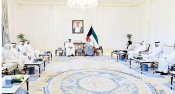
سمو ولي العهد يستقبل وزير التربية وقيادات الوزارة

العهد الشيخ صباح الخالد، أمس، وزير العدل ناصر السميح، حيث قدم لسموه وكيل وزارة العدل عواطف السند، وذلك بمناسبة توليها منصبها الجديد. من جهة أخرى، بعث سمو ولي العهد الشيخ صباح الخالد، ببرقية تهنئة إلى الرئيس البروفيسور آرثر بيتر موثاريكا رئيس جمهورية ملاوي الصديقة، ضمنها سموه خالص تهنائه بمناسبة ذكرى الاستقلال لبلاد وراجياً لفخامته دوام الصحة والعافية. كما بعث سمو ولي العهد الشيخ صباح الخالد، ببرقية تهنئة إلى الرئيس عثمان غزالي رئيس جمهورية القمر المتحدة الشقيقة، ضمنها سموه خالص تهنائه بمناسبة ذكرى الاستقلال لبلاد وراجياً لسموه لفخامته وأفر الصحة والعافية.