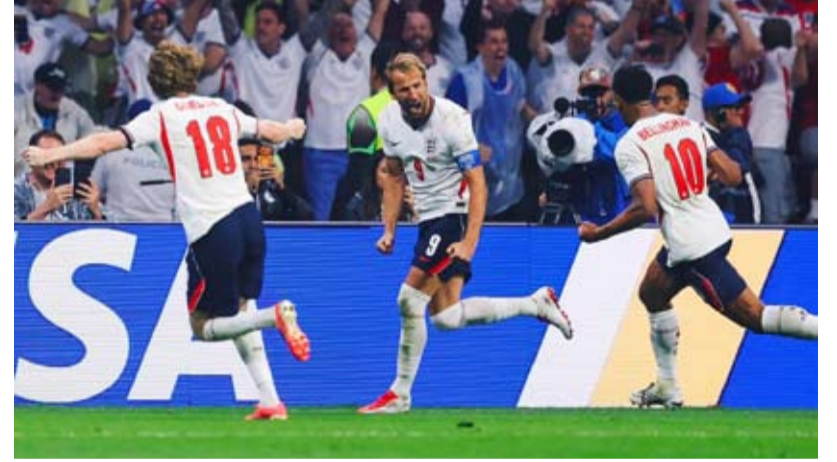
هاري كين يحتفل بالتسجيل من ركلة الجزاء

أقصت إنجلترا متفوقة العدد المكسيك، إحدى الدول المضيفة، من ثمن نهائي مونديال 2026 لكرة القدم، بعد فوزها الصعب والمثير عليها 3-2. على ملعب أزيكا في مدينة مكسيكو. وعلى الرغم من خوض أكثر من نصف ساعة بعشرة لاعبين بعد طرد غاريل كواناسه (54)، عبر منتخب «الأسود الثلاثة» إلى ربع النهائي بفضل الثنائي المتميز جود بيلينغهام (36) وهاري كين (60 من ركلة جزاء)، بينما سجل جوليان كينيونيس (42) ورأؤول خيمينيز (69 من ركلة جزاء) هدفي المكسيك. وحفلت مباراة المكسيك وإنجلترا بدور الستة عشر ببطولة كأس العالم 2026 في أميركا والمكسيك وكندا، بالعديد من الأرقام القياسية،