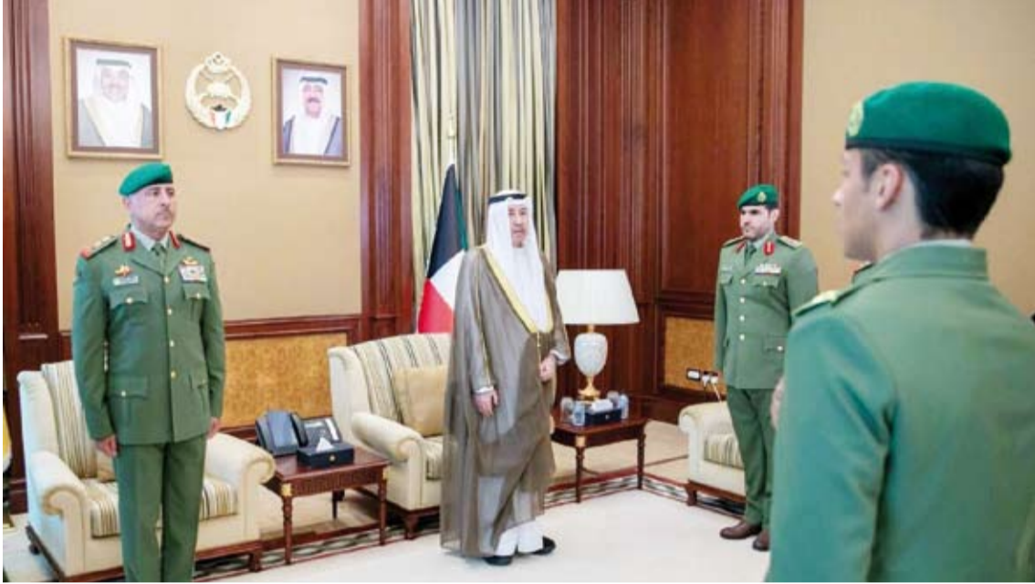
جانب من تأدية القسم القانوني