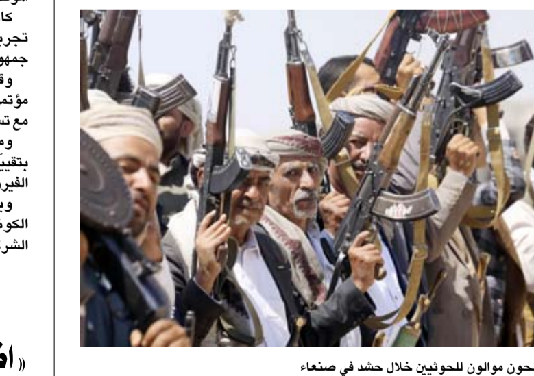
مسلحون موالون للحوثيين خلال حشد في صنعاء

المرحلة في المناطق المحررة على أنها حالة ضعف أو انقسام. ودعا التكتل الحكومة اليمنية إلى التعامل بحزم مع أي تصعيد حوثي على مختلف الجبهات، وعدم الانجرار إلى ما وصفها بسياسة الابتزاز، مؤكداً أن اليمنيين «لن يقبلوا المهادنة مع جماعة إرهابية مرتبطة بإيران»، على حد وصف البيان. وجدد التكتل تمسكه الكامل بالشرعية الدستورية ورفضه القاطع أي وصاية على القرار الوطني اليمني، مشيراً إلى