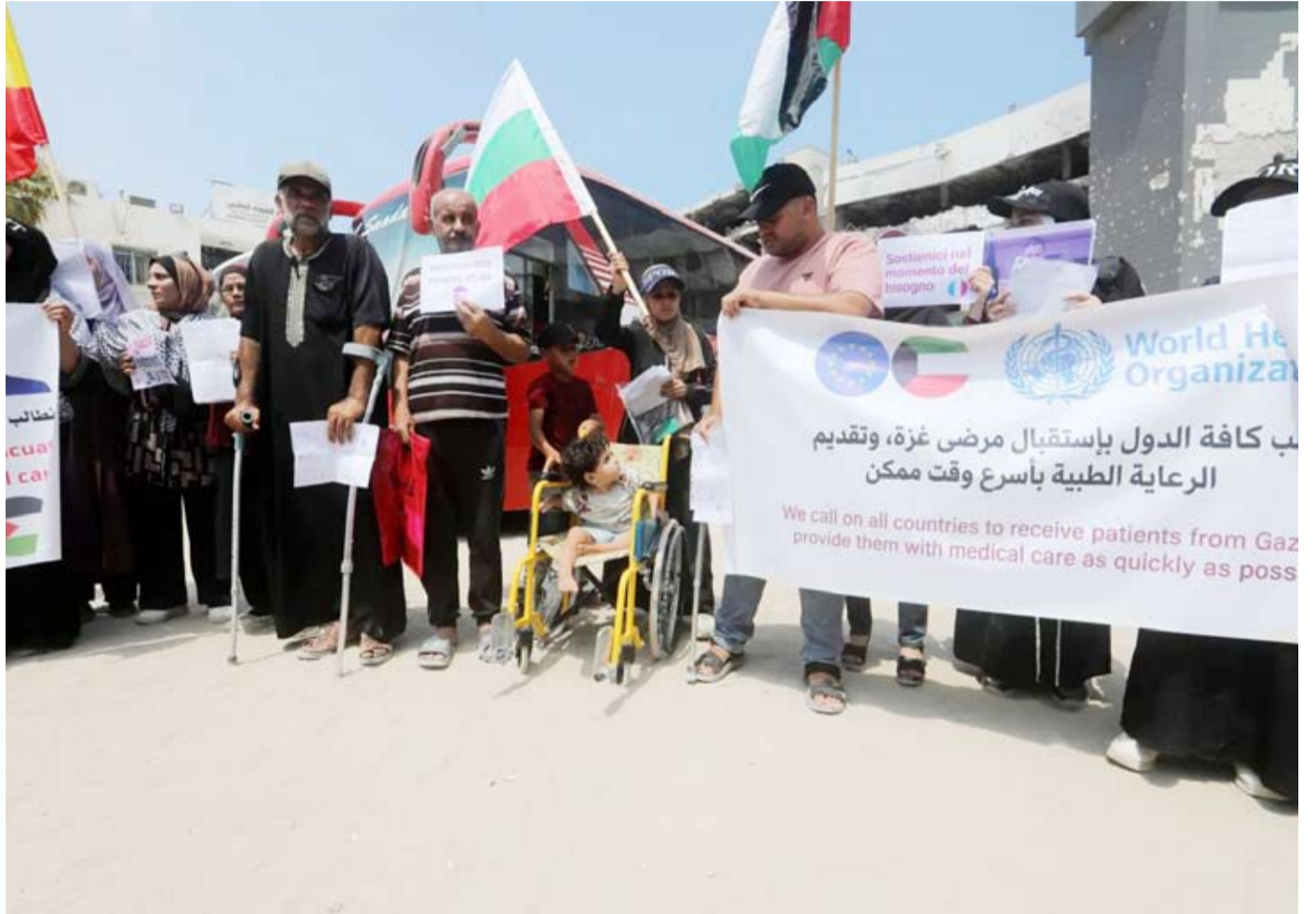
فلسطينيون جرحى وذووهم في وقفة احتجاجية