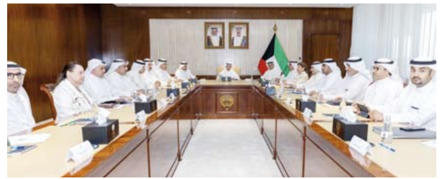
نائب وزير الخارجية السفير حمد المشعان يترأس الاجتماع

ترأس نائب وزير الخارجية السفير حمد المشعان، أمس، اجتماعاً لمجلس السالكين الدبلوماسي والتقني في ديوان عام الوزارة بمشاركة مساعدي وزير الخارجية أعضاء المجلس. وذكرت (الخارجية) في بيان أنه تم خلال الاجتماع