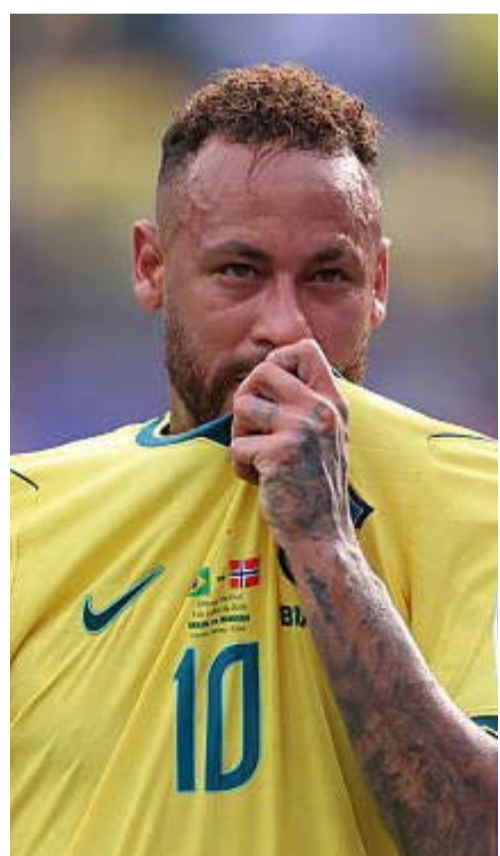
النجم البرازيلي المخضرم نيمار جونيور

أعلن النجم البرازيلي المخضرم نيمار جونيور، مهاجم سانتوس، اعتزاله اللعب الدولي بعد توديع منتخب بلاده لمنافسات كأس العالم. قال نيمار بعد الخسارة 1-2 أمام النرويج: «لقد حاولت، وواصلت المحاولة»، مضيفاً: «لقد بدأت مسيرتي هنا في ملعب ميت لايف، وانتهت هنا. لقد انتهى الأمر الآن». وبذلك يسدل نيمار (34 عاماً) الستار على مسيرة دولية بدأت قبل 16 عاماً، وأحرز خلالها 80 هدفاً وصنع 59 هدفاً في 130 مباراة دولية. وسيوذو النجم المخضرم منتخب بلاده كثاني أكثر اللاعبين مشاركة بقميص البرازيل، والهداف التاريخي متفوقاً على الأسطورة الراحل بيليه. ولم يتمالك نيمار نفسه بعد خروج منتخب بلاده من بطولة كأس العالم 2026 لكرة القدم التي تقام في الولايات المتحدة الأميركية وكندا والمكسيك.