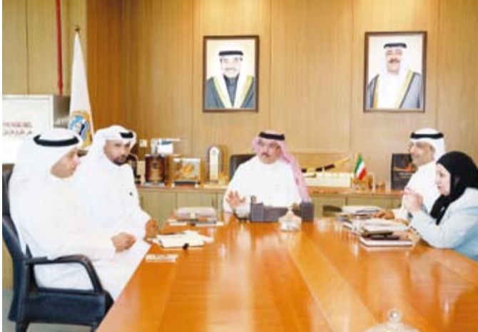
وزير التربية خلال اجتماعه مع القيادات التربوية