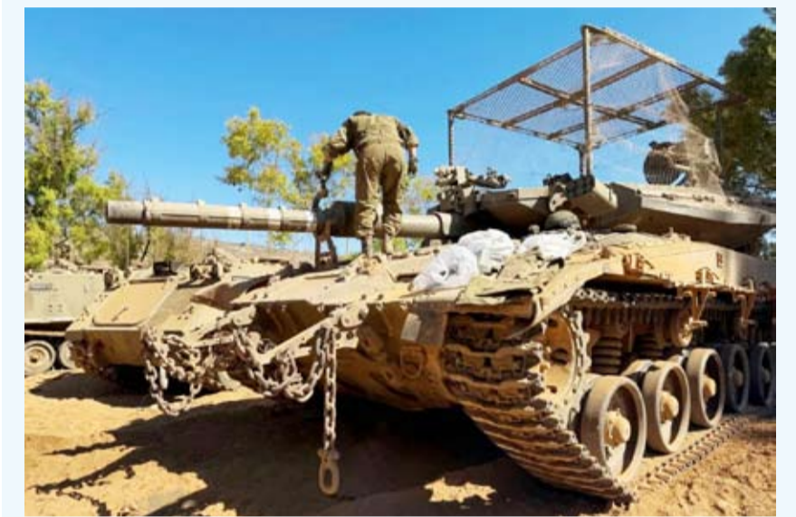
جندي صهيوني على الحدود اللبنانية

هذه المسارات والمنشآت تحت الأرض». وأضاف: «يجب على الجيش اللبناني الوفاء بالتزاماته بموجب الاتفاق التاريخي الذي تم التوقيع عليه، والعمل على تطهير المنطقة من عناصر «حزب الله». وتابع: «في موازاة ذلك، سيواصل الجيش الإسرائيلي العمل بحزم لإزالة التهديدات من الأراضي اللبنانية، وهو على أهبة الاستعداد للانتقال إلى هجوم سريع إذا جرى انتهاك وقف إطلاق النار». ووصف «حزب الله» بـ«المنهك»، قائلاً: «أضعفت الإنجازات العسكرية التي حققتها قواتنا (حزب الله). وقد مني بالهزيمة في كل مواجهة خاضها مع قواتنا، ويعول على إيران لإنقاذه».