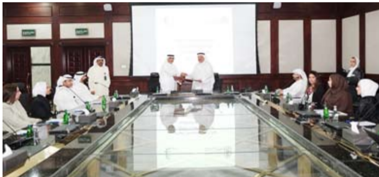
الجديدي والعمر بعد توقيع الاتفاقية