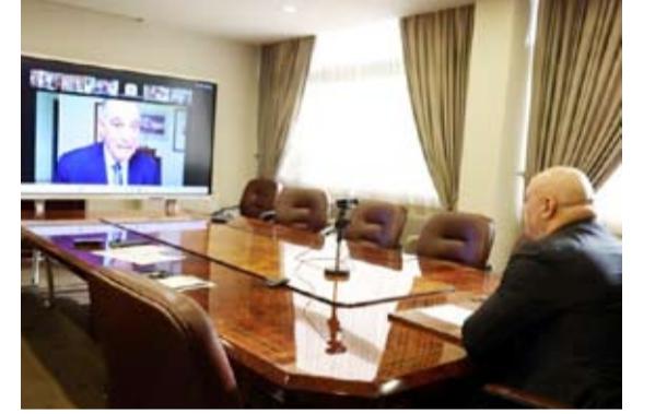
الرئيس اللبناني خلال اتصال مع مجموعة العمل الأمريكية من أجل لبنان

وفي سياق متصل، أعلن وزير الإعلام اللبناني بول مرقس، أمس، أن الكلفة المباشرة الأولية للحرب وفق التقديرات الأولية تتراوح بين ثلاثة وأربعة مليارات دولار مشيراً إلى هذه الكلفة "من دون احتساب الخسائر الاقتصادية والأضرار غير المباشرة".