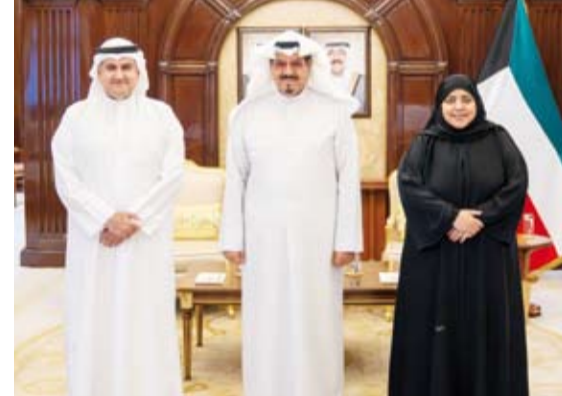
سمو الشيخ أحمد عبدالله يستقبل وزير العدل ووكيلة الوزارة

الرئيس عثمان غزالي رئيس جمهورية القمر المتحدة الشقيقة بمناسبة ذكرى الاستقلال لبلاد.