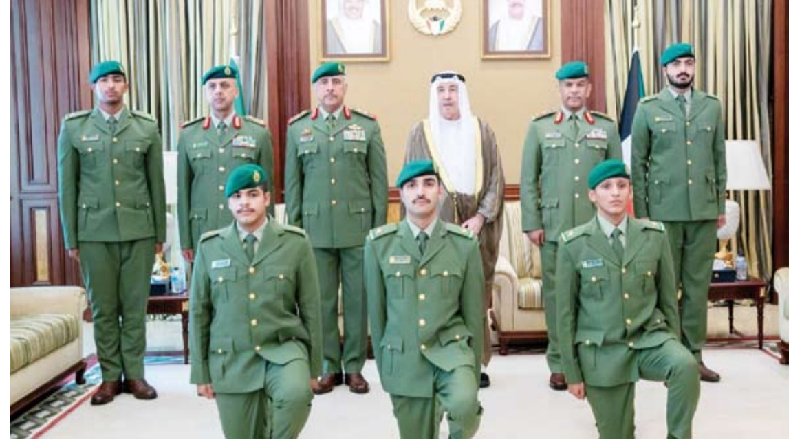
الشيخ مبارك الحمود في لحظة جماعية مع الضباط

وتحمل المسؤولية وأن يبذلوا جهودهم بكل إخلاص وتفان لخدمة الوطن والدفاع عنه وصون أمنه واستقراره.