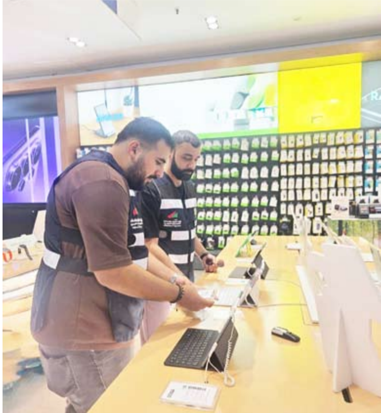
جولات رقابية لتعزيز الالتزام بالأنظمة التجارية

الإجراءات، سيتم إرسال إشعار فوري للمستخدمين عبر التطبيق الحكومي الموحد للخدمات الإلكترونية (سهل) يفيد بإتمام عملية تحويل بياناتهم بنجاح.