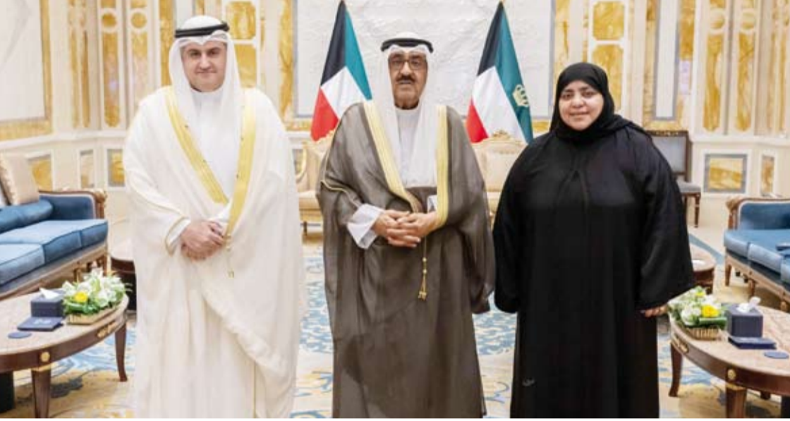
.. وسموه يستقبل وزير العدل ووكيلة الوزارة عواطف السند