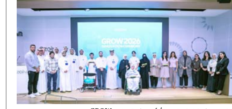
الغربللي وفريق الاستشام مع المخرّمين وفريق مبادرة GROW

مبادرات التوظيف والتطوير المهني والتصميم الشامل وخدمة العملاء، إلى جانب بناء شراكات مع الجهات الحكومية والأكاديمية ومنظمات المجتمع المدني لزيادة مشاركة الأشخاص ذوي الإعاقة في النشاط الاقتصادي. وفي خطوة موازية، أعلنت زين إطلاق المرحلة الأولى من مبادرة Freedom to Move، وهي منصة ذكية للتنقل داخل المباني طورتها شركة GoodMaps، وتعد الأولى من نوعها في الشرق الأوسط. احتفلت مجموعة زين بتخريج دفعة جديدة من المشاركين في برنامج GROW المخصص لتأهيل الخريجين الجدد من ذوي الإعاقة، في إطار استراتيجيتها الرامية إلى تعزيز التمكين المهني والاشتغال، بالترزامن مع إطلاق المرحلة الأولى من مبادرة Freedom to Move، التي توفر حلاً ذكياً للتنقل داخل المباني، في أول تعاون من نوعه لشركة GoodMaps في منطقة الشرق الأوسط. وشهد الحفل حضور الرئيس التنفيذي لشركة زين الكويت نواف الغربللي وعدد من قيادات المجموعة وممثلي الجهات الأكاديمية والشركاء، حيث أكدت الشركة أن البرنامج يمثل أحد أبرز مبادراتها لإعداد الكفاءات الشابة من ذوي الإعاقة وتهيئتها للانضمام إلى سوق العمل. وأوضحت زين أن البرنامج استقطب هذا العام أكثر من 620 متقدماً على مستوى المجموعة، تم اختيار 20 مشاركاً من الكويت والبحرين والسودان وجنوب السودان، خضعوا للبرنامج تدريبي ميداني مدفوع الأجر استمر ثلاثة أشهر، واشتمل على التدريب العملي في مجالات