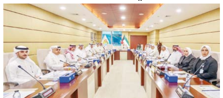
د. ريم الفليح تتراس الاجتماع الثاني للجنة العليا للمناخ

أكدت وزيرة الدولة لشؤون التنمية والاستدامة الدكتورة ريم الفليح، أهمية مواصلة التنسيق بين الجهات المعنية في البلاد والعمل المشترك لتعزيز جهود دولة الكويت في مواجهة تغير المناخ وتحقيق أهداف التنمية المستدامة. وقالت الدكتورة الفليح لـ (كونا) عقب الاجتماع الثاني للجنة العليا للمناخ الذي عقد صباح أمس، في الهيئة العامة للبيئة برئاستها وبحضور ممثلي الجهات المعنية: إن أعضاء اللجنة يبذلون جهوداً حثيثة لإبراز دور الكويت في هذا الشأن. وأوضحت أن اللجنة اطلعت على قرار تعديل تشكيل اللجنة العليا للمناخ الصادر مؤخراً في شهر