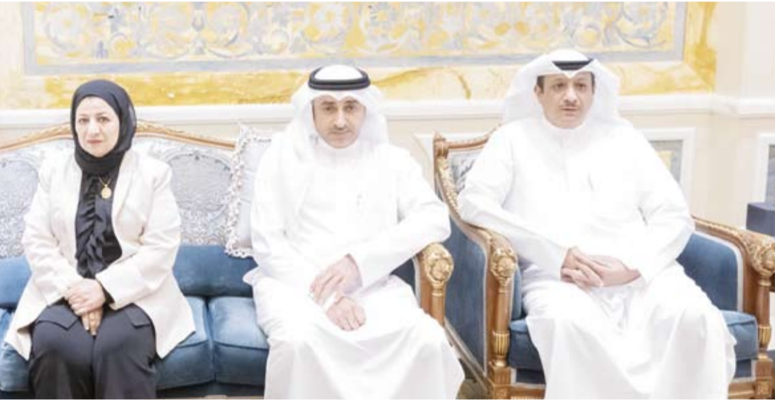
جانب من كبار القبايين والمسؤولين بوزارة التربية

تعيينها بمنصبها الجديد. من جهة أخرى، بعث صاحب السمو أمير البلاد الشيخ مشعل الأحمد، ببرقية تهنئة إلى الرئيس البروفيسور آرثر بيتر موثاريكا رئيس جمهورية ملاوي الصديقة، عبر فيها سموه عن خالص تهنائه بمناسبة ذكرى الاستقلال لبلاد. متمنياً سموه لفخامته موفقاً في الصحة والعافية ولجمهورية ملاوي وشعبها الصديق كل التقدم والازدهار. كما بعث صاحب السمو أمير البلاد الشيخ مشعل الأحمد، ببرقية تهنئة إلى أخيه الرئيس عثمان غزالي رئيس جمهورية القمر المتحدة الشقيقة، عبر فيها سموه عن خالص تهنائه بمناسبة ذكرى الاستقلال لبلاد. متمنياً سموه لفخامته موفقاً في الصحة والعافية ولجمهورية القمر المتحدة وشعبها الشقيق المزيد من التقدم والازدهار.