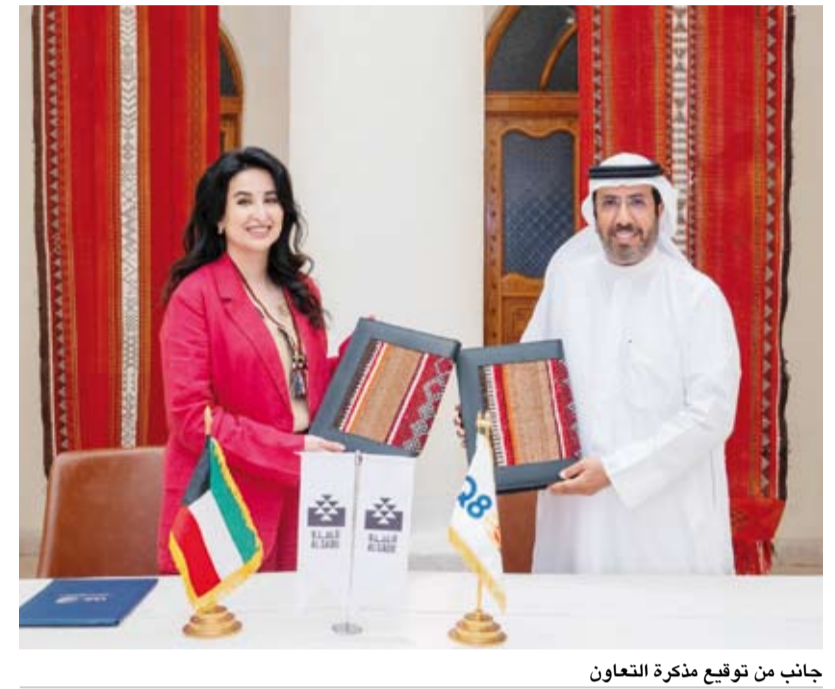
جاناب من توقيع مذكرة التعاون

ستتولى جمعية السدو الحرفية تزويد الشركة بالنقوش المعتمدة لفن السدو بصيغة جاهزة فنياً لاستخدامها في المشاريع المتفق عليها مع التأكيد على حفظ حقوق الملكية الفكرية للنقوش وضمان استخدامها بما يتوافق مع أهداف التعاون. وذكرت أن هذه الشراكة تمثل نموذجاً