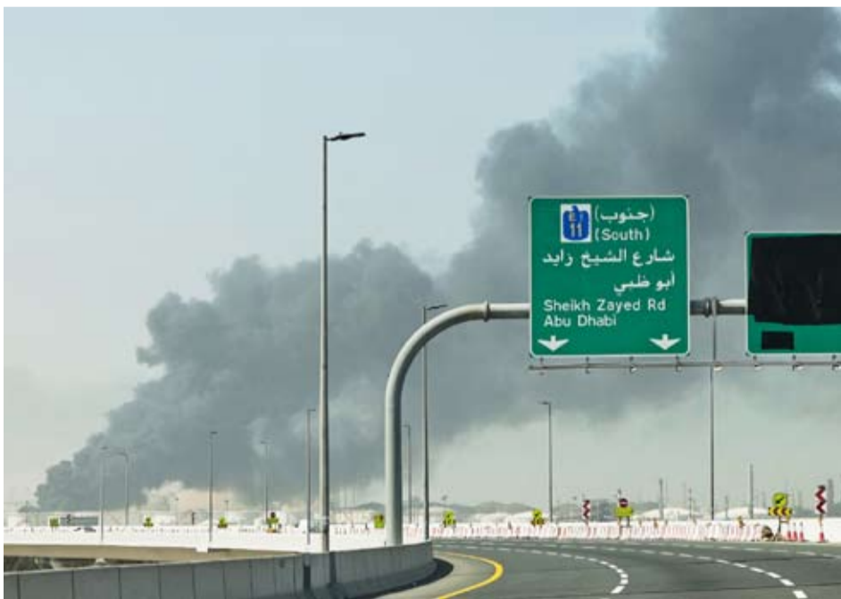
استهداف منشآت نفطية في دولة الإمارات

جوية، في سياق الرد الإيراني على الضربات الأمريكية الإقليمية. واستهدفت هذه الهجمات، بشكل مباشر وغير مباشر، البنية التحتية المدنية والاقتصادية، ما أدى إلى تعرضت الدول الخليجية، لسلسلة هجمات إيرانية مكثفة منذ 28 فبراير 2026، شملت إطلاق ما لا يقل عن (5655) صاروخاً وطائرة مسيرة، إضافة إلى هجمات