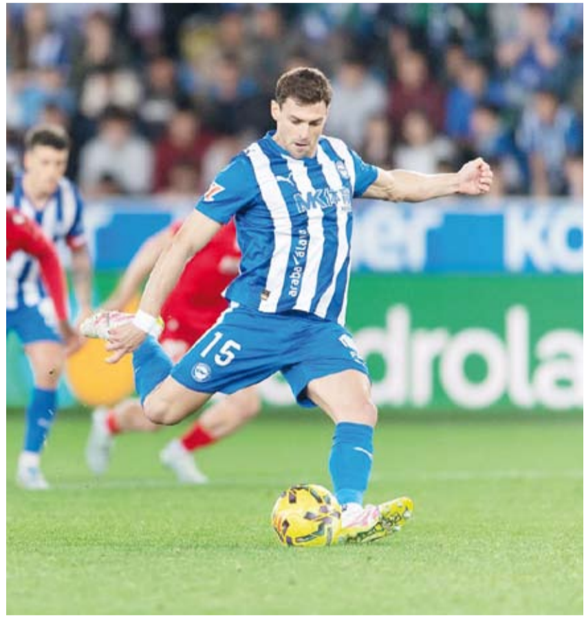
هدف التعادل من ركلة جزاء

الضائع للمباراة من ركلة جزاء. وأنهى أوساسونا المباراة بعشرة لاعبين عقب طرده لابعه آسير أوسامبيلا في الدقيقة الثالثة من الوقت الضائع. وأصبح في جعبة الأفيس 32 نقطة في المركز الخامس عشر، متاخراً بفارق 6 نقاط خلف أوساسونا، صاحب المركز التاسع.