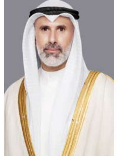
الشيخ جراح الجابر

تلقى وزير الخارجية الكويتي الشيخ جراح الجابر، أول أمس، اتصالاً هاتفياً من وزير خارجية المملكة العربية السعودية الشقيقة الأمير فيصل بن فرحان. وذكرت وزارة الخارجية الكويتية في بيان لها، أنه تم خلال الاتصال مناقشة آخر التطورات وما تشهده المنطقة من تصعيد عسكري متزايد نتيجة للعدوان الإيراني الآثم على دول المنطقة وانعكاساته الخطيرة على الأمن والاستقرار إقليمياً ودولياً. كما تلقى وزير الخارجية الشيخ جراح الجابر، رسالة خطية من وزيرة الخارجية والمغتربين في دولة فلسطين الشقيقة الدكتورة فارسين شاهين تتصل بالعلاقات