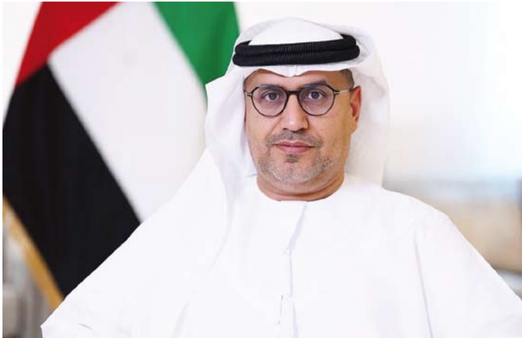
د. مطر النيايدي

أكد سفير دولة الإمارات العربية المتحدة لدى الكويت، د. مطر النيايدي، أن العلاقات الإماراتية-الكويتية تمثل نموذجا استثنائيا متجذرا للأخوة الصادقة، مشدداً على أن البلدين الشقيقين كانا وسيظلان صفاً واحداً في مختلف الظروف، لاسيما في أوقات التحديات التي لا تزدنا إلا تلاحماً وقوة. وجدد السفير الإماراتي، في تصريح صحفي، إدانة دولة الإمارات واستنكارها الشديدتين للعدوان الإيراني الغاشم المتواصل على الكويت ومنشأتها الحيوية، مؤكداً أن هذه الاعتداءات الأثمة لن تنال من صلابة الكويت وأمنها. وفي هذا السياق، وجه النيايدي تحية تقدير واعتزاز مفعمة بالفخر إلى حماة الديار في الكويت من رجال الجيش والشرطة والحرس الوطني والمطافي، قائلًا: أنتم لها وأنتم الرجال المخلصون الذين نفاخر بهم ونعتز، فجاهزيتكم العالية وقدرتكم على التصدي للهجمات بكل احترافية تعكس كفاءةكم في الدفاع عن الوطن ومقدراته. كما أثنى على تضامير جهود الجيش الكويتي، والحرس الوطني، ووزارة الداخلية، وقوة الإطفاء العام، واصفاً إياهم بأنهم عز الكويت ونورها، والمعاند الأصيلة التي تمنع في أوقات المحن وتتجلى قيمتها في الشدائد، مشيداً بيقظة رجال الداخلية، ودورهم المحوري في استتباب الأمن والاستقرار. وفي ختام تصريحه قال السفير الإماراتي: نحن على يقين أننا سنهزم العدوان الإيراني الغاشم، وسنحفظ قريبتنا بصبرنا... حفظ الله الإمارات والكويت وكل دول الخليج من كل شر ومكروه.