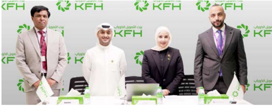
المسلم والضميد مع ممثلي شركات التدقيق

برامج السجوبات في الكويت، ويحظيان بإقبال واسع من العملاء. وتقدمت المسلم بخالص التهنئة لجميع الفائزين في سجوبات «الرايح» و«الحصاد»، مؤكدة حرص البنك الدائم على مكافأة عملائه وتقدير إقتهم. كما دعت العملاء الحاليين والجدد إلى فتح حسابات «الرايح» و«الحصاد» والاستفادة من الفرص المميزة التي توفرها، والتي تمنحهم إمكانية الفوز بجوائز قيمة في السجوبات القادمة، إلى جانب المزايا المتنوعة التي يقدمها البنك عبر منتجاته وخدماته المصرفية والتي تلبى تطلعاتهم وتعزز تجربتهم المصرفية.