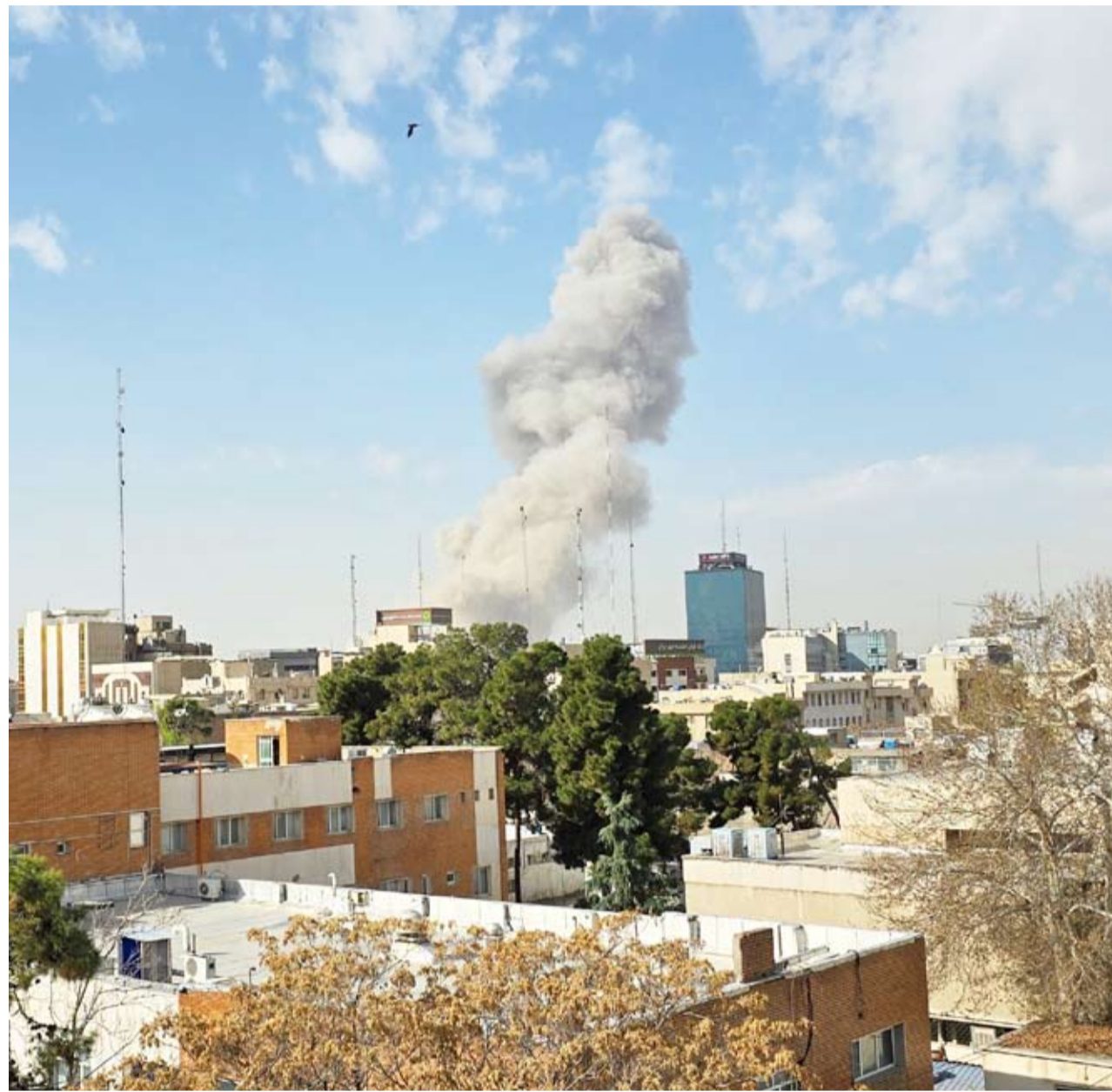
سلسلة انفجارات قوية بمواقع عدة في طهران

توقعت مصادر عدة من فصائل فلسطينية كبيرة في غزة تكثيف إسرائيل لهجماتها داخل قطاع غزة، بعد طلبها عبر حركة «حماس» تعديل خطة «مجلس السلام» لنزع السلاح من القطاع. وتحدثت 3 مصادر من «حماس» داخل غزة، لـ«الشرق الأوسط» عن مؤشرات ميدانية على تصعيد ميداني إسرائيلي أكبر، يتجاوز استهداف نقاط الشرطة والأمن وعناصر الفصائل المسلحة والإغتيالات. ويُعد نزع سلاح «حماس» أبرز بنود الخطة التي قدمها الممثل السامي لغزة في «مجلس السلام» نيكولاي ملادينوف، التي أعلنتها في «مجلس الأمن» أو أواخر مارس (آذار) الماضي. وتتضمن، حسب بنود نشرتها وسائل إعلام دولية وإقليمية، تدمير الحركة الفلسطينية شبكة الأنفاق، والتخلي عن السلاح على مراحل خلال 8 أشهر، على أن يتم انسحاب القوات الإسرائيلية بالكامل عند «التحقق النهائي من خلو غزة من السلاح».