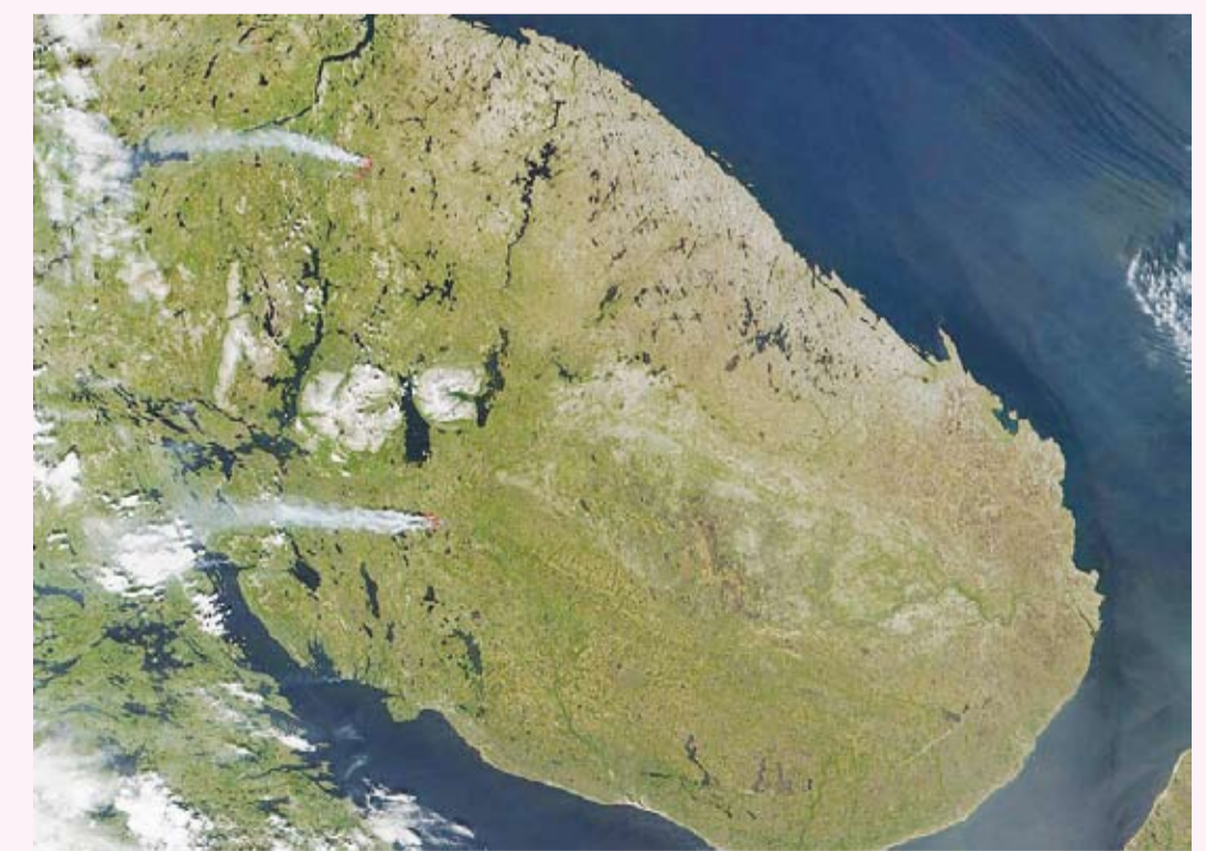
شبه جزيرة كولا الروسية