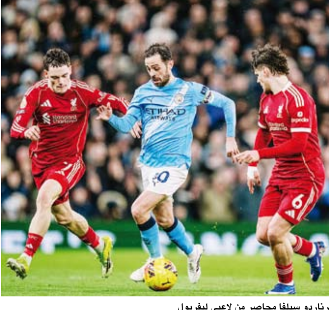
برناردو سيلفا محاصر من لاعبي ليفربول