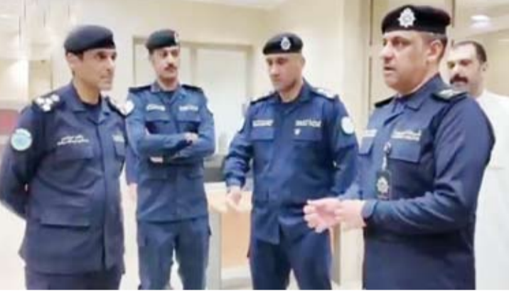
اللواء عبدالوهاب الوهيب خلال الجولة

قام وكيل وزارة الداخلية اللواء عبدالوهاب الوهيب، بجولة تفقدية شملت عدداً من مخافر الشرطة للاطلاع على سير العمل ومستوى الاستعداد الأمني في ظل الأوضاع الراهنة التي تشهدها البلاد والمنطقة وفي إطار الجولات الميدانية المستمرة لمتابعة الجاهزية الأمنية وتعزيز الانتشار في مختلف مناطق البلاد.