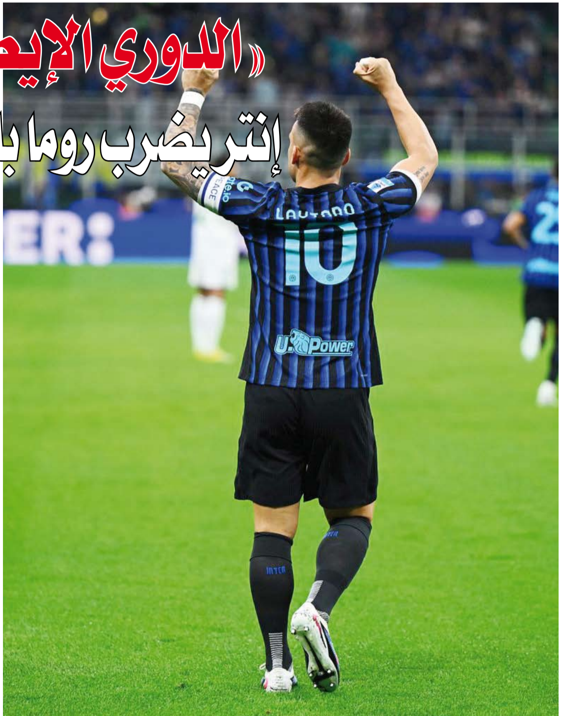
إنتر أفرس الذئاب بالخمس

في المقابل، تجمّد رصيد روما عند 54 نقطة في المركز السادس، وتلقت أماله بالتحول رابعاً وبلوغ مسابقة دوري أبطال أوروبا ضربة قوية، مانحاً يوفنتوس الخامس (54 نقطة) وكومو الرابع (57 نقطة) فرصة الابتعاد عنه، علماً بأن الأول يستقبل جنوا، والثاني يحلّ ضيفاً على أودينيزي الاثنين في ختام المرحلة.