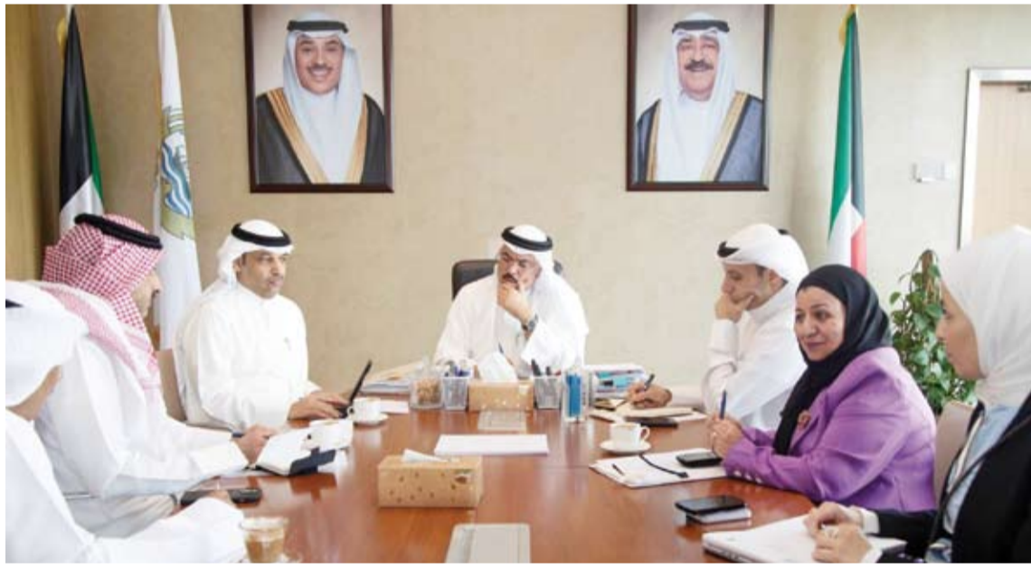
وزير التربية مترسداً الاجتماع

إعداد دراسة متكاملة لاحتياجات المدارس من المعلمين والمعلمات للعام الدراسي المقبل 2027/2026