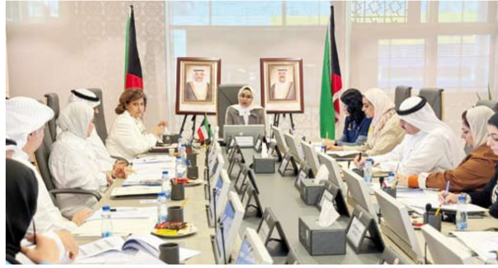
وزيرة الشؤون خلال مناقشة محاور الاجتماع مع أعضاء اللجنة

أكدت وزير الشؤون الاجتماعي وشؤون الأسرة والطفولة رئيس اللجنة الوطنية العليا لتنفيذ اتفاقية حقوق الأشخاص ذوي الإعاقة الدكتورة أمثال الحويلة، أن الكويت ملتزمة بمواصلة تعزيز وحماية حقوق ذوي الإعاقة بما يتماشى مع بنود الاتفاقيات الدولية والتوجهات الوطنية. وأكدت الوزير الحويلة، أمس، عقب ترؤسها الاجتماع الرابع للجنة استمرارهم في متابعة تنفيذ محاور الاتفاقية التي تضم 33 مادة والعمل على تنسيق الأدوار بين مختلف الجهات بما يساهم في تطوير منظومة الخدمات المقدمة والارتقاء بها. وأضافت أن الجهات المشاركة تسعى إلى تنفيذ مواد الاتفاقية بشكل متكامل عبر وضع خطط عمل واضحة وآليات متابعة دقيقة مؤكدة التزام الجهات المعنية بتنفيذ البنود وفق اختصاصاتها بما يعزز مستوى الامتثال ويسهم في دمج ذوي الإعاقة في المجتمع.