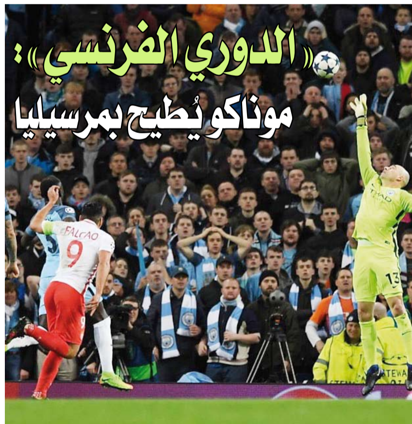
الكرة في طريقها للشباب

وتابع موناكو انتفاضة بعد سلسلة كارثية من سبع هزائم في ثماني مباريات بين نوفمبر ويناير، وحقق فوزه الخامس عشر هذا الموسم، فارتقى إلى المركز الخامس برصيد 49 نقطة بفارق الأهداف خلف مرسييليا الذي تراجع إلى المركز الرابع بعدما مُني بخسارته الأولى عقب ثلاثة انتصارات متتالية والتاسعة هذا الموسم. وقتل مرسييليا في استعادة المركز الثالث من ليل الفائز على لانس 3-0، فيما استغل موناكو استمرار ليون في نزيف النقاط بسقوطه في فخ التعادل السلبي أمام مضيفه أنجيه.