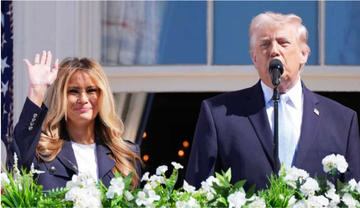
ترامب أكد أن اقتراح وقف إطلاق النار خطوة بالغة الأهمية

قبيل انتهاء المهلة التي منحها الرئيس الأمريكي دونالد ترامب للنظام الإيراني، شهد يوم أمس تصعيدا كبيرا وغير مسبوق على مستوى القصف المتبادل بين إيران من جهة والجانب الأميركي والكيان المحتل من جهة أخرى، ومن جانبه شدد ترامب على أن اليوم الثلاثاء هو الموعد النهائي للمهلة التي منحها للنظام الإيراني، مؤكدا اقتراح وقف إطلاق النار مع إيران "خطوة بالغة الأهمية"، وأن الحرب قد تنتهي سريعا إذا فعلوا ما يتعين عليهم فعله، وأن من تفاوضهم الولايات المتحدة يتسمون بالمنطق وليسا متشددين.