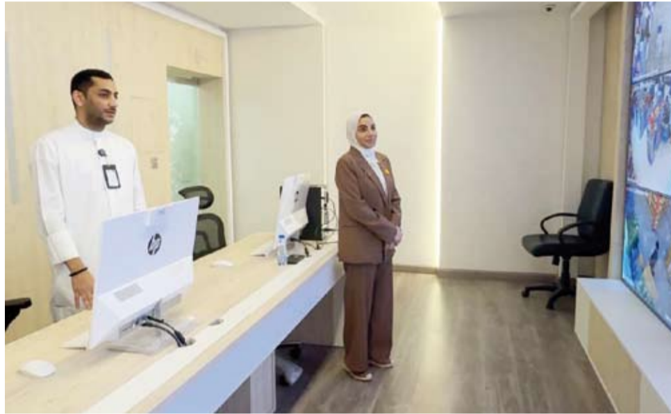
الحويلة خلال زيارة تفقدية مركز التحكم المركزي لمتابعة جاهزية الجمعيات التعاونية

وأوضحت الحويلة أنها اطمأنت خلال الزيارة على جاهزية خطط