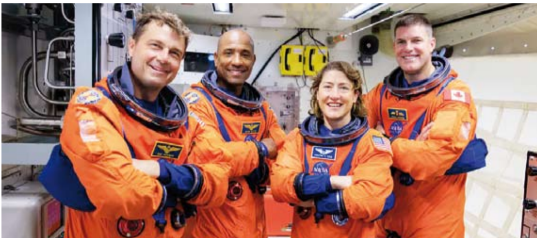
طاقم مهمة «أرتميس 2»

أعلنت وكالة الفضاء الأمريكية «ناسا»، أن طاقم مهمة «أرتميس 2» يستعد للتحليق حول القمر على متن مركبة «أوريون»، من خلال تنفيذ سلسلة من العمليات والفحوصات الفنية النهائية، في أول رحلة مأهولة إلى القمر منذ 53 عاماً. وأوضحت الوكالة، أن الطاقم نفذ مناورة لتصحيح مسار المركبة بهدف ضبط اتجاهها نحو القمر بدقة لضمان مسار الرحلة كما هو مخطط. كما أجرى الطاقم اختباراً لبدلات الفضاء، للتأكد من جاهزيتها لمراحل الرحلة المختلفة، وقدرتها على توفير الحماية خلال الطيران، وشمل ذلك ارتداء البدلة وضغطها وإجراء فحوصات للتسرب. وشملت الاختبارات أيضاً محاكاة الجلوس داخل مركبة «أوريون» وتقييم الحركة والقدرة على تنفيذ المهام الأساسية. وأكدت «ناسا» إتمام مراجعة جميع الأهداف العلمية النهائية بنجاح، في إطار الاستعداد المباشر لرحلة التحليق حول القمر. جدير بالذكر أن مهمة «أرتميس 2» ضمن برنامج أرتميس، الذي تسعى من خلاله «ناسا» إلى تمهيد الطريق لهبوط بشري على سطح القمر خلال السنوات المقبلة.