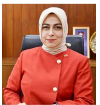
السفيرة طوبى سونمز

أشادت السفيرة التركية لدى الكويت طوبى سونمز، بمسار التصاعدي الذي تشهده العلاقات الخنثائية بين بلديهما والكويت في المرحلة الراهنة، مؤكدة أن هذا التطور يعكس بوضوح الإرادة السياسية لقيادتي البلدين، إلى جانب تطلعات الشعبين الصديقين نحو مزيد من التعاون والشراكة.