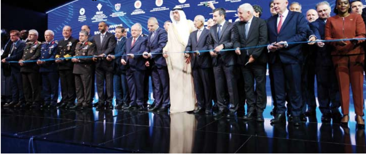
الشيخ عبدالله العلي خلال افتتاح المعرض