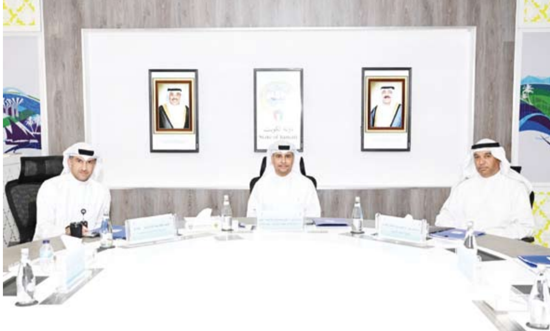
جانب من اجتماع اللجنة المشتركة المعنية بدراسة عودة النشاط الرياضي

وأوضح أن خطة العودة تعتمد على منهج تدريجي مدروس يضع في أولوياته الاتحادات المرتبطة بمشاركات خارجية وذلك لضمان جاهزية المنتخبات الوطنية للاستحقاقات الإقليمية والدولية بما يعكس صورة مشرفة للرياضة الكويتية في المحافل الخارجية.