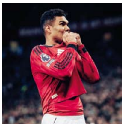
البرازيلي المخضرم كاسيميرو

يعدّ نادي إنتر ميامي الأمريكي لكرة القدم من أبرز المرشحين للتعاقد مع لاعب خط الوسط البرازيلي المخضرم كاسيميرو، في صفقة انتقال حر، هذا الصيف، وفقاً لتقرير إخباري. وأعلن كاسيميرو رحيله عن فريق مانشستر يونايتد الإنجليزي بنهاية عقده الحالي مع النادي، حيث يرجح أن تكون وجهته الدوري الأمريكي للمحترفين لكرة القدم. وتردد أن مدينة ميامي الأمريكية هي المكان الذي يرغب كاسيميرو وعائلته في الإقامة فيها أكثر من غيرها، وهو ما يجعل الظروف مواتية لضمه إلى إنتر ميامي مستقبلاً. كما يرغب كاسيميرو في اللعب إلى جانب الساحر الأرجنتيني ليونيل ميسي، وفقاً لما أفادت به شبكة «سكاي سبورتنس» الإخبارية، التي أوضحت أنه مستعد لخضف مطالبه المالية لتسهيل هذه الخطوة. وذكرت «سكاي سبورتنس» أن نادي لوس أنجلوس غالاكسي ربما يكون النادي الوحيد الآخر