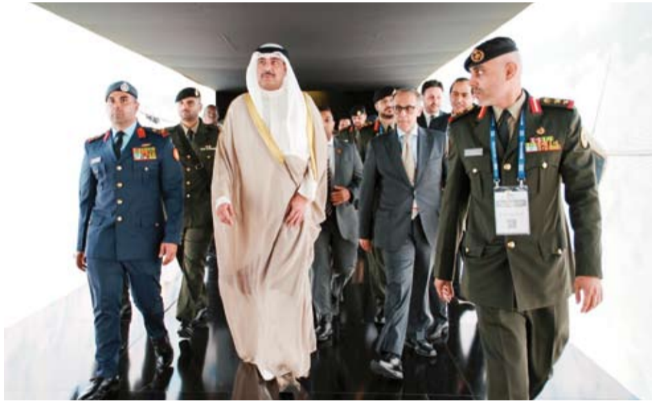
وزير الدفاع خلال جولة في المعرض

شارك وزير الدفاع الشيخ عبدالله العلي والوفد المرافق له بافتتاح فعاليات المعرض الخامس للدفاع (سأها اكسبو 2026) الذي تستضيفه الجمهورية التركية الصديقة.