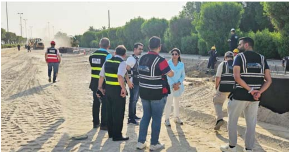
المشعان في أحد المواقع

أكدت وزيرة الأشغال العامة د. نورة المشعان مواصلة تنفيذ أعمال الصيانة الجذرية للطرق في منطقة الدسمه، ضمن خطة تطوير شبكة الطرق ورفع كفاءة البنية التحتية في مختلف مناطق البلاد.