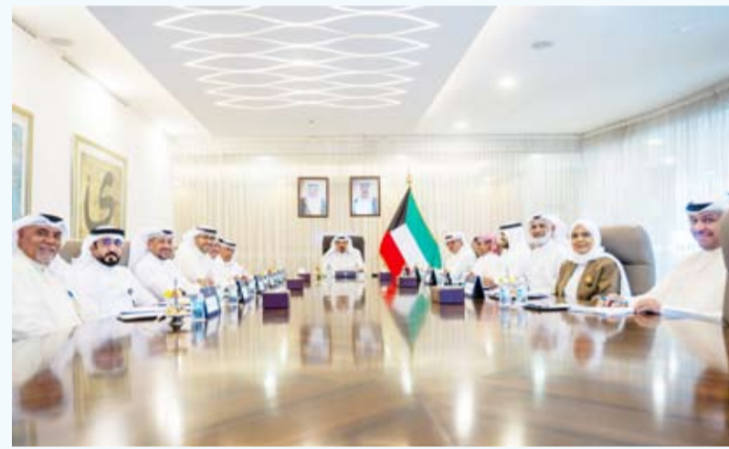
العبدالله يترأس الاجتماع أمس

ترأس سمو الشيخ أحمد العبدالله رئيس مجلس الوزراء اجتماعاً أمس لبحث سبل تعزيز موارد المياه الجوفية وذلك في إطار دعم منظومة الأمن المائي والمحافظة على المخزون الاستراتيجي للمياه. حضر الاجتماع وزير النفط طارق سليمان الرومي ووزير الكهرباء والماء والطاقة المتجددة الدكتور صبيح المخيزيم ووزير التجارة والصناعة أسامة بودي والمستشار بديوان رئيس مجلس الوزراء الدكتور خالد الفاضل ورئيس ديوان رئيس مجلس الوزراء بالإنابة الشيخ خالد محمد الخالد والرئيس التنفيذي لمؤسسة البترول الكويتية الشيخ نواف السعوي وعدد من المسؤولين في مؤسسة البترول الكويتية وشركة نفط الكويت ومعهد الكويت للأبحاث العلمية.