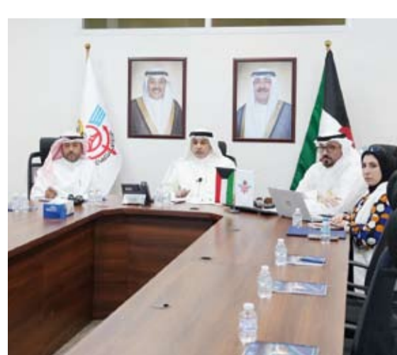
جانب من مشاركة جمارك الكويت في الاجتماع

يأتي في إطار الجهود المستمرة لتعزيز التكامل الجمركي بين دول الإقليم وتطوير منظومة العمل بما يواكب المتطلبات الدولية ويخدم المصالح الاقتصادية المشتركة.