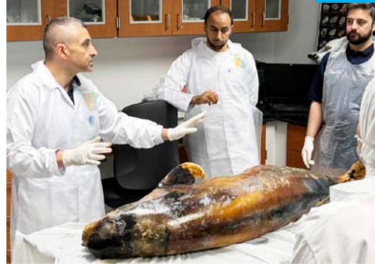
جانب من عملية تشريح الأسماك لبيان أسباب النفوق