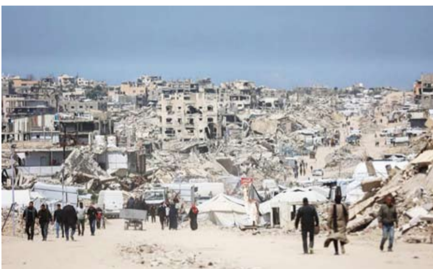
انقاض المباني المدمرة في مخيم جباليا

بالمفاوضات، عبر منصات إعلامية، نفى مصدر فلسطيني تحدث لـ«الشرق الأوسط» صحة ذلك، مؤكداً أن هناك نقاشاً مستمراً بين الوسطاء و«حماس» والفصائل، وينتظر عودة ملادينوف من تل أبيب بالرد الإسرائيلي على الأفكار المطروحة، لتحديد مستقبل تلك الجولة من المفاوضات المستمرة بالقاهرة، وإمكانية دخول «لجنة التكنولوجيا» بعد ترتيبات. وبينما تستمر مفاوضات القاهرة في جولتها الثالثة خلال شهر للأسبوع الثاني، التقى ملادينوف، رئيس الوزراء الإسرائيلي بنيامين نتانياهو، في القدس (الغربية)، بحسب بيان مكتبه. وعقب اللقاء، قال ملادينوف في منشور على حسابه بمنصة «إكس»: «نقاش إيجابي وجوهري مع رئيس الوزراء بنيامين نتانياهو حول المسار المستقبلي، ونعمل مع جميع الأطراف لتحويل هذا الالتزام إلى إجراءات ملموسة، وهذا يتطلب اتخاذ قرارات لتحقيق التقدم، دون أن يحدد تلك القرارات.