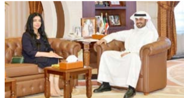
المحافظ ومدير هيئة البيئة نوف بهباني

الإهتمام المشترك، وبحث سبل تعزيز التعاون بين المحافظة والهيئة في مجالات الحماية والحفاظ على الموارد الطبيعية، بالإضافة إلى مناقشة المبادرات وإعداد الدراسات المتخصصة التي من شأنها ضمان سلامة الطبيعة وتحقيق الاستدامة في مختلف المناطق.