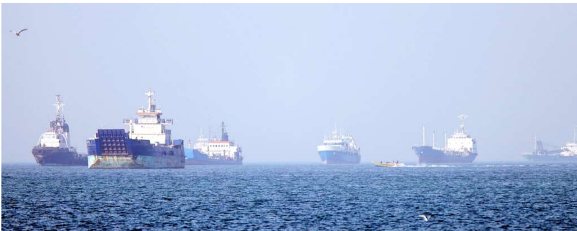
طهران تعلن عن آلية جديدة لمرور السفن عبر هرمز

أعلن الرئيس الأميركي دونالد ترامب أنه سيقوم مؤقتاً بعملية مرافقة السفن عبر مضيق هرمز «مشروع الحرية»، مشيراً إلى التقدم المحرز نحو التوصل إلى اتفاق شامل مع إيران، وسط أنباء عن قرب التوصل إلى اتفاق لإنهاء الحرب. وكتب ترمب على وسائل التواصل الاجتماعي، «اتفقنا على أنه في حين سيظل الحصار سارياً ونافذاً بالكامل، سيعلق (مشروع الحرية) لفترة وجيزة لمعرفة ما إذا كان بالإمكان إبرام الاتفاق وتوقيعه».