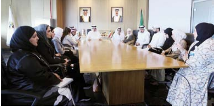
وزير التربية م. سيد جلال الطببائي مترسماً الاجتماع

عقد وزير التربية م. سيد جلال الطببائي، أمس، اجتماعاً موسعاً مع القيادات التربوية ومسؤولي الإدارة العامة للتطوير والتنمية والإدارة العامة للتكنولوجيا ونظم المعلومات، وذلك في إطار متابعة الجهود الرامية إلى تطوير الإجراءات الإدارية ورفع كفاءة العمل المؤسسي، بما ينسجم مع توجهات الدولة نحو التحول الرقمي وتعزيز الحوكمة والشفافية في مختلف القطاعات.