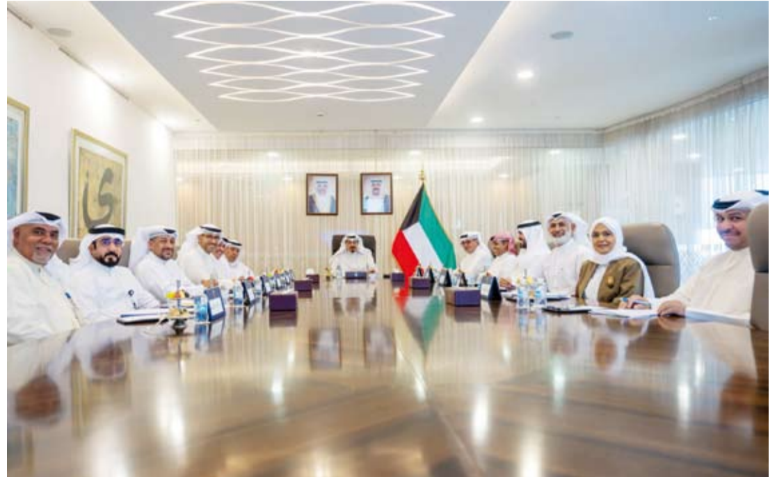
سمو الشيخ أحمد عبدالله يترأس الاجتماع

ترأس سمو الشيخ أحمد عبدالله رئيس مجلس الوزراء، اجتماعاً، أمس، لبحث سبل تعزيز موارد المياه الجوفية وذلك في إطار دعم منظومة الأمن المائي والمحافظ على المخزون الاستراتيجي للمياه.