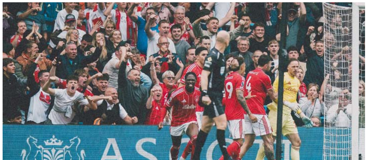
نوتنغهام فورست يصطدم بآستون فيلا

للأبطال» عامي 1979 و1980، لم يلعب فورست على لقب قاري كبير. وفي أول نصف نهائي أوروبي له منذ موسم 1983 - 1984، يمتلك فورست أفضلية ضئيلة بفضل وكلة الجزء التي سجلها النيوزيلندي كريس وود في ملعب