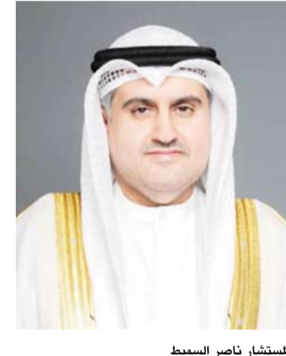
المستشار ناصر السميح

ولفت المستشار السميح إلى أن النظام تم تطويره وتنفيذه بكوادر وزارة العدل مع تفعيل التوقيع الإلكتروني الآمن والمعتمد من الهيئة العامة للمعلومات المدنية لقضاة الجرح ومنفذي الأحكام الجزائية بما يرفع موثوقية الإجراءات ويدعم وسائل الأمان الإلكتروني. وأكد وزير العدل أن إطلاق المرحلة الأولى من هذا النظام يمثل خطوة مهمة في مسار التقاضي الإلكتروني في القضايا الجزائية البسيطة ضمن توجه وزارة العدل لبناء منظومة عدلية رقمية أكثر سرعة وكفاءة مع الحفاظ على الضمانات القانونية المقررة للمتقاضين.