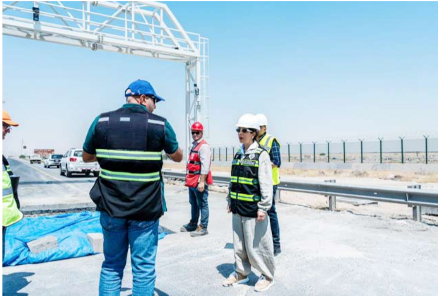
المشعان تستمع لشرح مهندس المشروع