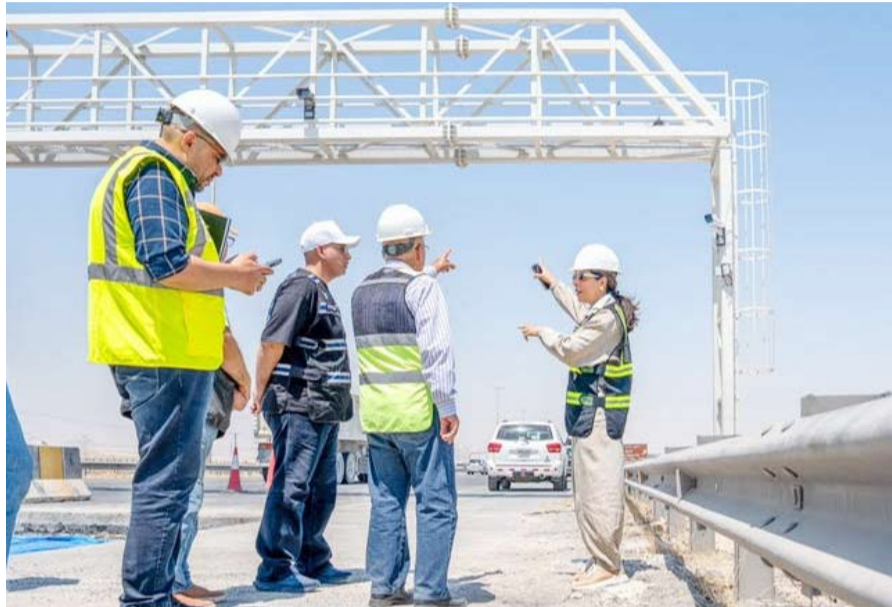
وزيرة الأشغال تتابع الأعمال