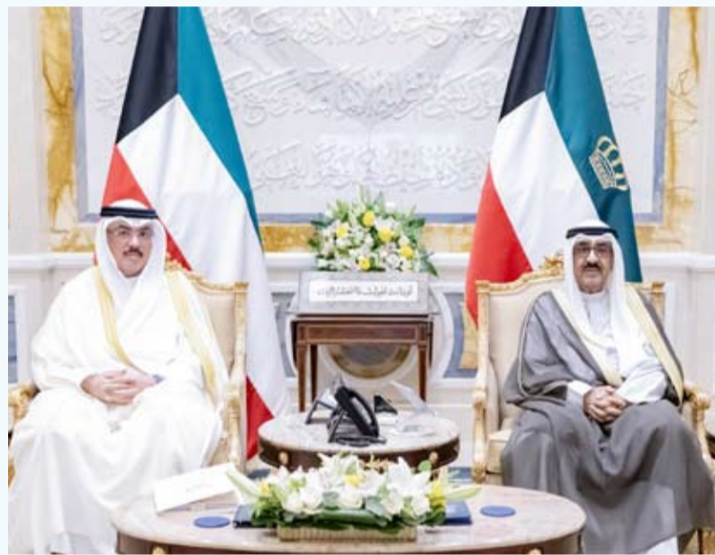
سمو أمير البلاد يستقبل وزير التربية

أشاد سمو أمير البلاد الشيخ مشعل الأحمد، دور منتسبي وزارة التربية لا سيما المعلمين والمعلمات الذين يمثلون الركن الأساسي للعملية التعليمية، وذلك خلال استقباله وزير التربية سيد جلال الطبطبائي وكبار القادة والمسؤولين بوزارة التربية، حيث قدموا لسموه تقريراً بشأن سير امتحانات الدور الأول للفترة الدراسية الثانية للعام الدراسي 2025 / 2026 لطلبة الصفوف العاشر والحادي عشر والثاني عشر، حيث هنأهم سموه بإنهاء العام الدراسي الحالي، وزودهم بتوجيهاته السامية لتحقيق كافة التطلعات والطموحات في المسيرة التعليمية والارتقاء بها، ومنها المتابعة الميدانية والوقوف على كافة التحديات والمعوقات ومعالجتها والاستعداد المبكر للعام الدراسي المقبل من خلال تهيئة وتأهيل الكوادر التربوية وتجهيز المدارس ومراقبتها، ومواصلة تطوير الكتب الدراسية بما يواكب متطلبات العصر ويعزز قيم ومبادئ الهوية الوطنية.