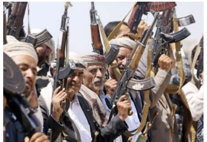
مسلحون موالون للحوثيين خلال حشد في صنعاء

المرحلة في المناطق المحررة على أنها حالة ضعف أو انقسام. ودعا التكتل الحكومة اليمنية إلى التعامل بحزم مع أي تصعيد حوثي على مختلف الجبهات، وعدم الانجرار إلى ما وصفها بسياسة الابتزاز، مؤكداً أن اليمنيين «لن يقبلوا المهادنة مع جماعة إرهابية مرتبطة بإيران»، على حد وصف البيان. وجدد التكتل تمسكه الكامل بالشرعية الدستورية ورفضه القاطع أي وصاية على القرار الوطني اليمني، مشيراً إلى الجماعة داخل اليمن.