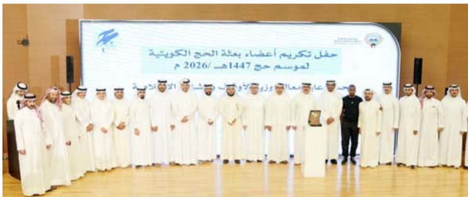
لقطة جماعية خلال حفل التكريم

بين البعثة والحجاج وأتاح الوصول إلى الخدمات والإرشادات والبلاغات والمعلومات اللازمة بصورة سهلة وسريعة مما عزز سرعة الاستجابة ورفع كفاءة الأداء وساهم في الارتقاء بجودة الخدمات المقدمة لضيوف الرحمن. وشدد على مواصلة البناء على ما تحققت من نجاحات وتطوير منظومة العمل في مواسم الحج المقبلة والاستفادة من التجارب الميدانية والمقترحات التي تقدمها اللجان العاملة بما يواكب توجهات الدولة في التحول الرقمي والارتقاء بالخدمات وبحقق أفضل مستويات الرعاية لحجاج دولة الكويت.