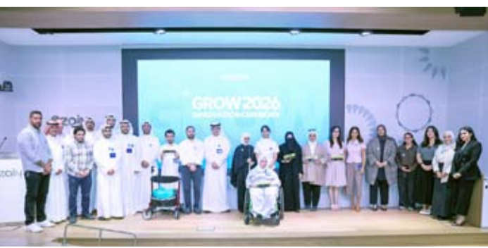
الغربللي وفريق الاستثمار مع المخرّمين وفريق مبادرة GROW

مبادرات التوظيف والتطوير المهني والاتصالات والتكنولوجيا والإدارة، إلى جانب تنمية المهارات المهنية والتقنية والسلوكية. وأضافت أن البرنامج نُفذ بالتعاون مع عدد من الجامعات والمؤسسات الأكاديمية ومؤسسات التدريب، كما حصل المشاركون عند التخرج على شهادات مهنية من زين وشركائها، بما يعزز جاهزيتهم للانخراط في سوق العمل. وأكدت الشركة أن GROW يعد أحد المراكز التنفيذية لرؤية WE 2030، التي تستهدف توسيع