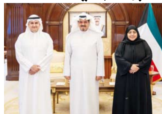
سمو الشيخ أحمد عبدالله يستقبل وزير العدل ووكيلة الوزارة

الرئيس عثمان غزالي رئيس جمهورية القمر المتحدة الشقيقة بمناسبة ذكرى الاستقلال لبلاد.