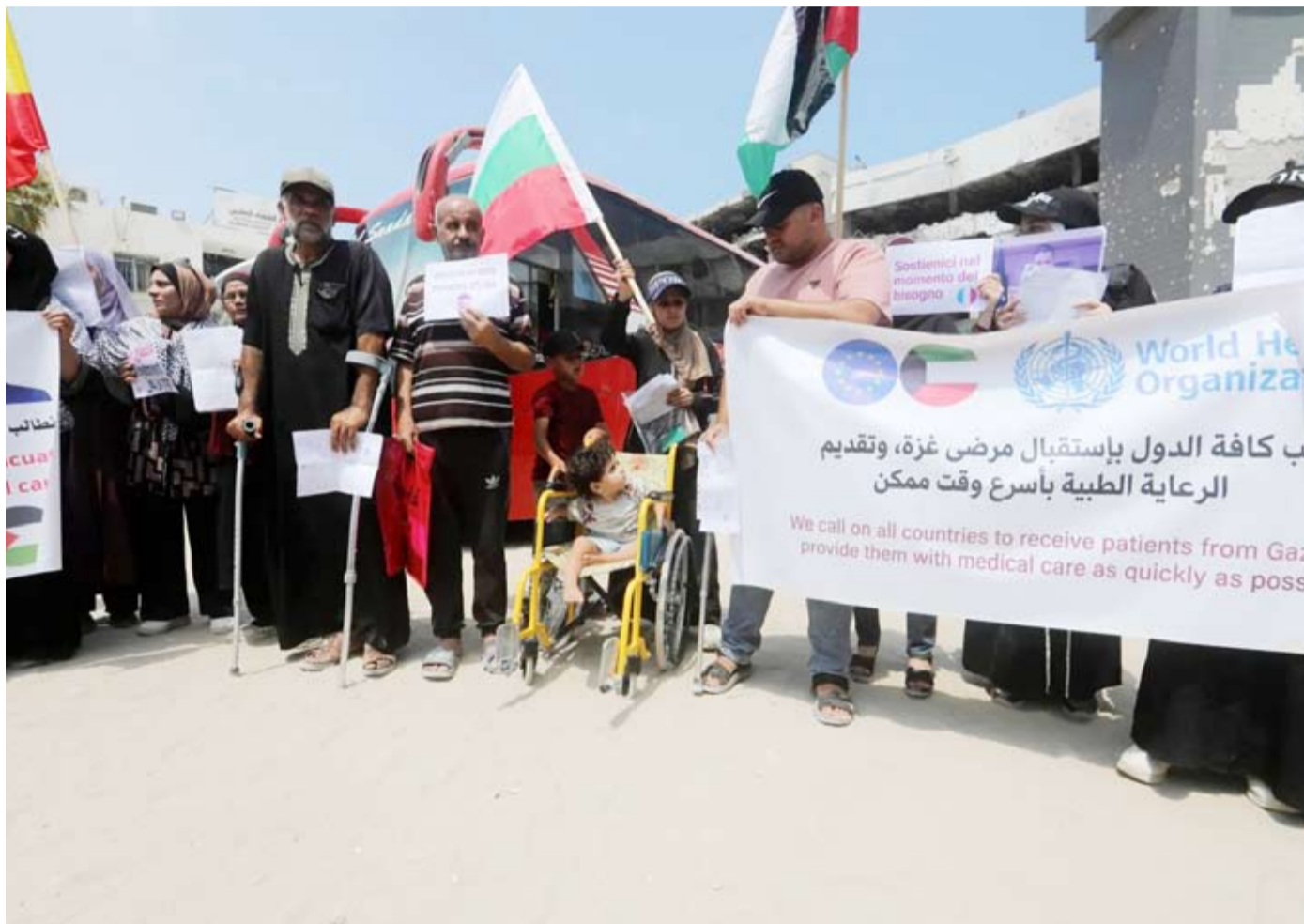
فلسطينيون جرحى وذووهم في وقفة احتجاجية

شقة سكنية في محيط المستشفى الأردني بحي تل الهوا، جنوب غربي مدينة غزة. أكد مصدران في حركة «حماس» لـ«الشرق الأوسط»، أن قياداتها تتجه لإعلان حل ما يسمى «لجنة متابعة العمل الحكومي» التي تعد حكومتها الفعلية في القطاع، بعد نحو عقدين من الإدارة الكاملة لشؤونه. وشرح المصدران، في إفادات منفصلة، أن خطوة الحل تأتي في إطار «مبادرة» لفتح الطريق أمام دخول «لجنة إدارة غزة»، أو ما يُعرف بلجنة التكنوقراط» التي يديرها الفلسطينيون علي شعث، إلى القطاع