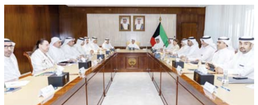
نائب وزير الخارجية السفير حمد المشعان يترأس الاجتماع

ترأس نائب وزير الخارجية السفير حمد المشعان، أمس، اجتماعاً لمجلس السالكين الدبلوماسي والتقني في ديوان عام الوزارة بمشاركة مساعدي وزير الخارجية أعضاء المجلس. وذكرت (الخارجية) في بيان أنه تم خلال الاجتماع