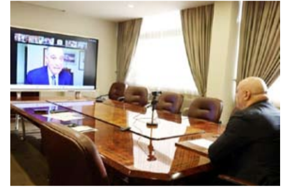
الرئيس اللبناني خلال اتصال مع مجموعة العمل الأمريكية من أجل لبنان

وفي سياق متصل، أعلن وزير الإعلام اللبناني بول مرقس، أمس، أن الكلفة المباشرة الأولية للحرب وفق التقديرات الأولية تتراوح بين ثلاثة وأربعة مليارات دولار مشيراً إلى هذه الكلفة "من دون احتساب الخسائر الاقتصادية والأضرار غير المباشرة".