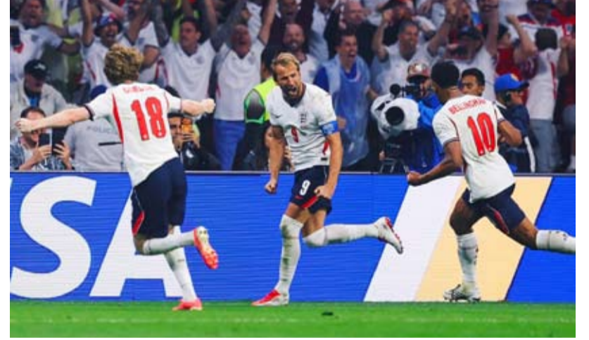
هاري كين يحتفل بالتسجيل من ركلة الجزاء

وذلك بعد فوز الإنجليز 3/2 وتأهلهم لدور الثمانية. وأصبح المنتخب الإنجليزي أول فريق يهزم المكسيك في ملعب «أزتيكا» ببطولة كأس العالم عبر التاريخ، حيث وجد الملعب التاريخي ضمن قائمة ملاعب نسخة 2026 بعدما استضاف مباريات للمنتخب المكسيكي في نسخته 1970 و1986 ولم يسبق لأي فريق أن هزم المنتخب المكسيكي على أرضية «أزتيكا» في عشر مباريات متتالية قبل انطلاق مباريات اليوم، لتتوقف السلسلة عند ذلك الرقم بعد فوز إنجلترا. وتأهل المنتخب الإنجليزي إلى دور الثمانية بكأس العالم للمرة 11 في تاريخه، لا يتفوق عليه في ذلك سوى منتخب البرازيل وألمانيا برصيد 15 و14 مرة على الترتيب.