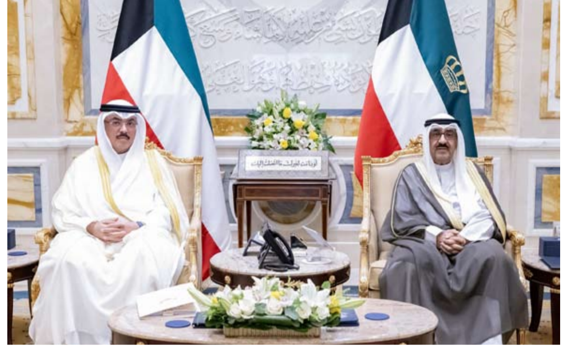
سمو أمير البلاد يستقبل وزير التربية