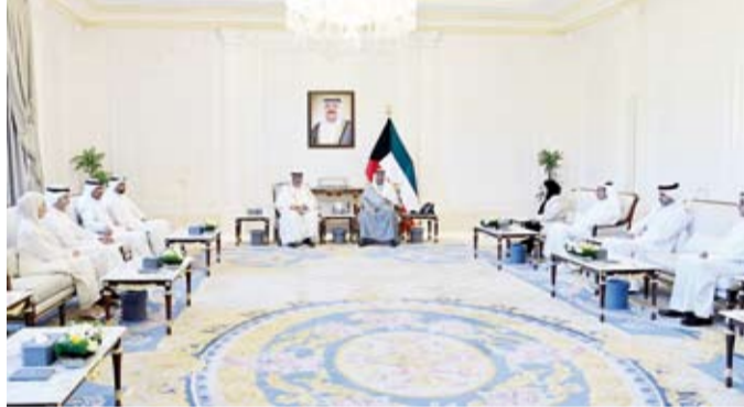
سمو ولي العهد يستقبل وزير التربية وقيادات الوزارة

العهد الشيخ صباح الخالد، أمس، وزير العدل ناصر السميح، حيث قدم لسموه وكيلة وزارة العدل عواطف السند، وذلك بمناسبة توليها منصبها الجديد. من جهة أخرى، بعث سمو ولي العهد الشيخ صباح الخالد، ببرقية تهنئة إلى الرئيس البروفيسور آرثر بيتر موثاريكا رئيس جمهورية ملاوي الصديقة، ضمنها سموه خالص تهانئه بمناسبة ذكرى الاستقلال لبلاد وراجياً لفخامته دوام الصحة والعافية. كما بعث سمو ولي العهد الشيخ صباح الخالد، ببرقية تهنئة إلى الرئيس عثمان غزالي رئيس جمهورية القمر المتحدة الشقيقة، ضمنها سموه خالص تهانئه بمناسبة ذكرى الاستقلال لبلاد وراجياً لسموه لفخامته وافر الصحة والعافية.