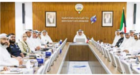
جانب من اجتماع الكهرباء

التقى وزير الكهرباء والماء والطاقة المتجددة د. صبيح الخيزيم بوكيل الوزارة د. عادل محمد الزامل وممثلي القطاعات المعنية، في اجتماع أمس الإثنين لمناقشة مؤشرات أداء فرق طوارئ الكهرباء والماء خلال شهر يونيو 2026، حيث تم استعراض نتائج التعامل مع البلاغات ومعدلات الاستجابة والإصلاح مقارنة بالفترة ذاتها من عام 2025.