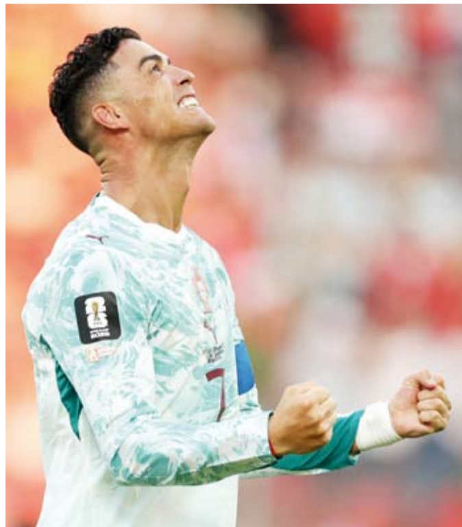
الفان رونالدو أمل البرتغال في بلوغ ربع النهائي

ويدخل منتخب المكسيك اللقاء بمعنويات مرتفعة، بعدما خاض أربع مباريات متتالية على أرضه، بينها ثلاث على ملعب «مكسيكو سيتي»، وقدم خلالها مستويات مميزة، إذ تصدر مجموعته بالعلامة الكاملة بعدما جمع تسع نقاط من ثلاثة انتصارات متتالية، بفوزه على جنوب إفريقيا (2 - 0) في المباراة الافتتاحية، ثم كوريا الجنوبية (1 - 0)، قبل أن يختم دور المجموعات بالفوز على التشيك (3 - 0)، محققاً بذلك أفضل حصيلة له في دور المجموعات بتاريخ مشاركاته في كأس العالم. ويدورح يسعى المنتخب الإنجليزي إلى تجاوز عقبة المكسيك وحجز مقعده في الدور ربع النهائي، عندما يعود إلى ملعب «مكسيكو سيتي»، الذي شهد واحدة من أكثر محطاته إيلاماً في تاريخ كأس العالم، بعدما خسّر أمام الأرجنتين التي أشتهدت بهدف الأرجنتيني ديبغو مارادونا باليد، قبل أن يسجل الهدف الثاني الذي يعد من بين أجمل الأهداف في تاريخ كأس العالم، لكن المنتخب الإنجليزي سيجد نفسه هذه المرة في مواجهة أصحاب الأرض، الذين أكدوا قدرتهم على استغلال عاملي الأرض والجمهور، بعدما قدموا مستويات مميزة منذ انطلاق البطولة.