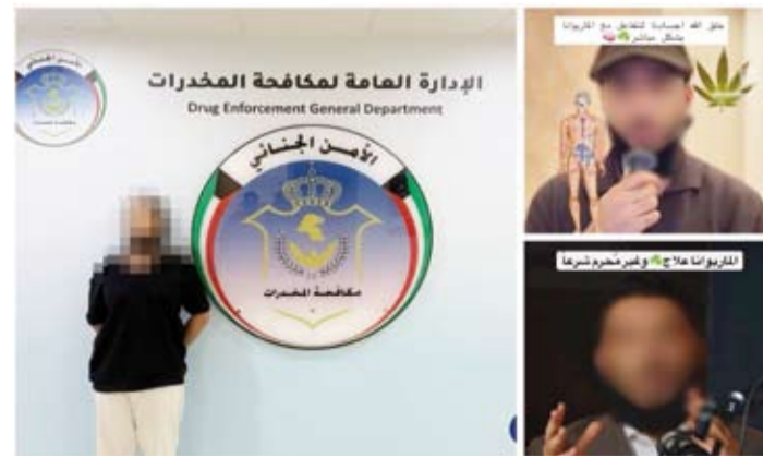
المتهم بروج مادة الماريجوانا

أحكام المرسوم بقانون رقم (159) لسنة 2025 بشأن مكافحة المخدرات والمؤثرات العقلية وتنظيم استعمالها والاتجار فيها، إذ نصت المادة (51) على أنه: يعاقب بالحبس مدة لا تتجاوز ثلاث سنوات وبغرامة لا تتجاوز خمسة آلاف دينار أو بإحدى هاتين العقوبتين كل من دعا بطريق الترويج أو الإغراء أو الإغواء وببأي وسيلة كانت إلى ارتكاب الجريمة المتصوص عليها في المادة (49) من هذا المرسوم بقانون.