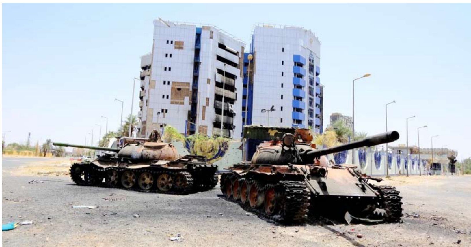
ديابات متضررة أمام مبنى بنك السودان المركزي

يواصل الجيش السوداني عملياته الهجومية في جبهة القتال بإقليم النيل الأزرق، جنوب شرقي البلاد، في محاولة للتقدم بوتيرة متسارعة نحو مدينة الكرمك الاستراتيجية القريبة من الحدود الإثيوبية، التي تسيطر عليها «قوات الدعم السريع» منذ مارس الماضي.