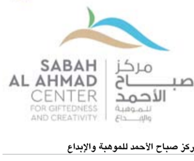
مركز صباح الأحمد للموهبة والإبداع

وأكد مواصلة تنفيذ برامجه الهادفة لاستثمار العقول الوطنية الواعدة وبناء منظومة متكاملة لرعاية الموهبة والإبداع بما يساهم في إعداد كوادر علمية قادرة على المنافسة عالمياً وتمثيل دولة الكويت بأفضل صورة.