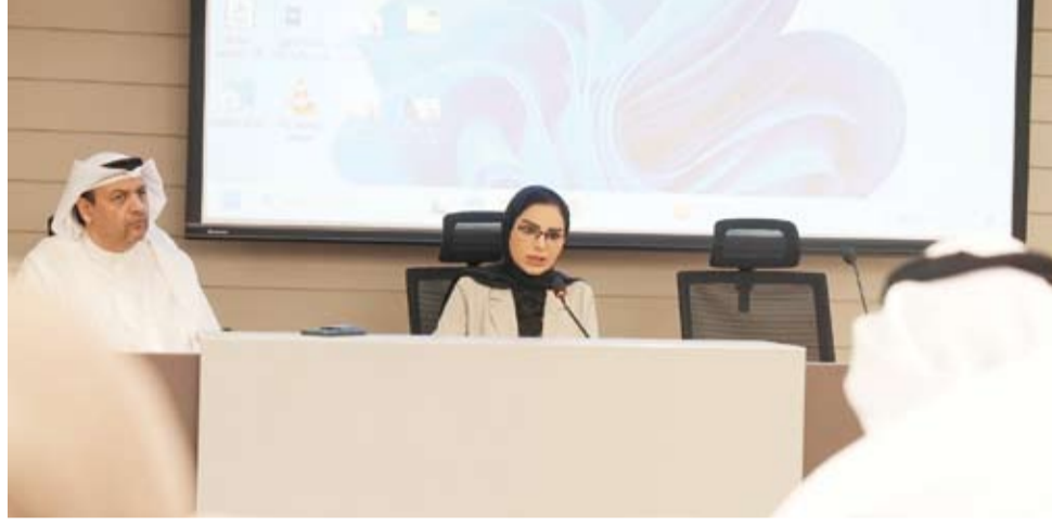
د. أمثال الحويولة خلال ترؤسها الاجتماع مع المعينين في الجمعيات التعاونية

الوزارة لكل موظف يؤدي واجبه بإخلاص، إذ ستوفر له الحماية اللازمة وفق القانون محذرة في الوقت ذاته من أنها لن تتهاون مع أي تقصير أو إخلال بالواجب الوظيفي.