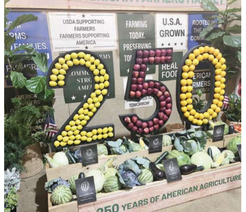
جانب من فعاليات المعرض

الأمريكية، ويضم المعرض أكثر من 150 جناحاً تقدم عروضاً موسيقية وفنية وفلكلورية يومية ومعارض للصناعات والابتكار والتكنولوجيا إضافة إلى فعاليات تسعى إلى ترسيخ روح