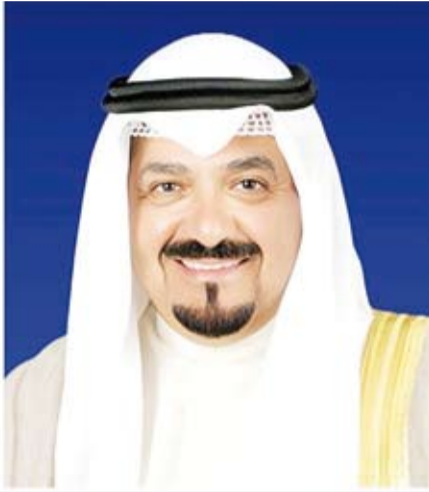
سمو الشيخ أحمد العبد الله

بعث سمو الشيخ أحمد عبدالله رئيس مجلس الوزراء، ببرقية تهنئة إلى الرئيس عبدالمجيد تبون رئيس الجمهورية الجزائرية الديمقراطية الشعبية الشقيقة بمناسبة ذكرى الاستقلال لبلاد.