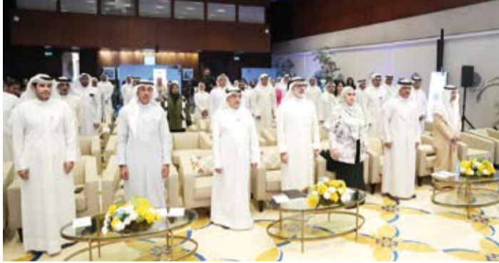
وزير الخارجية الشيخ جراح الجابر يتقدم الحضور خلال إطلاق المبادرة

وأوضح أن (صندوق الكويت للاستجابة الطارئة) سيعمل بصفتها نافذة حسابية خاصة ضمن الصندوق الكويتي للتنمية مع ضمان أعلى مستويات الشفافية والحكمة والرقابة المالية على تعبئة الموارد المالية وتوجيهها نحو المشروعات والبرامج ذات الأولوية وفقاً لأولويات الحكومة واحتياجاتها لاسيما إعادة تأهيل المرافق والمواقع المتضررة جراء العدوان الإيراني الأذى.