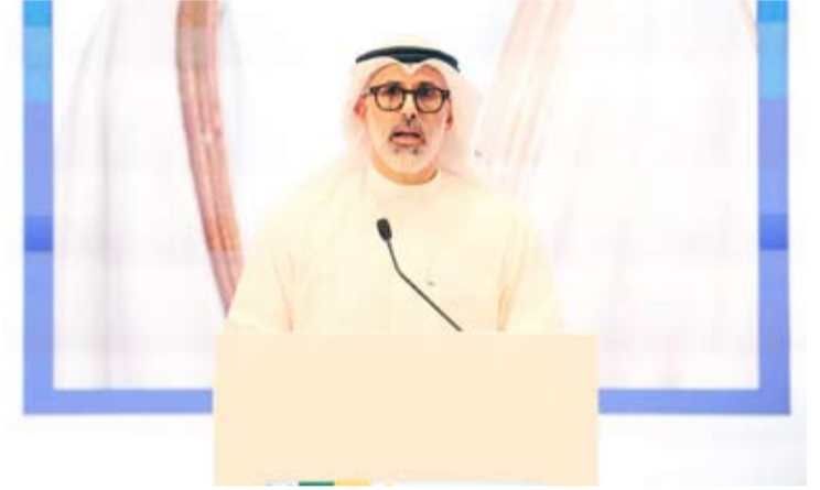
وزير الخارجية الشيخ جراح الجابر متحدثاً خلال المبادرة

أعلن الصندوق الكويتي للتنمية الاقتصادية العربية، انطلاق مبادرة وطنية استراتيجية تتمثل في إنشاء (صندوق الكويت للاستجابة الطارئة) برأسمال أولي قدره 100 مليون دولار أمريكي، وذلك دعماً للجاهزية الوطنية وتعزيز القدرة على مواجهة التحديات والظروف الاستثنائية. وقال وزير الخارجية رئيس مجلس إدارة الصندوق الشيخ جراح الجابر في المؤتمر الصحفي الخاص بإطلاق مبادرة (صندوق الكويت للاستجابة الطارئة)، الذي يقيمه الصندوق الكويتي بحضور: إن هذه المبادرة الوطنية تعكس قيم المسؤولية والتكافل وتجسد مبادئ التضامن التي تقوم عليها دولة الكويت، وذلك عبر تعزيز الجاهزية الوطنية وتطوير الأدوات المؤسسية