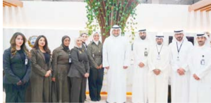
الشيخ الدكتور مشعل الصباح خلال زيارته جناح وزارة الدفاع في المعرض

وأثنى الشيخ عبدالله الصباح على الجهود المبذولة من فريق وزارة الدفاع في تنظيم الجناح وإبراز فرص العمل المتاحة أمام الخريجين مشيداً بتنوع الجهات المشاركة من القطاعين الحكومي والخاص وما يعكسه ذلك من تكامل الجهود الوطنية في دعم الشباب الكويتي وتوجيههم نحو مستقبلهم الأكاديمي والمهني.