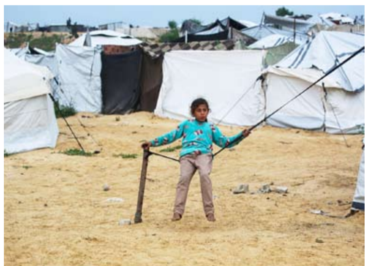
مخيم مؤقت للمنازحين الفلسطينيين بمنطقة نهر البارد بخان يونس

جديدة، والمساعي العربية لإعادة الاعتبار للقضية الفلسطينية بوصفها المدخل الحقيقي لاستقرار المنطقة». ويؤكد أن اختزال مؤتمر المانحين في كونه مناسبة لتوفير مساعدات مالية للسلطة الفلسطينية يفقده كثيراً من دلالاته الاستراتيجية، لافتاً إلى أن أهمية مؤتمر بروكسل تتجاوز حدود التمويل، ليصبح المؤتمر رسالة سياسية واضحة بأن المجتمع الدولي ما زال يرى في السلطة الفلسطينية المؤسسة الشرعية القادرة على إدارة الأراضي الفلسطينية، بخلاف رسالة موازية إلى إسرائيل، بأن إضعاف السلطة