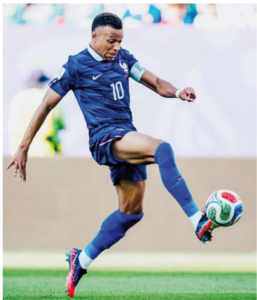
مبابي يواصل التسجيل

الذي كان قد تغلب على كندا بنتيجة 3 - صفر في دور ال16 من البطولة. وتقام مباراة دور الثمانية بين المغرب وفرنسا يوم 9 يوليو في فوكسبورو، ماستشوسيتس، في تكرار لمباراة الدور نصف النهائي بينهما بنسخة قطر 2022، التي كان قد فاز فيها المنتخب الفرنسي 2 - 1. ويطارد منتخب فرنسا لقبه الثالث تاريخياً في المونديال، بعدما فاز بالبطولة عامي 1998 و2018.