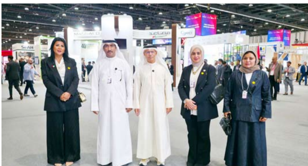
جانب من المشاركة بالفعالية في أبوظبي

وكيل «الكهرباء»: مشاركتنا في منصة «اصنع في الإمارات» لتعزيز التعاون وتبادل الخبرات