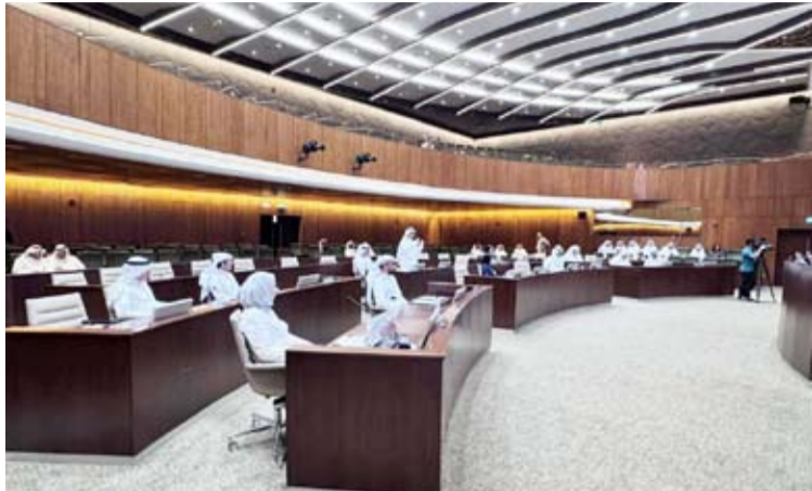
مناقشة من الأعضاء

تخصيص موقع لمستودعات لوجستية للأمن الغذائي في الشدادية الصناعية بمساحة 250 ألف متر مربع