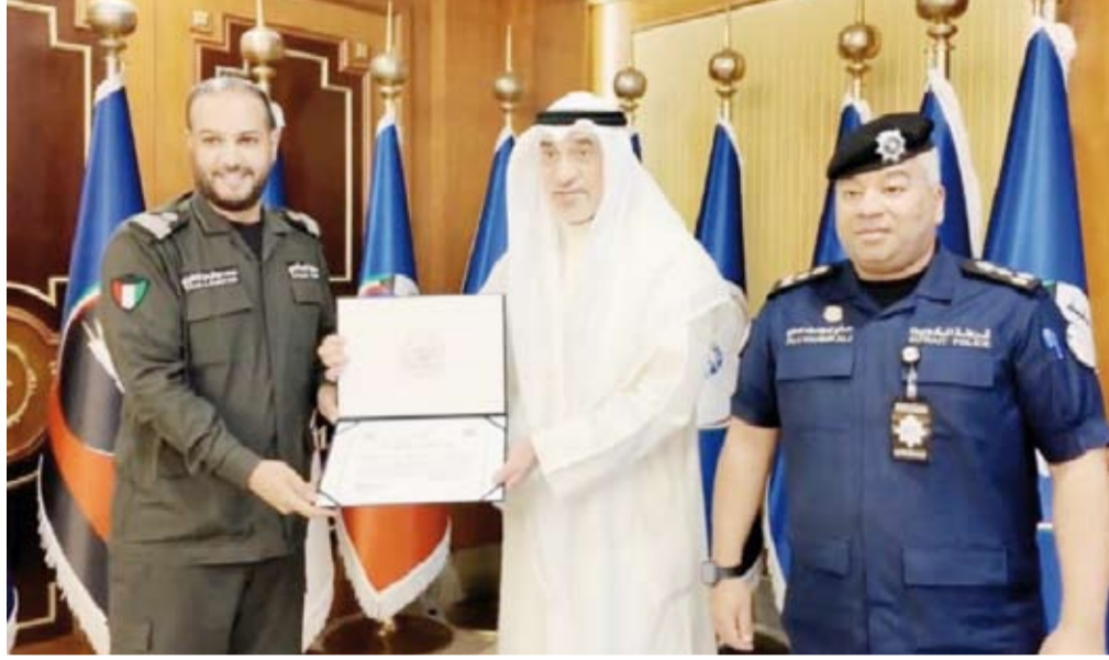
الشيخ فهد اليوسف مكرماً سعد المطيري

كرم النائب الأول لرئيس مجلس الوزراء ووزير الداخلية الشيخ فهد اليوسف، سعد المطيري من منتسبي إدارة منفذ السالمي بقطاع أمن المنافذ، وذلك تقديراً ليقظته وتفانيه في أداء مهام عمله، والتي أسفرت عن كشف محاولة أحد الأشخاص الدخول إلى البلاد بطريقة غير قانونية عبر منفذ السالمي الحدودي.