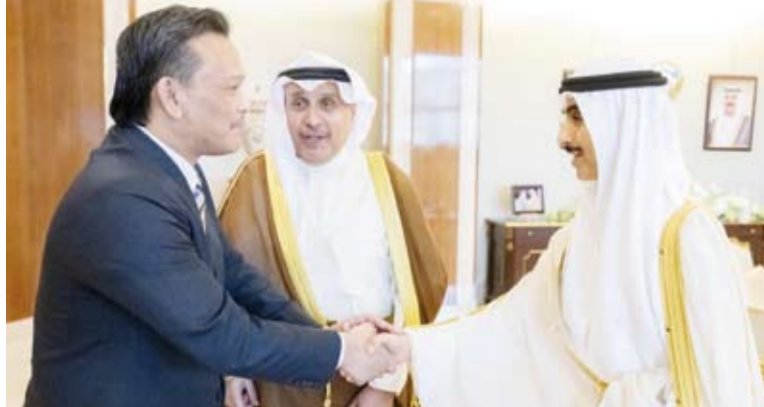
.. ويستقبلان سفير ماليزيا علاء الدين محمد نور