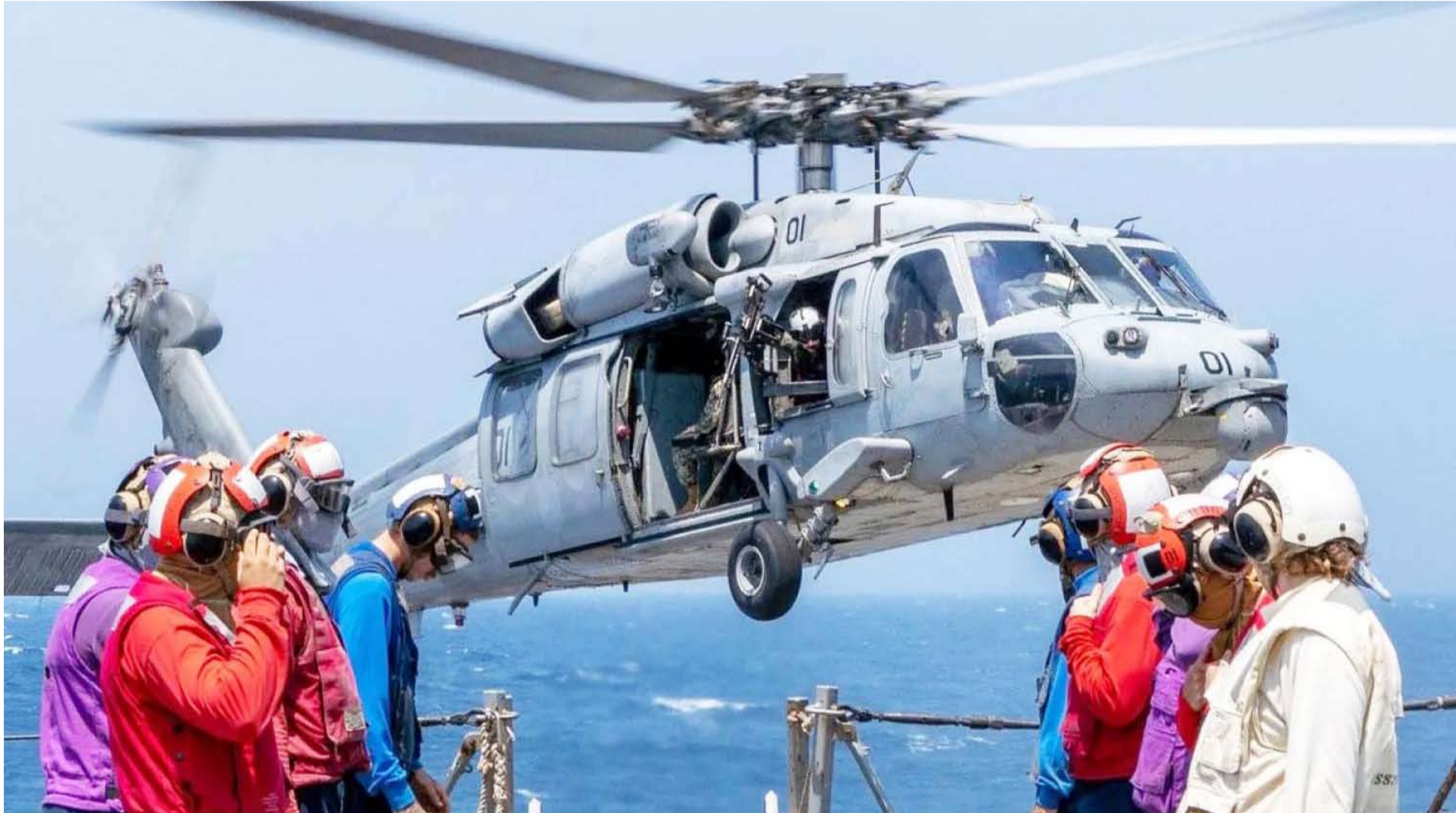
مروحية على متن المدمرة «يو إس إس ميلبوس»

أعلن الرئيس الأميركي دونالد ترامب أن مسؤولين أميركيين يجرون مناقشات «إيجابية للغاية» مع إيران بشأن خطوات محتملة لإنهاء الحرب، في حين كشف عن خطة تبدأ لمواكبة القوات الأميركية للسفن التي تعبر مضيق هرمز المغلق. وقال إن العملية البحرية الجديدة التي أطلق عليها اسم «مشروع الحرية»، هي بمثابة مبادرة «إنسانية» للسفن العديدة العالقة والتي تعاني من نقص الغذاء والإمدادات الحيوية الأخرى. لكنه أشار إلى أنه «إذا تم التدخل بأي شكل من الأشكال في هذه العملية الإنسانية (توجيه السفن)، فستعبر لاسلاف التعامل مع هذا التدخل بقوة». وأعلنت القيادة المركزية الأميركية «سنكوم» في بيان على منصة اكس، عن بدء قواتها اعتبارا من بدعم «مشروع الحرية» بمدمرات مجهزة بصواريخ موجهة وأكثر من 100 طائرة مقاتلة على البر وفي البحر و15 ألف جندي. في المقابل، حذر مسؤول إيراني كبير، من أن طهران ستعتبر أي محاولة أميركية للتدخل في مضيق هرمز بمثابة انتهاك لوقف إطلاق النار. وأعلن إبراهيم عزيزي، رئيس لجنة الأمن القومي والسياسة الخارجية في مجلس الشورى الإيراني، على منصة اكس، أن «أي تدخل أميركي في النظام البحري الجديد لمضيق هرمز سيعتبر انتهاكا لوقف إطلاق النار».