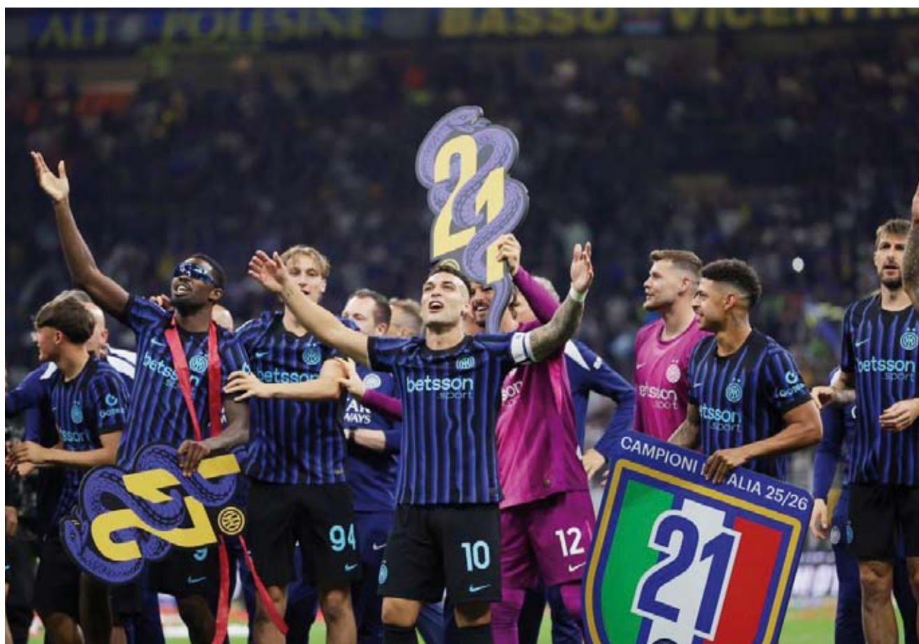
إنتر يتوج بالدوري الإيطالي

حسم إنتر ميلان لقب الدوري الإيطالي لكرة القدم للمرة الـ21 في تاريخه، وذلك بعد فوزه على ضيفه بارما 2 / صفر، ضمن منافسات الجولة 35 من المسابقة. ورفع إنتر ميلان رصيده إلى 82 نقطة في المركز الأول، ليوسع الفارق إلى 12 مع نابولي صاحب المركز الثاني وحامل لقب الموسم الماضي. ويبتعد إنتر ميلان بفارق 13 نقطة عن ميلان صاحب المركز الثالث، وذلك قبل ثلاث جولات من نهاية الموسم. واستعاد إنتر ميلان لقب الدوري بعدما غاب عنه في الموسم الماضي الذي خسره في اللحظات الأخيرة لصالح نابولي، وكانت المرة الأخيرة التي توج فيها إنتر ميلان بلقب في موسم 2023/2024. وسعى إنتر ميلان الفارق في ألقاب الدوري بينه وبين غريمه التقليدي ميلان إلى لقبين، حيث توج الأخير بلقب 19 مرة كان آخرها موسم 2021/2022. ويتبقى لإنتر ميلان، مثل باقي فرق الدوري، ثلاث مباريات في المسابقة حيث سيلعب مع لانسو في الجولة المقبلة، ثم يلتقيان مجدداً في نهائي كأس إيطاليا يوم 13 من الشهر الجاري، ثم سيواجه هيلاس فيرونا وبولونيا في آخر جولتين من الدوري. على الجانب الآخر، تجمد رصيد بارما 42 نقطة في المركز الثاني عشر.