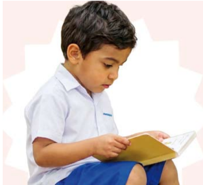
المسابقة ترسخ ثقافة القراءة لدى النشء