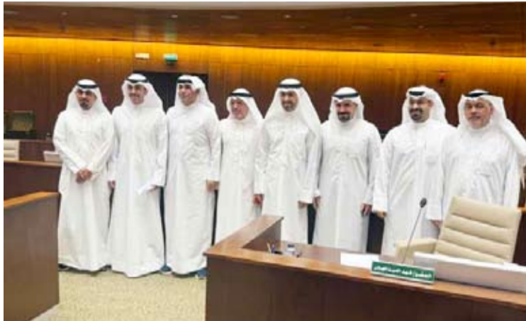
أعضاء البلدي قبل الجلسة