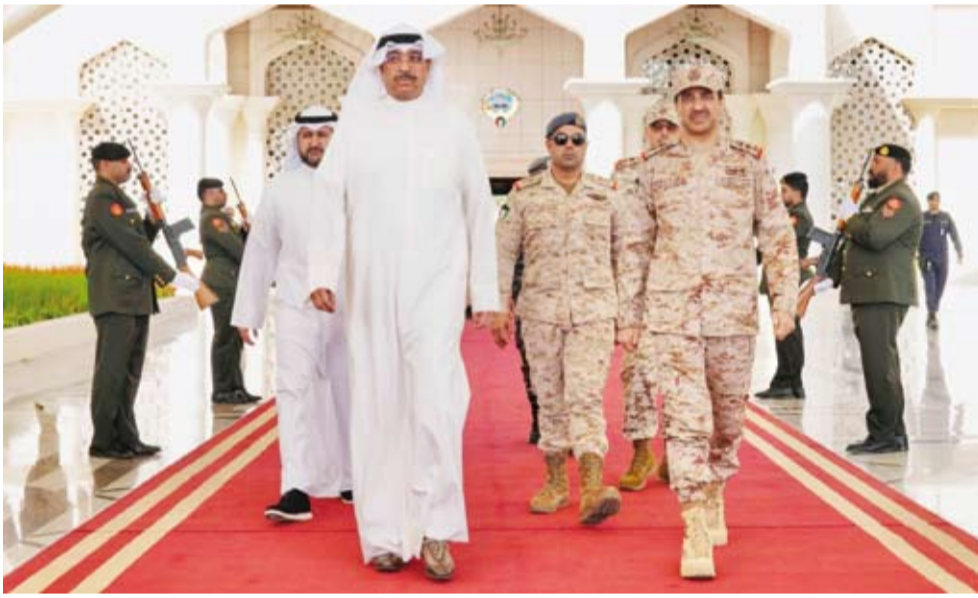
الشيخ عبدالله العلي لدى مغادرته البلاد

الوطني. وكان في وداع الوزير لدى مغادرته البلاد، رئيس الأركان العامة للجيش اللواء الركن طيار صباح جابر الأحمد وعدد من كبار الضباط القادة من وزارتي الدفاع والداخلية والحرس