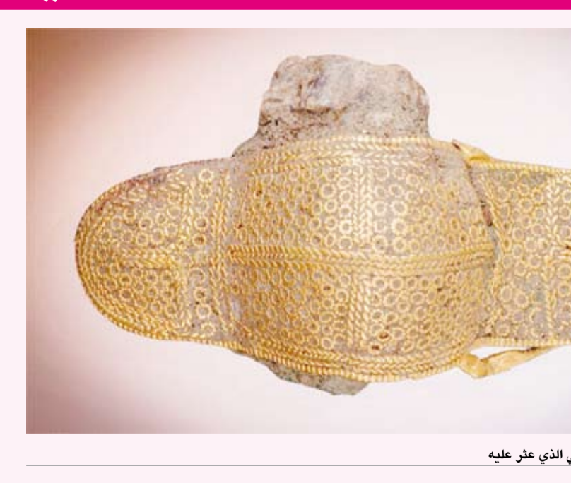
البروش الذهبي الذي عثر عليه