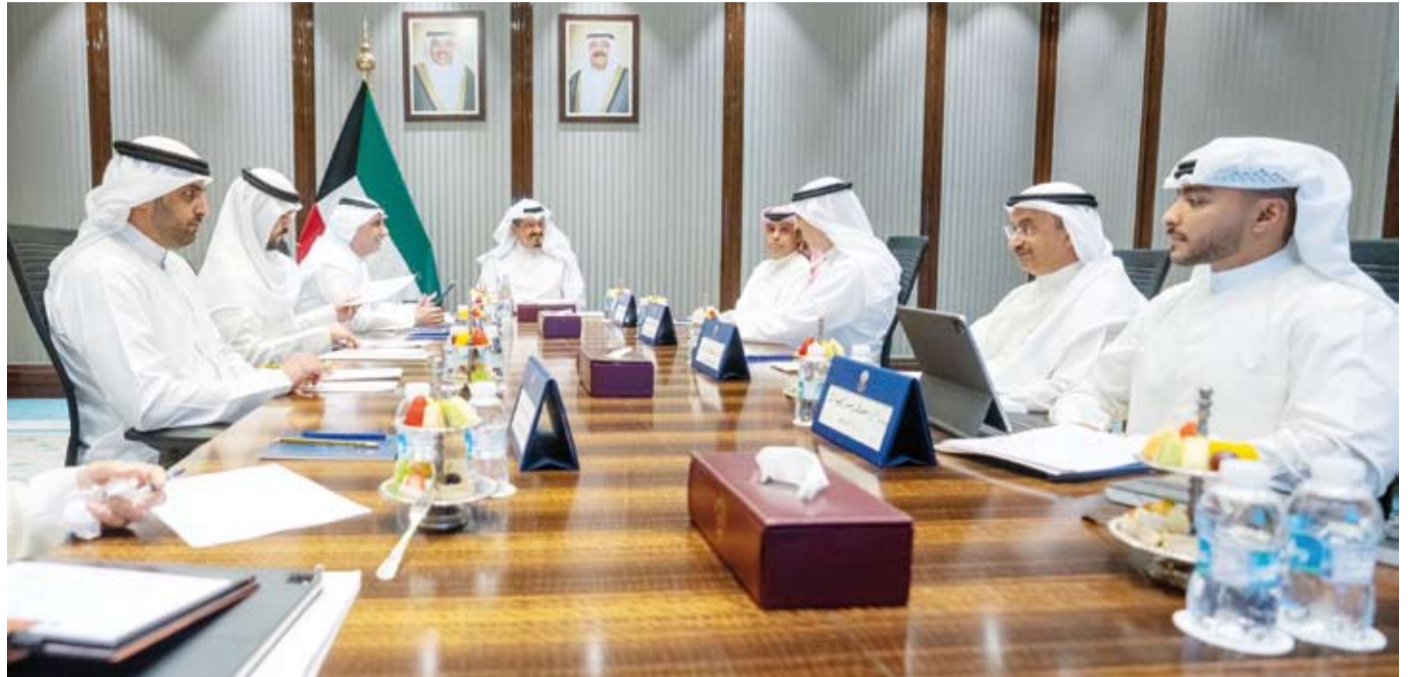
سمو الشيخ أحمد العبدالله يترأس الاجتماع

ترأس سمو الشيخ أحمد العبدالله رئيس مجلس الوزراء، اجتماعاً، أمس، لبحث ومتابعة إعادة هيكلة الأجهزة الحكومية والمؤسسات العامة في الدولة. ووجه سمو رئيس مجلس الوزراء