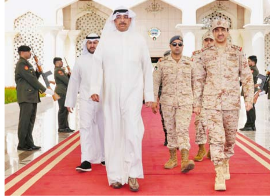
وزير الدفاع خلال مغادرته أمس

توجه وزير الدفاع الشيخ عبدالله العلي أمس إلى الجمهورية التركية وذلك تلبية لدعوة من نظيره التركي يشار غولر. وقالت «الدفاع» في بيان صحفي إنه يرافق الشيخ عبدالله الصباح في هذه الزيارة نائب رئيس الأركان العامة للجيش اللواء الركن طيار صباح جابر الأحمد وعدد من كبار الضباط القادة من وزارتي الدفاع والداخلية والحرس الوطني.