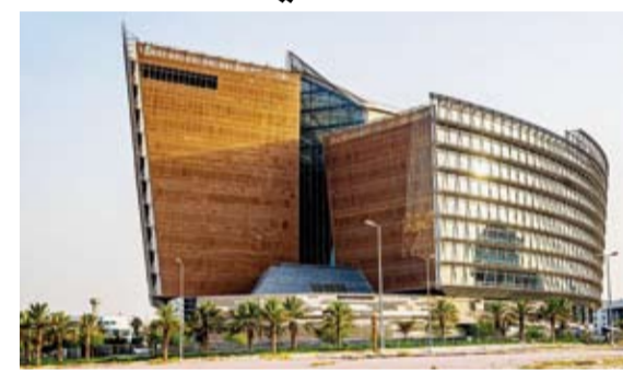
الحضارية لمنظومة العمل التربوي.

المراتب الوطني أقارب من الدرجة الأولى في الصفوف الـ 12 أو الـ 11 أو العاشر، وذلك لضمان الحياد الكامل وتقادي أي تضارب محتمل في المصالح خلال سير أعمال لجان الامتحانات. وأسفدت بأن عملية الاختيار ستشمل إجراء مقابلات شخصية للمرشحين قبل اعتماد الأسماء النهائية للتكليف بأعمال المراقب الوطني كما ستضمن العملية اختيار موظفي وزارة التربية الكويتيين من الوظائف الآتية: موجه فني رئيس قسم مادة دراسية ومعلم على أن يراعى عدم اختيار معلمي المواد الدراسية المدرجة ضمن جدول اختبارات اللجان التي سيرشرفون عليها تحقيقاً لمبدأ الحياد وضماناً لنزاهة سير الامتحانات.