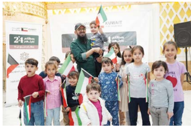
الشاي مع مجموعة من أطفال السوريين في تركيا