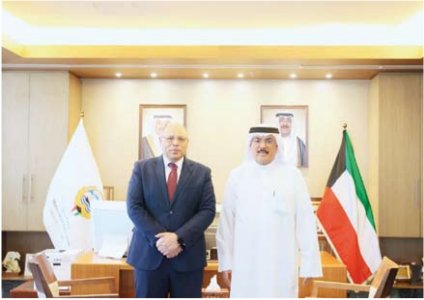
وزير التربية سيد جلال الطيبباني مستقبلاً سفير مصر محمد أبو الوفا

استقبل وزير التربية سيد جلال الطيبباني، أمس، سفير جمهورية مصر العربية لدى دولة الكويت محمد أبو الوفا ونائبة السفير نورا عبدالهادي ومستشار السفير محمد عبدالمعطي والمستشار التعليمي بالمحق الثقافي بالسفارة المصرية الدكتورة أمينة أبو الكارم. وقالت الوزارة في بيان لها: إن اللقاء تناول سبل تعزيز أوجه التعاون المشترك بين البلدين في المجالات التربوية والتعليمية إلى جانب بحث عدد من الموضوعات ذات الاهتمام المشترك بما يساهم في دعم وتطوير العلاقات الثنائية.