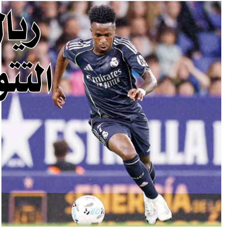
فينيسوس احرز هدفي اللقاء أمام إسبانيول

فاز ريال مدريد على مضيئه إسبانيول بنتيجة 2 / صفر، في منافسات الجولة الرابعة والثلاثين من الدوري الإسباني لكرة القدم، ليؤجل تتويج غريمه التقليدي برشلونة بلقب رسمي قبل أربع جولات على انتهاء المسابقة. سجل النجم البرازيلي فينيسوس جونيور هدفي الريال في الشوط الثاني بالدقيقتين 55 و66. بهذا الفوز يرفع العملاق المردي رصيده إلى 77 نقطة في المركز الثاني ليقلص الفارق إلى 11 نقطة مع برشلونة متصدر الترتيب. وبذلك يتأجل حسم لقب الدوري رسمياً إلى مباراة الكلاسيكو يوم الأحد المقبل، عندما يحل ريال مدريد ضيفاً على برشلونة الذي يحتاج لنقطة واحدة فقط ليحسم تتويجه قبل ثلاث جولات من نهاية المسابقة. أما إسبانيول فقد وصل سلسلة نتائجه السلبية بخسارته الرابعة في آخر ست جولات، ليتراجع للمركز الثالث عشر برصيد 39 نقطة، ويورط نفسه في صراع الهبوط للدرجة الثانية حيث يبتعد بفارق خمس نقاط فقط عن منطقة الخطر.