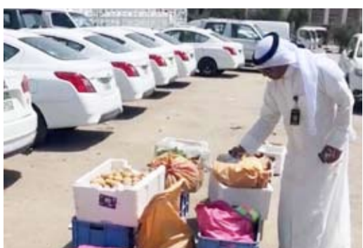
ضبط بسطات مخالفة بالشارع

فرق النظافة الميدانية تكثف الجولات التفتيشية في المحافظات