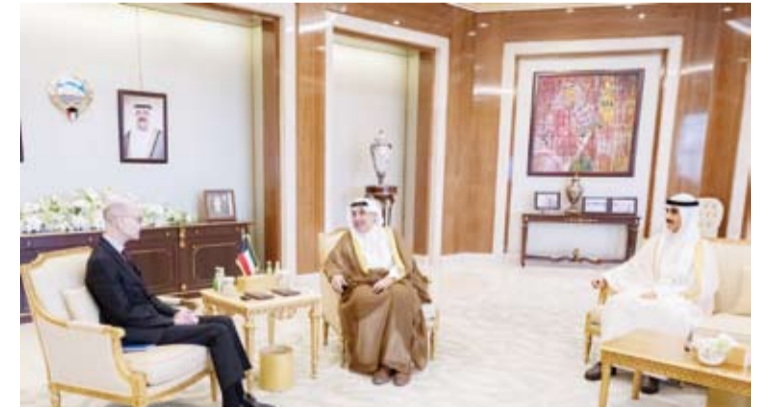
الشيخ حمد جابر العلي والشيخ ناهر الجابر يستقبلان السفير د. جورج سعيد زاميت سفير مالطا

التاريخية التي تجمع دولة الكويت وماليزيا الصديقة وسبل الارتقاء بها في مختلف المجالات والتأكد على الحرص المتبادل على مواصلة التعاون القائم وتطويره بما يعكس متانة العلاقات بين البلدين الصديقين.