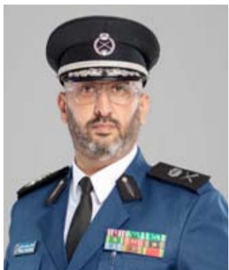
اللواء طلال الرومي

بالعمل بروح الفريق الواحد لتنفيذ المهام بكل دقة وإتقان.