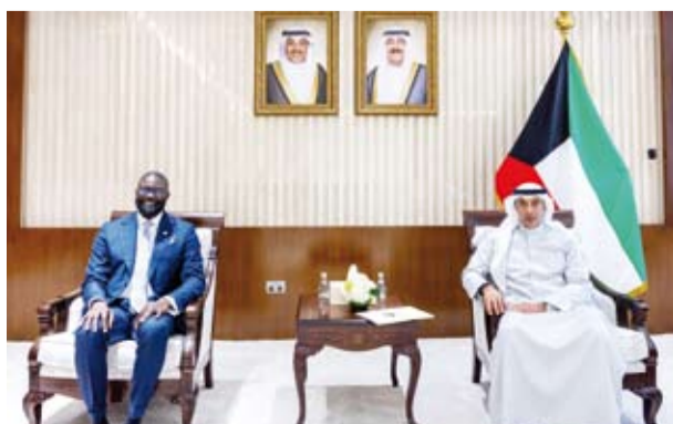
نائب وزير الخارجية السفير حمد المشعان يستقبل مامادو سو

استقبل وزير شؤون الديوان الأميري الشيخ حمد جابر العلي ورئيس ديوان سمو ولي العهد الشيخ ناهر الجابر، السفير د. جورج سعيد زاميت سفير جمهورية مالطا الصديقة لدى دولة الكويت.