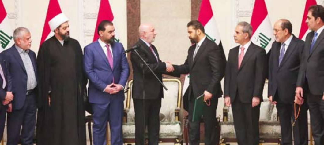
نزار أميدي يصافح علي الزبيدي

الذي يريد أن يشكل حكومة خالية من الفصائل المسلحة، ومن الترهل في المناصب، ومن إملات الكتل السياسية. في الوقت الذي يتحرك فيه رئيس الوزراء العراقي المكلف بتشكيل الحكومة علي الزبيدي، متسلحاً بدعم أميركي صلاحيات. وطبقاً للمراقبين السياسيين في بغداد، فإنه في حال أصرت تلك القوى على شروطها، فإن هذا يمكن أن يكون بداية الافتراق بينها وبين الزبيدي العراقية؛ هو «صراع الوزارات».