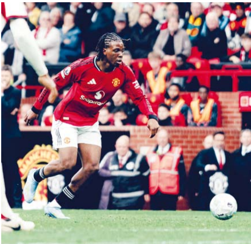
هدف الفوز في طريقه لرمي البريد

ورفع يونائتد رصيده إلى 64 نقطة في المركز الثالث، بفارق 6 نقاط عن ليفربول الرابع الذي قد يفقد مركزه في حال حقق أستون فيلا نتيجة إيجابية أمام توتنهام في وقت لاحق. في المقابل، تلقى ليفربول الذي غاب عنه المصري محمد صلاح بسبب الإصابة، خسارته الأولى في الدوري بعد ثلاثة انتصارات، والـ11 في موسم متقلب فشل فيه في الدفاع عن اللقب.