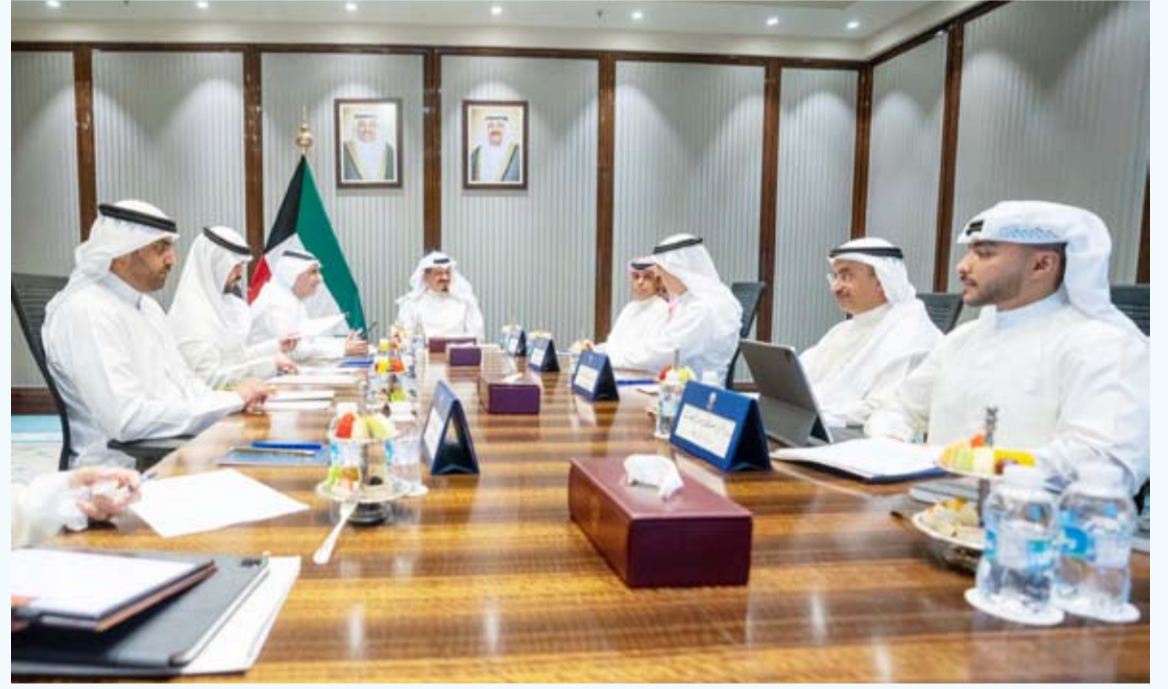
العبدالله يترأس اجتماعاً لإعادة تنظيم الهياكل الحكومية

وجه سمو رئيس مجلس الوزراء ومراجعة الهياكل الحكومية وإعادة تنظيمها بما يسهم في استثمار موارد الدولة ويضمن بناء منظومة إدارية متطورة تتسم بالكفاءة