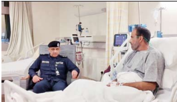
اللواء عبدالوهاب الوهيب يزور العقيد محمد الهاجري

وقاد وكيل وزارة الداخلية اللواء عبدالوهاب الوهيب بزيارة العقيد محمد راشد الهاجري الذي أصيب جراء العدوان الإيراني الآثم أثناء تأدية مهام عمله في أحد مواقع المسؤولية، وذلك للاطلاع على حالته الصحية والوقوف على مستوى الرعاية الطبية المقدمة له وفي إطار المتابعة الميدانية وحرص (الداخلية) على الأطمئنان على منتسبيها. وقالت (الداخلية) في بيان صحفي مساء الخميس الماضي: إن اللواء الوهيب نقل خلال الزيارة تحيات وتقدير النائب الأول لرئيس مجلس الوزراء ووزير الداخلية الشيخ فهد اليوسف وتمنياته له بالشفاء العاجل، مشيداً بما قدمه من تضحيات وجهود وطنية مخلصه.