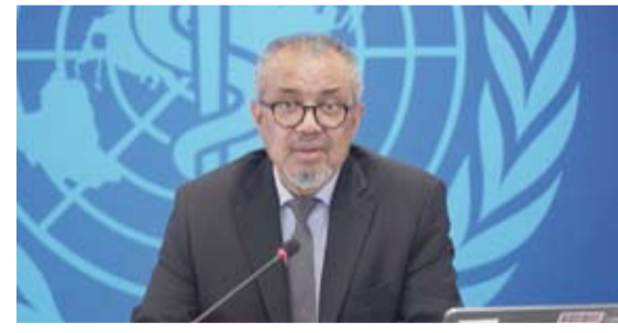
د. تيدروس غيبريسوس

واحد والحاق أضرار بالبيئية التحتية. وأكد غيبريسوس أن خدمات المياه للسكان استمرت من دون انقطاع رغم تلك الحوادث، محذراً من أن استهداف هذه المنشآت من شأنه أن يهدد المستشفيات وخدمات الرعاية الصحية وسلامة السكان.