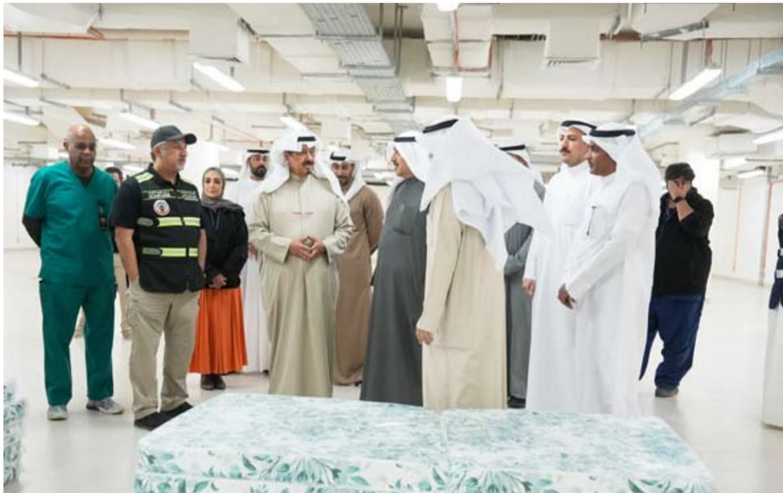
جولة لسمو رئيس مجلس الوزراء