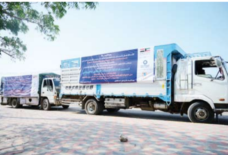
قافلة المساعدات للمتضررين