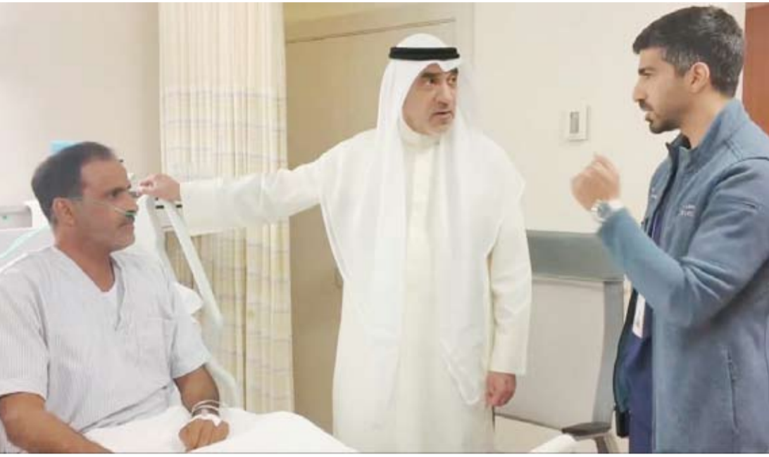
الشيخ فهد اليوسف خلال زيارة المصابين من منتسبي وزارة الداخلية

قام النائب الأول لرئيس مجلس الوزراء ووزير الداخلية الشيخ فهد اليوسف، أول أمس، بزيارة إلى عدد من منتسبي الوزارة الذين تعرضوا للإصابة جراء العدوان الإيراني الآثم وأثناء تاديتهم واجبهه الوطني في مواقع المسؤولية وذلك للاطلاع على حالتهم الصحية والوقوف على مستوى الرعاية الطبية المقدمة لهم. وقالت وزارة الداخلية إن الشيخ فهد اليوسف نقل إلى المصابين تحيات وتقدير القيادة السياسية واعتزازها بما قدموه من تضحيات وطنية مشرفة. سألنا المولى عن وجل أن يمن عليهم بالشفاء العاجل.