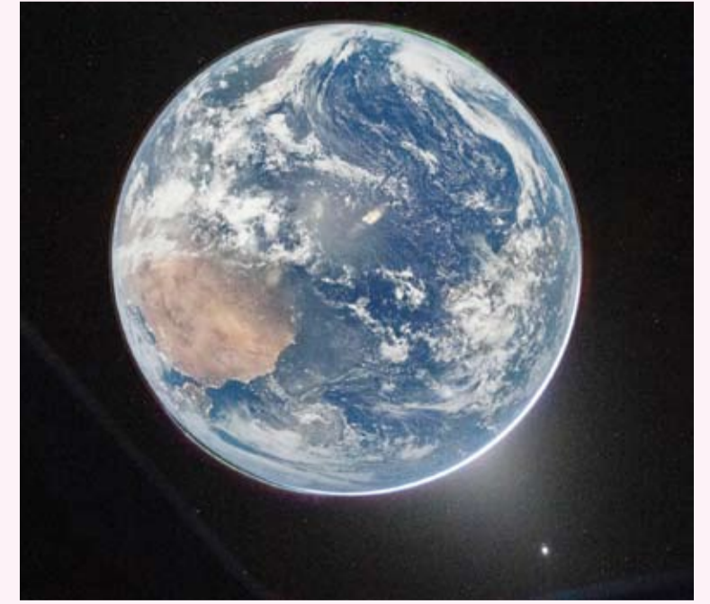
الصور الأولى للأرض

للوصول إلى جوار القمر. ويوثق الرواد أوقاتهم في الفضاء بأنفسهم باستخدام هواتفهم الذكية وكاميراتهم، وتبث وكالة ناسا مشاهد مباشرة لهم.