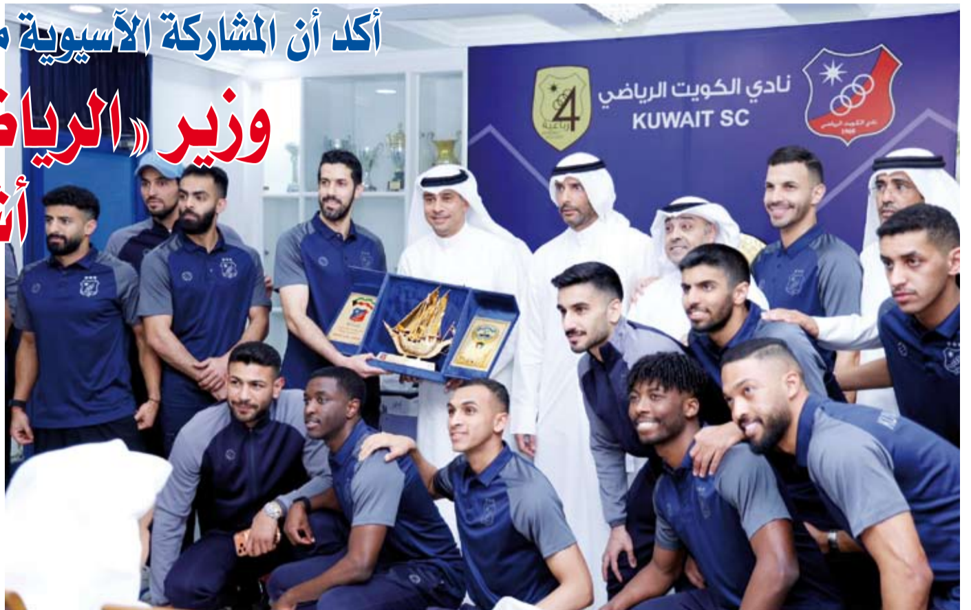
دور تكتاري للوزير الجلاهمة

أكد وزير الدولة لشؤون الشباب والرياضة الكويتي الدكتور طارق الجلاهمة الحرص على توفير كافة أشكال الدعم للأندية المحلية سواء من خلال تطوير البنية التحتية أو تهيئة الظروف المناسبة للإعداد الفني والبدني بما يساهم في رفع مستوى التنافسية وتحقيق الإنجازات. جاء ذلك في تصريح صحفي للوزير الجلاهمة عقب زيارته نادي الكويت حيث التقى بلاعبي الفريق الأول لكرة القدم والجهازين الفني والإداري قبل مواجهة المرتقب مع فريق الشباب العماني في 19 أبريل