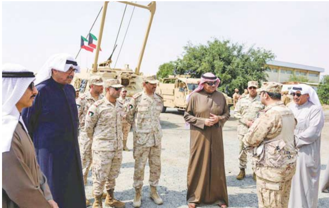
جانب من إحدى جولات سمو ولي العهد