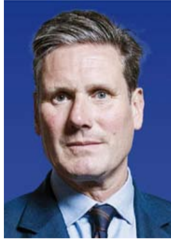
رئيس وزراء بريطانيا كير ستارمر