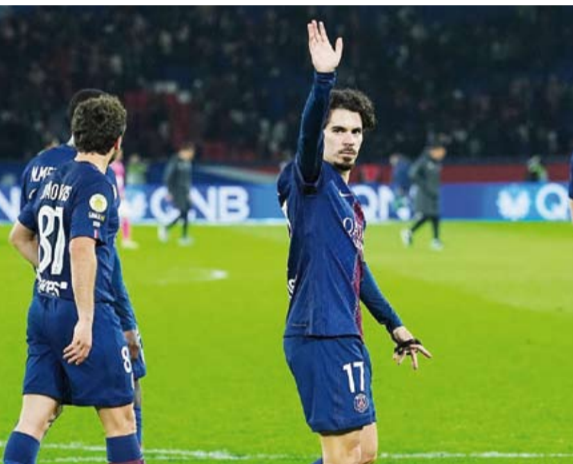
فوز كبير لسان جيرمان على تولوز

14 موسماً. وحقق سان جيرمان فوزه العشرين في البطولة، في حين تلقى تولوز خسارته الـ11 وتجمد رصيده عند 37 نقطة في المركز التاسع مؤقتاً. وكان من المنتظر أن يشارك لاعب الوسط الإسباني فابيان رويس بعد غياب شهرين بسبب الإصابة، لكنه لم يستدع إلى المباراة، ما يؤجل حضور «الثالث السحري» في وسط الملعب.