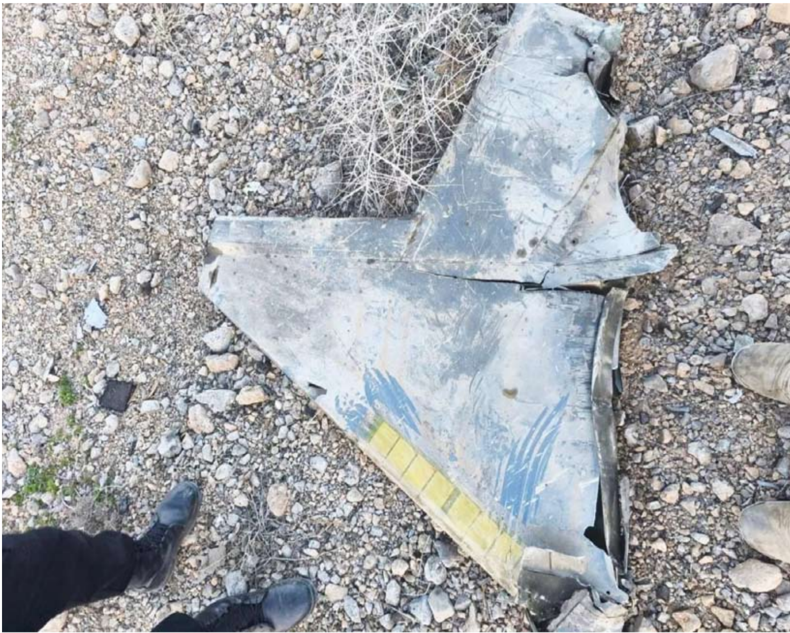
حطام مقاتلة أميركية تحطمت في غرب إيران

السعودية: أعلنت وزارة الدفاع السعودية -في بيانات متتالية- اعتراض وتدمير 14 طائرة مسيرة. الإمارات: في أبو ظبي، أعلن المكتب الإعلامي -في بيان- أنّ الجهات المختصة تعاملت مع سقوط شظايا في منشأة حبشان للغاز، مما أدى إلى حريق وتعليق العمليات. وأكد المكتب الإعلامي أنّ الجهات المختصة تعاملت مع حريقين اندلعا في الموقع، وباشرت فرق الاستجابة للطوارئ التعامل مع الحادث، وتمت السيطرة على الوضع.