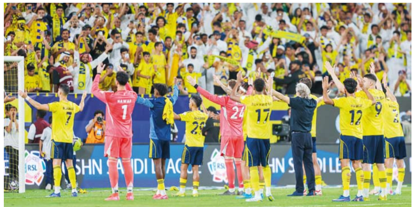
رونالدو ولاعبو النصر يحتفلون مع الجماهير

وفي الدقيقة 47 سجل فيليب كار دوسو الهدف الثاني للنجمة، لكن روناودو سجل الهدف الثالث للنصر من ضربة جزاء في الدقيقة 56، قبل أن يضيف الهدف الرابع في الدقيقة 73. وعاد النصر للتسجيل مجدداً في الدقيقة الخامسة من الوقت بدل الضائع للشوط الثاني، عن طريق ساديو ماني الذي سجل الهدف الثاني له في المباراة.