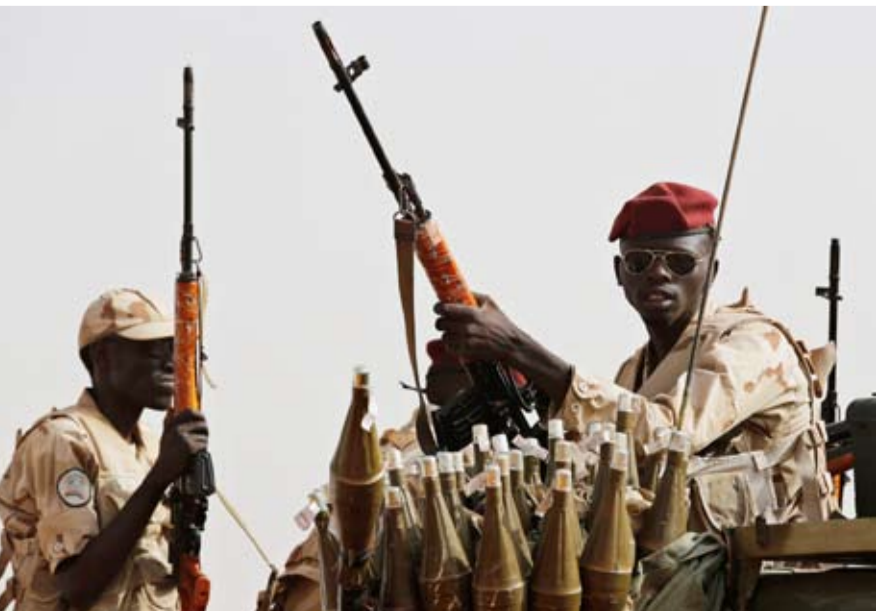
قوات الدعم السريع استهداف مستشفى الكويك

وتهدد لاستعادة مدينة الكرمك الإستراتيجية الواقعة على الحدود مع إثيوبيا. وطمان الحاكم مواطني الإقليم بأن الأوضاع ستعود كما كانت من قبل، ودعاهم إلى عدم تصديق الشائعات. وأعلنت حكومة الإقليم في وقت سابق حالة التعبئة العامة، في حين عزز الجيش السوداني وجوده العسكري بالولاية متوعداً بحسم المعارك لحصلته. وكان تحالف قوات الدعم السريع والحركة الشعبية-شمال قد سيطر على مدينة الكرمك الأسبوع الماضي، في تطور يذخر بعودة المواجهات إلى إقليم النيل الأزرق.