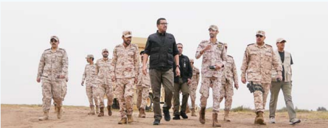
الشيخ عبدالله العلي خلال جولة ميدانية

من المسؤولية والحفاظ على أعلى درجات الاستعداد لمواجهة مختلف التحديات في الظروف الحالية.