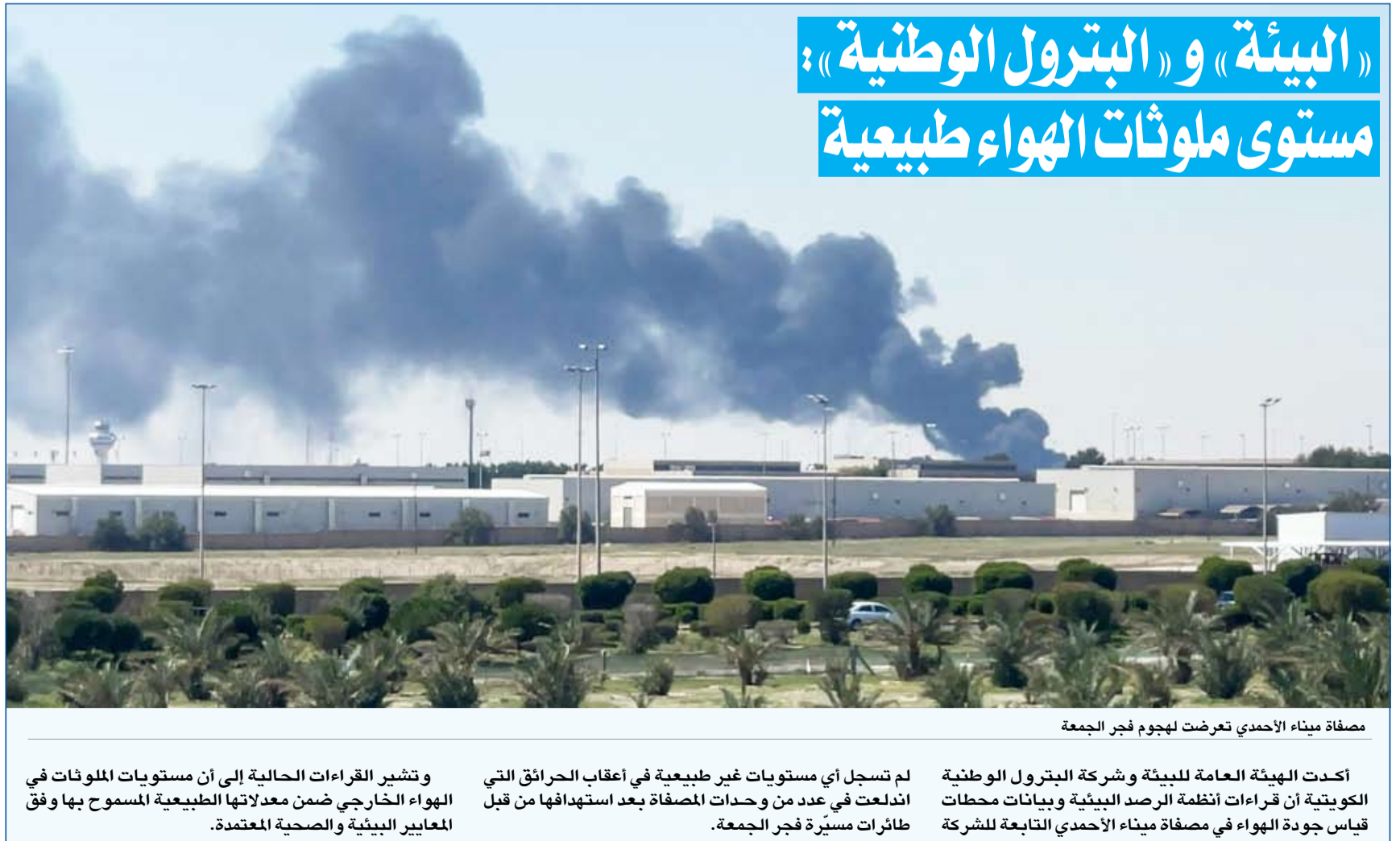
مصفاة ميناء الأحدي تعرضت لهجوم فجر الجمعة

وتشير القراءات الحالية إلى أن مستويات الملوثات في الهواء الخارجي ضمن معدلاتها الطبيعية المسموح بها وفق المعايير البيئية والصحية المعتمدة.