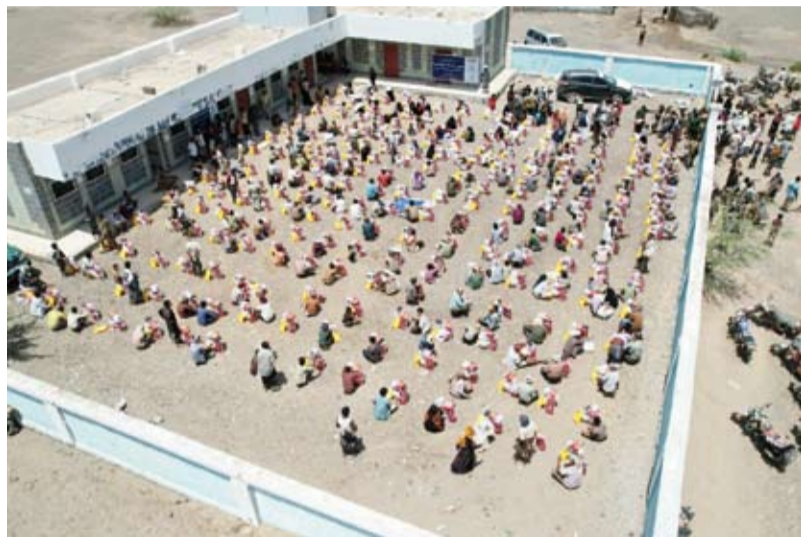
توزع 400 سلة غذائية للمتضررين من السيول بمحافظة تعز

مع مكتبتي وزارتي الشؤون الاجتماعية والعمل والتخطيط والتعاون الدولي في (تعز) وفرع الوحدة التنفيذية لإدارة مخيمات النازحين. ولفت إلى أن هذا التدخل يأتي ضمن الجهود الإنسانية الرامية إلى التخفيف من معاناة المتضررين وتوفير احتياجاتهم الأساسية في ظل الظروف الصعبة التي خلفتها الكارثة. من جانبه، ثمن مدير عام مديرية (الخا)