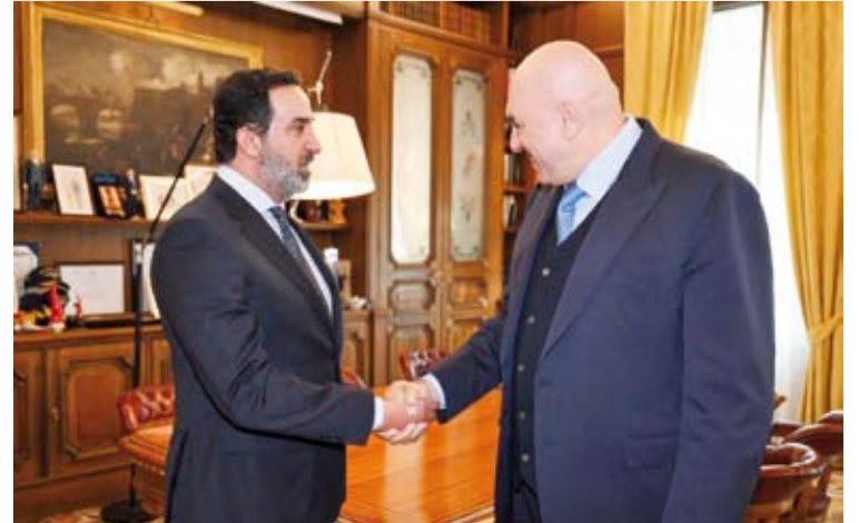
السفير ناصر القحطاني مع وزير الدفاع الإيطالي غويدو كروسيو

بحث سفير دولة الكويت لدى الجمهورية الإيطالية ناصر القحطاني مع وزير الدفاع الإيطالي غويدو كروسيو، تطورات الأوضاع في منطقة الخليج العربي والهجمات الإيرانية السافرة وغير المبررة على دول الخليج وانعكاساتها على أمن المنطقة والاستقرار الدولي وتهديد أمن الملاحة وتدابيرها على الاقتصاد العالمي. وذكرت سفارة دولة الكويت لدى روما في بيان لها، أول أمس، أن ذلك جاء خلال لقاء السفير القحطاني مع الوزير الإيطالي بالعامسة روما. وأشاد السفير القحطاني -خلال اللقاء- بموقف إيطاليا الذي أدان واستنكر العدوان الإيراني على دولة الكويت ودول الخليج العربي والمساهمة الإيطالية الفعالة في تعزيز منظومة الدفاع الجوي لدول المجلس