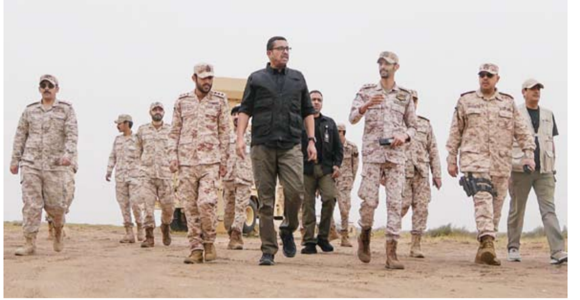
الشيخ عبدالله العلي خلال جولته التفقدية

وأشاد وزير الدفاع بالجهود المخلصة التي يبذلها منتسبو القوات المسلحة مخلصاً ما يتمتعون به من يقظة وجاهزية عالية في أداء مهامهم الوطنية.