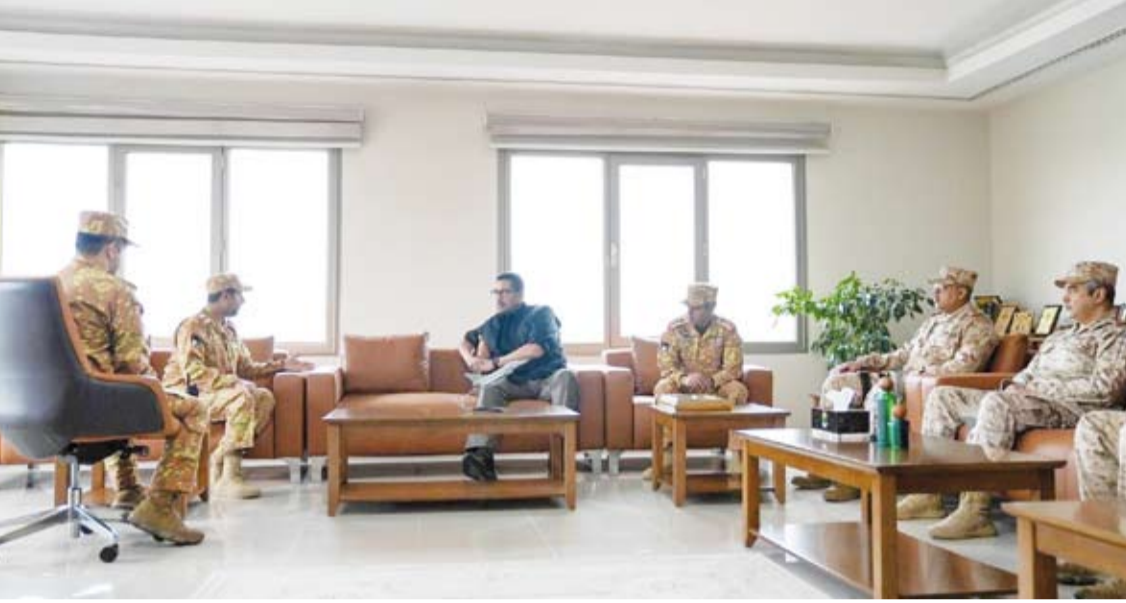
وزير الدفاع يستمع إلى شرح عن مستويات الجاهزية