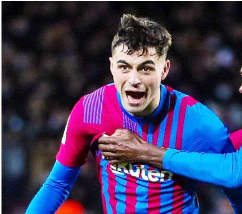
بيدري يحتفل بالهدف الرائع

الدقيقة 72. الفوز رفع رصيد برشلونة إلى 57 نقطة في المركز الثاني، متاخرا بفارق 12 نقطة عن ريال مدريد المتصدر، ومتوقفا بفارق الأهداف فقط عن أتلتيكو مدريد وإشبيلية.