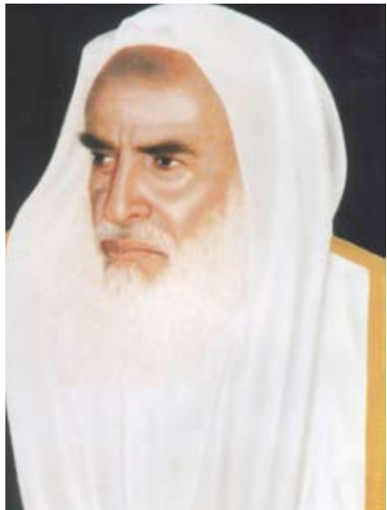
محمد بن صالح العثيمين

وهو بدون عائق عن الصوم أيلزمه القضاء إن تاب؟ -الصحیح أنّ القضاء لا یلزمه إن تاب؛ لأن كل عبادة مؤقتة بوقت إذا تعدد الإنسان تأخيرها عن وقتها بدون عذر، فإن الله لا يقبلها منه، وعلى هذا فلا فائدة من قضائه، ولكن عليه أن يتوب إلى الله عز وجل ويكثر من العمل الصالح، ومن تاب تاب الله عليه.