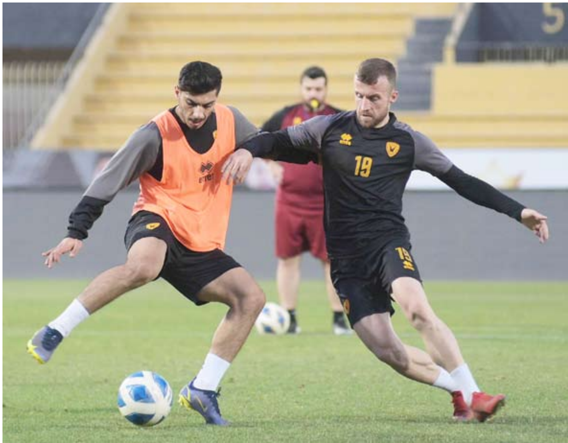
جانب من استعدادات القادسية

بظلاله الإيجابية على الفريق الذي اقترب من خطف إحدى بطاقتي الصعود للدوري الممتاز.