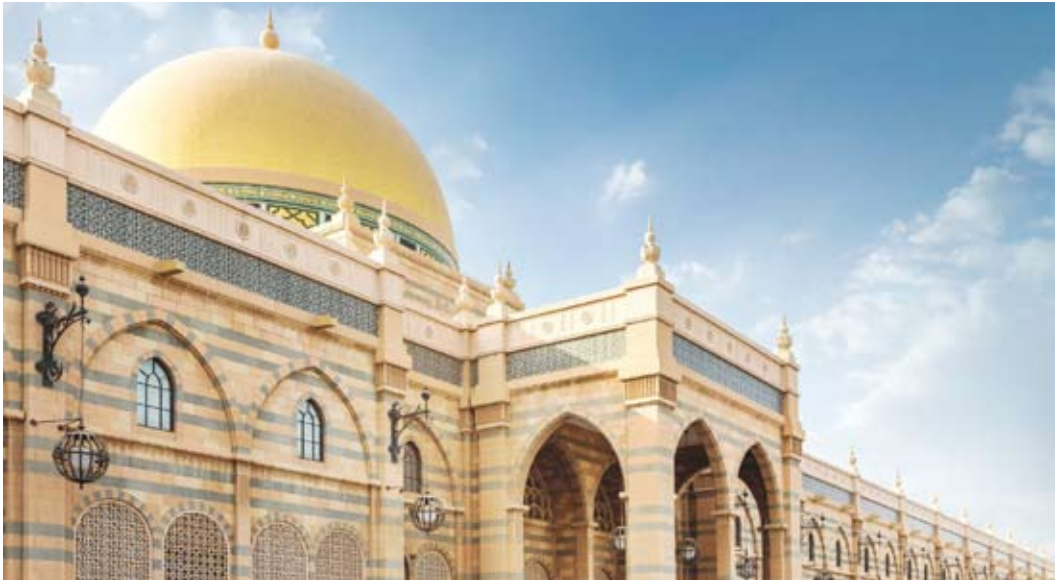
متحف الشارقة للحضارة الإسلامية