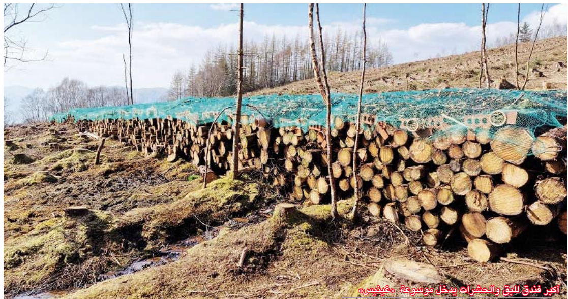
أكبر فندق للحج والحشرات يدخل موسوعة غينيس

وشُيّد فندق الحشرات الذي حطم الرقم القياسي العالمي باستخدام خشب التنوب السيتكي المتساقط في المحمية الطبيعية وطوب البناء وُغُصي الخيزران ورقائق الخشب ولحاء أشجار الغابات وبذور الأَهار البرية والأنايب الطينية والشباك المستخدمة لحماية الفراولة. وقال دوغلاس ويلسون، الرئيس التنفيذي لشركة “هايلاند تايتلز”: “تُحمل هذه المبادرة التي حطمت الرقم القياسي رسالة بيئية مهمة. وعندما اشترينا هذه الأرض عام 2006، كانت مزرة غابات