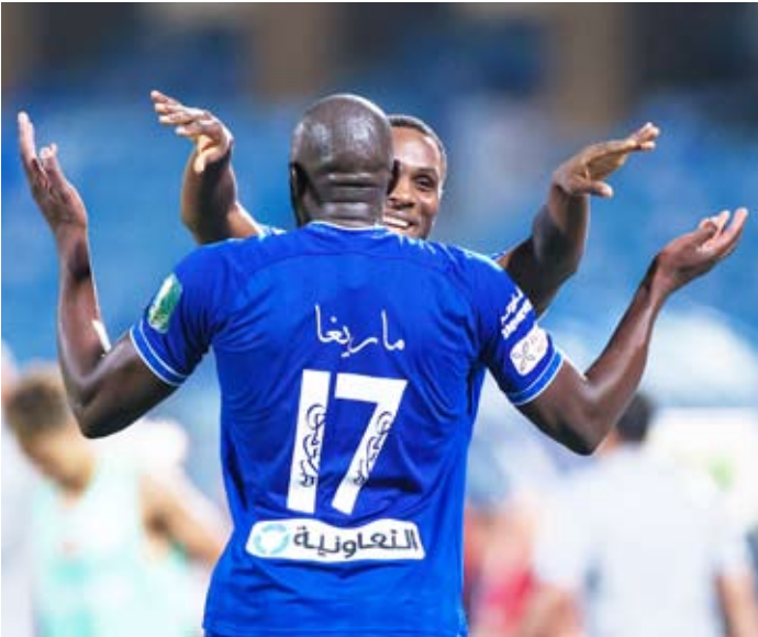
فرحة هلالية مميزة

في كل مناسبة وصل بها إلى النهائي في أعوام 2015 و2017 و2020 أمام النصر، مرتين، والأهلي.