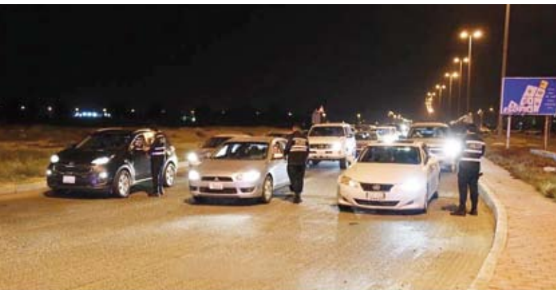
لقطة أرشيفية لحملة تفتيشية

مركبة، و15 دراجة نارية إلى كراج الحجز، وإحالة 52 مخالفاً ارتكبوا مخالفات مرور جسيمة إلى نظارة المرور، وضبط 24 حدثاً يقودون مركبات من دون الحصول على رخص قيادة وإحالتهم الى نيابة الأحداث، وكذلك ضبط 7 مركبات مطلوبة لجهات أمنية وقضائية، وضبط 15 شخصاً مطلوبين لجهات أمنية وقضائية. وقال: إن الإحصائية الأمنية لقطاع المرور والعمليات أظهرت أن إدارة العمليات المرورية احتلت المرتبة الأولى في تسجيل عدد المخالفات، بتسجيلها 6918 مخالفة، تلتها إدارة مرور حولي وسجلت 4552، ومن ثم إدارة مرور محافظة العاصمة بـ4378 مخالفة.