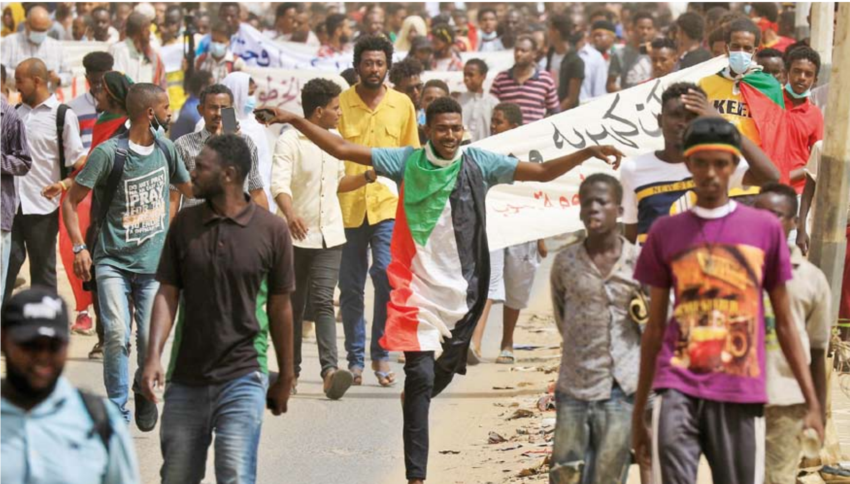
مظاهرات في السودان

شعبيين على انقلابين عسكريين، الأول إطاحتهم بنظام الديكتاتور الراحل جعفر النميري في 6 أبريل 1985، وبدا الاعتصام الذي أسقط نظام الديكتاتور عمر البشير في 11 أبريل، في ذات اليوم. وقالت لجان المقاومة التي تحشد لوكب 6 أبريل في بيان: «شهر الثورة المقدس قد أقبل، متزامناً مع قدوم شهر رمضان المبارك... ونحن في كامل الأمن والعافية، والخلص من الأغلال أياً كان شكلها».