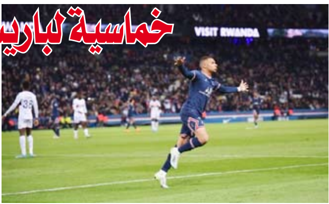
مبابي يحتفل بالهدف

هزم متصدر الدوري الفرنسي في كرة القم (باريس سان جيرمان) ضيفه (لوريان) بخمسة أهداف لهدف في اللقاء الذي جمع بينهما على ملعب (بارك دي برانس) ضمن منافسات الجولة الثلاثين من المسابقة. وأحرز البرازيلي نيمار هدف (سان جيرمان) الأول في الدقيقة الـ12 قبل أن يعزز الفرنسي كيليان مبابي النتيجة بهدف ثان في الدقيقة 28. وفي الشوط الثاني استطاع النيجيري