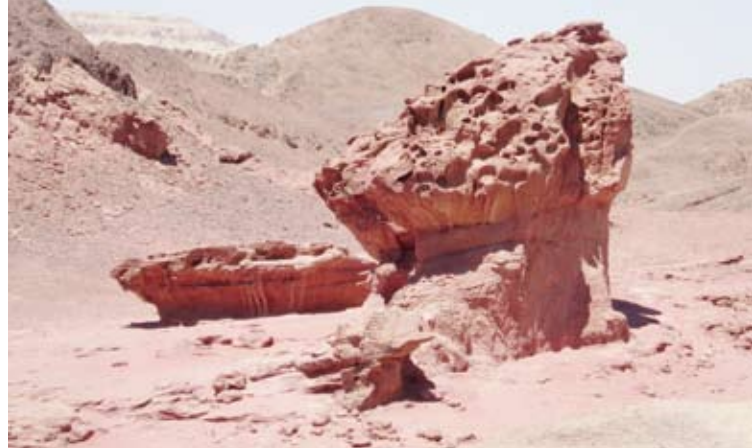
كانت مساكنهم في الجبال