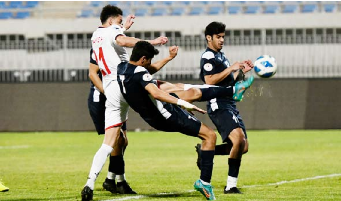
الفحيحيل إلى ربع النهائي

بلغ ناديا الفحيحيل والشباب الدور ربع النهائي من بطولة كأس سمو الأمير لكرة القدم في نسختها الـ60 بعد فوزهما على برقان والتضامن على التوالي. ففي المباراة الأولى التي جرت على استاد عبدالله خليفة الصباح فاز الفحيحيل على برقان بنتيجة 3-1 ليواجه في دور الثمانية نظيره اليرموك. وأما المباراة الثانية تغلب الشباب على التضامن في المباراة أقيمت على استاد نادي الكويت بركلات الترجيح بنتيجة 8-7 بعد تعادلهما في الشوطين الأصلي والإضافي سلباً. وبهذا الفوز سيواجه الشباب الفائز من لقاء الجھراء مع النصر والتي ستقام غد الثلاثاء. ويستكمل الدور التمهيدي منافساته اليوم بقاءً بين بجمع الأول منها القادسية مع كاظمه فيما يجمع الثاني السالمية مع الساحل.