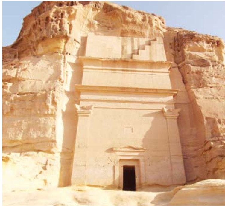
باقيا مدن قوم صالح

أصحاب أوثان يعبدونها من دون الله. ذكر أن صالحا— دعاهم إلى الله بمثل دعوة الرسل، وأمرهم بالتقوى، ونهاهم عن عبادة الأوثان، فأمن معه ثلة قليلة، أما أكثرهم فكذبوه، واستكبروا عن اتباعه،