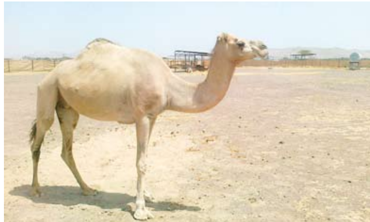
كذبو فعقرو الناقه