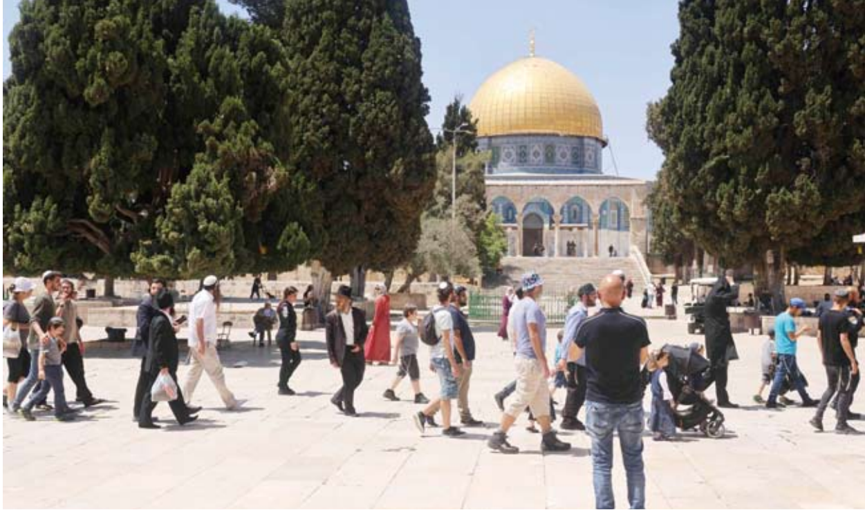
اقتحام المسجد الأقصى

وذكرت «وكالة الأنباء والمعلومات الفلسطينية (وفا)» أن «المستوطنين نفذوا جولات استفزازية وأدوا طقوساً تلمودية في ساحات الأقصى، خاصة في المنطقة الشرقية منه».