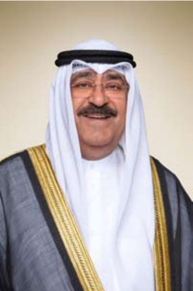
سمو ولي العهد الشيخ مشعل الأحمد

تلقى سمو ولي العهد الشيخ مشعل الأحمد، اتصالاً هاتفياً من أخيه صاحب السمو الملكي الأمير تركي بن محمد وزير الدولة عضو مجلس الوزراء بالمملكة العربية السعودية الشقيقة، عبر خلاله سموه عن خالص تهنائيه وأطيب تمنياته بمناسبة حلول شهر رمضان المبارك، سائلاً المولى عز وجل أن ينعم على سموه بدوام الصحة والعافية وعلى البلدين والشعبين الشقيقين بمزيد من التقدم والازدهار والرخاء وعلى الأمتين العربية والإسلامية قاطبة بالمزيد من الخير واليمن والبركات. وقد شكر سمو ولي العهد الشيخ مشعل الأحمد، أخاه صاحب السمو الملكي الأمير تركي بن محمد وزير الدولة عضو مجلس الوزراء بالمملكة العربية السعودية الشقيقة على هذه المشاعر الأخوية الصادقة، داعياً الله سبحانه وتعالى أن يديم على سموه وافر الصحة والعافية وعلى المملكة العربية السعودية وشعبها الشقيق بدوام التقدم والنماء والرخاء وعلى الأمتين العربية والإسلامية بمزيد من الأمن والأمان.