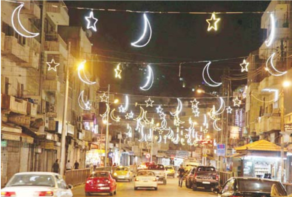
عودة أجواء رمضان