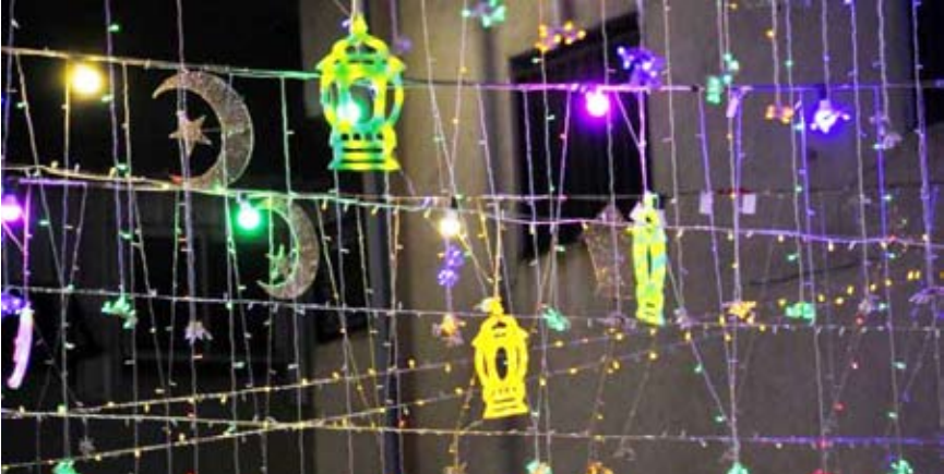
تعليق الفوانيس أحد أبرز مظاهر الاحتفال والفرح بشهر رمضان

الاحتفال بدخول الشهر، حيث يحرص المسلمون على زيادة التقرب إلى الله فيه، وأداء الشعائر الدينية، وعلى إفطار المحتاجين والمساكين، ومد سفر الإفطار والسحور بأغلب المساجد والجوامع.