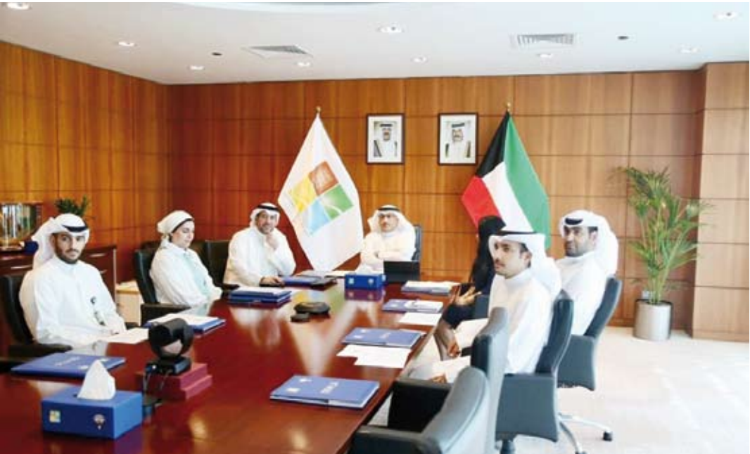
جانب من الاجتماع الـ 24 للوزراء المسؤولين عن شؤون البيئة في دول مجلس التعاون

ناقش الكثير من القضايا البيئية المشتركة بدول المجلس وتوصيات الوكلاء المسؤولين عن شؤون البيئة بشأن الموضوعات المطروحة.