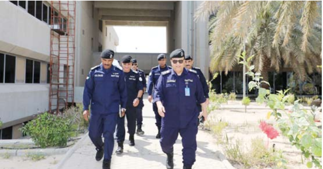
الفريق أنور البرجس خلال الزيارة التفقدية إلى قاعدة صباح الأحمد البحرية

وأطلع بعدها على آلية عمل نظم الشبكات البحرية وكيفية التصدي لمحاولات التهريب والتسسل عن طريق استخدام الزوارق والدوريات الاعتراضية بجانب التوقيف للتفتيش والتدقيق عند الاشتباه بأي محاولة تسلل إلى المياه الإقليمية الكويتية.