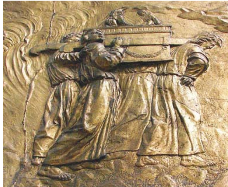
لا احد يعرف اين ذهبت كنوز سيدنا سليمان

ومن مظاهر علم سليمان للغة النمل أنه سمع نملة في وادي النمل تحذر قومها من أن يخطفهم سليمان وجنوده وهم لا يشعرون.. لأن الإنسان لن يهتم بمثل هذه الحشرات، ولكن الله ذكر هذا الموقف الذي يعتبر موقفاً لا قيمة له.. بالنسبة للإنسان العادي فما بالنا بمن له مثل ملك سليمان العريض – ليعطي دليلاً وحكماً شرعياً للقائد للامة أن يهتم بمثل هذه المخلوقات العجموات فما بالنا بالاهتمام ببني آدم، وقد انتبه لها سليمان وسمع صوتها على الرغم من هذا الحشد الهائل من جنوده وضجيج زحفهم، واهتم بها على الرغم من صغرها وضعفها وحقاتها عند كثير من الناس. ثم أنه عجب من ذكاء تلك النملة وهي تحذر قومها من كارثة قد تقع عليهم عند مرور سليمان وجنده على قريتهم وهم لا يشعرون. « فَتَّبَسَّمَ ضَاحِكاً مِنْ قَوْلِهَا » فهو لم يغتر بما أوتي من العلم والقوة، وكثرة الجنود كما يغتر الملوك والكبراء إذا كثرت أتباعهم وأعونهم؛ وإنما تأدب مع الله الذي أعطاه هذا الملك وهذه القدرة على فهم لغة الحيوان،