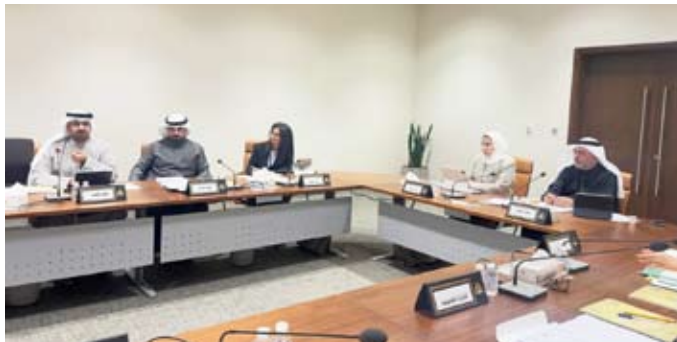
اجتماع سابق للجنة العاصمة

والخدمات التي تحددها البلدية لدعم المشروع بالإضافة إلى خدمات مواقف سيارات ومطاعم وكافيتريات