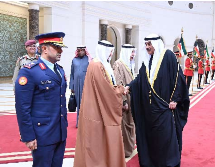
الوزير شريدة المعشري في وداع سمو ولي العهد

لشؤون مجلس الوزراء شريدة عبد الله المعشري. ويرافق سموه وفد رسمي يضم وزير الخارجية عبدالله الجحيا وكبار المسؤولين بديوان سمو ولي العهد.