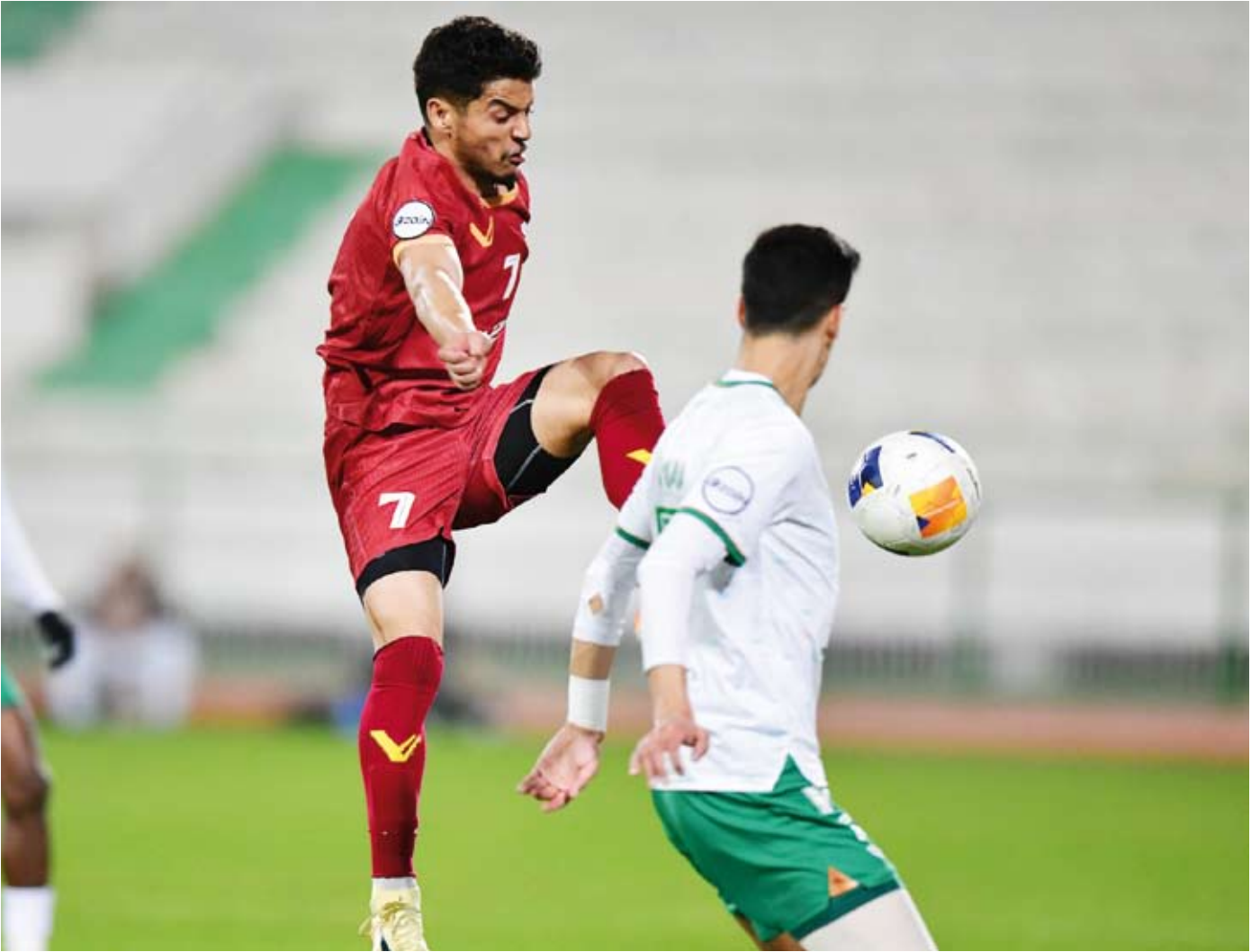
الأخضر استعد للسيب بفوز مهم على النصر في الدوري المحلي

يواجه فريق العربي اختباراً صعباً عندما يستضيف السيب العماني في ذهاب الدور ربع النهائي لبطولة كأس التحدي الآسيوي. ويدخل الأخضر مباراة الليلة بمعنويات مرتفعة بعد فوزه على النصر 2-1 في الجولة السابعة عشرة من الدوري الممتاز ومشاركته الصدارة