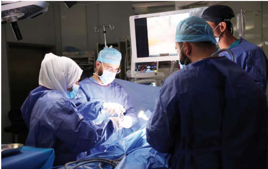
جانب من العمل الجراحي