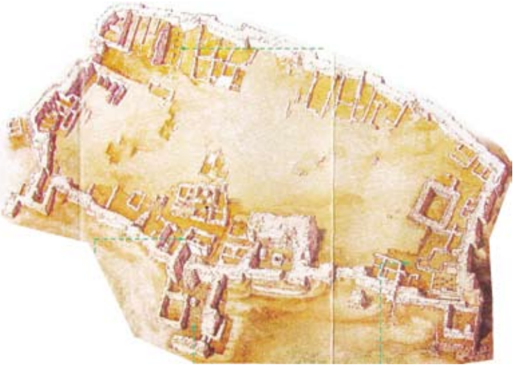
بقايا قصر ملك سبأ حسب بعض الرويات