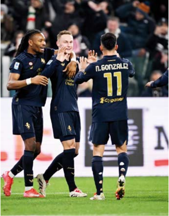
لاعبي اليوفي يحتفلون بالتسجيل

عاد يوفنتوس إلى المربع الذهبي للدوري الإيطالي لكرة القدم بفوزه على ضيفه فيرونا 2-صفر بالمرحلة السابعة والعشرين. وتقدم لاعب الوسط الفرنسي كيفريرن تورام بهدف ليوفنتوس في الدقيقة 72 بتسديدة قوية بقدمه اليسرى بعد تلقيه تمريرة من أندريا كامبياسو. وفي الخواني الأخيرة للمباراة أضاف الهولندي نيون كوبميرنس