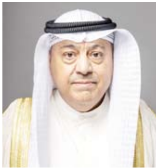
وزير النفط طارق الرومي

نهج استباقي مسؤول يهدف إلى ضمان استقرار السوق النفطية العالمية لافتاً إلى أن هذا القرار يأتي في إطار الجهود المستمرة والمبادرات التي تبذلها (أوبك+) لتحقيق توازن مستدام في السوق بما يضمن حماية مصالح كل من المنتجين والمستهلكين. يذكر أن الحصصة المقررة لدولة الكويت هي 2.413 مليون برميل يومياً ترتفع بداية من شهر أبريل إلى 2.421 مليون برميل يومياً ثم ترتفع تدريجياً لتصل إلى 2.548 مليون برميل يومياً بحلول شهر سبتمبر 2026.