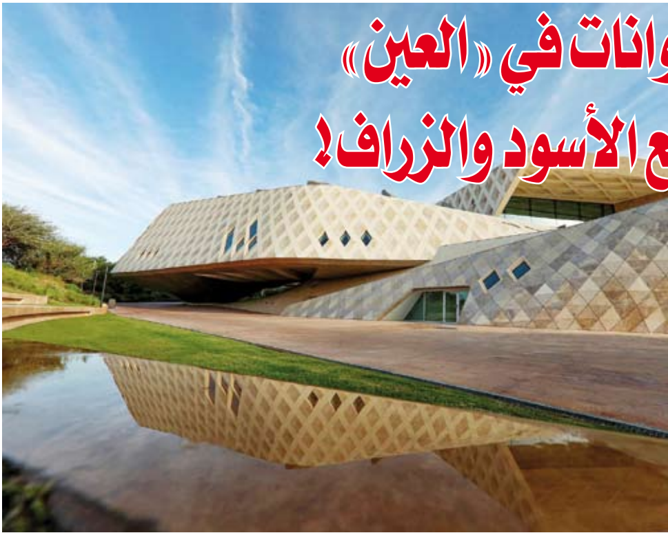
حديقة الحيوانات في «العين»

حرام المزور والمزودج .. ومن خذها من غير حق .. ياخذ قطعة ارض من بلاد ي @Alwasatkuwait