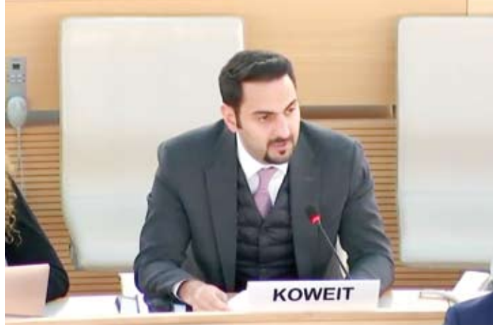
المستشار ناصر الرامزي

على حدود الرابع من يونيو عام 1967 وفقاً للقرارات الدولية ومبادرة السلام العربية.