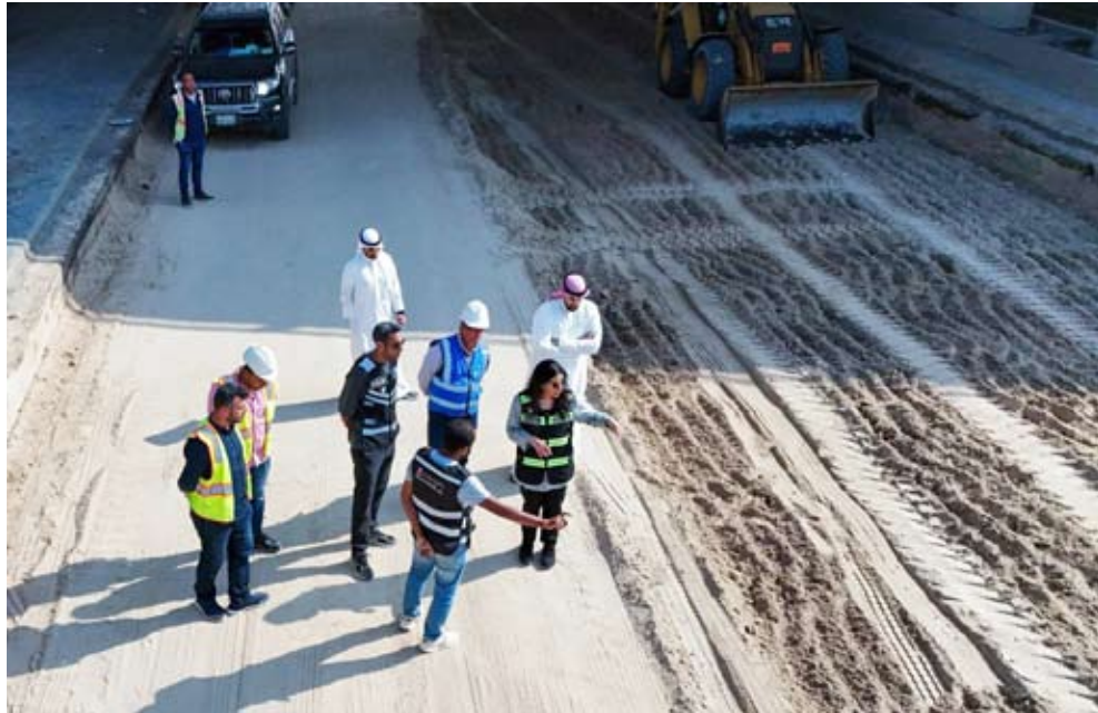
المشعان في موقع المشروع