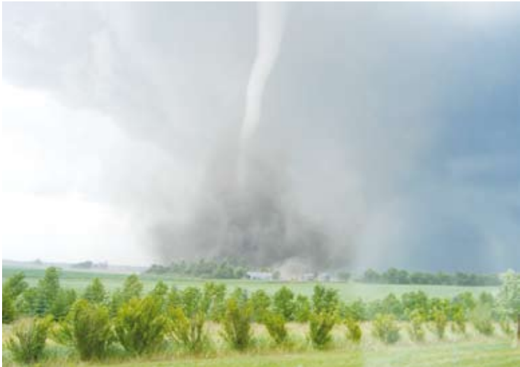
سخر الله الريح لسليمان سليمان

ثم نرى هنا مشهداً لسليمان لا يمكن أن نصفه إلا بالعبودية الخالصة والاعتراف بفضلته عليه وشكره على ما وهبه تعالى، عندما رأى عرش الملكة بلقيس مستقراً أمامه في طريقة عين. « قَالَ هَذَا مِنْ فَضْلِ رَبِّي لِيَبْلُوَنِي أَأَشْكُرُ أَمْ أَكْفُرُ وَمَنْ شَكَرَ فَإِنَّمَا يَمُزَّكُ لِنَفْسِهِ وَمَنْ أَكْفَرَ فَإِنَّ رَيْبِي غَنِي كَرِيمٌ (40). ( و طريقة العين: هي حركة جفن العين بين إغلاق وفتح للعين في جزء قصير جداً من الثانية).