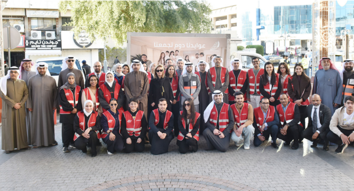
مسؤلو البنك مع فريق سواعد توسطهم العيسى

لجهود بنك الكويتي للطعام والإغاثة في توفير الوجبات وتوزيعها على مستحقها، بالتعاون معهم في مختلف الشروعات الخيرية التي تحقق الاستدامة المجتمعية.»