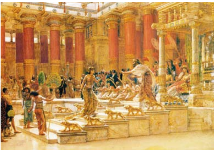
نظام ملكة سبأ كان قوي

عليها فيما هو الجسد، ويهنا هنا أن سليمان بعد أن فتنه الله واختبره تاب إليه مستغفراً. والروايات التي ذكرت في العديد من التفسير عن خاتم سليمان والشياطين المتمرد الذي سرق الخاتم والذي تمثل في صورة سليمان وغيرها من الحكايات، وإن رويت عن ابن عباس يبدو من السياق فيها