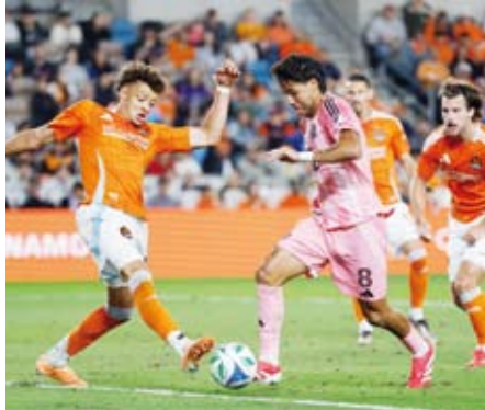
ميامي يحقق انتصاره الأول بدون ميسي

وكان ميلان تلقى خسارته الثامنة في الدوري أمام لاتسيو ، ويلتقي مع ليتشي في الجولة الثامنة والعشرين ، ويحتل المركز التاسع برصيد 41 نقطة مع نهاية الجولة الـ 27 من المسابقة.