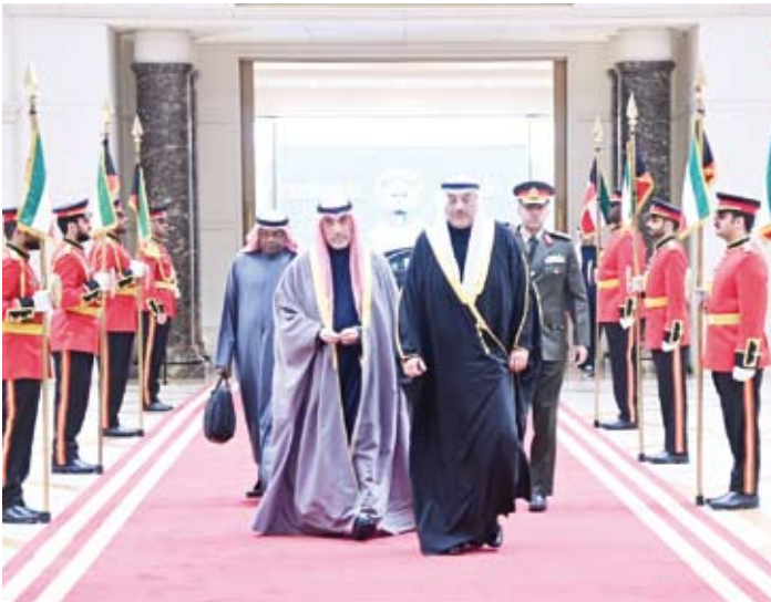
سمو ولي العهد لدى مغادرته إلى القاهرة

الداخلية الشيخ فهد اليوسف ورئيس الحرس الوطني الشيخ مبارك حمود الجابر الصباح ووزير شؤون الديوان الأميري الشيخ محمد عبدالله ونائب رئيس مجلس الوزراء ووزير الدولة