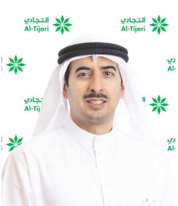
الشيخ أحمد الصباح

وأختتم الشيخ أحمد دعيج الصباح حديثه رافعاً أسمى آيات الشكر والامتنان لمقام حضرة صاحب السمو أمير البلاد المفدى الشيخ مشعل الأحمد الجابر الصباح وسمو ولي عهده الأمين الشيخ صباح خالد الحمد الصباح، موجهاً الشكر لبنك الكويت المركزي والجهات الرقابية الأخرى بدولة الكويت على دعم وتوجيهه ومساندة القطاع المصرفي، ومن مساهمي البنك وكذلك الإدارة التنفيذية وجميع الموظفين على تقانيهم في العمل ليزل التجاري دوماً الاختيار المفضل للعملاء.