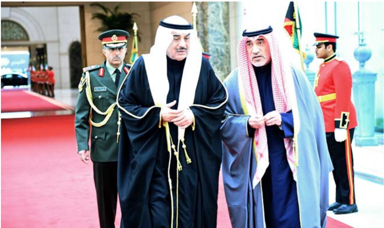
سمو ولي العهد خلال مغادرته أمس إلى القاهرة

والخطة المؤلفة من 112 صفحة تتضمن خرائط توضح كيفية إعادة تطوير أراضي غزة وميناء تجاريا ومركزا للتكنولوجيا وفنادق على الشاطئ. المرحلة الأولى من الخطة المصرية لإعادة إعمار غزة ستستغرق نحو عامين وستكلف 20 مليار دولار، في حين أن المرحلة الثانية تستغرق عامين ونصف وستكلف 30 مليار دولار... الكلام جميل المهم التنفيذ..