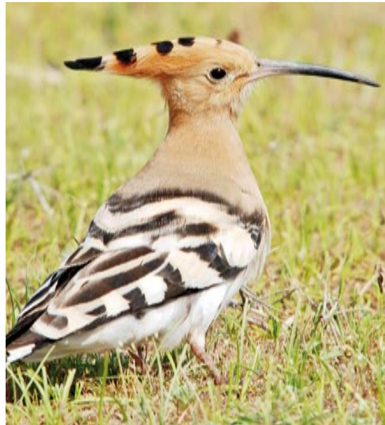
علمه الله لغة الطير

هذا الرد شديد اللهجة سينهي الأمر مع ملكة لا تريد العداء كما يبدو من طريقتها في مقابلة رسالته القوية بهدية!! ويُرِجَّح سليمان أنها ستستجيب لدعوته، متيقناً من استجابتها بالفراسة، وأنها من المؤكّد أنها ستحضر إليه كما خاطبها، وأتّوْنِي مُسْلِمِينَ!.. نفهم ذلك من خلال حوارٍ مع حاشيته وجنوده حول استحضر عرشها قبل وصولها، الذي خلفته في بلادها محروساً مصوناً. (الآية: 38).