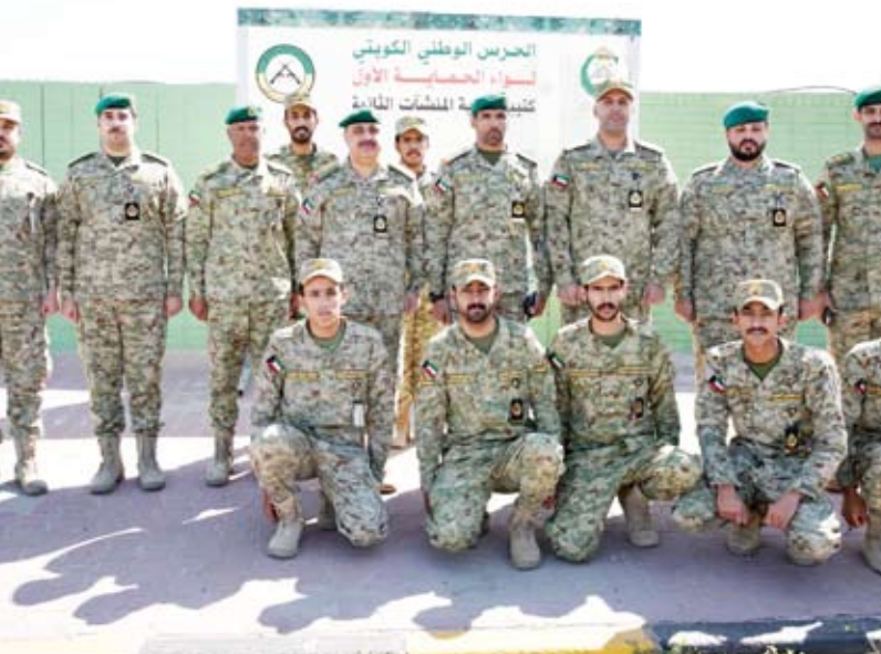
الفريق هاشم الرفاعي في لقطة جماعية مع المنتسبين

بمناسبة حلول شهر رمضان المبارك، وأعرب وكيل الحرس الوطني عن اعتزاز وتقدير قيادة الحرس الوطني بالدور الذي يؤديه في تأمين المواقع الحيوية، مشدداً على البقطة الأمنية وتوخي الحيطة والحذر والالتزام بالتعليمات والواجبات الأمنية المكلفين بها للحفاظ على أمن واستقرار البلاد.