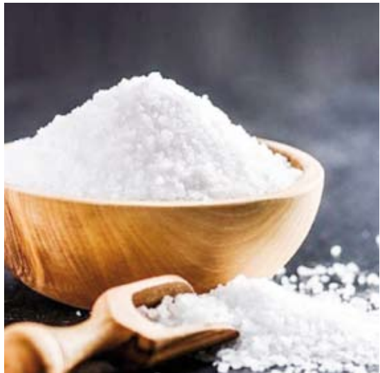
الملح يزيد خطر الإصابة بسرطان المعدة

أظهرت دراسة أجراها باحثون إيطاليون وبرازيليون أن الإفراط في تناول الملح يزيد من خطر الإصابة بسرطان المعدة، حتى بين الأشخاص الذين يتبعون نظاماً غذائياً صحياً.