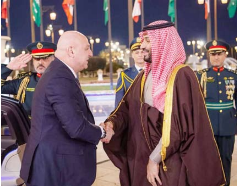
ولي العهد السعودي مستقبلا الرئيس اللبناني أمس

وقدما شدد البيان على ضرورة انسحاب جيش الاحتلال الإسرائيلي من الأراضي اللبنانية، اكدا اهمية البدء في الإصلاحات المطلوبة دوليا وفق مبادئ الشفافية وتطبيق القوانين، كما تم الاتفاق على ضرورة تعافي الاقتصاد اللبناني وتجاوزته لأزمته الحالية.