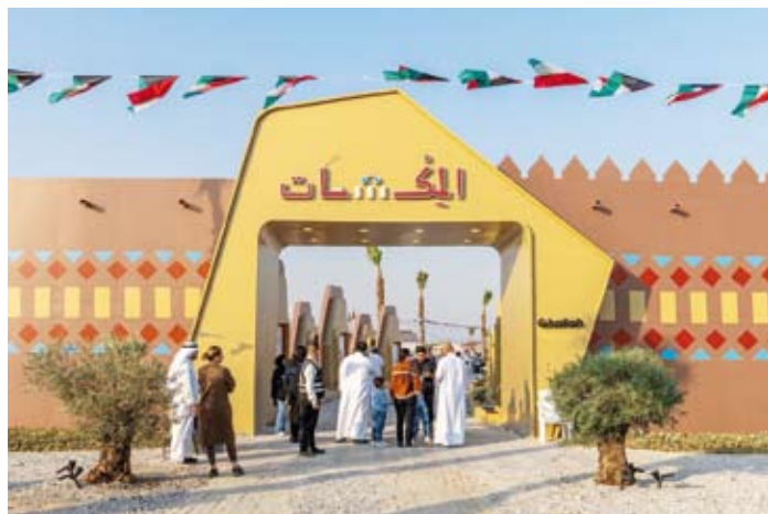
مشروع المكشات 3

وأشار إلى أن المشروع ساهم في تعزيز الاقتصاد الوطني عبر تحقيق الانفاق المحلي وتنشيط القطاعات المرتبطة بالسياحة والترفيه ما أدى إلى زيادة مبيعات المطاعم والمقاهي والمتاجر وخلق العديد من فرص العمل المباشرة وغير المباشرة للشباب الكويتي ورواد الأعمال وأصحاب المشاريع الصغيرة والمتوسطة. وبين أن النسخة الثالثة للمشروع