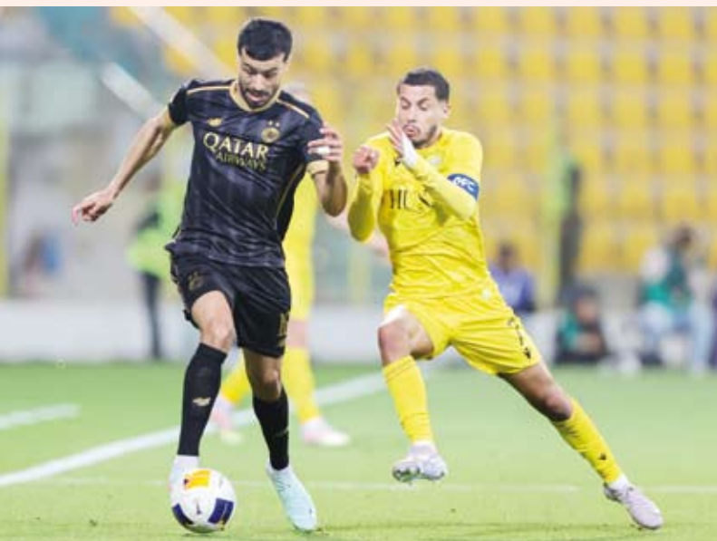
التعادل الإيجابي يحسم مباراة الذهاب

فريق السد. وكان السد قد احتل المركز الرابع في ترتيب مرحلة الدوري، فيما احتل الوصل المركز الخامس. وأقيمت مرحلة الدوري بمشاركة 12 فريقاً في منطقة الغرب، حيث تأهل أصحاب المراكز الثمانية الأوائل في الترتيب إلى دور الستة عشر.