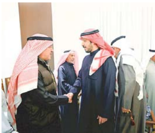
الخنين مستقبلا ضيوفه