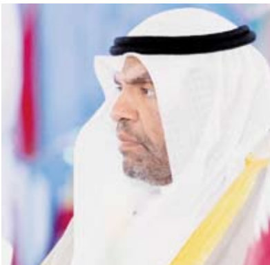
وزير الخارجية عبدالله الجحيا

ترأس وزير الخارجية عبدالله الجحيا، أول أمس، وفد دولة الكويت المشارك في الاجتماع الوزاري التحضيري لمجلس جامعة الدول العربية على مستوى القمة في دورته غير العادية وذلك في مقر جامعة الدول بالقاهرة. وتناول الاجتماع مناقشة البنود المدرجة على جدول أعمال القمة العربية المقرر عقدها الثلاثاء والمتعلقة ببحث آخر مستجدات القضية الفلسطينية واتخاذ موقف عربي موحد اتجاه دعم حقوق الشعب الفلسطيني وتمسك بالبقاء على أرضه إلى جانب مجمل ما تشهده المنطقة من تطورات تمهيدا لرفعها إلى أصحاب الجلالة والسمو والفخامة القادة.