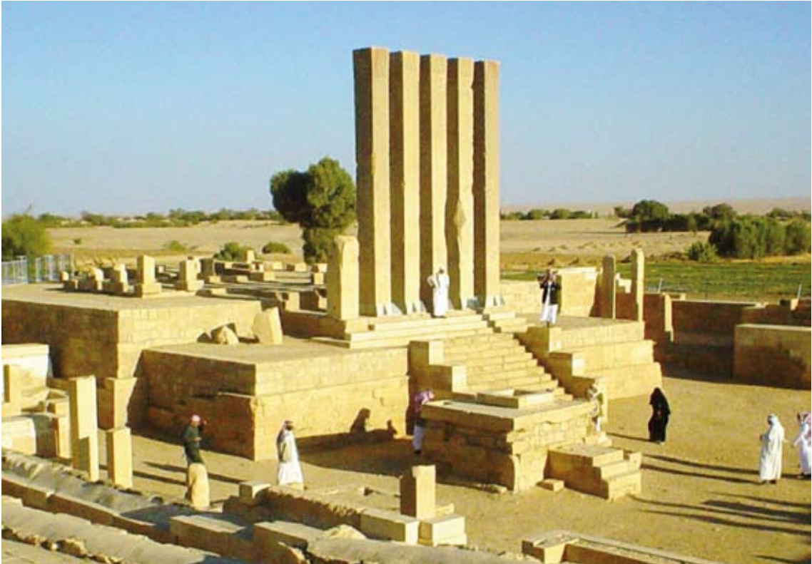
معبد بران أو «عرش بلقيس»

أنها من الإسرائيليات. قال ابن كثير في تفسيره: (والظاهر أنه إنما تلقاه ابن عباس رضي الله عنهما في صح عنه من أهل الكتاب وفيهم طائفة لا يعتقدون نبوة سليمان عليه الصلاة والسلام. فالظاهر أنهم يكذبون عليه ولهذا كان في السياق منكرات) (تفسير ابن كثير 4/ 45).