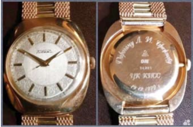
ساعة اليد الذهبية لبريجنيف

وحسب البائع فإنه قرر بيع ساعة اليد لأنه يواجه نقصاً في الأموال، بينما رفض عرض استبدال ساعة اليد بشقة في موسكو، وقال إنه يتوقع عقد صفقة أكثر ربحية. وسبق أن تم عرض سيارة “مرسيدس” التابعة لبريجنيف للبيع بالمزاد، مما يدل على استمرار الاهتمام التحف اهتمام الجامعين سواء من روسيا أو من خارجها