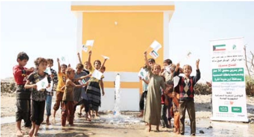
مشروع توفير المياه في اليمن

في إطار جهودها الإنسانية والتنموية الرامية إلى تحسين جودة الحياة وتعزيز الاستقرار والكرامة الإنسانية، نفذت الهيئة الخيرية الإسلامية العالمية مشروعين نوعيين، الأول لترميم منازل 15 أسرة فلسطينية في القدس، والثاني لتوفير المياه الصالحة للشرب لـ 30.000 مستفيد في اليمن، بإجمالي تكلفة تجاوزت 440 ألف دولار. ففي القدس، مولت الهيئة الخيرية مشروع «ماوى» لترميم وتحسين بيئة السكن لـ 15 أسرة فلسطينية فقيرة، بتكلفة بلغت 320.045 دولاراً، وذلك في إطار التزامها بتعزيز الاستقرار الاجتماعي وتحقيق حياة كريمة للأسر المقدسية.