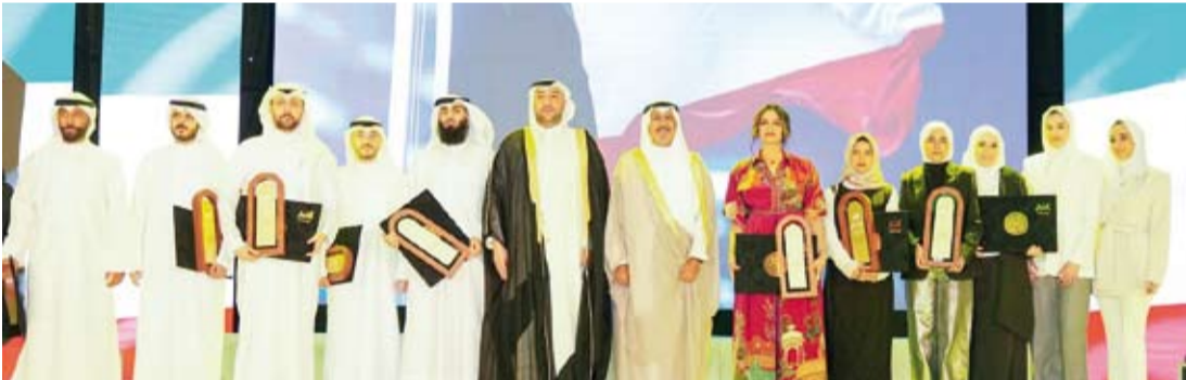
سمو الشيخ الدكتور محمد الصباح متوسلا الفائزين بجائزة الكويت للتميز والإبداع

كلمة له بإيمان الشباب الكويتي بأهمية المشاركة الحقيقية في صياغة وبناء «كويت المستقبل» من خلال الاستئثار المكثف في رأس المال البشري الإبداعي.