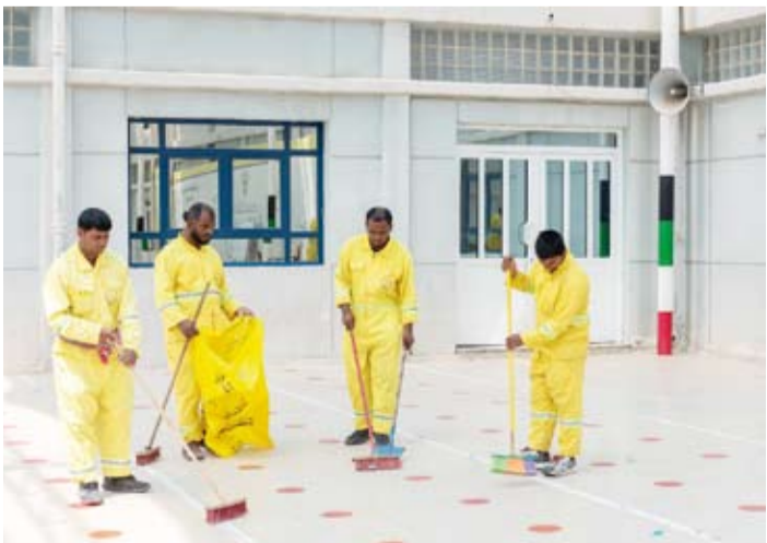
تنظيف المدارس وتجهيزها لانتخابات امة 2024

وبيّن أن دور البلدية لن ينتهي إلا في تنظيف مقرات الاقتراع والمدارس والهيئات المختلفة لإنجاح هذا العرس الديمقراطي وإظهار الكويت بأبهى صورة.