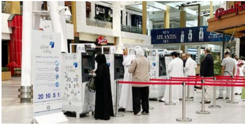
أجهزة سحب آلي

الماضية، حيث يحرص الأفنيوز دائماً على توفير هذه الخدمة للزوار مباشرة بهدف مشاركتهم فرحة العيد، وتسهيل وسرعة الحصول على العيادي، كما تساعد على الاستجابة لزيادة الطلب المتوقع على أوراق النقد الجديدة، لاسيما الفئات الصغرى التي لا تتوافر عادة في أجهزة السحب الآلي الأخرى لتوزيعها بمناسبة العيد. وإذ تهنيئ إدارة الأفنيوز كافة الزوار بمناسبة عيد الفطر السعيد، وتدعو الله أن يعيدها على الكويت وعلى الأمتين العربية والإسلامية والخير واليمن والبركات. كل عام وأنتم بخير.