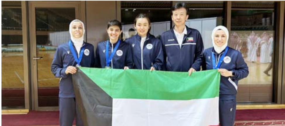
لاعبات نادي الفتاة بالمدالية الفضية

حقق نادي (الفتاة) الكويتي المركز الثاني لفئة السيدات في بطولة أندية غرب آسيا لكرة الطاولة المقامة بجدة بعد خسارته في النهائي أمام (عالي) البحريني بثلاثة أشواط لشوطين. وفي نهائي فئة الرجال حقق (البحرين) البحريني اللقب بعد فوزه على (الإتحاد) السعودي بنفس النتيجة. وأقيمت مواجهات تحديد المراكز لفئتي الرجال والسيدات حيث حل نادي (التضامن) سادساً و (الفحيحيل) سابعا في فئة الرجال ونادي (سليوى الصباح) سابعا بفئة السيدات.