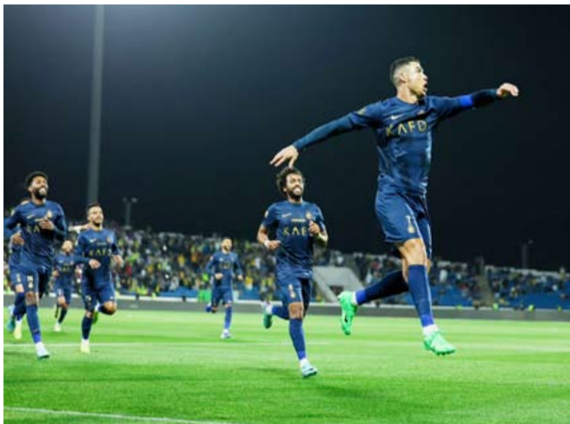
رونالدو يواصل التالق مع النصر