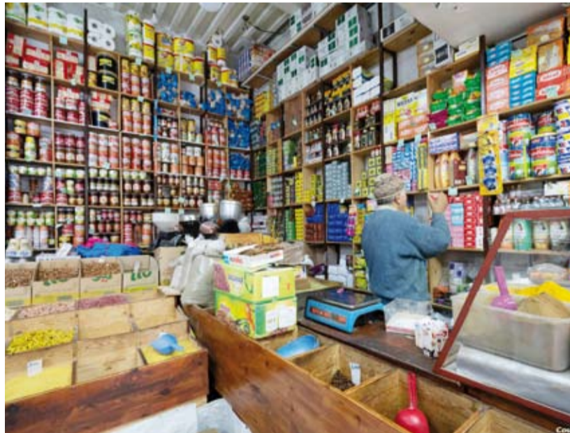
مبادرة لتسديد الديون في شهر الخير

ريميشل "الأناضول": إن المغاربة معروفون بتاريخيا بروح التضامن، مضيفة أن ذلك يتجلى في عدد من المحطات. وتعتبر أن تضامن المغاربة تجسد في زلزال الحوز، بالإضافة إلى سلة رمضان الغذائية، وتسديد ديون المحتاجين لدى المتاجر أو الصيدليات. وتجدر الإشارة إلى أن مبادرة تسديد ديون الأسر الفقيرة في دفاتر محلات البقالة ولدى الباعة، تقليد عثماني قديم يعرف باسم "دفتر الذم". ويقوم المتطوعون من خلال المبادرة بمساعدة الفقراء والمحتاجين مع مراعاة الخصوصية حتى لا يشعر من يتلقون المساعدة بأي إحراج. ويجرح المتطوعون على اتباع نفس الطريقة التي كانت إبان عهد الدولة العثمانية، إذ كان يذهب الأغنياء إلى محلات البقالة ويشترون دفتر الديون به، وبالتالي يكونوا قد سدوا كل الديون المتركمة على غير القادرين دون أن يروهم حتى لا يشعروا بأي إحراج.