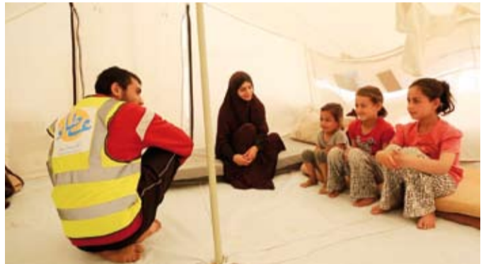
تقديم الدعم المعنوي لأطفال « غزة »