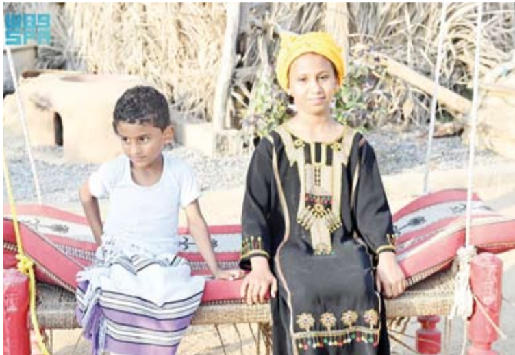
الفرحة على وجوه الأطفال