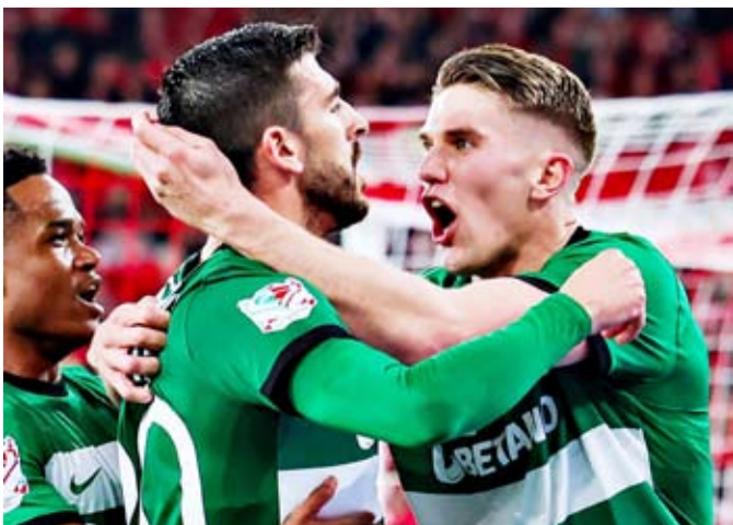
فرحة التأهل للنهائي

تأهل فريق سبورتينج لشبونة إلى الدور النهائي من بطولة كأس البرتغالي لكرة القدم، بعد تعادله مع مضيفه بنفيكا (2-2) على ملعب "النور" في العاصمة لشبونة في إياب الدور نصف النهائي. وسجل مورتن هجولاند وباولينهو في الدقيقتين (47، 55) هدفين سبورتينج لشبونة، ونيكولاس أوتامبندي ورافا سيلفا في الدقيقتين (53، 64) هدفين بنفيكا. وتفوق سبورتينج لشبونة على بنفيكا بنتيجة (4-3) في مجموع مباريات الذهاب والإياب، بعدما فاز ذهاباً (2-1) في المباراة التي أقيمت على ملعب "خوسيه الفالادي" في لشبونة.