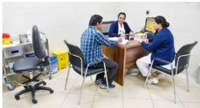
إحدى عيادات سحب الدم