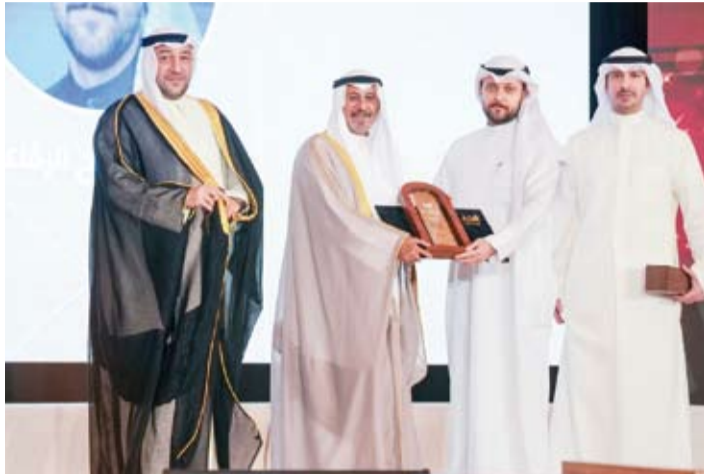
.. وسموه خلال تكريم الفائزين