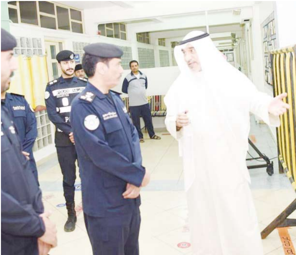
الشيخ فهد اليوسف يتفقد عددا من لجان الاقتراع

آلاف الناخبين والناخبات يتوجهون ظهر اليوم الى مراكز الاقتراع في الدوائر الخمس لاختيار ممثلهم .. ندعو الله أن يلهم الشعب ويهديه إلى حسن اختيار نوابه .. والله موفق