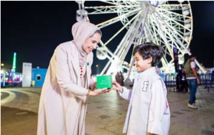
توزيع القرقيعان في وندروندلاند

كما أقام «بيتك» حفلاً آخر في (KFH Zone) في (Winter Wonderland) الترفيهية خلال أيام القرقيعان. بالإضافة