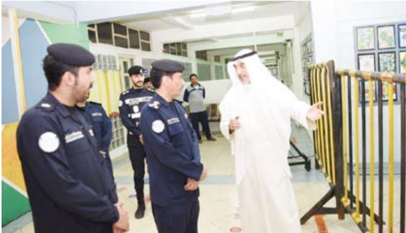
الشيخ فهد اليوسف خلال جولته التفقدية

تفقد نائب رئيس مجلس الوزراء ووزير الدفاع ووزير الداخلية بالوكالة، الشيخ فهد اليوسف، أول أمس، عدداً من لجان الاقتراع لانتخابات مجلس الأمة 2024 المقرر عقدها في الرابع من أبريل الجاري.