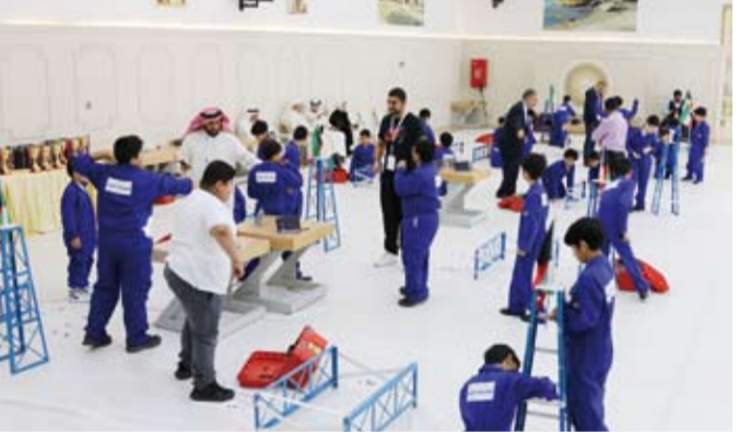
جانب من المسابقة