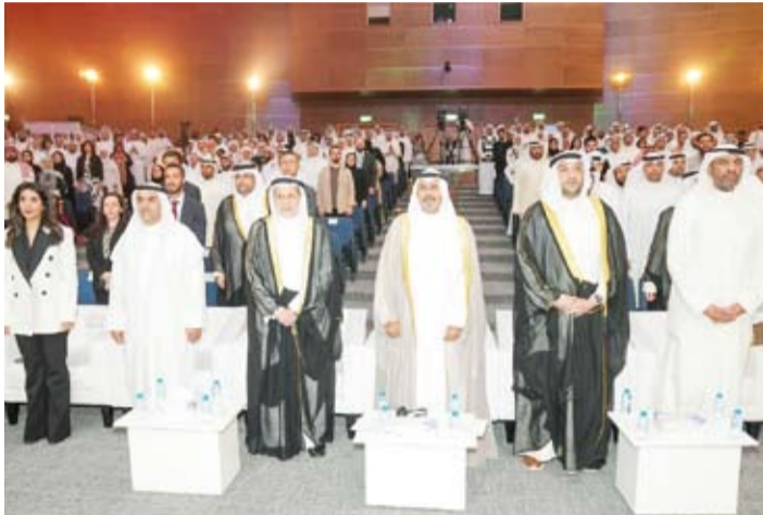
سمو رئيس مجلس الوزراء يتقدم الحضور الرسمي