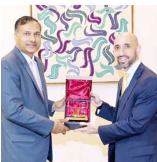
السفير الهندي خلال زيارته معهد دسمان للسكري

الجدير بالذكر أن معهد دسمان للسكري هو أحد المراكز التابعة لمؤسسة الكويت للتقدم العلمي وهو يعنى بالمقام الأول بالأبحاث المتقدمة