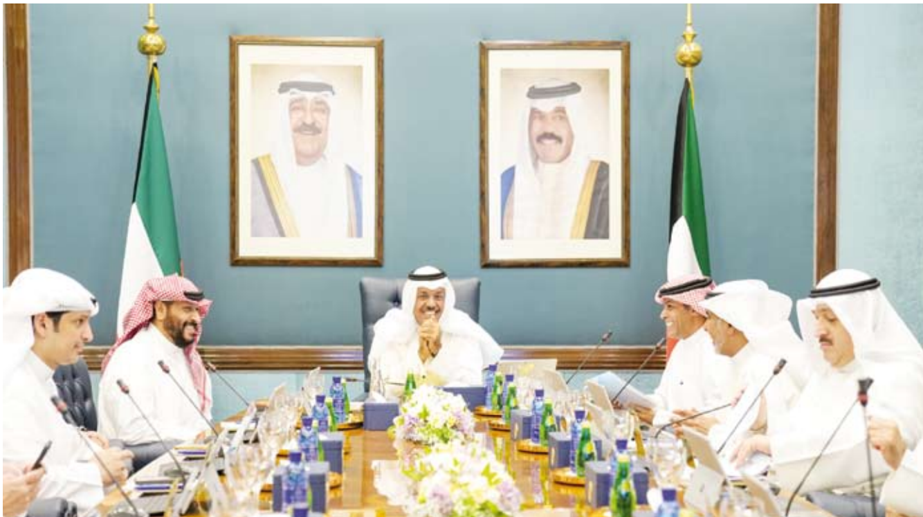
جانب من اجتماع مجلس الوزراء امس

البرلمان ووفق دستور 62 انحرف عن دوره الحقيقي في التشريع والرقابة إلى طريق معبدة للقاء غير المشروع، فاسماء النواب الذين اتروا من خلال وقوفهم مع الحكومة وتغطية تجاوزاتها معروفة، الكويت اليوم مختلفة عن وقت صدور الدستور، فهل نحتاج إلى ستة عقود حتى نصل إلى الديمقراطية المعمول بها في أغلب دول العالم الحر، إذا لم يتم التنسيق الجماعي لانتخاب برلمان إصلاحي، فنحن السبيل وراء دمار البلد.. «شفوا الله يرحم واليكم».