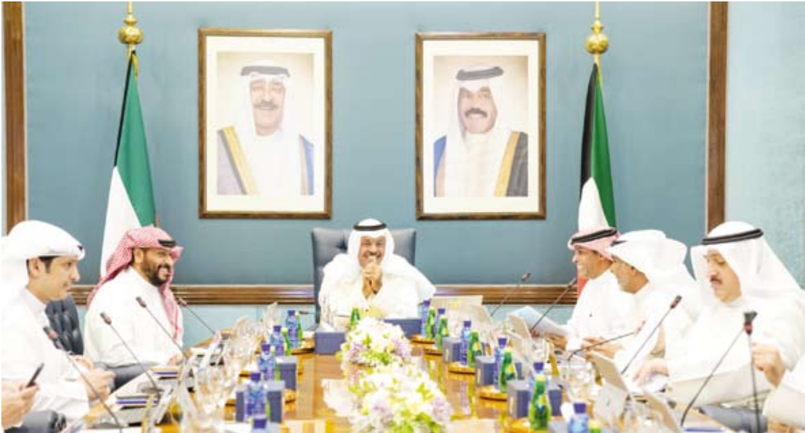
سمو الشيخ أحمد النواف يترأس اجتماع مجلس الوزراء

ورفع إلى سمو ولي العهد. كما قرر مجلس الوزراء الموافقة على تعطيل العمل في جميع الوزارات والجهات الحكومية والهيئات والمؤسسات العامة يوم الثلاثاء الموافق 6/ 6/ 2023 مع اعتباره يوم راحة أما الأجهزة ذات طبيعة العمل الخاصة فتحدد عملتها بمعرفة الجهات المختصة بشؤونها لمراعاة المصلحة العامة. وسعيًا لاستكمال كافة الترتيبات والاستعدادات اللازمة لتنظيم عملية