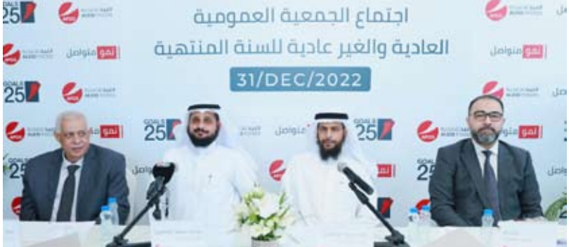
جانب من العمومية

والموافقة على استقطاع نسبة 10 بالمئة من الأرباح لحساب الاحتياطي الاختياري بمبلغ 262 ألف و 722 ديناراً وذلك لدعم المركز المالي للشركة فضلاً عن الموافقة على تحويل مبلغ 553 ألفاً و 907 من الاحتياطي الاختياري الى حساب أرباح محقق بها.