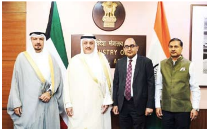
مساعد وزير الخارجية لشؤون آسيا مع مسؤولين في الخارجية الهندية