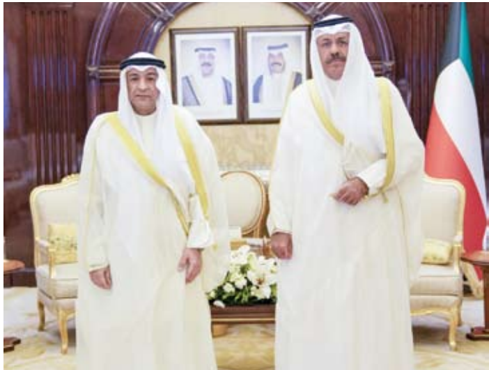
سمو رئيس مجلس الوزراء خلال استقبله الأمين العام لمجلس التعاون الخليجي

من جهة أخرى، بعث سمو الشيخ أحمد النواف رئيس مجلس الوزراء، ببرقية تهنئة إلى الرئيس أندريه دودا رئيس جمهورية بولندا الصديقة بمناسبة العيد الوطني لبلاده.