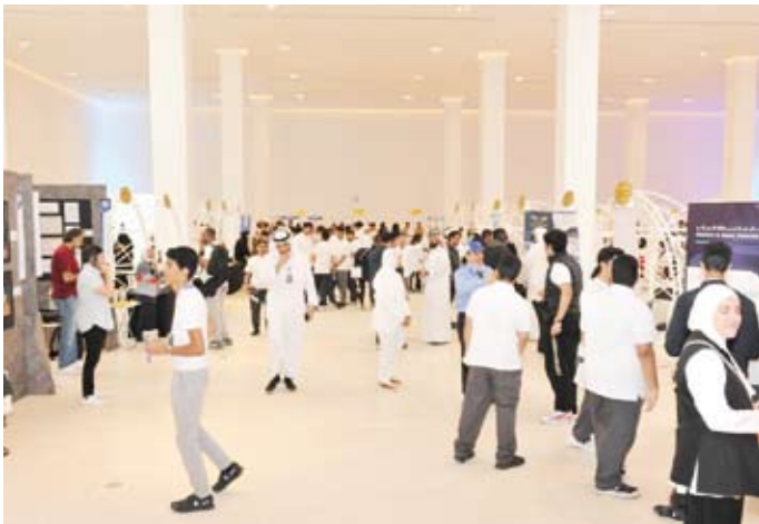
إقبال كبير في المعرض

القبول والتسجيل قامت بالإجابة عن استفسارات الطلبة المتعلقة بشروط القبول في الكليات وطريقة التقديم، وامتحانات القدرات وغيرها، مشيراً إلى أن العمادة لها دور تنويعي في تعريف الطلبة بكيفية التقديم على جامعة الكويت والتخصصات الأكثر طلباً بالإضافة إلى امتحانات القدرات الأكاديمية. وعلى هامش المعرض تم تنظيم جولات ميدانية للطلبة الزوار، تضمنت جميع كليات جامعة الكويت، حيث قامت كل مدرسة بزيارة كليتين على الأقل. وفي بداية كل جولة تم تقديم النصائح والتوجيهات والإرشادات للطلبة وعرض خريطة لتوضيح الأماكن التي تستقبلها الجولة والمدة الزمنية لها، وذلك من قبل قسم العلاقات العامة والاتحاد الوطني لطلبة الكويت. وكان في استقبال الزائرين أعضاء الهيئة التدريسية والإداريون لتقديم شرح مبسط عن الكليات والتخصصات والإجابة عن جميع أسئلة الطلبة، كما تم زيارة القاعات الدراسية والمكتبة المسرح في كل كلية. واختتمت الجولة في المركز الثقافي بمدينة صباح السالم الجامعية لزيارة المعرض الذي تشارك فيه مختلف مؤسسات التعليم العالي الحكومي والخاص.