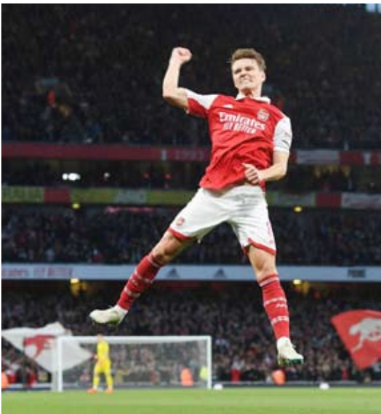
فرحة كبيرة بالعودة للنقطة

وأضاف اللاعب النرويجي لشبكة سكاي سبورتنس «استخدمنا غضبنا وخيبة أملنا للعودة في هذه المباراة. الخسارة واردة لكننا لم نلعب بأسلوبنا المعتاد وهذا ما تسبب في شعورنا بالآلم، وأردنا إظهار الجانب الآخر اليوم وفعلنا ذلك». وخسر تشيلسي للمرة السادسة في ست مباريات بجميع المسابقات مع المدرب المؤقت فرانك لامبارد الذي حل بدلا من جراهام پوتر الشهر الماضي، في استمرار للنتائج المخيبة للفريق المتوج بدوري أبطال أوروبا قبل عامين.