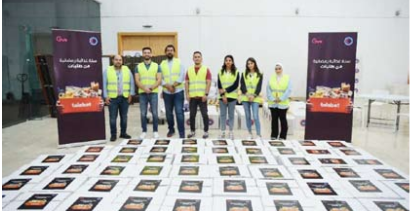
إحدى فعالياتيها في رمضان

وشمل البرنامج العديد من المشاريع الخيرية والمجتمعية التي انطلقت بتوقيع اتفاقية الأعمال الخيرية مع منصة “GIVE” بالتعاون مع جمعية الهلال الأحمر الكويتي و تم إعالة أكثر من 350 أسرة محتاجة بالمواد الغذائية الأساسية للشهر الفضل. وكذلك قامت طليات بتوزيع أكثر من 300 ألف حزمة مواد غذائية مع شركائها الاستراتيجيين، حيث سعت طليات إلى دعم أفراد المجتمع و غرس قيم ومبادئ شهر رمضان الكريم من خلال المبادرات المستدامة.