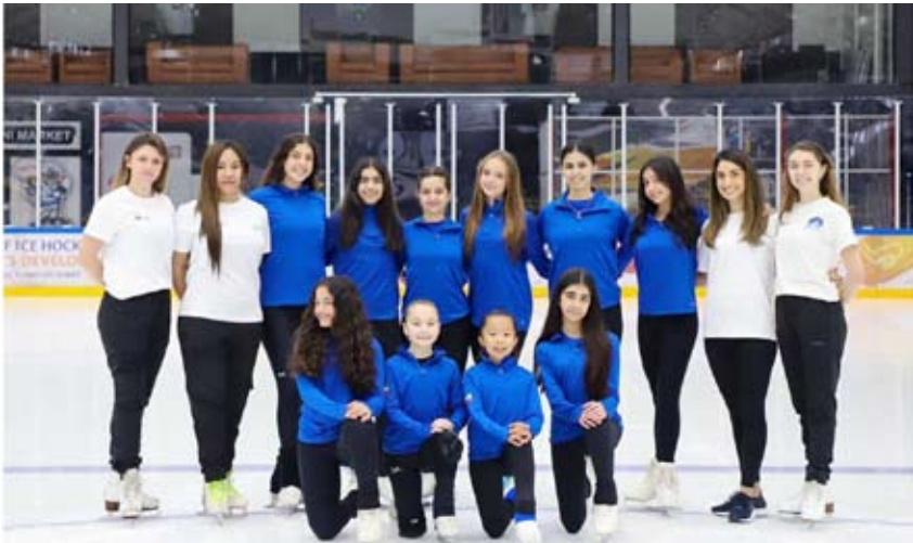
منتخب الكويت للفيجر مع الجهاز التدريبي

لخوض منافسات هذه البطولة حيث اقام الجهاز التدريبي