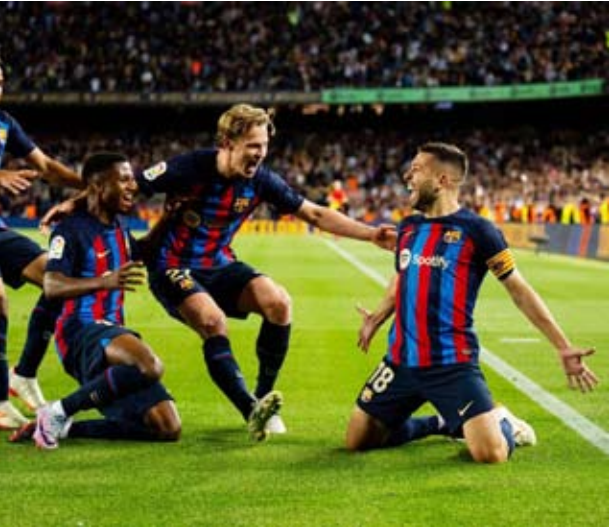
ألبا يحتفل مع زملائه بالفوز على أوساسونا

اقترب برشلونة خطوة جديدة من التتويج بلقب الدوري الإسباني لكرة القدم بفضل فوزه الصعب على ضيفه أوساسونا 1 – صفر في المرحلة الثالثة والثلاثين من المسابقة، في الوقت الذي فاز فيه أليريا على ضيفه إلتشي 2 –1.