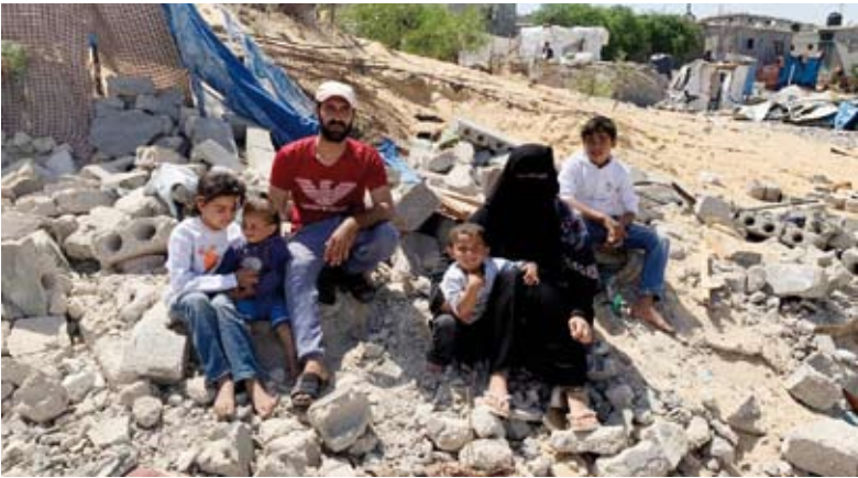
مأساة الأسر في فلسطين

العربي من الفلسطينيين على زيارة الوطن الآم للأبناء أو الأجداد، وهو ما يزيد هذه الخطوة.