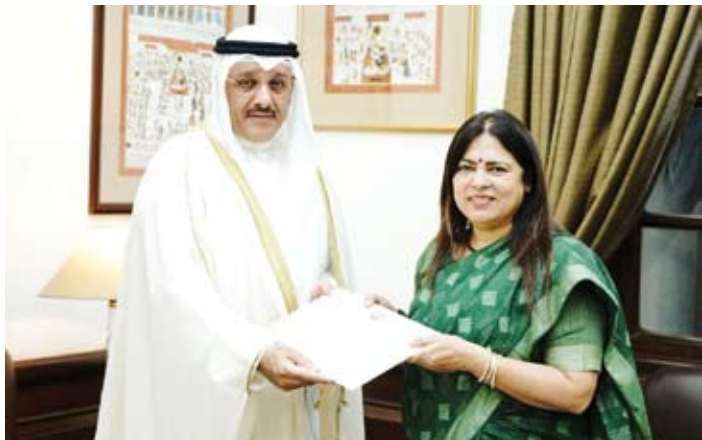
السفير سميج جوهر حيات يسلم الرسالة لوزير الخارجية الهندي ميناكشي ليكهي

الكويت والهند في مختلف المجالات. وتابع: إن الاجتماعات سادتتها أجواء إيجابية وأن وجهات النظر التي تمت مناقشتها في كافة الاجتماعات متطابقة في مجملها مع الجانب الهندي. ولفت إلى أن هذه المشاورات المهمة جاءت في إطار تنفيذ الاتفاقيات بشأن التعاون الثنائي بين وزارتي خارجية الكويت والهند وأن الدورة الحالية تعد الخامسة لإقامة المشاورات السياسية بين وزارتي الخارجية في كلا البلدين. وكان السفير حيات وصل إلى العاصمة الهندية، أول أمس، في زيارة رسمية لترؤس وفد دولة الكويت المشارك في اجتماعات الجولة الخامسة من المشاورات السياسية بين وزارتي الخارجية في البلدين الصديقين وسيجري خلال الزيارة محادثات رسمية مع كبار المسؤولين في الهند.