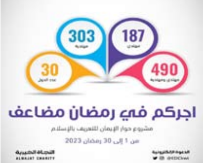
مشروع حوار الإيمان للتعريف بالإسلام