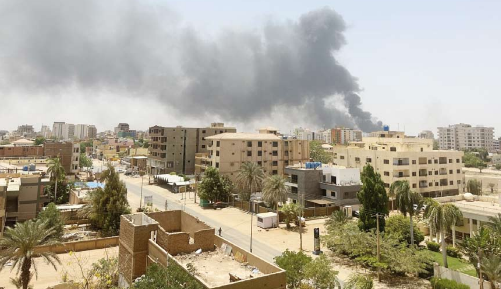
ضربات جوية في الخرطوم

قال شاهد من وكالة «رويترز» للأبناء إن دوي ضربات جوية تُردّد في العاصمة السودانية الخرطوم رغم موافقة طر في الصراع على وقف جديد لإطلاق النار لمدة سبعة أيام اعتباراً من اليوم (الخميس)، مما قوّض فرص تثبيت هدنة طويلة قد تخفف من حدة الأزمة الإنسانية المتفاقمة هناك. ووصل مارتن غريفيث، وكيل الأمين العام للأمم المتحدة للشؤون الإنسانية ومنسق الإغاثة في حالات الطوارئ، إلى بورتنسودان «لإعادة التأكيد» على التزامه بمساعدة الشعب السوداني. وقال متحدث باسمه إن تحسين ظروف توصيل المساعدات عبر ضمانات بتوفير العبور الأمن ستكون أولويته.