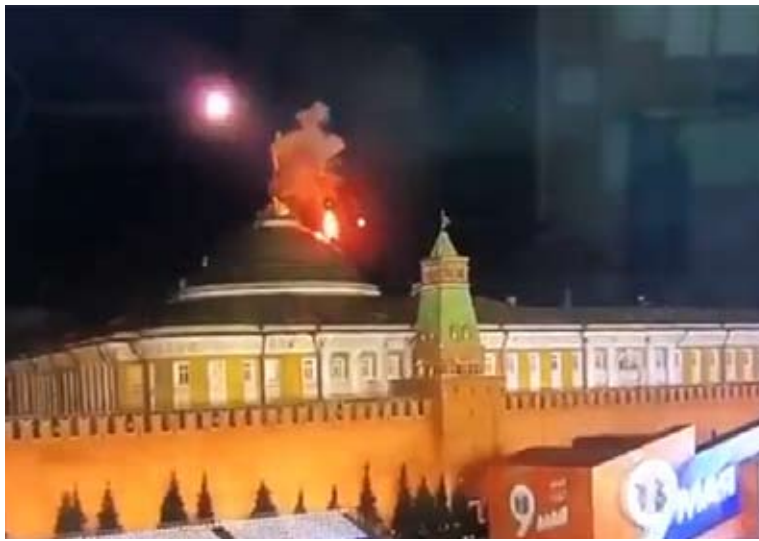
روسيا اتهمت أوكرانيا بمحاولة اغتيال بوتين عبر مسيرتين

اتهمت روسيا أوكرانيا، امس، بمهاجمة الكرملين بطائرتين مسيرتين في محاولة لم تنجح لاغتيال الرئيس فلاديمير بوتين. في المقابل، نفى الرئيس الأوكراني فولوديمير زيلينسكي أي علاقة لأوكرانيا بالهجوم على الكرملين، مضيفاً: قريباً ستكون لدينا عمليات هجومية واسعة النطاق. وأعلنت أوكرانيا حالة الإنذار الجوي في كييف ومناطق شرق البلاد، معتبرة أن ما حدث في الكرملين خدعة من روسيا. وأضاف الكرملين أن روسيا تحتفظ بحق الرد، وهو تعليق يشير إلى أن موسكو قد تستغل ما قالته عن هذا الهجوم لتبرير مزيد من التصعيد في الحرب مع أوكرانيا.