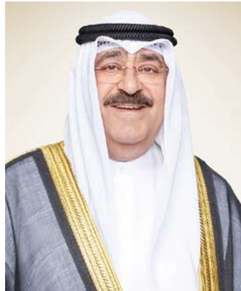
سمو ولي العهد الشيخ مشعل الأحمد

استقبل سمو ولي العهد الشيخ مشعل الأحمد، بقصر بيان، صباح أمس، سمو الشيخ صباح الخالد.