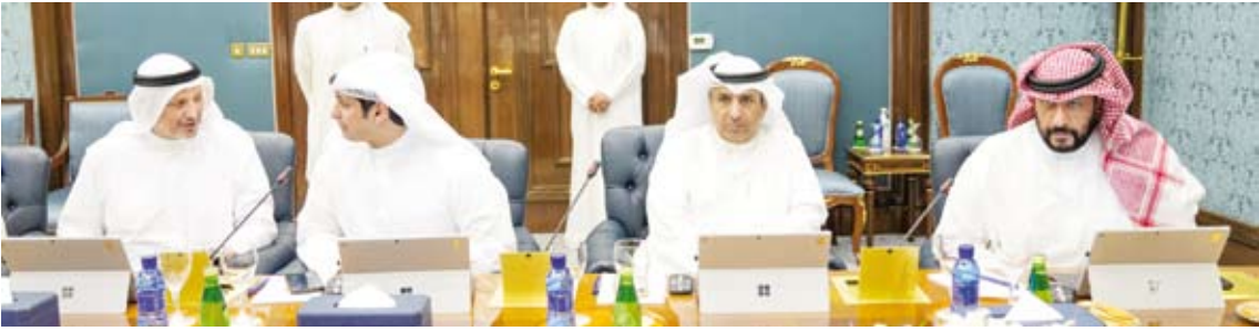
جانب من اجتماع مجلس الوزراء الاستثنائي

الانتخابات القادمة لعضوية مجلس الأمة لعام 2023 ولضمان ممارسة الناخبين بواجبهم الوطني بسهولة ويسر، فقد قرر مجلس الوزراء الموافقة على تشكيل لجنة برئاسة وزارة الداخلية وعضوية وزارة العدل -وزارة الإعلام -وزارة التربية -وزارة الشؤون الاجتماعية -وزارة الصحة - بلدية الكويت، لتتولى مهام الإعداد والتنظيم والتجهيز للانتخابات القادمة لعضوية مجلس الأمة لعام 2023.