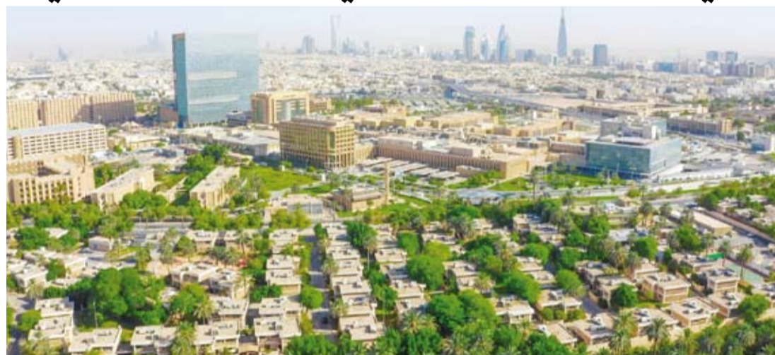
مستشفى الملك فيصل التخصصي

نجح مستشفى الملك فيصل التخصصي ومركز الأبحاث في تطبيق العلاج الجيني لمرضى مصاب بفقر الدم المنجلي، عبر تعديل الخلايا الجذعية المكونة للدم لتصحيح الخلل الوراثي المسبب للمرض، ثم إعادة حقنها في جسم المريض، ضمن دراسة سريرية تهدف إلى توسيع الخيارات العلاجية المتاحة للحالات غير المؤهلة للخضوع لزراعة خلايا جذعية من متبرع عين. ويسهم العلاج الجيني في تحسين جودة حياة المرضى من خلال الحد من تكرار الأزمات الصحية والحاجة إلى العلاجات الداعمة