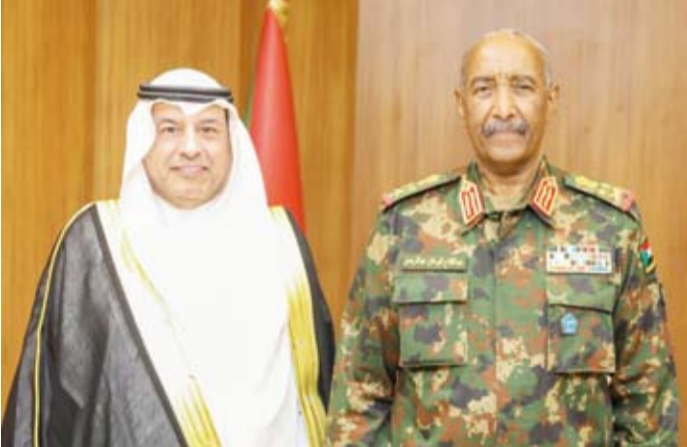
رئيس مجلس السيادة السوداني عبدالفتاح البرهان خلال لقائه سفير الكويت د.فهد الظفيري

السودانية الذي صدر يوم 28 فبراير والذي أعرب عن تضامن السودان وإدانته بكل وضوح للاعتداءات الإيرانية السافرة وغير المشروعة على دولة الكويت ودول الخليج وتأكيد على وقوف السودان التام مع سيادة تلك الدول وسلامة أراضيها. وثنى السفير الظفيري مواقف السودان بقيادة وشعباً واصفاً إياها بالمواقف النبيلة التي سنظل محفورة في ذاكرة وجدان الشعب الكويتي، مجدداً موقف دولة الكويت الثابت والداعم لوحدة السودان وسيادته الوطنية وسلامة أراضيه. وأشار سفير دولة الكويت لدى السودان إلى الدور الإنساني الكويتي تجاه الأشقاء في السودان لاسيما خلال فترة الحرب.