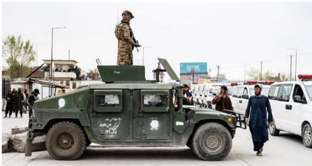
عنصر من «طالبان» يقف فوق مركبة مدرعة

من الحكومة الأفغانية بشأن المحادثات، لكن مسؤولاً أمينياً باكستانياً رفيع المستوى قال إن «وقداً يقوده مسؤول من وزارة الخارجية موجود في أورو متشي لعقد محادثات مع طالبان الأفغانية»، مضيفاً أن «الاجتماع جاء بطلب من أصدقائنا الصينيين».