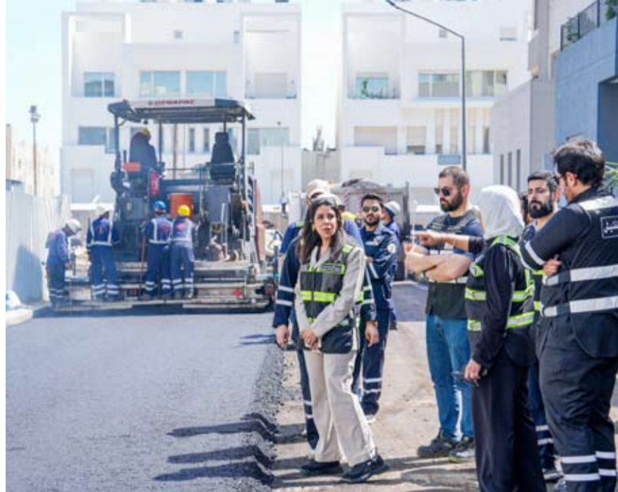
المشعان خلال زيارة ميدانية لمتابعة تنفيذ المشاريع

قامت وزير الأشغال العامة الدكتورة نورة المشعان بزيارة ميدانية إلى منطقة المسائل بمحافظة مبارك الكبير للاطلاع على أعمال فرش الأسفلت ومتابعة سير تنفيذ المشاريع والتأكد من جودة التنفيذ وفق المواصفات والمعايير الفنية المعتمدة. وقالت وزيرة الأشغال في بيان صحفي أمس إن الدكتورة المشعان اطلعت خلال الجولة على مراحل العمل الجارية ووجهت إلى ضرورة تسريع وتيرة الإنجاز مع الالتزام بأعلى معايير الجودة بما يضمن تحسين كفاءة الطرق وتعزيز البنية التحتية وتقديم أفضل الخدمات للمواطنين.