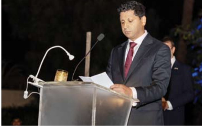
سفير المملكة المتحدة لبريطانيا العظمى وأيرلندا الشمالية لدى الكويت قدسي رشيد

وشدد على أن موقف بلاده واضح بضرورة وقف الهجمات الإيرانية فوراً وخفض التصعيد وتجنب توسيع دائرة النزاع، مؤكداً أن الحل يجب أن يكون عبر المسار الدبلوماسي مع استمرار التنسيق السياسي والعسكري الرفيع بين الكويت والمملكة المتحدة عبر قيادتي البلدين ووزراء الخارجية والدفاع. وأكد السفير رشيد أهمية إنهاء الاعتداءات وتأمين الملاحة في مضيق هرمز واستئناف حركة التجارة مشيداً بجهود السلطات الكويتية في التعامل مع الأزمة.