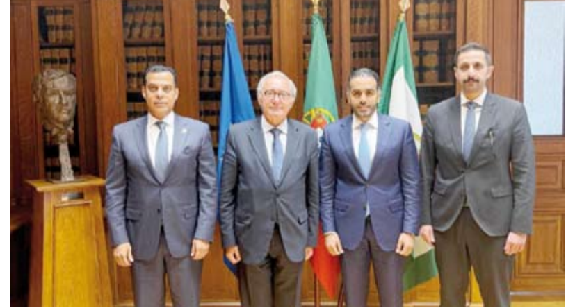
السفير حمد الهزيم مع رئيس لجنة الشؤون الخارجية بالبرلمان البرتغالي جوزيه سيزاريو

يؤثر بشكل مباشر في امدادات الطاقة العالمية، فضلاً عن تداعياته على الأمن الغذائي في ضوء الدور الحيوي لدول مجلس التعاون في إنتاج الأسمدة وهو ما سيؤدي إلى نقصها في الأسواق والتأثير على سلاسل الغذاء.