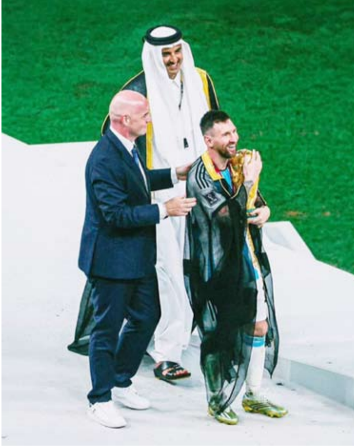
ميسي حمل آخر نسخة من كأس العالم في قطر

ويدير الاتحاد الدولي سوقاً خاصة لإعادة البيع ويحصل على نسبة 15 في المائة من كل من البائع والمشتري. وقال إنفاغنتينو في بنابر إن طلبات التذاكر كانت مذهلة وتعادل طلبات ألف عام من كؤوس العالم دفعة واحدة ودافع عن نشاط إعادة البيع، معتبراً إياه نشاطاً تجارياً قانونياً بموجب القانون الأميركي رغم مخاوف جماهيرية وشكاوى قدمت للمفوضية الأوروبية بشأن التكاليف المرتفعة.