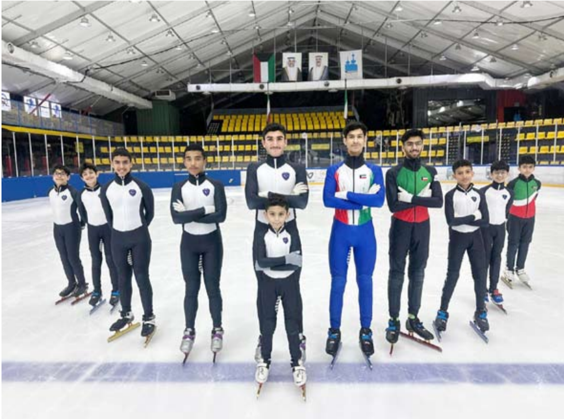
عدد من لاعبي نادي الألعاب الشتوية

توفي هانس-يورغن كرايشه، لاعب منتخب ألمانيا الشرقية لكرة القدم السابق، عن عمر 78 عاماً، وفق ما أعلن نادي دينامو دريسدن، نقلاً عن عائلته. ولعب كرايشه 50 مباراة دولية مع منتخب ألمانيا الشرقية، وسجل 25 هدفاً. وكان ضمن الفريق الذي اشتهر بفوزه على ألمانيا الغربية في كأس العالم