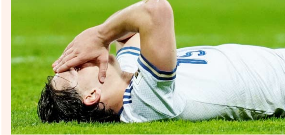
حسرة لاعب إيطاليا بعد توقيع المونديال

منتخبات جديدة، في تحول يعكس تغير موازين القوة في كرة القدم العالمية، ويعيد طرح السؤال حول قدرة هذه المنتخبات التاريخية على استعادة مكانتها في السنوات المقبلة.