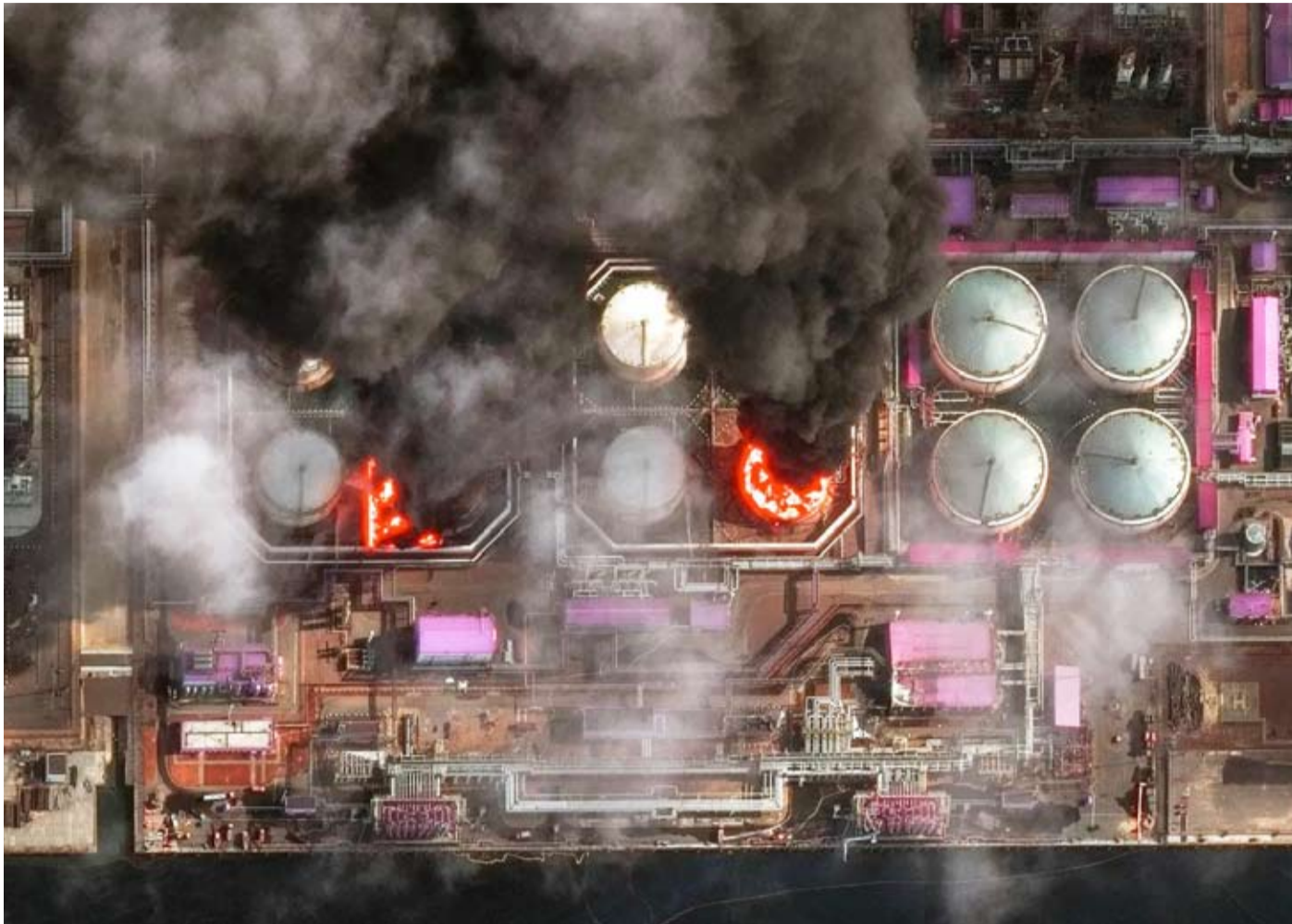
نيران في مستودعات تخزين للنفط في مرفأ أوست - لوجا

وقال وزير الخارجية الأوكراني أندريه سيبيها في مؤتمر صحافي، إن بلاده تتعاون مع دول منطقة البلطيق وفنلندا لتجنب حدوث مثل تلك الوقائع، مؤكداً أن الطائرات المسيرة التي تطلقها بلاده «لم تستهدف أبداً هذه الدول»، وأن ما يحدث هو نتيجة «تصرفات واعية ومتعمدة من روسيا».