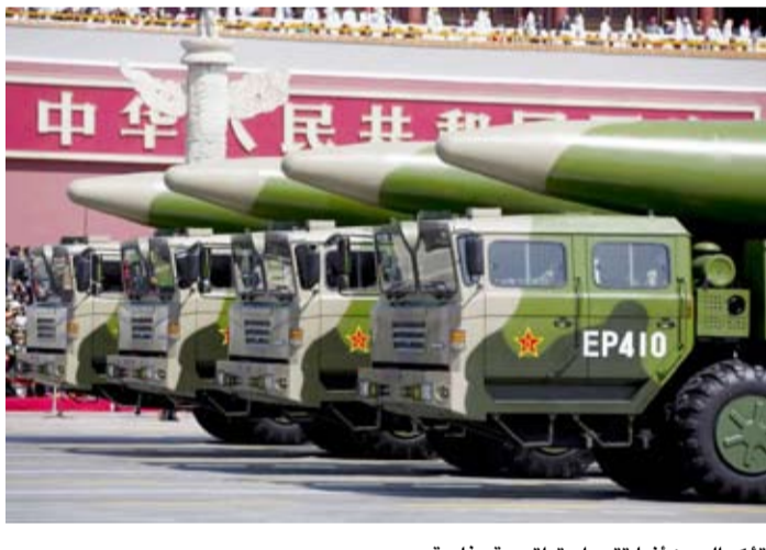
تؤكد الصين أنها تتبع استراتيجية دفاعية

ووفقاً لعدد من الخبراء، صممت هذه الميزات، وغيرها، بما في ذلك معدات معالجة الهواء المنظورة، لحصر المواد شديدة الإشعاع، مثل اليورانيوم والبلوتونيوم، داخل القبة، ما يشير إلى توسيع القدرة الإنتاجية للبرنامج النووي الصيني. كما أن المنشأة مُحاطة بثلاث طبقات من السياج الأمني.