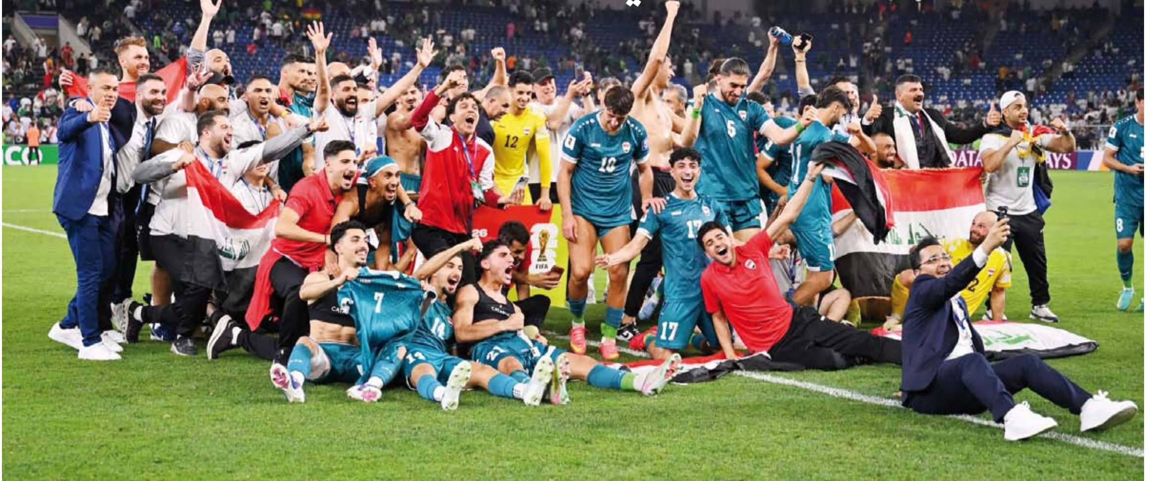
العراق يعود للمشاركة المونديالية بعد 40 عاماً من الغياب

الجزائريون على النمسا (2-0) وتشيلي (3-2)، لكنهم ودّعوا البطولة بفارق الأهداف رغم العروض السلافية التي قدموها.