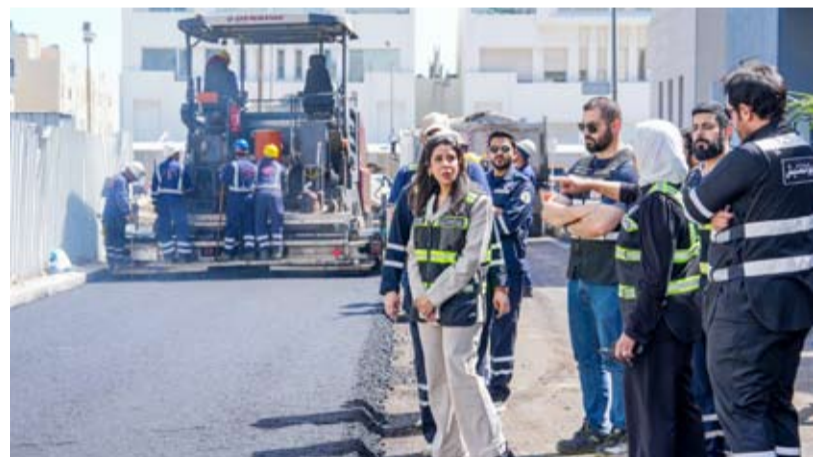
الشعان خلال تفقد أعمال فرش الأسفلت في منطقة المسایل

وقالت وزارة الأشغال في بيان صحفي أمس إن الدكتورة المشعان اطلعت خلال الجولة على مراحل العمل الجارية ووجهت إلى ضرورة تسريع وتيرة الإنجاز مع الالتزام بأعلى معايير الجودة بما يضمن تحسين كفاءة الطرق وتعزيز البنية التحتية وتقديم أفضل الخدمات للمواطنين.