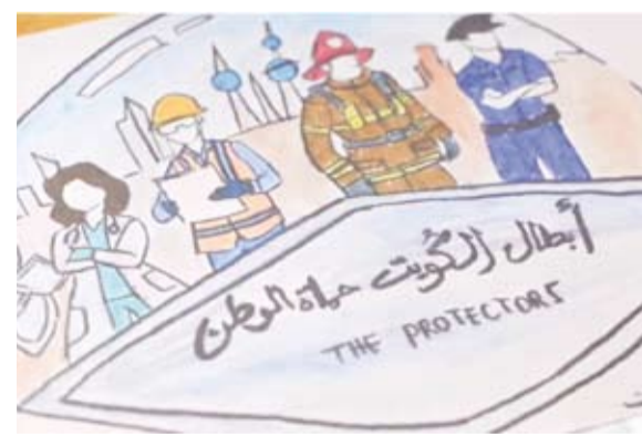
جانب من المشاركات

أعلنت وزارة التربية عن اختتام استقبال المشاركات في الحملة الوطنية «من قلوب عيائنا... إلى أبطال الوطن»، والتي استمرت على مدى أسبوعين، وذلك يوم أمس الأول، بعد تفاعل واسع من طلبة المدارس بمختلف مراحلهم التعليمية، في مبادرة تربية وطنية جاءت بتوجيهات من وزير التربية المهندس سيد جلال الطبيبائي وهدفت إلى تعزيز قيم الولاء والانتماء وترسيخ روح المسؤولية المجتمعية لدى المتعلمين.