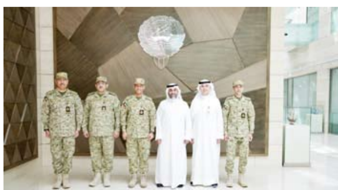
اللواء رياض طواري وممثلو الشركة المنفذة للمشروع

القرار إضافة إلى أتمتة الإجراءات وتعزيز الكفاءة المؤسسية. وحسب البيان، أوضحت شركة الشرق الأوسط للاتصالات المنفذة للعقد أن المشروع سيعتمد على حلول متقدمة في الذكاء الاصطناعي مع الالتزام بأعلى معايير أمن المعلومات وحوكمة البيانات ومن المقرر تنفيذ المشروع على مراحل تشمل التخطيط والتطوير والتشغيل وصولاً إلى تحقيق التكامل الكامل ورفع كفاءة الأنظمة. وحضر التوقيع قائد إدارة الموارد ونظم المعلومات في الحرس الوطني العميد يوسف هليل وقائد التحيز وإدارة المشاريع العميد راشد فرحان ومدير مديرية نظم المعلومات العميد مهندس ناصر أحمد.