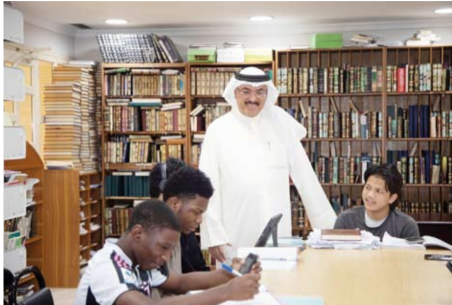
وزير التربية خلال زيارته التقفية للمعهد الديني

في إطار حرصه على متابعة سير العمل والإطمئنان على استمرارية العملية التعليمية، وتعزيز الدعم التربوي للمتعلمين من طلبة المنح الدراسية، قام وزير التربية المهندس سيد جلال الطبيبائي بزيارة تفقدية إلى مقر إقامة طلبة المنح الدراسية في المعهد الديني (بتين) في منطقة قرطبة، وذلك للاطمئنان على أوضاعهم التعليمية والمعيشية، ومتابعة انتظامهم في الحضور الدراسية بنظام التعليم عن بعد في ظل الظروف الراهنة.