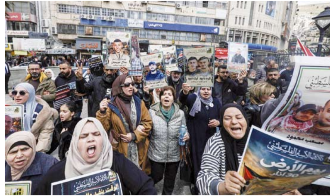
أقارب الأسرى الفلسطينيين خلال مسيرة في نابلس

دان وزراء خارجية السعودية، وتركيا، ومصر، وإندونيسيا، والأردن، وباكستان، وقطر، والإمارات، بإشاد العبارات سنّ سلطات الاحتلال الإسرائيلي قانوناً صادقاً عليه «الكنيست» يجيز فرض عقوبة الإعدام في الضفة الغربية المحتلة، ويبلغها بشكل فعلي بحق الفلسطينيين. وحذر الوزراء، في بيان مشترك، من الإجراءات الإسرائيلية المستمرة، التي ترسخ نظام فصل عنصري وتبني خطاباً إقصائياً ينكر الحقوق غير القابلة للتصرف للشعب الفلسطيني ووجوده في الأرض الفلسطينية المحتلة. وأكد الوزراء أن هذا التشريع يشكل تصعيداً خطيراً، لا سيما في ظلّ تطبيقه التمييزي بحق الأسرى الفلسطينيين، مشددين على أنّ مثل هذه الإجراءات من شأنها تاجيح التوترات وتقويض الاستقرار الإقليمي. وأعرب الوزراء كذلك عن بالغ القلق إزاء أوضاع الأسرى الفلسطينيين في السجون الإسرائيلية، محذرين من ازدياد المخاطر في ظلّ تقارير موثوقة عن انتهاكات مستمرة، بما في ذلك التعذيب، والمعاملة القاسية واللاإنسانية والمهينة، والتجوع، وحرمانهم من حقوقهم الأساسية، مؤكداً أن هذه الممارسات تعكس نهجاً أوسع من الانتهاكات بحق الشعب الفلسطيني. وجدد الوزراء رفضهم للسياسات الإسرائيلية القائمة على التمييز العنصري والقمع والعدوان، التي تستهدف الشعب الفلسطيني. وشدد الوزراء على ضرورة الامتناع عن الإجراءات التي تفرضها سلطة الاحتلال الإسرائيلي، والتي من شأنها تاجيح التوترات، مؤكداً أهمية ضمان المساءلة، وداعين إلى تكثيف الجهود الدولية للحفاظ على الاستقرار ومنع مزيد من التدهور.