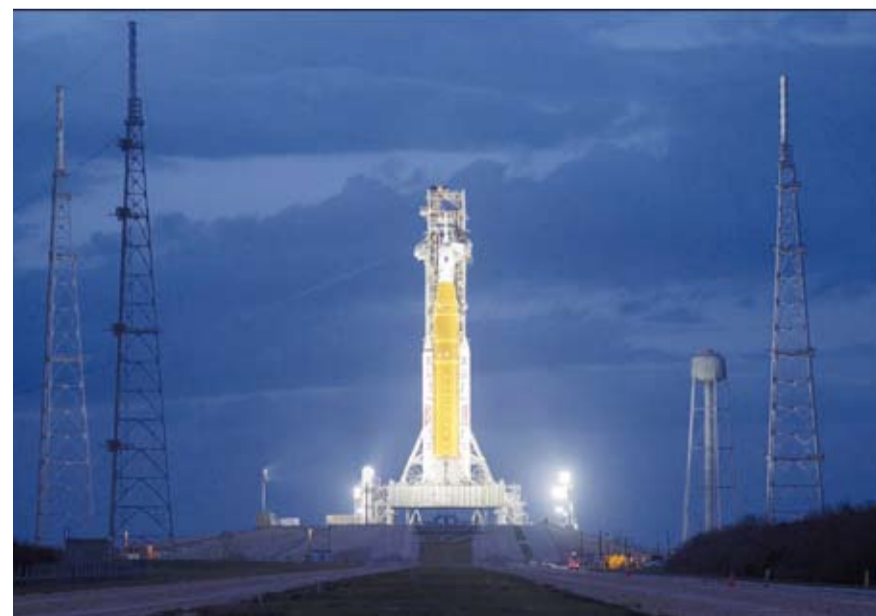
مركبة فضائية مأهولة إلى القمر تحمل على متنها 4 رواد فضاء

وسيقوم الطاقم خلال الرحلة التي تستمر حوالي 10 أيام بالدور حول القمر والعودة إلى الأرض في خطوة تمهيدية لرحلات مستقبلية بعد عقود من العمل المتواصل والبحث والشغوف. وقالت (ناسا): إن هذه الرحلة ستجعل الطاقم يسافر إلى أبعد نقطة عن الأرض مقارنة بالرحلات الفضائية السابقة للبشر. وأشارت إلى أن الطاقم سيحقق تقدماً في فهم كيفية العمل في بيئة الفضاء بين الأرض والقمر وسيدرس كيفية استجابة الأجهزة والأنظمة الحيوية في المركبة لتحديات الفضاء العميق بالإضافة إلى جمع صور وبيانات للقمر سيما الجانب البعيد منه مما سيساهم في الاستعدادات لعمليات استكشافية على سطحه مستقبلاً. ومن المتوقع أن تساهم رحلة المركبة (أوربيون) في تعزيز الخبرات التقنية والعلوم الفضائية لدى وكالة (ناسا) في إطار جهودها المستمرة منذ عشرات السنين لاستكشاف القمر وتأسيس وجود بشري دائم في الفضاء الخارجي.