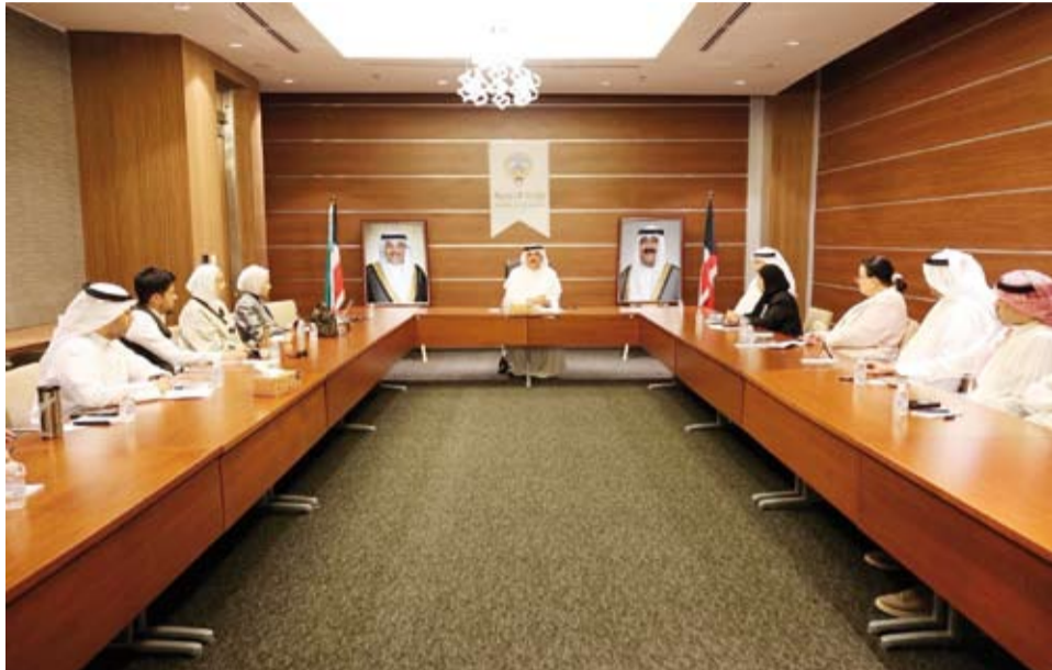
وزير التربية خلال اجتماعه مع ممثلي المدارس الأجنبية