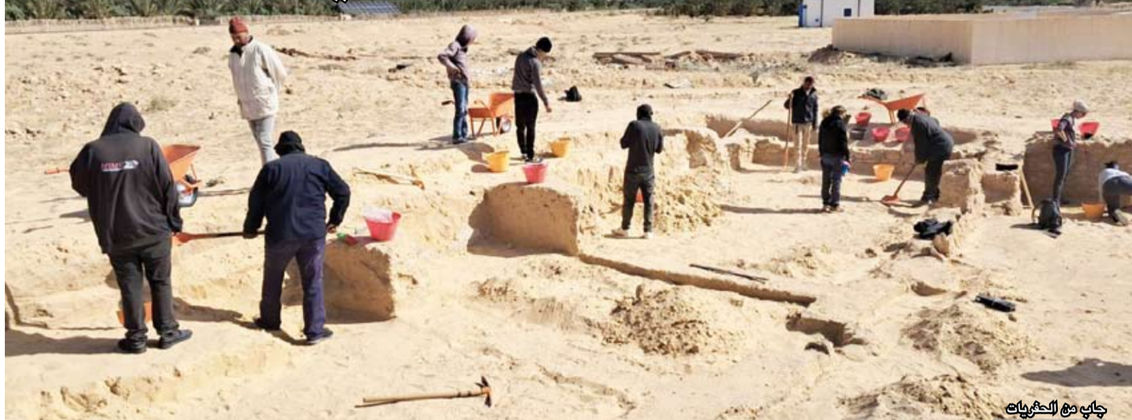
جاري مع الحفريات

ثمانى غرف تفتتح على فناء مستطيل الشكل، وهو ما يشير إلى وجود نشاط حرفي مرتبط بصناعة الجبس، حيث عثر في الغرف على آثار حرق لهذه المادة التي كانت تستخدم في البناء. وكانت الحفريات قد انطلقت منذ 16 مارس الماضي، على أن تتواصل حتى 4 أبريل الجاري، وتنفذ بالشراكة بين المعهد الوطني للتراث التونسي وجامعة روما تور فرغاتا، ضمن مشروع بحث يمتد لخلاث سنوات من 2026 إلى