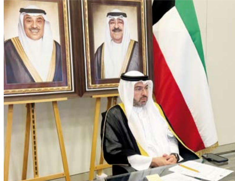
الشيخ المهندس حمود المبارك خلال اجتماع مجلس منظمة الإيكاو

36 دولة رسالة الاحتجاج وما ترتب على تلك الاعتداءات من استهداف مباشر للبنية التحتية للطيران المدني والخسائر الفادحة جراء تلك الاعتداءات. كما ناقش المجلس ورقة العمل الجماعية المقدمة من كافة دول مجلس التعاون والأردن المتعلقة بإدانة الاعتداءات الإيرانية الغاشمة على مجالها الجوي والمنشآت التابعة للطيران المدني. واعتبر المجلس أن هذه الاعمال تشكل خرقاً واضحاً للمادة الأولى من اتفاقية