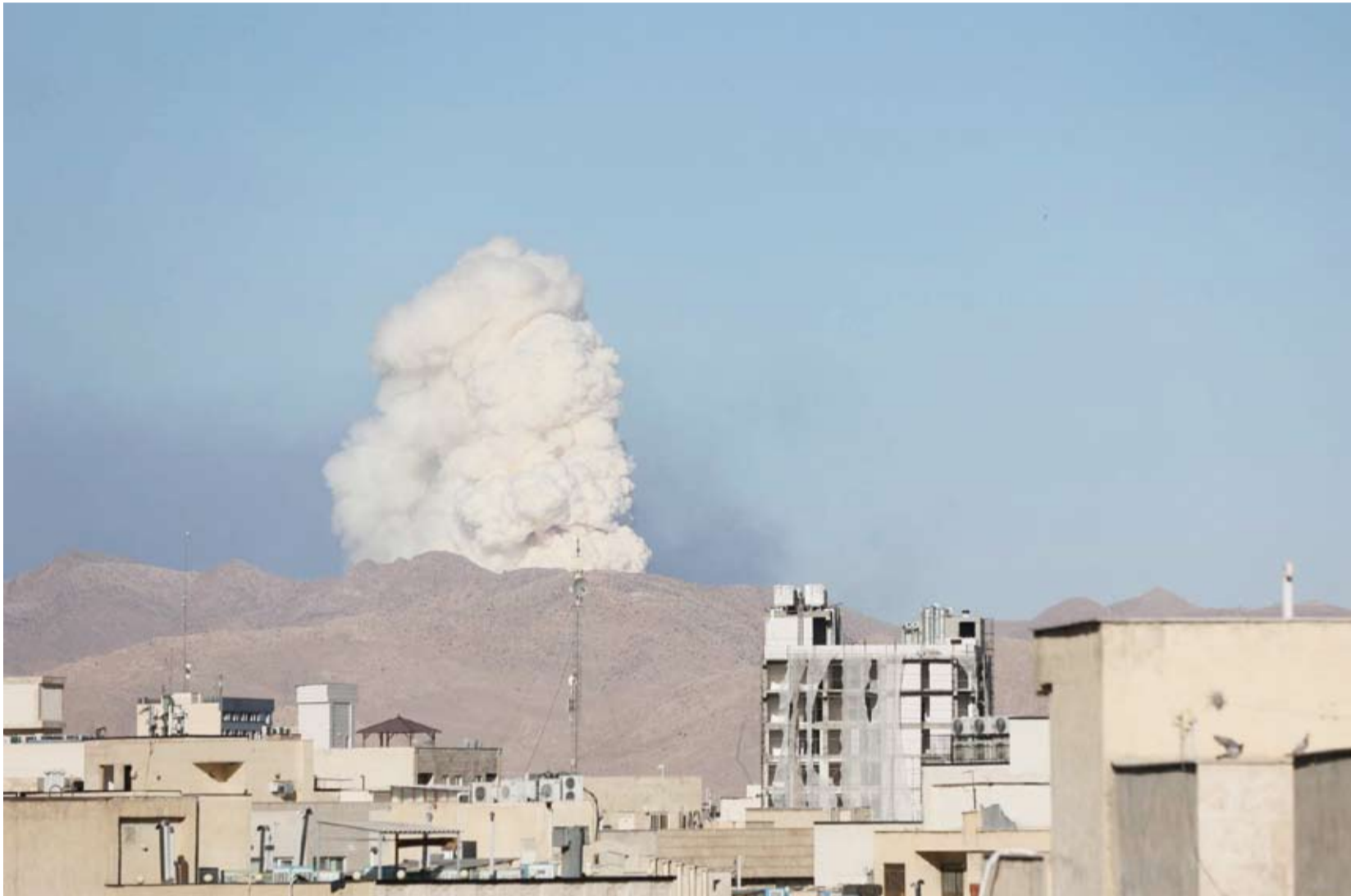
تصاعد الدخان جراء غارات على طهران

تعهد الجيش الإيراني، بشن هجمات «ساحقة» على الولايات المتحدة وإسرائيل، بعد ساعات من تهديد الرئيس الأميركي دونالد ترامب بتوجيه ضربات شديدة للجمهورية الإسلامية في الأسابيع المقبلة، وإعادةتها إلى «العصر الحجري». وقال «مقر خاتم الأنبياء»، غرفة العمليات المركزية للقوات المسلحة الإيرانية، في بيان بثته التلفزيون الرسمي: «بالتوكل على الله، سستمر هذه الحرب حتى إذ لا لكم ولذكم ونذكم والدائم والحتمي واستسلامكم»، وأضاف: «انتظروا عملياتنا الأكثر سخفاً وتدميراً». وقال الرئيس الأميركي دونالد ترامب، إن الولايات المتحدة «تقترب من تحقيق» أهدافها في الحرب ضد إيران لكنها ستواصل ضرب البلاد «بشدة» لمدة أسبوعين إلى ثلاثة أسابيع أخرى. وأشاد الرئيس الأميركي، في خطاب لأمّة من البيت الأبيض، بالانتصارات «الحاسمة» و«الساحقة» التي حققتها الولايات المتحدة، مؤكداً مرة أخرى أن الضربات كانت ضرورية لمنع إيران من الحصول على السلاح النووي، وتعهد بعدم التخلي عن دول الخليج التي استهدفتها إيران رداً على الضربات الإسرائيلية الأميركية على الجمهورية الإسلامية، وقال: «وإن أشكر حلفاءنا في الشرق الأوسط... لقد كانوا رائعين، ولن نسبح بتعرضهم بأي شكل لأي ضرر أو قتل». وفي الوقت نفسه، أصر ترمب على أن نهاية الحرب لم تات بعد، وقال: «سنوجه إليهم ضربات شديدة للغاية خلال الأسبوعين أو الثلاثة المقبلة، سنعيدهم إلى العصر الحجري الذي ينتمون إليه».