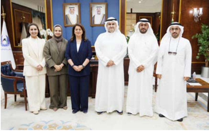
المستشار ناصر السميح خلال زيارته الهيئة أمس

قام وزير العدل المستشار ناصر السميح بزيارة إلى مقر الهيئة العامة لمكافحة الفساد «نزاهة» حيث كان في استقباله رئيس الهيئة الدكتور رنا الفارس ونائب الرئيس وأعضاء مجلس الإدارة. وذكرت الهيئة في بيان صحفي أمس أن الزيارة تأتي في إطار تعزيز التعاون والتنسيق المشترك بين الجهات الحكومية بما يساهم في دعم الجهود الوطنية الرامية إلى ترسيخ مبادئ النزاهة والشفافية ومكافحة الفساد. وأضافت أنه تم استعراض أبرز المبادرات والبرامج التي تنفذها الهيئة إضافة إلى التأكيد على أهمية تكامل الأدوار بين الجهات المعنية لتحقيق أعلى مستويات