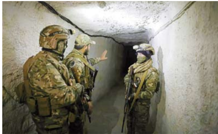
جنود من الجيش السوري يتفقدون النفق

في منطقة وعرة قرب الحدود السورية – اللبنانية، تُقيم جرافات تابعة للجيش السوري سواتر ترابية تمرکز خلفها مدعات، فيما يمشط جنود أنفاقاً قالوا إن «حزب الله» استخدمها خلال سنوات النزاع السوري، وذلك في إطار تعزيزات عسكرية في خضم الحرب الدائرة بالشرق الأوسط، وفق ما نقلته «وكالة الصحافة الفرنسية». وتسعى دمشق إلى النأي بنفسها عن الحرب التي امتدت إلى لبنان المجاور حيث يخوض «حزب الله» حرباً دامية مع إسرائيل. في ريف القصير غرب سوريا، أطلع مصوّر في «وكالة الصحافة الفرنسية»: الذي سمحت له وزارة الدفاع بتوثيق انتشار الجيش على الحدود لأول مرة منذ إرسال التعزيزات قبل نحو شهر، على أنفاق عدة عمارة للحدود اكتشفها الجيش أخيراً. وقال مسؤول النقاط الحدودية السورية