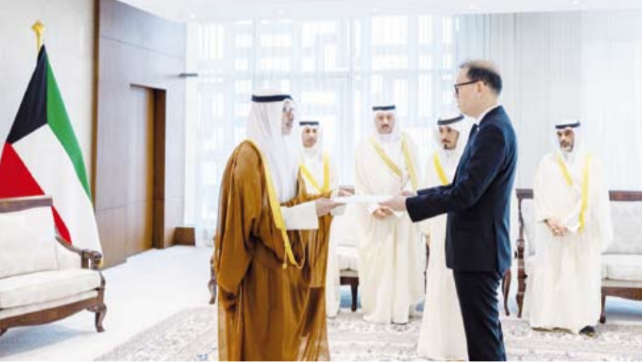
الشيخ جراح الجابر يتسلم نسخة من أوراق اعتماد سفير تايلند سونغتشاي تشايباتيبوت

تسلم وزير الخارجية الشيخ جراح الجابر، نسخة من أوراق اعتماد سفير مملكة تايلند لدى دولة الكويت سونغتشاي تشايباتيبوت، وذلك خلال اللقاء الذي تم أمس، في ديوان عام وزارة الخارجية.