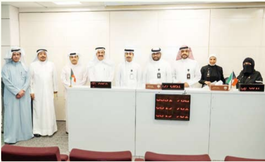
جانب من الجولة التفقدية