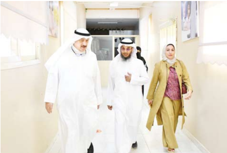
وزير الصحة يتفقد مقر لجان الاقتراع

قرر مجلس الوزراء في اجتماعه الأسبوعي، الذي عقد صباح أمس الثلاثاء، في قصر بيان برئاسة سمو الشيخ الدكتور محمد الصباح رئيس مجلس الوزراء، تعطيل العمل في جميع الوزارات والجهات الحكومية والهيئات والمؤسسات العامة بعد غد الخميس الموافق الرابع من شهر ابريل الحالي واعتباره يوم راحة نظراً لصدور المرسوم رقم (29) لسنة 2024 بدعوة الناخبين لانتخاب أعضاء مجلس الأمة، وذلك في يوم الخميس الموافق 4 أبريل 2024.