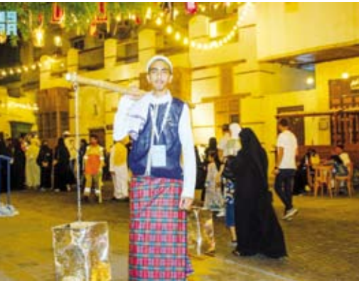
«السقا» يجوب الأزقة حاملاً صفيحتي الماء