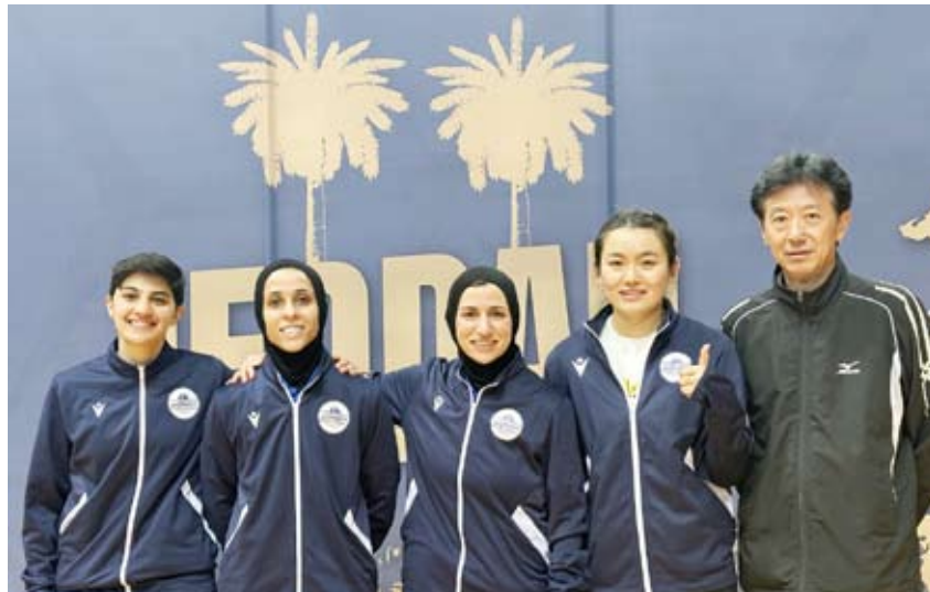
فريق نادي الفتاة المشارك في البطولة

تأهل نادي (الفتاة) الكويتي الى نهائي بطولة أندية غرب آسيا لكرة الطاولة والتي تستضيفها مدينة جدة فيما حل نادي (التضامن) سادسا و (الفحيحيل) سابعا في فئة الرجال ونادي (سلوى الصباح) سابعا بفئة السيدات في ترتيب الفرق المتنافسة.