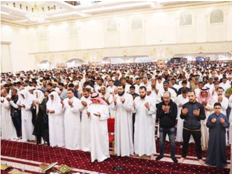
آلاف المصلين يلججون بالدعاء

تمكن جهاز ”كيه ستار“ لأبحاث الاندماج، والمعروف باسم الشمس الاصطناعية، من الحفاظ على البلازما بدرجات حرارة 100 مليون درجة لمدة 48 ثانية خلال الاختبارات بين ديسمبر 2023 وفبراير 2024، محطماً الرقم القياسي السابق البالغ 30 ثانية المسجل في عام 2021، حسب ما ذكره علماء المعهد الكوري لطاقة الاندماج في كوريا الجنوبية. ويسعى الاندماج النووي إلى تكرار التفاعل الذي يجعل الشمس والنجوم الأخرى تشع، عن طريق دمج ذرتين معاً لإطلاق كميات هائلة من الطاقة. وتشير التقارير إلى أن الاندماج النووي سيكون مصدراً غير محدود للحلول المناخية باستخدام الطاقة النظيفة، فالاندماج لديه القدرة على توفير طاقة لا حدود لها دون التلوث الكربوني الذي يؤدي إلى ارتفاع درجة حرارة الكوكب، لكن إتقان تلك العملية على الأرض يمثل تحدياً كبيراً. وتتضمن الطريقة الأكثر شيوعاً لتحقيق طاقة الاندماج وجود مفاعل على شكل طارة يسمى (توكاماك)، حيث يتم تسخين متغيرات الهيدروجين إلى درجات حرارة عالية بشكل غير عادي لتكوين البلازما. وقال سي و ويون مدير مركز أبحاث KSTAR في المعهد لشبكة ”سي إن إن“: إن درجات الحرارة المرتفعة والبلازما عالية الكثافة، التي يمكن أن تحدث فيها التفاعلات لفترات طويلة، أمر مهم لمستقبل مفاعلات الاندماج النووي. وأضاف يون: أن الحفاظ على درجات الحرارة المرتفعة لم يكن من السهل إثباته بسبب الطبيعة غير المستقرة للبلازما مرتفعة الحرارة، وهذا هو سبب أهمية هذا الرقم القياسي الأخير. وأشار العلماء إلى أن الهدف النهائي هو أن يكون ”كيه ستار“ قادراً على الحفاظ على درجات حرارة البلازما عند 100 مليون درجة لمدة 300 ثانية بحلول عام 2026، وهي نقطة حرجية لتكون قادرة على توسيع نطاق عمليات الاندماج.