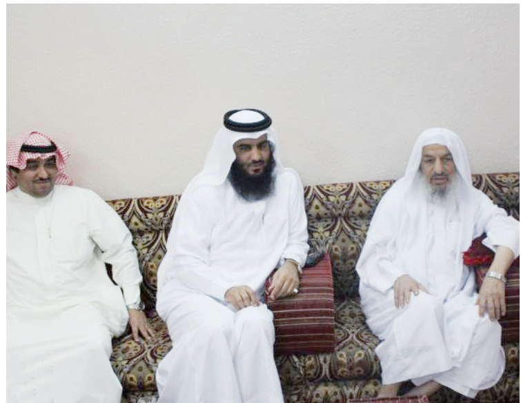
لوفي إحدى الدورات