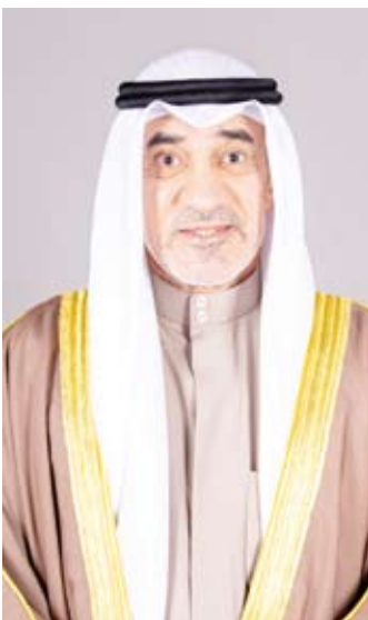
الشيخ فهد اليوسف

سير العمليات الانتخابية والتصدي بكل قوة لكل من تسول له نفسه الخروج على القانون أو الإخلال بالنظام والأمن العام بعد ظهور النتائج.“ واستعرض مع الحضور الخطط الأمنية التفصيلية للانتخابات والإجراءات التي سيتم اتخاذها وسبل فرض السيطرة الأمنية وتحقيق النظام العام في مختلف الدوائر وحفظ النظام بمواقع الاقتراع وحمايتها لكي تخرج الانتخابات بالصورة التي تتفق مع مكانة الكويت الحضارية إقليمياً ودولياً.