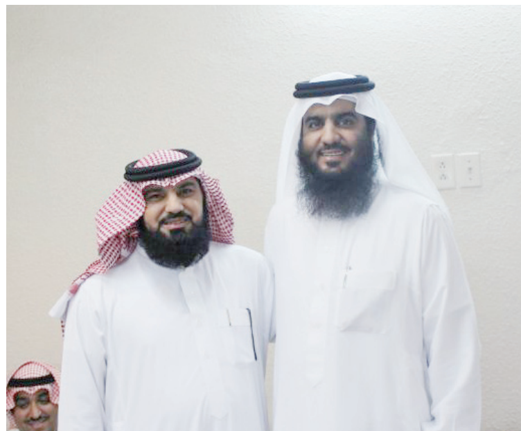
يحمل أن يسود الإسلام مشارق الأرض ومغاربها