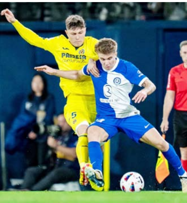
أتلتيكو قفز للمركز الرابع في الليغا

فاز فريق أتلتيكو مدريد على مضيفه فياريال بهدفين لهدف، في ختام الجولة الثلاثين من منافسات الدوري الإسباني لكرة القدم، ليتقدم بذلك للمركز الرابع في ترتيب جدول الدوري.