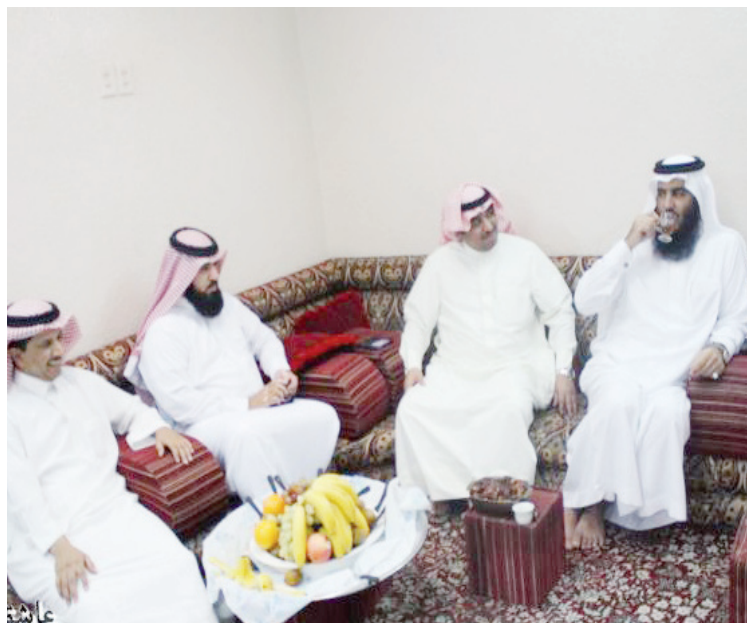
نزل إلى الأرض ولم يكف بالشعارات

ويتابع : بالنسبة لحفلي لكلام الله عز وجل فقد من الله علي بوالد كريم رحمة الله عليه فكان يأخذنا إلي