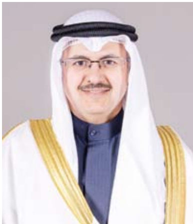
الشيخ فراس الصباح

وأوضح أن دولة الكويت ممثلة في الهيئة العامة لشؤون ذوي الإعاقة كانت ولا زالت سباقة ورائدة في رعاية وتأهيل الأشخاص ذوي الإعاقة ونحرص دائماً على تطوير الخدمات المقدمة لهم لتحسين ظروفهم الحياتية من خلال توفير الرعاية الصحية والنفسية والتأهيلية وتوفير الدعم التعليمي والمدارس الخاصة بهم. وذكر أن من شأن تقديم الدعم المناسب لمرضى التوحد والتكيف مع هذا المرض وقبوله أن يتيح للمصابين به التمتع بتكافؤ الفرص والمشاركة الكاملة والفعالة في المجتمع حتى ننقل من مجرد رفع مستوى الوعي إلى تعزيز قبول وتقدير الأشخاص المصابين بالتوحد ومساهماتهم في المجتمع. وأفاد بأن مشاركة دولة الكويت في الاحتفالية الدولية يمثل إيماناً منها بالاهتمام بذوي الإعاقة عامة والمصابين بـ(التوحد) خاصة من خلال الاهتمام بتعليمهم وتأهيلهم وتشغيلهم كبقية أفراد المجتمع.