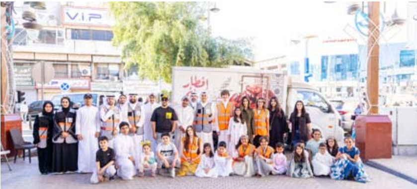
مشاركون في حملة شهر العطاء

تعزيز المسؤولية الاجتماعية بين فئات المجتمع لا سيما خلال شهر رمضان الفضيل حيث تهدف إلى تعزيز أسمى معاني الإخاء والبذل والعطاء بين كافة شرائح المجتمع عبر التواجد معهم والمساهمة في توزيع الوجبات على الصائمين بعد عناء الصيام. قام أيضاً فريق شركة وفرة