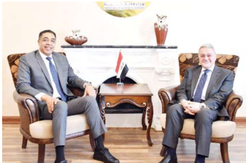
السفير الكويتي يلتقي وكيل وزارة الخارجية العراقية

وقال السفير الكويتي لدى العراق طارق الفرج مع وكيل وزارة الخارجية للعلاقات الثنائية السفير محمد بحر العلوم، أول أمس، العلاقات الثنائية بين البلدين.