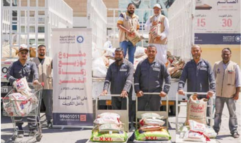
جانب من توزيع زكاة الفطر العام الماضي