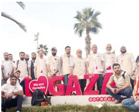
لفظة جماعية للفريق الطبي الكويتي