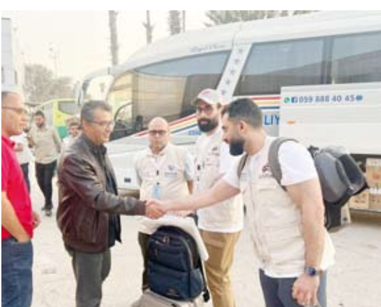
لحظة وصول الوفد الطبي الكويتي الي معبر رفح البري

إطار دعم دولة الكويت للقصية الفلسطينية وللتخفيف من معاناة الشعب الفلسطيني. ووصل الشهر الماضي وفداً طبياً كويتياً هو الأول من نوعه إلى غزة عبر (جمعية الهلال الأحمر الكويتي) وقام بسلسلة عمليات جراحية دقيقة للمرضى والمصابين الفلسطينيين.