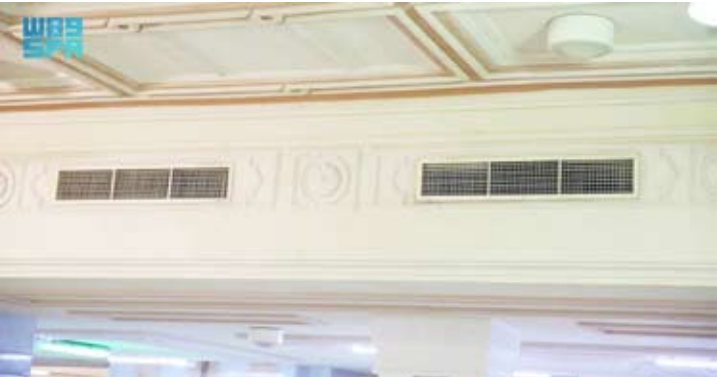
تنقية الهواء في المسجد الحرام

أعلن غينادي بوريسوف عالم الفلك الروسي، أنه اكتشف كويكباً جديداً خلق بالقرب من الأرض في حوالي الساعة 19:00 بتوقيت موسكو، يوم الأحد الماضي على مسافة تبلغ حوالي 28-30 ألف كيلومتر. وقال في تصريح لوكالة نوفوستي الروسية للأنباء: اكتشفت هذا الصباح هذا الجرم الجديد، وأرسلت ملاحظاتني إلى مركز الكواكب الصغيرة، وتم نشرها على الصفحة التي تؤكد وجود كويكبات قريبة من الأرض. وقد رصدته عدة مراصد أخرى لعدة ساعات، وأصبح من الواضح أن الكويكب كان صغيراً – يبلغ طوله حوالي 2 – 3 أمتار، لكنه يخلق على مسافة قريبة جداً، حتى داخل منطقة الأقمار الصناعية الثابتة بالنسبة للأرض. أي على بعد حوالي 28 – 30 ألف كيلومتر عن الأرض، في الساعة 19:00 بتوقيت موسكو. ووفقاً له، من الصعب تحديد بدقة مجموعة الكويكبات التي ينتمي إليها الجرم السماوي المكتشف. وستساعد عمليات الرصد على المدى القريب في تحديد مسار الكويكب والمؤشرات المدارية، مشيراً إلى أن جاذبية الأرض ستغير بالتأكيد مدار الكويكب، وسوف تنشئ نتائج الرصد والحسابات على الموقع الرسمي لمركز الكواكب الصغيرة التابع للاتحاد الفلكي الدولي. وتجدر الإشارة إلى أن غينادي بوريسوف اكتشف في عام 2019 أول مذنب يحلّق بين النجوم، أظهرت المؤشرات المدارية للمذنب أنه أتى من خارج النظام الشمسي. وقد أطلق على المذنب اسم Borisov / 2I. كما اكتشف بوريسوف عدداً من الكويكبات والمذنبات.