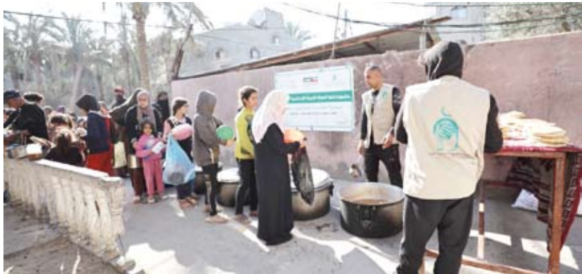
إطلاق مشروع صدقات العشر

لكفالة الأسر المتعففة والكوادر الطبية وأسرة الأيتام فضلاً عن الدعوة لدعم مشروع كسوة وعبيدة الأطفال واستقبال زكاة الفطر. وذكر أن قائمة صدقات العشر تتضمن مشروعاً صحياً لإجراء عمليات العيون في النيجر لمكافحة العمى ومعالجة أمراض العيون المنتشرة في أفريقيا عبر إزالة المياه البيضاء.