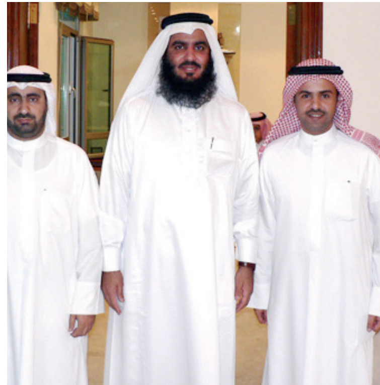
لحاز علي العديد من المناصب

البشر فلقد تعلمت منها ومن الذي سعة الصدر وتحمل الصعاب ومعاملة الناس بلطف ورقة وعناية وخلق حسن ( أسأل الله أن أكون كذلك وألا أكون من المداخين لأنفسهم لا سمح الله ) .. وكذلك أعانقتني على حفلي لكلام الله عز وجل في الحرم (المكي)