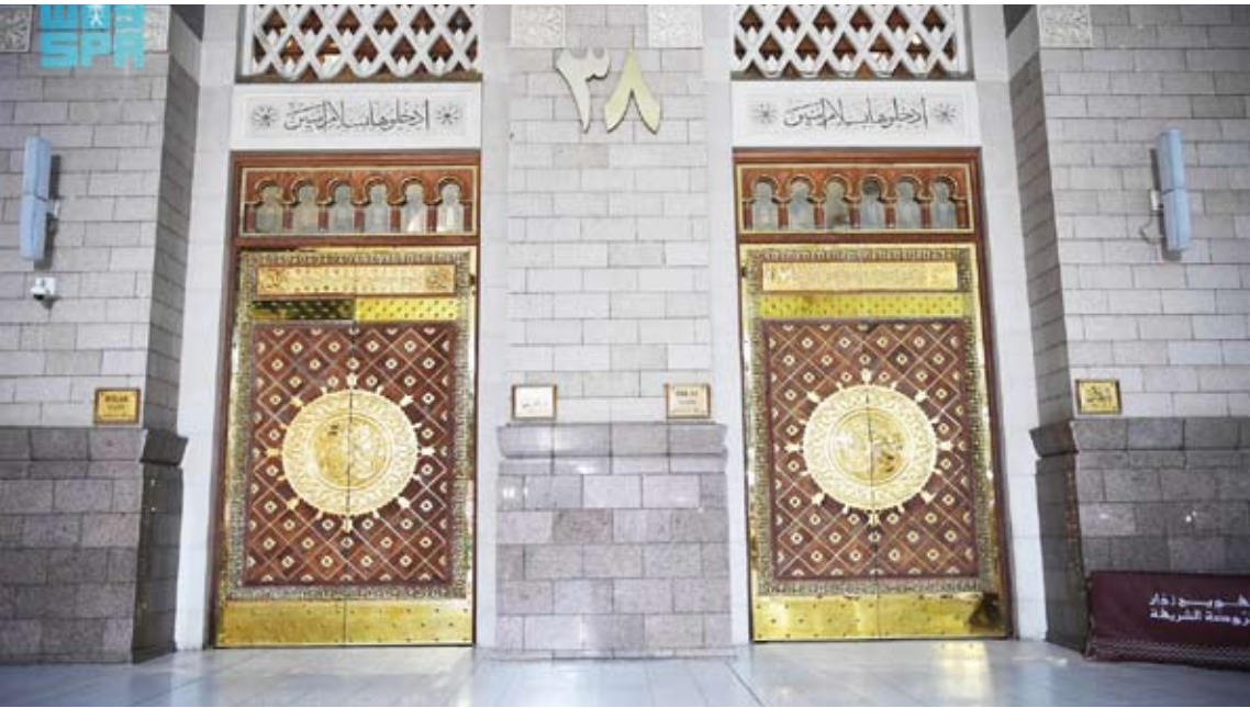
تصاميم مميزة تعكس حجم الرعاية والاهتمام