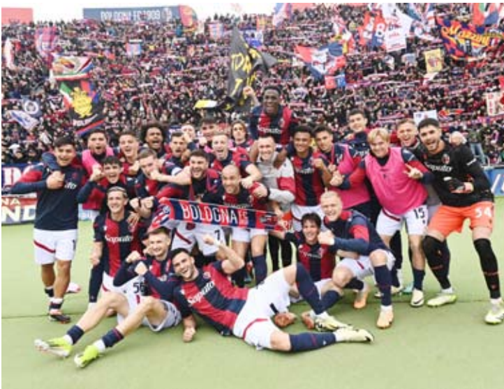
فرحة لاعبي بولونيا بالفوز على ساليرنيتانا

فاز فريق بولونيا على مضيفه ساليرنيتانا صاحب المركز الأخير بثلاثة أهداف دون مقابل ضمن منافسات الجولة الثلاثين من الدوري الإيطالي لكرة القدم ليواصل بولونيا زحفه نحو حجز بطاقته في مسابقة دوري أبطال أوروبا الموسم المقبل للمرة الأولى في تاريخه، وحسم بولونيا نتيجة المباراة في شوطها الأول بتسجيله هدفين عن طريق لاعبه ريكاردو أورسوليني في الدقيقة 14، والبلجيكي أليكسي سالماكرز في الدقيقة 44. قبل أن يضيف اليوناني خارا إلامبوس ليكو يانيس الهدف الثالث في الدقيقة الثانية من الوقت بدل الضائع.