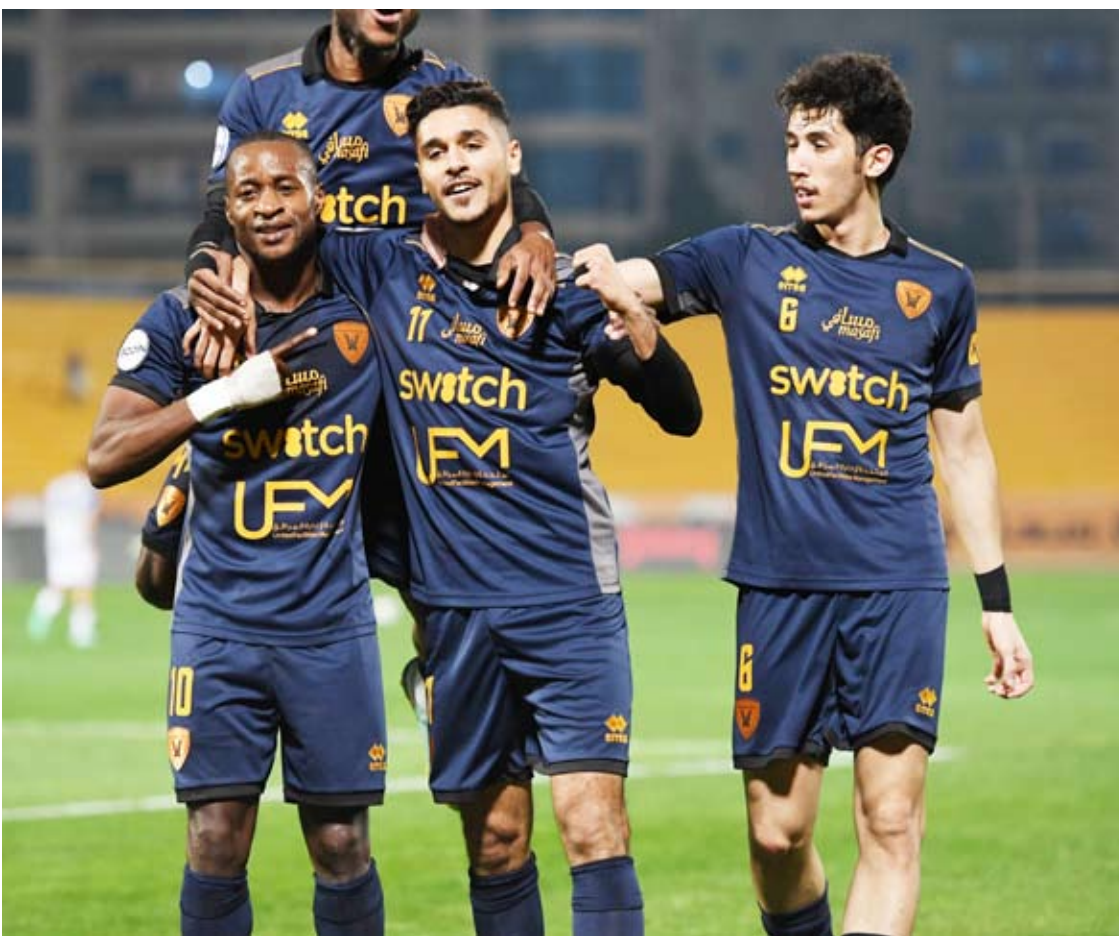
القادسية يقدم مستويات متقنة مع المشعان

جدير بالذكر أن جميع أندية الدوري الكويتي الممتاز غيرت مدربيها على مدار الموسم الجاري، ولم يسلم من ذلك