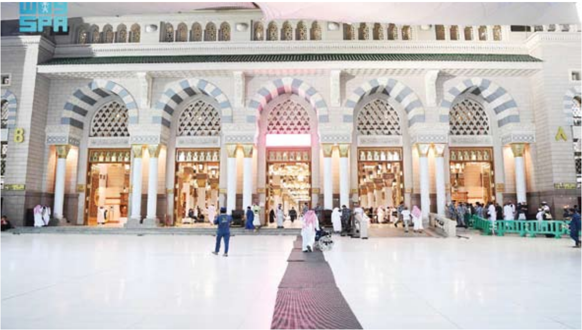
أبواب المسجد النبوي

وثبتت الأبواب باستخدام طريقة التشييق القديمة بدون استخدام المسامير. وتقف اليوم هذه الأبواب الميزة شاهدة على حجم الرعاية والعناية المستمرة من المملكة العربية السعودية بالمسجد النبوي الشريف، والعمل على عمارته باستمرار لتقديم الأعمال الجليلة لخدمة قاصديه لتأدية عبادتهم بكل يسر واطمئنان.