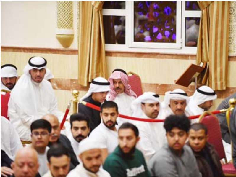
سمو الشيخ أحمد النواف يؤدي صلاة قيام الليل

وحرص مسجد بلال على إقامة الخيام الرمضانية التي تطلق على المكان الأجواء الروحانية، فضلاً عن القيام بخدمة التنظيم والمساعدة للمصلين في المسجد وقاعاته الملحقة ومصلى للسيدات، وتوفير مواقف تم تجهيزها لاستيعاب أكبر عدد من السيارات، وتوفير كبير من سيارات "جولف" لنقل المصلين