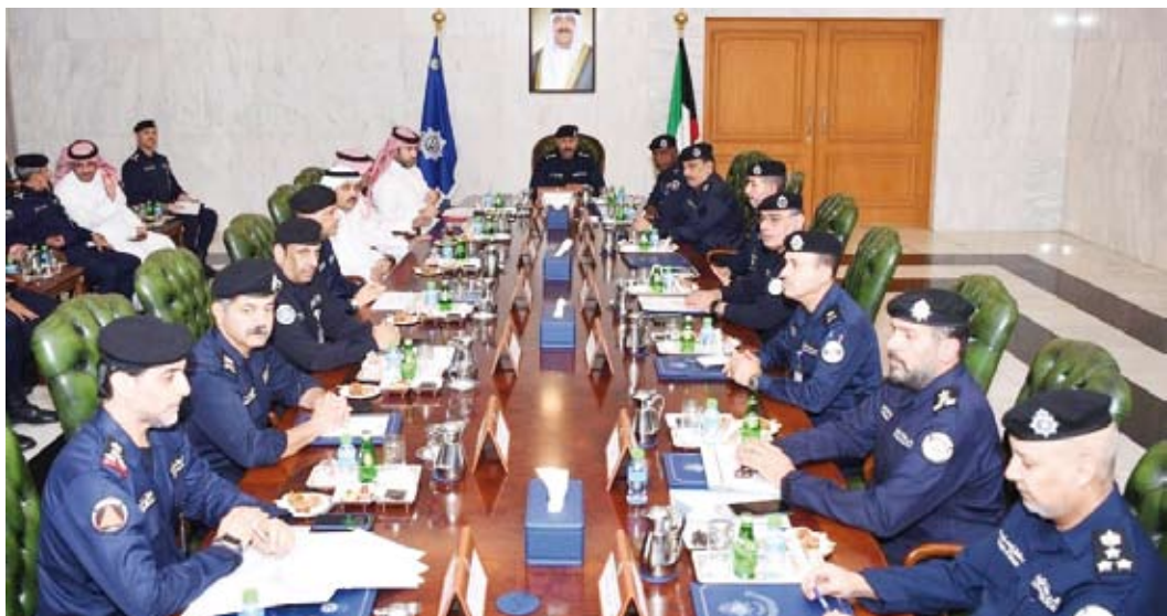
الشيخ سالم النواف يترأس الاجتماع الأمني