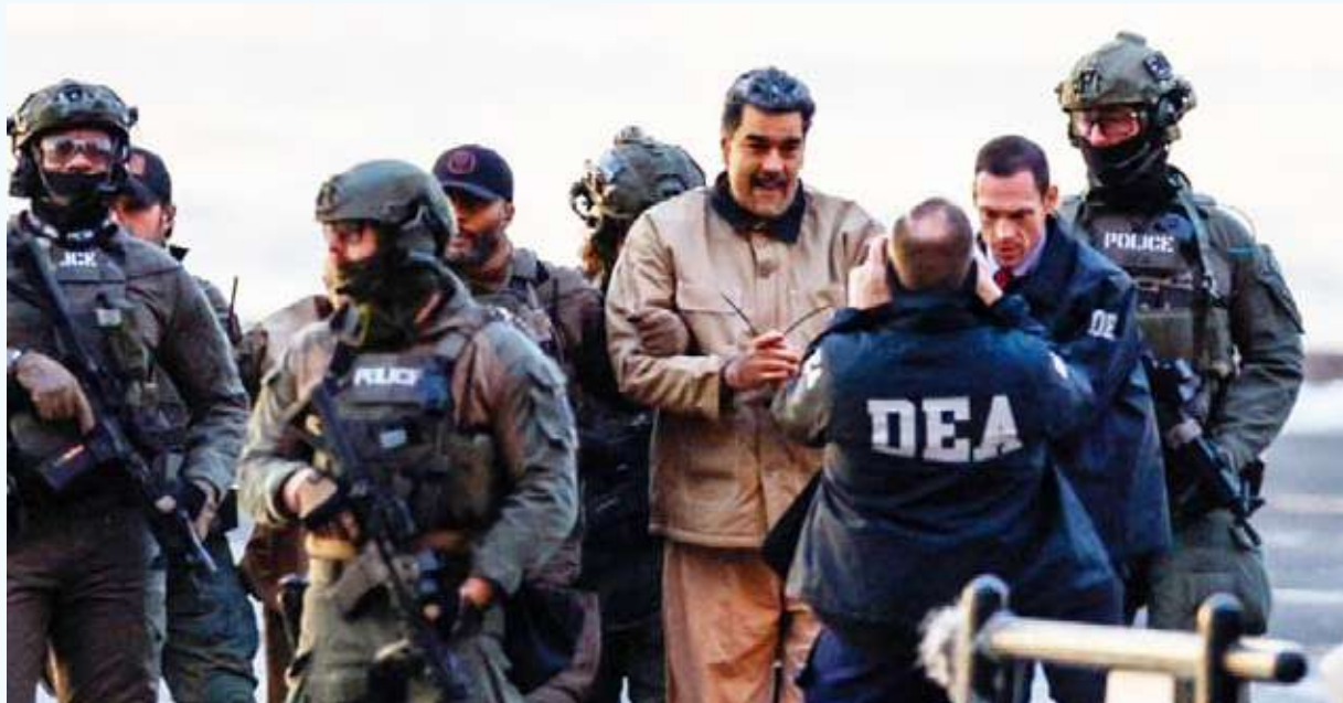
الرئيس الفنزويلي وزوجته مكبلي الدين في طريقهما للمحاكمة

عدد من عناصر قوات الأمن المدججين بالأسلحة. ويواجه الرئيس المحتجز في بروكلين نيو يورك للمثول أمام المحكمة في جلسة مقررّة ظهرها، وبدا مكبل الدين يواكبه