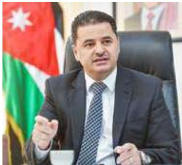
السفير ستان المجالي

وشدد السفير الأردني على أن قبول الطلبة الوافدين في الجامعات والكليات الرسمية يتم حصراً عبر نظام القبول الموحد الإلكتروني، مؤكداً في الوقت ذاته أن الجامعات والكليات الخاصة تتنح للطلبة التقديم إما عبر النظام ذاته أو بالتواصل المباشر مع الجامعة المعنية، دون الحاجة إلى أي وسطاء أو دفع أي رسوم إضافية لأي جهة كانت. كما لفت إلى أن وزارة التربية والتعليم الأردنية تتولى تدقيق شهادات الثانوية العامة للطلبة، واعتمادها أو منح شهادة معادلة مؤقتة، على أن يتم استكمال إجراءات التصديق والحصول على المعادلة الأصلية عند حضور الطالب إلى الأردن حسب الأصول المعمدة. وأكد السفير المجالي أن الطالب سيحصل على قبول مبدئي أو مشروط أو نهائي من الجامعة المختارة، بحسب استيفائه للشروط، مشيراً إلى أن النظام يتيح للطلاب إدخال حتى عشرة خيارات في جامعة واحدة أو عدة جامعات. ودعا الطلبة الراغبين إلى الاطلاع على البوابة «ادرس في الأردن» عبر الموقع الرسمي.