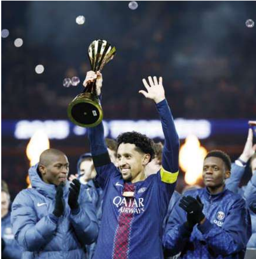
كابتن الفريق يرفع الكاس

في الدقيقة 51. وبهذه النتيجة، رفع باريس سان جيرمان رصيده للنقطة 39 في المركز الثاني بفارق نقطة واحدة عن فريق لانس المتصدر، فيما بقي فريق باريس أف سي في المركز 15 برصيد 16 نقطة.