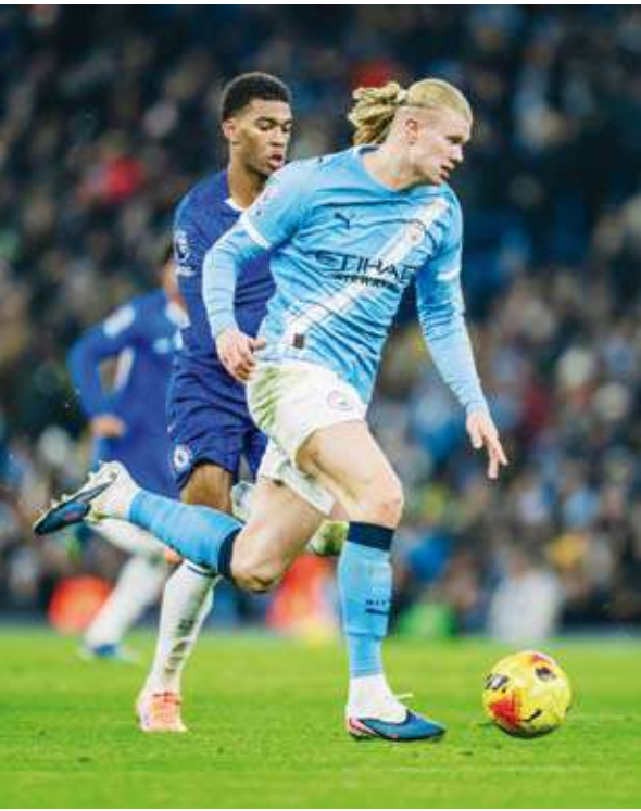
هالاند فشل في التسجيل

وأخطأ فرنانديز في تسديده الأولى، وتصدى الحارس جيانلويجي دوناروما