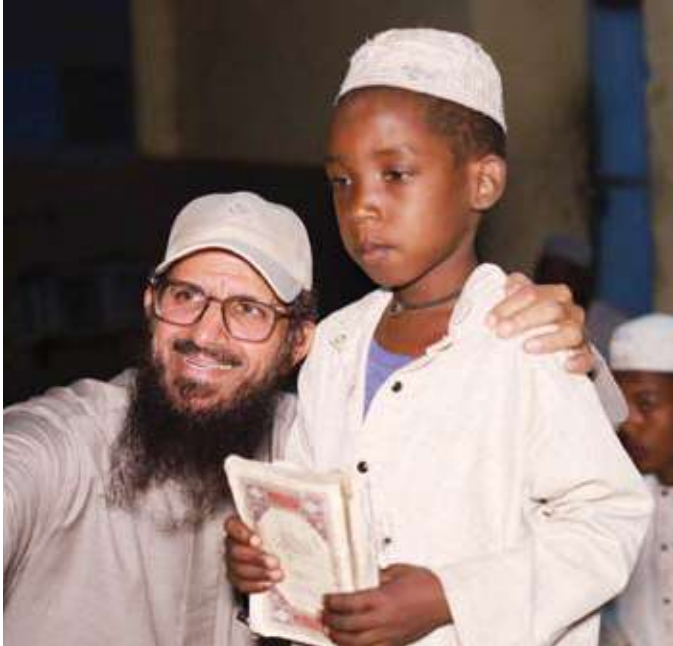
الشايح خلال إحدى الفعاليات الميدانية

العالم، مشدداً على أن هذه الجهود والاستجابات تعكس قيم التضامن الإنساني التي تتجاوز الحدود، وتؤكد المكانة الرائدة لدولة الكويت في مجال العمل الإغاثي والإنساني على المستويين الإقليمي والدولي. تعزيزاً للعمل التطوعي الكويتي خارج البلاد وترسيخ قيم التضامن والتكامل الإنساني مع الشعوب المحتاجة نفذ فريق سحابة أمل التطوعي سلسلة برامج إنسانية في إندونيسيا استهدفت دعم الفئات الأكثر احتياجاً هناك. وضمن الدور الإنساني لقطاع العمل الخيري الكويتي جاءت هذه الخطوة بتنظيم من أطباء كويتيين متنسبين للفريق ومشاركة عدد من المتبرعين والداعمين، للإطلاع على سير المشاريع الإنشائية والإنسانية والتنمية واقتراح عدد منها، مؤكداً أن هذه المبادرة تأتي في إطار تعزيز مبدأ الشفافية، وترسيخ مفهوم الشراكة الحقيقية مع المتبرعين بوصفهم شركاء في صناعة الخير وصانعاً للنجاح. واختتمت الجمعية عامها بزيارة ميدانية للأسر السودانية النازحة على الحدود الشمالية – السودانية، للوقوف على أوضاعهم الإنسانية وبذل كل سبل التضامن والدعم في ظل ما يعانونه من مجاعة ونقص حاد في أبسط مقومات الحياة. وفي ختام تصريحه، أكد الشايح أن «الصفاء الإنسانية» ستواصل رسالتها الإنسانية في تقديم الدعم والمساندة للمتضررين حول