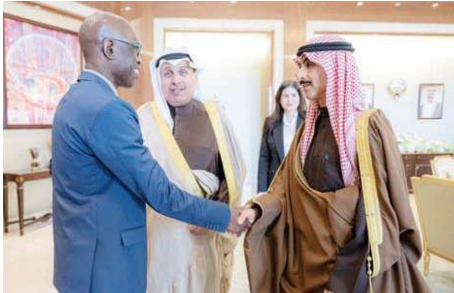
رئيس ديوان سمو ولي العهد خلال الاستقبال