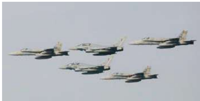
جانب من التمرين