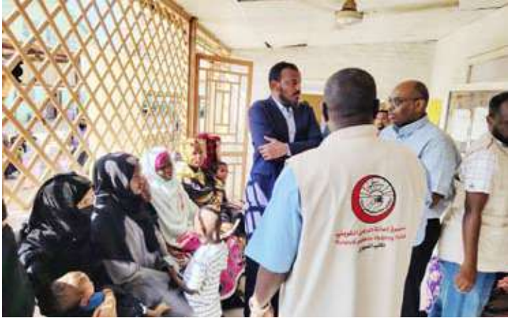
جانب من المخيم الطبي