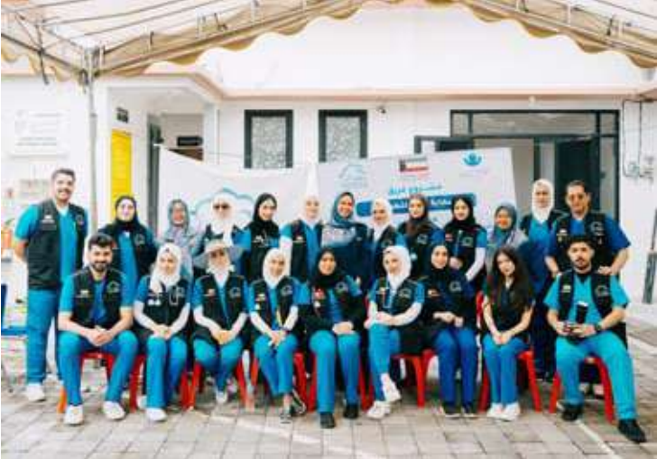
المشاركون في المبادرة

مخيم طبي وتنظيم زيارات ميدانية لأيتام وكبار السن وتوزيع سلال غذائية إلى جانب تنفيذ رحلات تسوق مخصصة لأيتام وزيارة عدد من المدارس والمشاركة في أعمال ترميم بعض الفصول الدراسية بهدف تحسين البيئة التعليمية وتوفير الحد الأدنى من مقومات الحياة الكريمة للمستفيدين.