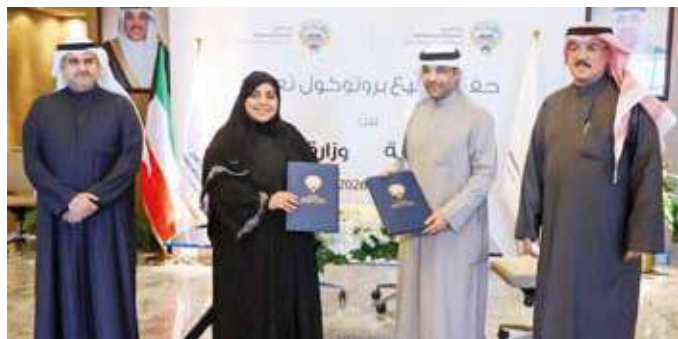
جانب من توقيع بروتوكول التعاون