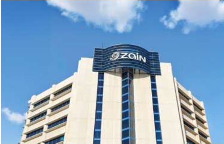
زين في 2025.. تواصل دائم، حياة أجمل

باستخدام الذكاء الاصطناعي. وفي المسار نفسه، دفعت زين بتحوّلها التشغيلي عبر مشروع الترقية الرقمية لنظام دعم الأعمال BSS بهدف رفع كفاءة العمليات، وتسريع نمو الخدمات، وإثراء تجربة العملاء عبر قدرات أكثر مرونة وذكاءً في تطوير المنتجات وإدارتها. كما وسّعت الشركة آفاق الابتكار الشبكي لنشر أول تجربة OpenRAN سحابية في الكويت، ما عزّز مرونة الشبكة وكفاءتها وقابليتها للتوسع، ودعمت تسريع تقديم الخدمات ضمن بيئة تشغيل أكثر انفتاحاً واعتمادية.