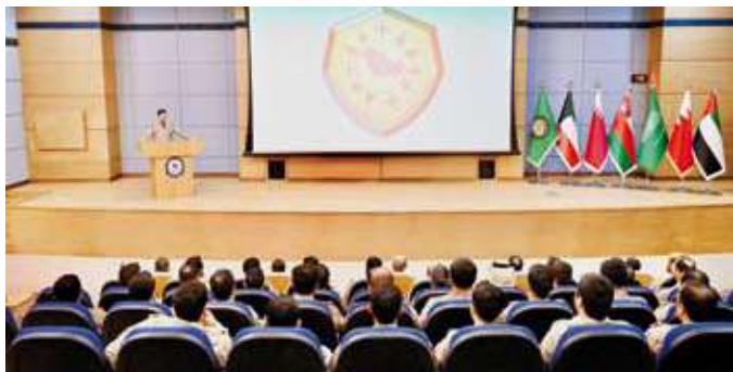
تدشين تمرين درع الخليج

ويشارك الجيش الكويتي ممثلاً بالقوة الجوية وسلاح الدفاع الجوي في هذا التمرين تأكيداً لالتزام دولة الكويت بدعم منظومة العمل العسكري الخليجي المشترك، بما يسهم في الحفاظ على أمن وسلامة واستقرار دول المجلس.