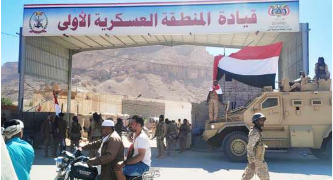
نجاح عملية تأمين المعسكرات بشكل كامل

الجنوب بإعلانه عن “مرحلة انتقالية”، في خطوة لاقت انتقادات بمنية واسعة. وشهدت محافظات حضرموت والمهرة شرقي اليمن تطورات ميدانية متسارعة، مع إعلان القوات الحكومية مغللة بقوات درع الوطن بسط سيطرتها على كامل مديريات حضرموت، وبدء إجراءات التسلم السلمي للمواقع العسكرية والأمنية في المهرة عقب انسحاب قوات المجلس الانتقالي الجنوبي.