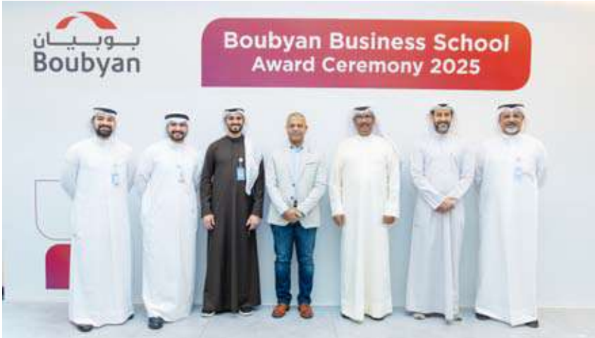
الحمد والرومي مع فريق إدارة التدريب والتطوير بالبنك

على مستويات الأداء المتميزة، وخلق أثراً إيجابياً ملموساً داخل البنك.