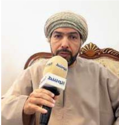
السفير العماني متحدنا

العلاقات الثنائية ويدفع بها نحو مستويات أوسع من الشراكة والتكامل، تحقيقاً لتطلعات القيادتين والشعبين الشقيقين.