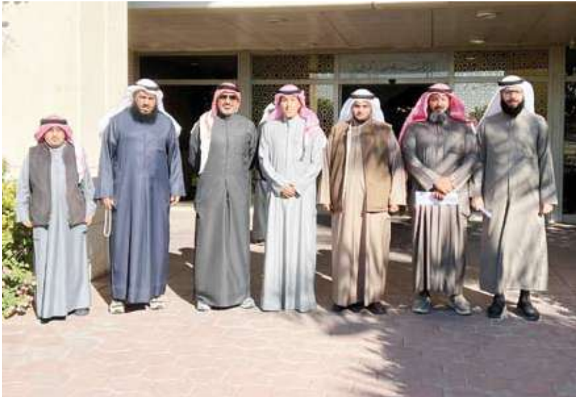
الوزير الوصي خلال جولته التفقدية

قام وزير الأوقاف والشؤون الإسلامية الدكتور محمد الوصي بجولة تفقدية على إدارة مساجد محافظة الفروانية أطلع خلالها على سير العمل والجهود المبذولة في تطوير الخدمات المقدمة للمساجد وروادها والوقوف على الاحتياجات التنظيمية والإدارية والفنية. وذكرت وزارة الشؤون الإسلامية في بيان صحفي أمس أن جولة الوزير الوصي تضمنت متابعة خطط الإدارة في المساجد وآليات العناية بها وبرامج الصيانة والتأهيل إضافة إلى الجهود المبذولة في تطوير الجوانب الدعوية والخدمية بما يحقق رسالة الوزارة في العناية ببيوت الله وتوفير بيئة مناسبة لأداء العبادة.