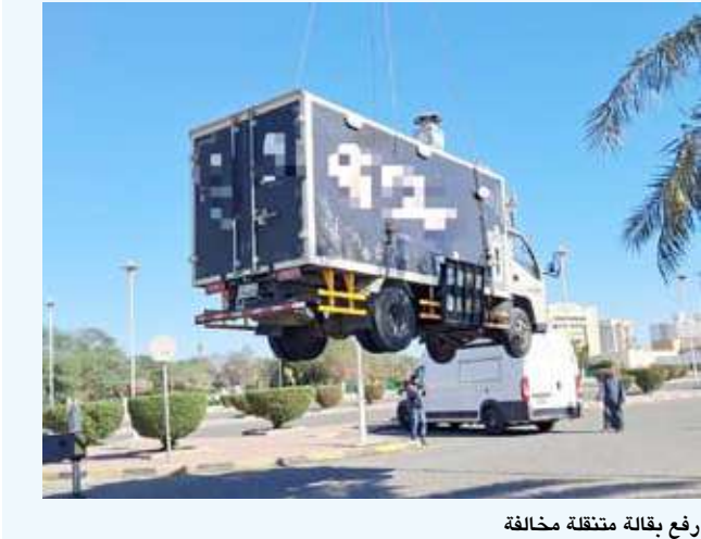
رفع بقالة متنقلة مخالفة

العامة وإشغالات الطرق بفرع بلدية محافظة الفروانية محمد الجبوع أن تواصل الحملات الميدانية لرصد المخالفين واتخاذ الإجراءات القانونية بحقهم وأضاف بأن تم رفع 7 عربات متنقلة فودترك مخالفة وإرسالها لموقع الحجز بالتعاون مع وزارة الداخلية.