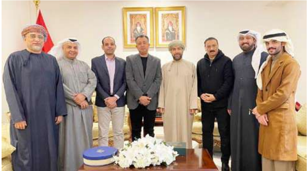
ومتوسطا ممثلي الصحف الكويتية