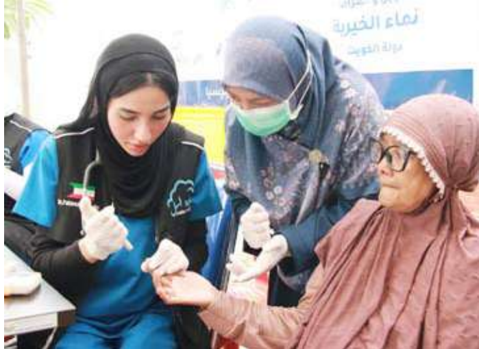
مبادرة لدعم الفئات الأكثر احتياجاً

الفريق ومشاركة متطوعين من دول خليجية في صورة تعكس روح التآخي الإنساني والعمل المشترك لخدمة المجتمعات المتضررة وتلبية احتياجاتها الصحية والمعيشية والتعليمية بما يجسد الرسالة الإنسانية للكويت إلى مختلف بقاع العالم. وشملت البرامج الإنسانية الممتدة عشرة أيام إقامة