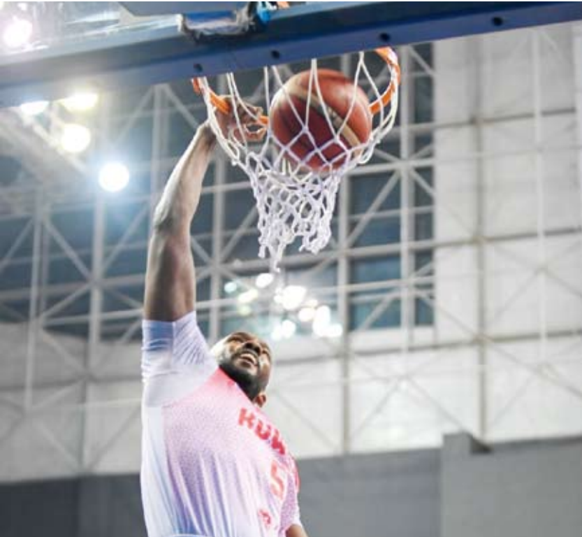
لاعب نادي الكويت يرتقي نحو السلة

العربي وأثبت (العמיד) خلال اللقاء قيمته الفنية من خلال سيطرته على مجريات اللقاء على الرغم من محاولات العربي إلا ان خبرة لاعبي الكويت حسمت المباراة لصالحهم. وفي المباراة الثانية تمكن كازمة من مواصلة ملاحقته لفرق الصدارة بفوزه الثمين على منافسه الصليبيخات بنتيجة