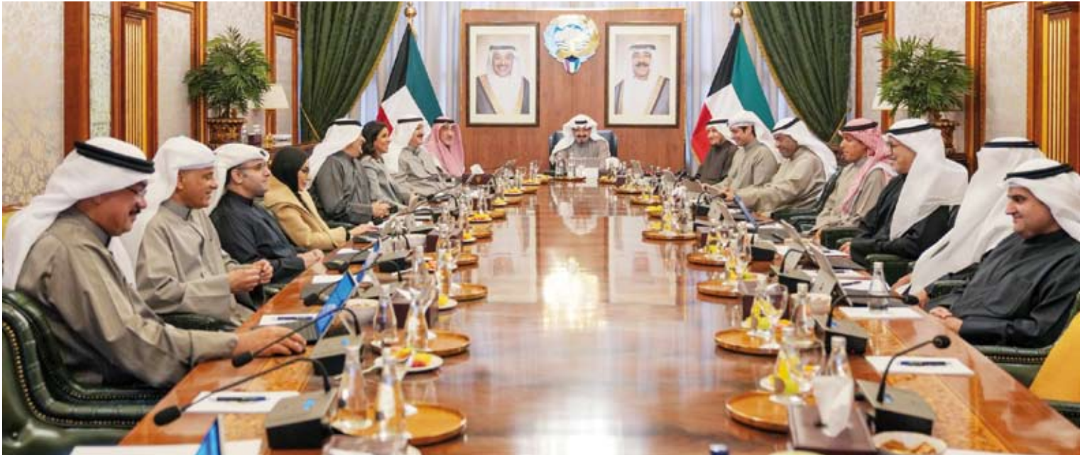
العبد الله مترشدا اجتماع مجلس الوزراء أمس

واعتمد مجلس الوزراء محضر اللجنة العليا لتحقيق الجنسية الكويتية والمتضمن حالات فقد وسحب الجنسية الكويتية من بعض الأشخاص وذلك وفقًا لأحكام المرسوم بالقانون رقم (15) لسنة 1959 بشأن الجنسية الكويتية وتعديلاته، واستعرض مجلس الوزراء عدداً من المواضيع المدرجة على جدول الأعمال وقرر الموافقة عليها كما قرر إحالة عدد منها إلى اللجان الوزارية المختصة لدراستها وإعداد تقارير بشأنها لاستكمال الإجراءات الخاصة لإنجازها.