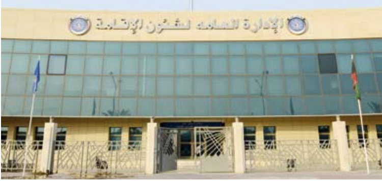
الإدارة العامة لشؤون الإقامة

وفق الضوابط التي يحددها مجلس الوزراء، كما يجوز الترخيص بالإقامة العادية للمستثمرين الأجانب المستوفين للشروط وبناء على كتاب رسمي صادر من الهيئة. وأشار إلى أن اللائحة نصت على السماح للمعاملة المنزلية الحاصلين على إقامة (مادة 20) بالوجود خارج البلاد لمدة لا تتجاوز أربعة أشهر وتسقط الإقامة بعد ذلك في حال عدم تقديم الكفيل بطلب إذن غياب، مبيناً أن القرار لا يطبق على المغادرين قبل تاريخ التطبيق كما حددت اللائحة رسوم سمات الدخول والزيارات بجميع أنواعها بواقع 10 دنانير كوتبة عن كل شهر. وأضاف العميد المطيري أن اللائحة حددت فترة السماح لتسجيل المواليد الأجانب بارية أشهر وبعدها تحسب غرامة بواقع دينارين عن كل يوم في الشهر الأول ثم أربعة دنانير عن كل يوم بعد ذلك، كما نصت اللائحة على ألا يقل سن العامل المتقدم للعمل عن 21 عاماً ولا يزيد عن 60 عاماً. وأضاف أن الإدارة دشنت بالتعاون مع الإدارة العامة لنظم المعلومات بوزارة