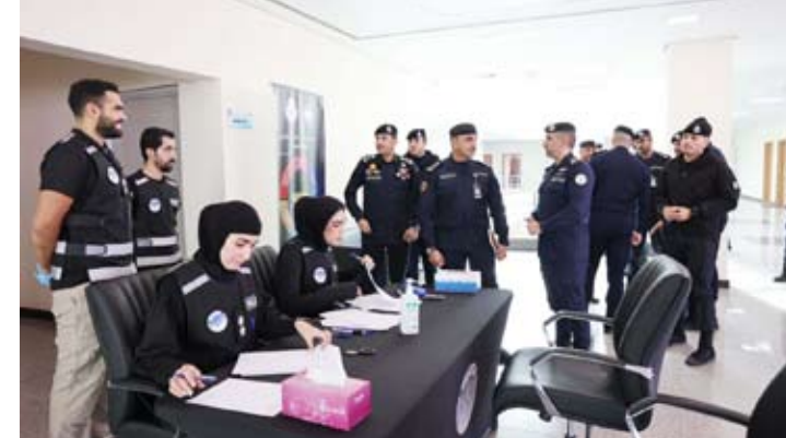
خطة شاملة لتعزيز الانضباط الوظيفي وترسيخ مبدأ القدوة والمسؤولية