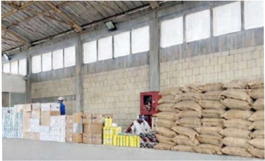
ضبط كميات كبيرة من المواد التموينية

تمكّنت الإدارة العامة للجمارك من ضبط محاولة تهريب كميات كبيرة من المواد التموينية التي يُحظر تصديرها، وذلك أثناء إجراءات التفتيش والرقابة الجمركية في منفذ جمارك السالمى الحدودي وأوصحت الإدارة أن رجال الجمارك قاموا بضبط المواد التموينية المخالفة واتخاذ الإجراءات القانونية اللازمة بحقها، حيث تم حصر الكميات المضبوطة وتصنيفها وفق المحاضر الرسمية المعتمدة، تمهيداً للتصرف بها حسب القوانين واللوائح المنظمة. وقامت الإدارة العامة للجمارك بتسليم المواد التموينية المصادرة إلى وزارة التجارة والصناعة، بعد