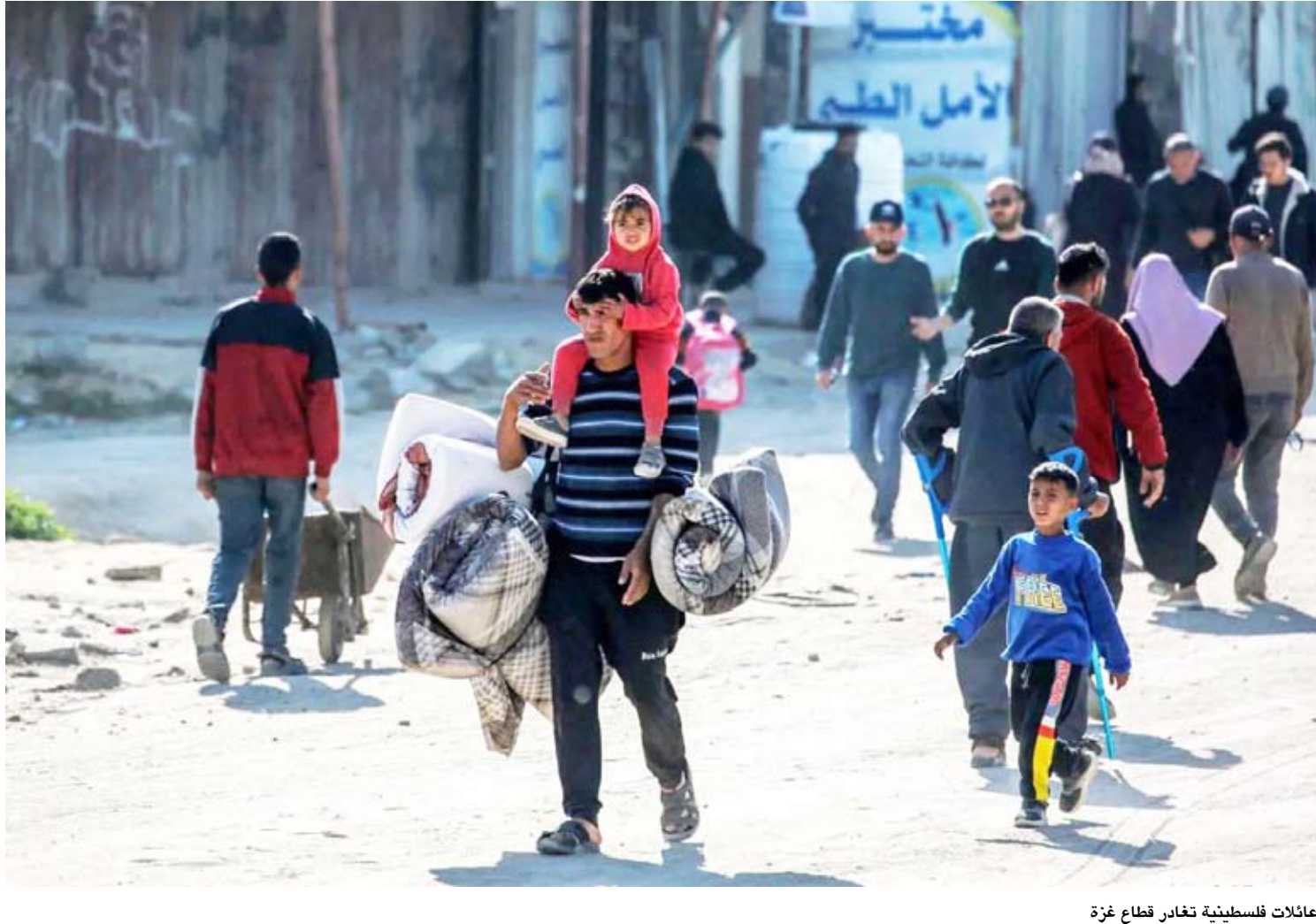
عائلات فلسطينية تغادر قطاع غزة

مواقف مصرية متتالية لليوم الثالث، تشكك فيها مع الاعتراف الإسرائيلي بإقليم «أرض الصومال» الانفصالي بقديشو، الذي تجمعه بالقاهرة اتفاق دفاع مشترك. تلك المواقف المصرية يراها خبراء تحدثوا لـ«الشرق الأوسط»، تصعيداً أفريقياً محسوباً في مواجهة ذلك الاعتراف الإسرائيلي دون أن يصل لصدام، مشيرين إلى أن مصر ستتحرك عبر المؤسسات الدولية والأفريقية والدول المشاطئة للبحر الأحمر، لتوحيد المواقف وتغظيم الضغوط الراقضة، مع عدم استبعاد قيام القاهرة بوساطة لحوار صومالي – صومالي. وطالبت مصر، بعقد جلسة طارئة لمجلس السلم والأمن الأفريقي، لرفض الاعتراف الإسرائيلي بالإقليم الانفصالي أرض الصومال، وذلك في كلمة لوزير الخارجية بدر عبد العاطي، في الجلسة الوزارية لمجلس السلم والأمن الأفريقي، التي عقدت افتراضياً، وفق بيان لـ«الخارجية المصرية». وأعاد عبد العاطي في كلمته «تأكيد رفض مصر التام للاعتراف الإسرائيلي بما يسمى أرض الصومال بوصفه انتهاكاً صارخاً لمبادئ القانون الدولي ومبادئ الأمم المتحدة والقانون التأسيسي للاتحاد الأفريقي، ويقوّض أسس السلم والأمن الإقليمي والدولي، وبصفة خاصة في منطقة القرن الأفريقي». وطالب عبد العاطي بـ«عقد جلسة طارئة لمجلس السلم والأمن الأفريقي لتناول هذا التطور الخطير، ولتأكيد وحدة وسلامة الأراضي الصومالية ورفض الإجراءات الأحادية الإسرائيلية التي تهدد السلم والأمن الإقليميين والدولين».