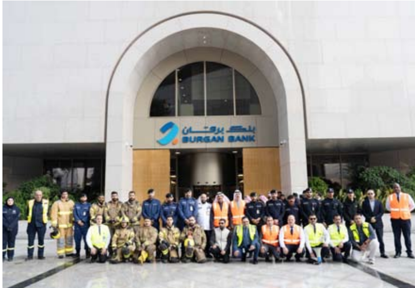
فريق البنك المشارك في عملية الإخلاء

بشكل عملي ومستمر، لضمان قدرتنا على الاستجابة السريعة والمظلمة لأي ظرف طارئ، بما يحافظ على استقرار بيئة العمل واستمرارية العمليات.»