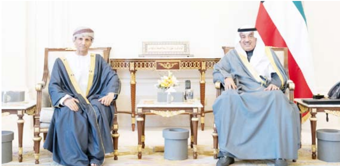
سمو ولي العهد يستقبل د. محمد بن عوض الحسان

رجب طيب أردوغان رئيس الجمهورية التركية الصديقة، خلال اتصال هاتفي، مساء أمس الأول. كما جرى خلال الاتصال استعراض العلاقات الثنائية بين دولة الكويت وجمهورية تركيا الصديقة لما فيه مصلحة البلدين والشعبين الصديقين بالإضافة إلى مناقشة أبرز المستجدات وبحث آخر التطورات والأوضاع الإقليمية والدولية.