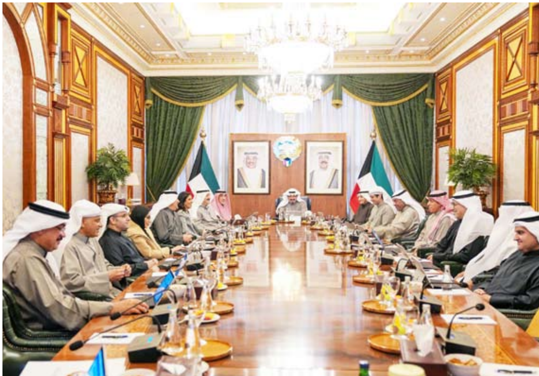
سمو رئيس مجلس الوزراء مقرشاً اجتماع المجلس أمس

انتبهوا .. الفحوصات الدورية والعشوائية، ستكون أحد متطلبات الترقية، وتولي المناصب الإشرافية، والتعيين، وإجراءات التحقيق.