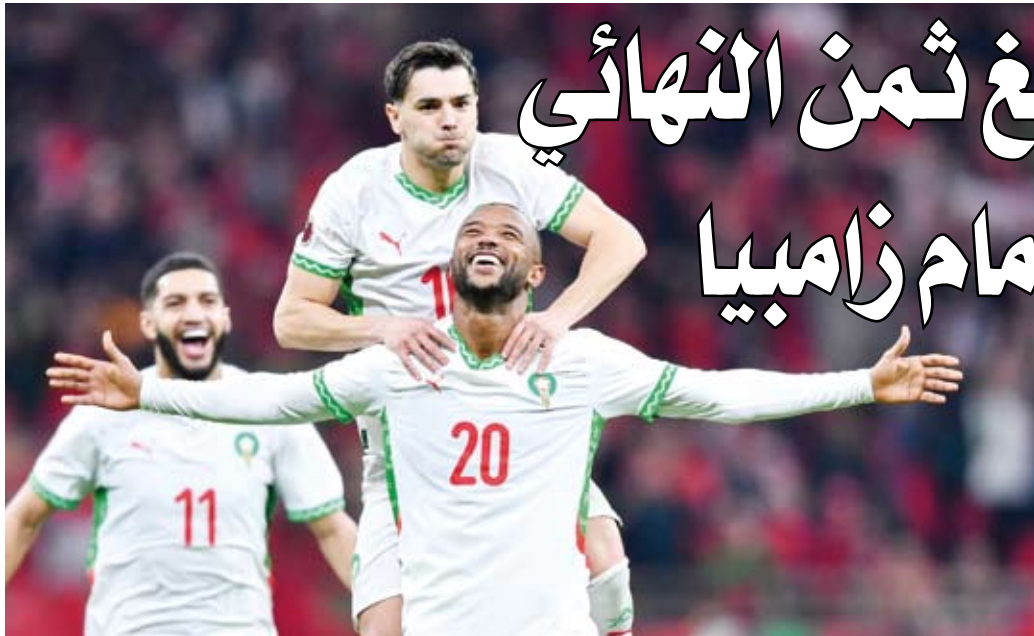
فرحة لاعبي المغرب بالفوز

بعد خمس دقائق فقط بواسطة تشامادو في مباراة اتسمت بالإفارة والندية. وبهذه النتيجة رفع منتخب كوت ديفوار والكاميرون رصيدهما إلى أربع نقاط لكل منهما ليواصل تقاسم صدارة المجموعة مع اقتراب الحسم في الجولة الثالثة من دور المجموعات.