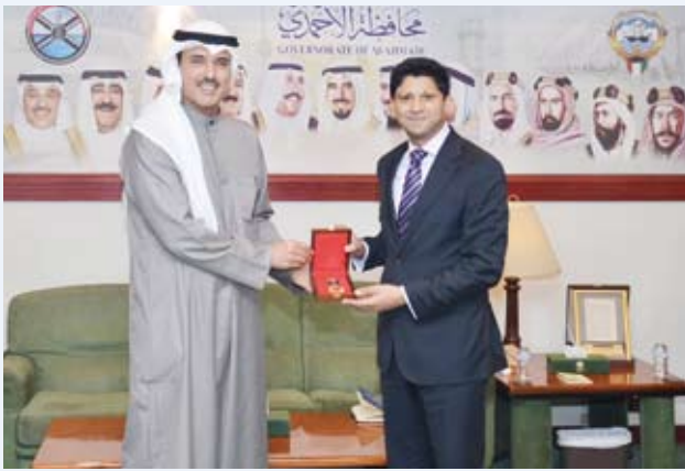
محافظ الأحمد يهدي سفير المملكة المتحدة درعا تذكارية

استقبل محافظ الأحمد السيد حمود الجابر، بمكتبه في ديوان عام محافظة الأحمد، صباح أمس، سفير المملكة المتحدة لبريطانيا وأيرلندا الشمالية لدى دولة الكويت السفير قدسي رشيد، بحضور السكرتير السياسي بوشكار كابول، حيث جرى التعارف وتبادل الأحاديث الودية التي تناولت العلاقات الثنائية بين البلدين وسبل تعزيزها في جميع المجالات، كما رحب المحافظ بالسفير، متمنياً له التوفيق في مهام عمله والدفع بعلاقات البلدين إلى آفاق أرحب.