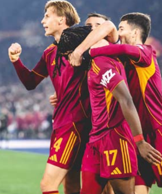
احتفالية لاعبي روما بالفوز على جنوا