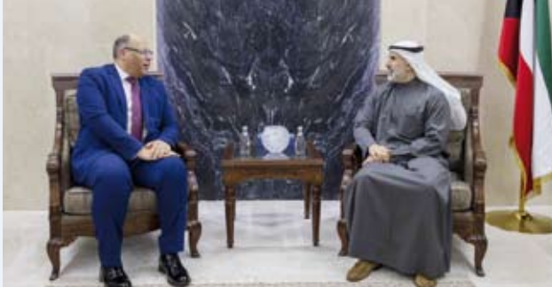
السفير الشيخ جراح الجابر يستقبل سفير مصر محمد جابر أبو الوفا

استقبل نائب وزير الخارجية السفير الشيخ جراح الجابر، سفير جمهورية مصر العربية الشقيقة لدى دولة الكويت محمد جابر أبو الوفا، وتم خلال اللقاء بحث سبل تطوير العلاقات الثنائية بين البلدين في كافة المجالات بالإضافة إلى أبرز المستجدات على الساحتين الإقليمية والدولية.