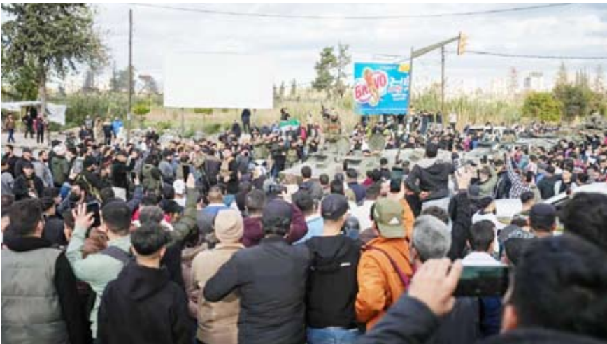
انتشار قوات الأمن السورية في اللاذقية

قديمة سيتم العمل على استبدال الجديدة بها، ولذلك لا داعي للإلحاح على تبديلها لأن ذلك قد يضرر بسعر صرف الليرة السورية.. مشدداً على أن البلاد تحتاج إلى حالة من الهدوء وقت استبدال العملة، وأن المصرف المركزي أوضح أن ذلك سيتم وفق جدول زمني محدد.