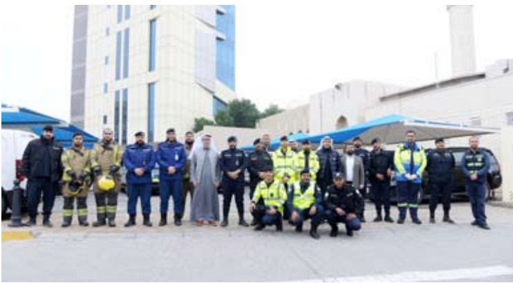
فريق إدارة الأمن في بوبيان

وأضاف أن التفاعل الإيجابي والانضباط الذي لمسهنا خلال تنفيذ عملية الإخلاء يعكس مستوى الوعي والمسؤولية لدى فرق العمل.