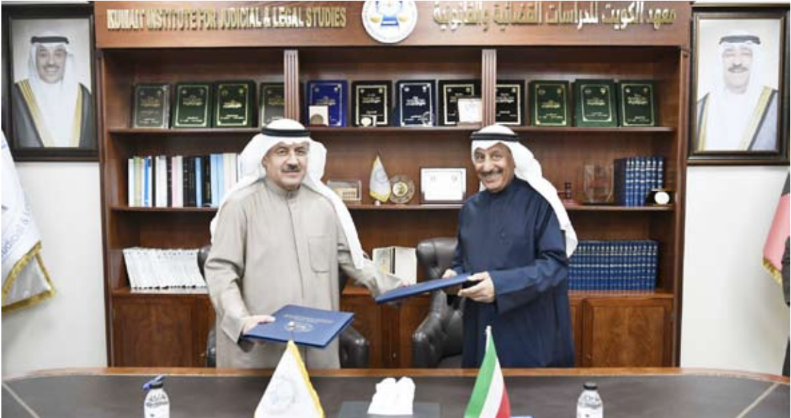
المسعد والمغاسس خلال توقيع مذكرة التفاهم