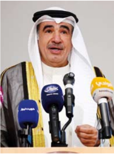
سعود البابطين متحدثاً

نظمت مؤسسة عبدالعزيز سعود البابطين الثقافية، بالتعاون مع مجمع اللغة العربية في لبنان والتنسيق مع السفارة اللبنانية لدى البلاد، ندوة بعنوان (تمكين اللغة العربية وتعزيز حضورها.. مبادرات معاصرة) بمشاركة نخبة من الأكاديميين والخبراء العرب.