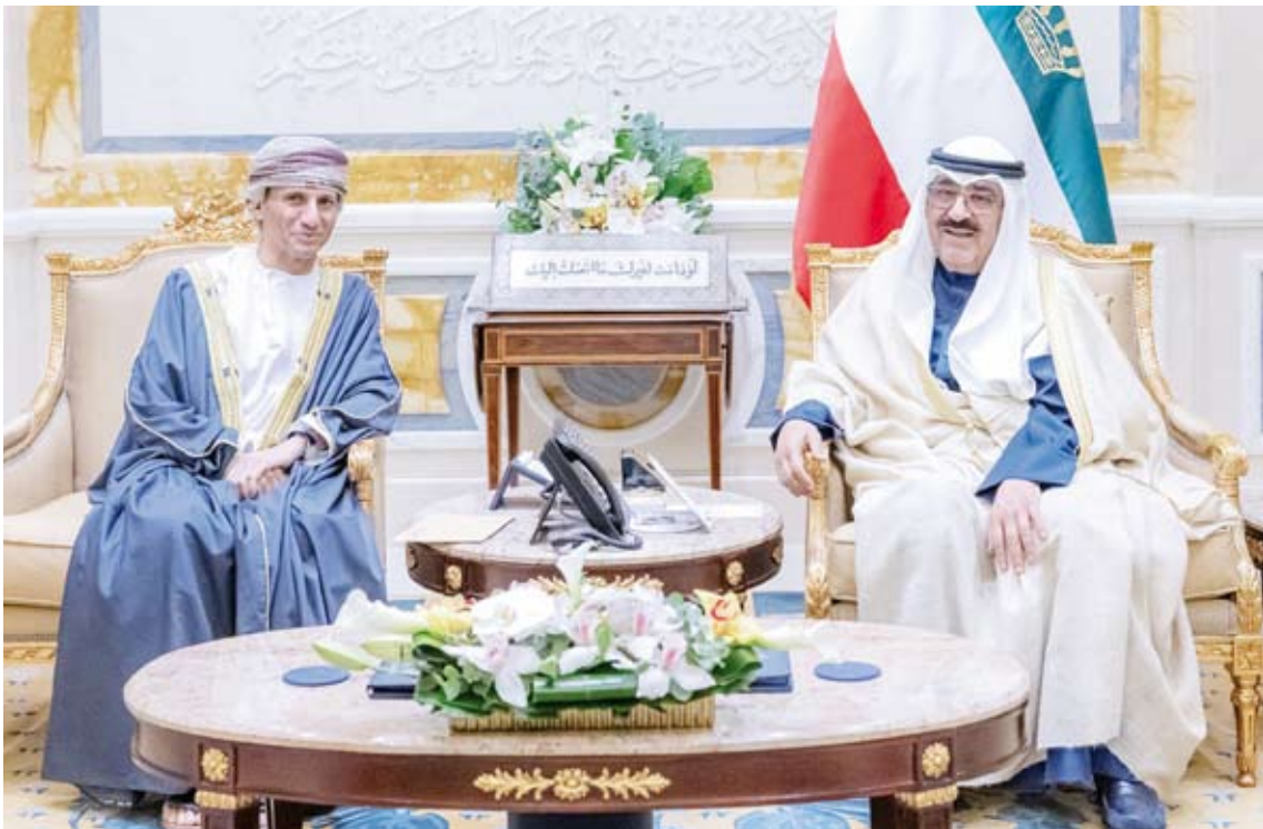
سمو أمير البلاد يستقبل السفير د. محمد بن عوض الحسان

العراق رئيس بعثة الأمم المتحدة لمساعدة العراق، السفير الدكتور محمد بن عوض الحسان، وذلك بمناسبة انتهاء عمل وولاية البعثة.