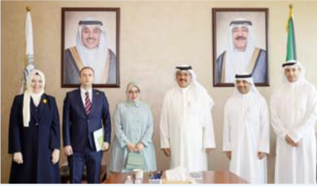
وزير التربية مستقبلاً سفيرة تركيا والوفد المرافق

استقبل وزير التربية سيد جلال الطبطبائي، أمس، سفيرة الجمهورية التركية لدى دولة الكويت طويبي نور سونمز، بحضور نائب السفير عمر شيمشك والمستشار التعليمي بالسفارة التركية روضة توتناش. وذكرت «التربية» في بيان صحفي، أن الجانبين أكدا خلال اللقاء عمق ومثانة العلاقات الثنائية التي تجمع الكويت وتركيا وحرصهما على توسيع مجالات التعاون في القطاع التعليمي بما يدعم تطوير المنظومة التعليمية ويعزز الشراكة القائمة بين البلدين.