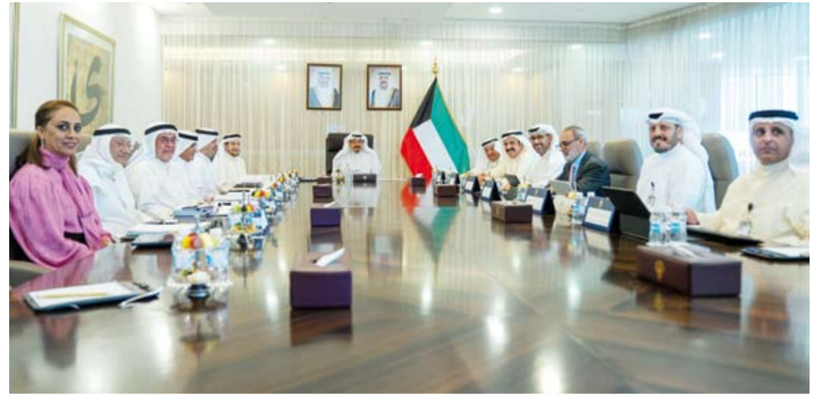
سمو الشيخ أحمد العبدالله يترأس الاجتماع

ترأس سمو الشيخ أحمد العبدالله رئيس مجلس الوزراء، أمس، الاجتماع 130 (2/2026) للمجلس الأعلى للبتترول. وناقش المجلس البنود المدرجة على جدول أعماله والتي تشمل المشاريع المعتمدة من قبل مؤسسة البترول الكويتية وشركاتها التابعة واستراتيجية المرتبطة بهذه المشاريع.