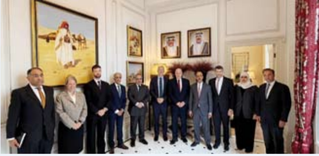
السفير بدر المنيع يستقبل وزير الدفاع والقوات المسلحة البريطاني بحضور عدد من سفراء دول مجلس التعاون

استقبل سفير دولة الكويت لدى المملكة المتحدة لبريطانيا العظمى وإيرلندا الشمالية بدر المنيع، أول أمس، كلا من وزير الدولة لشؤون الدفاع البريطاني اللورد فيرونون كوكر، ووزير القوات المسلحة البريطاني اليستار كارنس وعدد من كبار مسؤولي وزارة الدفاع البريطانية، وذلك بحضور عدد من سفراء دول مجلس التعاون لدول الخليج العربية في لندن. وذكرت سفارة دولة الكويت في لندن، أنه تم خلال اللقاء مناقشة العلاقات الدفاعية الخليجية - البريطانية وبحث سبل تعزيزها وتطويرها. كما تم الإشادة بمستوى التعاون الدفاعي القائم بين دولة الكويت والمملكة المتحدة والذي يعكس مثانة العلاقة التاريخية التي تجمع البلدين الصديقين.