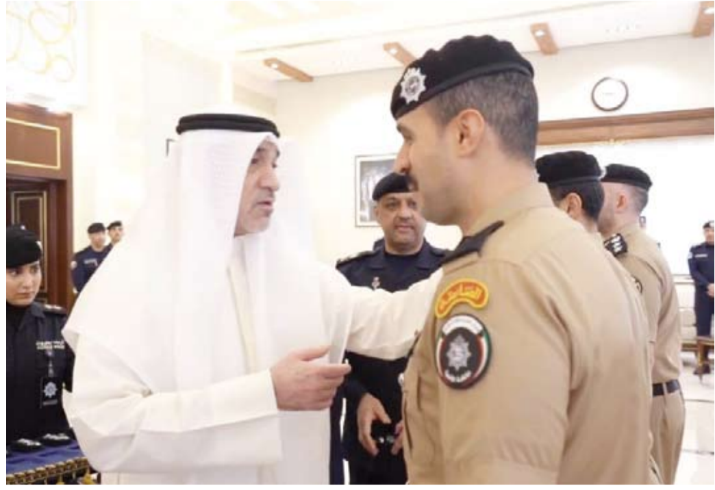
الشيخ فهد اليوسف يقبل أحد الضباط رتبته الجديدة

قيد النائب الأول لرئيس مجلس الوزراء وزير الداخلية الشيخ فهد اليوسف، أمس، عدداً من الضباط رتبهم الجديدة، وذلك في إطار حرص وزارة الداخلية على دعم منتسبيها وتحفيزهم. وقالت (الداخلية) في بيان صحفي: إن الشيخ فهد اليوسف قد الضباط رتبهم الجديدة بحضور وكيل وزارة الداخلية اللواء عبدالوهاب الوهيب وعدد من الوكلاء المساعدين ورؤساء القطاعات الأمنية.