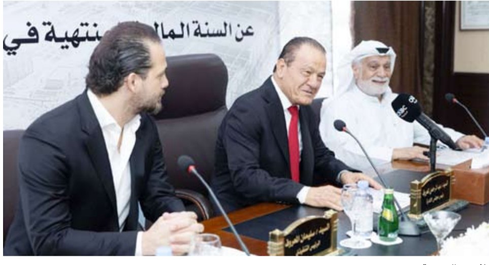
جانب من العمومية

◆ العبد الله: «المشركة» تسعى إلى التقيد بمعايير وسلوكيات الحوكمة لتكون منهجاً رئيسياً لأعمالها