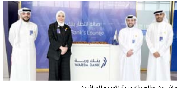
جانب من جناح بنك وربة لتوديع المسافرين

في إطار حرصه المستمر على تعزيز حضوره المجتمعي والتفاعل المباشر مع مختلف شرائح المجتمع، أطلق بنك وربة مبادرة خاصة لتوديع المسافرين تزامناً مع عودة الرحلات الجوية عبر مبنى الركاب T4 في مطار الكويت الدولي، وذلك في خطوة تجسد اهتمام البنك بمشاركة عملائه لحظاتهم المختلفة، وتؤكد التزامه بتقديم تجربة متكاملة تجمع بين القرب الاجتماعي والخدمة المصرفية المتطورة.