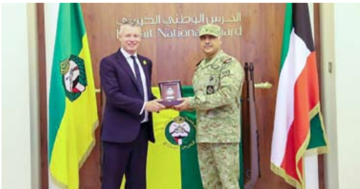
تكريم للوزير البريطاني

استقبل وكيل الحرس الوطني الفريق الركن حمد سالم البرجس وزير الدولة لشؤون الجاهزية والدفاع البريطانية لوك بولارد، وسفير المملكة المتحدة لدى الكويت قديسي رشيد والوفد المرافق لهما، وذلك في إطار تعزيز علاقات التعاون المشترك وتبادل الخبرات بين الجانبين.