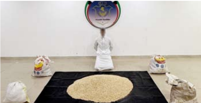
التمتع مع المضبوطات

وأكدت استمرار جهودها في التصدي لآفة المخدرات وتعزيز التعاون الإقليمي والدولي في ملاحقة مهربيها مشددة على تطبيق القانون بكل حزم لحماية المجتمع من هذه الآفة الخطيرة.