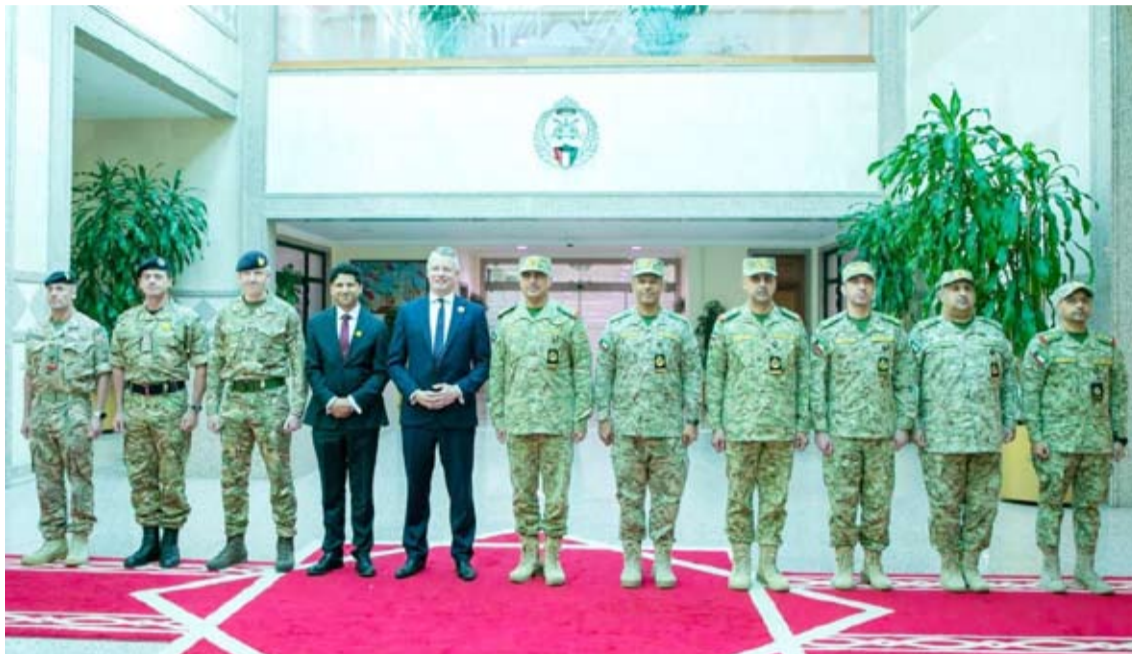
الوزير البريطاني والسفير قديسي رشيد وقياديو «الحرس»

الزيارة أهمية استمرار التعاون في مجال الجاهزية والصناعات الدفاعية بين المملكة المتحدة ودولة الكويت. شملت الزيارة أيضاً لقاءات مع عناصر القوات البريطانية الموجودة في دولة الكويت، حيث أشاد الوزير بدورهم إلى جانب القوات الكويتية في حماية المدنيين والبنية التحتية الحيوية خلال التهديدات الأخيرة من الصواريخ والطائرات المسيّرة قبل وقف إطلاق النار.