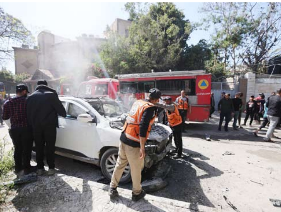
سيارة تعرضت لضربة بصاروخ صيوني

نشرت صحيفة «الشرق الأوسط» تفاصيل المقترح الذي صاغه ممثلون لـ«مجلس السلام»، بينهم المندوب السامي للمجلس، نيكو لاي ميلادينوف، والوساطة من الدول الثلاث، مصر وقطر وتركيا، إلى جانب الولايات المتحدة، بشأن قطاع غزة، وخاصة نزع السلاح منه. وتظهر الوثيقة المعنونة بأنها «خريطة طريق» لإتمام تنفيذ خطة الرئيس الأميركي دونالد ترمب الشاملة للسلام بغزة. 15 يوماً للتعامل مع تنفيذ بنود المرحلة الثانية من اتفاق وقف إطلاق النار الذي كان دخل حيز التنفيذ في العاشر من أكتوبر (تشرين الأول) 2025. وبحسب مصدر قيادي من «حماس»، تحدث لـ«الشرق الأوسط»، فإن هذا المقترح نقل إلى إسرائيل أيضاً، وستعقد اجتماعات في القاهرة، قد تبدأ، لبحث ردود جميع الأطراف، بما فيها حركته والفصائل، على ما ورد فيها. وامتنع المصدر عن توضيح موقف حركته الذي ستقدمه حول ذلك بعدما اجرت مشاورات داخلية بشأنها. وكانت مصادر أخرى ذكرت أن ميلادينوف سيزور إسرائيل قبل الوصول إلى مصر، لإجراء مناقشات حول الموقف الإسرائيلي في الورقة المقدمة. وتشير الوثيقة إلى تشكيل لجنة سميت بـ«التحقق من التنفيذ»، سيتم إنشاؤها من قبل الممثل الأعلى لغزة، تتالف من الدول الضامنة، وقوة الاستقرار الدولية، و«مجلس السلام»، لضمان تنفيذ الأطراف ما يقع على عاتقها، على أن يتم تدعيم هذه اللجنة من خلال آلية مراقبة معززة.