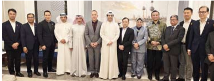
السفير ناصر المطيري متوسلاً السفراء والدبلوماسيين

تعزيز التعارف والتواصل بين البعثات الدبلوماسية الآسيوية. وفي كلمة له خلال المناسبة، رحّب المطيري بالسفراء الجدد، متمنياً لهم التوفيق والنجاح في مهامهم الدبلوماسية في دولة الكويت، مؤكداً أن عملهم في البلاد يمثل فرصة مميزة في بيئة دبلوماسية نشطة ومنفتحة.