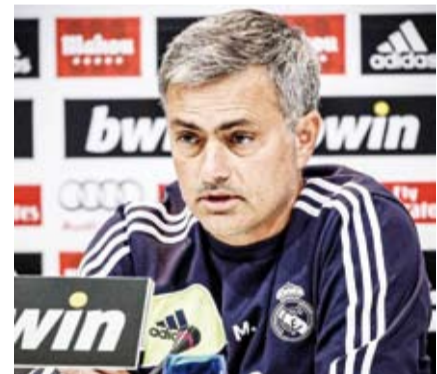
المدرب البرتغالي جوزيه مورينيو

يبقى المدرب البرتغالي جوزيه مورينيو المرشح المفضل لرئيس نادي ريال مدريد فلورنتينو بيريز لتولي المهمة خلفاً للمدرب الحالي الفارو أربيلوا بعد نهاية الموسم الجاري. وذكرت شبكة «ذا أتلتيك» أن مورينيو يبقى المرشح الأبرز، لكن شخصيته المخيرة للجدل تثير علامات استفهام بشأن إمكانية عودته إلى ريال مدريد بدءاً من الموسم المقبل.