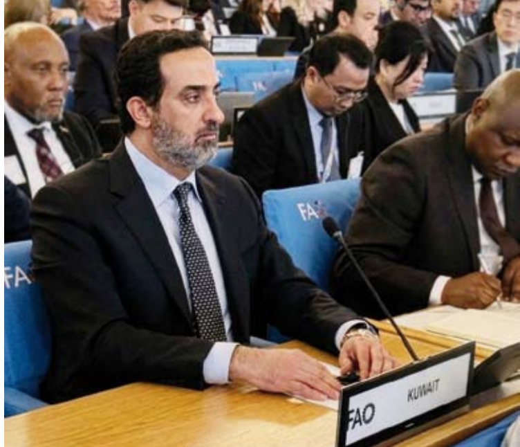
سفير الكويت في روما ناصر القحطاني خلال ترؤسه وفد الكويت

ترتب عليها من تهديد مباشر لأمن الملاحه الدولية وسلامة سلاسل الإمداد. وأكد أن مثل هذه الأعمال تمثل انتهاكاً صارخاً للالتزام الدولي والحفاظ على الجهود الدولية الرامية إلى الحفاظ على استقرار الأسواق وضمان الأمن الغذائي العالمي. وشدد السفير القحطاني على أن أمن وسلامة الممرات البحرية الدولية وفي مقدمتها مضيق هرمز تمثل ركيزة أساسية لضمان انسيابية التجارة العالمية واستقرار الأسواق.