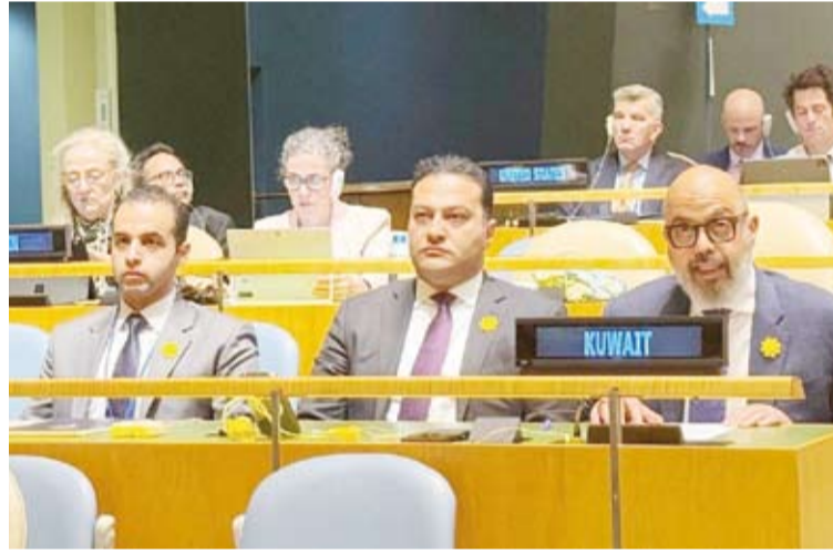
السفير طارق البنائي يتحدثاً

ومقاصدها. وراى السفير البنائي أن استمرار مثل هذه الأعمال يبرز الحاجة الملحة لمعالجة الترابط الوثيق بين نزع السلاح والأمن الإقليمي بشكل أكثر جدية وواقعية. وأكد حق جميع الدول في تطوير واستخدام الطاقة النووية للأغراض السلمية وفقاً لأحكام المعاهدة وتعزيز دور الوكالة الدولية للطاقة الذرية باعتبارها الجهة الوحيدة المختصة بالتحقق والرقابة. ولفت إلى أن الواقع الدولي الراهن يظهر بوضوح وجود اختلال خطير في تنفيذ التزامات المعاهدة، إذ تستمر بعض الدول النووية في تحديث ترساناتها وتطوير عقائدها العسكرية القائمة على الردع النووي في تناقض صريح مع نص وروح المادة السادسة التي تلزمها بالسعي الجاد نحو نزع السلاح النووي بشكل كامل وغير مشروط.