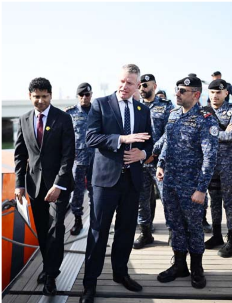
ويستمع لشرح من الشيخ مبارك الصباح

◆ نشر أنظمة «رابيد سنترى» و«أوركوس» لتعزيز قدرة الكويت على رصد المسيرات والصواريخ والتصدي لها