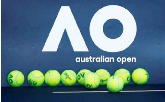
بطولة أستراليا المفتوحة للتنس مهددة بسبب كورونا

قراره بتأجيل العودة بانه «القرار الصحيح من أجل تحقيق عودة جيدة إلى المنافسات».