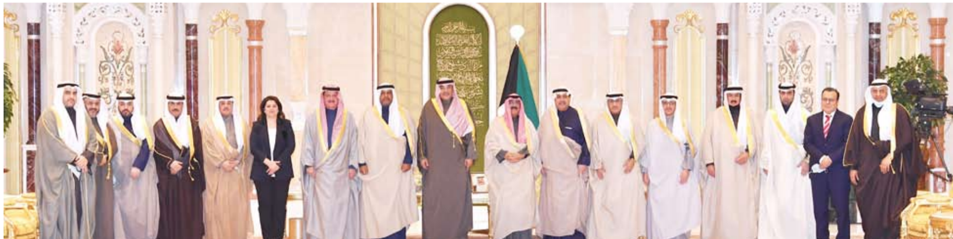
الحكومة الجديدة بعد أداء اليمين الدستورية أمام سمو ولي العهد في قصر بيان