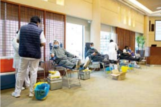
حملة التبرع بالدم

إن التزامنا الإنساني تجاه هذا المبادرة ما هو إلا خلق ثقافة التبرع واستمراريتها في المجتمع، ويتجلى ذلك في حملة هذا العام "تبرع بالدم وانقذ حياة" وهي مبادرة مستدامة للتبرع بالدم لمساعدة المرضى والحجاجين، وبدورنا نشكر جميع من شارك و ساهم في انجاح هذه الحملة مما يعكس بالاجاب في دعم خطة القطاع الصحي بدولة الكويت".