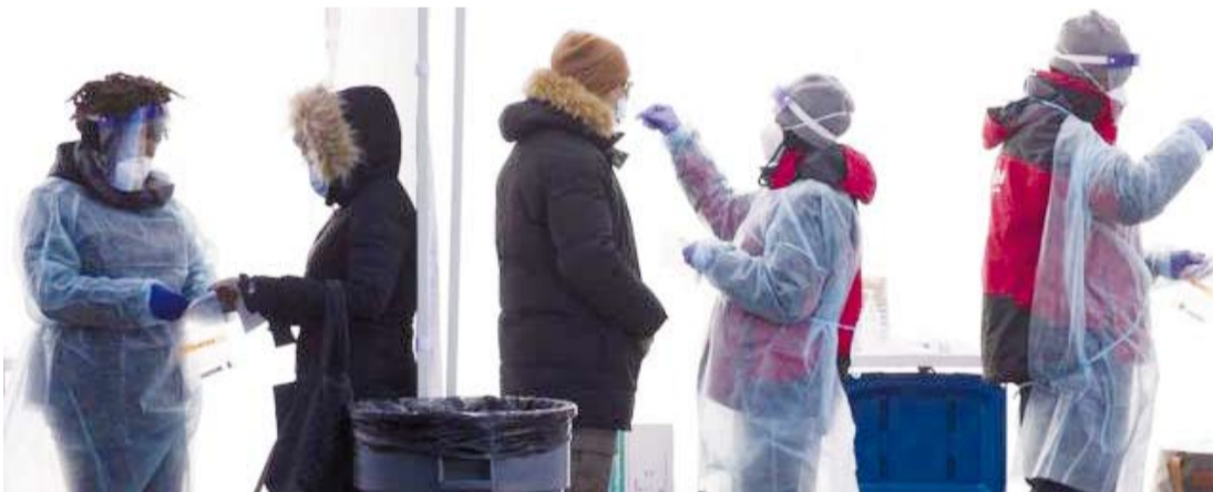
أعلى حصيلة يومية لإصابات كورونا في أميركا وفرنسا ودول أخرى

تفشي الوباء بلغت 265,427 إصابة جديدة، بحسب جامعة جونز هوبكنز. كما سجلت فرنسا أمس أعلى حصيلة إصابات يومية بـ«كوفيد-19»- تجاوزت للمرة الأولى عتبة مئتي ألف إصابة خلال 24 ساعة، بحسب أرقام كشفها وزير الصحة أوليفييه فيران.