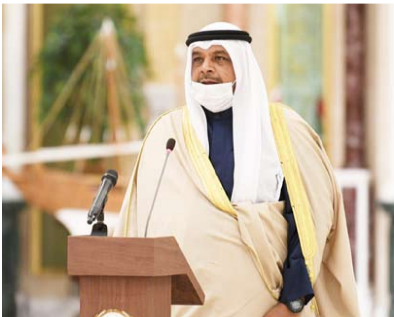
الشيخ أحمد المنصور

أعرب نائب رئيس مجلس الوزراء وزير الداخلية، الشيخ أحمد المنصور، عن خالص شكره وامتنانه لسمو أمير البلاد القائد الأعلى للقوات المسلحة وسمو ولي العهد الأمين وسمو رئيس مجلس الوزراء على منحه الثقة الغالية واختياره لتولي حقيبة وزارة الداخلية، معتبراً إياها وسام فخر واعتزاز.