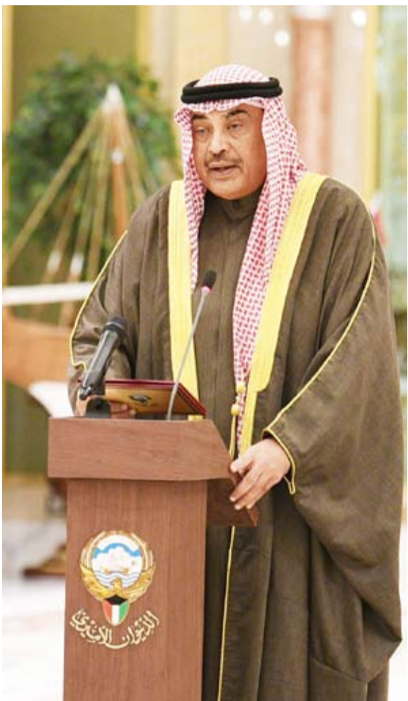
سمو الشيخ صباح الخالد يؤدي اليمين الدستورية أمام سمو ولي العهد