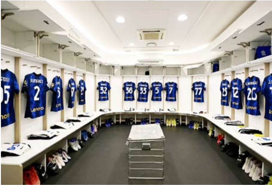
صندوق الاستثمارات العامة السعودي يفكر في إنترميلان

ونكرت الصحيفة، حسب ما نشرناه يوم الأربعاء الموافق 13 أكتوبر 2021، أن الصندوق لديه الآن هدفاً جديداً في دوري الدرجة الأولى الإيطالي، فإذا كانت صفقة نيوكاسيل بلغت 350 مليون يورو، فإن سعر إنتر ميلان قد يصل إلى مليار يورو. وحال تم المضي قدماً في هذه الصفقة بالفعل، سيشكل إنتر ميلان تهديداً لأندية أخرى كبرى بـ«السيري آ»، مثل يوفنتوس وميلان وروما، مع وجود موارد مالية ضخمة تحت إمرته. ووفق مصادر صحافية، تعيش شركة سوينينغ الصينية، حالة غير مستقرة مالياً، في ظل القيود الجديدة التي تفرضها الحكومة الصينية، على الاستثمار في كرة القدم، ما دفعها أخيراً لإيقاف نشاط فريق جيانغسو الصيني الذي تملكه أيضاً. وترغب مجموعة سوينينغ، في الحصول على مبلغ 200 مليون من بيع أسهم إنتر ميلان، لإنهاء أزمةها الاقتصادية التي تمر بها.