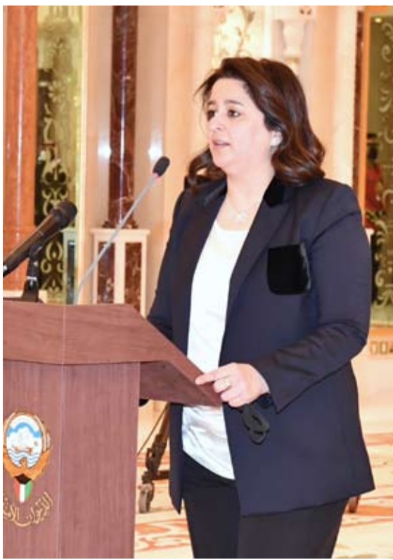
د. رنا الفارس

أعربت وزيرة الدولة لشؤون البلدية ووزيرة الدولة لشؤون الاتصالات وتكنولوجيا المعلومات، الدكتورة رنا الفارس، عن اعتزازها بالثقة السامية التي منحها سمو أمير البلاد وسمو ولي العهد وسمو رئيس مجلس الوزراء لتولي حقيبة (البلدية) و (الاتصالات). وقالت الفارس في بيان صحفي أمس، عقب أدائها القسم الدستوري: إن "هذا التكليف الوطني أمانة غالية نسال الله سبحانه أن يعيننا عليها إذ سنحرص بإذن الله على ترجمة اهتمام القيادة السياسية بضرورة الاستمرار في تطبيق التحول الرقمي للخدمات الحكومية والعمل نحو الإصلاح والتطوير لكل ما يخدم الوطن والمواطن". وأضافت أن "هذه المسؤولية تعد مهمة وطنية أسأل الله فيها التوفيق لتحقيق رؤى القيادة السياسية وطموحات الشعب الكويتي في المرحلة المقبلة عبر مواصلة العمل بيدا بيد مع اخواني في السلطة التشريعية والتنفيذية". وأكدت الفارس الحرص على استكمال الخطط والتطلعات نحو تطبيق التنمية وتعزيز الإصلاح خاصة على مستوى السير نحو رؤية الدولة في التحول الرقمي والإرتقاء بتصنيف دولة الكويت في المؤشرات الإقليمية والعالمية علاوة على الدفع بوزارة الدولة لشؤون البلدية في السعي نحو التطوير والإرتقاء بجميع الخدمات الموجهة للمواطن ورسم الصورة الحضارية للكويت على الصعيد العمراني والخدمي. ووجهت شكرها لجميع العاملين في وزارة الأشغال العامة والهيئة العامة للطرق والنقل البري على جهودهم خلال العامين الذين قضتهما وزيرة للأشغال مشيدة بمساعيهم نحو العمل والاجتهاد في ظل تحديات كبيرة وفي ظروف صعبة آتيتوا خلالها مثابرتهم ومسارعة الوقت نحو الإنجاز والإصلاح.