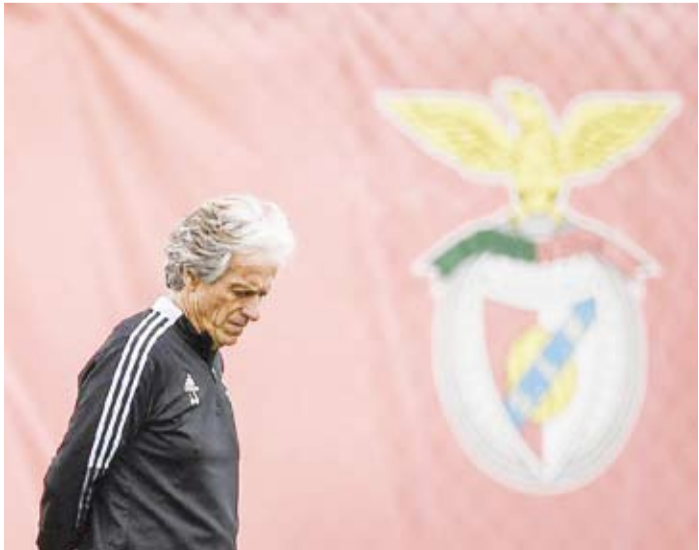
جورج جيزوس المدرب القال بنفيكا

أعلن مانشستر سيتي المنافس في الدوري الإنجليزي الممتاز لكرة القدم، الثلاثاء (28 ديسمبر 2021)، أن مهاجمه الإسباني فيران توريس أكمل إجراءات الانضمام بشكل دائم إلى برشلونة.