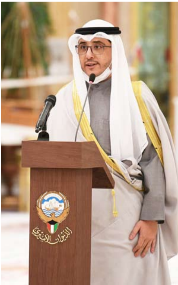
الشيخ أحمد ناصر المحمد

وتضرع إلى المولى عز وجل «أن يديم على وطننا نعمة الأمن والأمان والاستقرار وأن يوفق الجميع لما فيه خير الوطن».