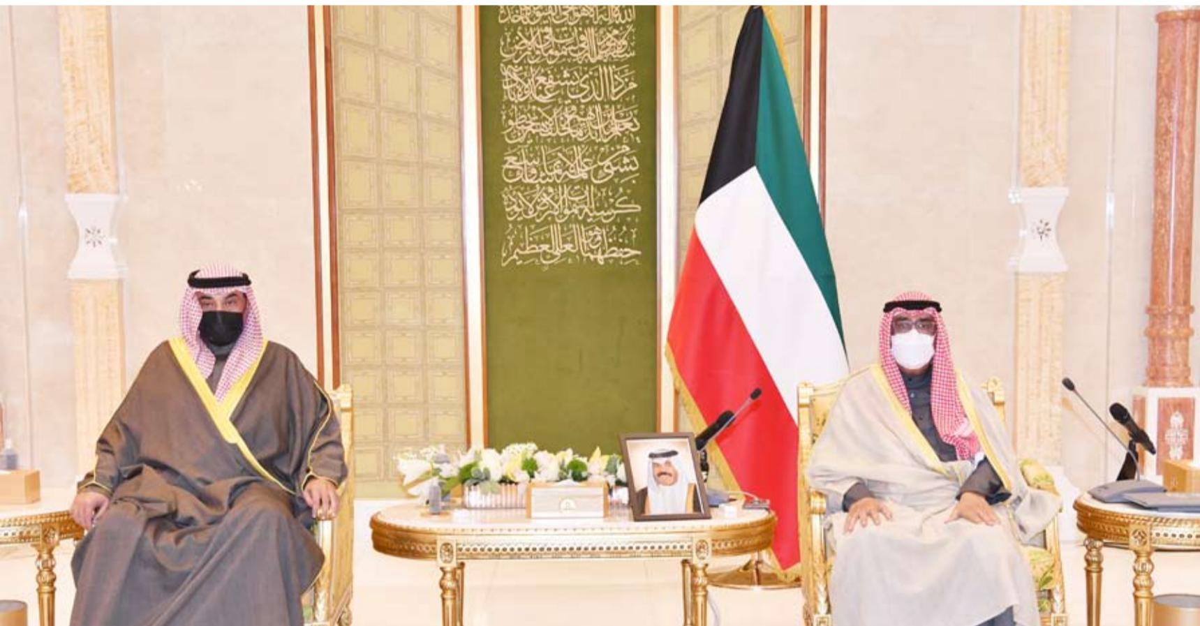
سمو ولي العهد وسمو رئيس مجلس الوزراء

استقبل سمو ولي العهد الشيخ مشعل الأحمد، بقصر بيان، صباح أمس، سمو الشيخ صباح الخالد رئيس مجلس الوزراء لأداء اليمين الدستورية بمناسبة تعيينه رئيساً لمجلس الوزراء، كما قدم لسموه الوزراء كلاً من: حمد جابر العلي الصباح نائباً لرئيس مجلس الوزراء ووزيراً للدفاع. — أحمد منصور الأحمد الصباح نائباً لرئيس مجلس الوزراء ووزيراً للدخلية. — الدكتور محمد عبداللطيف الفارس نائباً لرئيس مجلس الوزراء ووزيراً للنظف ووزيراً للكهرباء والماء والطاقة المتجددة. — عيسى أحمد محمد حسن الكندري وزيراً للأوقاف والشؤون الإسلامية. — الدكتور أحمد ناصر المحمد الصباح وزيراً للخارجية ووزير دولة لشؤون مجلس الوزراء. — الدكتور رنا عبدالله عبدالرحمن الفارس وزير دولة لشؤون البلدية ووزير دولة لشؤون الاتصالات وتكنولوجيا المعلومات. — الدكتور علي فهد المصطفى وزيراً للتربية ووزيراً للتعليم العالي والبحث العلمي. — جمال هاضل سالم الجلاوي وزيراً للعدل ووزير دولة لشؤون تعزيز النزاهة. — الدكتور حمد أحمد روح الدين وزيراً للإعلام والثقافة. — الدكتور خالد مهوس سليمان السعيد وزيراً للصحة. — عبدالوهاب محمد الرشيد وزيراً للمالية ووزير دولة للشؤون الاقتصادية والاستثمار. — فهد مطلق نصار الشريهان وزيراً للتجارة والصناعة. — مبارك زيد العرو المطيري وزيراً للشؤون الاجتماعية والتنمية المجتمعية ووزير دولة لشؤون الإسكان والتطوير العمراني. — محمد عبيد الراحي وزير دولة لشؤون مجلس الأمة. حيث أدوا اليمين الدستورية أمام سموه بمناسبة تعيينهم في مناصبهم الجديدة.