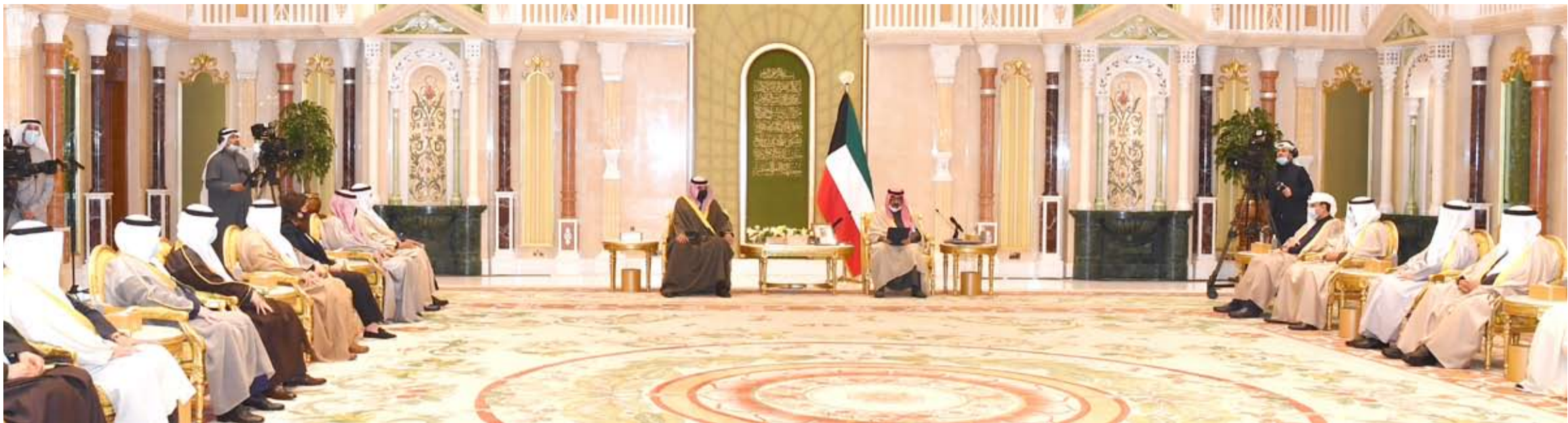
جانب من لقاء سمو ولي العهد مع الحكومة الجديدة