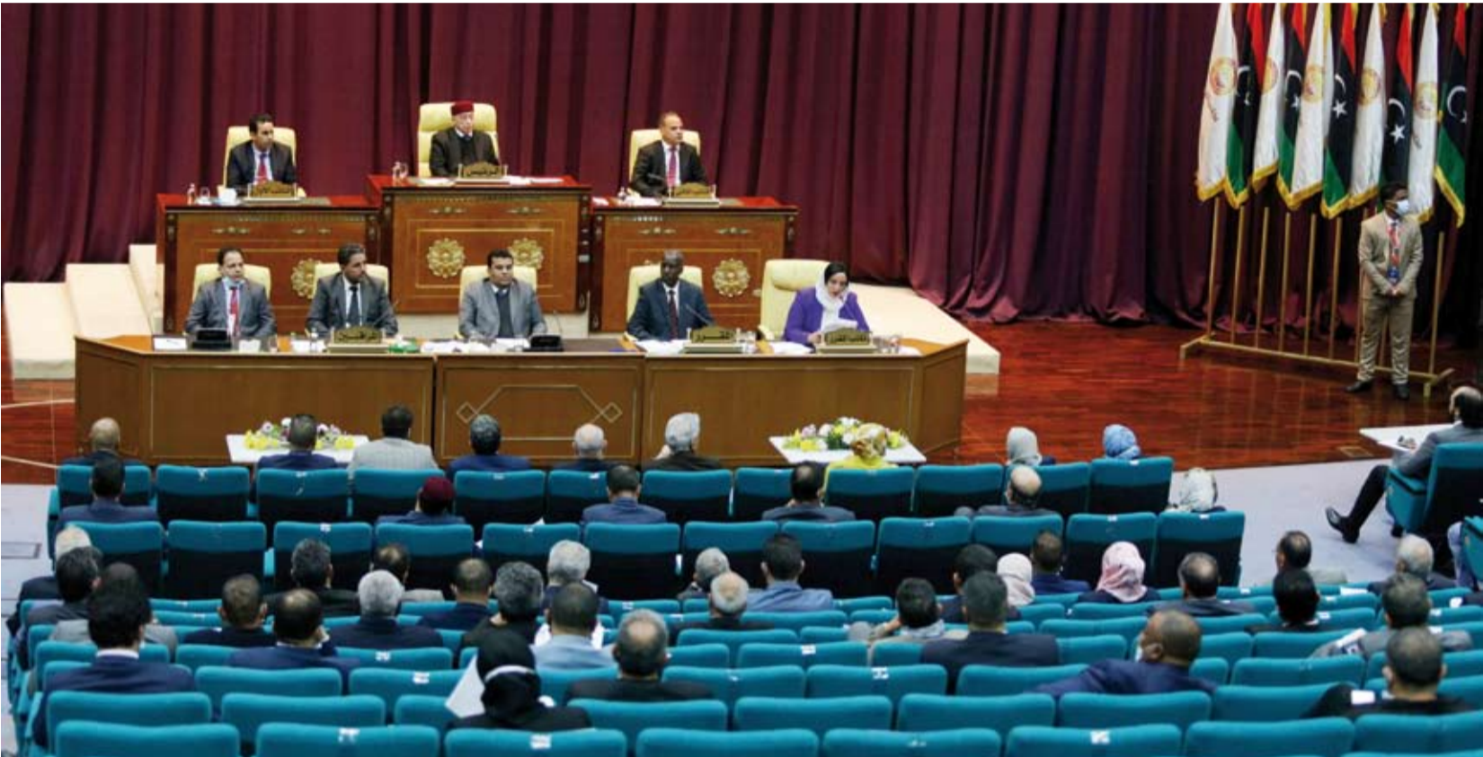
مجلس النواب الليبي

بدا أن مصير السلطة الانتقالية في ليبيا بات على المحل، بعدما أعلن مجلس النواب، الذي قرر طرد سفيرة بريطانيا بسبب تصريحاتها المثيرة للجدل، أنه يصدد وضع خريطة طريق جديدة للمرحلة القادمة، والتواصل مع كافة الأطراف المعنية.