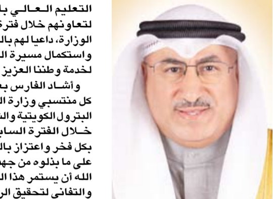
د. محمد الفارس

وأشار الوزير الفارس إلى أهم الأولويات التي تستجوب الاهتمام خلال المرحلة المقبلة خاصة بوزارة الكهرباء والماء والطاقة المتجددة والتي تأتي في مقدمتها زيادة واستدامة إنتاج الطاقة الكهربائية وتأسيس نموذج مستدام لتوفير الطاقة دون الإضرار بالبيئة ومواردها، وبما يكفل تعزيز التنمية الاقتصادية للدولة ومطابقتها لخطة الدولة التنموية خاصة في ظل تزايد الطلب العالمي على الطاقة النظيفة، ما أصبح بذل الجهود نحو استخدام الطاقة المجددة والمستدامة أمرا حتميا لضمان تحقيق التوازن بين الاحتياجات الاقتصادية والأهداف البيئية.