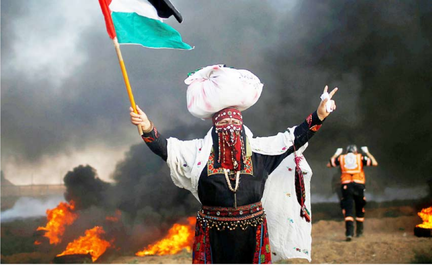
احتجاجات سابقة في فلسطين

وقالت: "استمرار رهان قيادة السلطة على المفاوضات والسلام مع العدو الصهيوني الذين يمارس أشنع الجرائم الفاشية بحق كل مكونات الشعب الفلسطيني هو محاولة لبيع الأوهام من جديد".