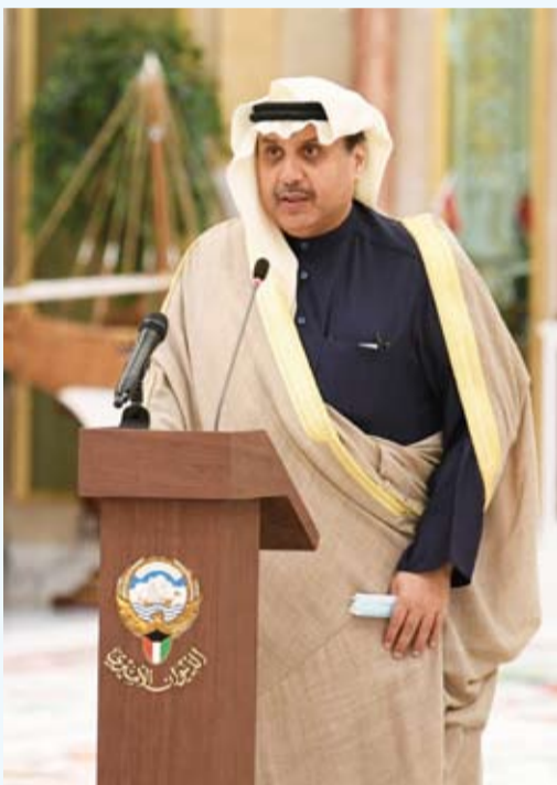
الشيخ حمد جابر العلي يؤدي اليمين الدستورية

أعرب نائب رئيس مجلس الوزراء ووزير الدفاع، الشيخ حمد جابر العلي، عن خالص شكره وجزيل تقديره وافر امتنانه لصاحب السمو أمير البلاد القائد الأعلى للقوات المسلحة الشيخ نواف الأحمد، وسمو ولي عهده الأمين الشيخ مشعل الأحمد، وسمو الشيخ صباح الخالد رئيس مجلس الوزراء حفظهم الله ورعاهم على تجديد ثقتهم الغالية به.