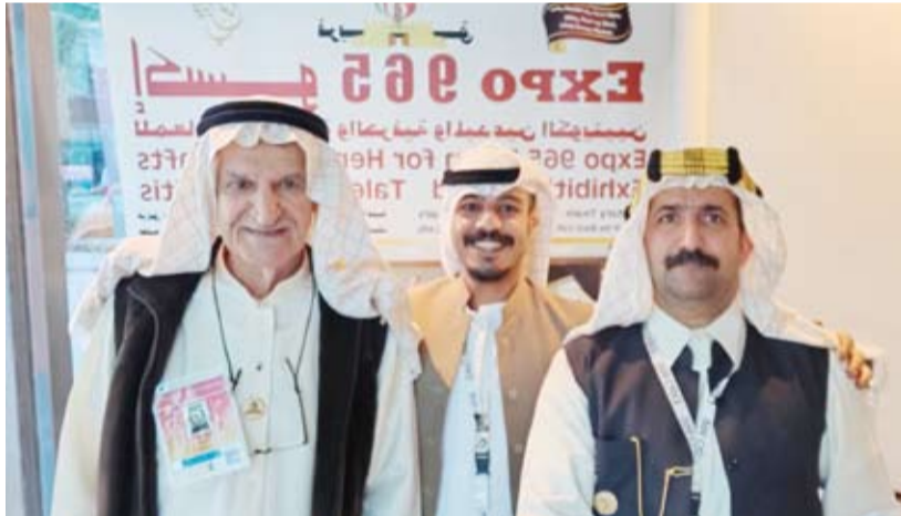
فريق «إكسبو 965» للمعارض التراثية والحرفية والمبدعين الكويتيين