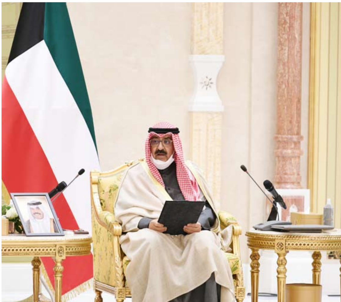
سمو ولي العهد متحدناً

وجدد نائب رئيس مجلس الوزراء ووزير الدفاع باسمه ونياية عن منتسبي وزارة الدفاع الوعد والعهد لصاحب السمو أمير البلاد وسمو ولي عهده الأمين وسمو رئيس مجلس الوزراء بالحفاظ على سلامة الوطن واستقراره وبذل الغالي والنفيس في سبيله سائلاً المولى عز وجل أن يديم على بلادنا الغالية نعمة الأمن والأمان والرخاء وأن يعين الجميع لما فيه خير الكويت ورفعتها وازدهارها.