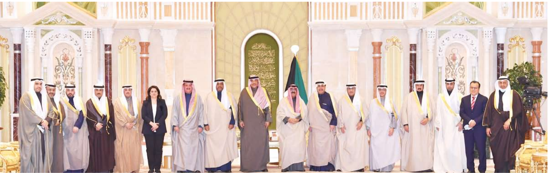
سمو ولي العهد في لحظة جماعية ومعه التشكيل الحكومي الجديد