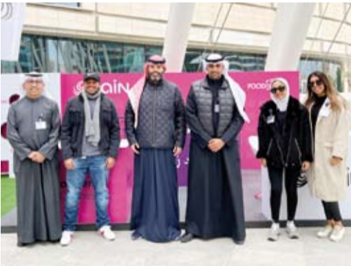
فريق زين في جناح الشركة

أعلنت زين عن استمرار شراكتها الاستراتيجية لفعالية FoodBuzz المجتمعية، والتي تقدّم بيئة اجتماعية وترفيهية للزوّار للتواصل والاستمتاع بالأجواء الربيعة والشتوية مرتين شهرياً من نوفمبر الماضي وحتى فبراير القادم في مول العاصمة قلب مدينة الكويت بمُشارَكة العديد من المطاعم والمقاهي ذات العلامات التجارية المميّزة.