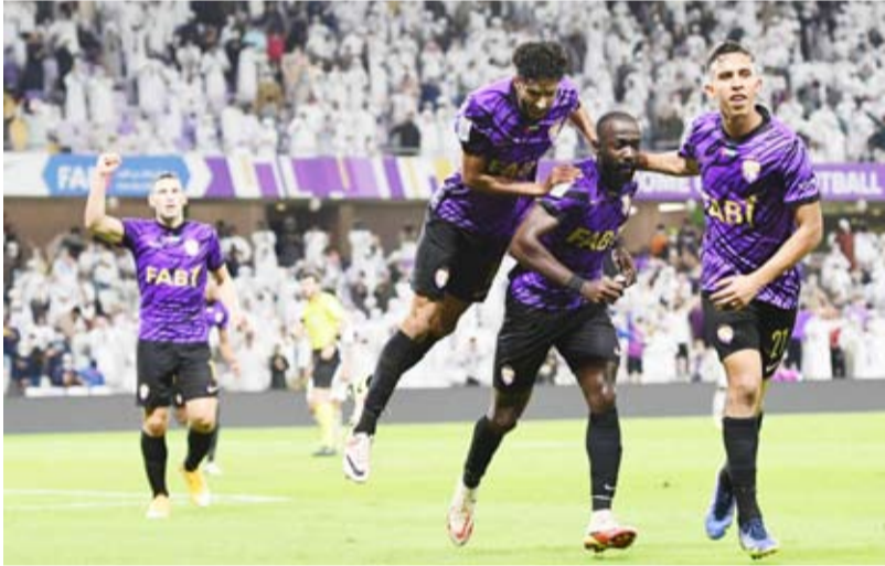
لاعبو العين الإماراتي

اللعب أكثر، وكاننا نبدأ المباراة خاسرين بنتيجة 0-1، والتفكير في كيفية التغلب على الفريق المنافس لتحقيق نتيجة إيجابية». ويخوض الوحدة مواجهة محفوفة بالمخاطر أمام الجزيرة في قمة أبوظبي يوم الجمعة، بعد أن وضع حامل اللقب حداً لهزيمتين متتاليتين بفوزه على خورفكان في الجولة السابقة. ويحتل الجزيرة المركز الرابع برصيد 19 نقطة. ويسعى شباب الأهلي إلى مواصلة الضغط على العين عندما يلعب في ضيافة بني ياس اليوم الخميس. وقال مدرب شباب الأهلي مهدي علي «نخوض مواجهة صعبة خاصة وأن بني ياس يريد التعويض بعد خسارته في الجولة الماضية. نحن أيضاً نسعى لتحقيق المزيد من الانتصارات لتدعيم موقعنا في المنافسة على الدوري» مضيفاً أن فريقه ما زال يفتقد عمر عبد الرحمن «عموري» وماجد حسن بسبب الإصابة، بينما يغيب عبد الله النقيبي أمام بني ياس للإيقاف. ويتطلع الشارقة، صاحب المركز الخامس برصيد 19 نقطة، إلى مواصلة سلسلة انتصاراته الأخيرة عندما يزور فريق الإمارات متذيل الترتيب، الذي أقال مدربه المغربي طارق السكتوني هذا الأسبوع وعين المصري أيمن الرمادي خلفاً له. كما يلتقي الوصل مع العروبة ويلعب الظفرة ضد النصر وخورفكان ضد اتحاد كلباء.