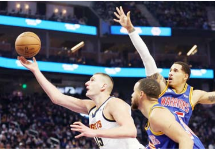
لغة من مباراة دنفر ناغتشس وغولدن ستايت وورييرز

116-124 مع بقاء تسعين ثانية على النهاية، وكان ذلك كافياً لإحباط صاحب الأرش. وعلق مساعد المدرب ديفيد فيز دايل الذي يشرف على الفريق للمباراة الخامسة توالياً بسبب وجود المدرب فرانك فوغل في الحجر الصحي، على ما شاهدته من فريقه قائلاً «أن نقاتل معاً بهذه الطريقة وأن ننهي المباراة بالطريقة التي أنهيناها مع ما حققه معاً لبيرون ورأس (وستبروك)... أعتقد أن ذلك كان خطوة كبيرة نحو الإمام».