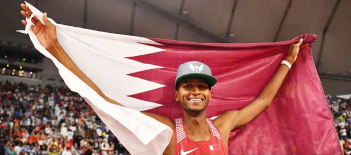
معزز برشم بالعلم القطري خلال أولمبياد طوكيو