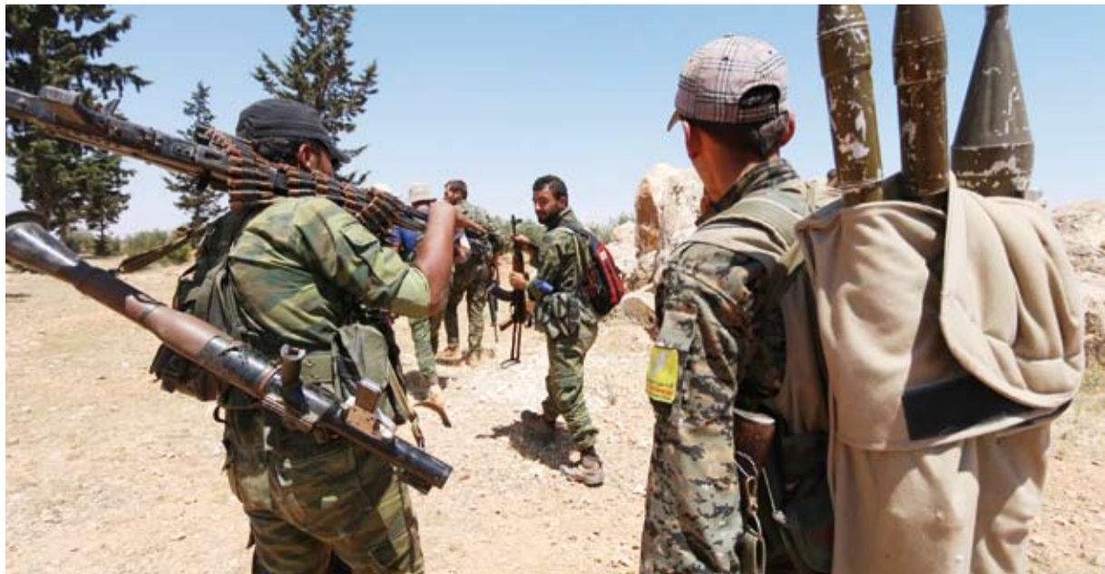
القتال في سورية

وزاد البيان: «تجهد روسيا في أن تقدم نفسها كوسيط سياسي لكن دون جدوى، فدماء عشرات الآلاف من الشهداء، وملايين المهجرين في مخيمات البرد والصقيع؛ تشهد على الإجماع المستمر لروسيا والنظام وإيران، فضلاً عن