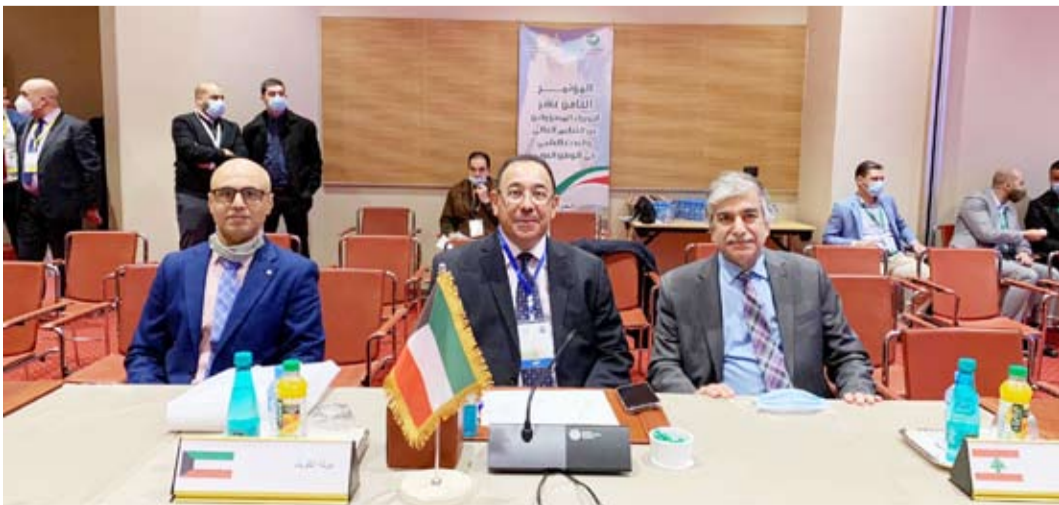
وقد جامعة الكويت

والتصورات المستقبلية للارتقاء بالعملية التربوية وتحقيق الجودة الشاملة فيها في مؤسسات التعليم العالي في الدول العربية.