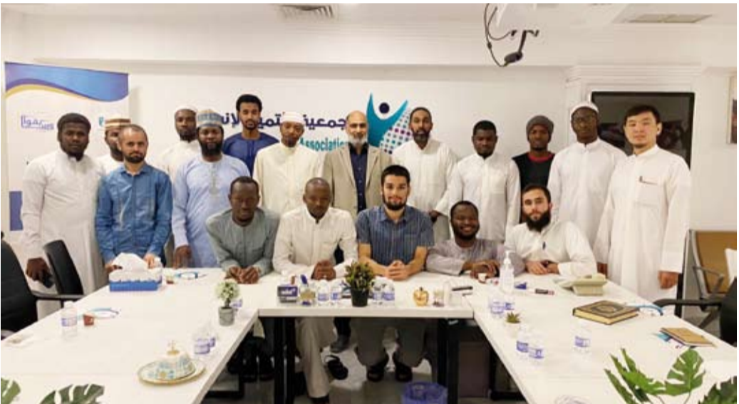
جانب من ورشة العمل

برنامج «سفراء الخير»، الذي أكد فيه الطلاب المشاركون على حاجتهم إلى عدد من الدورات، منها: «إدارة المشروعات»، و«تطوير الذات»، و«التخطيط الشخصي»، و«التخطيط الاستراتيجي»، و«فنون الإلقاء والخطابة»، و«إدارة الأزمات»، و«التصور»، و«دورات في الاقتصاد والتجارة والحاسوب وغيرها»، بالإضافة إلى أنشطة متنوعة، مثل الرحلات، والأنشطة الرياضية والأنشطة الثقافية، كما أبدى الطلاب استعدادهم للتطوع داخل الجمعيات الكويتية. كما انتهت الورشة بالتشاور