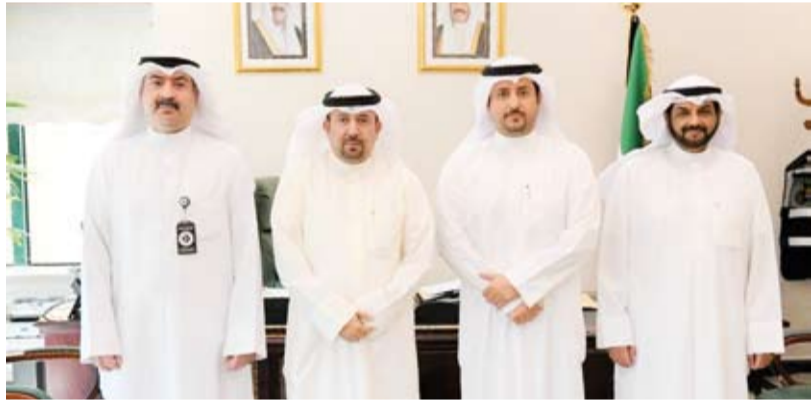
مدير عام هيئة الزراعة يلتقي ممثلي الطيران المدني

لمعالجة كل ما من شأنه تخفيف العواصف الغبارية والثرورية السميكة، علي الفارسي، مع ممثلي الإدارة العامة للطيران المدني - إدارة الأرصاد الجوية معالجة العواصف الغبارية والترايبية ومواقعها ومصادرها المحلية في دولة الكويت. وأكد الفارسي في بيان صحفي للهيئة، أمس، استعداد (الزراعة) للتعاون مع جميع جهات الدولة