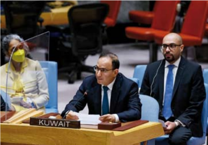
السفير منصور العتيبي

وقال: من خلال تجربة الكويت وعضويتها في مجلس الأمن خلال الفترة 2018 - 2019 نرى أن التغيير الموسمي والفعال في أساليب عمل مجلس الأمن لا يمكن تحقيقه إلا من خلال التعاون ووجود رغبة حقيقية من جميع أعضائه وفي هذا الصدد نأمل أن نرى مزيد من المرونة والإبداع بهدف مواصلة السعي نحو زيادة فعالية المجلس وكفاءته وشفافيته.