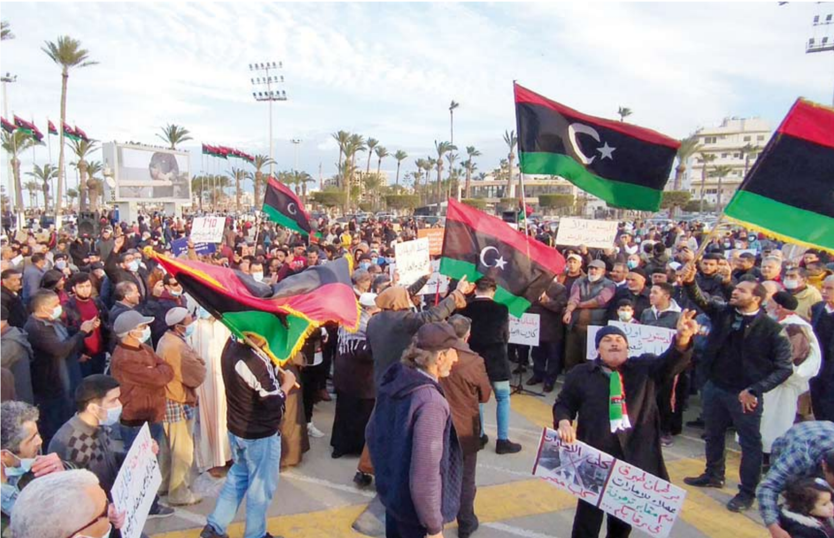
مظاهرات سابقة في ليبيا

دفع الجمود السياسي وتردّي الخدمات الحكومية عدداً من الليبيين للانخراط في دعوة للعصيان المدني بجميع أنحاء البلاد، يوم الجمعة المقبل، بهدف إسقاط مجلسي النواب و«الأعلى للدولة»، وحكومتَي «الوحدة الوطنية» و«الاستقرار»، برئاسة عبد الحميد الدبيبة وفتحي باشاغا.