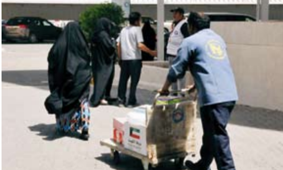
توزيع المساعدات الإنسانية على الأرامل