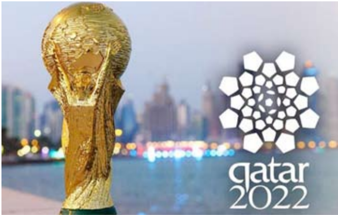
توقعات بإقبال كبير على شراء كأس العالم في قطر