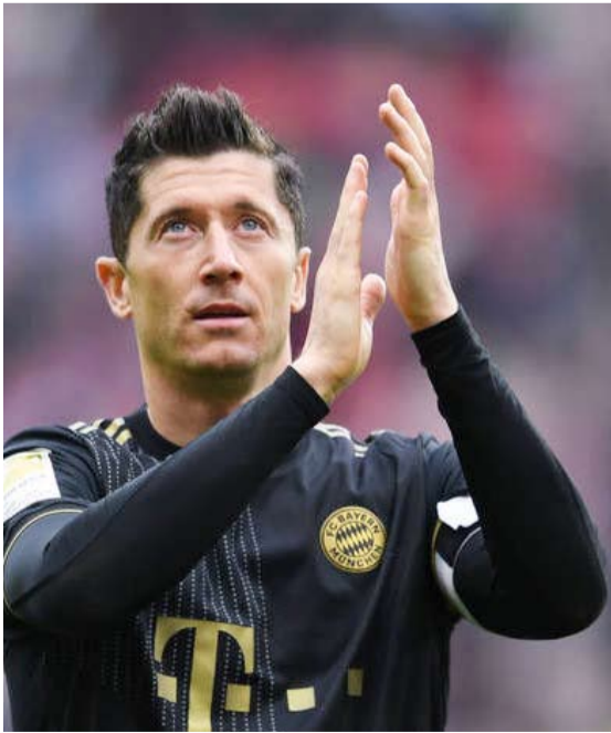
البولندي روبرت ليفاندوفسكي

رفع برشلونة الإسباني من قيمة العرض المقدم لبايرن ميونيخ من أجل التخلي عن هدافه الدولي البولندي روبرت ليفاندوفسكي إلى 40 مليون يورو، وفق ما أفادت وسائل إعلام عدة أبرزها صحيفة "بيلد" الألمانية.