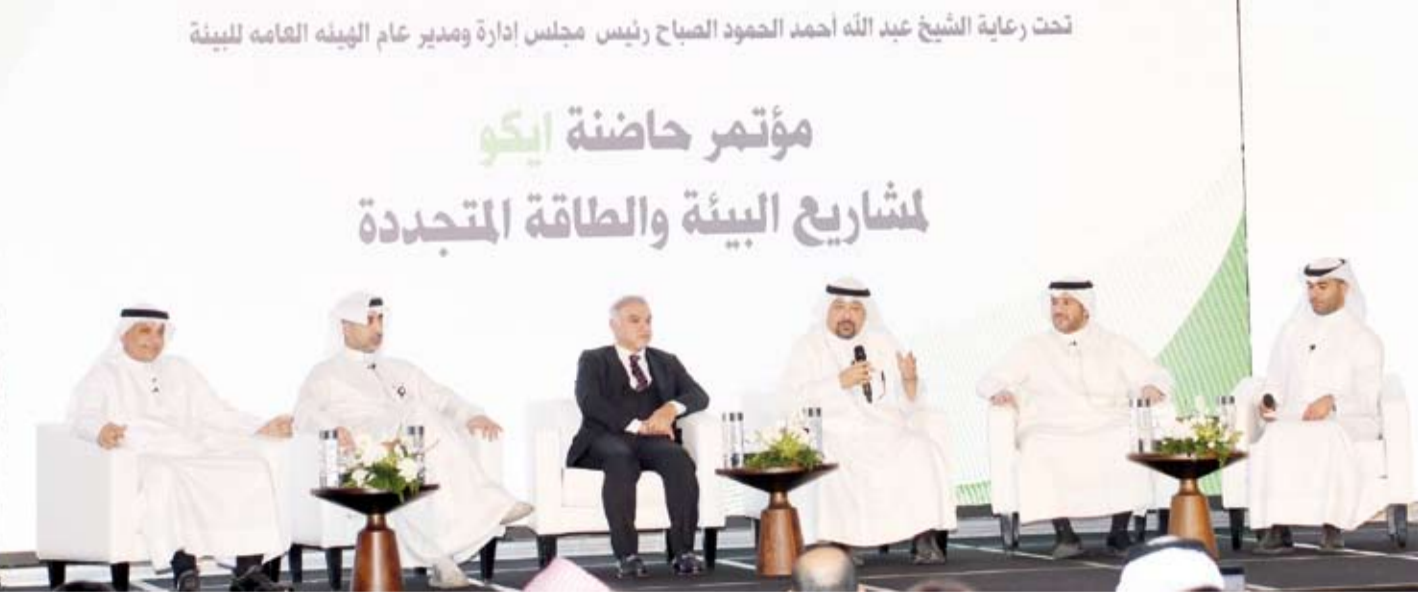
جانب من المشاركين في مؤتمر «بيئة وطن»

المستدامين وهو ما يتضح جلياً بإصدار قانون حماية البيئة رقم (42) لسنة 2014 ولوائحه التنفيذية واعتمادها لأهداف التنمية المستدامة عام 2017. وذكر أنه في ضوء اهتمام الكويت بالمساهمة في أنماط الاستهلاك والإنتاج المستدامين تم إعداد خطة التنمية (رؤية كويت جديدة 2035) التي