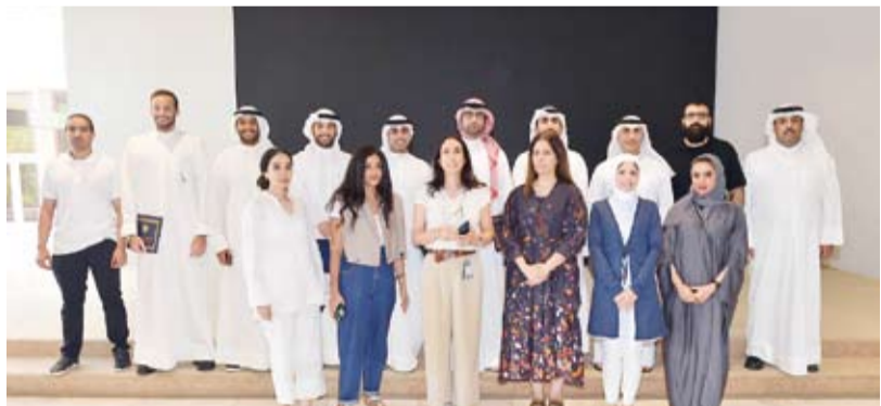
لقطة جماعية للمشاركين في الدورة

اختتم مركز وكالة الأنباء الكويتية (كونا) لتطوير القدرات الإعلامية، أمس، برنامج (صحافة الموبايل - مستوى مبتدئ) ثاني برامجه بموسمه التدريبي الجديد (2022-2023) المتضمن ثلاثة برامج تدريبية إعلامية تتناول مختلف الفنون الإعلامية.