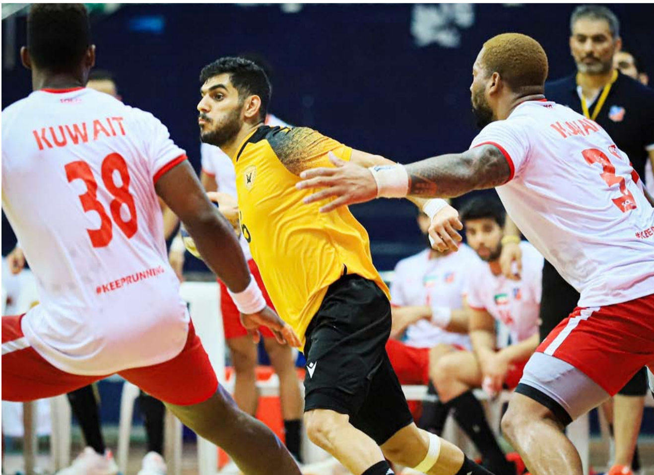
الكويت يتغلب على القادسية خارج الديار

صعد فريق الكويت لكرة اليد إلى نهائي البطولة الآسيوية الـ24 للأندية أبطال الدوري، في انتظار الفائز من مباراة النجمة البحريني، والعربي القطري، وذلك بعد فوزه المريح على القادسية 25/20 في المباراة التي جمعت بينهما في الدور نصف النهائي في حيدر آباد الهندية.