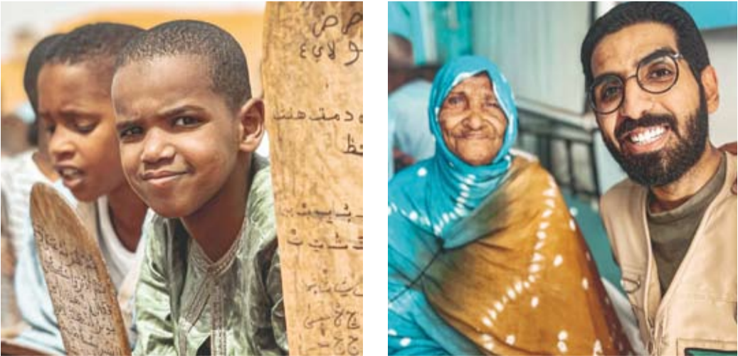
تدريس القرآن الكريم