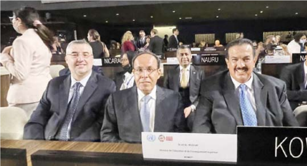
وفد الكويت برئاسة وزير التربية ووزير التعليم العالي والبحث العلمي د.علي المصفي

للتعليم الذي عقد في بريطانيا بتقدير مبالغ 30 مليون دولار لدعم مبادرة التعليم العالمية على مدى السنوات الخمس المقبلة بواقع ستة ملايين دولار سنوياً. وأوضح أن الحكومة ستصدر بياناً في شهر أغسطس المقبل يتضمن أهداف ورؤى دولة الكويت لقمة التحول المنشود في التعليم التي ستعقد في سبتمبر إبان انعقاد الجمعية العامة للأمم المتحدة في نيويورك.