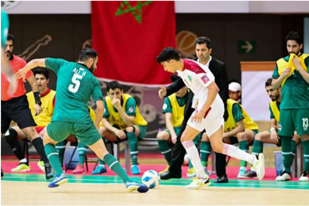
المغرب يحافظ على تفوقه بقدم الصالات

توج المنتخب المغربي لكرة قدم الصالات (رجال) بطلا لبطولة كأس العرب لكرة قدم الصالات للمنتخبات 2022 بعد فوزه على نظيره العراقي الذي حل ثانياً بنتيجة (3 - 0) في المباراة التي جمعتهما في مدينة (الدمام) السعودية.