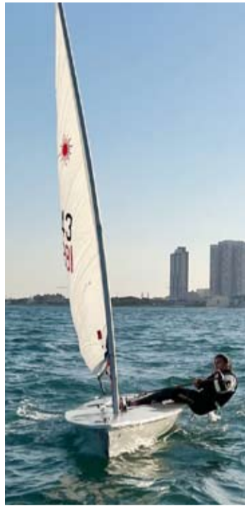
البطل العالمي بدر الدوسري

حقق البطل العالمي بدر الدوسري قائد الزورق الكويتي (كويت B24) ومساعد محمد العيسائي المركز الأول في منافسات الجولة الثانية من بطولة العالم للزوارق السريعة للموسم الحالي 2022، والتي نظّمها الاتحاد الدولي للزوارق السريعة UIM في مدينة أوستند الساحلية ببلجيكا وأسدل الستار عنها من خلال إقامة السباق الثاني للجولة الثانية في الوقت الذي أعلن فيه الاتحاد الدولي إلغاء منافسات السباق الثاني واعتماد السباق الأول الذي أقيم السبت الماضي والذي حقق فيه الدوسري المركز الأول ليتوج بذلك بطلا للعالم منافسات الجولة الثانية.