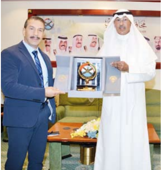
الشيخ فواز الخالد يقدم درعاً تذكارية لسفير قبرص

تقديره البالغ للرعاية التي يحظى بها البعثة الدبلوماسية لبلاده ومواطنو