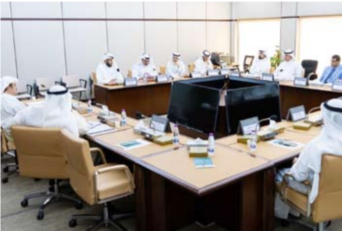
جانب من اجتماع اللجنة

ونوه المطر في هذا الشأن إلى أن تصريحه في اعتراف الاتحاد الوطني لطلبة الكويت في جمهورية مصر العربية والاتحاد الوطني لطلبة الكويت تم اجتراءه، مضيفاً أن "مخرجات الجامعات العربية محل اهتمام شخصي".