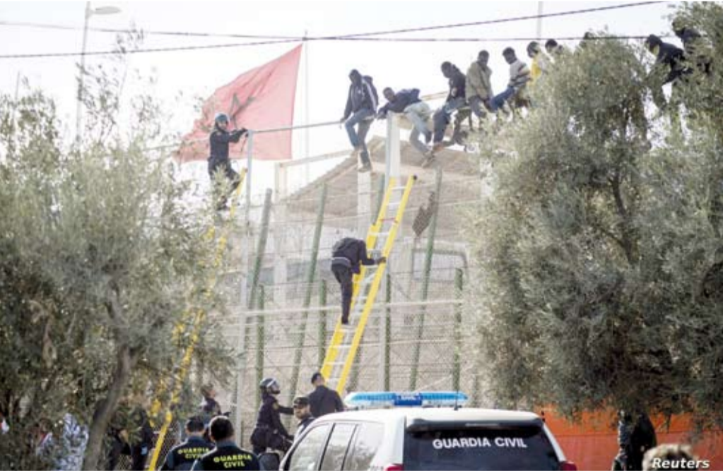
اقتحام سياج مليلية

العشرات من البشر أو طالبي اللجوء أو المهاجرين“.