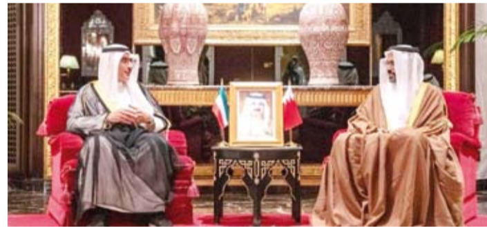
مساع ووزير ومدير عام العلاقات الثنائية بوزارة الخارجية البحرينية