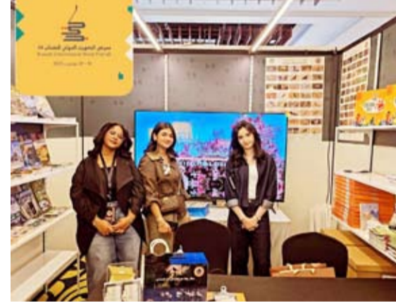
أعضاء فريق أصدقاء البيئة بجناح الجمعية

المقيمة والمستوطنة، بالإضافة إلى إصدارات تثقيفية للأعمار الصغيرة، وإصدارات لرسومات بيئية لطيور وأسماك ونباتات، وإصدارات تفاعلية على شكل ألعاب استراتيجية لإدارة النفايات، كما أن حقائب النوع الأحيائي في البيئة الكويتية متعددة الاستخدام المعاد تدوير قماشها تنقل صورة الوعي البيئي بجمال البيئة الكويتية حيث كانت محط اهتمام الزوار