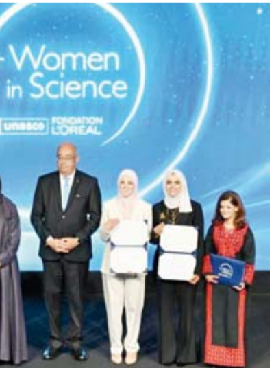
لقطة جماعية للفائزات بجائزة «لوريال - اليونسكو»

عثرت هيئة الآثار الإثيوبية على هيكل لطفل يبلغ نحو أربع سنوات ونصف في منطقة بورتالي بإقليم العفر، ليتبين أنه يعود إلى نوع غير معروف سابقاً من فصيلة أسلاف الإنسان. هذا الاكتشاف الذي صنّفه علماء باسم أسترالوبيثكس ديبيرييدا، أعاد تسليط الضوء على تاريخ الإنسان القديم ومسارات تطوره. ويعود الهيكل، الذي يضم أجزاء من الأسنان والفك والأصابع، إلى نحو (3.5) ملايين سنة، ويظهر سمات أكثر بدائية مقارنة بفصيلة أسترالوبيثكس أفارينسيس الشهيرة، مما يشير إلى تنوع القدرات التشريحية والحركية لأسلاف الإنسان في العصور القديمة. وأوضح فريق البحث الدولي بقيادة جامعة «أريزونا» الأمريكية وبالتعاون مع عالم الآثار الإثيوبي يوهانس هيلاسلاسي، أن النوع المكتشف يمتلك خصائص تجمع القدرة على المشي على قدمين والتسلق، ما يعكس تكيفاً بيئياً متنوعاً، وجاء هذا الكشف ثمره جهود استمرت أكثر من 22 عاماً من التنقيب والدراسات في إقليم العفر، المنطقة التي تعد الأغنى عالمياً بقايا أسلاف الإنسان، إذ عُثر فيها على 14 نوعاً من أصل 23 نوعاً معروفاً حتى الآن.