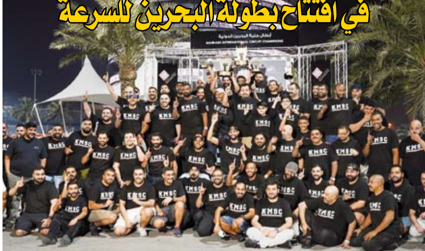
النادي الكويتي للسيارات والدراجات الآلية المشارك في البطولة بالبحرين

عوامل أساسية وراء الأداء المشرف لاقتنا إلى أن الفريق يواصل تعزيز موقعه في مختلف البطولات الخليجية. وانطلقت سباقات الجولة الأولى والافتتاحية للبطولة مساء أمس الجمعة وهي من أصل خمس جولات طوال الموسم. ويستمر الموسم الجديد من بطولة سباقات السرعة حتى شهر مارس المقبل إذ من المقرر أن تقام الجولة الثانية من 23 حتى 26 ديسمبر تليها الجولة الثالثة من 6 إلى 9 يناير 2026 على أن تتنطلق الجولة الرابعة وما قبل الأخيرة بين 13 و16 يناير وختام البطولة سيكون في الفترة من 3 حتى 6 مارس.