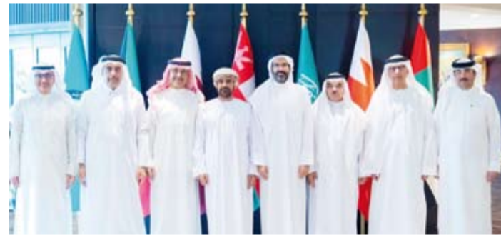
أعضاء لجنة صياغة قرارات وتوصيات الدورة الـ16 للمجلس الوزاري الخليجي

وما تشهده من تطور مستمر في مسارات التعاون المشترك على مختلف الصعد. وقال: إن اللقاء تناول بحث سبل تعزيز التنسيق الثنائي والإرتقاء بالكليات العمل في المجالات ذات الأهتمام المشترك بما يترجم توجيهات القيادتين الحكيمتين في البلدين الشقيقين.