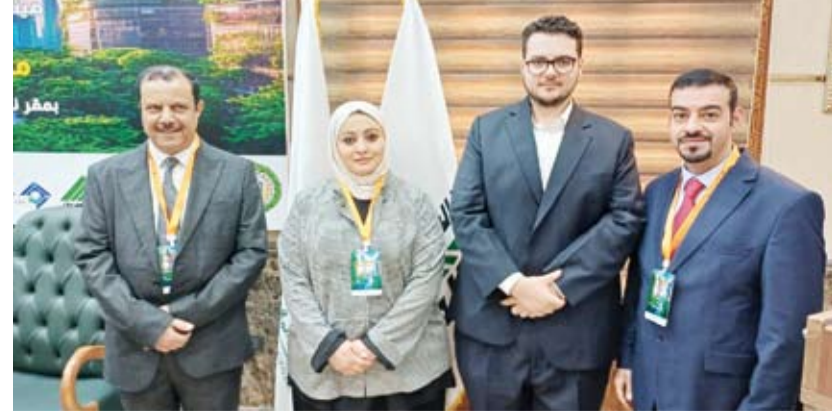
الوفد الكويتي المشارك في ملتقى مدن مستدامة بهوية عربية

ويحظى الملتقى بمشاركة واسعة من خبراء وباحثين ومؤسسات من مختلف الدول العربية إضافة إلى ممثلي الوزارات والبلديات والجامعات ومكاتب الهندسة والهيئات البيئية، ليشكل منصة عربية متخصصة لتبادل الخبرات وتطوير رؤى مستقبلية للمدن ذات الهوية العربية المستدامة.