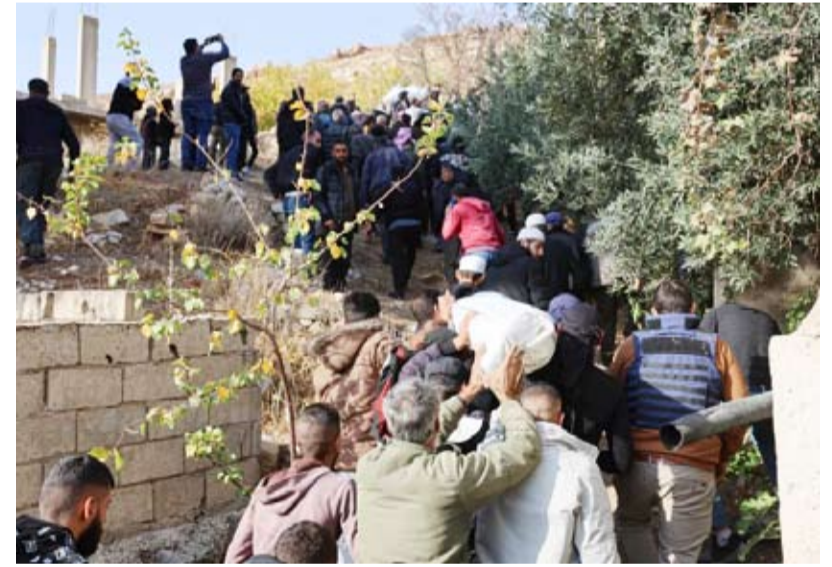
سوريون يشيعون ضحايا الاعتداء الصهيوني