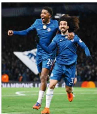
تشيلسي في مهمة صعبة لإيقاف صحوه أرسنال

ربما يشهد سياق المنافسة على قمة ترتيب بطولة الدوري الإنجليزي الممتاز منعطفاً آخر، حينما يلتقي تشيلسي ضيفه أرسنال، في ديربي لندن ساخن. اليوم الأحد في قمة منافسات المرحلة الـ13 للمناسبة. ويتوجه أرسنال، متصدراً الترتيب برصيد 29 نقطة، بفارق 6 نقاط أمام أقرب ملاحقيه تشيلسي، إلى ملعب ستامفورد بريدج، معقل الفريق الأزرق، بكثير من التفاؤل والثقة الكبيرة في قدرته على إنهاء انتظاره الطويل للتتويج بلقبه الأول في المسابقة العريقة منذ موسم 2003-2004. لا سيما في ظل امتلاكه تشكيلة هي الأقوى على الأرجح في أوروبا حالياً. وحافظ فريق المدرب الإسباني ميكل أرنتيتا على سجله خالياً من الهزائم في مبارياته الـ16 الأخيرة بمختلف المسابقات، محققاً 14 انتصاراً خلال تلك السلسلة. وبعد ثلاث سنوات متتالية وصفاً، يبدو أن وقت أرسنال قد حان لاعتلاء منصة التتويج أخيراً، وكان فوزه الكبير والمستحق (3-1) على ضيفه بايرن ميونيخ، حامل لقب الدوري الألماني (بونديسليغا)، الأربعاء، في دوري أبطال أوروبا،