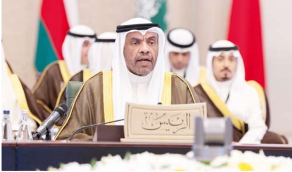
وزير الخارجية عبدالله الجحيا مترئساً اجتماعاً سابقاً للمجلس الوزاري لوزراء خارجية دول مجلس التعاون

♦ الكويت حرصت على إرساء نهج مؤسسي راسخ وتفعيل آليات التشاور وتكثيف التنسيق وتسريع وتيرة تنفيذ قرارات المجلس الأعلى والمجلس الوزاري