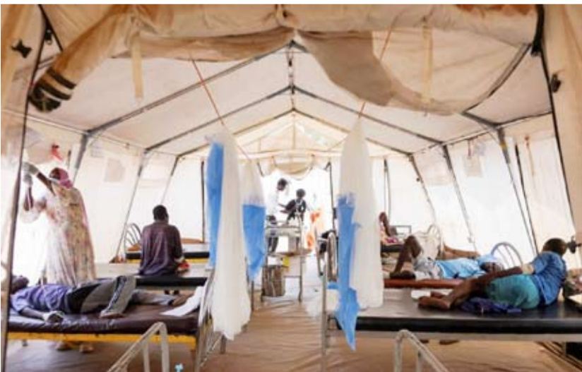
مصابون فروا من المعارك يتلقون العلاج

وتُشير البيانات إلى أن «قوات الدعم السريع» مسؤولة عن 71 في المائة على الأقل من هذه الوقائع، بينما تتحمل القوات المسلحة السودانية مسؤولية ثلاثة في المائة. وشملت معظم الحالات المتبقية جهات مجهولة أو قتالاً بين «قوات الدعم السريع» والقوات