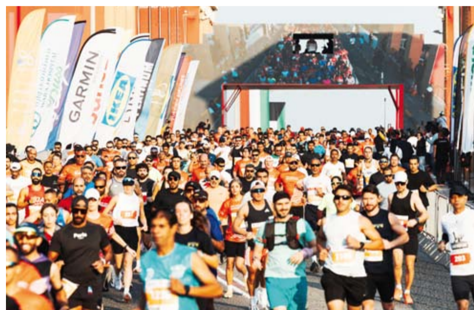
الآلاف يشاركون في ماراثون بنك الخليج

في الصميم الأحداث والفعاليات الرياضية الدولية أصبحت استثماراً جيداً على مستوى العالم، واستضافة أي دولة لحدث عالمي من شأنه أن يحدث رواجاً كبيراً لإسم الدولة ومكانتها خاصة حال تحقيقها نجاحاً لافتاً في هذا الشأن. والنموذج الإقليمي لذلك يتمثل في دولة قطر الشقيقة، التي استطاعت خلال السنوات الماضية تنظيم أكثر من بطولة دولية بدءاً بكأس العالم و انتهاء بطولة كأس العرب التي ستطلق خلال أيام قليلة. تسهيلات كثيرة فيما يتعلق بتأشيرة الدخول قدمتها الدوحة خاصة للمقيمين في دول مجلس التعاون الراغبين في الحضور وتشجيع منتخبات بلادهم في البطولة.. التخطيط الجيد يعقبه نجاح وتميز.