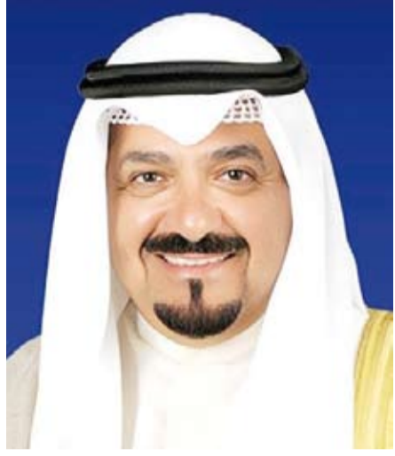
سمو الشيخ أحمد العبد الله

بعث سمو الشيخ أحمد العبدالله رئيس مجلس الوزراء، ببرقية تهنئة إلى الرئيس محمد ولد الشيخ الغزواني رئيس الجمهورية الإسلامية الموريتانية الشقيقة بمناسبة ذكرى استقلال بلاده.