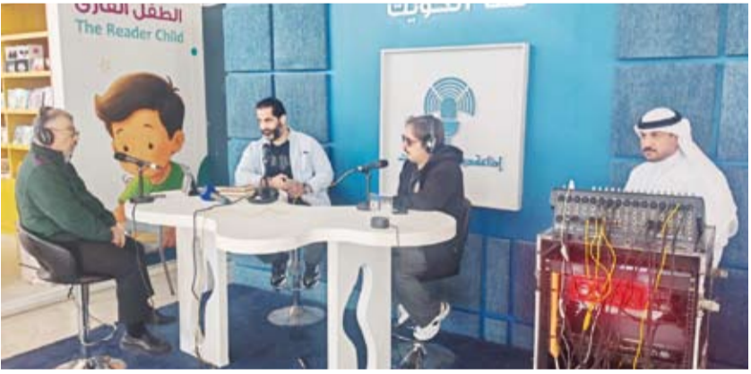
مشاركة فاعلة لإذاعة الكويت في معرض الكويت الدولي للكتاب