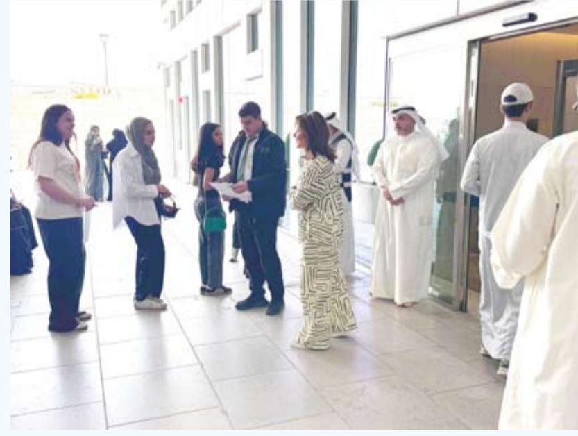
مدير الجامعة خلال جولة تفقدية لاختبار القدرات أمس

أكدت مدير جامعة الكويت الدكتورة دينا الميلم أمس حرص الجامعة على تقديم اختبارات منظمة وتطوير الخدمات التي تقدمها لضمان الجودة والانضباط. جاء ذلك في تصريح صحفي خلال جولة ميدانية قامت بها في كليات مدينة صباح السالم الجامعية لمتابعة تنفيذ اختبارات القدرات الأكاديمية للفرصة الثانية والتي سجل فيها 9513 طالباً وطالبة بنظامها الورقي والإلكتروني للاطلاع على سير العمل داخل القاعات المخصصة.