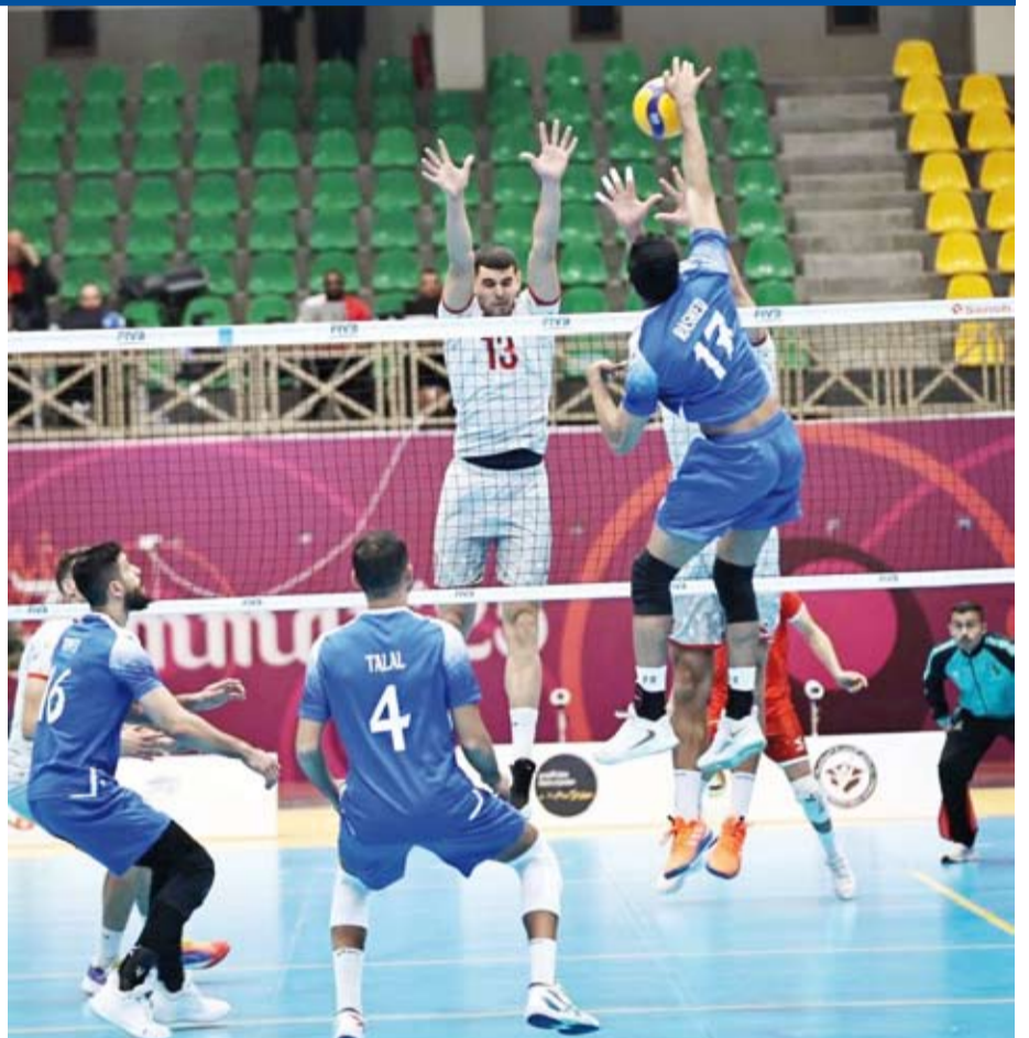
جانب من اللقاء

خسر منتخب الكويت الوطني الأول لكرة الطائرة أمام نظيره التونسي بنتيجة (0-3) في اللقاء الذي جمعهما في مستهل مشواره في النسخة الأولى من بطولة كأس التحدي العربي للرجال في العاصمة الأردنية عمان. وحافظ المنتخب التونسي على تقدمه في الأشواط الثلاثة بفارق نقطتين بالشوط الأول وأربع نقاط بالشوط الثاني ونقطتين بالشوط الثالث. وقدم المنتخب الكويتي مباراة قوية خصوصاً في الشوط الثالث محاولاً تحسين النتيجة إلا أن خبرة المنتخب التونسي أحد أبرز المرشحين للقب رجحت كفته في اللحظات الحاسمة.