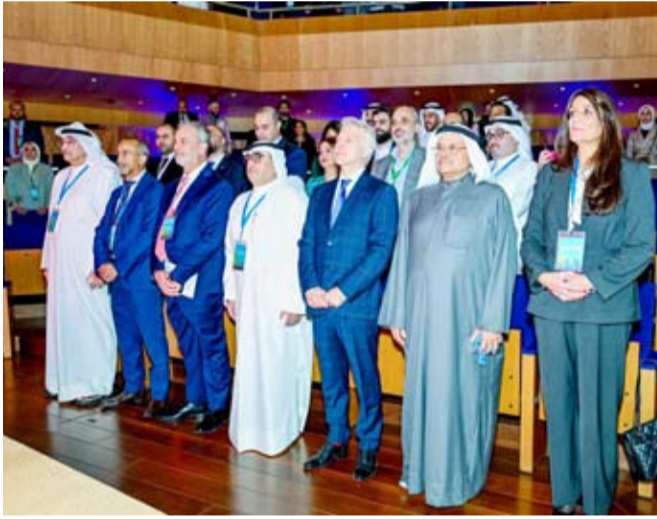
جانب من الفعالية التي استضافتها روش دايجنوستكس في مركز الشيخ جابر