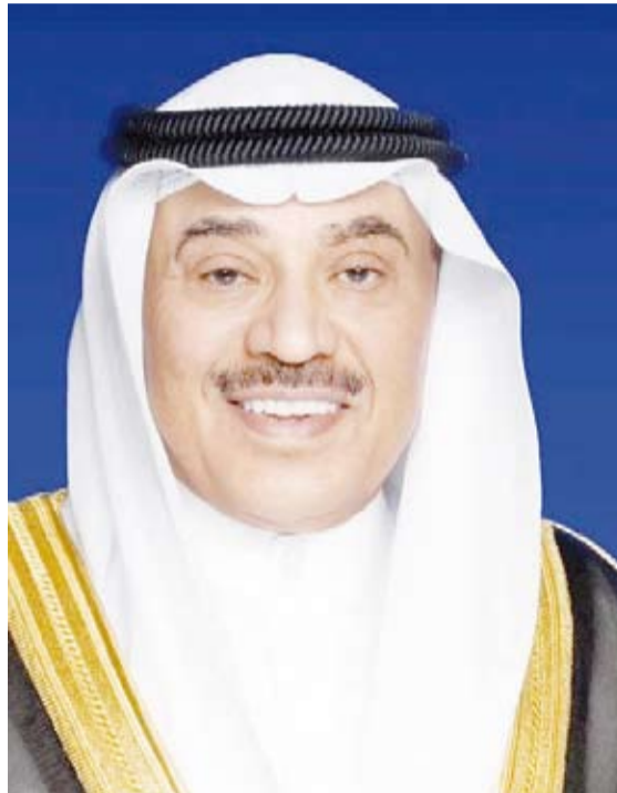
سمو ولي العهد الشيخ صباح الخالد

بعث سمو ولي العهد الشيخ صباح الخالد، ببرقية تهنئة إلى الرئيس محمد ولد الشيخ الغزواني رئيس الجمهورية الإسلامية الموريتانية الشقيقة، ضمنها سموه خالص تهنائه بمناسبة ذكرى استقلال بلاده ورأياً لفخامته وأفر الصحة والعافية.