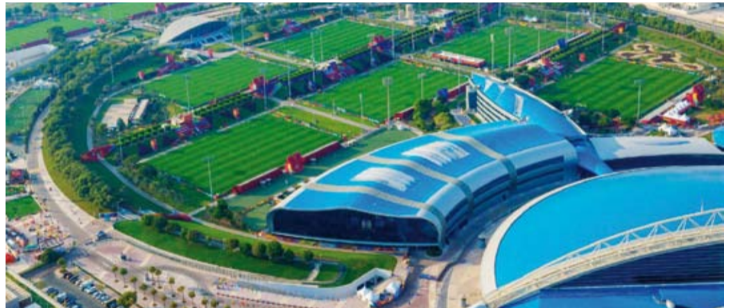
ملعب البطولة جامزة

منتخبات موزعة على مجموعتين حيث تضم المجموعة الأولى منتخب الكويت إلى جانب منتخبات قطر والسعودية والبحرين فيما تشمل المجموعة الثانية منتخبات العراق والإمارات وعمان واليمن. وتقام مباريات دور المجموعات وعددها 14 مباراة على ملعبين منطقة (أسباير زون) اللذين استضافا أخيراً منافسات كأس العالم تحت 17 سنة (فيفا قطر 2025) كما أعلن الاتحاد إتاحة حضور جميع مباريات دور المجموعات مجاناً للجماهير لإتاحة فرصة أكبر لتابعه اللاعبين الشباب. وتنتقل بطولة كأس الخليج تحت 23 عاماً 2025 في الرابع من ديسمبر المقبل بمباراة الافتتاح التي تجمع منتخب العراق واليمن عند الساعة (45:2) ظهراً بتوقيت (الدوحة) فيما يستهل المنتخب الكويتي مشواره أمام منتخب قطر يوم 5 ديسمبر في التوقيت ذاته. وتقام المباراة النهائية في يوم 16 ديسمبر على استاد (974) الذي يعد أول ملعب قابل للتفكيك بالكامل في تاريخ بطولة كأس العالم بعدما استضاف عدة مباريات في كأس العالم قطر 2022. وأشار الاتحاد إلى أن تذاكر المباراة النهائية لكأس الخليج تحت 23 عاماً ستطرح خلال الأيام المقبلة لافتاً إلى تخصيص مناطق في الملاعب للمشجعين ذوي الإعاقة. و تأتي البطولة ضمن موسم كروي حافل تشهده قطر هذا العام والذي يشمل كأس العرب والتي تقام في الفترة من 1 إلى 18 ديسمبر وكأس القارات للأندية في 10 و13 و17 ديسمبر.