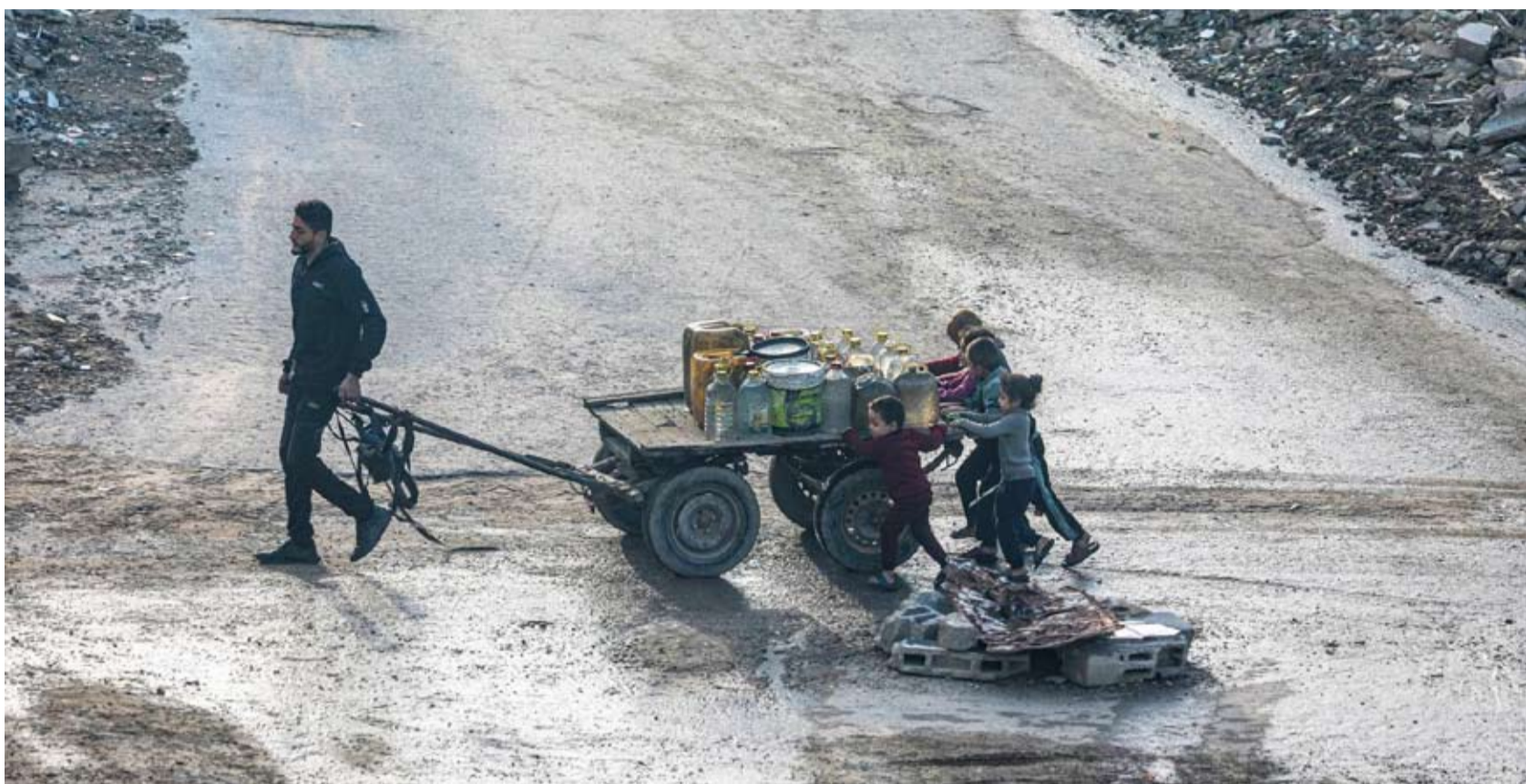
نازحون فلسطينيون يتلقون أوعية مملوفا بالماء

أعلنت القيادة المركزية الأميركية، زيادة المنضمين إلى مركز التنسيق المدني - العسكري لغزة ليضم ممثلين من 50 دولة ومنظمة دولية. وقتل فلسطيني، وأصيب 7 على الأقل أحدهما وصفت حالته بالخطيرة، بنيران إسرائيلية، في خروق مستمرة لوقف إطلاق النار الذي دخل حيز التنفيذ في العاشر من أكتوبر 2024، لتسجل أكثر من 500 حالة خرق منذ ذلك الوقت.