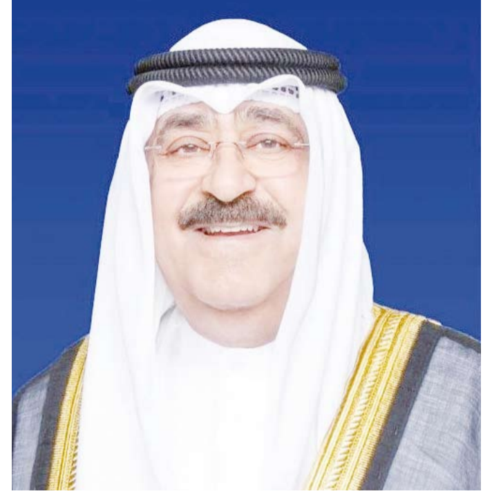
سمو أمير البلاد الشيخ مشعل الأحمد

بعث صاحب السمو أمير البلاد الشيخ مشعل الأحمد، ببرقية تهنئة إلى أخيه الرئيس محمد ولد الشيخ الغزواني رئيس الجمهورية الإسلامية الموريتانية الشقيقة، عبر فيها سموه عن خالص تهنائه بمناسبة ذكرى استقلال بلاده، متمنياً سموه لفخامته مو فور الصحة والعافية وللجمهورية الإسلامية الموريتانية وشعبها الشقيق المزيد من التقدم والازدهار.