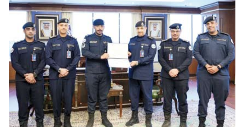
اللواء علي العدواني مكرماً الرقيب أول عبد الرحمن السالم

المواطن والمقيمين على مدار الفرق العاملة ودورها في تعزيز التواصل الفاعل بين الوزارة والجمهور. وأكدت وزارة الداخلية، حرصها على دعم الكوادر المتميزة ودعم الجهود التي تسهم في تطوير بيئة العمل وتسريع وتيرة الإنجاز بما يلبي تطلعات المواطنين ويرتقي بالخدمات المقدمة لهم.