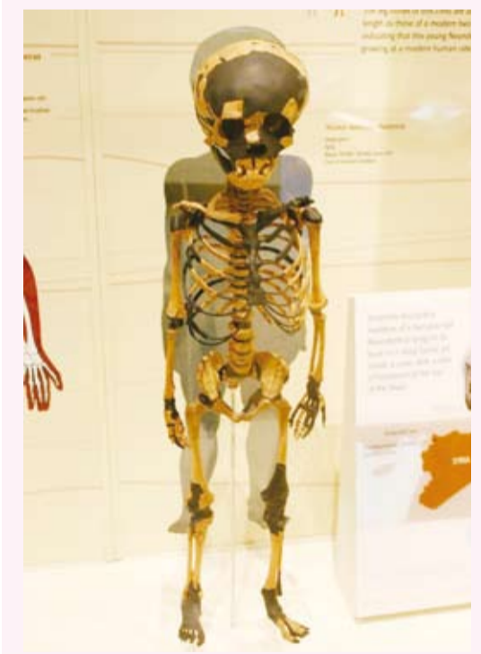
هيكل لطفل يبلغ نحو أربع سنوات ونصف

عثرت هيئة الآثار الإثيوبية على هيكل لطفل يبلغ نحو أربع سنوات ونصف في منطقة بورتالي بإقليم العفر، ليتبين أنه يعود إلى نوع غير معروف سابقاً من فصيلة أسلاف الإنسان. هذا الاكتشاف الذي صنّفه علماء باسم أسترالوبيثكس ديبيرييدا، أعاد تسليط الضوء على تاريخ الإنسان القديم ومسارات تطوره. ويعود الهيكل، الذي يضم أجزاء من الأسنان والفك والأصابع، إلى نحو (3.5) ملايين سنة، ويظهر سمات أكثر بدائية مقارنة بفصيلة أسترالوبيثكس أفارينسيس الشهيرة، مما يشير إلى تنوع القدرات التشريحية والحركية لأسلاف الإنسان في العصور القديمة. وأوضح فريق البحث الدولي بقيادة جامعة «أريزونا» الأمريكية وبالتعاون مع عالم الآثار الإثيوبي يوهانس هيلاسلاسي، أن النوع المكتشف يمتلك خصائص تجمع القدرة على المشي على قدمين والتسلق، ما يعكس تكيفاً بيئياً متنوعاً، وجاء هذا الكشف ثمره جهود استمرت أكثر من 22 عاماً من التنقيب والدراسات في إقليم العفر، المنطقة التي تعد الأغنى عالمياً بقايا أسلاف الإنسان، إذ عُثر فيها على 14 نوعاً من أصل 23 نوعاً معروفاً حتى الآن.