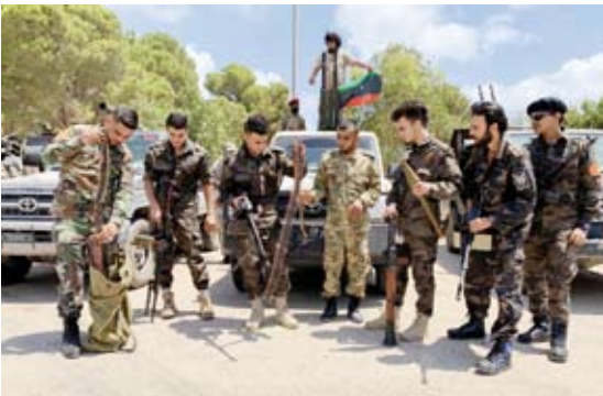
المرتزقة في ليبيا

«بعض السياسيين لا يرغبون في حل للوضع الليبي»، لافتاً إلى توجيه الأمم المتحدة ومجلس الأمن الدولي «رسالة قوية لهم»، واعتزّاهم التواصل مع كل الأطراف الليبية للخروج من هذه الأزمة. كما أشاد باتيلي بدور لجنة (5+5) في تحقيق الاستقرار الأمني والعسكري داخل البلاد. وأكد في هذا السياق دعم الأمم المتحدة لكل الجهود الرامية لإبعاد شبح الانقسام السياسي، والمحافظة على سيادة ليبيا