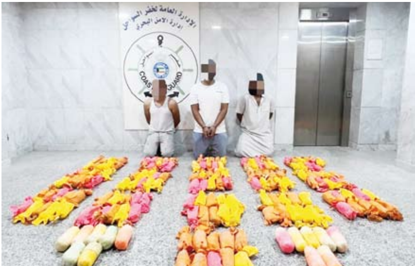
كميات كبيرة من الحشيش مع المتهمين

أعلنت وزارة الداخلية، أن التعاون بين قطاع الأمن الجنائي "إدارة حماية الآداب العامة والاتجار بالأشخاص" مع الهيئة العامة للقوى العمالة، أسفر عن ضبط 17 شخصاً بتهمة ممارسة أعمال منافية للأداب العامة. وقالت إدارة الإعلام الأمني: إنه تم إحالتهم لجهات الاختصاص وذلك لاتخاذ اللازم بحقهم. كما أعلنت وزارة الداخلية، أول أمس، ضبط ثلاثة أشخاص أثناء محاولتهم تهريب نحو 174 كيلو غراماً من مادة الحشيش المخدرة كانت ملقاة في قاع البحر بمنطقة جون الكويت. وقالت الوزارة في بيان صحفي لإدارة العامة للعلاقات والإعلام الأمني: إنه استمررا لتوجيهات النائب الأول لرئيس مجلس الوزراء ووزير الداخلية الشيخ طلال خالد الأحمد الصباح تمكن قطاع أمن المنافذ والحدود ممثلا في الإدارة العامة لخفر السواحل وبالتعاون مع الإدارة العامة لمكافحة المخدرات من ضبط المتهمين وإحالتهم والمضبوطات إلى جهات الاختصاص لاتخاذ الإجراءات القانونية اللازمة بحقهم. وشددت على حرص النائب الأول لرئيس مجلس الوزراء وزير الداخلية على ضرورة التصدي بكل قوة وحزم لمواجهة مهربي المخدرات ومروجيها.