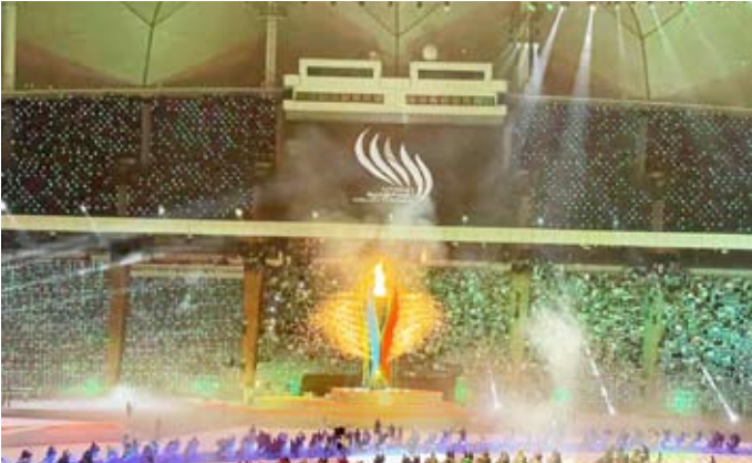
جانب من افتتاح البطولة بالرياض

وأكد المري أن إقامة هذه الدورة برعاية خادم الحرمين الشريفين الملك سلمان بن عبدالعزيز وتوجيهات واهتمام ولي العهد رئيس مجلس الوزراء السعودي الأمير محمد بن سلمان يدل على الاهتمام الكبير بالرياضة والنهوض بها عربياً عن الامنيات بالتوفيق للمملكة العربية السعودية في المحافل الكبيرة التي تصبو إليها متمنياً لها مزيداً من التوفيق في الرياضة وفي جميع المجالات. وضم الوفد الكويتي المشارك عضو مجلس إدارة اللجنة الأولمبية الشيخ مبارك فيصل نواف الأحمد الصباح والأمين العام للجنة حسين المسلم. يذكر أن منافسات الألعاب السعودية تقام في 22 منشأة بمدينة الرياض وبمشاركة أكثر من 6000 رياضي ورياضية وتستمر حتى 7 نوفمبر المقبل.