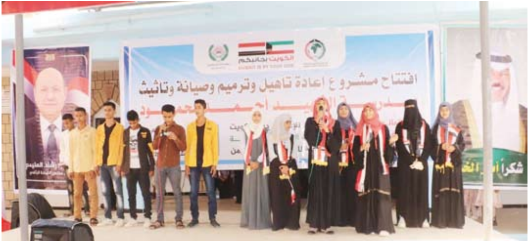
جانب من حفل افتتاح المدرسة

تعليمية ملائمة للطلاب. وأوضح أن (الكويتية للأغاثه) أسهمت خلال الفترة الماضية في ترميم وصيانة وتجهيز العديد من المدارس والكلليات والمعاهد والمؤسسات التعليمية في (تعز) ومختلف المحافظات اليمنية. وكانت الجمعية الكويتية للأغاثه قد أنجزت في شهر أغسطس الماضي تجهيز وتأثيث ثمانية مدارس أساسية وثانوية