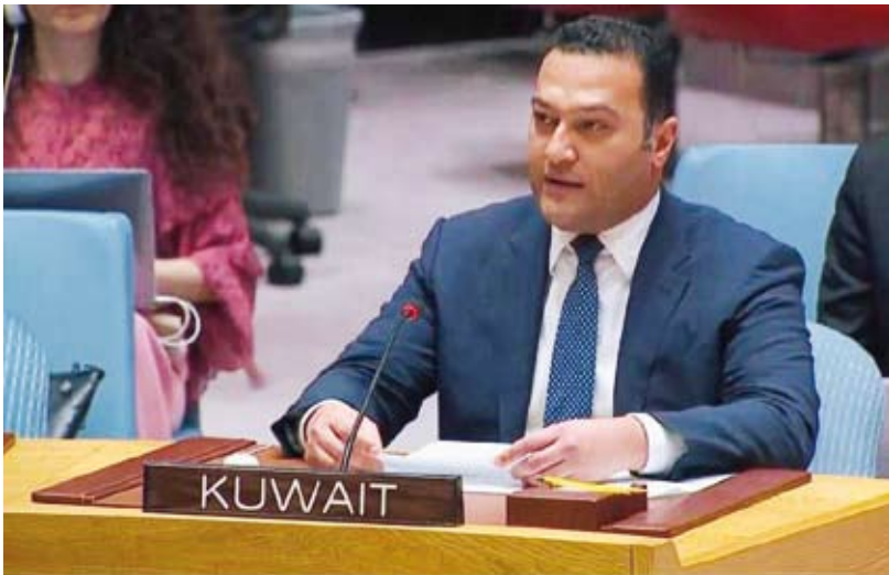
المستشار فيصل العنزي يلقي كلمة الكويت

حيث دولة الكويت صمود الشعب الفلسطيني، معربة عن دعمه لنضاله المشروع ضد الاحتلال الإسرائيلي بغية الحصول على كامل حقوقه السياسية المشروعة.