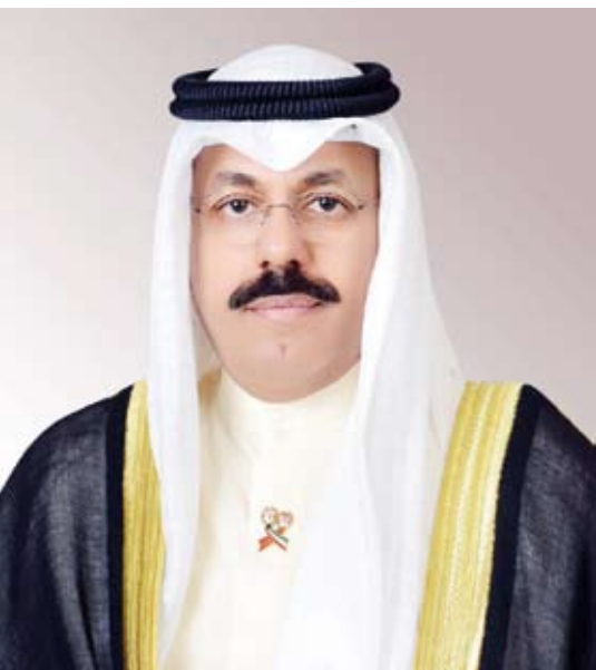
سمو الشيخ أحمد النواف

بعث سمو الشيخ أحمد النواف رئيس مجلس الوزراء، ببرقية تهنئة إلى الرئيس رجب طيب أردوغان رئيس الجمهورية التركية الصديقة بمناسبة العيد الوطني لبلاده.