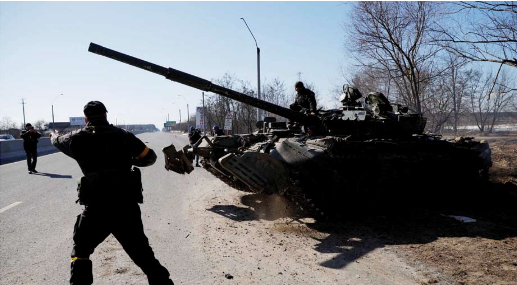
جنود خلال المعارك

أعلنت السلطات في القرم التي ضَمَّتْها موسكو بأنه تم بنجاح «صد» وإسقاط» كل المِسيِرات التي هاجمت ميناء سيفاستوبول في شبه الجزيرة.