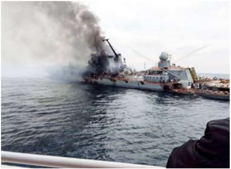
أحدى سفن الاسطول الروسي المتضررة في البحر الاسود

وكتبت وزارة الدفاع الروسية على تلغرام «التحضير لهذا العمل الإرهابي وتدريب عسكريين في المركز الأوكراني ال73 للعمليات البحرية الخاصة، نفذهما متخصصون بريطانيون مقرهم في أوتشاكوف في منطقة ميكولايف الأوكرانية». وهذه السفن كانت تشارك في حماية قوافل تصدير الحبوب الأوكرانية، بحسب موسكو. كما أعلنت السلطات في شبه جزيرة القرم أنه تم بنجاح صد وإسقاط كل الطائرات المسيرة التي هاجمت ميناء سيفاستوبول.