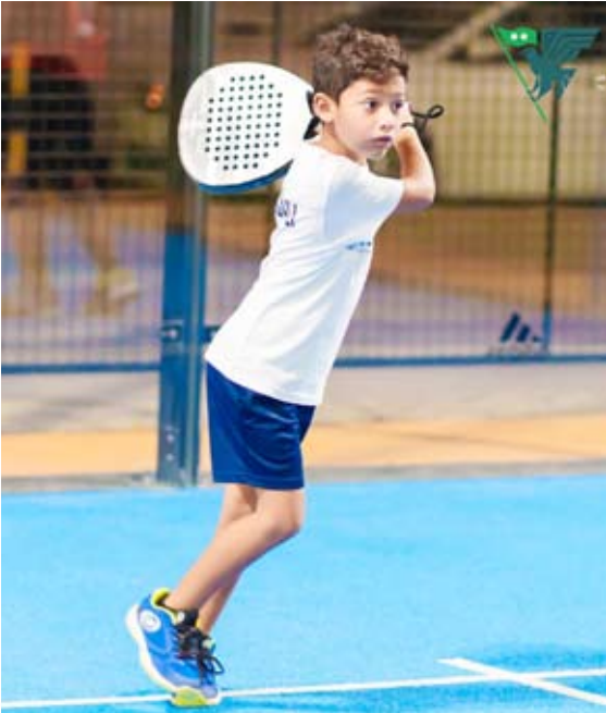
إقبال كبير من الشباب على لعبة البادل

لم تعد ممارسة رياضة (البادل) في الكويت تقتصر على أوساط الشباب بل تعدت ذلك لتنتشر بكثافة بين الأطفال واليافعين من الجنسين وباتت هذه الرياضة ذات الانتشار الواسع في البلاد منذ عامين إحدى أكثر الرياضات استقطاباً لهم الأمر الذي يعود عليهم بالفائدة والصحة وملء أوقات الفراغ.