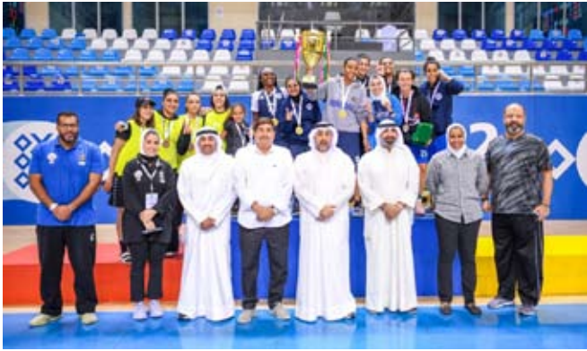
الفتاة - أ يحتفل بالتتويج

أحرز نادي (الفتاة-أ) لقب بطولة (3/3) لكرة السلة للسيدات وهي أولى البطولات المحلية للسيدات لهذا الموسم الرياضي (2022/2023) ونظمها الاتحاد الكويتي للعبة بعد فوزه في المباراة النهائية على نظيره بالمرکز الثاني نادي (الفتاة-ب) بنتيجة (14-9).