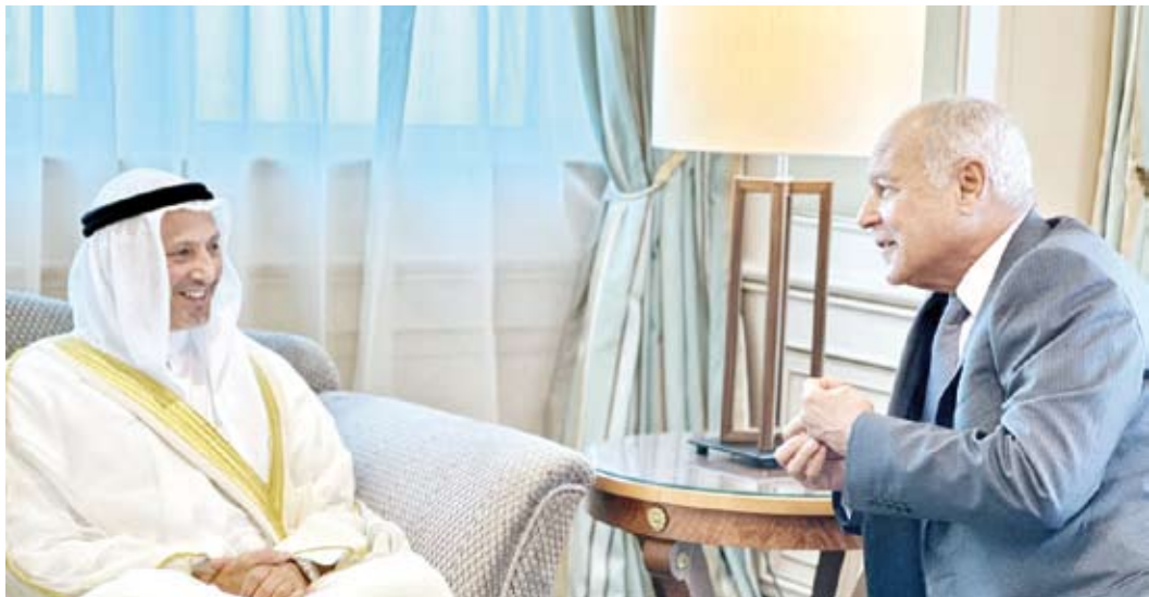
وزير الخارجية يلتقي أمين عام جامعة الدول العربية

قال وزير الخارجية الكويتي الشيخ سالم الصباح، أول أمس: إن القمة العربية الـ 31 المقررة بالجزائر ستحقق أهدافها وستثمر “نتائج إيجابية“، مشيراً إلى أن التطورات المتسارعة التي يشهدها العالم تستوجب “إبراز وحدتنا والحفاظ على مصالح شعوبنا“.