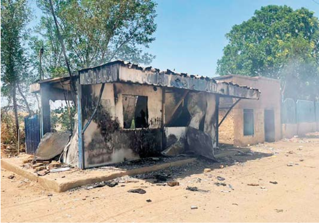
منشأة مخربة في النيل الأزرق

أعلن الجيش السوداني هدوء الأوضاع في إقليم النيل الأزرق المضطرب، بما يمكنه من الشروع في معالجات جذرية لأسباب العنف الذي شهده الإقليم وتسبب بإزهاق أرواح المئات وتشريد عشرات الآلاف خلال الأسابيع والأشهر الماضية.