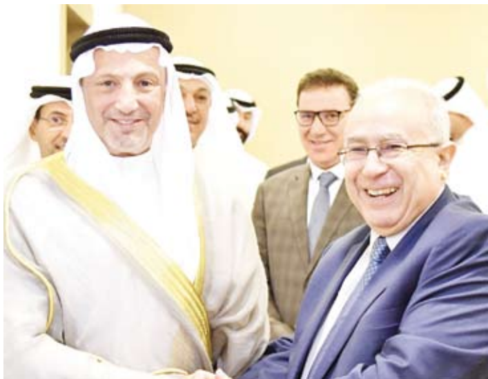
الشيخ سالم الصباح مع نظيره الجزائري رمضان لعمامرة

وتم خلال اللقاء بحث العلاقات الثنائية الوثيقة التي تربط البلدين