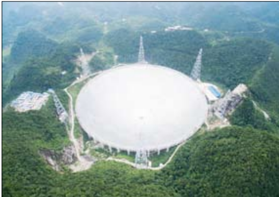
تلسكوب "عين السماء" الصيني

ويعد "عين السماء" أكبر تلسكوب راديوي أحادي الفتحة وأكثرها حساسية في العالم مع فتحة قطر ما 500 متر، ويمكن لحساسيته العالية للغاية اكتشاف الإشعاع الخافت المنبعث من الغازات الذرية الرقيقة للغاية المنتشرة بعيدا عن مركز المجرة.ومنذ تدشينه في سبتمبر 2016، حقق هذا التلسكوب نتائج علمية في العديد من الاتجاهات البحثية، مما وسع أفق المراقبة وعمق الفهم البشري للكون. ففي 31 مارس من العام الماضي تم رسميا Maras هذا التلسكوب أمام العالم للمشاركة في استغلاله، وقد تلقى طلبات المراقبة من علماء الفلك في جميع أنحاء العالم، وتم إطلاق الملاحظات العلمية في أغسطس 2021.