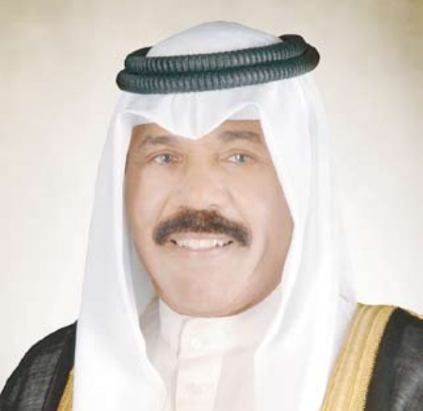
سمو أمير البلاد الشيخ نواف الأحمد

بعث صاحب السمو أمير البلاد الشيخ نواف الأحمد، ببرقية تهنئة إلى الرئيس رجب طيب أردوغان رئيس الجمهورية التركية الصديقة، عبر فيها سموه عن خالص تهانئه بمناسبة العيد الوطني لبلاده، متمنياً سموه لفخامته موفقور الصحة والعافية وللجمهورية التركية وشعبها الصديق كل التقدم والأزدهار.