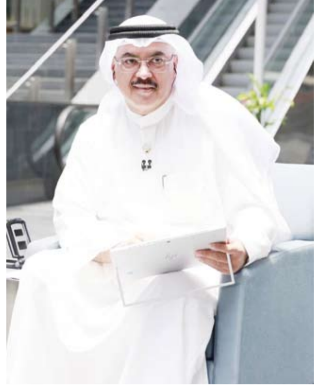
وزير التربية سيد جلال الطبطبائي أثناء إعلان النتائج

وزير التربية لـ «الطبة»: أنتم فخر أسركم وثروة وطننا