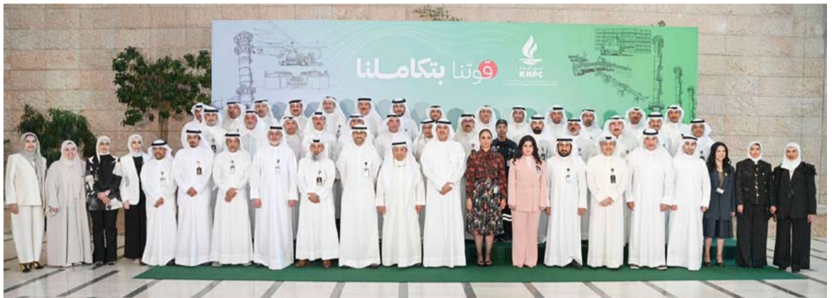
المشاركون في صورة جماعية

◆ تعزيز التكامل بين التكرير والإنتاج والتسويق لتحقيق مستهدفات 2040