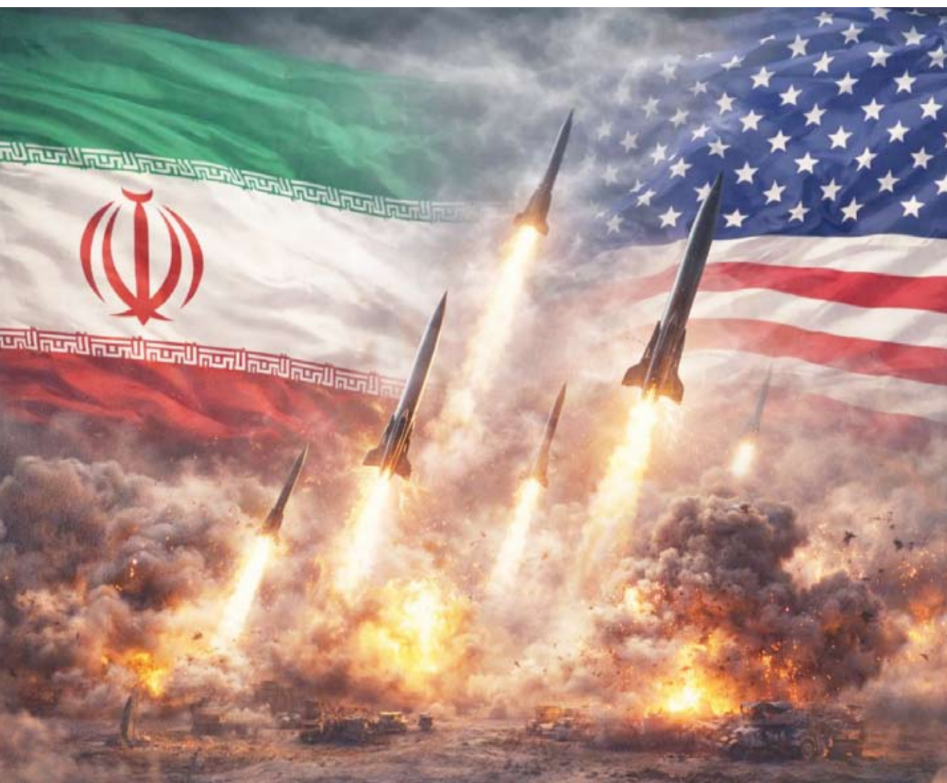
الجهود الدبلوماسية جارية لحل الملفات العالقة

مؤكدة أنها لا تعترم لقاء الوفد الأميركي الذي وصل إلى الدوحة، بينما أكدت إيران بقاء ملف صواريخ طهران الباليستية وملفها النووي خارج إطار التفاوض.