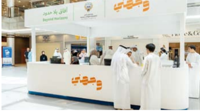
تشدين الدعم الفني لخدمات نظام التسجيل في خطة البعثات الخارجية ضمن الحملة