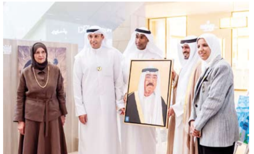
الشيخ صباح بدر الصباح خلال عرض إحدى صور المشاركين

والذي قام 30 معلماً ومعلمة من قسم التربية الفنية في الوزارة من خلاله بترجمة الأقوال السامية إلى لوحات فنية يعكس العلاقة المميزة بين سمو أمير البلاد وأبنائه المواطنين. وتقدم الحمد بالشكر والتقدير لحافظ مبارك الكبير ومحافظ حولي بالتكليف على رعايته وحضوره المعرض، الذي شهد إقبالاً مميزاً، كما توجه بالشكر لكل معلم ومعلمة على مساهمتهم بهذا العمل الوطني، متمنياً لهم التوفيق في عملهم ومستقبلهم المهني.