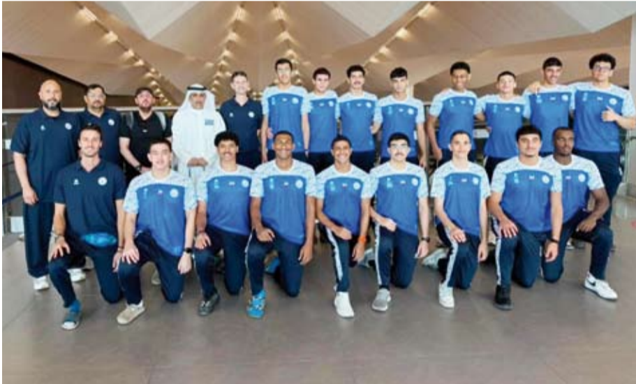
وفد منتخب الكويت لكرة السلة للشباب التوجه إلى القاهرة