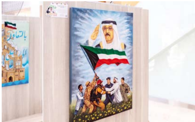
لوحة لأحد المعلمين المشاركين في المعرض