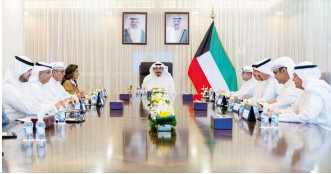
سمو الشيخ أحمد العبدالله يترأس الاجتماع

ترأس سمو الشيخ أحمد العبدالله رئيس مجلس الوزراء، اجتماعاً، أمس، لبحث سبل تطوير البنية التحتية واستكمال خطط حصر وتصنيف الأراضي المملوكة للدولة بما يسهم في تعزيز الكفاءة الإدارية والاقتصادية واللوجستية تنفيذاً لرؤية البلاد التنموية. وحضر الاجتماع وزير الأشغال العامة الدكتور نورة المشعان، ووزير الدولة لشؤون البلدية ووزير الدولة لشؤون الإسكان عبداللطيف المشاري، ووزير الكهرباء والماء والطاقة المتجددة الدكتور صبيح المخيزم، ووزير التجارة والصناعة أسامة بسودي، ووزير الدولة للشؤون الاقتصادية والاستثمار عبدالعزيز المزروع، ومدير عام هيئة تشجيع الاستثمار المباشر الشيخ الدكتور مشعل جابر الأحمد، ورئيس ديوان رئيس مجلس الوزراء بالإنابة الشيخ خالد محمد الخالد، والعضو المنتدب للهيئة العامة للاستثمار الشيخ سعود سالم عبدالعزيز الصباح، ورئيس مجلس إدارة الشركة الكويتية للتخزين حازم العيسى. من جهة أخرى، بعث سمو الشيخ أحمد العبدالله رئيس مجلس الوزراء، ببرقية تهنئة إلى الرئيس حسن شيخ محمود رئيس جمهورية الصومال الفيدرالية الشقيقة بمناسبة ذكرى الاستقلال لبلادها. كما بعث سمو الشيخ أحمد العبدالله رئيس