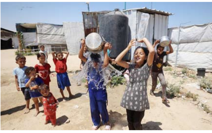
أطفال فلسطينيون داخل مخيم للنازحين في النصيرات

ويرى المصدر أن «الأهم في هذه الجولة أن حركة (حماس) تبدي خطوات إيجابية، ووفداً يحمل تفويضاً كاملاً لاتخاذ القرارات، وسط مشاركة فصائل فلسطينية أخرى».