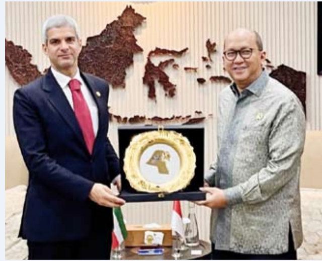
السفير خالد الياسين خلال لقائه وزير روسان روسلاني

بحث سفير دولة الكويت لدى إندونيسيا خالد الياسين مع مسؤولين إندونيسيين سبل تعزيز التعاون الاقتصادي والاستثماري بين البلدين والقضايا ذات الاهتمام المشترك. وقالت سفارة دولة الكويت لدى إندونيسيا في بيان تلقت (كونا) نسخة منه، أمس: إن السفير الياسين اجتمع مع وزير الاستثمار والصناعات التحويلية والرئيس التنفيذي لوكالة إدارة الاستثمار (داناانتارا) الإندونيسي روسان روسلاني لبحث سبل تعزيز التعاون الاقتصادي بين البلدين. وأضاف البيان أن المسؤول الإندونيسي أكد خلال الاجتماع ترحيب بلاده بتطوير العلاقات الاقتصادية والتجارية والاستثمارية مع دولة الكويت، مشيراً إلى توفر العديد من الفرص الاستثمارية المتاحة في إندونيسيا لرؤوس الأموال الأجنبية.