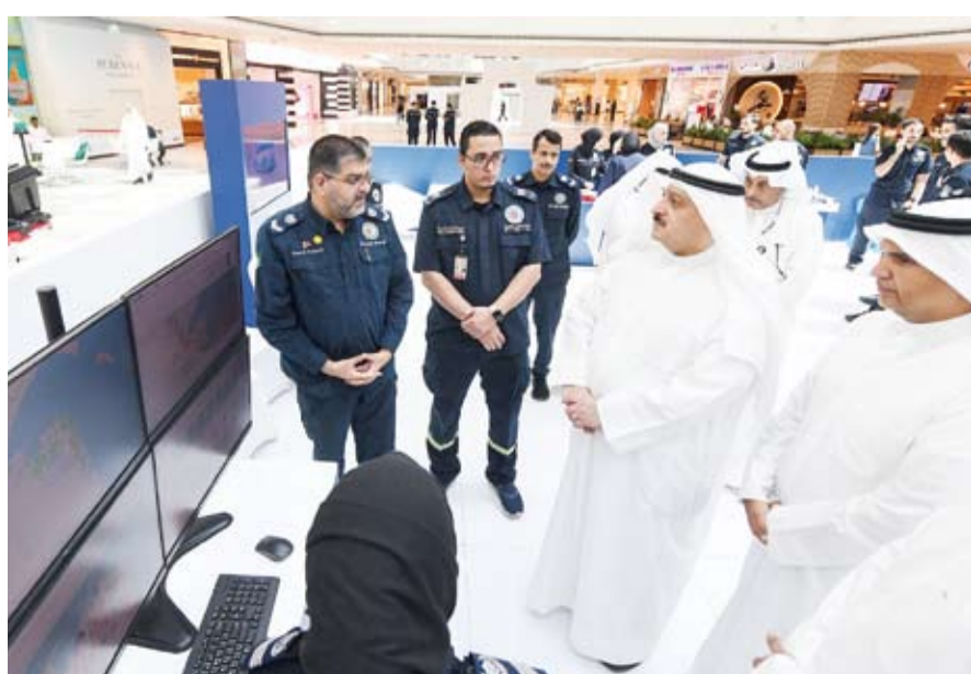
وزير الصحة الدكتور احمد العوضي يطلع على المعرض المقام بمناسبة يوم المسعف العالمي

وأشارت إلى أن المبادرة تهدف لإيجاد مناطق معيشية متناغمة بيئياً والحرص على توظيف أفضل الممارسات البيئية في بيوت الله بما يسهم في ترشيد استهلاك الموارد وتعزيز الاستدامة.