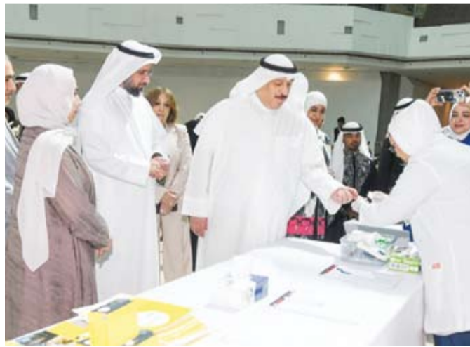
وزير الصحة خلال تدشين الدليل الغذائي لمرضى السكري

الدليل الغذائي جاء ضمن سلسلة الدلائل الإرشادية الغذائية التي تصدرها إدارة التغذية والإطعام حيث تم تشكيل فريق عمل متخصص من الكوادر الطبية والفنية للإشراف على جميع مراحل الإعداد والتطوير وفق أحدث التوصيات العلمية والمعايير الغذائية المعتمدة كما تم إجراءات تسجيله وإيداعه لدى المكتبة الوطنية الكويتية.