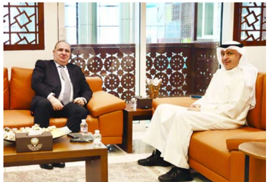
أسامة بودي مستقبلاً إيميل كريموف

بحث وزير التجارة والصناعة أسامة بودي مع سفير جمهورية أذربيجان لدى دولة الكويت إيميل كريموف سبل تعزيز العلاقات الثنائية بين البلدين، وتطوير التعاون في المجالات التجارية والاقتصادية، بما يخدم المصالح المشتركة. وقالت وزارة التجارة والصناعة، في بيان، إن اللقاء تناول آفاق تنمية التبادل التجاري بين الكويت وأذربيجان، واستعراض الفرص المتاحة لتعزيز التعاون الاقتصادي وتوسيع مجالات