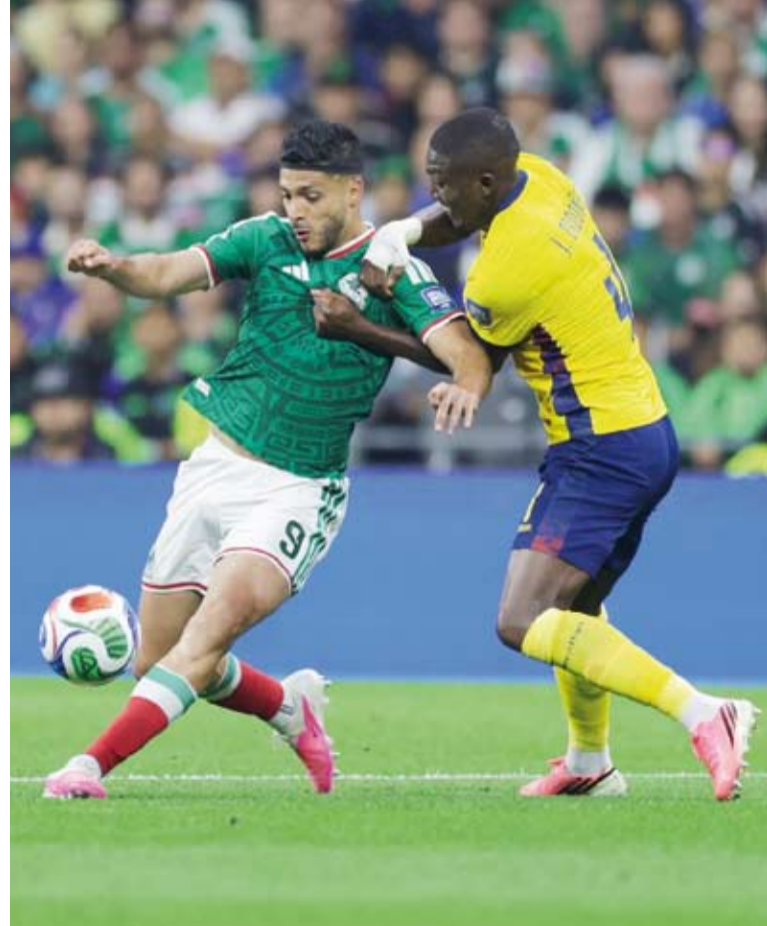
أداء قوي للاعب المكسيك أمام الإكوادور

واصل منتخب المكسيك حملته الناجحة حتى الآن في بطولة كأس العالم لكرة القدم، بعدما تاهل إلى دور ال16 في المباراة، عقب فوزه (2-0) على منتخب الإكوادور، في دور ال32 للموندياال، المقام حالياً في الولايات المتحدة وكندا والمكسيك. وفي ملعب «مكسيكو سيتي»، تقدم المنتخب