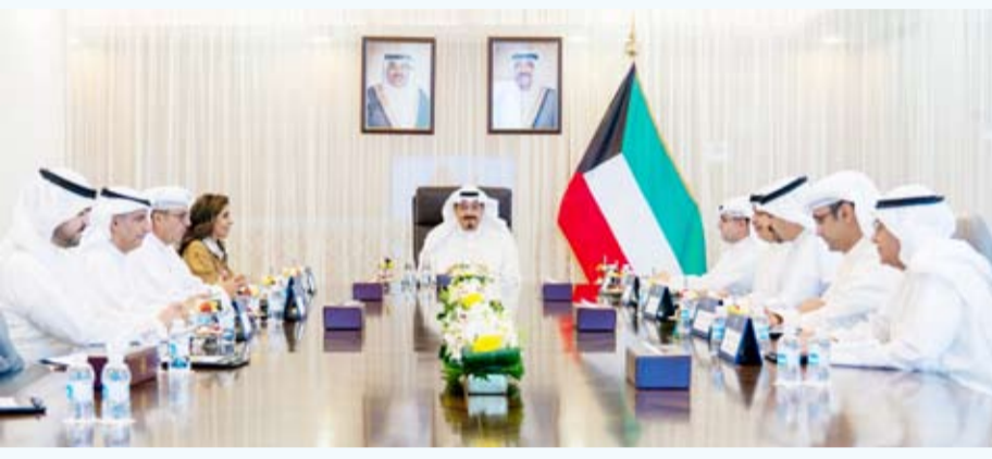
العبدالله ترأس اجتماعاً لبحث سبل تطوير البنية التحتية

ترأس سمو الشيخ أحمد العبدالله رئيس مجلس الوزراء اجتماعاً لبحث سبل تطوير البنية التحتية واستكمال خطط حصر وتصنيف الأراضي المملوكة للدولة بما يسهم في تعزيز الكفاءة الإدارية والاقتصادية واللوجستية تنفيذاً لرؤية البلاد التنموية. حضر الاجتماع وزير الأشغال العامة د.نورة المشعان ووزير الدولة لشؤون البلدية ووزير الدولة لشؤون الإسكان عبداللطيف المشاري ووزير الكهرباء والماء والطاقة المتجددة د.صبح المخيريم ووزير التجارة والصناعة أسامة بوذي ووزير الدولة للشؤون الاقتصادية والاستثمار عبدالعزيز المرزوق ومدير عام هيئة تشجيع الاستثمار المباشر الشيخ الدكتور