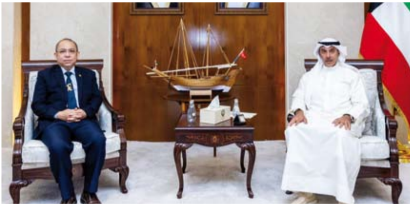
نائب وزير الخارجية يستقبل سفير ميانمار لدى البلاد