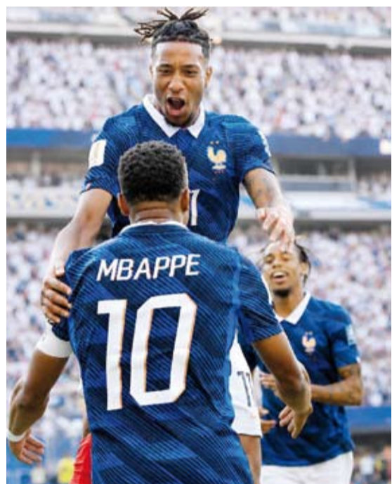
مبابي يحتفل بالتسجيل

لمباراة فرنسا ضد باراغواي في دور ال16 من بطولة كأس العالم 2026. المباراة ستعقد في 1 يوليو في مينيابوليس، مينيسوتا، الولايات المتحدة.