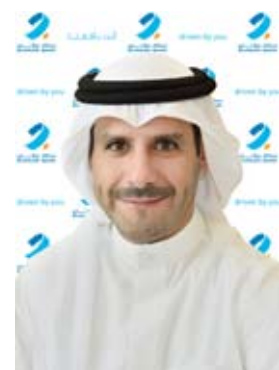
الشيخ عبدالله ناصر

الراسخ بوضع خطة التحول الرقمي طويلة الأمد والتركيز على خدمات الأفراد موضع التنفيذ، وجاء نجاح حساب كنز الجديد نتيجة لهذا التركيز. وكجزء من هدفنا المختل في توفير تجربة مصرفية أكثر كفاءة وأماناً لعملائنا، قدّم برقان العديد من المزايا وأضاف ميزات جديدة إلى خدماته المقدمة عبر تطبيق بنك برقان على الهاتف المحمول، وذلك لتلبية لاحتياجات المتغيرة لعملائنا. وشمل ذلك تقديم النموذج الإلكتروني “إعرف عميلك” (eKYC)، وميزة “قدم طلبك الآن” للمنتجات، إضافة إلى التصميم الاستراتيجي وتطوير العمليات.