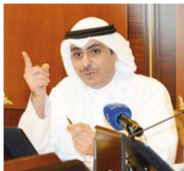
الشيخ أحمد المشعل

أكد رئيس جهاز متابعة الأداء الحكومي، الشيخ أحمد المشعل، أنه أحد جنود السلطة التنفيذية الذين يعملون تحت رئاسة سمو رئيس مجلس الوزراء الشيخ أحمد النواف، رافضاً ما جاء على لسان عضو المجلس المطبل عبد الوهاب العيسى بوجود صراع الشيخ أحمد النواف وأن هناك حكومتين داخل دولة الكويت تتصارع فيما بينها. وجاء في بيان صحفي نشره الجهاز عبر حسابه الرسمي على "تويتر": "تعقيباً على ما صرح به