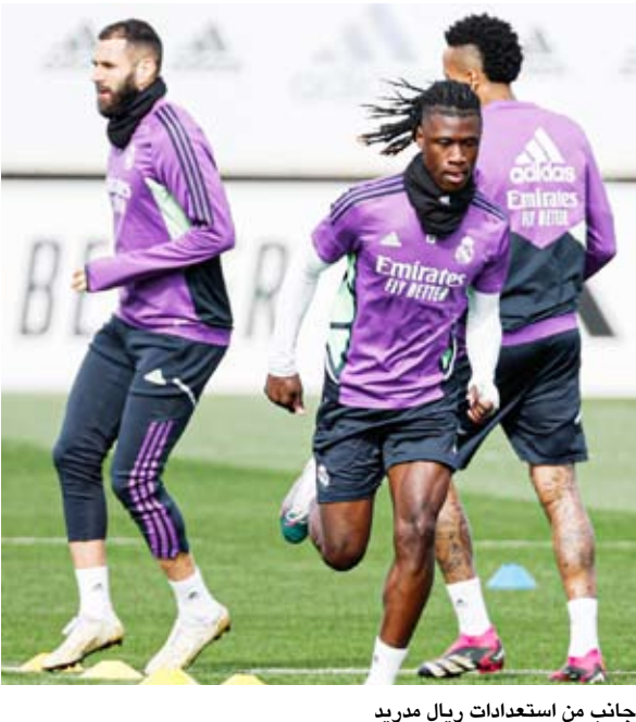
جانب من استعدادات ريال مدريد