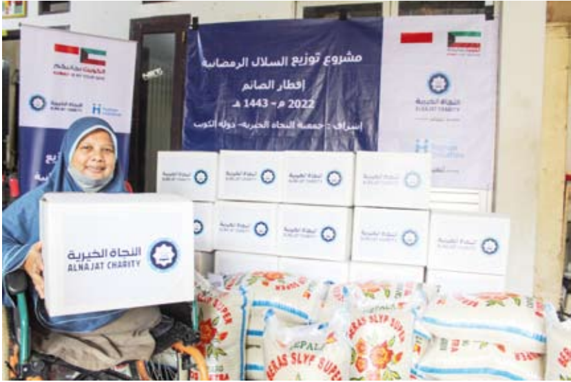
توزيع السلال خارج الكويت

يمكن للمتبرعين التواصل مع زكاة الأندلس عبر الاتصال هاتفياً، أو زيارة مقرها بمنطقة الأندلس.