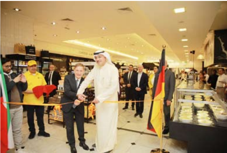
السفير الألماني يقص شريط الافتتاح

افتتحت شركة دانكه فرعها الجديد داخل «دين اند ديلوكا» في الأفقيوز، بحضور السفير السفير الألماني في الكويت هانز كريستيان فون رابينجتز، و رجل الأعمال بدر الشريفي مؤسس مشروع دانكه بابتو ماركيت، تحت مظلة مجموعة بافاريا و فلوران بورو ومثلاً لمجموعة الشايح، بالإضافة إلى عدد كبير من الصحافيين و الاعلامين و الضيوف .