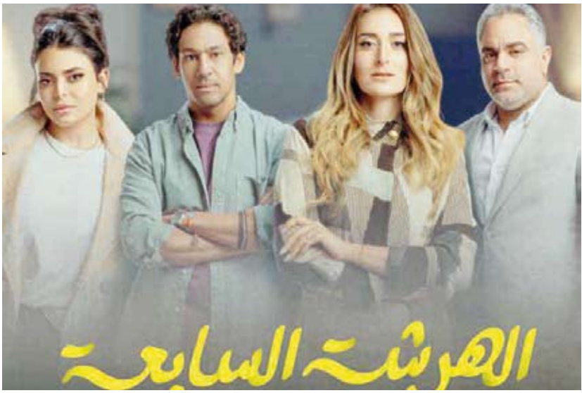
مسلسل «الهرشة السابعة»

وأشار عبد الشكور إلى أكثر من عامل تسبب في لفت الأنظار للمسلسل، وأوضح أن «المشاهد يشعر خلال المشاهدة بأن الكاميرا قد تسللت إلى بيت يعرفه، فالشخصيات تشبه تلك التي يراها في حياته اليومية، والفاصل والتعبيرات في مكانها دون ثثرة في السرد، مع توظيف ممتاز للموسيقى بدلاً من ضجيج شريط الصوت والموسيقى في كثير من المسلسلات، إضافة إلى أداء يعتمد