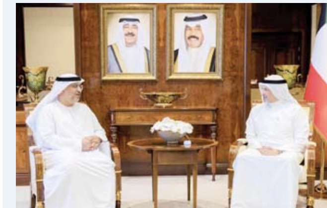
الشيخ سالم الصباح يستقبل السفير الإماراتي

بمناسبة حلول شهر رمضان المبارك، استقبل وزير الخارجية الشيخ سالم الصباح وجرمه الشقيقة ربما الصباح، مساء الخميس الماضي في قاعة صباح الأحمد الكبرى بديوان عام وزارة الخارجية، رؤساء البعثات الدبلوماسية والمنظمات الإقليمية والدولية المعتمدين لدى دولة الكويت، بحضور نائب وزير الخارجية السفير منصور العتيبي ومساعد وزير والسفراء وكبار المسؤولين بالوزارة. وقد نقل وزير الخارجية للحضور تحيات صاحب السمو أمير البلاد الشيخ نواف الأحمد