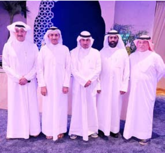
القحطان في لحظة تذكارية مع بعض المسؤولين

سبع عشرة عاماً، مشيراً على أن هذا النجاح والنقة المتبادلة بين الشركة وعملائها جاء من خلال الجهد والمخاطرة للتغلب على الصعوبات وتحدياتها كل حين خلال السنوات الماضية.