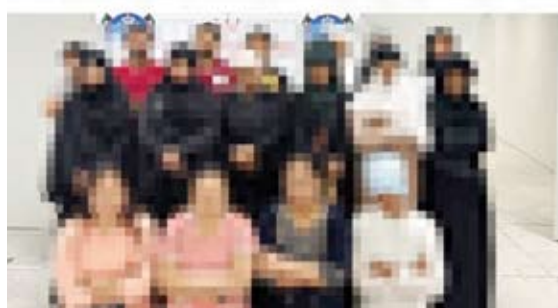
ضبط شخص بتهمة تزوير طوابع مالية