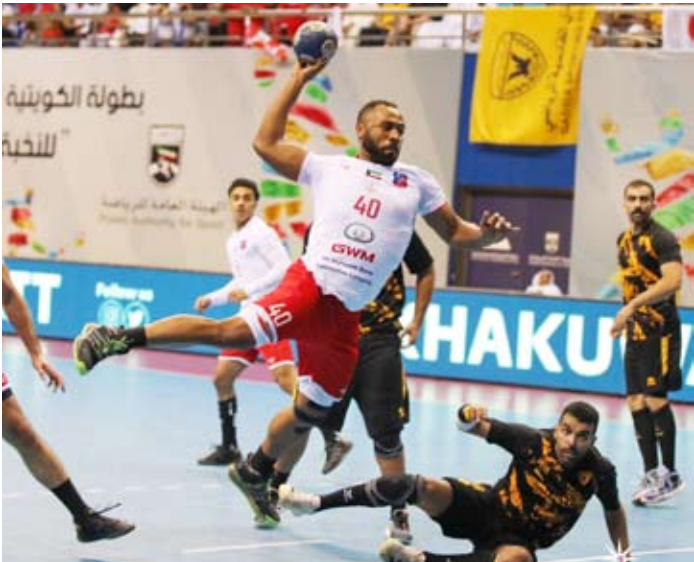
الأبيض اكتسح الأصفر في مباراة من طرف واحد

وانتهى الشوط الأول (19-10) لصالح الكويت الذي واصل هيمنته على الشوط الثاني.