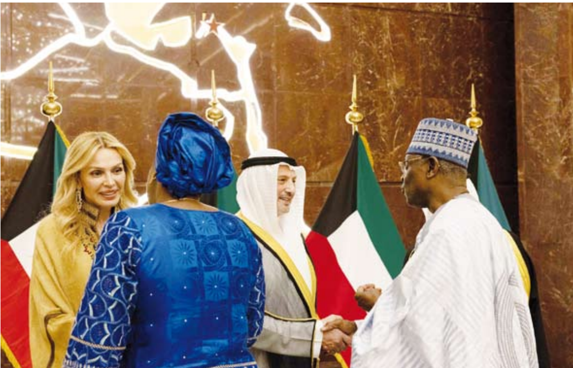
وزير الخارجية وجرمه خلال حفل الاستقبال