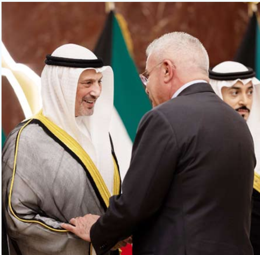
الشيخ سالم العبدالله يستقبل رؤساء البعثات الدبلوماسية والمنظمات الإقليمية والدولية المعتمدين لدى البلاد

بمناسبة حلول شهر رمضان المبارك استقبل وزير الخارجية الشيخ سالم العبدالله وحرمة الشيخة ريم الصباح مساء الخميس 30 مارس الماضي في قاعة صباح الأحمد الكبرى بديوان عام وزارة الخارجية رؤساء البعثات الدبلوماسية والمنظمات الإقليمية والدولية المعتمدين لدى دولة الكويت بحضور نائب وزير الخارجية السفير منصور العتيبي ومساعدى الوزير والسفراء وكبار المسؤولين بالوزارة.