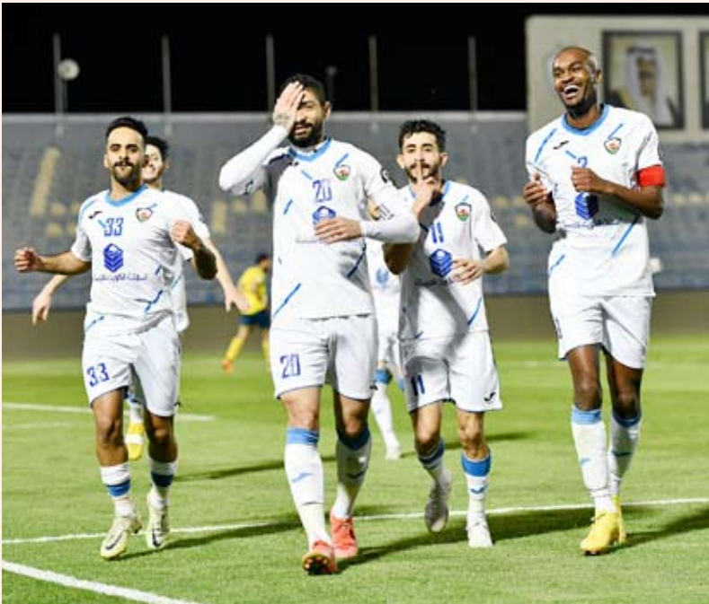
الجهراء يحتفل على طريقة ليفربول الإنجليزي