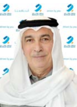
مسعود جوهر حيات

وخلال الاجتماع، أشاد الشيخ عبدالله ناصر صباح الأحمد الصباح، رئيس مجلس إدارة بنك برقان، بالتقدّم المميز الذي حققه البنك خلال مسيرته الاستراتيجية، مدعوماً بالنمو الكبير في مؤشرات الرئيسية، بما في ذلك صافي الدخل، حيث سجل البنك إيرادات مستقرة بلغت 232 مليون دينار كويتي لعام 2022، مدفوعة بانتعاش قوي في صافي دخل الفوائد، بزيادة قدرها 15 بالمئة على