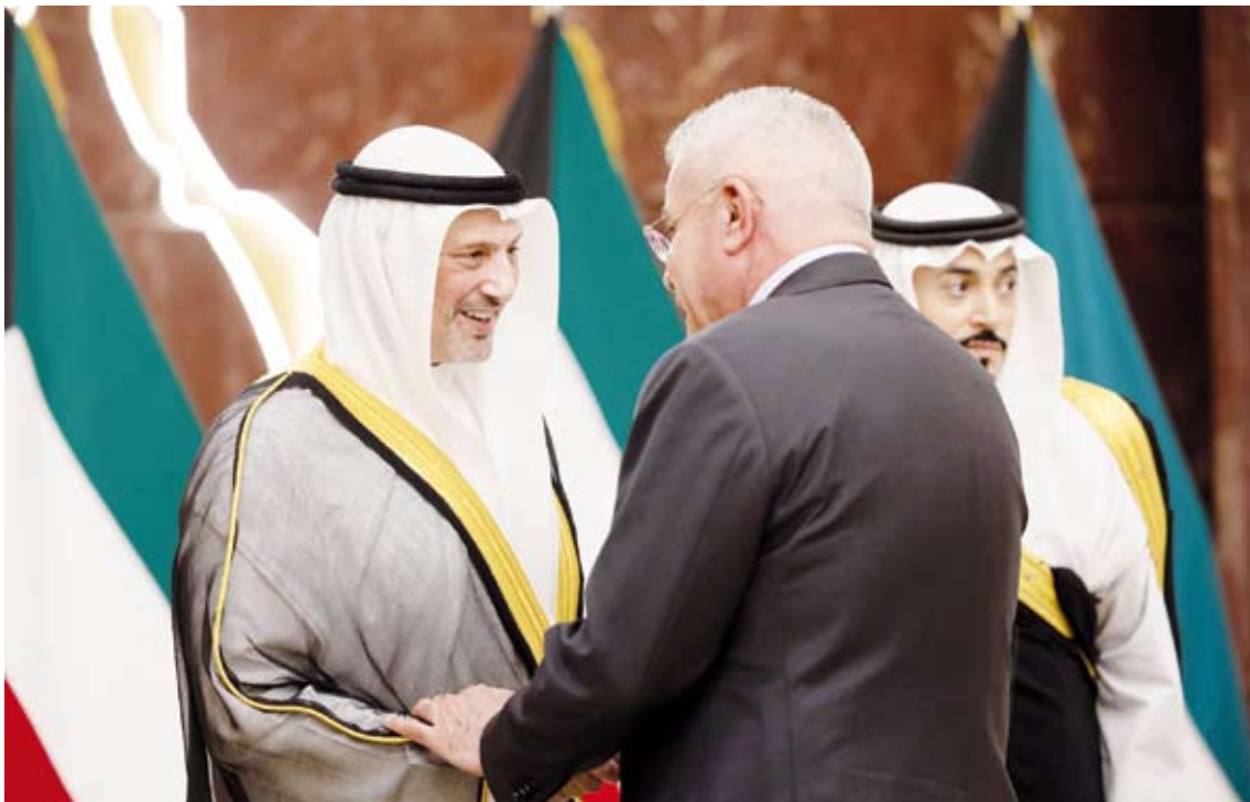
وزير الخارجية يستقبل رؤساء البعثات الدبلوماسية والمنظمات الإقليمية والدولية