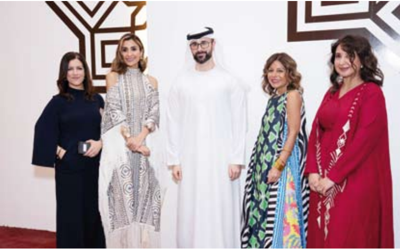
... ويرحب بجانب من الإعلاميات