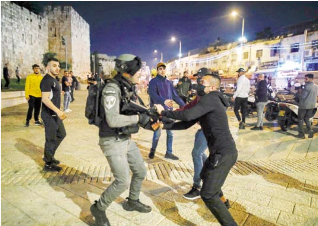
اشتباكات عنيفة في القدس

قالت الشرطة الإسرائيلية إنها قتلت «إرهابياً» حاول الاستيلاء على سلاح شرطي إسرائيلي بالقرب من المسجد الأقصى في القدس. وحصلت الواقعة قرب باب السلسلة أحد الأبواب المؤدية إلى الحرم القدسي حيث كان «مشتبه به» قد اعتقل بهدف استجوابه فأسك بسلاح شرطي وتمكن من إطلاق رصاصة واحدة من دون إصابة أحد قبل أن يتم قتله، وفق بيان للشرطة.