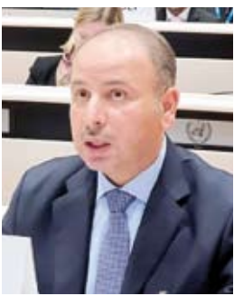
السفير ناصر الهين

ودعم "أوتشا" وزارة الصحة التركية بحوالي 4.6 ملايين جرعة لقاح و16 عبادة صحية متنقلة بالإضافة إلى الأدوية والمستلزمات الطبية للصحة الإنجابية ورعاية الإصابات.