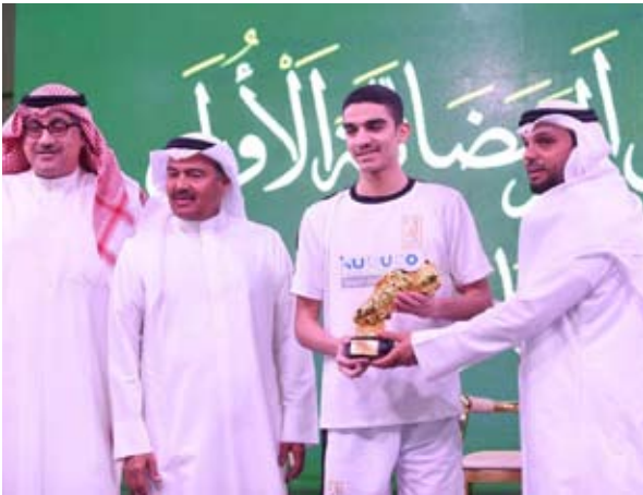
تتويج الفرق الفائزة