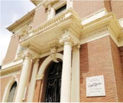
قصر عائشة فهمي بالقاهرة

يعتبر قصر (عائشة فهمي) أحد أهم معالم حي الزمالك العريق بالقاهرة نظراً لبيئته وتصميمه الفريد وإطلالته الرائعة على نهر النيل فضلاً عن قيمته وتأثيره الثقافي الكبير كمجمع للفنون حيث يضم سينما ومكتبة ومسرحاً.