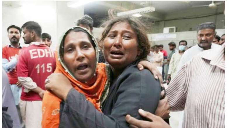
التدافع وقع أثناء توزيع الزكاة على أسر العاملين في إحدى الشركات بكراتشي

لقي ما لا يقل عن 12 شخصا حتفهم امس الاول وأصيب أربعة آخرون أثناء تدافع خلال توزيع الزكاة بمدينة كراتشي جنوب باكستان. وأوضح نائب المفتش العام لشرطة كراتشي عرفان بلوش في تصريحات صحفية أن التدافع وقع أثناء توزيع الزكاة على أسر العاملين في إحدى الشركات الخاصة بالمنطقة الصناعية بكراتشي وراح ضحيته 12 شخصا. وأدى التدافع لإصابة أربعة أشخاص بينهم نساء وجرى نقل الجرحى إلى أقرب مستشفى فيما فتح تحقيق في ملابساته. وأكدت طبية بالمستشفى أن من بين القتلى ثلاثة أطفال.