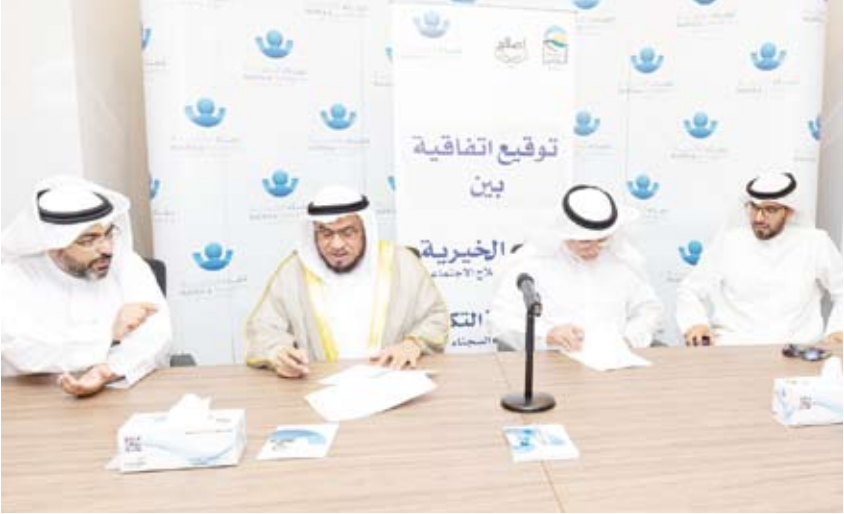
جانب من توقيع اتفاقية الشراكة