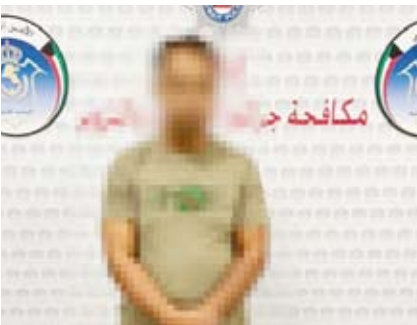
ضبط 17 شخصاً من المخالفين