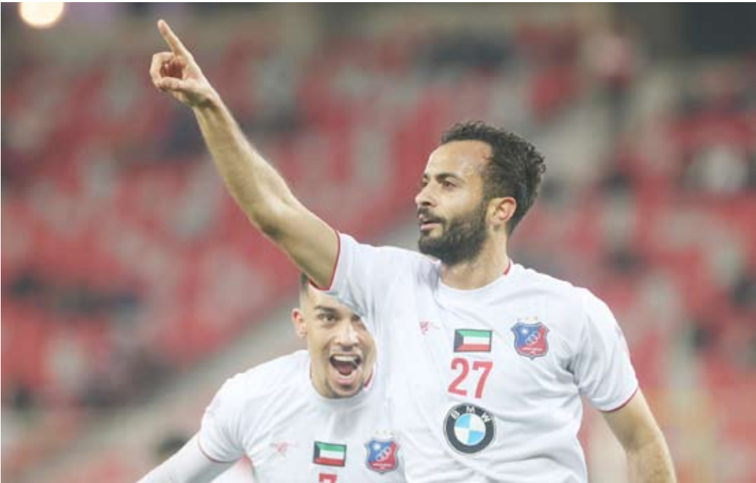
الأبيض بمعنويات مرتفعة أمام السماوي