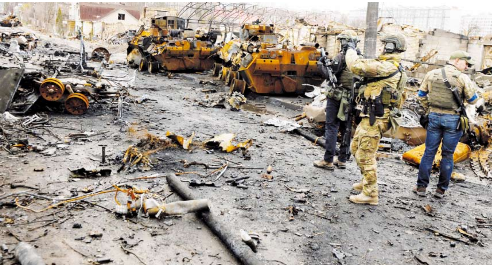
بلدة بوتشا تقع شمال غرب أوكرانيا

أحيا الرئيس الأوكراني فولوديمير زيلينسكي ذكرى ضحايا «جرائم الحرب الروسية» في بلدة بوتشا بشمال غربي كييف التي تنفي موسكو ارتكابها، وذلك بمقطع مصور في الذكرى السنوية الأولى لانسحاب القوات الروسية منها.