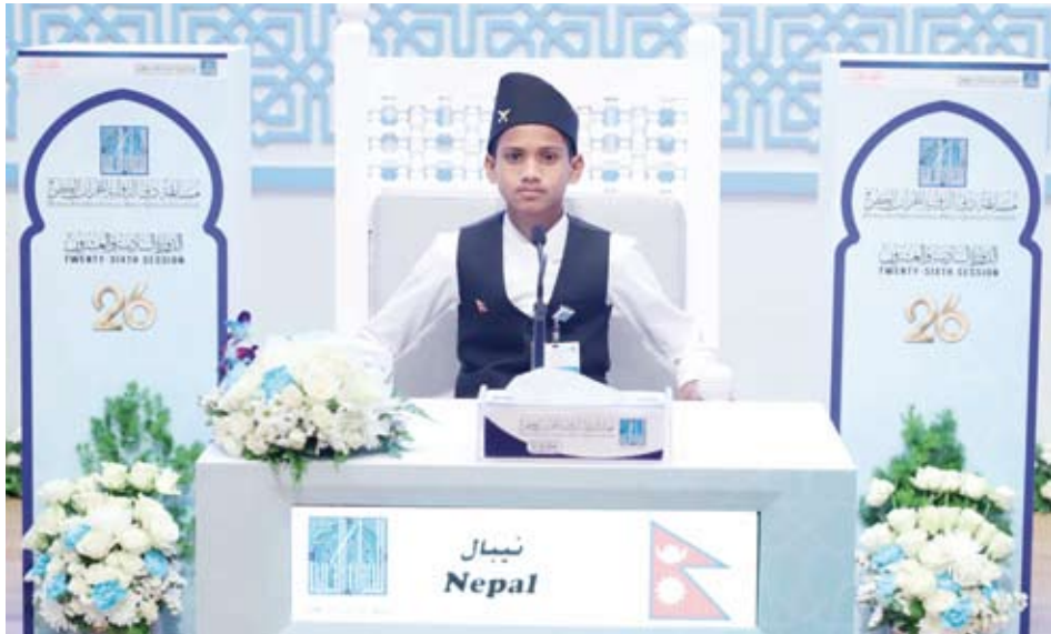
متسابق من نيبال