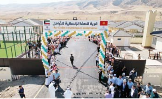
قرية الصفا للأرامل والأيتام تضم 100 بيتاً