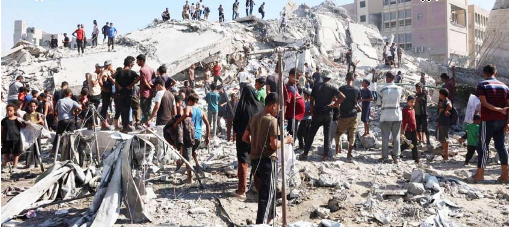
دمار كبيرة في غزة نتيجة الحرب

يلتقي الوسطاء من مصر وقطر الوفد التفاوضي لـ«حماس» في الدوحة، بينما وضع الرئيس الأميركي دونالد ترامب فترة زمنية بين 4 إلى 4 أيام لوصول رد الحركة الفلسطينية، «والإستفعل إسرائيل ما يجب فعله». وبين سندان موعد ترامب، ومطرفة بنود الخطة الأميركية التي تشمل وقف إطلاق النار في قطاع غزة، ونزع سلاح حركة «حماس»، يرى خبراء تحذروا لـ«الشرق الأوسط»، أن «رافهية رفض الحركة للمبادرة التي قبلت عربياً تبدو صفرية، ومن ثمّ الأقرب لضغوط من الوسطاء للذهاب لمفاوضات تحث تفاصيل التنفيذ، عبر تقريب وجهات النظر وتقديم تفسيرات وضمائم على أن يكون وقف إطلاق النار قريباً». وفي 23 سبتمبر الحالي، طرح ترامب، خطة من 20 بنداً لإنهاء الحرب على غزة، خلال لقاء مع قادة ومسؤولي 8 دول عربية وإسلامية في نيويورك بينهم مصر والسعودية وقطر وتركيا، قبل أن يعلن الرئيس