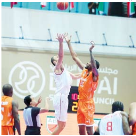
كاظمة يخسر أمام العربي القطري

خسر فريق نادي كاظمة الكويتي لكرة السلة أمام نظيره العربي القطري بنتيجة (88-75) في اللقاء الذي جمعتهما اليوم الثلاثاء ضمن منافسات الجولة الثالثة من بطولة الأندية العربية الـ37 لكرة السلة للرجال المقامة حاليا في إمارة دبي. وجاءت المباراة متكافئة في بدايتها وتبادل الفريقان الأفضلية في الأداء الهجومي قبل أن يتمكن العربي من توسيع الفارق تدريجيا وحسم النتيجة لمصلحته بفارق 13 نقطة. وتتواصل منافسات البطولة التي تستمر حتى السادس من شهر أكتوبر المقبل بمشاركة 16 فريقا عربيا.