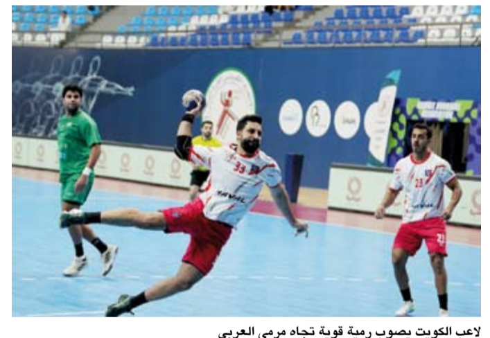
لاعب الكويت يصوب رمية قوية تجاه مرمى العربي

فاز فريق نادي الكويت لكرة اليد على نظيره العربي (38-22) فيما تغلب كاظمة على برقان (32-31) في اختتام منافسات الجولة السادسة من بطولة الدوري الكويتي الممتاز موسم (2025-2026). وواصل حامل اللقب (الكويت) سلسلة انتصاراته المتتالية هذا الموسم بفوز سادس على حساب العربي إذ أنهى شوط المباراة الأول متقدما بفارق مريح (21-8) ليواصل أفضليته في الشوط الثاني ويحقق الفوز مؤكدا صدارته في ترتيب البطولة.