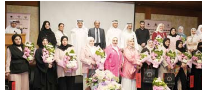
المشاركون في الحملة

أطلقت الحملة الوطنية للتوعية بمرض السرطان (كان)، حملة التوعية بسرطان الثدي (طوق النجاة الوردية)، برعاية وزير الشؤون الاجتماعية وشؤون الأسرة والطفولة الدكتورة أمثال الحويلة، ومؤسسة البرتل والكويتية وشركائها وتستمر طوال الشهر الجاري (أكتوبر الوردية) لنشر الوعي الصحي وتشجيع الفحص المبكر للكشف عن سرطان الثدي. وقال رئيس مجلس إدارة (كان) الدكتور خالد الصالح في كلمته خلال حفل الإطلاق أمس: إن الوعي والمعرفة هما السبيل الأول للوقاية والشفاء، مشدداً على أهمية التثقيف الصحي والتدريب على الفحص الذاتي الشهري لأنهما سبلتان مهمتان في عملية الكشف المبكر للمرض. ولفت الصالح إلى أن سرطان الثدي يحتل المركز الأول من حيث معدلات