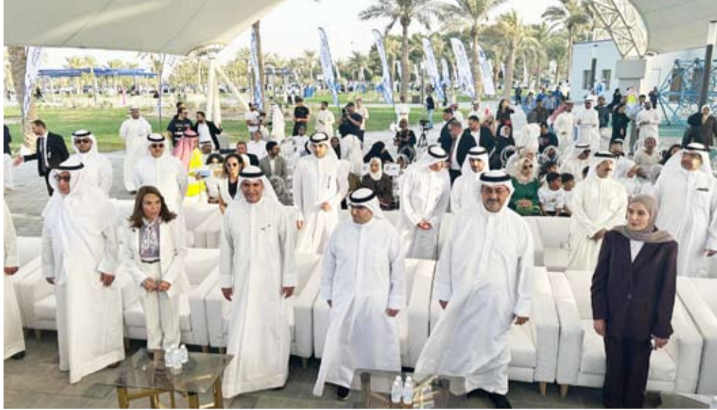
حضور رسمي وشعبي