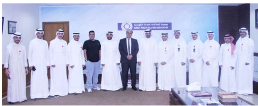
أعضاء مجلس إدارة جمعية العلاقات و نادي الإعلام بجامعة الكويت الدولية

بزيارة جمعية العلاقات العامة، مشيداً بدور جمعية العلاقات العامة، ومؤكداً أنها مؤسسة رائدة في مجالها وتمثل نموذجاً حياً للتواصل الفعال والبناء بين المؤسسات والجمهور. وأضاف أنهم في نادي الإعلام حريصون على بناء جسور التعاون مع مؤسسات المجتمع المختلفة، إيماناً