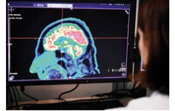
رصد تشوهات دماغية

أعلن باحثون أستراليون، أن أداة تعمل بالذكاء الاصطناعي قادرة على رصد تشوهات دماغية دقيقة يصعب اكتشافها لدى الأطفال المصابين بالصرع، ما قد يساهم في تسريع خضوع المرضى لجراحة قد تغير حياتهم. وأبرزت دراسة نشرت في مجلة «إبيبيلسيا» عمل فريق بقيادة الطبيبة إيما ماكواند-لورن، اختصاصية أعصاب الأطفال في مستشفى ملبورن الملكي للأطفال، على تدريب الأداة على صور دماغية للأطفال للكشف عن آفات بحجم التوت الأزرق، أو حتى أصغر منها. وأوضحت الطبيبة ماكواند-لورن أن هذه الأداة لا تغني عن أطباء الأشعة أو المتخصصين في الصرع، بل تعمل كمُحَقِّق يساعد على تجميع أجزاء الصورة المفككة بسرعة أكبر، مما يتيح اقتراح إجراء جراحة قد تحدث فرقاً كبيراً في حياة المريض. وأظهرت الدراسة أن من بين المرضى المشاركون ممن يعانون خلل التنسج القشري والصرع البؤري، سبق أن خضع 80% منهم لفحص بالرنين المغناطيسي وكانت نتائجها طبيعية. وعند استخدام أداة الذكاء الاصطناعي لتحليل كل من فصوص الرنين المغناطيسي والتصوير المقطعي بالإصدار البوزيتروني، بلغ معدل نجاحها 94 بالمئة لإحدى مجموعات الاختبار و91 بالمئة للمجموعة الأخرى. وأشار الفريق إلى أن من بين 17 طفلاً في المجموعة الأولى، خضع 12 لعملية جراحية لإزالة آفات الدماغ، وشفي 11 منهم من النوبات، مؤكداً أن الخطوة التالية ستكون اختبار أداة الكشف في بيئة مستشفى أكثر واقعية على مرضى جديد لم يسبق تشخيص إصابتهم.