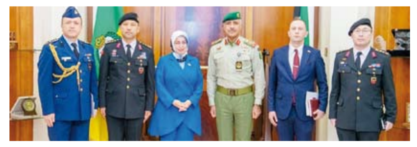
الفريق الركن حمد البرجس مستقبلاً السفارة التركية والعقيد جان هيرولت مونير

بحث وكيل الحرس الوطني، الفريق الركن حمد البرجس، أمس، مع سفيرة الجمهورية التركية الصديقة لدى دولة الكويت طوبى سونمز، الموضوعات ذات الاهتمام المشترك. وقال الحرس الوطني وقاتل الحرس الوطني ملحق الأمن الداخلي في بيان صحفي: إن الفريق البرجس نقل للسفيرة التركية تحيات رئيس الحرس الوطني الشيخ مبارك الحمود ونائب رئيس الحرس الوطني الشيخ فيصل النواف. كما استقبل وكيل الحرس الوطني ملحق الأمن الداخلي