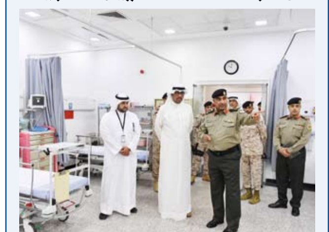
الشيخ عبدالله العلي خلال زيارته المجمع الطبي العسكري الشمالي

قام وزير الدفاع الشيخ عبدالله العلي، أمس، بزيارة إلى مديرية طبابة المنطقة الشمالية (المجمع الطبي العسكري الشمالي)، حيث اطلع على سير العمل وألية تقديم الخدمات الطبية والوقائية وما تضمه المديرية من تجهيزات وإمكانات طبية متطورة. وأكد الشيخ عبدالله العلي في بيان صحفي صادر عن الوزارة، حرصه على دعم وتطوير القطاع الطبي العسكري بما يواكب أحدث المعايير الطبية، مشيداً في الوقت ذاته بالجهود الكبيرة التي يبذلها العاملون في المديرية وما يقومون به من عمل إنساني ورسالة سامية في خدمة