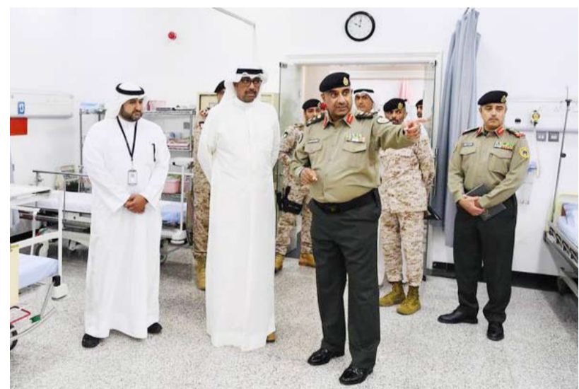
جانب من الزيارة إلى المجمع الطبي العسكري الشمالي