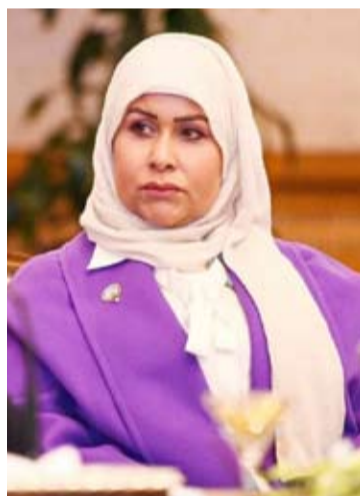
الشيخة تماضر الصباح

تأكيداً أن هذا المشروع يجسد التزام الوزارة بنهج التحول الرقمي وتبني أدوات الذكاء الاصطناعي في الإعلام البترولي انسجاماً مع توجهات الوزارة التي تضع التحول الرقمي في صدارة أولوياتها وتنفيذا لرؤية (كويت جديدة 2035). وأعربت الشيخة تماضر الصباح عن الفخر بإطلاق هذه الخطوة التي تمثل نقلة نوعية في وسائل وأدوات التواصل الإعلامي وتعكس جهود الوزارة في مواكبة التطور العالمي بمجالات الإعلام الرقمي والذكاء الاصطناعي. وبيّنت أن هذه الخطوة تعزز من مكانة الكويت الريادية في تسخير التكنولوجيا الحديثة لخدمة القطاع النفطي والإعلام البترولي لافتة إلى أن الوزارة أتاحت للجمهور حوض هذه التجربة من خلال فيديو تجريبي متوافر عبر منصة (يوتيوب).