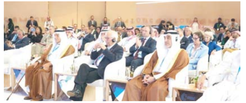
الشيخ فهد اليوسف خلال مشاركته في مؤتمر ميونخ للأمن

أكد ممثل سمو الشيخ أحمد عبدالله رئيس مجلس الوزراء، النائب الأول لرئيس مجلس الوزراء ووزير الداخلية الشيخ فهد اليوسف، أمس، أن مشاركة دولة الكويت في اجتماع قادة مؤتمر ميونخ للأمن تؤكد حرصه على دعم الحوار الإقليمي وتعزيز التعاون الدولي. جاء ذلك في تصريح أدلى به النائب الأول لرئيس مجلس الوزراء ووزير الداخلية الشيخ فهد اليوسف لـ (كو نا) على هامش أعمال اجتماع قادة مؤتمر ميونخ للأمن المتعدد بمدينة (العل) السعودية. وذكر أن الاجتماع يوفّر منصة مهمة لتبادل الرؤى حول التحديات الأمنية الإقليمية والدولية الحالية وخاصة في منطقة الشرق الأوسط. وقال: إن النقاشات التي جرت في الجلسات العامة وورش العمل المنبثقة تناولت القضايا الأكثر إلحاحاً وفي مقدمتها الأوضاع الإنسانية المأساوية في غزة والأراضي الفلسطينية المحتلة، إذ أجمع المشاركون على أنه لا يمكن الحديث عن أمن إقليمي مستدام مع استمرار العدوان الإسرائيلي. وحذر من تداعيات التصعيد العسكري الخطير واتساع رقعة النزاعات المسلحة التي تسبب بها عدوان الاحتلال الإسرائيلي السافر على دولة قطر على أمن واستقرار المنطقة. وأكد أن العدوان الإسرائيلي على دولة قطر الشقيقة وقطاع غزة يشكل انتهاكاً صارخاً للقانون