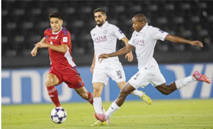
السد القطري فشل في الحفاظ على نقاط المباراة

تعدال السد القطري مع ضيفه الشارقة الإماراتي بهدف لثلاثة في الجولة الأولى ليحتل المركز السادس مؤقتا فيما رفع الشارقة الذي كان قد فاز على الغرافة في الجولة الأولى (4-3) رصيده إلى النقطة الرابعة ليحتل المركز الثالث. وحسب نظام البطولة فيشارك في المنافسات 24 فريقا تم توزيعها إلى (دورين منفصلين) يضم كل دوري 12 فريقا موزعين بين منطقتي الشرق والغرب على أن يخوض كل فريق في كل دوري ثماني