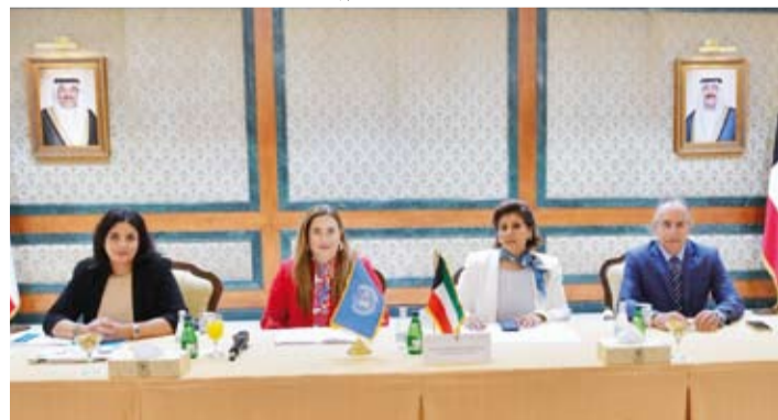
الشيخة جواهر الصباح خلال مشاركتها في ورشة العمل

أن هذه الجهود تتماشى مع خطة التنمية الوطنية (كويت جديدة 2035) وأهداف التنمية المستدامة العالمية 2030 لاسيما الهدف العاشر منها علاوة على التجهيزات الطوعية التي قدمتها دولة الكويت في إطار عضويتها بمجلس حقوق الإنسان (2024 - 2026) والتزاماتها بتنفيذ الاتفاقية الدولية لحقوق الأشخاص ذوي الإعاقة التي انضمت إليها الكويت عام 2013 إضافة إلى إعلان برلين - عمان الصادر عن القمة العالمية الثالثة للإعاقة 2025. وذكرت الشبيخة جواهر الصباح أن الورشة تأتي التزاماً من دولة الكويت تجاه دعم وتمكين الأشخاص ذوي الإعاقة استناداً إلى التوجهات السامية من صاحب السمو أمير البلاد الشيخ مشعل الأحمد، وانطلاقاً من القانون رقم (8) لسنة 2010 الذي ينص على أهمية تعزيز حقوق الأشخاص ذوي الإعاقة.