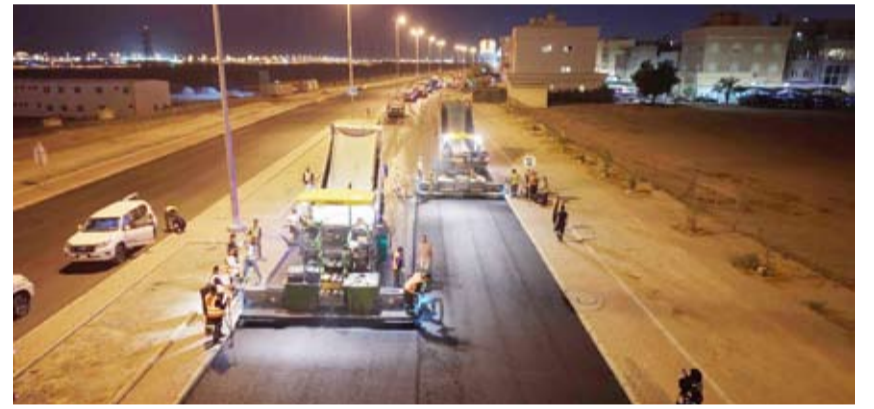
جانب من أعمال فرش الأسفلت

أكدت وزيرة الأشغال العامة الدكتورة نورة محمد المشعان أن الوزارة تواصل تنفيذ خططها الميدانية للصيانة الجذرية لشبكة الطرق، مشيرة إلى أن الأعمال تشمل فرش الأسفلت من نوع (Type 3) بعدد من المناطق. وأوضحت المشعان أن الأعمال الجارية في منطقة عبد الله المبارك تأتي ضمن العقود الجديدة لتحسين كفاءة الطرق، مشيرة إلى الانتهاء من صيانة و فرش الأسفلت في قطعتي