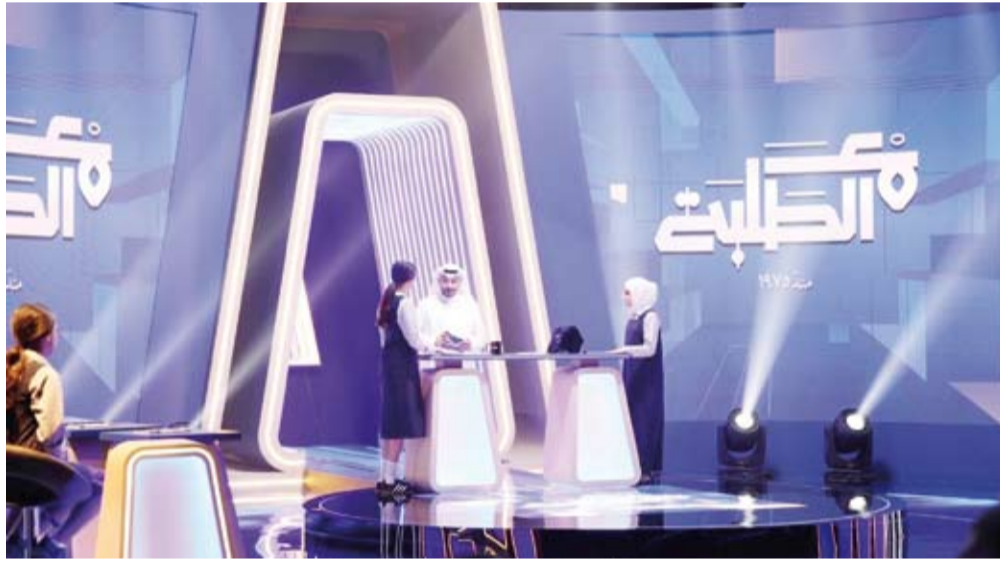
برنامج «مع الطلبة» سينطلق بحلة جديدة

وذكرت أن البرنامج يتبذ بالتعاون مع عدد من الرعاة أبرزهم، بيت التمويل الكويتي ومؤسسة الكويت للتقدم العلمي وشركة مطاحن الدقيق والمخابز الكويتية وشركات من القطاع الخاص، مؤكدة أن دعم هذه الجهات يعكس إيمانها بأهمية المسؤولية المجتمعية في دعم العملية التعليمية ورعاية الطلبة. وأكدت سعي الوزارة من خلال هذا البرنامج إلى إعداد جيل واثق بنفسه قادر على مواجهة التحديات العلمية والمعرفية ومتمسك بقيمه الوطنية التي تمثل أساس نجاحه في المستقبل.