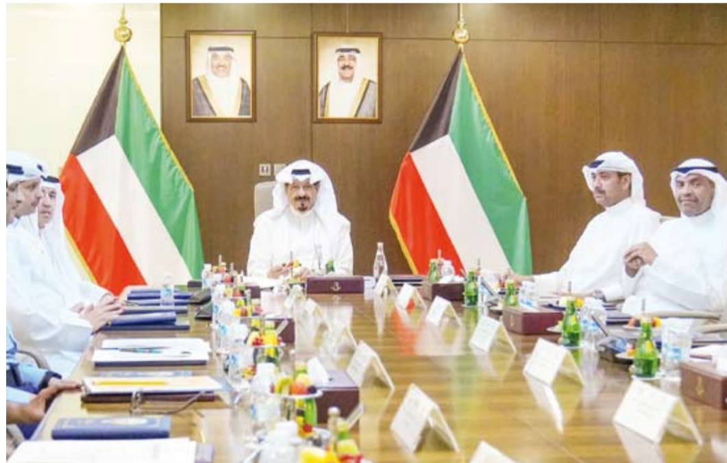
سمو الشيخ أحمد عبدالله مترأساً الاجتماع

ترأس سمو الشيخ أحمد عبدالله رئيس مجلس الوزراء، رئيس مجلس الدفاع الأعلى، في قصر بيان، أمس، اجتماعاً لمجلس الدفاع الأعلى، وناقش المجلس في اجتماعه البنود المدرجة على جدول الأعمال وأبرز التطورات في المنطقة وآخر المستجدات على الساحتين الإقليمية والدولية. من جهة أخرى، بعث سمو الشيخ أحمد عبدالله رئيس مجلس الوزراء، ببرقية تهنئة إلى الرئيس شي جين بينغ رئيس جمهورية الصين الشعبية الصديقة بمناسبة ذكرى العيد الوطني لبلاده. كما بعث سمو الشيخ أحمد عبدالله رئيس مجلس الوزراء، ببرقية تهنئة إلى الرئيس بولا أحمد تينوبو رئيس جمهورية نيجيريا الاتحادية الصديقة بمناسبة ذكرى استقلال بلاده. وبعث سمو الشيخ أحمد عبدالله رئيس مجلس الوزراء، ببرقية تهنئة إلى الرئيس نيكوس خريستودوليديس رئيس جمهورية قبرص الصديقة بمناسبة ذكرى استقلال بلاده.