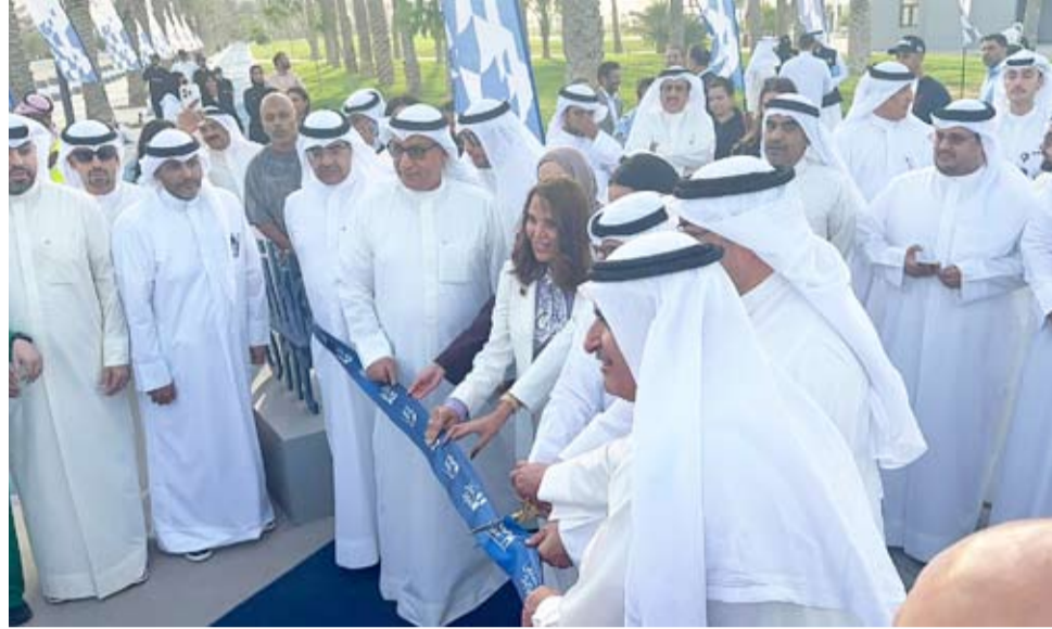
افتتاح الشاطئ رسمياً