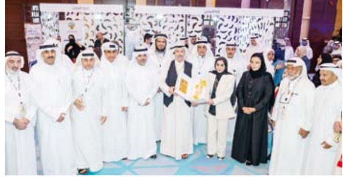
جانب من التكريم خلال الاحتفال باليوم الدولي لرعاية المسنين