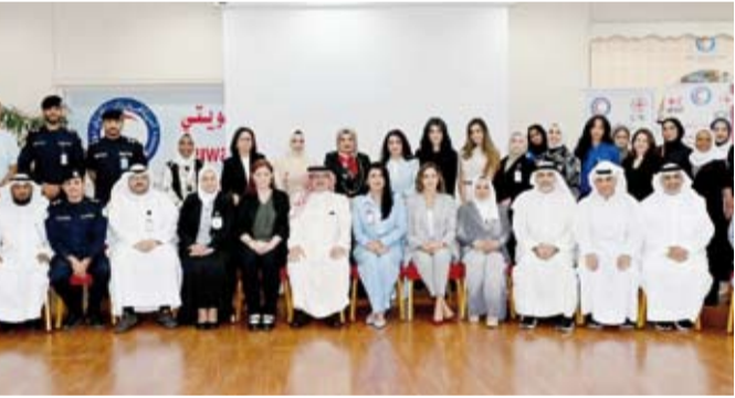
لقطة جماعية للجهات المشاركة