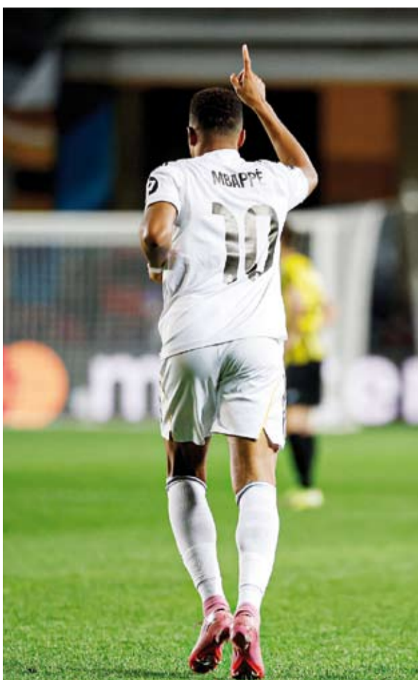
مبابي سجل هاتريك في فوز ريال بدوري الأبطال

فاز فريق إنتر ميلان الإيطالي على ضيفه سلافيا براغ التشيكي 3-0 ضمن منافسات الجولة الثانية من بطولة دوري أبطال أوروبا لكرة القدم. وسجل الأرجنتيني لوتارو مارتينيز مهاجم إنتر ميلان هدفين في الدقيقتين 30 و65، بينما أحرز الهولندي دينزل دومفريس الهدف الثالث ليواصل الفريق