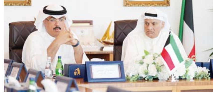
د. نادر الجلال و م. سيد جلال الطبطبائي خلال الاجتماع

عقد كل من وزير التعليم العالي والبحث العلمي د. نادر الجلال، ووزير التربية المهندس سيد جلال الطبطبائي، أمس، اجتماعاً مشتركاً، لبحث وضع آلية موحدة لمعادلة الشهادات الثانوية الأجنبية.