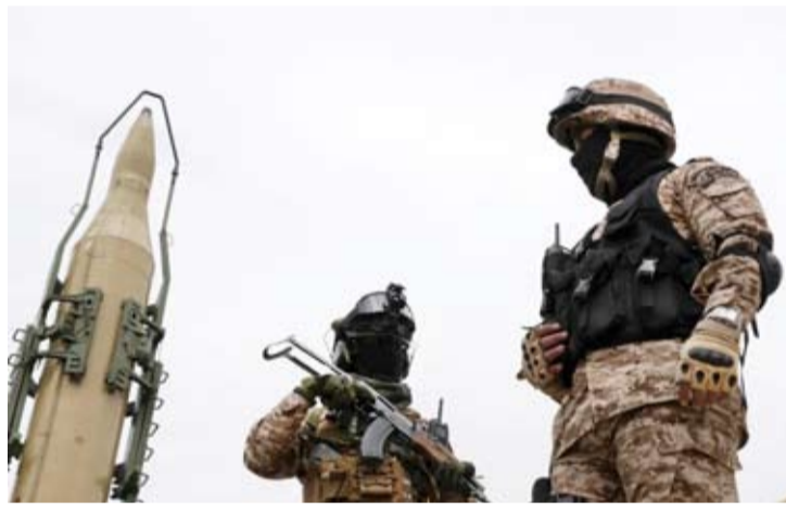
عناصر من الحرس الثوري

قال نائب قائد العمليات في هيئة الأركان الإيرانية، إن مدى الصواريخ سيزداد حتى «أي نقطة تعدّها طهران ضرورية»، وذلك رداً على ما قال إنها مطالب غربية لكبح البرنامج الباليستي الإيراني. ونقلت وكالة «فارس» الإيرانية، الحرس الثوري، عن الجنرال محمد أسدي، مسؤول التفيتيش في «مقر عمليات هيئة الأركان» الذي يعرف بـ«مقر خاتم الأنبياء»، قوله إن «مدى صواريخ إيران سيزداد ليصل إلى أي نقطة تكون ضرورية». وقالت الوكالة إن تصريحات القيادي تأتي رداً على «مزاعم الأوروبيين بشأن تقييد القدرات الصاروخية»، وصرح أسدي بأن «التجربة أثبتت أن القدرة الصاروخية الردعية للجمهورية الإسلامية لعبت دوراً حاسماً في مواجهة الأعداء».