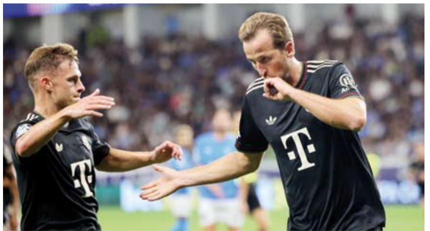
هاري كين يواصل التسجيل مع البايرن

فاز بايرن ميونخ الألماني على ضيفه بافوس القبرصي بخمسة أهداف مقابل هدف ضمن مباريات الجولة الثانية من دوري أبطال أوروبا لكرة القدم، في مرحلة الدوري. وسجل خماسية البايرن، هاري كين هدفين في الدقيقتين (15 و34)، ورافائيل جيريرو في الدقيقة (20) ونكولاس جاكسون في الدقيقة (31) ومايكل