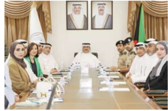
الشيخ عبدالله سالم العلي خلال الاجتماع مع مسؤولي «السكنية»

عقد محافظ العاصمة الشيخ عبدالله سالم العلي، اجتماعاً صباحياً أمس، مع مسؤولي قطاع الاستثمار ومشاريع القطاع الخاص في المؤسسة العامة للرعاية السكنية. حيث تم خلال الاجتماع مناقشة عدد من المشاريع الجاري تنفيذها واستعراض أبرز الخطط والبرامج الجاري إعدادها بما يسهم في تلبية احتياجات المواطنين وتوفير الخدمات الأساسية وفق أعلى المعايير.