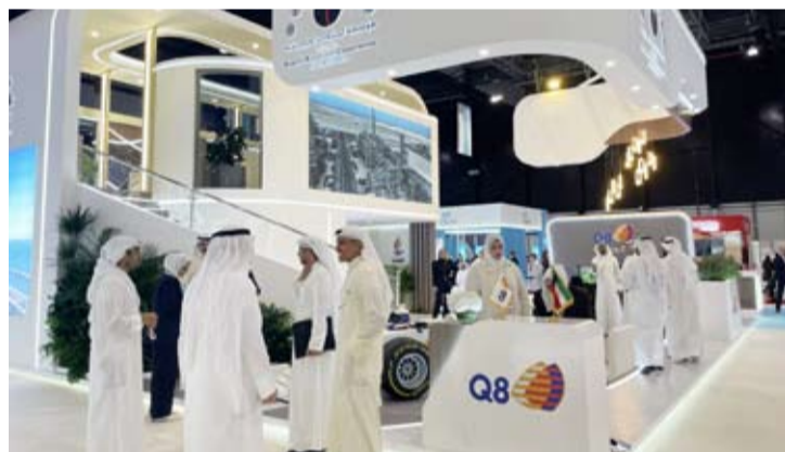
جناح مؤسسة البترول للمصاحب للمؤتمر

الذي بدأت فعالياته أمس الثلاثاء وتختتم غدا الخميس.