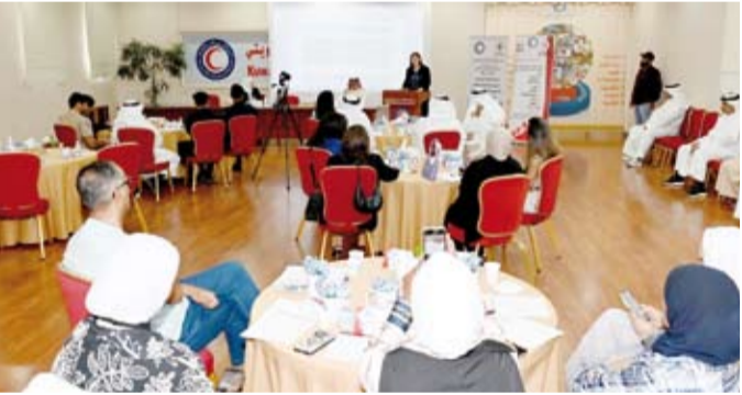
جانب من الورشة التدريبية

برامج إعادة الروابط العائلية. من جانبها، أكدت المنسقة الإقليمية لقسم الحماية في اللجنة الدولية للصليب الأحمر أنسكي فاندورمال (كونا) التزام اللجنة بدعم الجمعيات الوطنية حول العالم في جهودها لاستعادة الروابط العائلية، مشيرة إلى أهمية مثل هذه الأعمال الإنسانية لبث الأمل في نفوس ذوي الأشخاص المفقودين. وأشادت فاندورمال، بالتعاون بين الهلال الأحمر الكويتي واللجنة الدولية بشأن إعادة الاتصال بحالات لعائلات مشتتة وبدور الجمعية في إعادة الأمل والحفاظ على روابط الأسر لمواجهة أصعب الظروف.