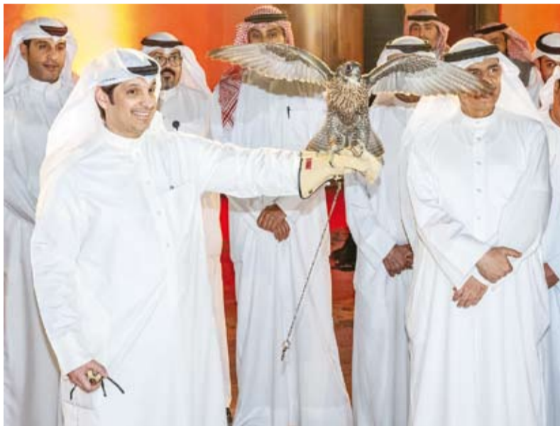
الوزير المطيري يزور مكونات القصر

من جهته قال الأمين العام المساعد لقطاع الآثار والمتاحف بالتكليف في المجلس الوطني للثقافة والفنون والآداب محمد بن رضا: إن موسم الجهور الثقافي سيشهد إقامة ورش عمل فنية متنوعة لصلق مهارات المشاركين وتعريفهم بأساليب جديدة في الفنون التراثية وتعزيز مشاركة المجتمع في الأنشطة الثقافية والفنية والفكرية والمقامية داخل القصر الأحمر.