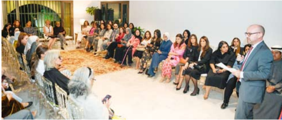
السفير الفرنسي أوليفيه غوفان يتحدث