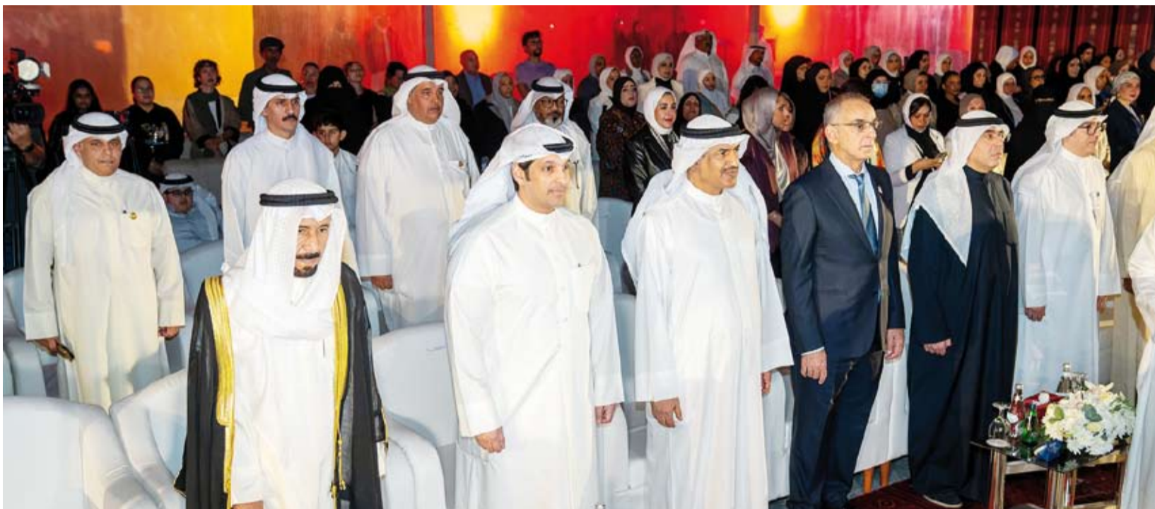
الوزير عبد الرحمن المطيري يتقدم الحضور الرسمي

في الصميم أكثر من 1000 مريض قضاوا خلال انتظارهم لفتح المعابر والسفر لتلقي العلاج خارج قطاع غزة، رغم حصولهم على تصاريح بالتنسيق مع منظمة الصحة العالمية، التي استقبلت نحو 22 ألف ملف طبي، بينهم 5 آلاف مريض بالسرطان و7 آلاف جريح نتيجة الحرب الصهيونية القذرة. هكذا يتعامل الاحتلال المجرم مع أهلنا في غزة، يتعمد بشتى السبل التضيق على القطاع الصحي ليدفع الجرحى والمرضى الذين نجوا من آلياته العسكرية إلى الموت.. قاتلكم الله.