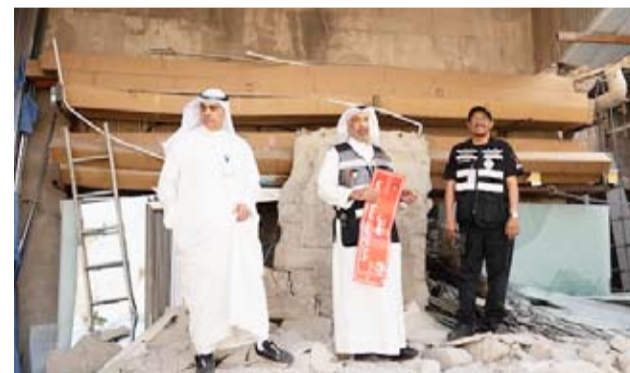
إغلاق منشأة مخالفة

الاطراف لضبط المخالفات بشكل فوري وشامل. وتأتي هذه الجولة بعد قرار الوزير بتشكيل لجان تفتيشية متخصصة برئاسة ثلاثة من المستشارين الخضساء، تتولى إجراء مسح شامل ودقيق للقسائم الصناعية، ورصد جميع المخالفات، واتخاذ الإجراءات القانونية الصارمة بحق المتجاوزين دون أي تهاون.