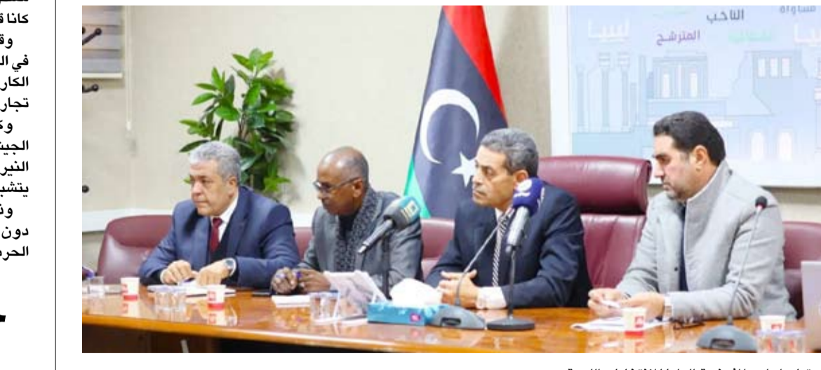
اجتماع مجلس المفوضية العليا للانتخابات الليبية

حول تعديلات قوانين الانتخابات الصادرة عن لجنة (6+6) المشتركة بين مجلسي (النواب) و(الأعلى للدولة)، وإحالتها دون تأخير لتمكين المفوضية من إصدار اللوائح التنفيذية». واعتبرت أن قرار إجراء الانتخابات وكسر الجمود يجب أن يكون «ليبياً محضاً»، بعيداً عن أي تدخل خارجي، محذرة من الانزلاق نحو مسارات تعقيد الانقسام، كما أكدت استعدادها الكامل لتحمل مسؤولية التغيير مهما كانت العقبات، واعتبرت أن «صناديق الاقتراع هي الطريق الوحيد لاستعادة الشرعية وإنهاء الانقسام».