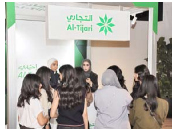
جانب من فعالية Brev x Thabbit

من حرص البنك التجاري الكويتي على دعم الشباب وتشجيع الأنشطة والمبادرات المختلفة، إيماناً منه بأهمية توفير فرص وفعاليات متمتع تمكن من استثمار طاقات الشباب وتعزيز حضورهم وتفاعلهم في المجتمع.