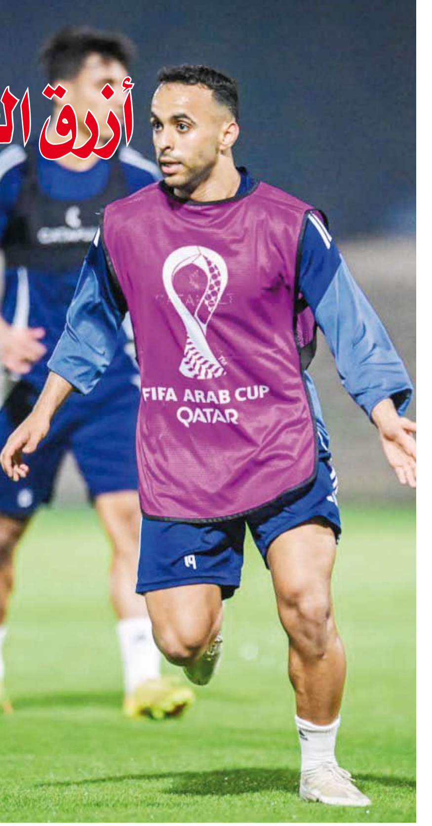
الأزرق جاهز لمواجهة الفراعنة