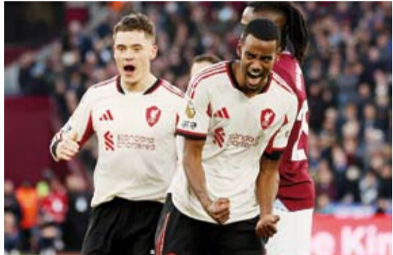
ليفربول يعود لسكة الانتصارات

تعادل فريق آرسنال مع تشيلسي بهدف لثله في المباراة في المباراة التي جمعتهما، في ختام منافسات الجولة الثالثة عشرة من الدوري الإنجليزي الممتاز لكرة القدم.