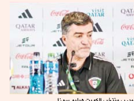
مدرب منتخب الكويت هيليو سوزا

أكد مدرب منتخب الكويت لكرة القدم هيليو سوزا السعي لتقديم أفضل أداء ممكن أمام منتخب مصر وتحقيق الفوز عليه في المباراة الافتتاحية لهما في بطولة كأس العرب لكرة القدم (فيفا قطر 2025).