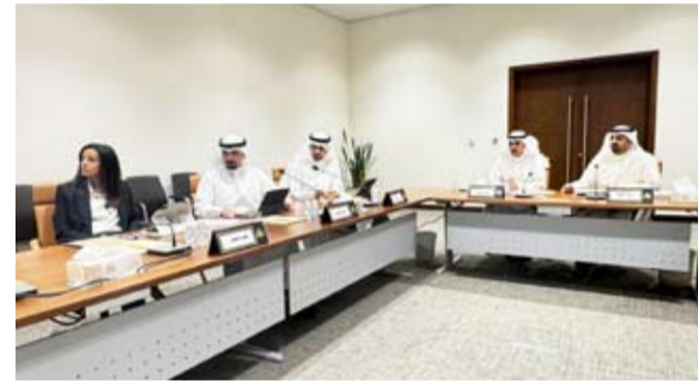
جانب من اجتماع قانونية البلدي

على المستثمرين والشركات الالتزام بالإشراطات. 2. رفض طلب جامعة الكويت بإعفاءها من البند رقم (7) من المادة الأولى من القرار الوزاري رقم 206 لسنة 2009، والمتعلق بمشروع الحرم الطبي في مدينة صباح السالم الجامعية، تأكيداً على ضرورة الالتزام بالإشراطات والضوابط المقررة.