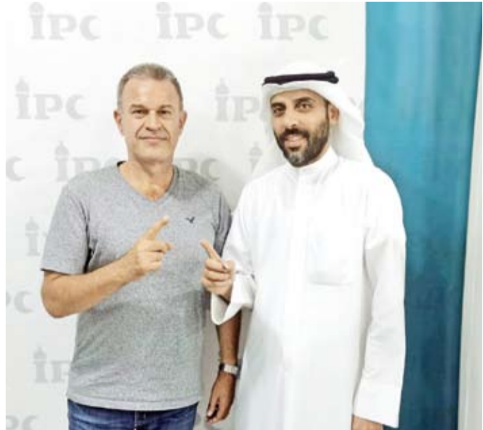
إشهار إسلام أحد المهتدين