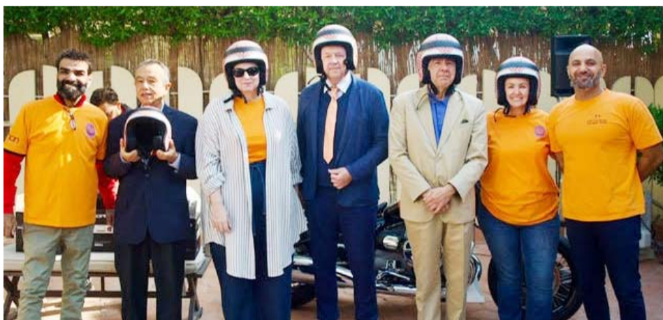
سفراء كندا والبيرو والتشيك والمكسيك مع سفيرة أستراليا