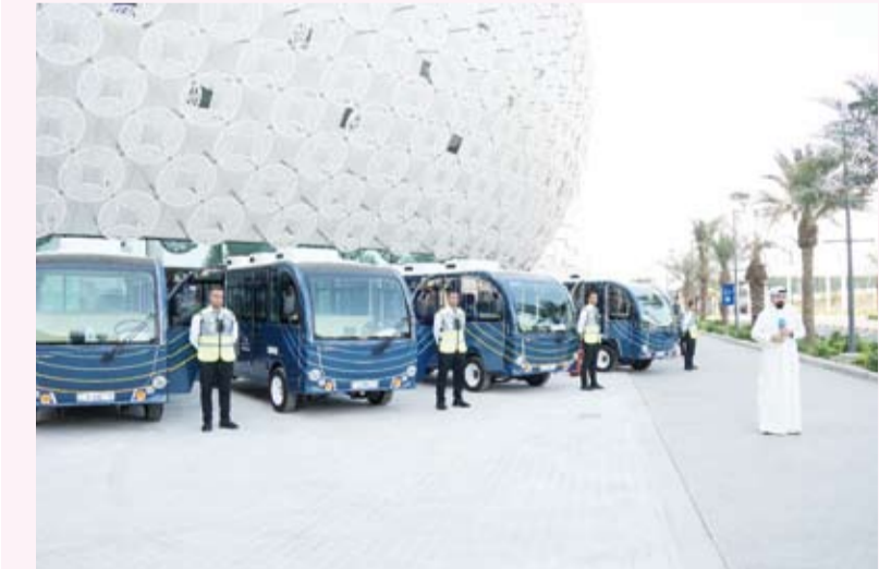
15 عربة كهربائية لمسار التنقل الجامعي