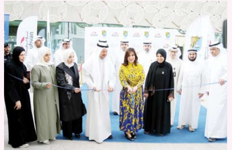
جانب من اطلاق المشروع

نقل آمنة وفعالة تسهم في تسهيل حركة متنسبي الجامعة بين المباني والكليات والحد من الكثافة المرورية داخل الحرم الجامعي بما يعزز بيئة تعليمية متطورة وشاملة. بدوره أشاد محافظ الفروانية الشيخ عذبي الصباح بالمشروع موجهاً الشكر للأمانة العامة للأوقاف على دعمها الكريم بتوفير 15 عربة