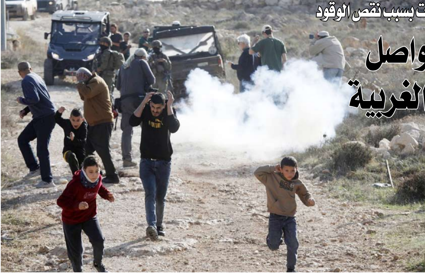
جنود الاحتلال بالضفة الغربية

واصل الجيش الإسرائيلي شن هجماته في مناطق مختلفة في الضفة الغربية، رغم انسحاب قواته من طوباس، في حين أعلن القضاء على أربعة مقاتلين في رفح بجنوب قطاع غزة. واعتقل عدداً من الفلسطينيين في مدن سلفيت وبيت لحم والخليل ونابلس ورام الله بالضفة، وشرع في هدم 24 منزلاً في مخيم جنين، وأعلن أنه اعتقل أيضاً خلية من خمسة فلسطينيين في بلدة برطعة في جنين بزعم أنهم كانوا يخططون لتنفيذ عملية قريبا. وجاء في بيان مشترك للجيش وجهاز الأمن العام (الشاباك) والشرطة الإسرائيلية أن قوة من وحدة «بسام» الخاصة، وبإسناد «قوات من لواء منشييه وبتوجيه من الشاباك»، نفذت عملية في برطعة واعتقلت أفراد خلية كانوا يعززون تنفيذ عملية «في المدى الزمني الفوري»، دون تقديم تفاصيل إضافية حول طبيعة العملية أو المرحلة التي