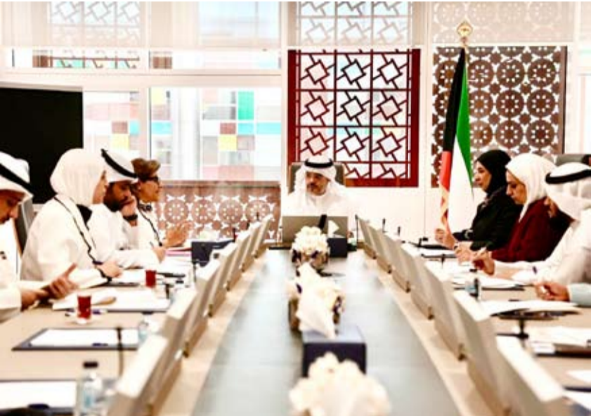
جانب من الاجتماع بين الجهات الثلاث