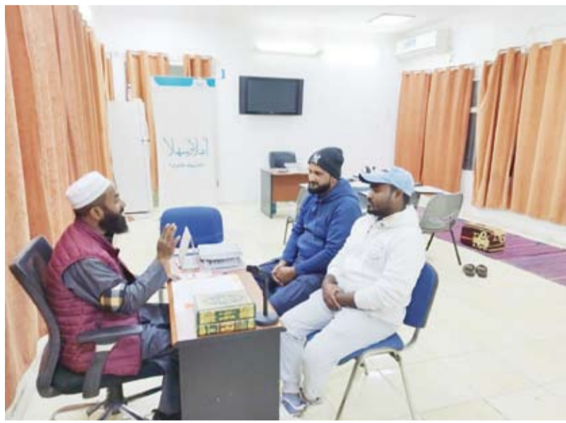
دورات شرعية لتعليم المهتمين