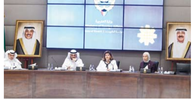
السفيرة الشبخة جواهر الصباح محدثة

وقالت: إن هذا الاجتماع يأتي ضمن سلسلة من الجهود التي تنهض بها اللجنة الوطنية الدائمة بالتعاون مع مختلف الجهات الرسمية المعنية مما يؤكد على التنسيق المؤسسي وبرز الجهود الوطنية في الوفاء بالالتزامات الدولية وتعزيز حقوق الإنسان على كافة المستويات. وبيّنت السفيرة الشبخة جواهر الصباح، أن الاجتماع يهدف إلى متابعة تنفيذ الالتزامات الدولية وتعزيز نهج الدولة في إعلاء مبادئ حقوق الإنسان وصون الكرامة الإنسانية بما يتماشى مع رؤية دولة الكويت التنموية (كويت 2035)، وأشارت إلى أن البحث تناول الاستحقاقات الدولية