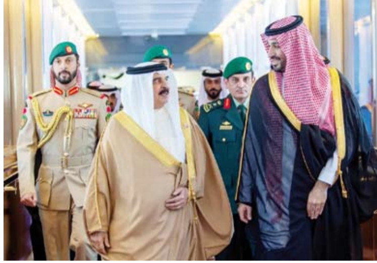
.. ويستقبل العاهل البحريني