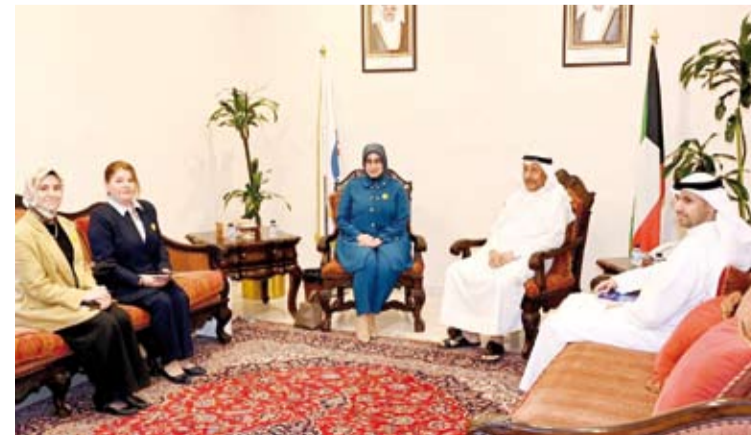
جمعية الهلال الأحمر الكويتي تستقبل سفيرة تركيا طوبى نور سونمز

التحديات المتزايدة على الساحة الدولية. وقال المغامس: إن العمل الإنساني يمثل أحد أهم الجسور التي تعزز التعاون الدولي وتفتح آفاقاً أوسع للتنسيق المشترك مشيراً إلى أن التعاون مع الجانب التركي يمتد لسنوات من العمل المشترك في عدد من المبادرات الإغاثية والإنسانية. وأوضح أن الجمعية نفذت خلال السنوات الماضية عدداً من المشاريع الإنسانية داخل تركيا شملت دعم اللاجئين السوريين وتقديم المساعدات لهم إلى جانب تنفيذ برامج تنمية أخرى بما يعكس عمق العلاقات الإنسانية بين البلدين. وأشار إلى اللقاء استعراض أبرز التحركات الإنسانية الكويتية لإغاثة ومساعدة المنكوبين في مختلف أنحاء العالم وبحث سبل تعزيز التعاون الثنائي وتبادل الخبرات في مجالات العمل الإنساني.