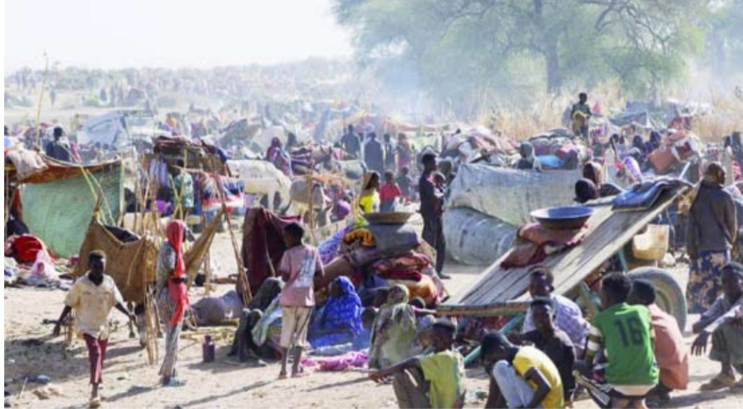
هروب الآلاف بعد هجمات «قوات الدعم السريع»

عن مقتل 6 أشخاص، وإصابة العشرات بجروح متفاوتة. وأضافت في بيان على «فيسبوك»، أن المخيم يووي آلاف النازحين الفارين من الحرب، غالبيةهم من النساء والأطفال. وعبرت الهيئة الحقوقية عن مخاوف جديدة من تكرار استهداف البنية التحتية المدنية، الذي يقاوم من تدهور الوضع الإنساني في الإقليم، ويعرض حياة المدنيين لخطر مباشر. ودعا المسؤول بـ«المنسقية» الأمم المتحدة والاتحاد الأفريقي والمنظمات الحقوقية والإنسانية إلى التحرك العاجل لحماية المدنيين، وضمان وصول المساعدات، وفتح تحقيق دولي مستقل لحاسبة المسؤولين. وأوردت في البيان أن هذا القصف تترتب عليه «آثار إنسانية خطيرة تتجاوز لحظة الاستهداف، من خلال تعطيل الخدمات داخل المعسكر، وتهديد استمرارية الإيواء والرعاية الصحية والغذائية للنازحين، خصوصاً الفئات الأكثر هشاشة من النساء والأطفال، بما يزيد تقاوم الأزمة الإنسانية القائمة».