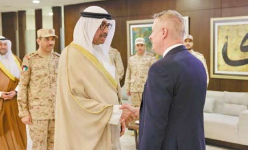
جانب من لقاء وزير الدفاع ونظيره البريطاني أمس

بحث وزير الدفاع الشيخ عبدالله العلي أمس مع وزير الدولة لشؤون الجاهزية والصناعة الدفاعية لدى وزارة الدفاع البريطانية لوك بولارد التعاون المشترك بين البلدين لاسيما في المجالات العسكرية والدفاعية. وذكرت وزارة الدفاع الكويتية في بيان صحفي أن الجانبين بحثا أيضاً التعاون في المجالات العسكرية والدفاعية وسبل تعزيزها وتطويرها بما يخدم المصالح المشتركة للبلدين كما جرى استعراض العلاقات التاريخية الراسخة التي تجمع دولة الكويت والمملكة المتحدة .