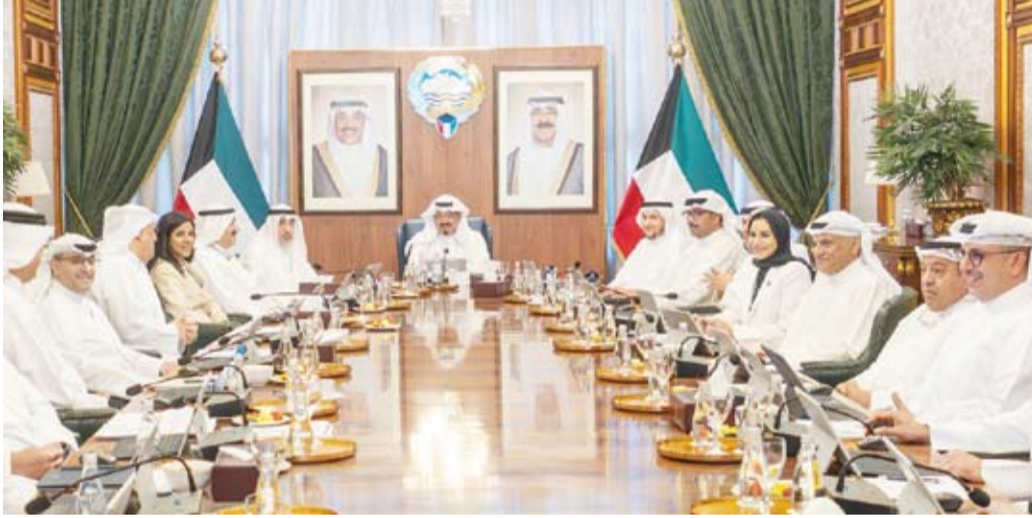
جانب من اجتماع مجلس الوزراء أمس برئاسة سمو الشيخ أحمد العبدالله

عقد مجلس الوزراء اجتماعاً أمس برئاسة سمو الشيخ أحمد العبدالله رئيس مجلس الوزراء، وبعد الاجتماع صرح نائب رئيس مجلس الوزراء وزير الدولة لشؤون مجلس الوزراء شريدة المعوشجي.. بما يلي: