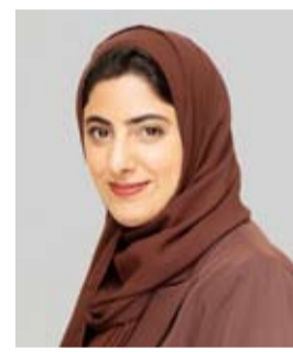
شما بنت سلطان بن خليفة آل نهيان

كما أظهر التقرير أن 341 امرأة يشغلن حالياً 403 مقعداً في مجالس الإدارة، مقابل 334 امرأة و390 مقعداً في 2025، ما يعكس نمواً في عدد القيادات النسائية بنسبة 2.1%، وارتفاعاً في عدد المقاعد التي يشغلنها بنسبة 3.3%. وعلى مستوى التوزيع الجغرافي، حافظت الإمارات العربية المتحدة على صدارتها للعام الثالث على التوالي بنسبة 15% من إجمالي مقاعد مجالس الإدارة، تلتها البحرين بنسبة 10.5%، ثم سلطنة عمان بنسبة 7%.