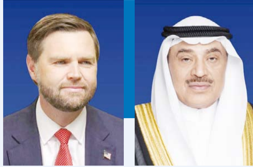
نائب رئيس الولايات المتحدة الأمريكية جي دي فانش سمو ولي العهد الشيخ صباح الخالد

تمتني سموه لمعالجه موقور الصحة و تمام العافية وللولايات المتحدة الأمريكية وشعبها الصديق دوام التقدم والرخاء. وفي ختام الاتصال، تمّن سمو ولي العهد الشيخ صباح الخالد، الموقف الأمريكي الثابت والداعم لأمن وسلامة أراضي الكويت،