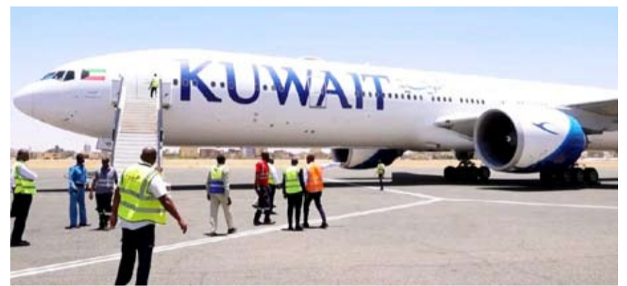
جانب من العائدين على متن الخطوط الكويتية أمس

وصلت إلى مطار الخرطوم الدولي أمس أول رحلة دولية مباشرة للخطوط الجوية الكويتية قادمة من دولة الكويت، وعلى متنها أكثر من 300 من المواطنين السودانيين العائدين. وأكد الأمين العام لجهاز تنظيم شؤون السودانيين بالخارج، د. عبد الرحمن سيد أحمد زين العابدين، في تصريح صحفي، أن هبوط الطائرة يمثل خطوة مهمة نحو استئناف الرحلات الدولية وتعزيز جهود الدولة في رعاية شؤون مواطنيها بالخارج. وأوضح أن استقبال هذه الرحلة يعكس جاهزية مطار الخرطوم لعودة حركة الطيران الدولي، ويجسد مثانة العلاقات الثنائية بين السودان ودولة الكويت. وأعرب عن تقديره لدولة الكويت قيادةً وحكومةً وشعباً، وللخطوط الجوية الكويتية، على دورهم في تسهيل عودة المواطنين، متمناً لجهود وزارة الخارجية والسفارة السودانية بالكويت في متابعة وترتيب الإجراءات.