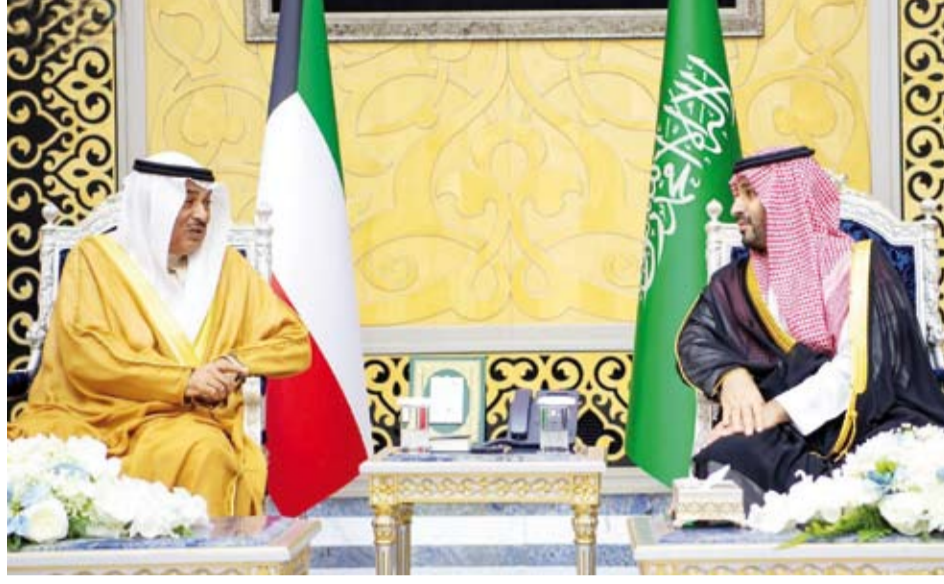
سمو الأمير محمد بن سلمان مستقبلاً سمو ولي العهد الشيخ صباح الخالد

وذكرت وكالة الأنباء السعودية (واس) أنه تم خلال القمة مناقشة عدد من الموضوعات والقضايا المتعلقة بالمستجدات الإقليمية والدولية وتنسيق الجهود تجاهها. وأضافت أنه حضر القمة وزير الخارجية السعودي الأمير فيصل بن فرحان.