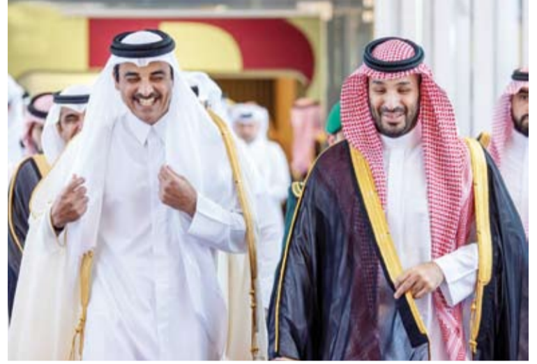
ولي العهد السعودي مستقبلاً أمير قطر