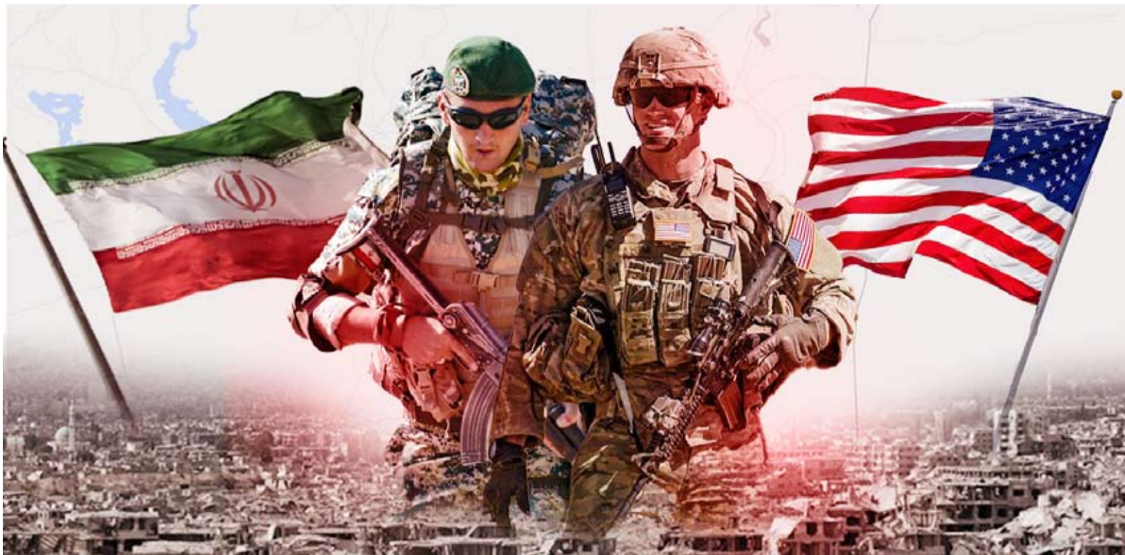
مناورات سياسية بين واشنطن وطهران

ويمر في مضيق هرمز في الأوقات العادية خمس الإنتاج العالمي من النفط والغاز المسال، لكنه يخضع الآن لحصار مزدوج إيراني وأميركي. ولم تكشف واشنطن بعد عن تفاصيل العرض، لكن الرئيس ترمب عقد اجتماعاً مع كبار مساعديه وقال وزير الخارجية ماركو روبيو: «من الواضح أننا لن نفاوض عبر وسائل الإعلام»، ولكنه وصف العرض الإيراني بأنه «أفضل مما كنا نتوقع أن يقدموا».