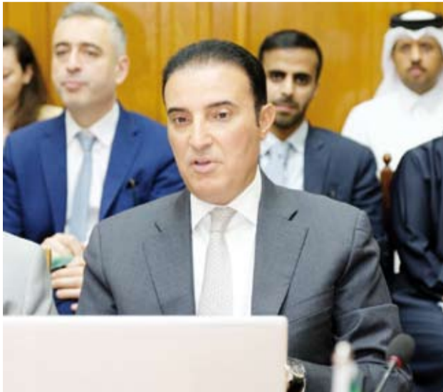
السفير طلال المطيري خلال الاجتماع

عقد مجلس جامعة الدول العربية، اجتماعاً تنسيقياً على مستوى المندوبين الدائمين بمشاركة دولة الكويت، أمس، لبحث الترتيبات النهائية للاجتماع الوزاري العربي - الأوروبي السادس المقرر عقده في الأردن يونيو المقبل. وذكرت الجامعة في بيان، أن الاجتماع انعقد برئاسة مندوب الأردن الدائم لدى الجامعة وسفيرها في القاهرة أمجد العضايلة بصفتها ممثل الدولة المضيفة وبمشاركة الأمين العام المساعد بالجامعة لشؤون السياسة الدولية السفير الدكتور خالد منزلاوي. وأضاف البيان، أن الاجتماع التنسيقية يأتي في إطار الإعداد للاجتماع الوزاري الذي سيعقد خلال الفترة من 22 إلى 23 يونيو المقبل، موضحاً أنه جرى خلال الاجتماع استعراض التحضيرات الأخيرة للاجتماع الوزاري إلى جانب مناقشة مشروع الإعلان المشترك الذي سيصدر عن الاجتماع المرتقب. وشارك في الاجتماع مندوب دولة الكويت الدائم لدى جامعة الدول العربية السفير طلال المطيري.