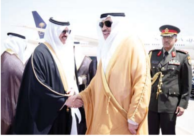
سمو ولي العهد الشيخ صباح الخالد مغادراً «جدة»

وتخلت وكالة الأنباء السعودية (واس) عن وزير الإعلام السعودي سلمان الدوسري في بيان القول: إن ذلك جاء عقب جلسة مجلس الوزراء التي ترأسها ولي العهد السعودي رئيس مجلس الوزراء الأمير محمد بن سلمان في جدة، وقالت (واس): إن مجلس الوزراء السعودي تابع مستجدات الأوضاع الإقليمية والدولية وفي مقدمتها التطورات بالمنطقة وتداعياتها الأمنية والاقتصادية مجدداً مواقف المملكة الثابتة بشأنها والدعم المستمر لجهود والمساعي الدبلوماسية الهادفة إلى إرساء دعائم السلم والاستقرار العالمين.