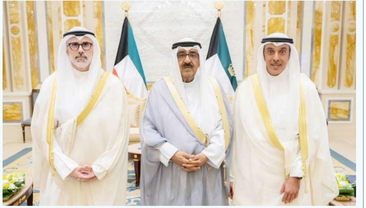
صاحب السمو يستقبل الجابر والمشعان في قصر بيان

استقبل صاحب السمو أمير البلاد الشيخ مشعل الأحمد أمس وزير الخارجية الشيخ جراح جابر الأحمد حيث قدم لسموه نائب وزير الخارجية حمد المشعان وذلك بمناسبة تعيينه بمنصبه الجديد. كما استقبلهما سمو ولي العهد الشيخ صباح