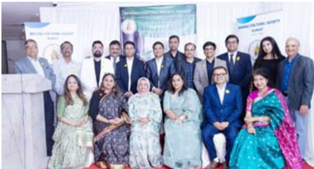
المشاركين في المبادرة