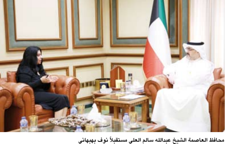
محافظ العاصمة الشيخ عبدالله سالم العلي مستقبلاً نوف بيهباني

عقد فريق العمل المعني بإنشاء مركز لإدارة الأزمات والكوارث على المستوى الوطني (أمان) اجتماعاً تنسيقياً، أمس، عبر تقنية الاتصال المرئي مع إدارة الكوارث والطوارئ التركية (AFAD) لبحث أوجه التعاون وتبادل الخبرات في مجالات إدارة الأزمات والطوارئ. وقال فريق (أمان) في بيان صحفي: إن الاجتماع يأتي في إطار دعم الجهود الرامية إلى تطوير منظومة وطنية متكاملة لإدارة الأزمات والكوارث وتم خلاله استعراض عدد من الممارسات والتجارب ذات الصلة برفع الجاهزية والبيات التنسيق المؤسسي وسبل تعزيز القدرة على التعامل مع مختلف السيناريوهات الطارئة بما يدعم كفاءة الاستجابة وسرعة اتخاذ القرار. وأضاف أنه جرى أيضاً بحث فرص التعاون المشترك في مجالات التدريب وتبادل المعرفة والاستفادة من الخبرات المتخصصة بما يسهم في تعزيز القدرات المؤسسية ومواجهة التحديات المتسارعة في مجال إدارة الأزمات والكوارث. وأكد الجانبان حسب البيان أهمية استمرار التواصل وتطوير مجالات التعاون بما يدعم تبادل أفضل الممارسات ويرسخ الجاهزية في مواجهة الأزمات والطوارئ. وذكر أن فريق (أمان) التابع لمجلس الوزراء يعني بتأسيس منظومة وطنية شاملة لإدارة الطوارئ والكوارث ويعني بتوحيد الجهود الوطنية وبناء إطار متكامل لإدارة المخاطر ورفع مستوى الجاهزية والاستجابة للأزمات.