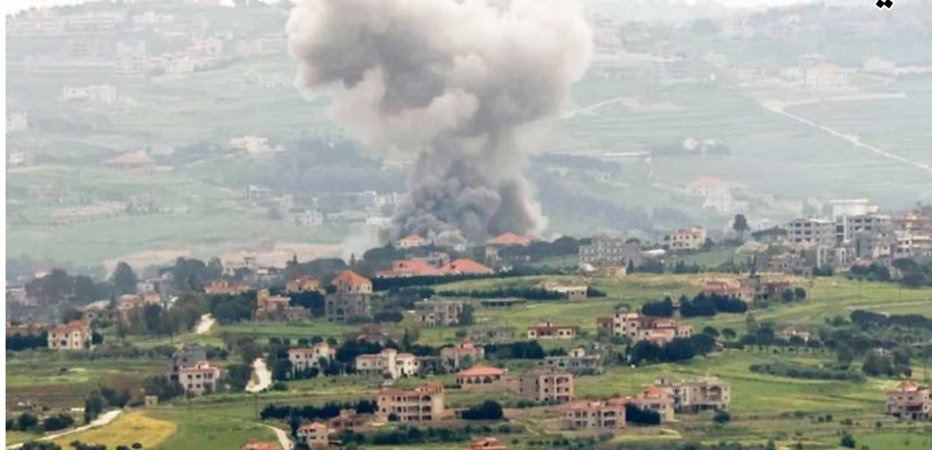
غارات صهيونية على جنوب لبنان

أعلنت وزارة الصحة اللبنانية، أن الغارات الإسرائيلية على جنوب البلاد، أسفرت عن مقتل 14 شخصاً، وهو الأعنف منذ الإعلان عن وقف إطلاق النار في الحرب بين إسرائيل و«حزب الله»، قبل أكثر من أسبوع، وفق ما أوردته «وكالة الصحافة الفرنسية».