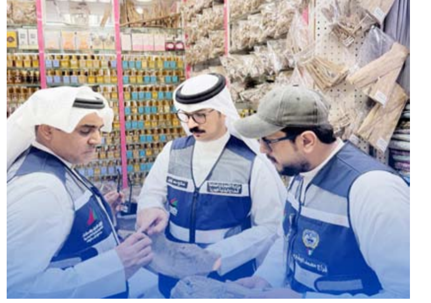
جانب من الجولة التفتيشية لفريق التجارة

وفي الفروانية، أسفرت جولة ميدانية على عدد من المحال التجارية عن تحرير 24 محضر ضبط، شملت مخالفات تتعلق ببيع سلع مجهولة المصدر ومحظورة مثل علكة التبغ، إلى جانب نشر إعلانات لخدمات غير منمقة، وعدم التزام بعض الصيدليات الأهلية بقرار حظر التعاملات النقدية