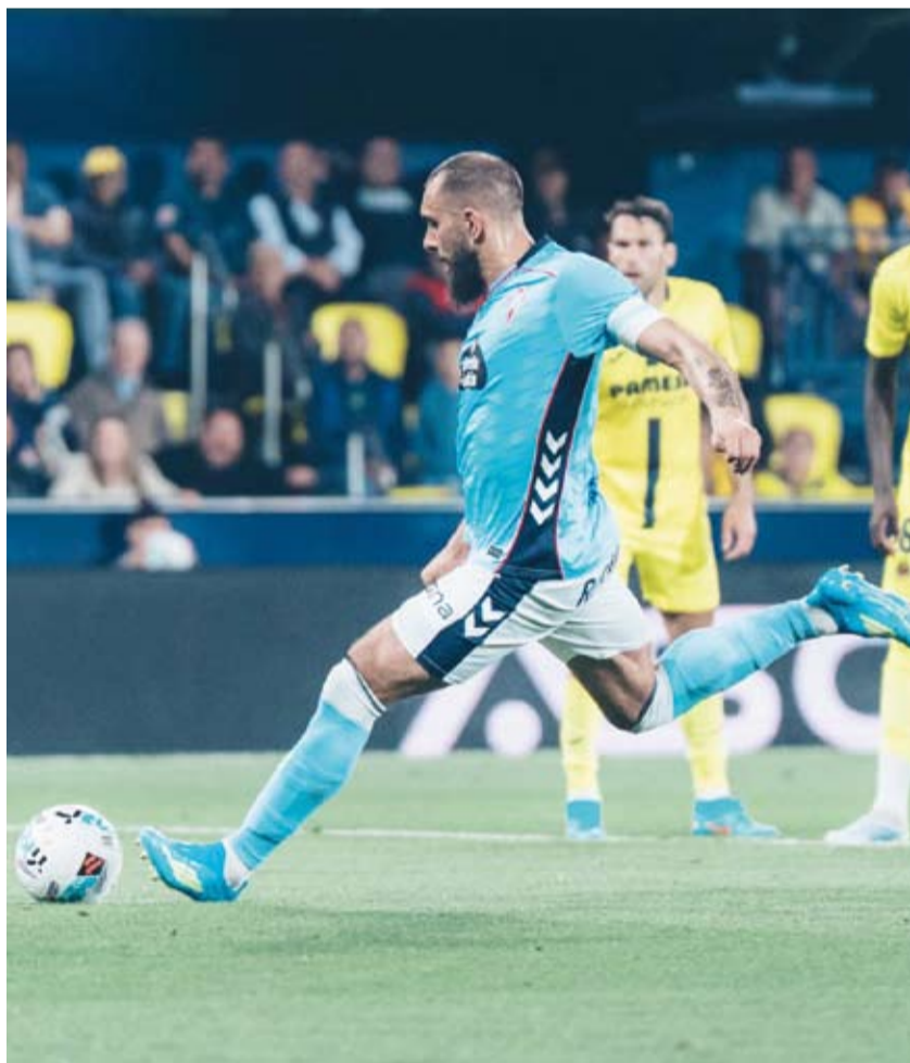
سيلتا فيغو فشل في إدراك التعادل

التوالي، والمرة السادسة في تاريخه، وذلك قبل خمس جولات من انتهاء مشواره في بطولة الدوري. أما سيلتا فيغو فتلقت خسارته الثالثة على التوالي، ليتجمد رصيده عند 44 نقطة في المركز السابع، متخلفا بفارق الأهداف عن خيتافي صاحب المركز السادس. وسيلعب فياريال في الجولة القادمة على ملعبه أمام ليفانتي، يوم السبت المقبل، بينما يستقبل سيلتا فيغو نظيره إلتشي الأحد.