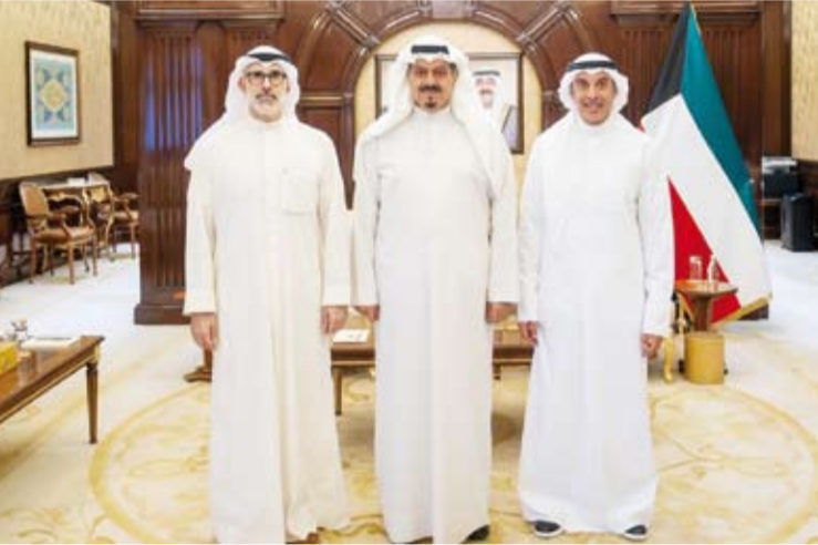
سمو الشيخ أحمد عبدالله مستقبلاً الجابر والمشعان