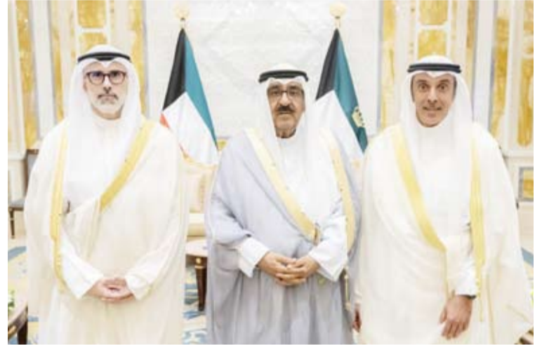
سمو أمير البلاد الشيخ مشعل الأحمد مستقبلاً وزير الخارجية ونائبه

استقبل صاحب السمو أمير البلاد الشيخ مشعل الأحمد، وزير الخارجية الشيخ جراح الجابر والأمير أحمد الصباح حيث قدم لسموه نائب وزير الخارجية حمد المشعان، وذلك بمناسبة تعيينه بمنصبه الجديد. كما استقبل سمو ولي العهد مستقبلاً وزير الخارجية خالد، وزير الخارجية الشيخ جراح الجابر، حيث قدم لسموه نائب وزير الخارجية حمد المشعان، وذلك بمناسبة تعيينه بمنصبه الجديد. كما استقبل سمو الشيخ أحمد عبدالله رئيس مجلس