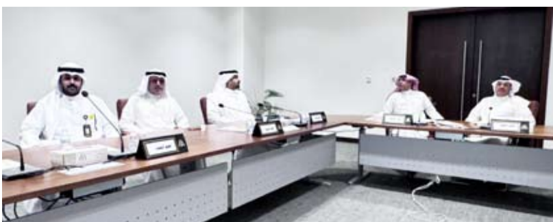
جانبا من اجتماع لجنة الاحمدي