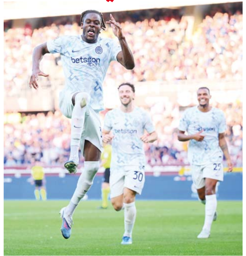
تعادل مخيب للإنتر

أوقف جانلوكا روكي، المسؤول عن تعيين الحكام في الدرجتين الأولى والثانية لكرة القدم الإيطالية، نفسه عن العمل بشكل فوري، على خلفية تحقيق يجريه الادعاء العام في ميلانو للاشتباه بتورطه في قضية احتيال رياضي، كما اتخذ مشرف تقنية حكم الفيديو المساعد أندريا غيرفاسوني الإجراءات نفسه للأسباب نفسها، في وقت تركز فيه التحقيقات على وقائع تعود إلى الموسم الماضي من دوري الدرجة الأولى الإيطالي.