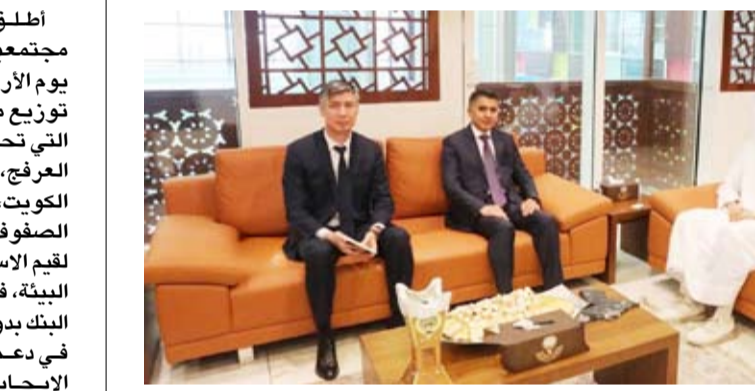
بودي مع سفير أيوب خان يونسوف

بحث وزير التجارة والصناعة أسامة بودي أمس الإثنين مع سفير جمهورية أوزبكستان لدى البلاد الدكتور أيوب خان يونسوف سبل تعزيز التعاون المشترك بين البلدين الصديقين لاسيما في مجال الأمن الغذائي. وقالت (التجارة) في بيان لوكالة الأنباء الكويتية (كونا) إن اللقاء تناول مناقشة آفاق تطوير العلاقات الثنائية في المجالات التجارية والاقتصادية بما يسهم في تحقيق المصالح المشتركة للبلدين الصديقين. وأضافت أن الجانبين استعرضا فرص تنمية التعاون وتوسيع الشراكات الاقتصادية بما يعزز التبادل التجاري ويدعم توجهات التنمية المستدامة. وأشارت إلى أن الاجتماع يأتي في إطار حرص دولة الكويت على توطيد علاقاتها مع مختلف الدول وتعزيز التعاون المشترك في مختلف القطاعات الحيوية.