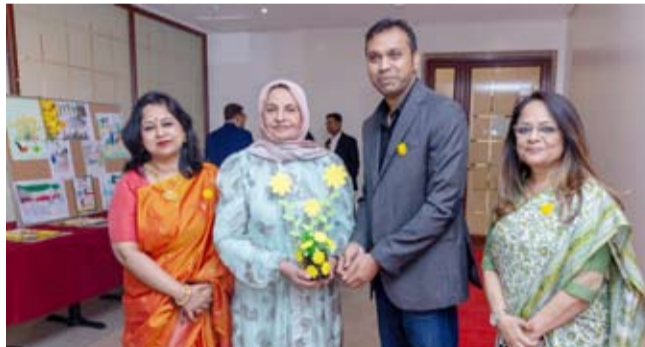
شاييتالي بي والكويش روي وزهرة العرفج

حيثلقى طلاب المدارس الهندية كلمات قصيرة عبروا فيها عن جهم وامتنانهم ولأولئك للكويت، مُسجدين بذلك الرابطة العاطفية التي تجمع الجيل الشاب بالبلد الذي يفخرون بالانتماء إليه.