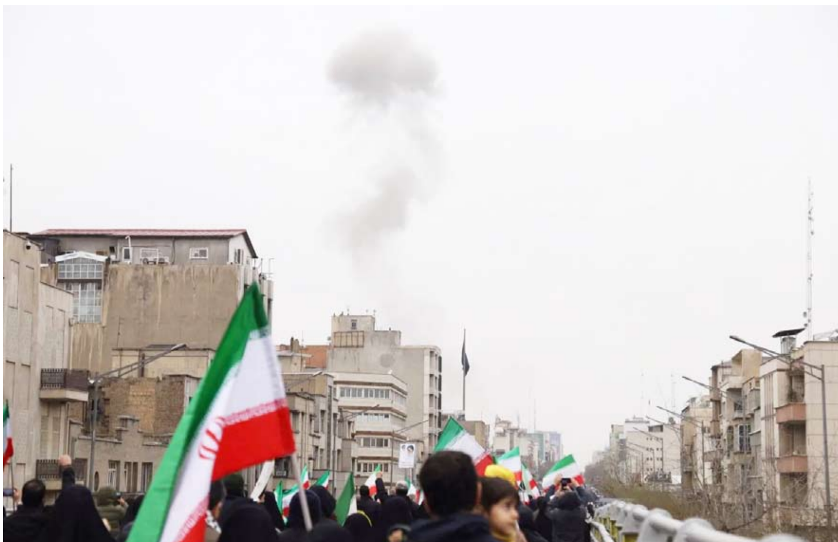
انفجار خلال احتجاجات إحياء لذكرى «يوم القدس»