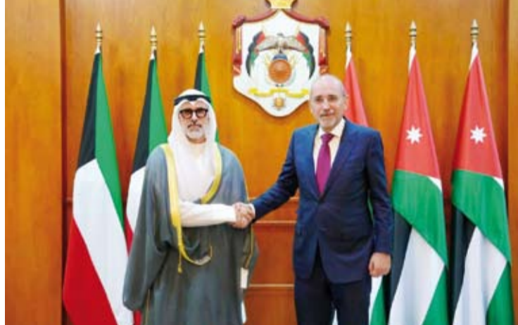
وزير الخارجية الشيخ جراح الجابر مع وزير الخارجية الأردني أيمن الصفدي

وفرض تحقيق السلام العادل والشامل لاسيما بناء المستوطنات وتوسعتها وضم الأراضي ومحاولات تغيير الوضع التاريخي والقانوني القائم في المقدسات الإسلامية والمسيحية في القدس. كما تبادل الجانبان وجهات النظر حول الأوضاع في لبنان، حيث أكد أهمية تثبيت وقف إطلاق النار ودعم الحكومة اللبنانية في جهودها بفرض سيادتها على كل أراضيها وحصر السلاح بيد الدولة. وعلى صعيد العلاقات بين البلدين، أكد الجانبان عمق العلاقات الأخوية الراسخة التي تجمع البلدين الشقيقين ووقوف المملكة والكويت معا في مواجهة مختلف التحديات. وبحث الجانبان -وفقاً للبيان- سبل تعزيز التعاون بين البلدين في مختلف المجالات خدمة لمصالحهما المشتركة. وأشار البيان إلى أنه تم الاتفاق على التحضير لعقد الدورة السادسة للجنة العليا المشتركة (الأردنية - الكويتية) والبناء على الخطوات المقررة في الدورة الخامسة التي عقدت في دولة الكويت العام الماضي.