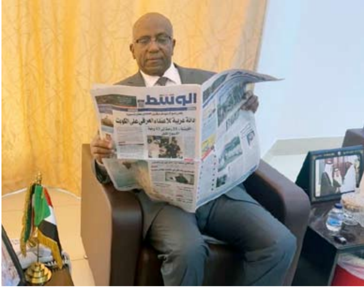
سفير السودان يقرأ جريدة الوسط

الكويت ظلت داعماً سياسياً وإنسانياً بارزاً لبلادنا ما بعد العدوان وكذلك قبله