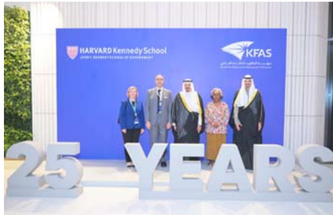
سمو الشيخ أحمد عبدالله خلال رعايته وحضوره الملتقى

أشاد سمو الشيخ أحمد عبدالله رئيس مجلس الوزراء، بالشراكة المتجددة بين مؤسسة الكويت للتقدم العلمي (KFAS) وكلية (كينيدي) بجامعة هارفارد بوصفها استثماراً استراتيجياً في الإنسان الكويتي.