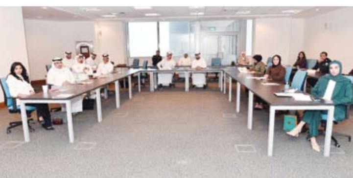
جانب من المرحلة الثانية للبرنامج التدريبي

الإنساني. وأعرب المهنا عن تطوع (اللجنة الوطنية الدائمة) إلى إعداد مدربين وطنيين معتمدين لتعزيز الوعي المؤسسي بالقانون الدولي الإنساني ودعم قواعده في التدريب والسياسات الوطنية ورفع مستوى الالتزام العملي بهذه القواعد. وياتي البرنامج التدريبي الذي أقيم في الفترة بين 23 و27 نوفمبر الجاري في مقر معهد الكويت للدراسات القضائية والقانونية في إطار ترسيخ مبادئ القانون الدولي الإنساني والعمل على تحقيق الأهداف التي ترسي إليها الاتفاقيات والمعاهدات الدولية المعقودة بشأنها وكفالة احترامها وتعزيز التعاون الدولي في هذا المجال والتعريف بتلك المبادئ ونشرها على المستوى الوطني.