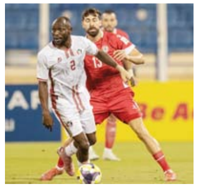
فوز مثير للسودان على لبنان

سيطرت البحرين على الكرة في وسط الملعب في أول ربع ساعة، عن طريق علي مدن وكميل الأسود وسيد ضياء سعيد، من دون وجود أي محاولات هجومية خطيرة