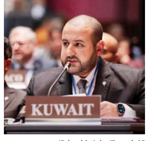
الشيخ د. عبدالله مشعل يترأس وفد الكويت

وعلى هامش المؤتمر عقد وكيل وزارة الدفاع والوفد المرافق عدداً من اللقاءات الثنائية مع رؤساء الوفود والمسؤولين الدوليين جرى خلالها بحث فرص تعزيز التعاون وتبادل الخبرات في الجوانب التقنية والتشريعية المتعلقة بتنفيذ الاتفاقية. وضم وفد دولة الكويت القائم بالأعمال بالإناية في سفارة الكويت لدى مملكة هولندا إبراهيم الدعى وعددًا من ممثلي وزارتي الخارجية والدفاع.