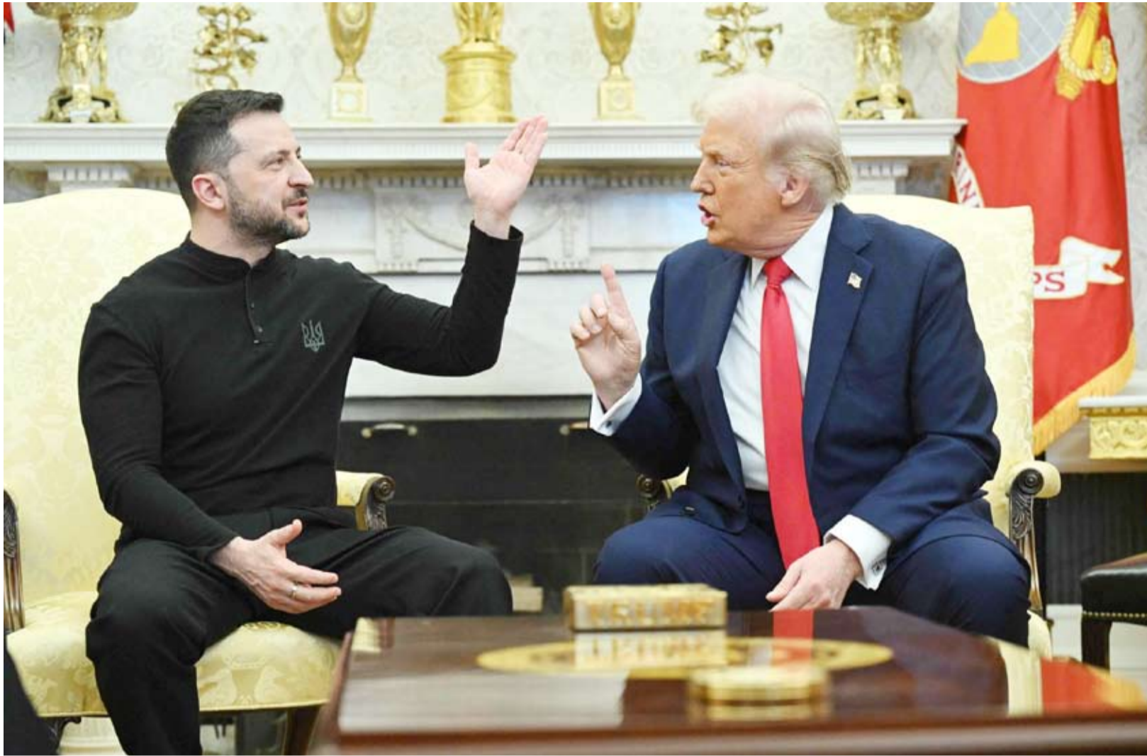
لقاء سابق بين ترامب وزيلينسكي

في الأيام والساعات الأخيرة، تسارعت التطورات المتعلقة بخطة الرئيس الأميركي دونالد ترامب لوقف الحرب في أوكرانيا، حتى بات المشهد يبدو كسباق متداخل المسارات يقوده رئيس أميركي حائر بين أوروبين قلقين، وأوكرانيين يقاومون ضغوطاً سياسية وعسكرية متصاعدة، وروس يترقبون اللحظة المناسبة لتعظيم مكاسبهم. قبل أيام فقط، هدد ترامب بوقف الدعم العسكري والمالي لكيف إذا لم تقبل بخطة سلام من 28 بنداً بحلول، لكنه عاد وتراجع عن الموعد، ولم يفهم هذا التراجع بعده مرونة فحسب، بل هو دليل على ارتباك داخل البيت الأبيض، خصوصاً بعد تسرب مكالمة لمبعوثه ستيف ويتكوف ظهر فيها وكأنه يقدم نصائح لمستشار الرئيس الروسي فلاديمير بوتين حول كيفية التعامل مع الرئيس الأميركي. وقال ترامب إنه «غير جاهز» للقاء الرئيسين الأوكراني فولوديمير زيلينسكي أو الروسي ما لم تكن الخطة «نهائية أو شبه مكتملة»، في محاولة واضحة لإبعاد نفسه قليلاً عن تفاصيل التفاوض، تاركاً خطوطه الحمراء الغامضة لصياغة مساعديه؛ ويتكوف، ووزير الجيش دان دريسكول، وربما صهره جاريد كوشنر الذي لع إلى إمكانية زيارة موسكو. هذا التخفيف الأميركي من الضغط منح كيف فرصة قصيرة لالتقاط الأنفاس، بعد أيام من محاولات دفعها إلى قبول خطة وصفت بأنها «استسلام كامل»، ليس فقط من قبل