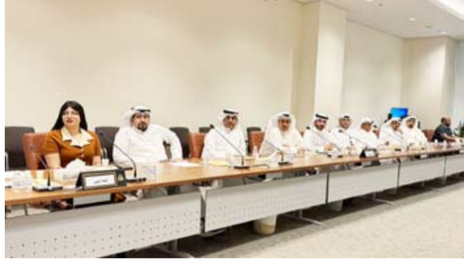
متابعة من الجهات الحكومية في اجتماع اللجنة