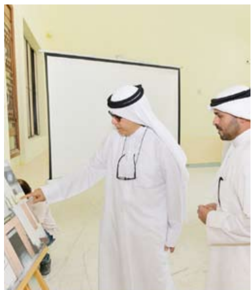
جانب من زيارة محافظ مبارك الكبير للمسجد