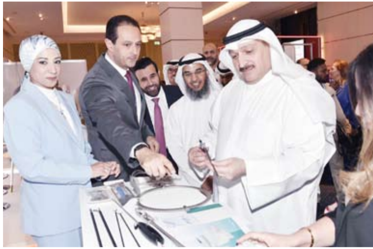
جانب من جولة وزير الصحة