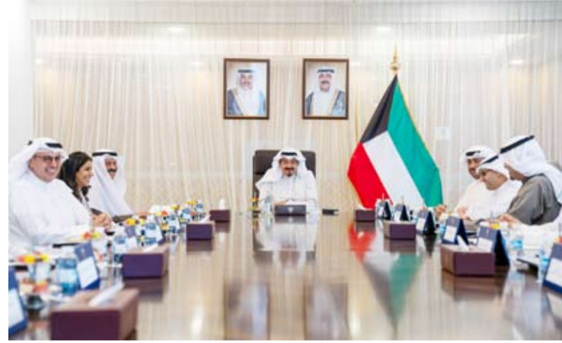
سمو الشيخ أحمد عبدالله يترأس الاجتماع

مبارك الكبير والتعاون في مجال منظومة الطاقة الكهربائية وتطوير الطاقة المتجددة والتعاون بشأن منظومة خضراء منخفضة الكربون لإعادة تدوير النفايات والتعاون في مجال التطوير الإسكاني والتعاون في مجال البنية التحتية البيئية