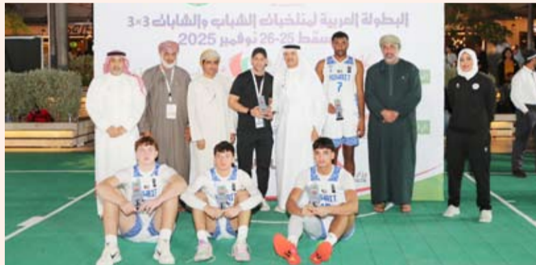
فريق الشباب حصد المركز الثاني