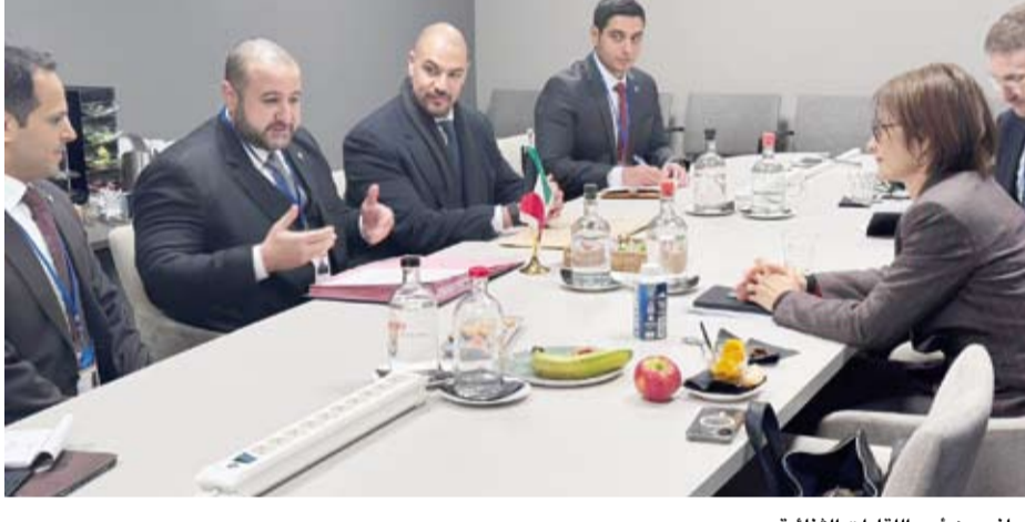
جانب من أحد اللقاءات الثنائية