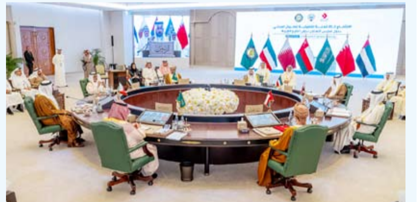
جانب من الاجتماع الـ 21 للجنة التنفيذية الخليجية للطيران المدني

أكد رئيس الهيئة العامة للطيران المدني الكويتية، الشيخ حمود المبارك، أن اللجنة التنفيذية الخليجية للطيران المدني، أوصت بالموافقة على إنشاء هيئة خليجية موحدة للطيران المدني على أن يرفع هذا القرار إلى المجلس الأعلى لمجلس التعاون لدول الخليج العربية لاعتماده. جاء ذلك في تصريح أدلى به الشيخ حمود المبارك لـ (كونا) أمس، خلال الاجتماع الـ 21 للجنة التنفيذية الخليجية للطيران المدني المنعقد حالياً في البلاد.