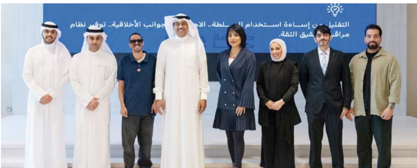
المشاركون في البرنامج التدريبي

الإلقاء والتعبير الصوتي وصناعة المحتوى السمعي أصبح مطلباً للمتخصصين في الإعلام والاتصال المؤسسي، مشيراً إلى أن الصوت قادر على خلق علاقة مباشرة مع المتلقي ونقل من أي وسيلة أخرى. وأوضح أن التدريب العملي الذي تضمنه البرنامج أتاح للمشاركين فرصة تطبيق المهارات فوراً ما ساعدهم على تطوير أدائهم الصوتي وإنتاج محتوى واقعي قابل للنشر.