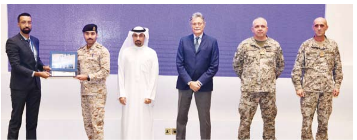
تكريم المشاركين في الدورة التدريبية