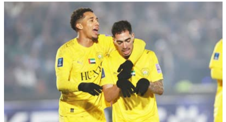
تعادل يطعم الفوز للوصل أمام الاستقلال

لكن هوغو نيتو تعادل للوصل في الدقيقة 63 عن طريق تمريرة ساحرة من سيرجينيو من داخل منطقة الجزاء لينفرد هوغو بالمرمى ويسدد في الشباك.