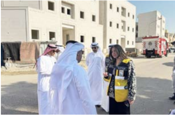
العصفور تتابع عمليات الإزالة