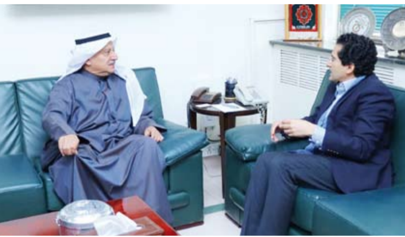
السفير نصار المطيري مع وزير البترول الباكستاني علي مالك

باكستان بتعميق التعاون الثنائي، مشدداً على أهمية توسيع الشراكة البترولية بما يتماشى مع تطورات ديناميكيات الطاقة العالمية. ووفق البيان، اتفق الجانبان على مواصلة التنسيق الوفيق واستكشاف فرص جديدة في قطاع الطاقة وتعزيز العلاقات التاريخية بين باكستان والكويت.