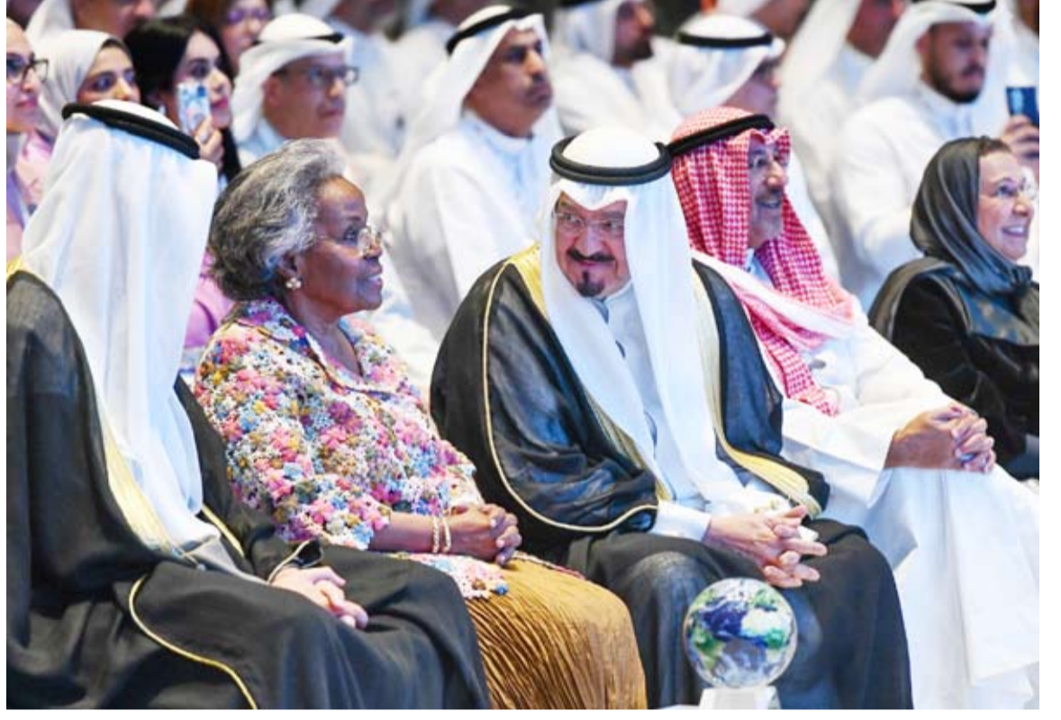
سمو الشيخ أحمد العبدالله خلال رعايته وحضوره المنقذ

أكثر من 535 خرقا قوات الاحتلال ارتكبتها منذ دخول اتفاق وقف إطلاق النار في قطاع غزة حين التنفيذ ما أسفر عن استشهاد 350 فلسطينيا بينهم 130 طفلا و54 امرأة، وذلك بمعدل يزيد على 11 خرقا يوميا. وبالتزامن مع تلك الخروقات والصمت الدولي عنها، وغض الطرف الأميركي أو مباركتها لها، يمارس الاحتلال هوايته القذرة في منع دخول المساعدات الإنسانية، فلم يسمح إلا بمرور 211 شاحنة يوميا خلفا لادعاءاته بالسماح بمرور 600 شاحنة. يأتي ذلك كله بالتوازي مع تعمد تعطيل الانتقال إلى المرحلة الثانية من خطة وقف إطلاق النار آملا في نسف الاتفاق برمته والعودة إلى حرب الإبادة.