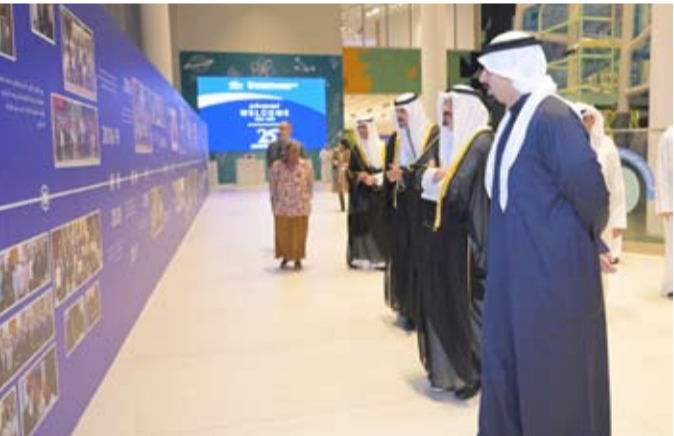
... وسموه يطلع على جانب من نشاطات المؤسسة