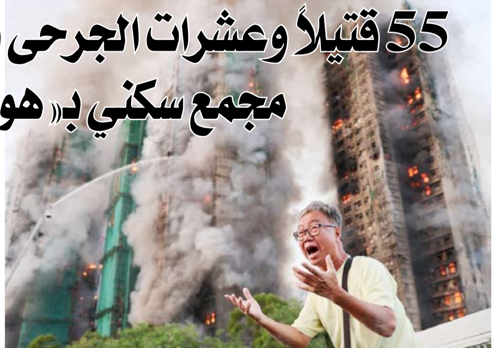
الحريق اندلع في 7 أبراج سكنية بمنطقة تاي بو شمال هونغ كونغ