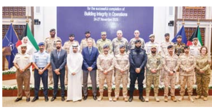
لقطة جماعية عقب اختتام الدورة التدريبية

مبادرة إسطنبول للتعاون. وأعرب عن خالص الشكر لجميع المشاركين والشكر للمدربين من حلف شمال الأطلسي (ناتو) والقيادة المشتركة للقوات الحليفة في نابولي لتقديمهم هذا البرنامج. وكان مدير المركز الإقليمي لـ «ناتو» شمال الأطلسي (ناتو) ومبادرة إسطنبول للتعاون، أكد خلال انطلاق الدورة التدريبية، أن الدورة التي استهدفت ضباطاً من رتب (OF-3) إلى (OF-5) وموظفين مدنيين قدموا من دول مجلس التعاون لدول الخليج العربية ودول