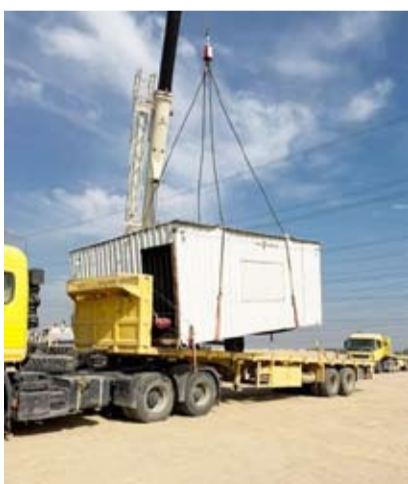
إزالة كرفان مخالف

بتوجيهات ومتابعة ميدانية من وزير الدولة لشؤون البلدية ووزير الدولة لشؤون الإسكان المهندس عبداللطيف المشاري ومدير عام البلدية المهندس مئال العصفور بإشرت لجنة المخيمات الربيعية في بلدية الكويت بالمنطقة الجنوبية بإزالة المخيمات المخالفة لعدم وجود ترخيص مخيم بالإضافة إلى عدم الالتزام بالأماكن المخصصة للتخيم بالتعاون مع وزارة الداخلية والقوة العامة للإطفاء والهيئة العامة للبيئة.