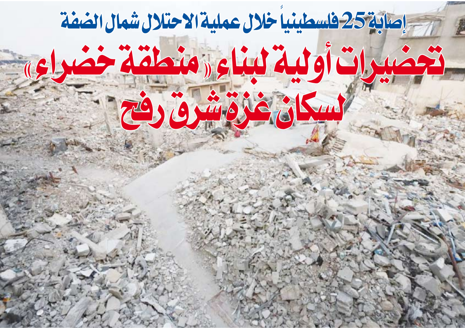
دمار جراء الغارات على قطاع غزة