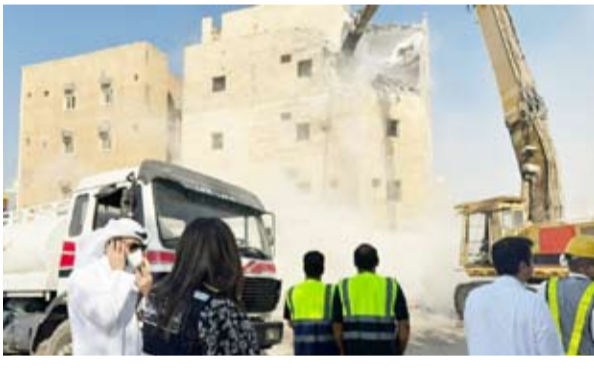
هدم أحد العقارات

أزالت بلدية الكويت 67 عقاراً متهاكاً في جليب الشيوخ، وذلك بعد انتهاء المهلة الممنوحة لملاكها بالإخلاء.