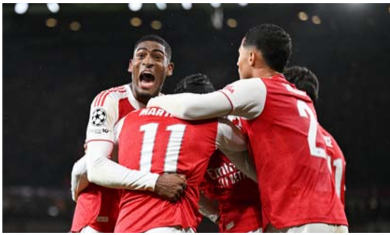
الجانز في موسم استثنائي

وبذلك، حقق أرسنال، الذي لا يزال يبحث عن تحقيق لقبه الأول في دوري الأبطال، فوزه الرابع في تاريخ لقاءاته مع بايرن، الذي لا يزال يمتلك