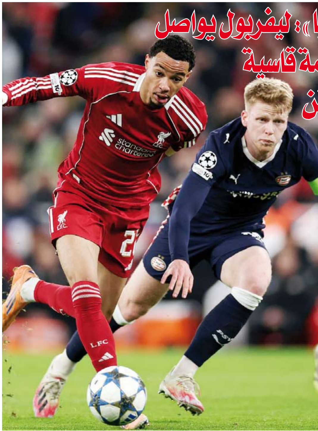
سقوط جديد للريدز