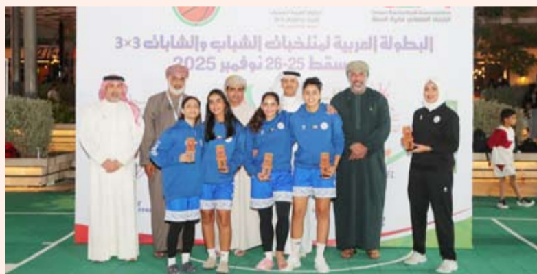
فريق الشباب حصد المركز الثالث

حصد منتخب الشباب المركز الثاني في البطولة العربية للرجال 3x3، التي أقيمت على مدار يومين في العاصمة العمانية مسقط بتنظيم مشترك بين الاتحادين العماني والعربي للعبة، فيما حصد منتخب الشابات المركز الثالث في نفس البطولة.