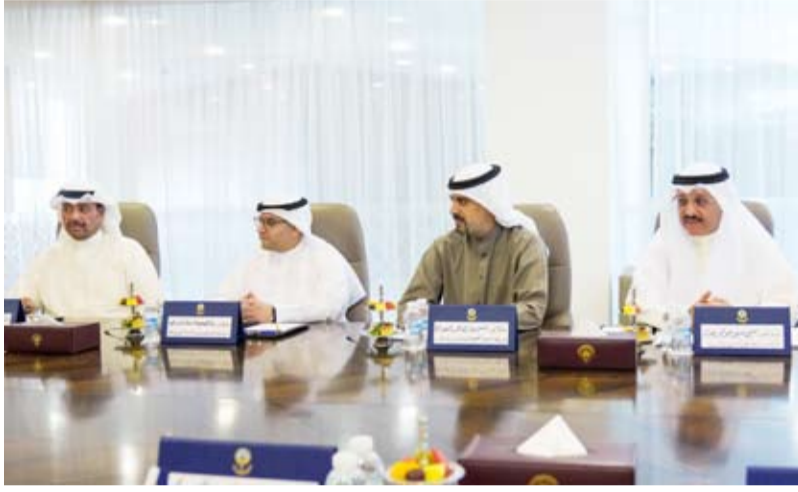
جانب من اجتماع اللجنة الوزارية لمتابعة المشاريع التنموية

وأكدت المؤسسة استمرارها في تعميق الشراكة مع كلية كينيدي بجامعة هارفارد وتوسيع مجالاتها بما يدعم رؤية دولة الكويت في بناء اقتصاد متنوع قائم على المعرفة ويعزز دورها العلمي والإنساني في محيطها الإقليمي والدولي تحت القيادة الحكيمة لصاحب السمو أمير البلاد الشيخ مشعل الأحمد وسمو ولي العهد الأمين الشيخ صباح خالد وسمو الشيخ أحمد عبدالله رئيس مجلس الوزراء.