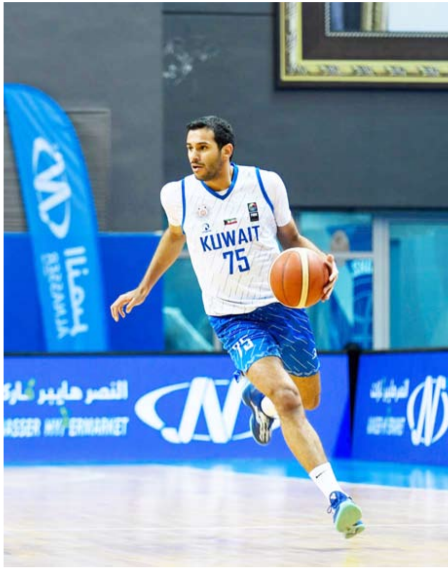
جانب من اللقاء

كما نال المنتخب القطري لقب فئة الشابات والميدالية الذهبية بعد فوزه في المباراة النهائية بنتيجة (21 - 13) على نظيره العماني الذي احتل المركز الثاني والميدالية الفضية، فيما جاء المنتخب الكويتي ثالثاً والميدالية البرونزية.