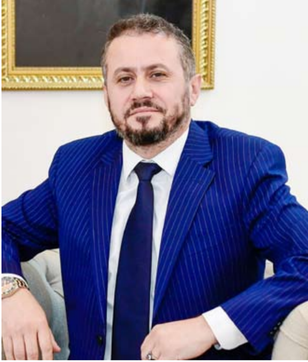
سفير ألبانيا لدى البلاد إير هوسا

وأوضح أن بلاده «تقدّم فرصاً جذابة للمستثمرين الكويتيين، لا سيما مع الإصلاحات الاقتصادية المتسارعة والبيئة الاستثمارية المحفّزة».