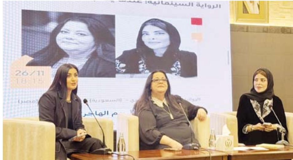
المشاركات في الجلسة

وأكدت أن العلاقة بين الكاتب والمخرج وفريق العمل يجب أن تكون تكاملية وأن كل تجربة تحويل نص إلى عمل بصري تمنح القارئ والجمهور فرصاً جديدة للتفاعل مع النص وتبرز عبقريته التي لا يمكن وعبقريته المخرج في تحويل النص إلى مشهد حي.