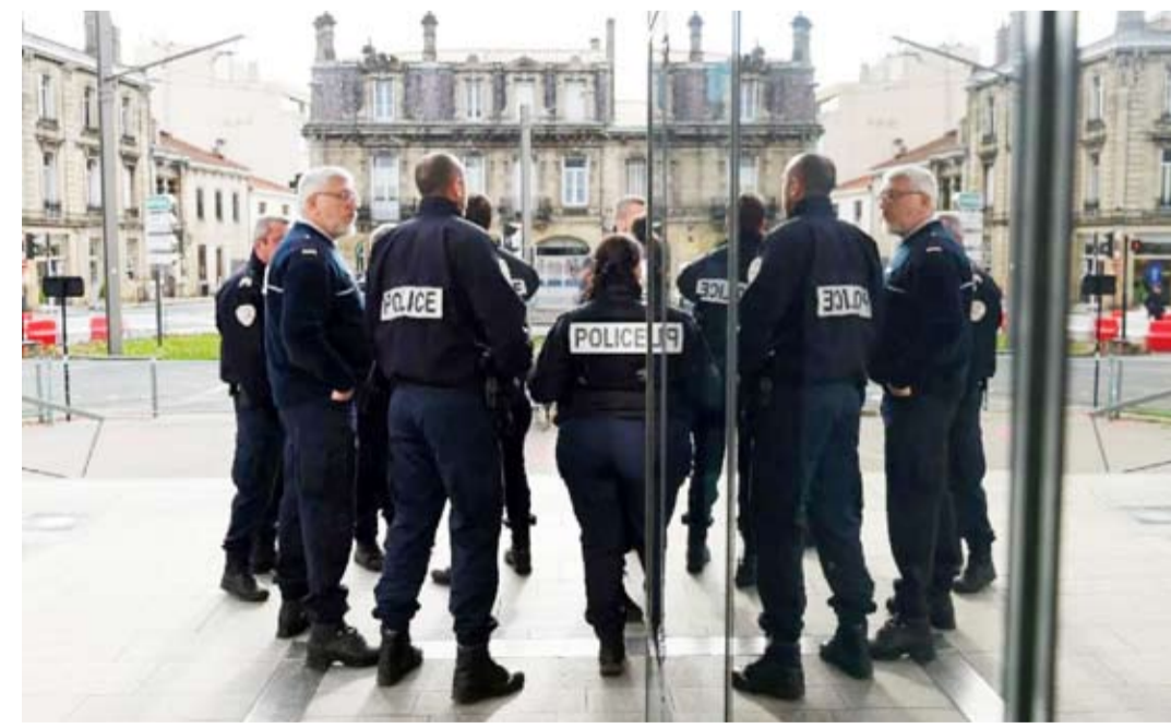
عناصر من الشرطة الفرنسية