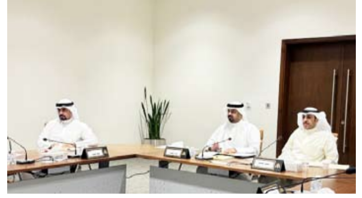
جانب من اجتماع لجنة تقصي الحقائق بالبلدي

1 - اعتماد أهداف اللجنة وآلية عملها من خلال: - تحديد نطاق البحث الجغرافي (فروع البلدية، المحافظات). - تحديد آلية تلقي الشكاوى والملاحظات والمراسلات الرسمية. 2 - استعراض تقارير إدارات التدقيق والمتابعة الهندسية وإدارات النظافة وإشغالات الطرق في المحافظات بشأن التعديات والاستغلال التجاري لأملاك الدولة. 3 - الاستماع إلى مديري الإدارات المعنية في بلدية الكويت (التدقيق والمتابعة، تراخيص المحلات النظافة