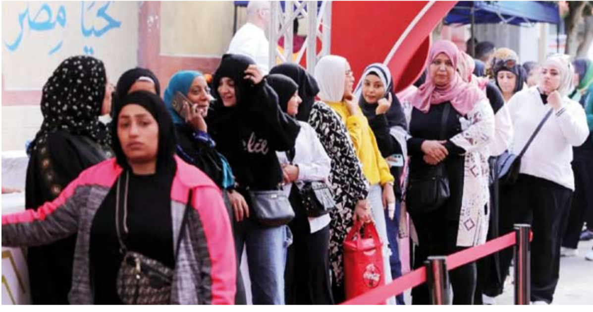
ناخبات في طابور أمام مركز اقتراع

قال الرئيس المصري عبد الفتاح السيسي، إن بعض ملاحظاته على عملية التصويت في انتخابات مجلس النواب كانت بمثابة «فيتو» لعدم رضاه عنها، واعتراضاً على بعض الممارسات.