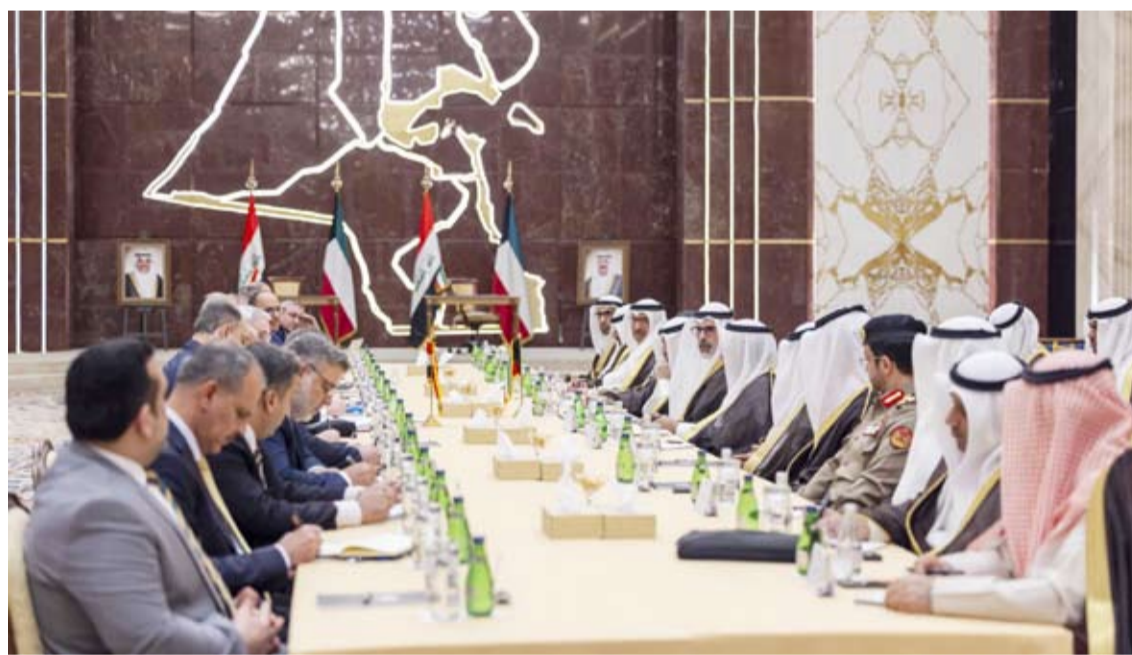
جانب من اجتماع اللجنة الفنية أمس في الكويت

ووكيل وزارة الخارجية العراقية للشؤون الثنائية السفير محمد بحر العلوم. وذكرت الخارجية في بيان صحفي أن الجانبين أعادا التأكيد على استمرارية عقد اللجنة الفنية والقانونية المشتركة