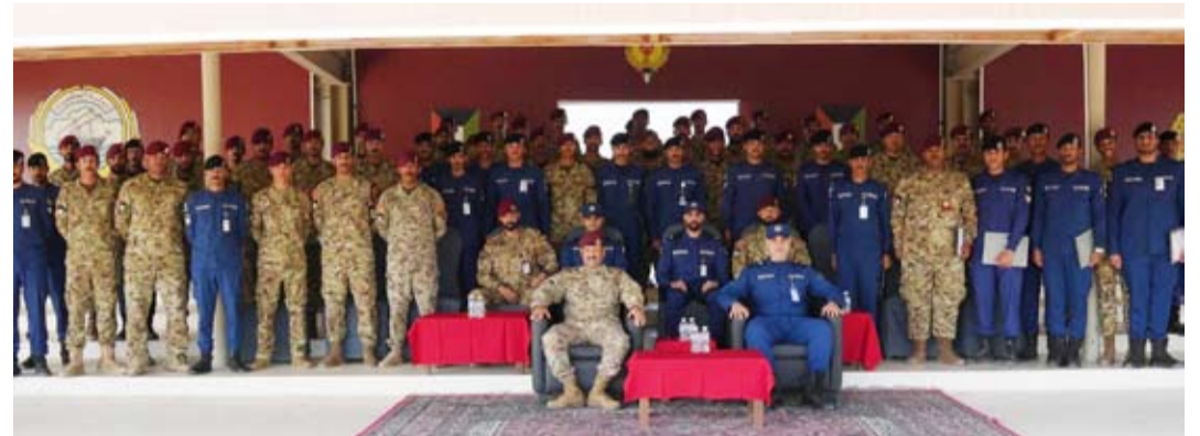
ممثلو قوّة الإطفاء

شاركت قوّة الإطفاء العام بالتعاون مع الحرس الأميري في الجيش الكويتي في دورة المراسم لضباط الصف والأفراد رقم (4) التي أقيمت في معهد تدريب الحرس الأميري خلال الفترة من 2 إلى 27 نوفمبر 2025 وذلك في إطار تعزيز التنسيق والشراكة بين الجانبين. وتأتي هذه المشاركة استمراراً لجهود قوّة الإطفاء العام في تطوير منظومة المراسم ورفع كفاءة منتسبيها بما يعكس مستوى الجاهزية والإحترافية ويعزز التكامل المؤسسي بين مختلف الجهات العسكرية في دولة الكويت