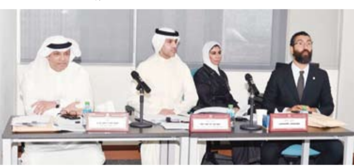
مشاركون في البرنامج التدريبي