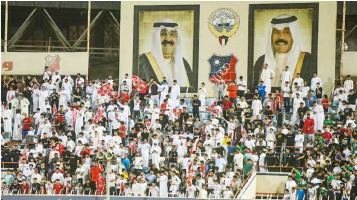
جماهير الكويت حاضرة بقوة في التتويج