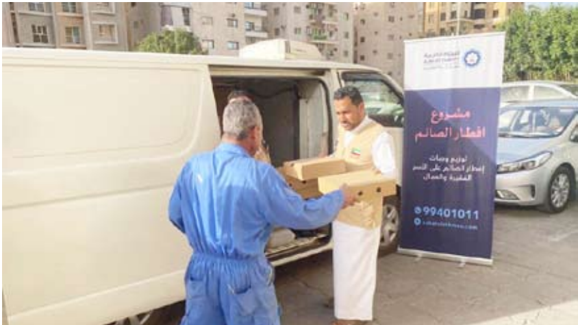
جانب من توزيع وجبات إفطار الصائم

من العمالة وضعاف الدخل وغيرهم من الفئات المستفيدة، وحرص على توزيع الوجبات عليهم في مناطق تواجدهم. وبين الكندري أن مشروع وجبات إفطار الصائم مستمر إلى نهاية شهر رمضان داعياً المتبرعين من الأفراد والمؤسسات إلى التواصل مع زكاة العثمان ودعم المشروع من خلال الاتصال هاتفياً. وأشاد بالدور المميز الذي يقوم به العاملون في زكاة العثمان والمتطوعون في توزيع الوجبات، مؤكداً الحرص على مراعاة الضوابط الصحية، وتعليمات الأمن والسلامة وذلك حفاظاً على صحة الجميع.