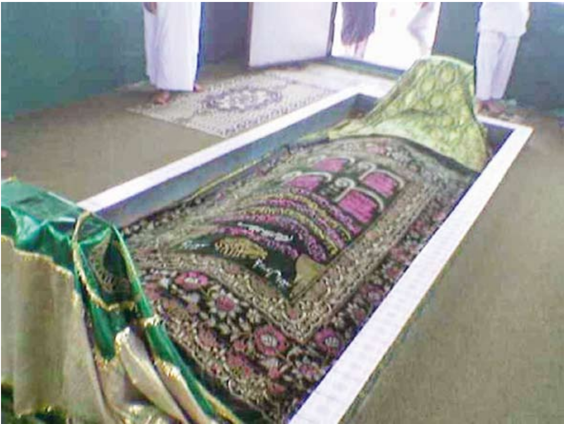
مرقد سيدنا أيوب

قال الله تبارك وتعالى: وخذ بيدك ضغثا فاضرب به ولا تحنث إنا وجدناه صابراً نفع العبد إنّه أواب (44) «سورة يوسف» .