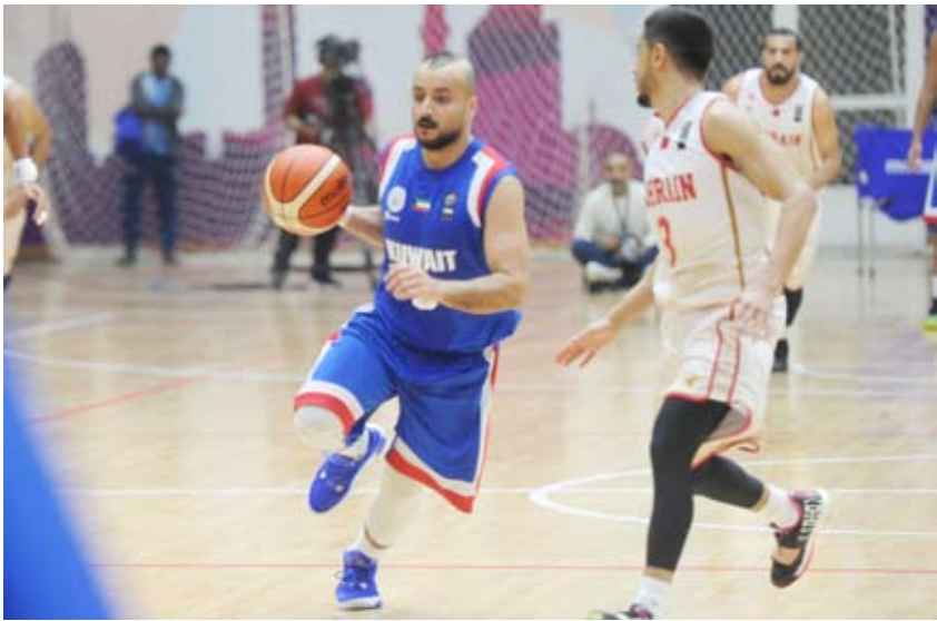
سلة الكويت والاستعداد لتصفيات كأس آسيا 2025

بعد ان وقع في المجموعة الثانية الى جانب منتخبتي فلسطين والعراق مرعبا عن أملة ان تحقق كرة السلة الكويتية نتائج جيدة