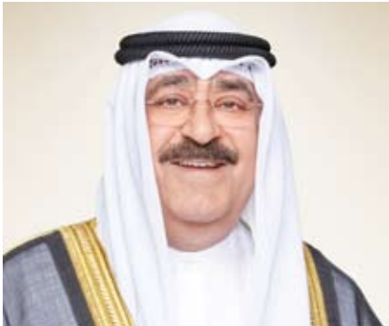
سمو ولي العهد الشيخ مشعل الأحمد

التي بعث صاحب السمو أمير البلاد الشيخ نواف الأحمد، ببرقية تهنئة إلى الرئيسة سامية صلوحي حسن رئيسة جمهورية تنزانيا المتحدة الصديقة، ضمنها سموه خالص تهانیه بمناسبة العيد الوطني لبلادہ، متمنياً لجلالته مو فو