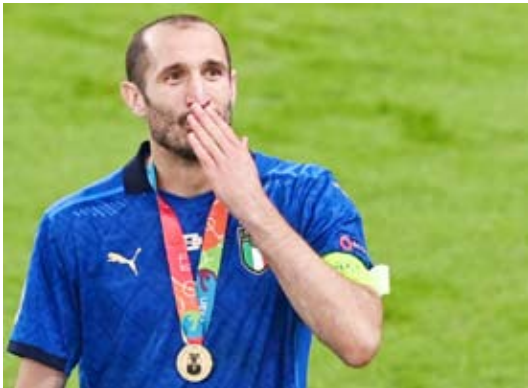
الدافع المخضرم جورجو كييليني

آخر مباراة لي مع إيطاليا». وكان كييليني الذي خاض 116 مباراة دولية مع منتخب بلاده، يأمل في المشاركة بكأس العالم مرة أخرى قبل أن يقول (نشأوا) (وداعاً) للجماهير، لكن إيطاليا ستغيب عن مونديال قطر 2022، للمرة الثانية توالياً، ما عجل باعترال قلب الدفاع دولياً.