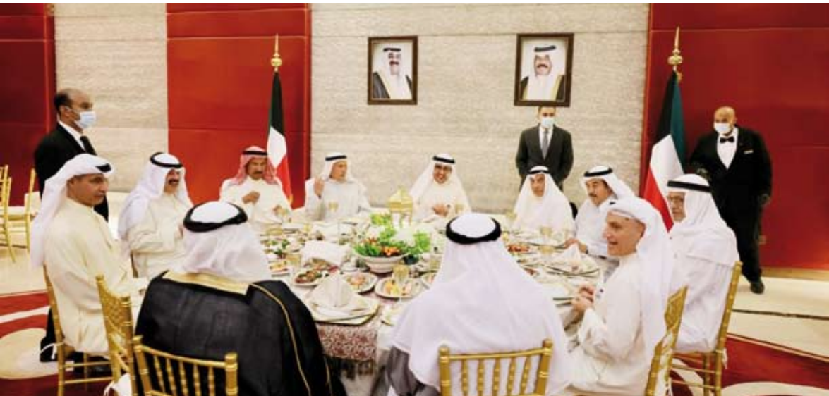
الشيخ الدكتور أحمد ناصر المحمد خلال إقامته مأدبة

تكريماً للسفراء والقياديين المتقاعدين في وزارة الخارجية، أقام الشيخ الدكتور أحمد ناصر المحمد، وزير الخارجية المأدبة سحور مساء الاثنين 24 رمضان 1443هـ الموافق 25 أبريل 2022م، حيث نقل وزير الخارجية خلال اللقاء اعتزاز وتقدير صاحب السمو الشيخ نواف الأحمد أمير البلاد وسمو ولي العهد الشيخ مشعل الأحمد، لرواد العمل الدبلوماسي واسهاماتهم المخلصة في تمثيل الكويت ورعاية مصلحة الوطن والمواطنين وتادية واجباتهم بكفاءة وإخلاص واقتدار.