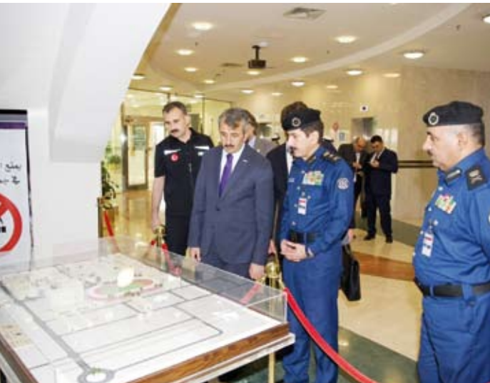
يونس سيزر خلال زيارته قيادة قوة الإطفاء العام

في مهام إطفاء حرائق الغابات بناء على توجيهات أميرية سامية، وتضمنت أعمال الفريق الذي ضم نحو 45 رجل إطفاء وزود بست آليات متخصصة بكامل تجهيزاتها التعامل مع الحرائق ومكافحتها وكذلك المشاركة في عمليات الإنقاذ.