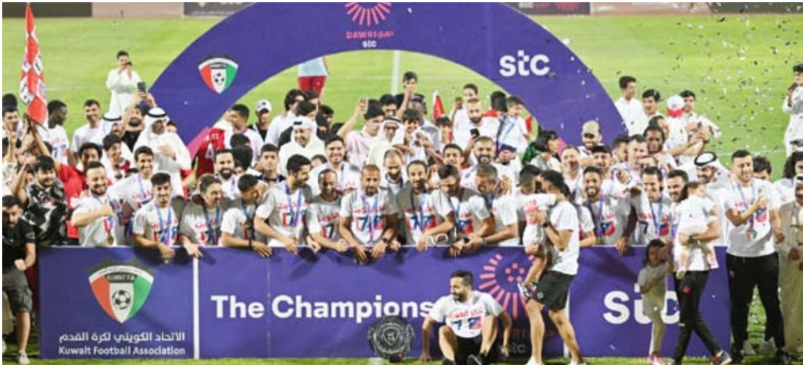
الكويت يحتفل باللقب رقم 17 في تاريخه

نقاط ، وهو ما حافظ عليه مع نهاية الجولة 18. وبهذا الفوز رفع الكويت رصيده الى 42 نقطة في حين بقي العربي عند رصيده السابق بـ32 نقطة وضعته في المركز الثالث.