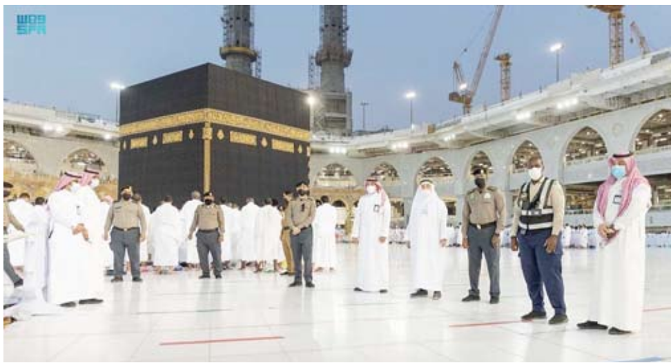
الكوادر الأمنية داخل المسجد الحرام

خلال تبني أحدث الطرق وأفضل الممارسات الداعمة لتحفيز العمل التطوعي، ورفع مستواه والتشجيع عليه، بالإضافة إلى تعزيز جوانب التكامل والشراكة المجتمعية، وما لها من دور في تحقيق رؤية المملكة التي تدعم جهود تنظيم وتطوير العمل التطوعي وتهيئة البيئة المناسبة لتنميته والوصول إلى مليون متطوع في عام 2030.