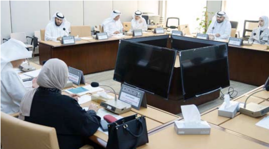
جانب من اجتماع اللجنة

الاجتماعي رغم أهميته في نشر بياناتها وتصريحاتها الرسمية وإطلاع الرأي العام على المستجدات خاصة في الظروف الاستثنائية المتعلقة بانتشار جائحة كورونا وتداعياتها؟ 3 – ألا تتوفر لدى الوزارة ضمن هيكلها التنظيمي إدارة متخصصة بالإعلام والتواصل؟ ذات طابع مؤسسي يحضن أعمالها عن التصرفات أو الرغبات الفردية أيا كانت مبرراتها وأسبابها؟ 4 – تزويدي بكشف عن تنظيم وهيكله قطاع الإعلام والتواصل بالوزارة وتوزيع الاختصاصات والمسؤوليات بها وخاصة تنظيم الحسابات الإلكترونية والموقع الرسمي للوزارة.