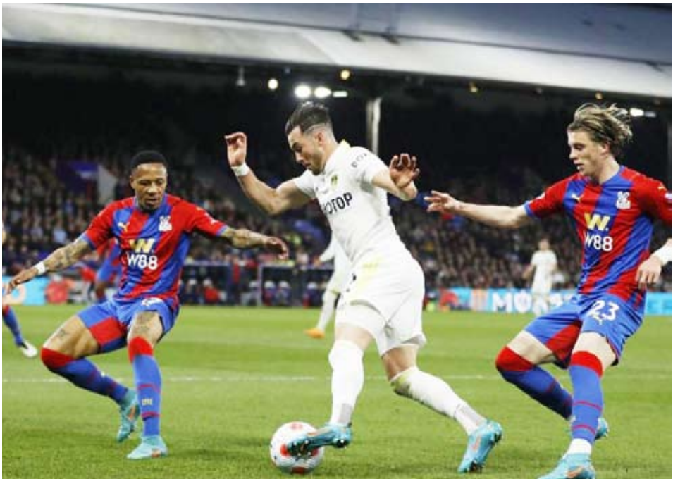
ختام المرحلة الرابعة والثلاثين من الدوري الإنجليزي

ختم كريستال بالاس وضيفه ليدز يونايتد المرحلة الرابعة والثلاثين من الدوري الإنجليزي لكرة القدم بتعادل سلبي على ملعب ”سيلهورت بارك“ في لندن.