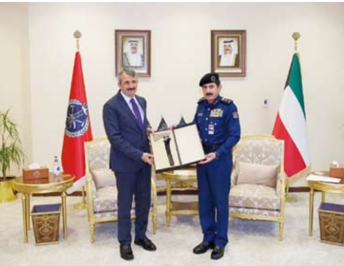
الفريق خالد المكراد خلال استقباله رئيس هيئة إدارة الكوارث والطوارئ التركية يونس سيزر

المكراد المسؤول التركي الزائر للبلاد والوفد المرافق، حيث أكد عمق الروابط المتينة بين البلدين الصديقين. وتناول اللقاء بحث الموضوعات ذات الاهتمام المشترك وسبل دعم وتعزيز التعاون الثنائي.