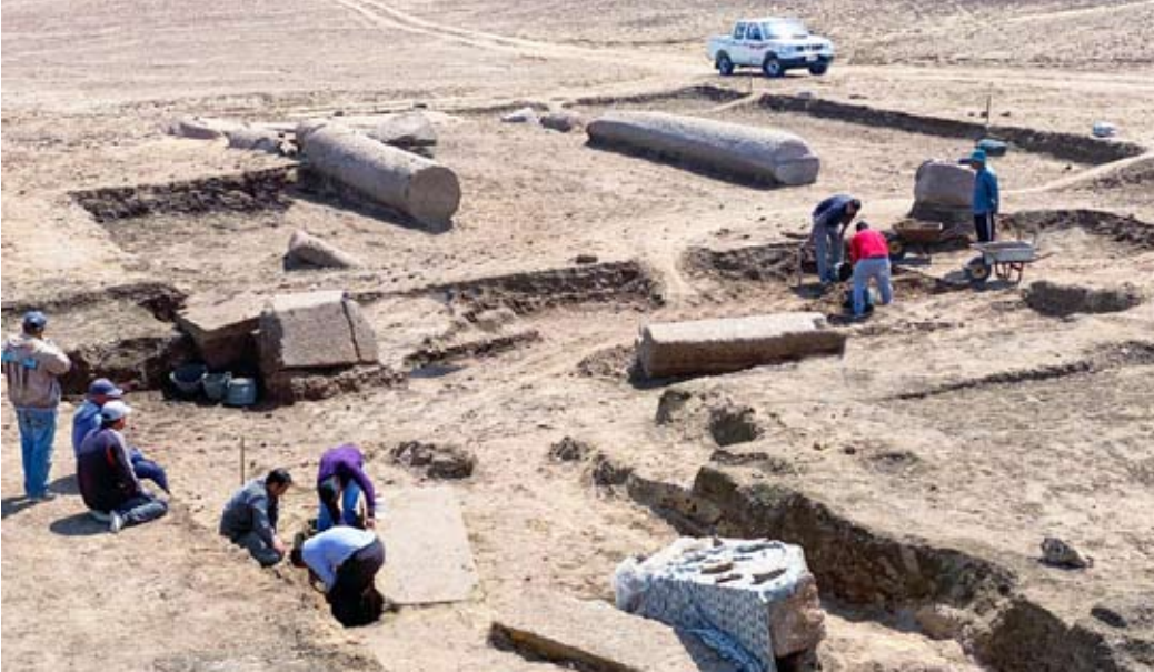
انقاض معبد زيوس عند الإغريق في سيناء

عليها بين بين قلعة بيلوزيوم وكنيسة تذكارية في الموقع. وعثر علماء الآثار على مجموعة من الكتل الغرانيتية، ربما كانت تستخدم لبناء درج للمصلين للوصول إلى المعبد. وتعود أعمال الحفر في المنطقة إلى أوائل القرن العشرين عندما عثر عالم المصريات الفرنسي، جان كليدات، على نقوش يونانية قديمة أظهرت وجود معبد زيوس كاسيوس، لكنه لم يتمكن من اكتشافه، وفقا للوزارة.