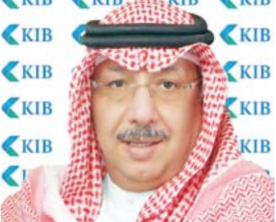
الشيخ محمد جراح الصباح

المالية التي حققها KIB منذ بداية العام وحتى الآن، تؤكد نجاح فريقه التنفيذي وجميع الموظفين في تطبيق مبادرات وخطط البنك الاستراتيجية، ومدى استمراره في تطوير أنظمة البنك وعملياته وتحسين أدائه في القطاع المالي والمصرفي بشكل عام، مشيراً إلى تثبيت تصنيفه الائتماني طويل الأجل (Long-term IDR) من قبل وكالة التصنيف العالمية “فيتش”، عند “A+”، وكذلك تثبيت قدرته الذاتية (VR) عند “bb-“، مع نظرة مستقبلية مستقرة.