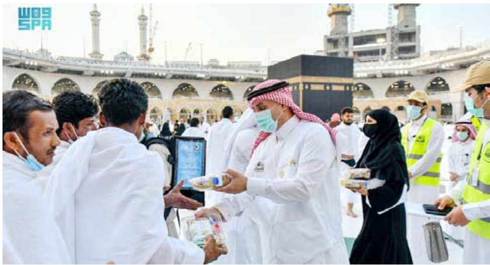
توزيع وجبات الإفطار لضيوف الرحمن