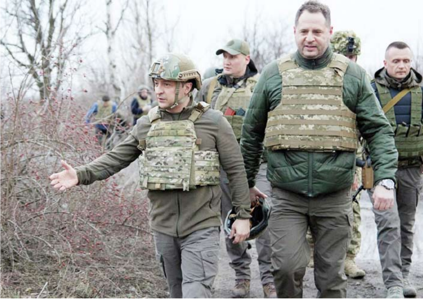
القتال في أوكرانيا