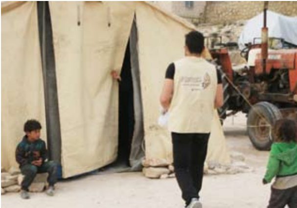
جانب من توزيع الوجبات على النازحين