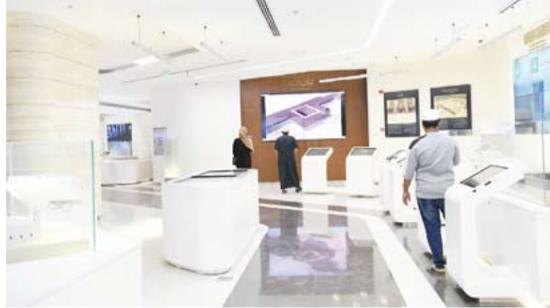
المعرض بشكل تجربة تربية للزائرين