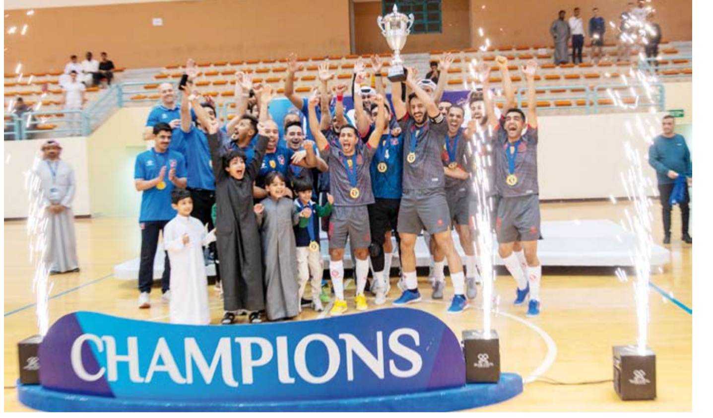
تتويج لاعبي نادي الكويت بلقب البطولة