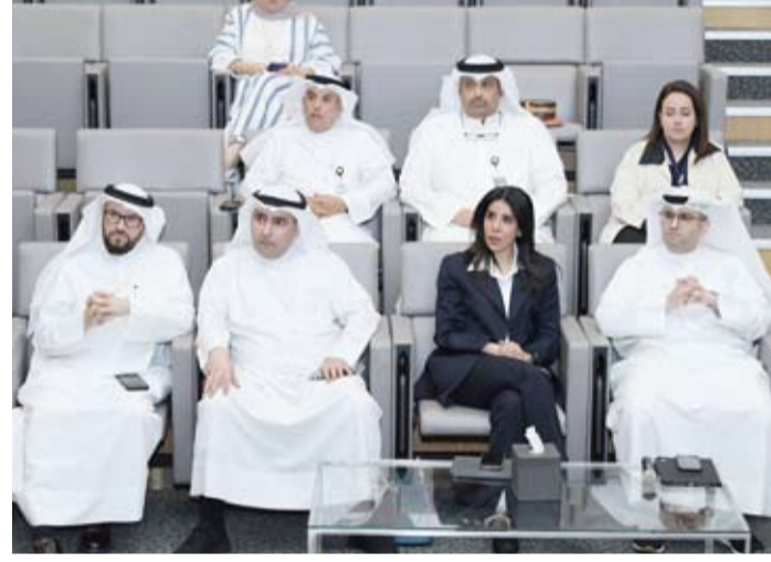
الوزير عبد اللطيف المشاريح والوزيرة الدكتورة نورة المشعان أثناء اجتماع اللجنة

الزمني اللازم له والمتطلبات والتوصيات المناسبة لتذليل أي عواقب تمهيداً لرفع تقرير وزاري إلى لجنة الخدمات العامة بمجلس الوزراء. وأضافت أن عضوية اللجنة تشكلت من ممثل عن كل من وزارة المالية والأشغال العامة والكهرباء والماء والطاقة المتجددة والمواصلات إلى جانب بلدية الكويت والهيئة العامة للطرق والنقل البري والهيئة العامة للزراعة والثروة السمكية وبنك الائتمان الكويتي على أن لا يقل التمثيل عن مستوى وكيل وزارة مساعد.