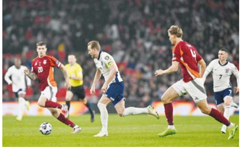
هاري كين يواصل التهديد في فوز إنجلترا

حقق المنتخب الإنجليزي لكرة القدم فوزه الثاني في تصفيات أوروبا المؤهلة لمونديال 2026 وجاء على حساب لاتفيا بثلاثية أهداف دون مقابل، وذلك في المباراة التي جمعت بينهما ضمن منافسات المجموعة الحادية عشرة من المسابقة. وتقدم المنتخب الإنجليزي في الدقيقة 38 عن طريق ريس جيمس، قبل أن يضيف هاري كين الهدف الثاني في الدقيقة 68. وفي الدقيقة 76 سجل إيبترشي إيزي الهدف الثالث. وكان المنتخب الإنجليزي قد فاز على ألبانيا بهدفين دون رد في الجولة الأولى. وفي مباراة أخرى بنفس المجموعة، فاز المنتخب الألباني على ضيفه منتخب أندورا بثلاثية نظيفة. وسجل راي ساناج هدفين لآلبانيا في الدقيقتين 9 و19.