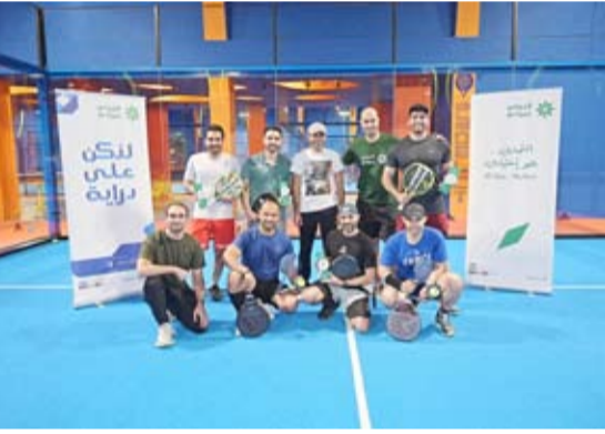
مشركون في بطولة البادل

حصل الفائزون الثلاثة الأوائل في البطولة على جوائز نقدية في فئتي الرجال والنساء. هذه هي بطولة البادل الثانية لموظفي البنك، وستستمر في إقامتها بشكل دوري في المستقبل نظراً لشعبيتها وإقبال الموظفين عليها.