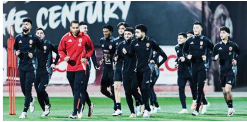
جانب من تدريبات الأهلي المصري

أعلن النادي الأهلي المصري تقدمه باستئناف أمام لجنة التظلم بالاتحاد المحلي للعبة للمطالبة بإلغاء قرار رابطة المحترفين المصرية حول مباراة القعة ضد الزمالك. ويأتي الاستئناف بعدما أصدرت رابطة الأندية قراراتها بشأن مباراة القعة باعتبار الأهلي خاسراً أمام الزمالك بنتيجة 3-0 وخصم 3 نقاط من رصيده في الدوري بتهاتية الموسم. وجاء بيان الأهلي كالتالي: «تقدم النادي ظهر اليوم بتظلم أمام لجنة الاستئناف بالاتحاد المصري لكرة القدم، للحفاظ على حقوقه المشروعة في مباراة القعة التي كان مقرراً لها 11 مارس الجاري. وطلب إلغاء قرار رابطة الأندية المحترفة بخصوص المباراة ذاتها وما ترتب عليه من آثار. جاءت هذه الخطوة للحفاظ على حقوق الأهلي أمام جميع مسارات الهيكل التنظيمية للحركة الأولمبية، وتعزيزاً للخطوة الأولى للنادي بتقديم شكوى إلى اللجنة الأولمبية المصرية».