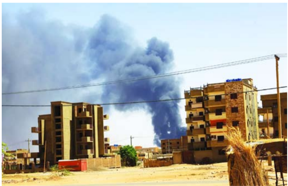
الاشتباكات بين الجيش السوداني و «الدعم السريع»

«قوات الدعم السريع». كما قال العطا: «ستقتل من الرئيس التشادي محمد إدريس ديبي، ونحذره من أن مطاري انجمينا وأم جرس هما أهداف مشروعة للقوات المسلحة السودانية»، كما هاجم أيضاً ما سماها «مراكز النفوذ الخربة في دولة جنوب السودان».