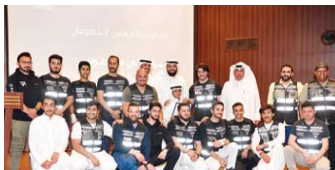
تكريم فريق أمير الإنسانية التطوعي