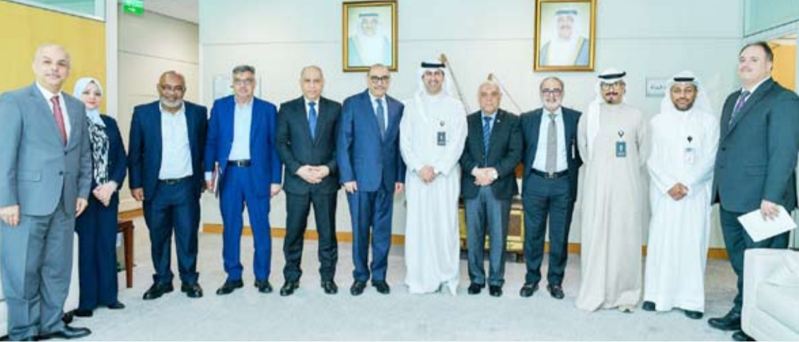
«النفط» تعقد اجتماعاً مشتركاً مع وفد من نظيرتها العراقية

أعلن بنك الكويت المركزي توفير أجهزة للسحب الآلي في عدد من المجمعات التجارية خلال فترة العيد تتضمن أوراقاً نقدية جديدة من فئات الدينار الكويتي وذلك نظراً لزيادة الطلب من قبل المواطنين على تلك الفئات لتوزيع العيادي. وقال «البنك المركزي» في بيان صحفي إن خدمة