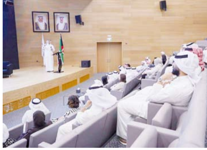
جانب من اجتماع اللجنة