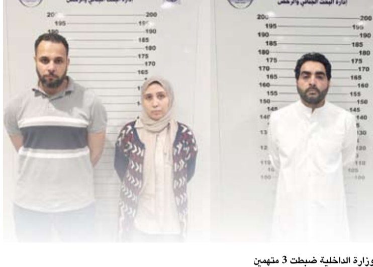
وزارة الداخلية ضبطت 3 متهمين

وأكدت (الداخلية) أنها لن تتهاون في ملاحقة كل من يخبت تورطه في قضايا الفساد والتلاعب بالأنظمة والقوانين مستندة على اتخاذ أقصى العقوبات القانونية بحق المتهمين وتقديهم للعدالة.