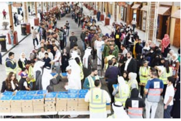
جانب من توزيع وجبات الإفطار

والعافية وعساها عادة لا تنقطع ونستمر بتقديم كل ما هو أفضل لخدمة مجتمعنا». ومن أبرز الفعاليات والمبادرات والأنشطة: إطلاق بنك برقان عدة فعاليات ومبادرات تحت مظلة حملة «علمهم صغار»، تهدف إلى غرس العديد من القيم والعادات والتقاليد في سن مبكرة سواء عند الأطفال وحتى عند الشباب. وتجسدت هذه القيم من خلال أنشطة وإعلانات تحمل رسائل ومفاهيم توعوية في العديد من المبادرات والمجالات منذ بداية العام.