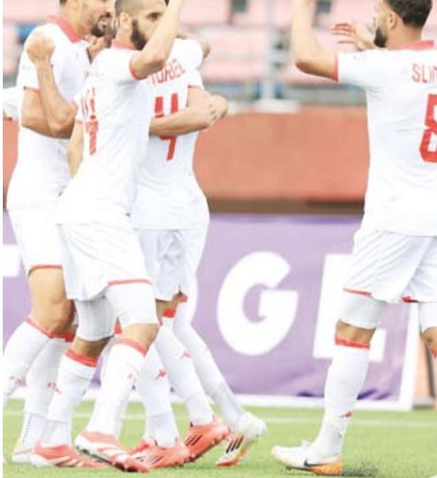
تونس تقترب من كأس العالم للمرة الثالثة على التوالي