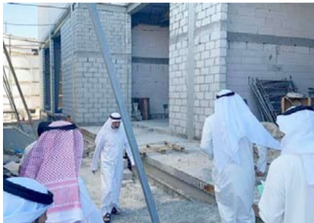
فريق البلدية يتفقد أماكن التشوين