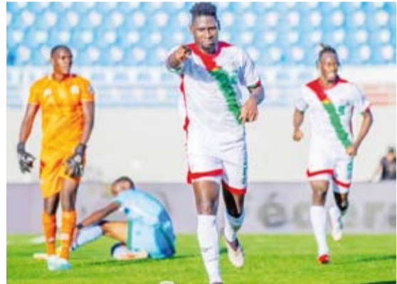
تصفيات المونديال في الأمتار الأخيرة