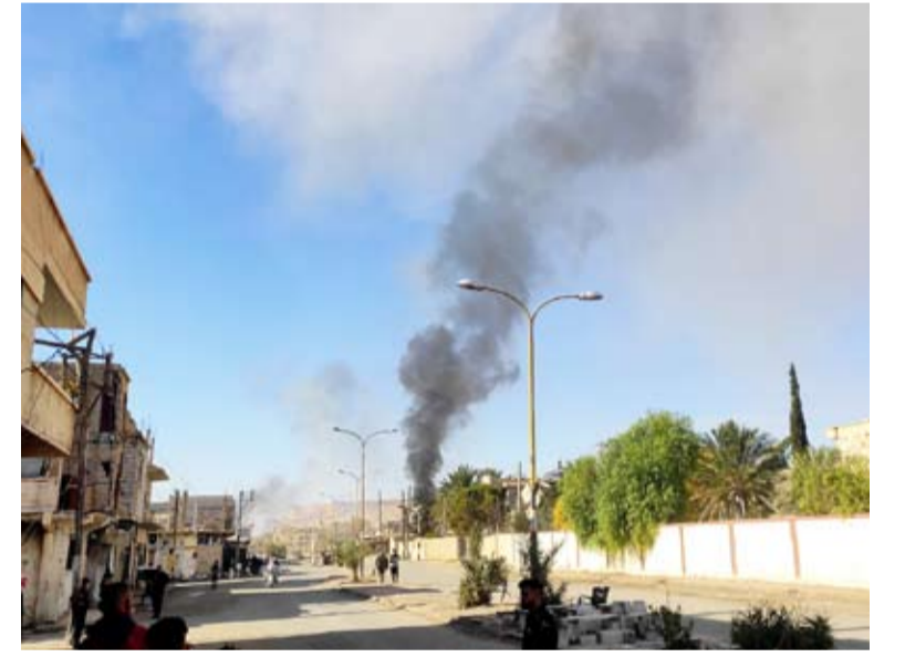
غارات جوية على قاعدتي تدمر و تي 4 في حمص

شن الاحتلال الإسرائيلي امس غارات جوية استهدفت قاعدتي تدمر و تي 4، في محافظة حمص، اللتين تحتويان على قدرات عسكرية، وأوضحت قوات الاحتلال أن