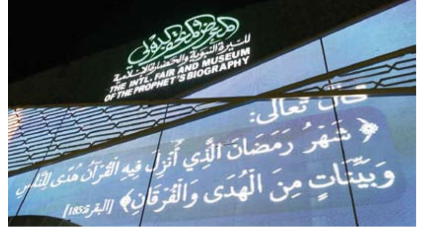
جانب من عرض المخطوطات

تطور الكتابة عبر العصور. ويمثل معرض عمارة المسجد النبوي الواقع في الجهة الجنوبية من ساحة المسجد النبوي نقلة نوعية في عرض تاريخ عمارة المسجد النبوي عبر مراحل زمنية مختلفة من خلال تقنيات حديثة. فيما تضم مكتبة المسجد النبوي الواقعة بالجهة الغربية من المسجد النبوي عدة أقسام،