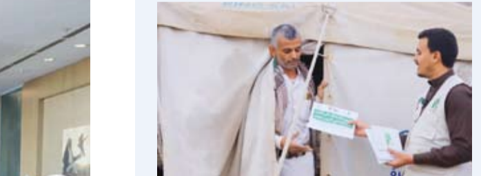
توزيع زكاة الفطر

أعلنت الهيئة الخيرية الإسلامية العالمية عن استقبال زكاة الفطر لهذا العام لتقدمها إلى الأسر الفقيرة والمتضررة في 12 دولة، تشمل فلسطين، اليمن، السودان، باكستان، الأردن، بوركينافاسو، أوزبكستان، أوغندا، نيجيريا، كازاخستان، والنيجر، حيث يستهدف المشروع مساعدة 19,537 مستفيداً من الأسر المتعففة، سعياً إلى إيصال الزكاة إلى مستحقيها في موعدها الشرعي، ووفق الضوابط الشرعية.