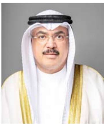
وزير التربية م. سيد جلال الطبطبائي