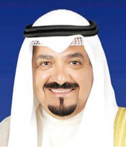
سمو الشيخ أحمد العبدالله

بعث سمو الشيخ أحمد العبدالله رئيس مجلس الوزراء، ببرقية تهنئة إلى الرئيس كونستانتينوس تاسولاس رئيس جمهورية اليونان الصديقة بمناسبة ذكرى الاستقلال لبلاده.