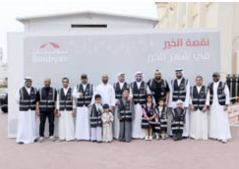
فريق بوبيان التطوعي خلال توزيع وجبات الإفطار

وفي هذا السياق، قال نائب المدير العام لقطاع التدقيق الشرعي الداخلي في بنك بوبيان، الشيخ فواز الكليب أن مبادرة «إفطار صائم» تمثل امتداداً لجهود فريق عمل نقصة بوبيان، حيث يتم توزيع الـ 700 التي تم إعدادهم يومياً على المحتاجين طوال الشهر الفضيل، موضحاً أن هذا التكامل بين المبادرتين يعزز من أثرهما المجتمعي، ويجسد رسالة بوبيان في دعم المجتمع وتعزيز الاستدامة المجتمعية.