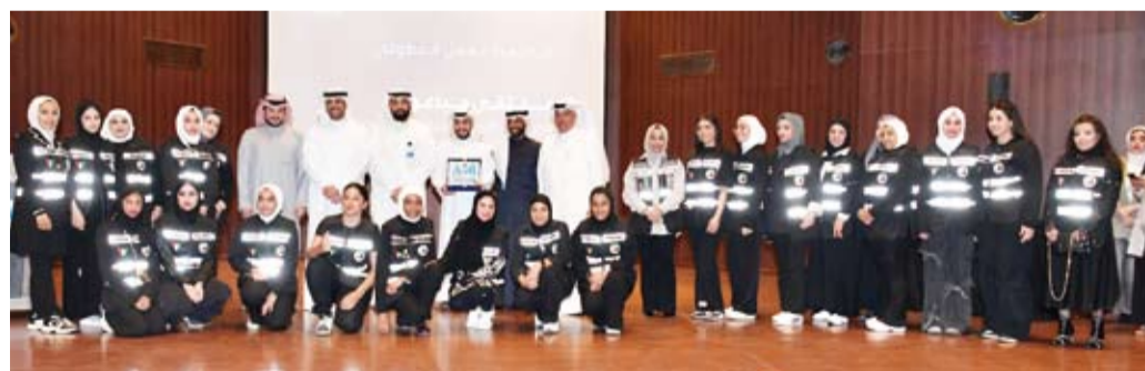
تكريم فريق الاستجابة والإنقاذ

وأشار إلى أن مشروع مستشفى الكويت الصحي بمنطقة