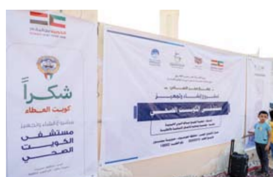
تدشين بناء مستشفى ومستوصف بتمويل كويتي

وأوضح أن هذين المشروعين الحيويين سيسهمان في تعزيز بنية القطاع الصحي في مديرية (سيئون) مركز وادي وصحراء (حضرموت) من خلال تقديم خدماتهما لأكثر من 25000 نسمة.