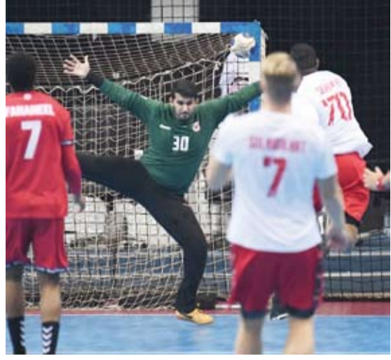
مناسات قوية في بطولة اليد