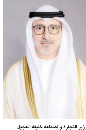
وزير التجارة والصناعة خليفة العجيل

أصدر وزير التجارة والصناعة، خليفة العجيل، أول أمس، عدة إجراءات داخلية للتعامل مع شبهة السحوبات ضماناً لاتخاذ كل ما من شأنه تعزيز ثقة الرأي العام في إجراءات وأعمال وزارة التجارة والصناعة.