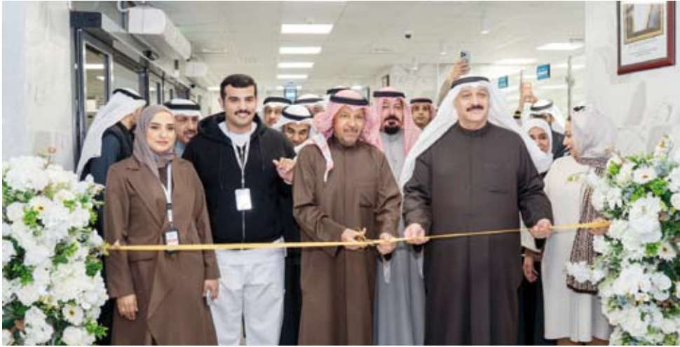
وزير الصحة ومحافظ الغروانية يفتتحان المركز امس

الأمراض السرطانية واضطرابات الجهاز الهضمي العلوي. وأوضح أن الهدف من هذا التطور العلمي والتقني الارتقاء بجودة حياة المريض إذ تسعى الوزارة إلى تقديم رعاية صحية دقيقة وأمنة وسريعة التعافي تركز على أفضل الممارسات العالية وأحدث الابتكارات الطبية.