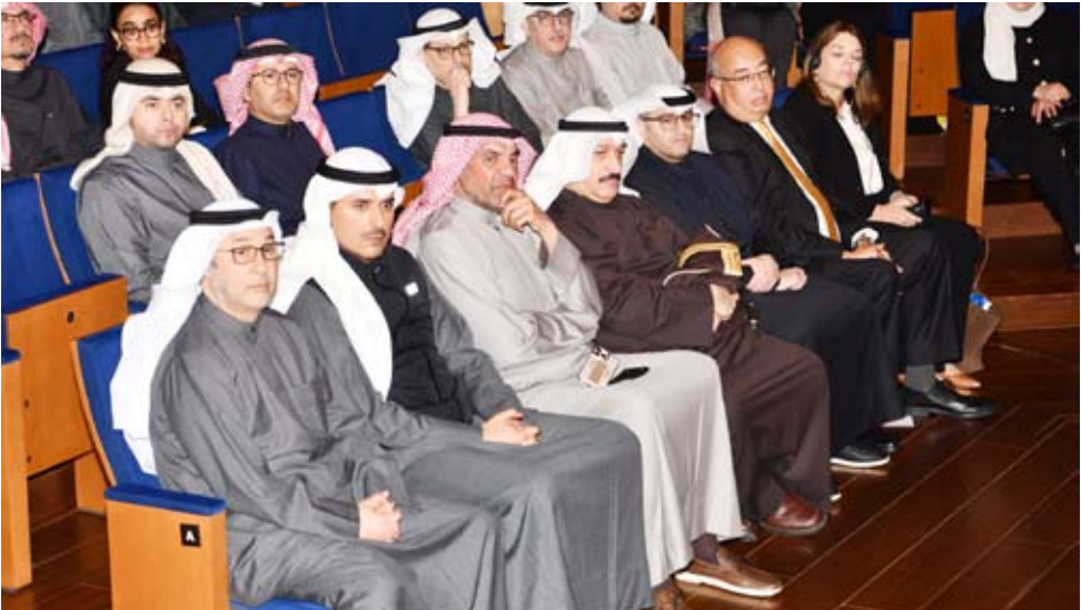
وزراء الصحة والخارجية والإسكان ومحافظ الأحمدى يتقدمون الحضور

أطلق المجلس الوطني للثقافة والفنون والآداب أمس الرؤية الاستراتيجية لمدينة الأحمدى التاريخية ضمن مشروع التراث والهوية من أجل التنمية المستدامة في الأحمدى وذلك بالتعاون مع منظمة الأمم المتحدة للتربية والعلم والثقافة «اليونسكو» وبرنامج الأمم المتحدة الإنمائي بحضور عدد من الوزراء والمسؤولين والمختصين والمهتمين بالتراث.