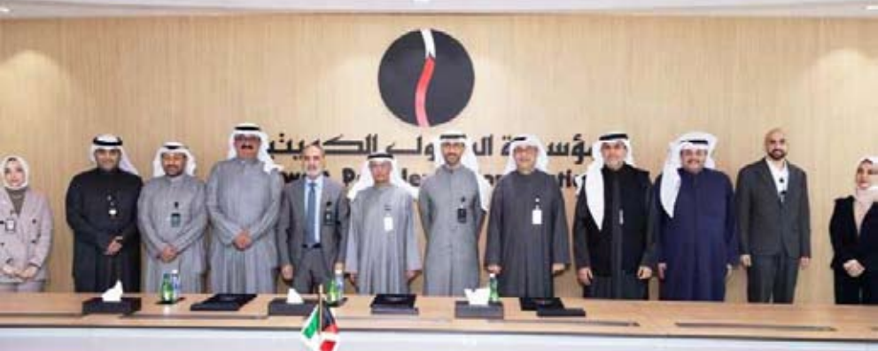
قيادات الكهرباء والبترول الكويتية

الكهرباء والماء والطاقة المتجددة وكيل الوزارة د. عادل محمد الزامل. وتعليقاً على توقيع مذكرة التفاهم، صرح الرئيس التنفيذي لمؤسسة البترول الكويتية الشيخ نواف سعود الصباح قائلاً: «يمثل هذا المشروع خطوة مهمة نحو بناء منظومة طاقة أكثر تكاملاً وكفاءة في دولة الكويت، فإن تعاوننا اليوم مع وزارة الكهرباء والماء والطاقة المتجددة يعكس التزامنا الراسخ بتوفير حلول مستدامة تدعم عملياتنا النفطية وتلبي في الوقت ذاته احتياجات البلاد المستقبلية من الطاقة الكهربائية، وتنتقل إلى أن يسهم هذا المشروع الحيوي في المزيد من التعاون مستقبلاً لتعزيز أمن الطاقة ورفع كفاءة الإنتاج وتحقيق قيمة مضافة للاقتصاد الوطني.»