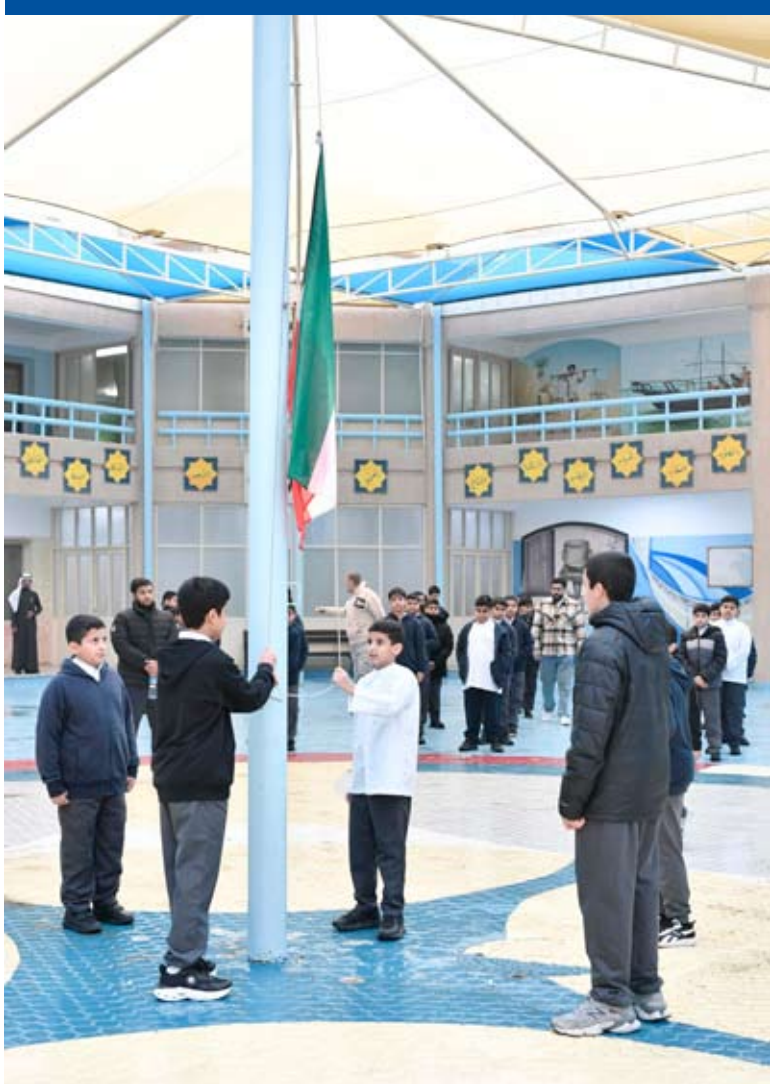
اليوم الأول لانطلاق الفصل الدراسي الثاني

مع شروق صباح أمس عادت المدارس في مختلف مناطق البلاد لتستقبل طلبتها بعد فترة إجازة منتصف العام الدراسي معلنة انطلاق الفصل الدراسي الثاني للعام (2025-2026) في التعليم العام والديني والترفيهية الخاصة وفق التقويم التعليمي المعتمد رسمياً في أجواء تنسم بالحيوية والنشاط.