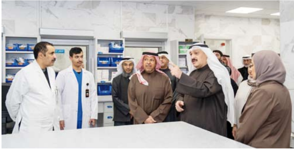
جانب من الجولة بالمركز