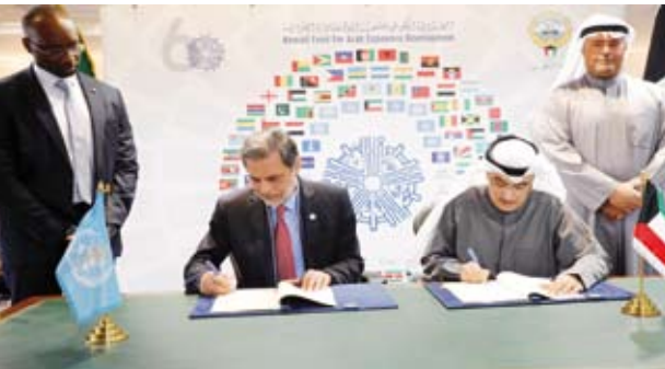
جانب من توقيع الاتفاقية