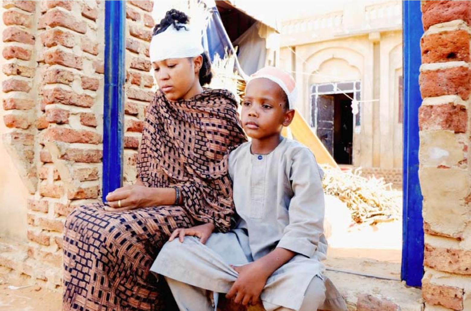
سودانيون أصيبوا جراء هجوم بطائرة مسيرة

يأتي ذلك فيما نقلت صحيفة «المشهد» السودانية عن مصادر ميدانية قولها إن «وحدات الدفاعات الأرضية التابعة للجيش السوداني تمكنت من اعتراض وإسقاط طائرة مسيرة انتحارية كانت في طريقها لاستهداف مدينة الدلنج بولاية جنوب كردفان، في محاولة جديدة لتهديد المناطق السكنية».