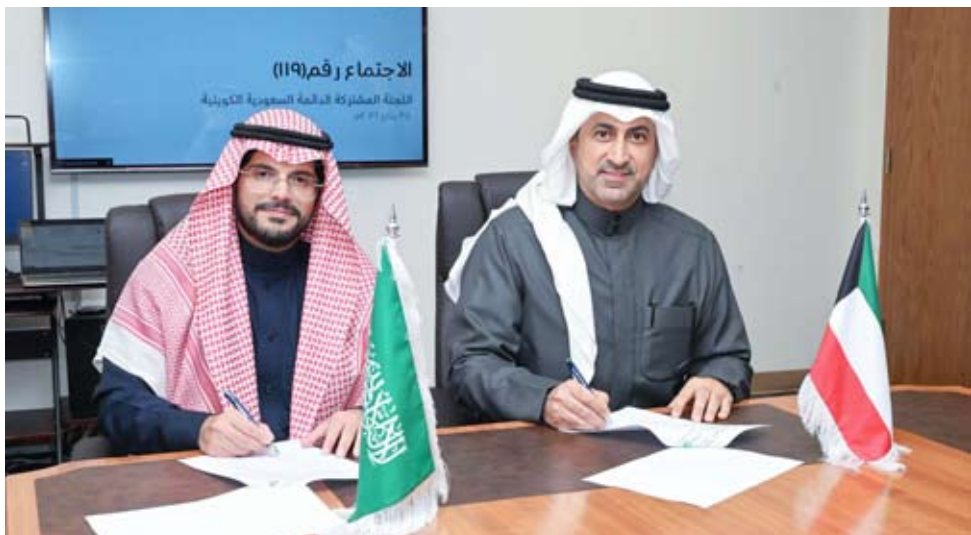
جانب من توقيع الاتفاقية

بين وزارة النفط بدولة الكويت ووزارة الطاقة في المملكة العربية السعودية، وما يقدمه الجانبان من تسهيلات ملموسة لتيسير الأعمال البترولية في عمليات الوفرة والخفجي المشتركة، وضمان سلامة العاملين في الشركات العاملة، والتي تضم الشركة الكويتية لنفط الخليج وشركة أرامكو لأعمال الخليج، وشركة شيفرون العربية السعودية