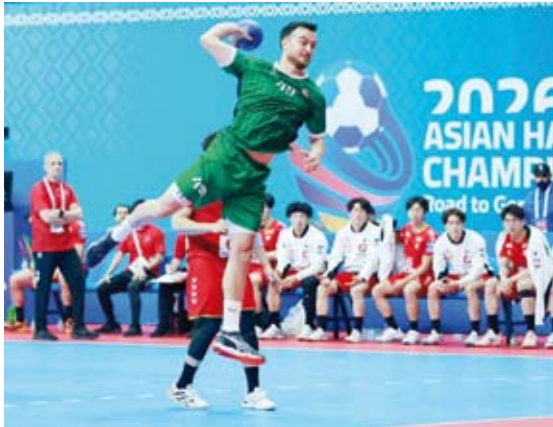
فوز مثير لليابان على العراق

فاز منتخب اليابان لكرة اليد على نظيره العراقي بنتيجة (30 - 29) ضمن مواجهات المجموعة الأولى بالدور الرئيسي لمنافسات كأس آسيا الـ22 في الكويت والمؤهلة لكأس العالم (ألمانيا 2027) وتنتصر حتى 29 يناير الحالي.