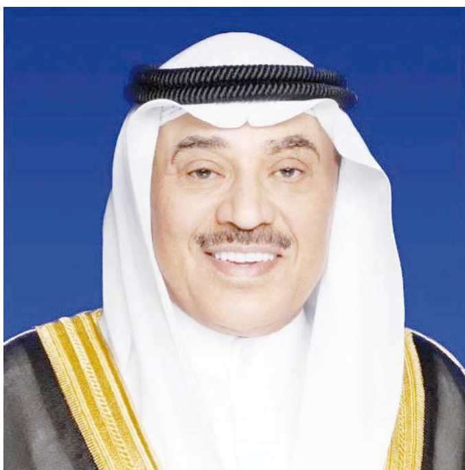
سمو ولي العهد الشيخ صباح الخالد