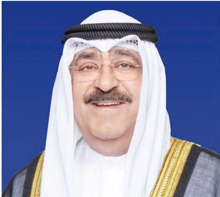
سمو أمير البلاد الشيخ مشعل الأحمد