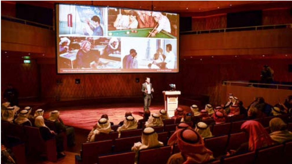
جانب من الفعالية