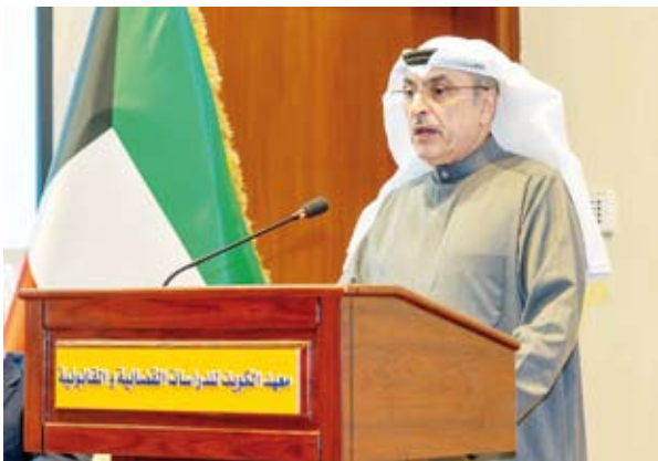
المستشار بدر المسعد

بتكامل مع أهداف (رؤية الكويت الاقتصادية 2035) دون الإخلال برسالته الأساسية في تقديم العون الإنمائي للدول العربية والنامية الأخرى. وأعرب البحر عن تقديره للدور المحوري الذي يضطلع به معهد الكويت للدراسات القضائية والقانونية في تطوير منظومة العدالة بدولة الكويت عبر الارتقاء بمستويات التدريب والتأهيل للمكوادر القضائية والقانونية وتعزيز الوعي القانوني بما يساهم في ترسيخ دعائم العدالة وسيادة القانون.