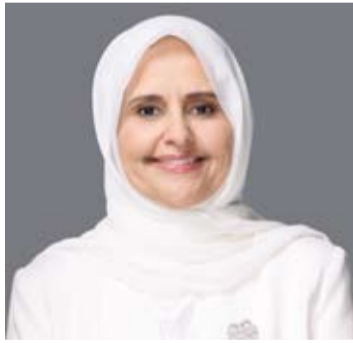
د. ريم الفليح

أعلى معايير الشفافية والرقابة المؤسسية وأنها لن تتهاون في أي ممارسات تمس النزاهة الوظيفية أو تخل بواجباتها إذ سيتم إحالة البلاغات إلى الجهات القضائية المختصة وفق الأطر والإجراءات المعتادة. وذكرت أن الوزارة مستمرة في مراجعة ومتابعة الملفات التي ترد بشأنها ملاحظات أو شبهات انطلاقاً من التزامها بتعزيز الحوكمة الرشيدة ودعم جهود الإصلاح المؤسسي وترسيخ الثقة في الأداء الحكومي بما يحقق المصلحة العامة ويحافظ على مقدرات الدولة ومواردها.