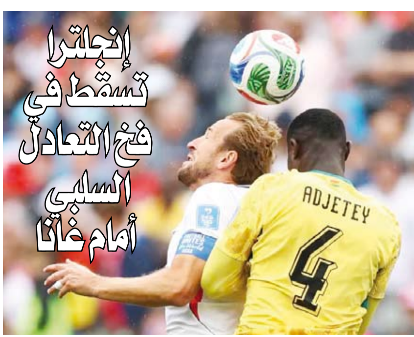
أداء قوي لمنتخب غانا أمام إنجلترا

نتيجة إيجابية ضد أوزبكستان، للحفاظ على آمالها في التأهل. وسيطرت كولومبيا على الكرة، وصنعت الفرص الأفضل طوال المباراة، لكن حارس المرمرى، ليونيل مباسي، أحبط محاولاتها، وقام بسلسلة التصديقات لإيقاف محاولات خاميس رودريغيز ولويس ديباز وجون أرياس. وجاء الهدف الأول أخيراً في الدقيقة 76، عندما وصلت تمريرة خوان فرناندو كينتيرو إلى مونوز الذي انطلق داخل منطقة الجزاء، وأطلق المدافع تسديدة منخفضة غيرت اتجاهها واستقرت في شبك مباسي.