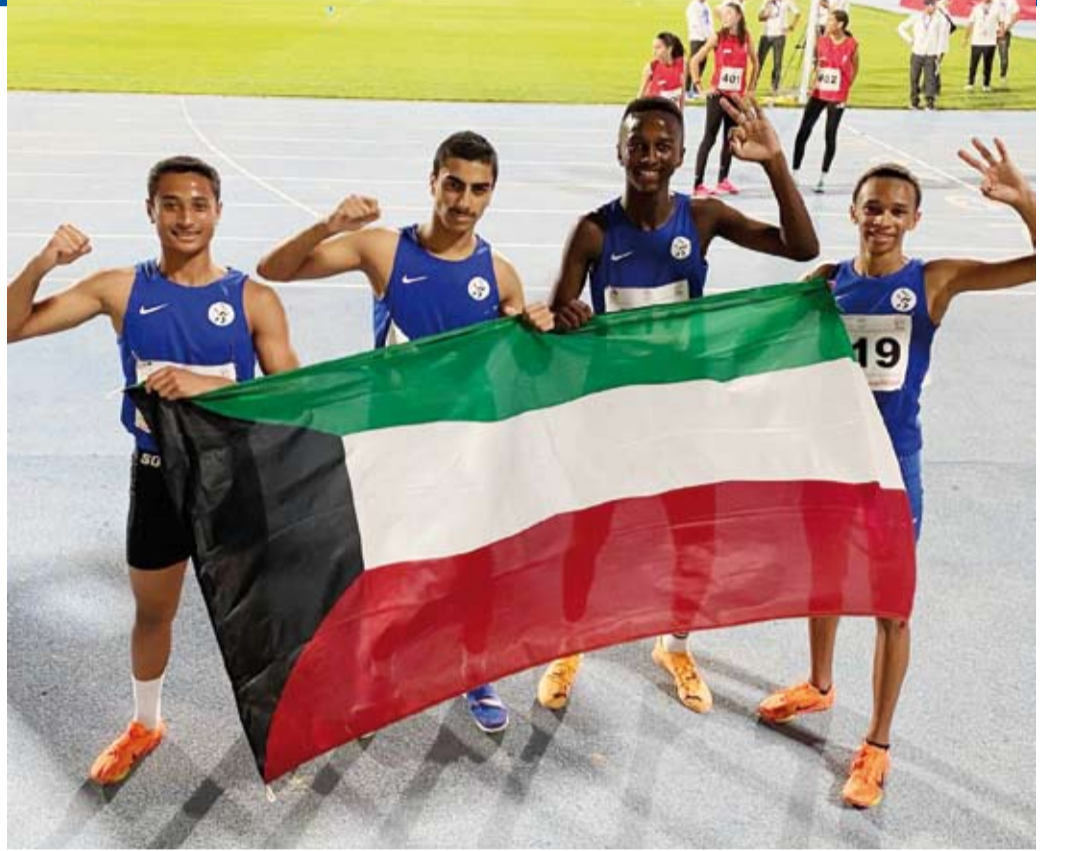
فريق المتابع الفانز بالميدالية البرونزية

حقق لاعبو منتخب الكويت للعبة القوى 5 ميداليات متنوعة بمناسبات البطولة العربية تحت 16 سنة وتحت 23 سنة والتي تستضيفها مصر على استاد هيئة قناة السويس بمدينة الإسماعيلية بمشاركة 14 دولة عربية