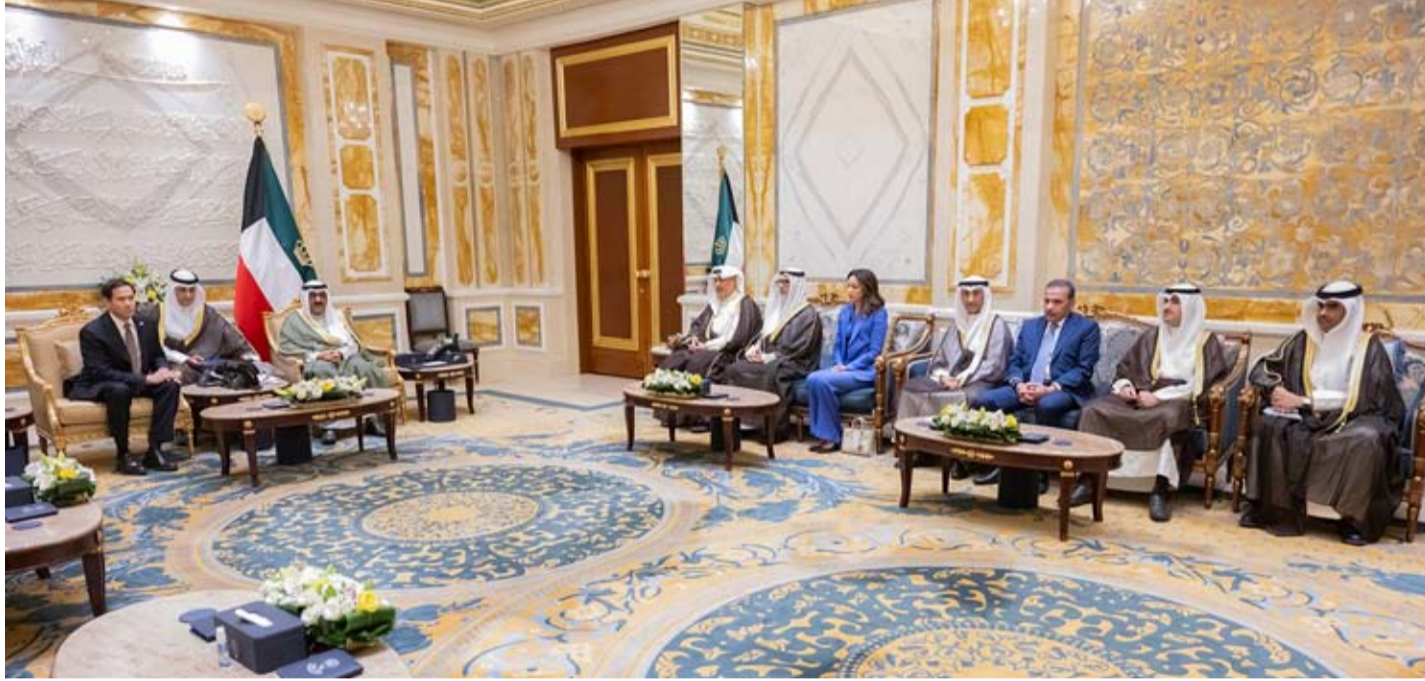
جانب من الحضور خلال اللقاء