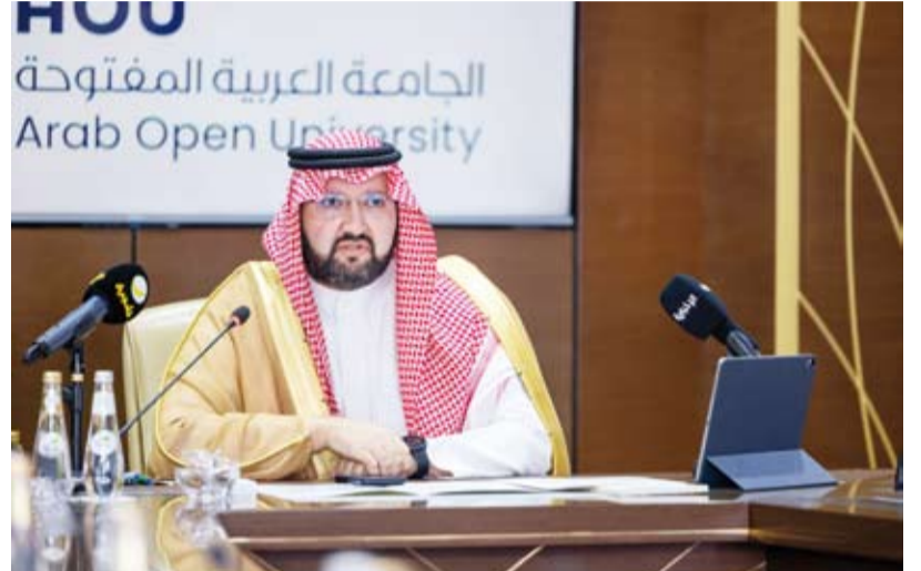
الأمير عبدالعزيز محدثاً

وأضاف أن الحرم الجامعي في المغرب سيكون مفتوحاً للجميع برسوم دراسية في متناول مختلف شرائح المجتمع، معرباً عن متلعه إلى أن يصبح مركزاً تعليمياً يخدم المتعلمين في منطقة الساحل الإفريقي مستفيداً من الموقع الاستراتيجي للمغرب وما يتمتع به من امتداد حضاري وعلمي في القارة الإفريقية. ودعا الطلبة في المغرب إلى اغتنام هذه الفرصة والانضمام إلى الجامعة، إذ صممت برامجها الأكاديمية المعتمدة محلياً ودولياً لتزويدهم بالمعارف والمهارات التي يحتاجونها وليكونوا جزءاً من مجتمع الجامعة الذي يضم حالياً أكثر من 90 ألف طالب وطالبة، فيما تجاوز عدد المنتسبين إليها منذ انطلاق أعمالها عام 2002 أكثر من 400 ألف منتسب.