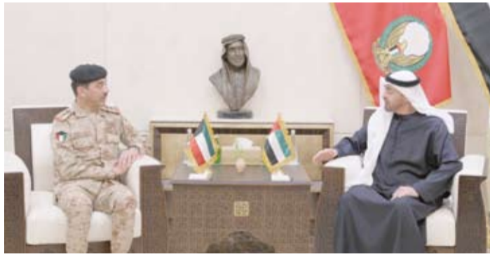
الشيخ محمد بن زايد مستقبلاً الفريق الركن خالد الشريعان

خلال استقبال الفريق المزورعي للفريق المنطقة. من جهة أخرى، بحث رئيس الأركان العامة للجيش الكويتي الفريق الركن خالد الشريعان مع رئيس أركان القوات المسلحة الإماراتية الفريق الركن عيسى سيف بن عبلان المزورعي، سبل تعزيز التعاون العسكري المشترك بين البلدين الشقيقين. وذكرت وزارة الدفاع الإماراتية في بيان على منصة (اكس)، أن ذلك جاء