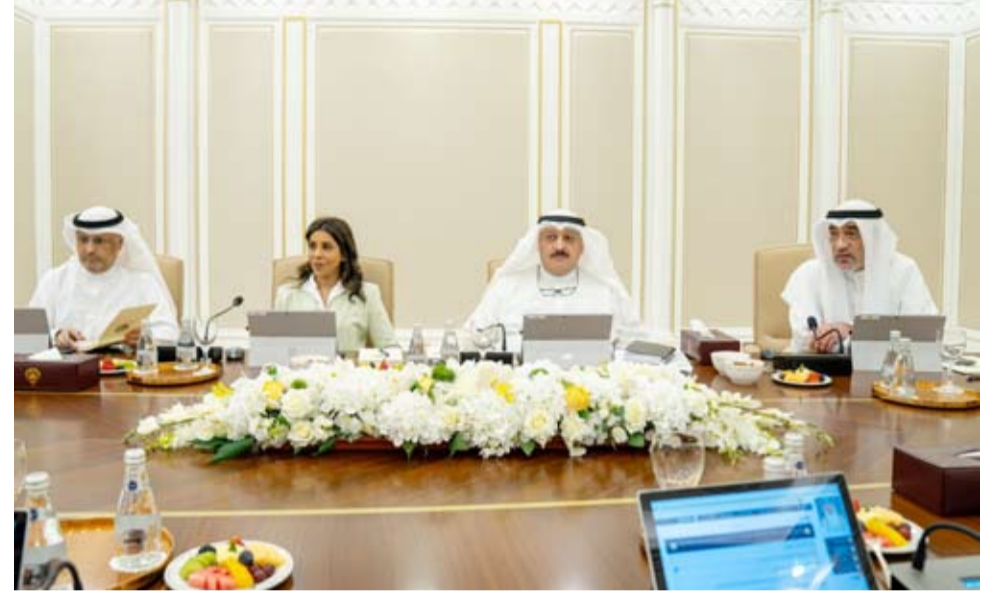
الشيخ فهد اليوسف يترأس اجتماع مجلس الوزراء

أجرها وتلقاها خلال الأيام الماضية مع عدد من وزراء الخارجية في الدول الشقيقة والصديقة حيث تم خلال الاتصالات استعراض العلاقات الأخوية المتينة التي تربط دولة الكويت بتلك الدول الشقيقة والصديقة وسبل تعزيزها في مختلف المجالات وبحث تطورات الأحداث الراهنة في المنطقة والجهود المبذولة بشأنها إضافة إلى الاتصال الهاتفي الذي تلقاه معاليه من المفوض السامي للأمم المتحدة لشؤون اللاجئين برهم صالح، حيث جرى خلال الاتصال بحث العلاقات الوثيقة التي تربط دولة الكويت بالمفوضية السامية للأمم المتحدة لشؤون اللاجئين وسبل تعزيزها وتطويرها.