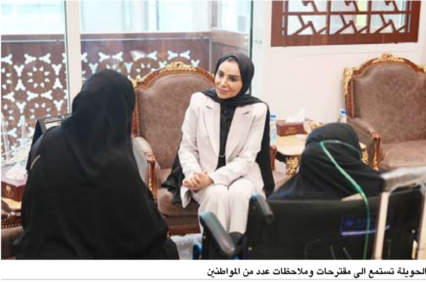
الحويلة تستمع الى مقترحات وملاحظات عدد من المواطنين

الذي يرسخ مبادئ الشفافية والتواصل الفعال مع مختلف شرائح المجتمع.