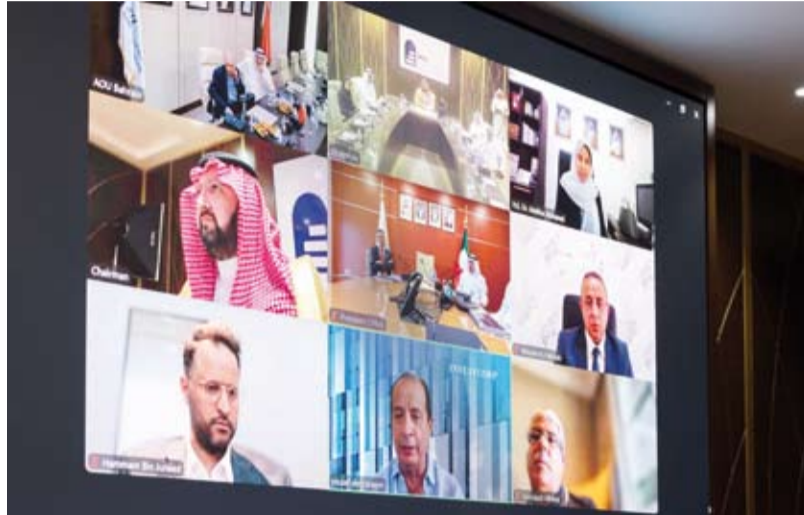
جانب من اجتماع مجلس أمناء الجامعة عبر الاتصال المرئي