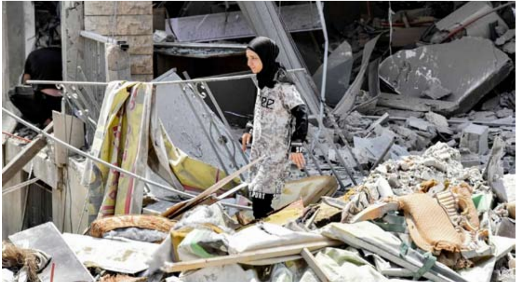
سيدة وسط منازل مدمرة في بلدة النبطية الفوقا جنوب لبنان

أي خطة لن تظهر إلا بعد اليوم الأخير من المحادثات اليوم الخميس. ولم يرد المسؤول على طلب التعليق على ما ذكره المسؤولون الإسرائيليون بشأن التدقيق الأميركي للقوات اللبنانية.