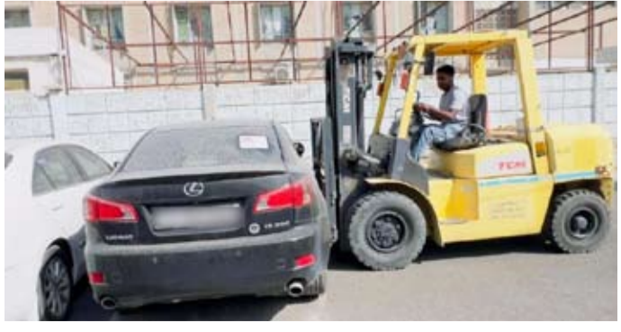
رفع سيارات مخالفة

العامه واشغالات الطرق، مبيناً في هذا الخصوص عدم تهاون الفريق الرقابي في اتخاذ كافة الإجراءات القانونية حيال المخالفين لللائحة النظافة العامة واشغالات الطرق