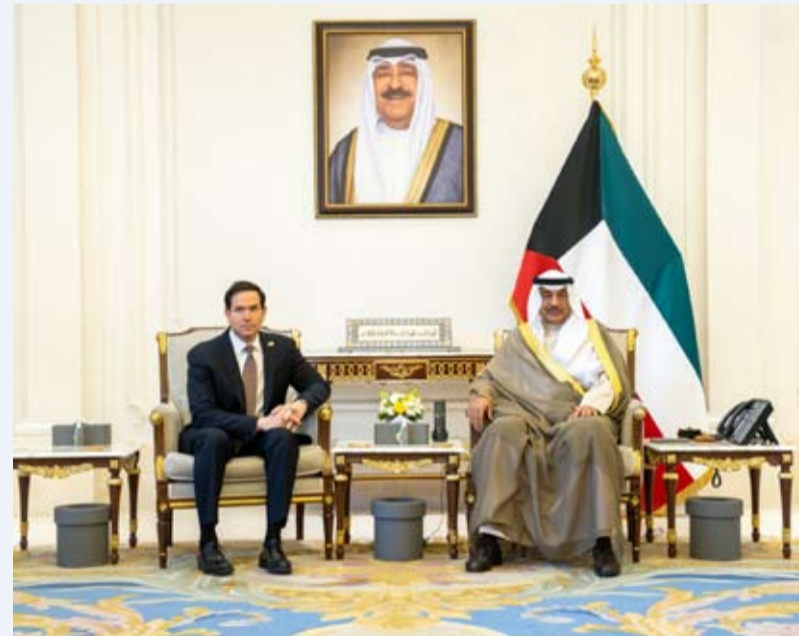
سمو ولي العهد مستقبلاً وزير الخارجية الأميركي

استقبال سمو ولي العهد الشيخ صباح خالد أمير وزير الخارجية بالولايات المتحدة الأمريكية ماركو روبيو والوفد الرسمي المرافق وذلك بمناسبة زيارته للبلاد. وتم خلال اللقاء استعراض العلاقات التاريخية الراسخة التي تجمع البلدين والشعبين الصديقين بالإضافة إلى بحث آخر المستجدات في منطقة الشرق الأوسط والتأكيد على دعم كافة الجهود للحفاظ على أمن واستقرار المنطقة. حضر اللقاء الشيخ ثامر جابر الأحمد الصباح رئيس ديوان سمو ولي العهد والشيخ جراح جابر الأحمد الصباح وزير الخارجية و الشيخة الزين صباح الناصر الصباح سفيرة دولة الكويت لدى الولايات المتحدة الأمريكية وكبار المسؤولين