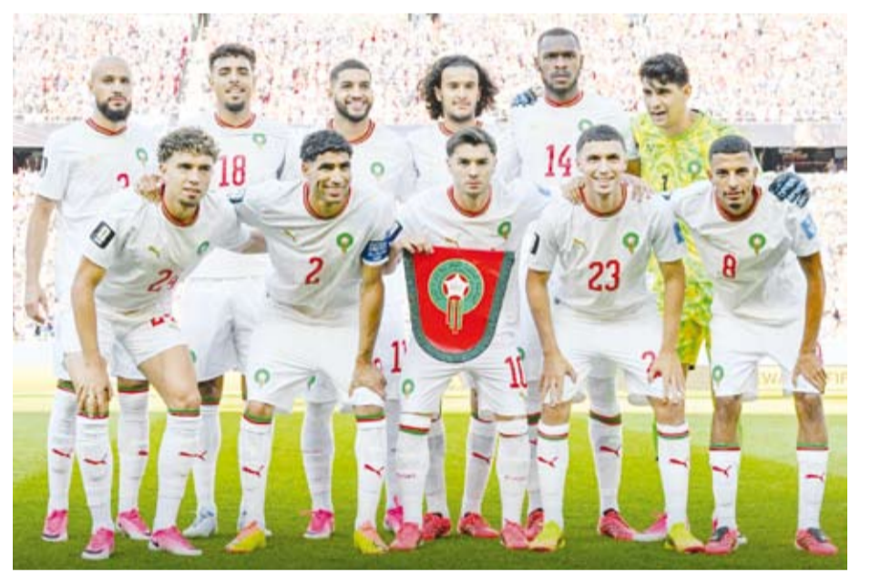
أسود الأطلس في مواجهة سهلة أمام هايتي

يخوض المنتخب المغربي مواجهة مهمة أمام نظيره الهائتي على ملعب أتلانتا ضمن الجولة الثالثة والأخيرة من منافسات المجموعة الثالثة في نهائيات كأس العالم 2026 المقامة حالياً بالولايات المتحدة وكندا والمكسيك، وأضعا نصب عينيه حسم بطاقة التأهل إلى الأدوار الإقصائية ومواصلة نتائجه الإيجابية في البطولة. ويدخل المنتخب المغربي اللقاء بأفضلية واضحة بعد حصده أربع نقاط من أول جولتين، يتعادله مع البرازيل والفوز على اسكتلندا، ما يجعله في وضع مريح نسبياً قبل مواجهة هايتي. وعلى الجانب الآخر، ودع منتخب هايتي المنافسات رسمياً بعد تلقيه خسارتين متتاليتين أمام البرازيل واسكتلندا في الجولتين الأولى والثانية، ليتحول لقاء المغرب إلى فرصة لإنهاء مشاركته بصورة إيجابية في أول ظهور له بالمونديال منذ أكثر من خمسة عقود. وفي مباراة أخرى ضمن المجموعة ذاتها، يلتقي المنتخب البرازيلي مع نظيره الاسكتلندي على ملعب ميامي، في مواجهة لا تقل أهمية عن المباراة الأخرى بالمجموعة. ويدخل المنتخب البرازيلي اللقاء وهو في وضع مريح نسبياً بعد جمعه أربع نقاط من فوز على هايتي وتعادل مع المغرب، إذ يكفيه الفوز أو التعادل لضمان التأهل إلى الدور المقبل.