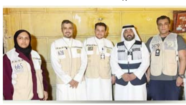
فريق هيئة الغذاء

ولفتت إلى أنه تم باتخاذ الإجراءات القانونية اللازمة ضد المخالفين وإحالة المخالفات إلى الجهات المختصة لاستكمال الإجراءات المقررة وفقاً للأنظمة واللوائح.