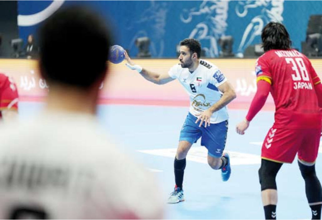
خسارة مثيرة للأزرق أمام نظيره الياباني