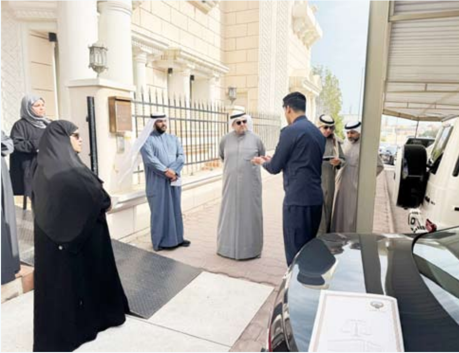
المستشار ناصر السميح يتفقد مركز رؤية الزهراء

أكد وزير العدل المستشار ناصر السميح أمس أن مصلحة الطفل وراحتته النفسية تمثل المرتكز الأساسي للتطوير المرتقب في مراكز رؤية المحضونين. وذكرت وزارة العدل في بيان صحفي أن ذلك جاء خلال زيارة ميدانية للمستشار السميح إلى مركز رؤية المحضونين بمنطقة الزهراء برفاقه وكيل وزارة العدل بالتكليف عواطف السند ومجموعة من قياديي الوزارة للاطلاع على سير العمل والوقوف على احتياجات المراجعين والموظفين. وأضافت الوزارة أن «الزيارة تأتي في إطار المتابعة المباشرة وتحسين جودة الخدمات المقدمة بما يراعي خصوصية الأطفال والأسر».