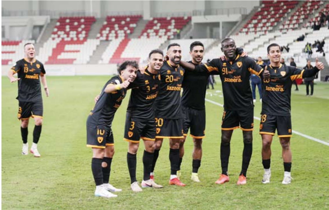
فرحة لاعبي القادسية بالتسجيل