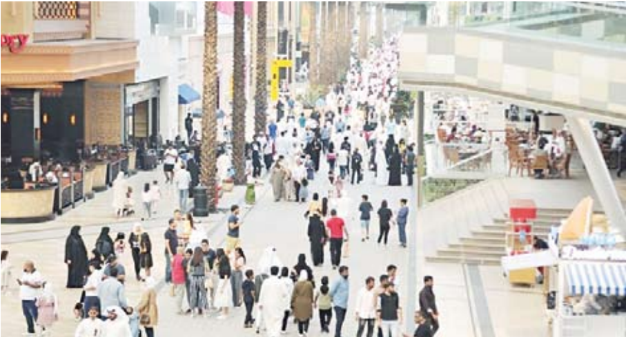
تسارع النمو في المنطقة مقارنة بالمعدل العالمي

◆ نسبة الذكور بلغت 62.7 في المئة مقابل 37.3 في المئة للإناث