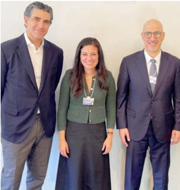
خليفة العجيل مع تشارلز حاتي و جود عبد المجيد

استعرض وزير التجارة والصناعة خليفة العجيل أمس السبت في (دافوس) السويسرية مع كبرى شركات الاستثمار وإدارة الأصول العالمية جاذبية السوق الكويتي للمستثمر الأجنبي وتطورات البيئة الاقتصادية في دولة الكويت وفرص الاستثمار المتاحة.