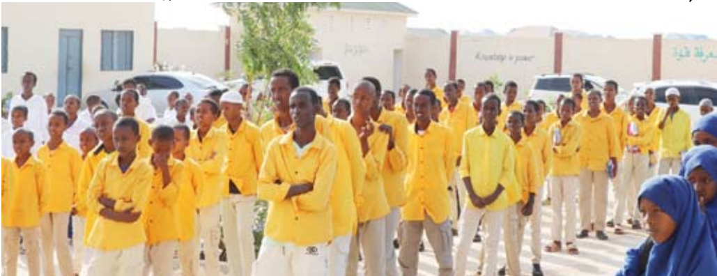
نماء ساهمت في دعم 4709 طلاب علم بالمرحلة الجامعية