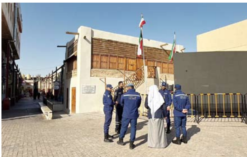
جانب من الجولة

واتت هذه الجولات بالتعاون مع المجلس الوطني للثقافة والفنون والآداب وتفعيل بنود بروتوكول التعاون المشترك بين الجهتين حيث تهدف هذه الجولات إلى اتخاذ الإجراءات الوقائية والتأكد من مطابقة اشتراطات السلامة والوقاية من الحريق.