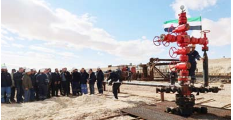
بدء استخراج النفط من حقول سيطرت عليها الحكومة في الآونة الأخيرة