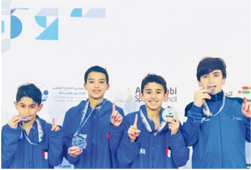
أشبال منتخب الكويت

على تقديم أفضل ما لديهم لافتنا إلى أن الأرقام المحققة تؤكد نجاح البرامج الفنية المعتمدة.