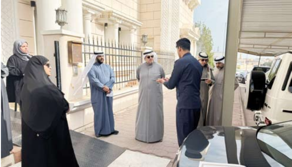
جانب من الجولة