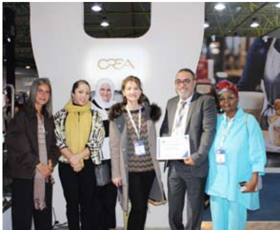
تكرم على هامش الزيارة