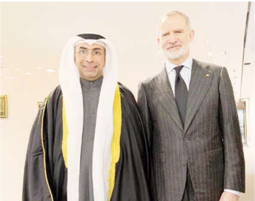
الدكتور ناصر محيسن وملك إسبانيا فيليببي السادس

الدولي ونياية عن وزير الإعلام والثقافة ووزير الدولة لشؤون الشباب عبدالرحمن المطيري. وأضاف البيان أن اللقاء مع الملك فيليببي السادس الذي جرى بحضور سفير دولة الكويت لدى مملكة إسبانيا زياد الأنبيعي يعكس عمق ومنانة العلاقات الثنائية ويؤكد حرص قيادتي البلدين الصديقين على توسيع مجالات التعاون المشترك لا سيما في القطاعات الإعلامية والسياحية والثقافية.