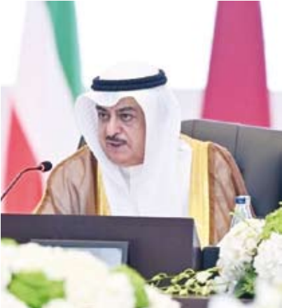
المستشار سعد الصفران

أصدر النائب العام المستشار سعد الصفران توجيهات فورية بتشكيل فريق تحقيق مختص بناية العاصمة لتولي فحص البلاغ المتعلق بمشروع المنطقة الحرفية الخدمية «غرب أبوفطيرة» ومباشرة إجراءات التحقيق على نحو يكفل الإحاطة الكاملة بجوانب القضية الفنية والقانونية. وذكرت النيابة العامة في بيان لها أنها تبشر تحقيقات موسعة تتعلق بالمشروع على ضوء البلاغ الوارد إليها بتاريخ 9 ديسمبر الماضي "بشأن ما شاب التعاقد على المشروع وتنفيذه من شبهات جسيمة تمس سلامة التصرف في الملكية العقارية للدولة والأضرار بالمال العام". وأشارت إلى اتخاذ حزمة من الإجراءات التحفظية العاجلة تمثلت في إصدار أوامر منع التصرف على جميع القسائم محل المشروع والحفظ على أموال المرتبطة بالأشخاص محل الاتهامات. وأضافت أنه صدر عدد من أوامر منع السفر بحق بعض الأشخاص المرتبطين بالقضية فضلاً عن صدور أوامر قبض دولية وذلك في إطار الإجراءات القانونية المقررة لضمان سلامة سير التحقيقات وعدم العبث بالأدلة أو الأموال محل الواقعة. وبينت أن نطاق التحقيق يشمل شبهات تتعلق بجرائم الإضرار الجسيم بالمال العام وتسهيل الاستيلاء على الملكية العقارية للدولة والنزوير في المحررات الرسمية والكسب غير المشروع وغسل الأموال إلى جانب شبهات تتصل بمصدى الالتزام بالأطر المعتدلة للخطة الإنمائية ونظام البديل المقرر للاستثمار.