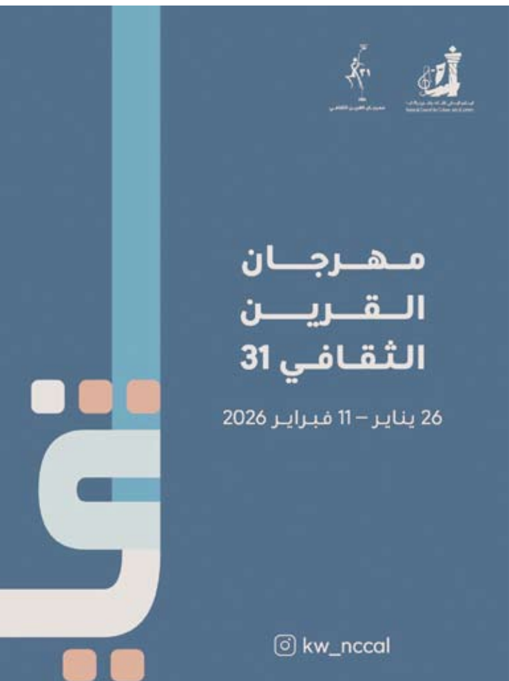
المهرجان يستمر حتى 11 فبراير المقبل