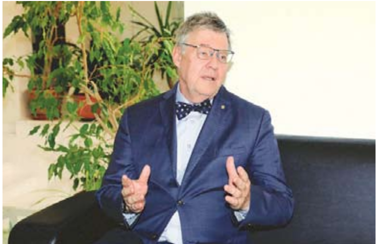
سفير جمهورية التشيك يوراي خميل

♦ نتطلع إلى التعاون والشراكة في مختلف القطاعات وهناك مشاورات لإعادة تفعيل اعتماد الشهادات الجامعية