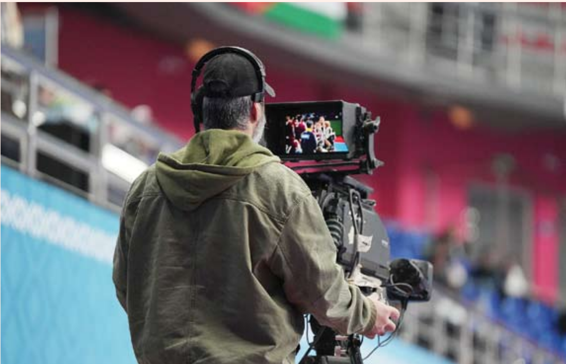
كاميرات القنوات التلفزيونية لنقل الحدث الآسيوي