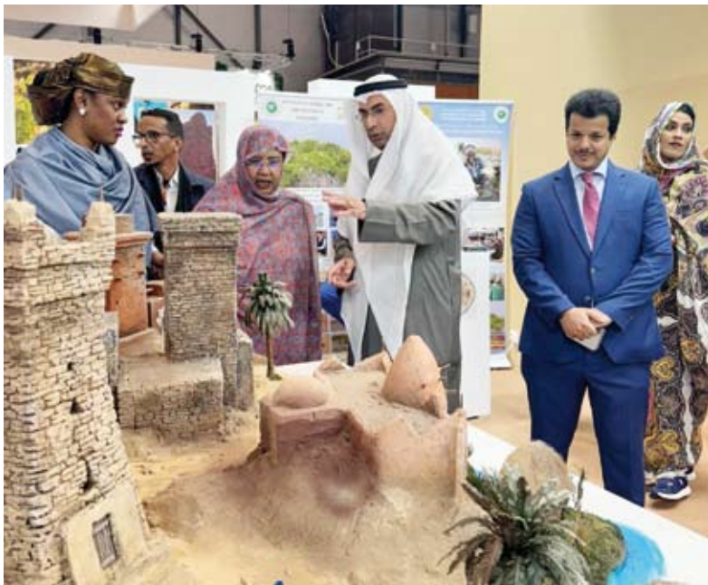
جولة داخل المعرض

هذا الاضطراب جاء في أعقاب تصريحات ترامب بأن أميركا نشرت أصولا بحرية في الشرق الأوسط تضم حاملة طائرات وعددًا من المدمرات ، ووصول قائد القيادة المركزية الأميركية ”سنتكوم“ إلى الكيان المحتل عقب زيارة رئيس الموساد إلى واشنطن ، مما جدد المخاوف من احتمالية تنفيذ تهديداته بمهاجمة إيران.... والله يستر