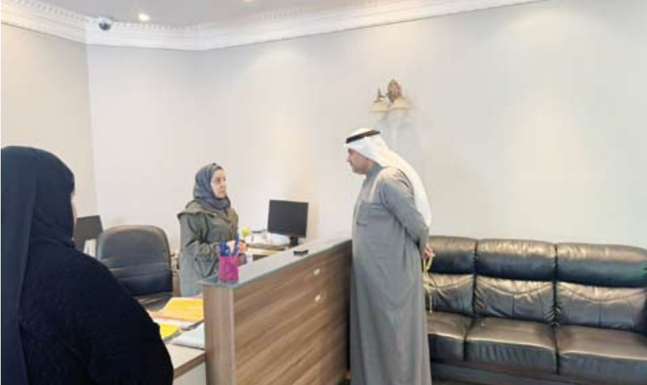
المستشار ناصر السميح خلال الزيارة الميدانية لمركز الزهراء

أكد وزير العدل المستشار ناصر السميح أمس أن مصلحة الطفل وراحته النفسية تمثل المرتكز الأساسي للتطوير المرتقب في مراكز رؤية المحضونين. وذكرت وزارة العدل في بيان صحفي أن ذلك جاء خلال زيارة ميدانية للمستشار السميح إلى مركز رؤية المحضونين بمنطقة الزهراء برفاقه وكيل وزارة العدل بالتكليف عواطف السند ومجموعة من قباذي الوزارة للاطلاع على سير العمل والوقوف على احتياجات المراجعين والموظفين. وأضافت الوزارة أن "الزيارة تأتي في إطار المتابعة المباشرة وتحسين جودة الخدمات المقدمة بما يراعي خصوصية الأطفال والأسر". وأوضحت أن الزيارة تأتي ضمن جهود الوزارة لتطوير البنيات ونموذج عمل مراكز الرؤية بما يساهم في توفير بيئة أكثر أماناً وملاءمة للأطفال وتحسين تجربة الأسر المستفيدة من خدماتها.