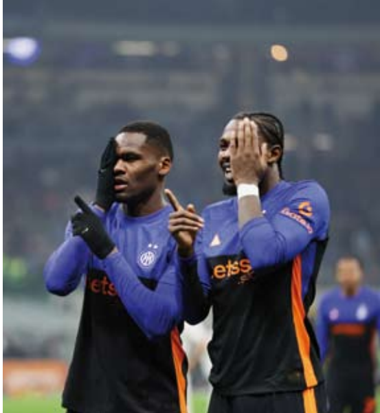
احتفالية لاعبي إنتر بالتسجيل

نقاط عن غريمه إيه سي ميلان الوصف أما بيزا فبات يحتل المركز الأخير برصيد 14 نقطة بفارق الأهداف عن هيلاس فيرونا.