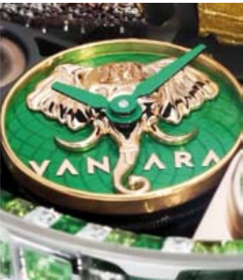
الساعة مستوحاه من حديقة حيوانات خاصة تديرها العائلة الهندية

وإن تمثال أنانت في وسط الميناء يرمز إلى المسؤولية والرعاية. وأوضحت الشركة أن الساعة تتكون من 397 حجرا كريماً، بما في ذلك الماس والياقوت الأخضر والجراثيت وأحجار كريمة أخرى.