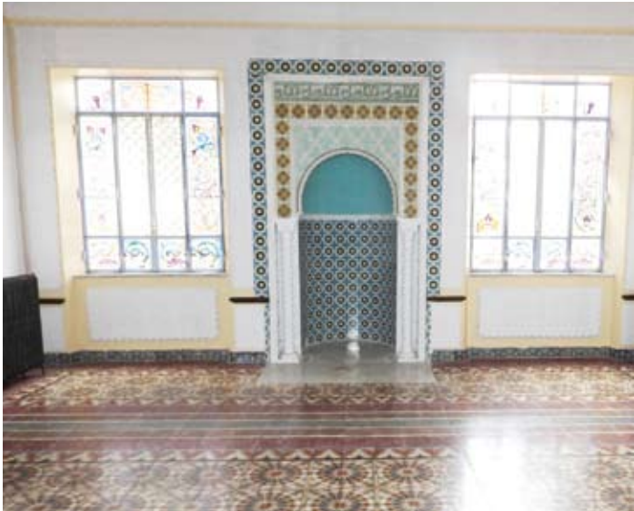
إحدى قاعات القصر مخصصة للصلاة

يعد قصر بلكين ببلدية (حسين داي) وسط العاصمة الجزائرية، الذي تم تشييده عام 1821 بطرازه المعماري العثماني المزوج بلمسات محلية مميزة، معلماً تاريخياً وشاهداً على حقبة مهمة من تاريخ البلاد.