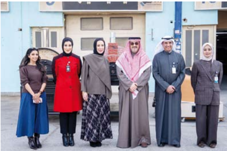
لقطة مع طلبة وطالبات الهيئة العامة للتعليم التطبيقي والتدريب