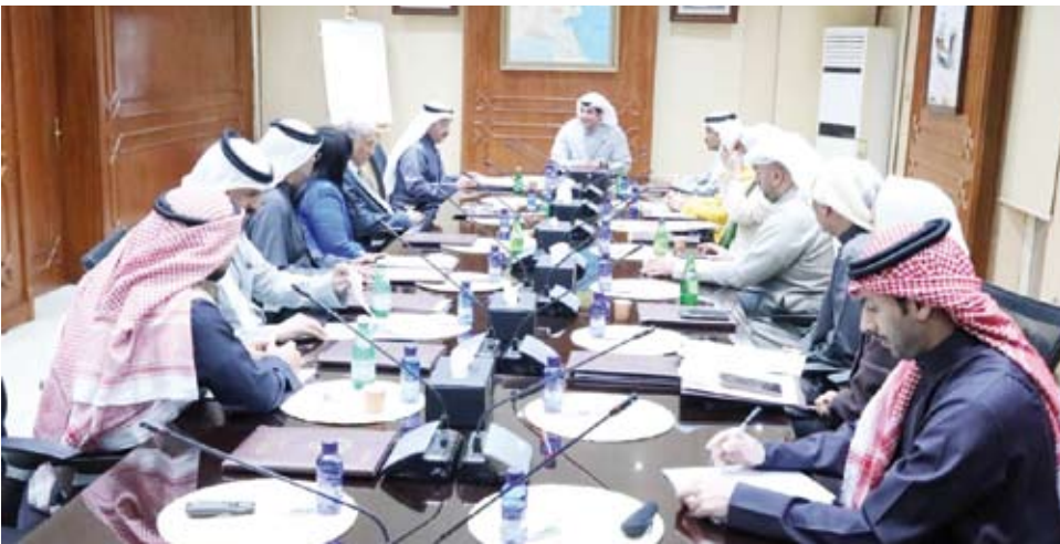
الوزير عبد الرحمن المطيري خلال اطلاعه على آليات عمل اللجنة