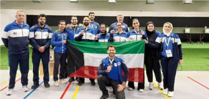
صورة جماعية لمنتخب الكويت