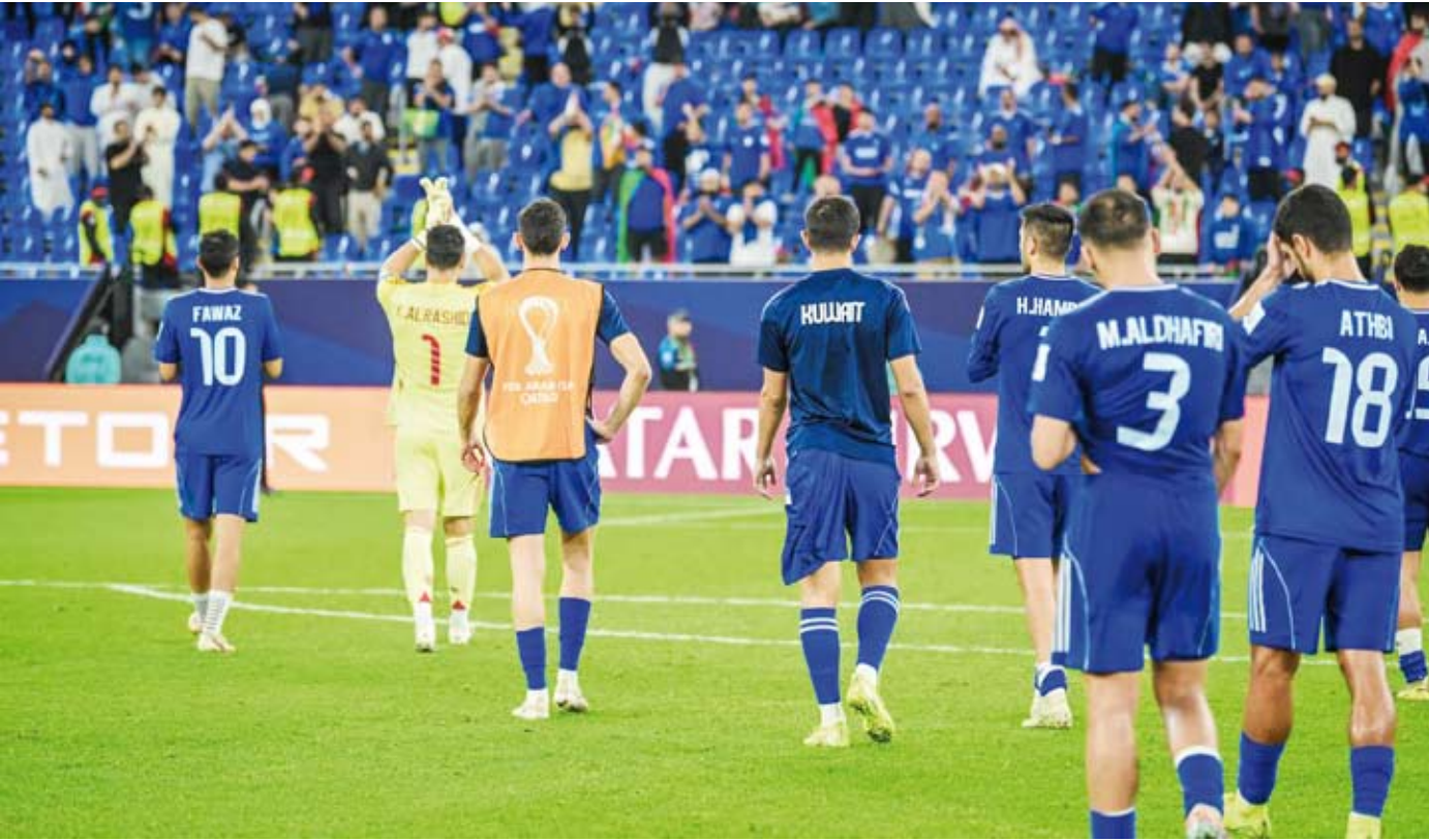
منتخب الكويت أهدر فرصة تحسين الترتيب العالمي في كأس العرب

أصدر الاتحاد الدولي لكرة القدم (فيفا) تحديده الأخير لسنة 2025 لتصنيف المنتخبات والذي شهد تواصل تصدر منتخب إسبانيا صدارة الترتيب العالمي تليه الأرجنتين ثم فرنسا بينما حافظ المنتخب الكويتي على ترتيبه 135 عالمياً.