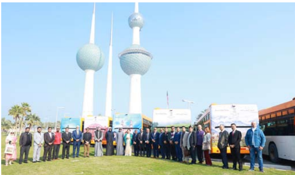
مسئولو السفارة الهندية وشركة المشاريع السياحية خلال الفعالية

وأطلقت السفيرة تريباتي والرئيس التنفيذي لشركة المشاريع السياحية الكويتية، السيد الحليبة، حافلات إيداناً ببدء الحملة السياحية التي تستمر لمدة شهر. ستجوب عشرون حافلة الكويت حاملة رسالة "هند العجائب"، مستعرضة مجموعة متنوعة من الوجهات السياحية الشهيرة في جميع أنحاء الهند، بما في ذلك سياحة المغامرات في رينيكيش (التحديف على المياه البيضاء)، وتجارب الحياة البرية في منتزه غابة جبر الوطني، وممرات كيرالا الهادئة، والسفر الفاخر على متن قطار المهراجا السريع. كما تشمل الحملة السياحية وجهات خلابة مثل مزارع