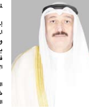
وزير الصحة د. أحمد العوضي

للأدوية البشرية والمواد الفعالة الدوائية في خطوة علمية تواكب المعايير الدولية المعتمدة، مشيرة إلى أن القرار الثامن يشمل القطاع البيطري الخاص بتسجيل وتداول الأدوية والمستحضرات البيطرية في حين شمل القرار التاسع تنظيم حيازة وصرف المستحضرات المخدرة والمؤثرات العقلية في المستشفيات البيطرية. وأضافت أن القرار العاشر نظم استيراد المواد أو المستحضرات المخدرة أو المؤثرة عقلياً أو «السلائف» الكيميائية المستخدمة في أعمال الإغاثة عند إعلان الطوارئ في البلاد. وتضمن القرار الحادي عشر، تشكيل لجنة لإعداد البرنامج الوطني للكشف المبكر عن سرطان عنق الرحم في دولة الكويت تأكيداً على التوجه الاستراتيجي نحو الوقاية وتعزيز الصحة العامة.