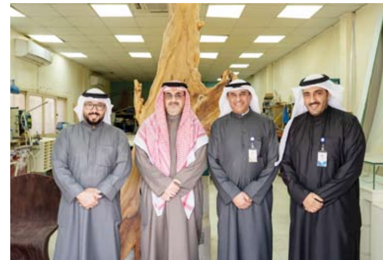
محافظ العاصمة ومدير عام الهيئة العامة للتعليم التطبيقي والتدريب خلال زيارة المركز

أكد محافظ العاصمة الشيخ عبدالله سالم العلي، أن مركز المبادرين والمشاريع الصغيرة التابع للهيئة العامة للتعليم التطبيقي والتدريب يعتبر نموذجاً رائداً في الربط بين التعليم التطبيقي ومخرجات سوق العمل. وأضاف الشيخ عبدالله سالم العلي، في كلمة خلال زيارته المركز، أمس، أن (المبادرين والمشاريع الصغيرة) يسهم في تمكين الشباب من تأسيس مشاريعهم الخاصة ودعم ثقافة العمل الحر وريادة الأعمال مما ينعكس إيجاباً على تنويع