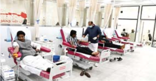
جانب من حملة التبرع بالدم