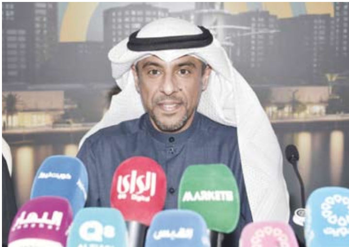
الحليلة متحدثاً خلال المؤتمر الصحفي أمس