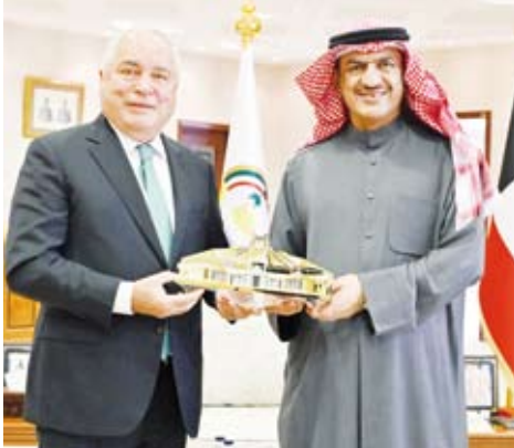
محافظ الجهراء مستقبلاً سفير طاجكستان

استقبل محافظ الجهراء حمد الحبشي، في مكتبه بديوان عام المحافظة، الدكتور زبيدالله زبيدوف سفير جمهورية طاجكستان الصديقة لدى دولة الكويت. وفي مستهل اللقاء، رحب المحافظ بالسفير، مؤكداً على العلاقات الودية التي تجمع بين دولة الكويت وجمهورية طاجكستان الصديقة، وما يربط البلدين من احترام متبادل وتعاون مشترك في مختلف المجالات، مشيداً بدور السفير باعتباره عميد السلك الدبلوماسي في تعزيز أواصر التواصل الدبلوماسي.