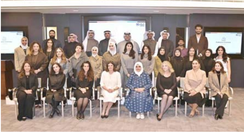
خريجو برنامج إنبات للإعداد المهني

إمكاناتنا، والاستعداد لمستقبلنا المهني برؤية أوضح وفترة أكبر.