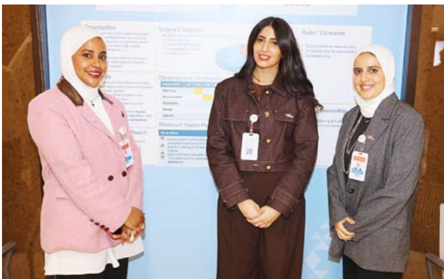
جانب من المشاركين في الفعالية

نظمت مؤسسة الكويت للتقدم العلمي أمس فعالية بعنوان "من الأفكار إلى الابتكار" ضمن سلسلة جولة تفاعلية تهدف إلى استعراض الابتكارات المؤسسية التي طورتها كواهرها خلال العام الحالي وإبراز دورها في تطوير بيئة العمل ورفع الكفاءة التشغيلية. وقالت المؤسسة في بيان صحفي إن المعرض يركز على عرض نماذج تطبيقية ناجحة لتحويل الأفكار إلى حلول عملية تعزز الكفاءة وتحسن بيئة العمل ويأتي في إطار التزامها بترسيخ ثقافة الابتكار المؤسسي وتشجيع فرق العمل على تقديم مبادرات قابلة للتطبيق تسهم في تطوير الأداء. وأضافت أن المعرض يسلط الضوء على مبادرات ومشاريع تطويرية في مجالات تحسين الإجراءات ورفع جودة الخدمات الداخلية وتطوير أدوات العمل وقياس الأثر الإضافية إلى حلول داعمة للحلول الرقمي وتحديث العمليات بما يعكس منهجية