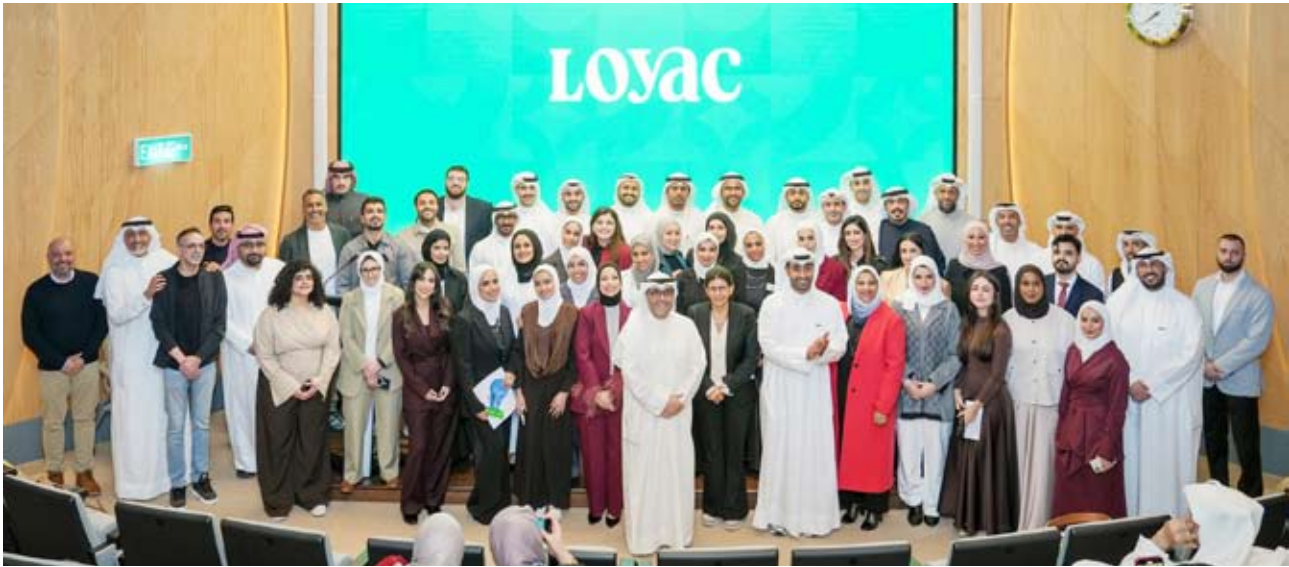
جانب حفل التخرج