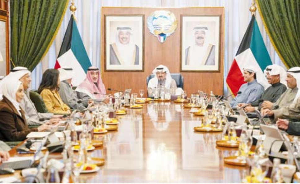
العبدالله يترأس اجتماع مجلس الوزراء أمس