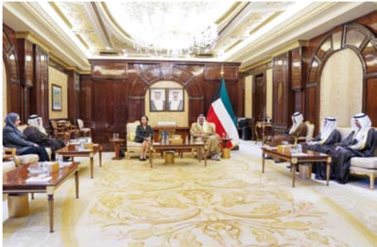
سمو الشيخ أحمد عبدالله مستقبلاً مدير عام وأعضاء هيئة تشجيع الاستثمار المباشر