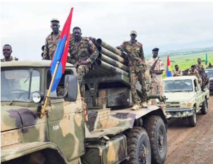
جنود تابعون للجيش السوداني في مدينة القضارف

في كادوقلي شرعت فعلياً في إجلاء طواقمها العاملة هناك بسبب تدهور الأوضاع الأمنية، عقب استهداف مقر بعثة السلام (يونيسفا).