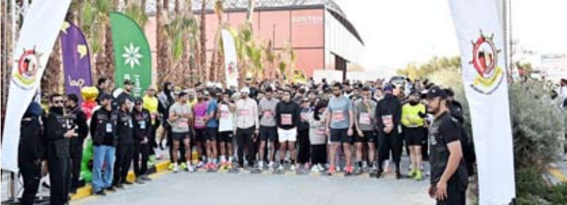
جانب من اليوم الرياضي