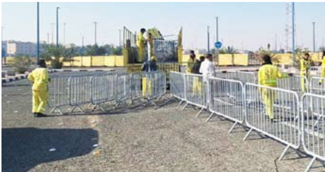
عمال البلدية خلال عمليات التنظيف

الميداني قام بتكثيف أعمال النظافة اليومية حول محيط الإستاذ الرياضي والشوارع والطرق المؤدية إليه وتوزيع حاويات سعة 1100 لتر، مستخدمة في ذلك عدد 50 عامل نظافة للكنس اليدوي وعدد 3 كناسات إلى جانب عددا من الكليات. وأضاف الجبیهه بأنه تم تشكيل فرق ميدانية لضبط الباعة الجائلين خارج أسوار الإستاذ الرياضي، بالإضافة إلى توجيه إنذارات بشأن الشاحنات والمعدات الثقيلة تمهيدا لرفعها من الموقع.