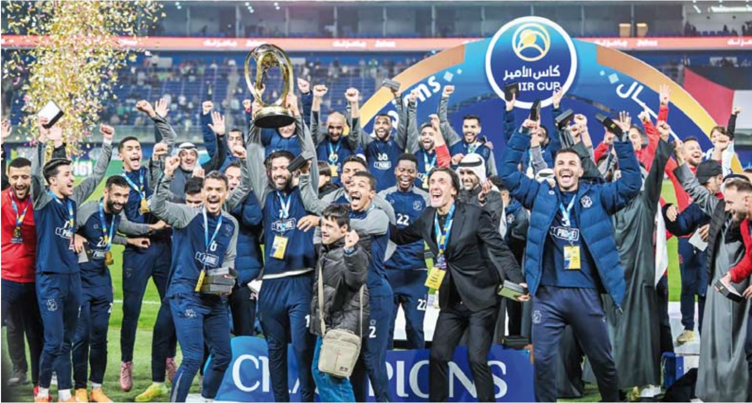
الكويت تغلب على العربي بهدفين نظيفين /

توج فريق الكويت بلقب كأس الأمير لكرة القدم بعدما تغلب على العربي 2-0 أس، على استاد جابر الدولي، في المباراة النهائية للنسخة الثالثة والستين من البطولة.