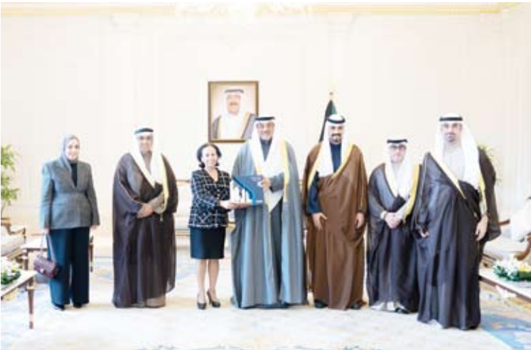
سمو ولي العهد يتسلم التقرير