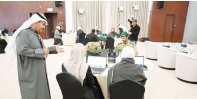
جانب من التمرين

على الصعيد التقني علاوة على تمكين قدرات ممثلي الجهات المشاركة في التصدي للتهديدات السيبرانية المتطورة المحتملة من خلال التعامل مع سيناريوهات محاكاة واقعية تحاكي بيئة العمل الفعلية. ويعد التمرين أحد المشاريع الاستراتيجية الأساسية التي يشرف عليها المركز الوطني للأمن السيبراني بهدف تعزيز حماية الأنظمة الحكومية ورفع مستوى التنسيق والتكامل بين الجهات المعنية. كما يشمل إحدى الركائز الأساسية لبناء منظومة سيبرانية وطنية متميزة دعماً لجهود الدولة الحديثة نحو حماية فضائها الرقمي ومواكبة التحديات العالمية بما يضمن أمن المعلومات واستقرار الخدمات والأنظمة الحكومية الحيوية.