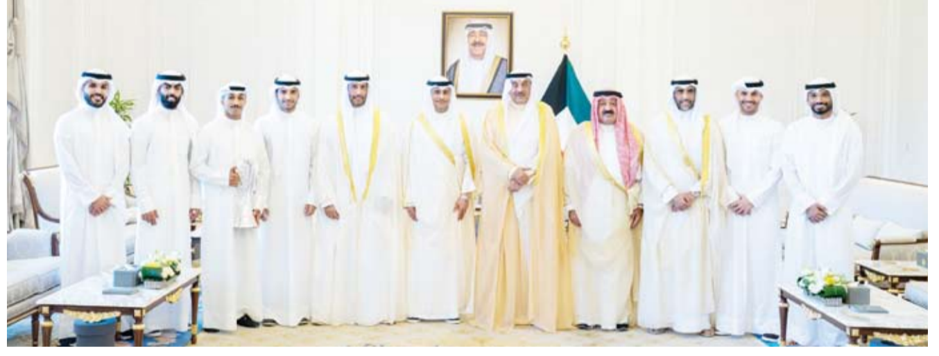
سمو ولي العهد يستقبل وزير الشباب والرياضة ومجلس إدارة ولاعبى نادي الكويت

بعث سمو ولي العهد صباح الخالد، ببرقية تهنئة إلى صاحب السمو الملكي الدوق الأكبر غيوم الخامس الدوق الأكبر لدوقية لوكسمبورغ الكبرى الصديقة، ضمنها سموه خالص تهانیه بمناسبة ذكرى العيد الوطني لبلادها وراجياً لسموه دوام الصحة والعافية.