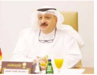
د. أحمد العوضي متحدثاً خلال اللقاء

أكد وزير الصحة الدكتور أحمد العوضي أمس أهمية تعزيز الأمن الدوائي الخليجي وضمان استدامة توافر الأدوية والمستلزمات الطبية ودعم التكامل الخليجي في منظومة الإمداد الدوائي والأمن الصحي المشترك. جاء ذلك في بيان صحفي صادر عن وزارة الصحة عقب مشاركة الوزير العوضي باجتماع وزراء الصحة بدول مجلس التعاون لدول الخليج العربية الذي عقد عبر تقنية الاتصال المرئي لبحث عدد من الملفات الاستراتيجية المترتبة