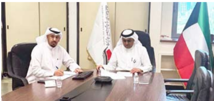
مشاركة الوزارة في اجتماع لجنة حماية المستهلك