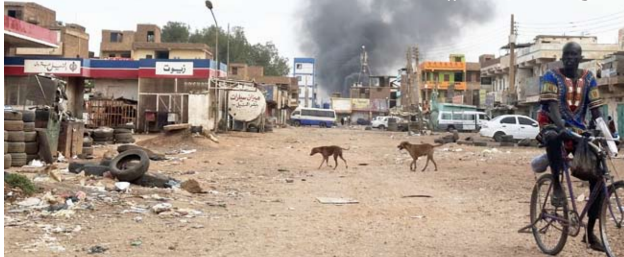
قصف نفذه الدعم السريع على منشآت طبية

لوقعتها الجغرافي الذي يربط الخرطوم ووسط البلاد مع غربها، وتُعد أكبر مركز حضري في إقليم كردفان الذي يتألف من 3 ولايات وبوابة رئيسية نحو إقليم دارفور.