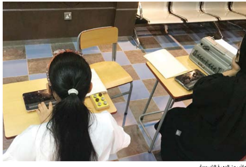
جانب من الدورة التدريبية