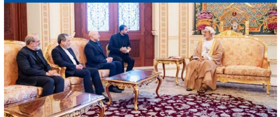
السلطان هيثم بن طارق مستقبلا عراقجي وقاليبايف امس