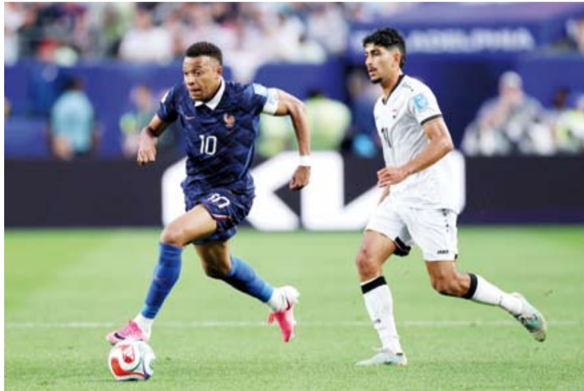
مبابي يواصل التالق مع الديوك

لحق منتخب فرنسا بركب المتأهلين لدور الـ32 ببطولة كأس العالم لكرة القدم، عقب فوزه الثمين 3-0 على منتخب العراق، في بطولة كأس العالم لكرة القدم 2026. وأقيمت المباراة في فيلادلفيا الأميركية، ضمن منافسات الجولة الثانية بالمجموعة التاسعة من مرحلة المجموعات للبطولة، التي تقام حالياً في الولايات المتحدة والمكسيك وكندا. وتأجل انطلاق الشوط الثاني للقاء لمدة ساعتين عن موعده المحدد، بسبب الأمطار الغزيرة التي هطلت على ملعب المباراة، لتصبح هذه هي أول حالة توقف للقاءات في الموندريال الحالي؛ بسبب سوء الأحوال الجوية. وتقمص النجم الفرنسي كيليان مبابي، الذي خاض مباراته الدولية الـ100 في مسيرته مع منتخب