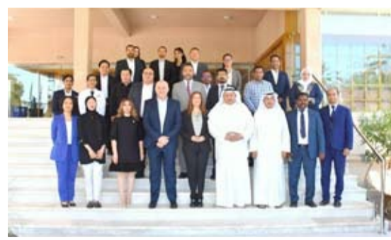
صورة جماعية للمشاركين في ورشة العمل

المياه الكويتية على دعمها المستمر لبرامج التعليم البيئي في دولة الكويت. وأكد الرز أن «برنامج (المفتاح الأخضر) يمثل أكثر من مجرد شهادة تزيينية، بل هو التزام مستمر تجاه النزلاء والمجتمع والبيئة»، مشيرة إلى أن «البرنامج يشهد تطوراً مستمراً لضمان مواكبة لأفضل الممارسات العالمية في قطاع الضيافة المستدامة».