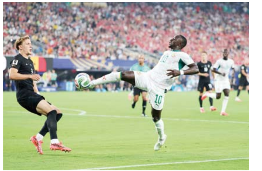
ماني في محاولة للتسجيل أمام مرمي النرويج

أصبح منتخب النرويج سادس المتأهلين لدور الـ32 ببطولة كأس العالم لكرة القدم، المقامة حالياً في الولايات المتحدة والمكسيك وكندا. وحقق المنتخب النرويجي انتصاراً مثيراً 3-2 على منتخب السنغال، بالتوقيت المحلي، في الجولة الثانية بالمجموعة التاسعة من مرحلة المجموعتين للتأهل. ووقعت النرويج رصيده إلى 6 نقاط في المركز الثاني، بفارق الأهداف خلف منتخب فرنسا (المتصدر)، ليصعدا معاً للدور اللاحق في المسابقة، قبل مباراة التمهيد في الجولة المقبلة. في المقابل، بقي منتخب السنغال في المركز الثالث دون رصيد، بفارق الأهداف أمام منتخب العراق، صاحب المركز الرابع، قبل مباراتهما المقصدة في الجولة الأخيرة، حيث يسعى كل منهما لحصد النقاط الثلاث من أجل خطف المركز الثالث، والإبقاء على الأمل في التأهل لمرحلة خروج المغلوب من خلال الوجود ضمن أفضل 8 منتخبات حاصلة على المركز الثالث في المجموعات الـ12 بالدور الأول.