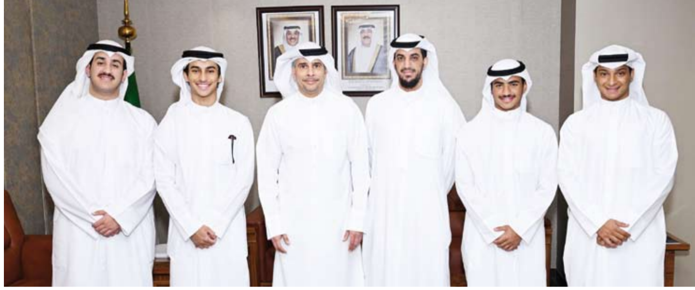
اللاعبون المختارون مع الوزير الجلاهمة ورئيس نادي سالزيري الإنجليزي

قال وزير الدولة لشؤون الشباب والرياضة الدكتور طارق الجلاهمة إن تعاون الهيئة العامة للرياضة مع نادي (سالزيري) الإنجليزي لكرة القدم خطوة مهمة نحو تعزيز ثقافة الاحتراف الرياضي لدى اللاعبين الشباب. جاء ذلك في تصريح للوزير الجلاهمة بعد استقباله للاعبين المختارين لخوض تجربة الاحتراف في نادي (سالزيري) الإنجليزي وذلك ضمن برنامج اكتشاف وصلق المواهب الرياضية الذي تنفذه الهيئة بالتعاون مع النادي الإنجليزي لإتاحة الفرصة أمام اللاعبين الواعدين للاحتكاك ببيئات احترافية متقدمة واكتساب المزيد من الخبرات الفنية والبدنية. وأكد الوزير الجلاهمة أن هذه المبادرة تأتي في إطار دعم الدولة للمواهب الشابة وترجمة لرؤيتها في بناء جيل قادر على الإبداع والتميز في مختلف المجالات من خلال توفير البرامج التطويرية. وأشار إلى أن (هيئة الرياضة) تضع دعم الشباب الرياضي وتمكين المواهب الوطنية ضمن أولوياتها وتسعى باستمرار إلى بناء شراكات وتعاونات دولية مع مؤسسات وأندية رياضية