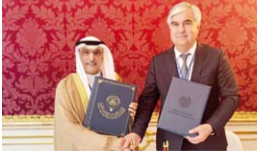
وليد البحر ووزير المالية في طاجيكستان فيض الدين قهار زاده بعد توقيع الاتفاقية

وقّع الصندوق الكويتي للتنمية الاقتصادية العربية، أمس، اتفاقية قرض مع حكومة جمهورية طاجيكستان بقيمة 6 ملايين دينار كويتي (نحو 19ر4 مليون دولار أميركي)، وذلك للإسهام في تمويل مشروع تطوير المدارس في الجمهورية. وذكر الصندوق في بيان لـ (كونا)، أن الاتفاقية جاءت في إطار الجهود المتواصلة لدعم التنمية المستدامة وتعزيز قطاع التعليم في الدول النامية، مبيّناً أن الاتفاقية تم توقيعها في العاصمة النمساوية فيينا على هامش اجتماعات رؤساء مجموعة التسوق العربية. وأضاف أن المشروع يهدف إلى الارتقاء بمستوى الخدمات التعليمية وتعزيز التنمية الاجتماعية والاقتصادية في طاجيكستان من خلال إنشاء مبان ومرافق جديدة في 10 مواقع لمدارس قائمة موزعة على ثلاثة أقاليم هي العاصمة وسغد وختلون. وأوضح أن سيتم تزويد تلك المباني بالأتات المدرسي والمختبرات والتجهيزات التعليمية والفنية والرياضية وتوفير خدمات