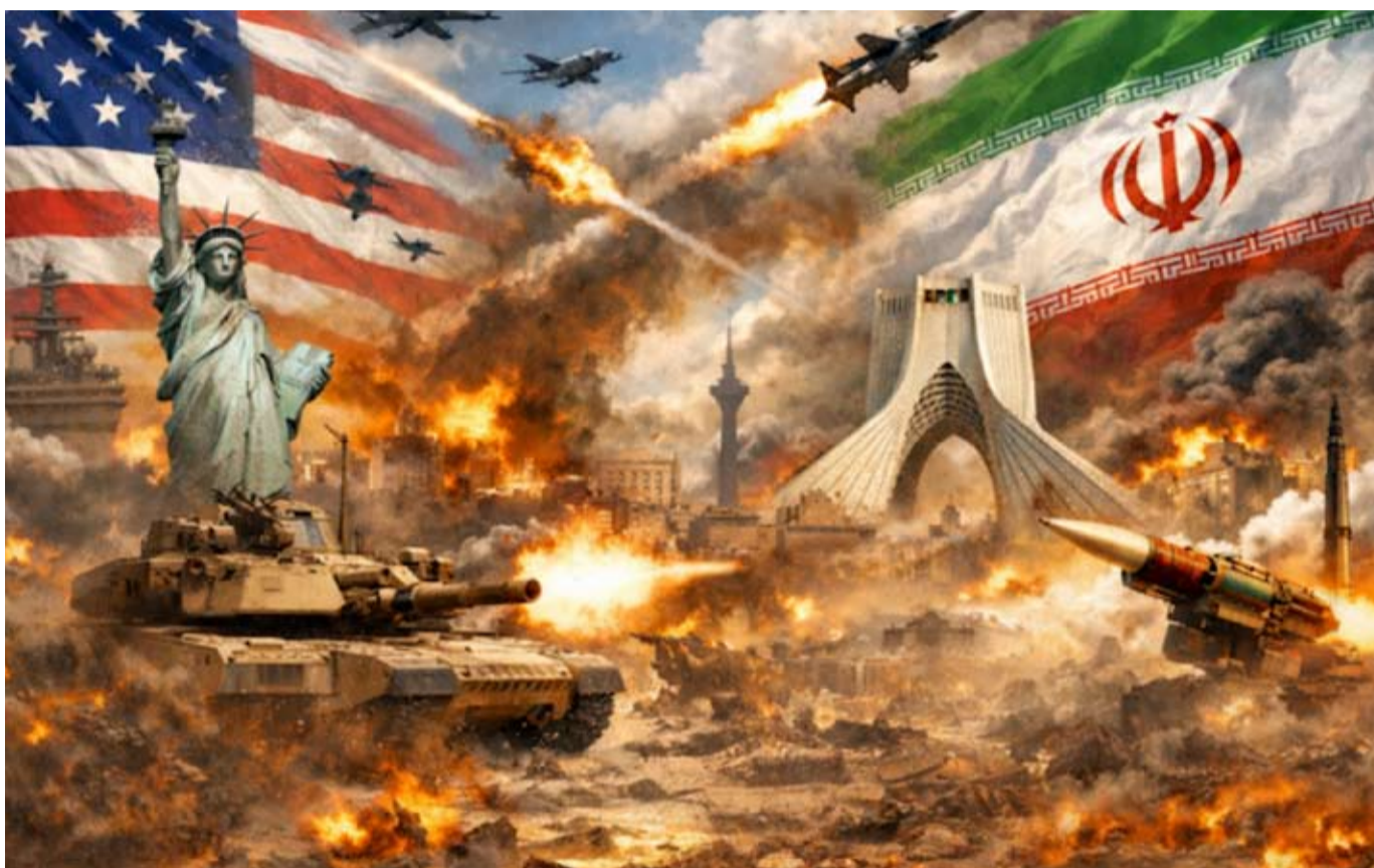
اتفاق بين أمريكا وإيران يقضي بإنهاء الحرب

أعلن نائب وزير الخارجية الإيراني اختتام المحادثات الفنية مع الولايات المتحدة في إطار المفاوضات الدائرة في سويسرا بواسطة قطرية وباكستانية لإنهاء الحرب، وفق وسائل إعلام رسمية، وبسحب وكالة الأنباء الإيرانية (إرنا) «تقرر أيضاً تشكيل أربع مجموعات عمل تتعلق بإنهاء العقوبات، والشؤون النووية، وإعادة الإعمار والتنمية الاقتصادية، والمراقبة والتفويض».