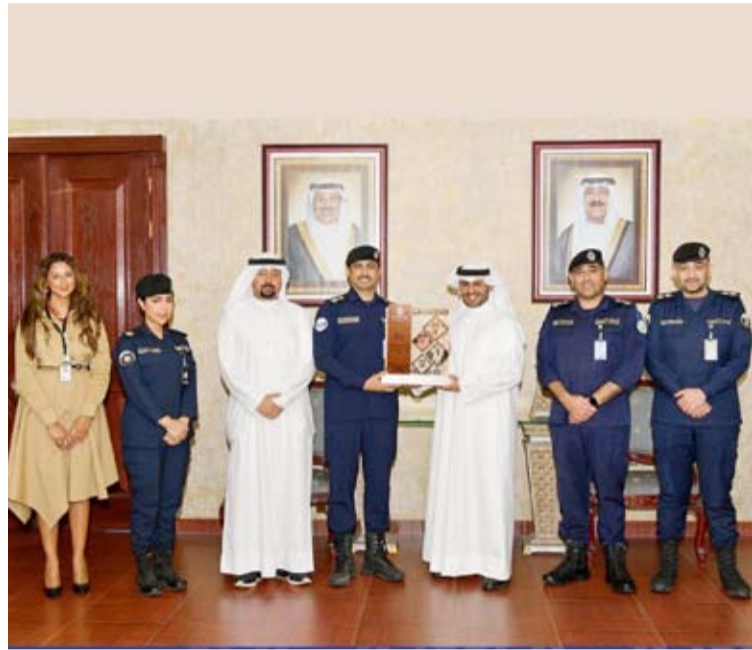
تكريم للمحافظ من قبل إدارة النادي