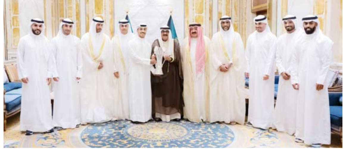
سمو أمير البلاد مستقبلاً وزير الشباب والرياضة ورئيس اتحاد كرة القدم ومجلس إدارة ولاعبى نادي الكويت

استقبل صاحب السمو أمير البلاد الشيخ مشعل الأحمد، أمس، وبحضور رئيس مجلس الوزراء بالإثابة وزير الداخلية الشيخ فهد اليوسف، وزير الدولة لشؤون الشباب والرياضة الدكتور طارق الجلامه، ورئيس الاتحاد الكويتي لكرة القدم الشيخ أحمد اليوسف، ورئيس مجلس إدارة نادي الكويت الرياضي خالد الغانم، وأعضاء مجلس الإدارة ولاعبى فريق نادي الكويت الرياضي لكرة القدم، وذلك بمناسبة تتويج الفريق وحصوله على كأس بطولة دوري التحدي الآسيوي. وقد هناه سمو بهذا الإنجاز الرياضي المميز، مشيداً سموه بالأداء الفني الرفيع الذي