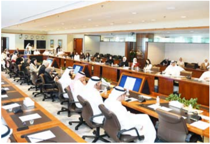
جانب من الندوة القانونية

أواخر التنفيذ، مع التركيز على الحالات التي يجيز فيها القانون الكويتي تدخل القضاء للتحقق من سلامة الإجراءات واحترام النظام العام دون المساس بسلطة هيئة التحكيم في تقدير موضوع النزاع. وشهدت الندوة نقاشات موسعة حول التطبيقات العملية للقضاء الكويتي في مجال التحكيم، وأهمية تحقيق التوازن بين استقلالية هيئات التحكيم وضمانات الرقابة القضائية. من جانبه، أكد الأمين العام لمركز الكويت للتحكيم التجاري أن تنظيم هذه الفعالية يأتي في إطار جهود المركز الرامية إلى تطوير منظومة التحكيم المؤسسي في الكويت وتعزيز الوعي القانوني بإحداث المستجدات القضائية، مشدداً على أن استقرار العلاقة التكاملية بين القضاء والتحكيم يعد عاملاً أساسياً في دعم بيئة الأعمال وجذب الاستثمارات المحلية والأجنبية.