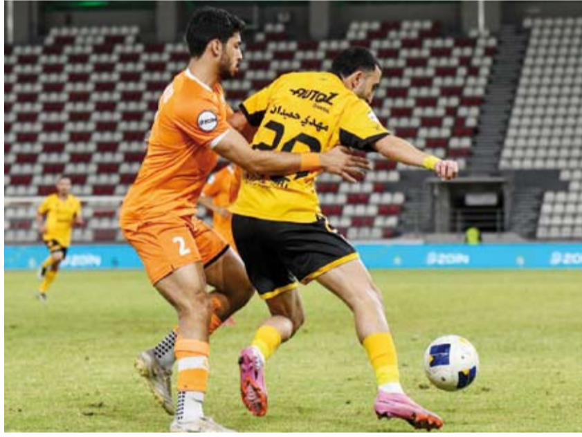
لاعب القادسية ينطلق وسط رقابة من لاعب كاظمة

أسفرت نتائج الجولة عن فوز فريق السالمية والكويت وكاظمة على الفحيحيل والعربي والقادسية على التوالي، وذهب فريق نادي الكويت (ضمن الفوز بلقب الدوري) بفارق النقاط بعيداً بوصوله للنقطة الـ51 فيما اشتعلت مراكز التأهل إلى البطولات الخارجية إذ حل العربي ثانياً بنقطة 36 والقادسية ثالثاً بنقطة 35 وكاظمة ورابعاً بنقطة 34 والسالمية خامساً بنفس الرصيد ثم الفحيحيل سادساً بنقطة 22. يذكر أن صاحب المركز الأول يتأهل مباشرة إلى (دوري أبطال آسيا 2) والمركز الثاني إلى ملحق (دوري أبطال آسيا 2) والمركز الثالث إلى دوري أبطال الخليج.