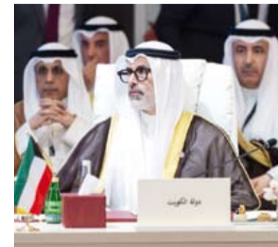
الشيخ جراح الجابر يرأس وفد الكويت في الاجتماع التشاوري

كما التقى وزير الخارجية الكويتي الشيخ جراح الجابر، نائب رئيس مجلس الوزراء وزير خارجية جمهورية العراق الشقيقة الدكتور فؤاد حسين، على هامش أعمال الاجتماع التشاوري العربي واجتماع مجلس جامعة الدول العربية على المستوى الوزاري في دورته العادية المستأنفة (165) المنعقدتين في العاصمة الأردنية عمان. وتم خلال اللقاء استعراض العلاقات الثنائية الأخوية بين البلدين الشقيقين وسبل تطويرها وتعزيزها بما يخدم مختلف المجالات، كما شهد اللقاء بحث مستجدات الأوضاع الإقليمية والجهود المبذولة حيالها.