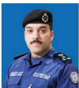
العميد محمد الغريب

الكهربائية الزائدة، وسوء استخدام التمديدات والأجهزة الكهربائية، وترك الأجهزة قيد التشغيل لفترات طويلة، إضافة إلى التخزين غير الآمن للمواد القابلة للاشتعال وإهمال إجراءات السلامة داخل المنازل والمنشآت، وأكد ضرورة إجراء