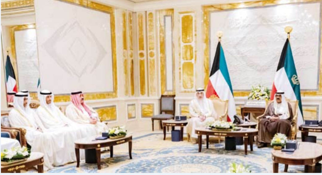
وزير التربية المهندس سيد جلال الطبطبائي

التابع لوزير التربية بمناخية مدى التزام مدارس التعليم الخاص غير الحكومي باللوائح والنظم المعمول بها في وزارة التربية، ورفع التقارير اللازمة إلى مكتب الوزير. وشدد القرار على جميع الجهات المعنية، كل في مجال اختصاصه، تنفيذ القرار والعمل به اعتباراً من تاريخ صدوره، مع إلغاء أي قرارات وزارية سابقة تتعارض مع أحكامه.