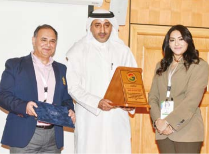
ممثلو شركة غوغل يكرمون مدير المشروع

وأضاف الحمدي أن المشروع تضمن لتأهيل المعلمين والمعلمات على استخدام أدوات الذكاء الاصطناعي وتطبيقاتها بما يعزز كفاءة العملية التعليمية ويدعم توجهات الوزارة في التحول الرقمي، مؤكداً أن توظيف أدوات الذكاء الاصطناعي في التعليم يعد استثماراً استراتيجياً في عقول الأجيال المقبلة. وأشاد بجهود فريق العمل في شركة «غوغل» ووزارة التربية لاسيما إدارة التوجيه الفني للحاسوب وما بذلوه من جهود متواصلة لتحقيق أهداف المشروع متمنياً المزيد من التوفيق والنجاح للحاصلين على شهادة مدرب معتمد أكاديمياً. من جهته قال المدير العام لإدارة التوجيه