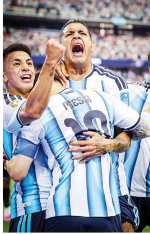
فرحة لاعبي التانغو بهدف ميسي

قاد ليونيل ميسي منتخب الأرجنتين إلى التأهل لدور الـ32 في كأس العالم 2026 بعدما سجل هدفه الفوز على النمسا 2-0، على ملعب «إيه تي أند تي» في أربلغتون ضمن الجولة الثانية من منافسات المجموعة العاشرة. وواصل ميسي كتابة التاريخ في الموندريال، إذ افتتح التسجيل في الدقيقة 38 ليصبح الهدف التاريخي لكأس العالم برصيد 18 هدفاً، متجاوزاً الرقم القياسي الذي كان يتقاسمه مع الألماني ميروسلاف كلوزه، ثم عاد وأضاف الهدف الثاني في الوقت بدل الضائع (90+5) رافعاً رصيده إلى 18 هدفاً في النهائيات. بهذا الفوز، ضمنّت الأرجنتين التأهل إلى الدور الثاني، كما باتت قريبة من حسم صدارة المجموعة. كذلك رفع ميسي رصيده الدولي إلى 122 هدفاً في 201 مباراة مع منتخب بلاده.