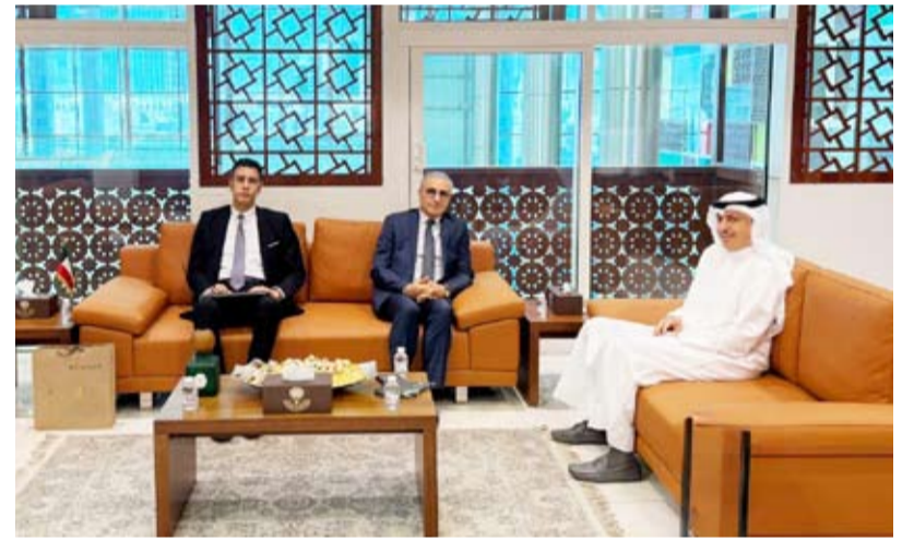
بودي يبحث مع سفير تونس تعزيز التعاون التجاري

بين دولة الكويت والجمهورية التونسية واستعراض فرص التعاون المشترك في عدد من المجالات ذات الاهتمام المشترك. وأضافت أن الجانبين ناقشا سبل تعزيز التعاون التجاري والاستثماري والصناعي بما يسهم في دعم العلاقات الاقتصادية بين البلدين وتوسيع مجالات التعاون المشترك.