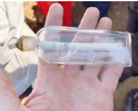
الرسالة في الزجاجة