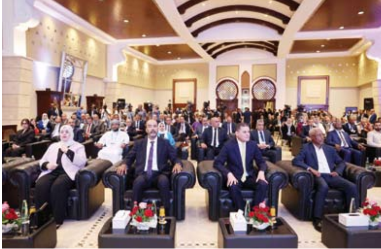
الديبية خلال افتتاح منتدى العمل التطوعي

الليبية مع عدد من قادة دول العالم. وفي إطار الدعم الأفريقي لجهود «المصالحة الوطنية» في ليبيا، قالت وزارة الخارجية بحكومة الديبية إن الطاهر الباعور المكلف بتسيير الوزارة، عقد «اجتماعاً مئماً» مع رئيس مفوضية الاتحاد الأفريقي موسى فكي، في إطار مشاركة ليبيا في الدورة 79 للجمعية العامة للأمم المتحدة. وقالت «الخارجية»، إن الباعور وهو ممثل دولة ليبيا في هذه الدورة.