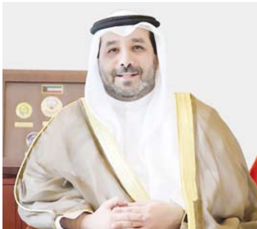
الشيخ صباح ناصر صباح الأحمد

إما أن تبقى الكويت أو تذهب السعودية معها.. فهذه الكلمة دلالة أخرى على المصير الواحد للبلدين. وفي الختام دعا الشيخ صباح الناصر، الله سبحانه وتعالى أن يحفظ البلدين الشقيقين تحت القيادة السامية للشيخ مشعل الأحمد وخادم الحرمين الشريفين الملك سلمان بن عبدالعزيز.