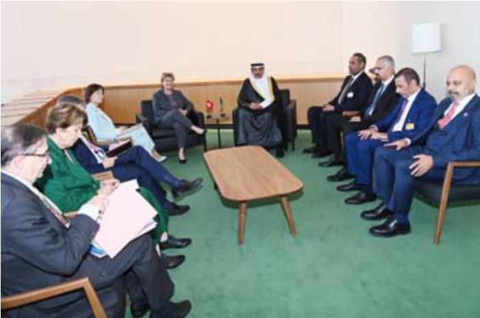
.. وسموه يستقبل رئيسة الاتحاد السويسري فيولا امهيرد