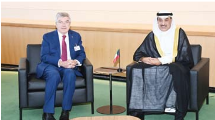
.. وسموه يستقبل رئيس اللجنة الأولمبية الدولية توماس باخ

الأمريكية. وتم خلال اللقاء بحث العلاقات المشتركة بين دولة الكويت وجمهورية الهند وسبل تطويرها بما يخدم مصالح البلدين والشعبين الصديقين بالإضافة إلى مناقشة أبرز المستجدات على الساحتين الإقليمية والدولية.