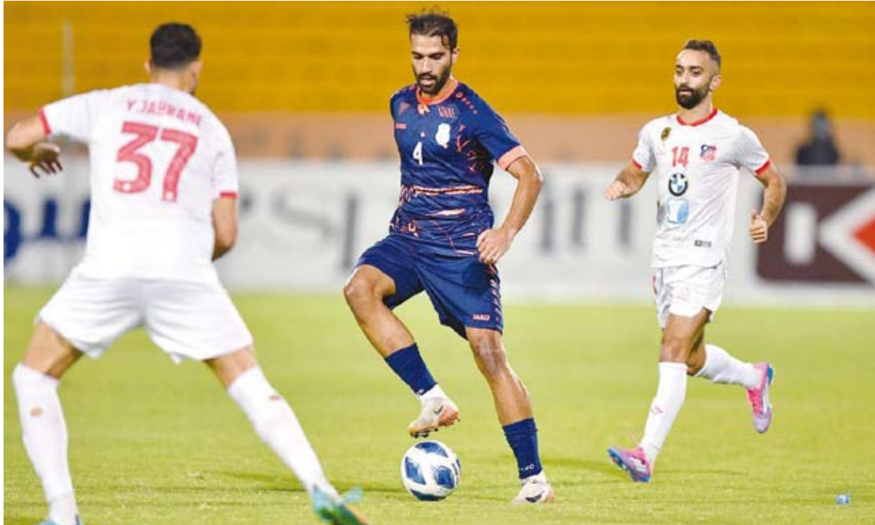
حصار أبيض على لاعب اليرموك

أعرب الإيطالي كارلو أنشيلوتي المدير الفني لنادي ريال مدريد عن سعادته البالغة بالفوز العريض الذي حققه فريقه على ضيفه إسبانيول، مشيراً إلى أن الإنجليزي جود بيلنغهام والإسباني داني كارفخال يعانيان من إصابة.