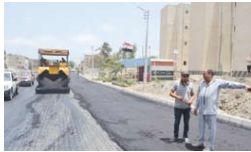
رصف طريق «أرشفيف»

جهوزيتها للعمل بعد توقيع العقد بأسبوع في حين طلبت أخرى مهلاً زمنية مختلفة تصل إلى شهر من تاريخ توقيع العقد للبدء في أعمال الصيانة».