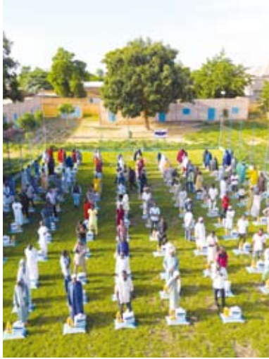
جانب من توزيع المساعدات

أعلنت نماء الخيرية التابعة لجمعية الإصلاح الاجتماعي عن تنفيذ إغاثة عاجلة للمتضررين من الفيضانات في النيجر، وذلك في إطار جهودها الإنسانية المستمرة.