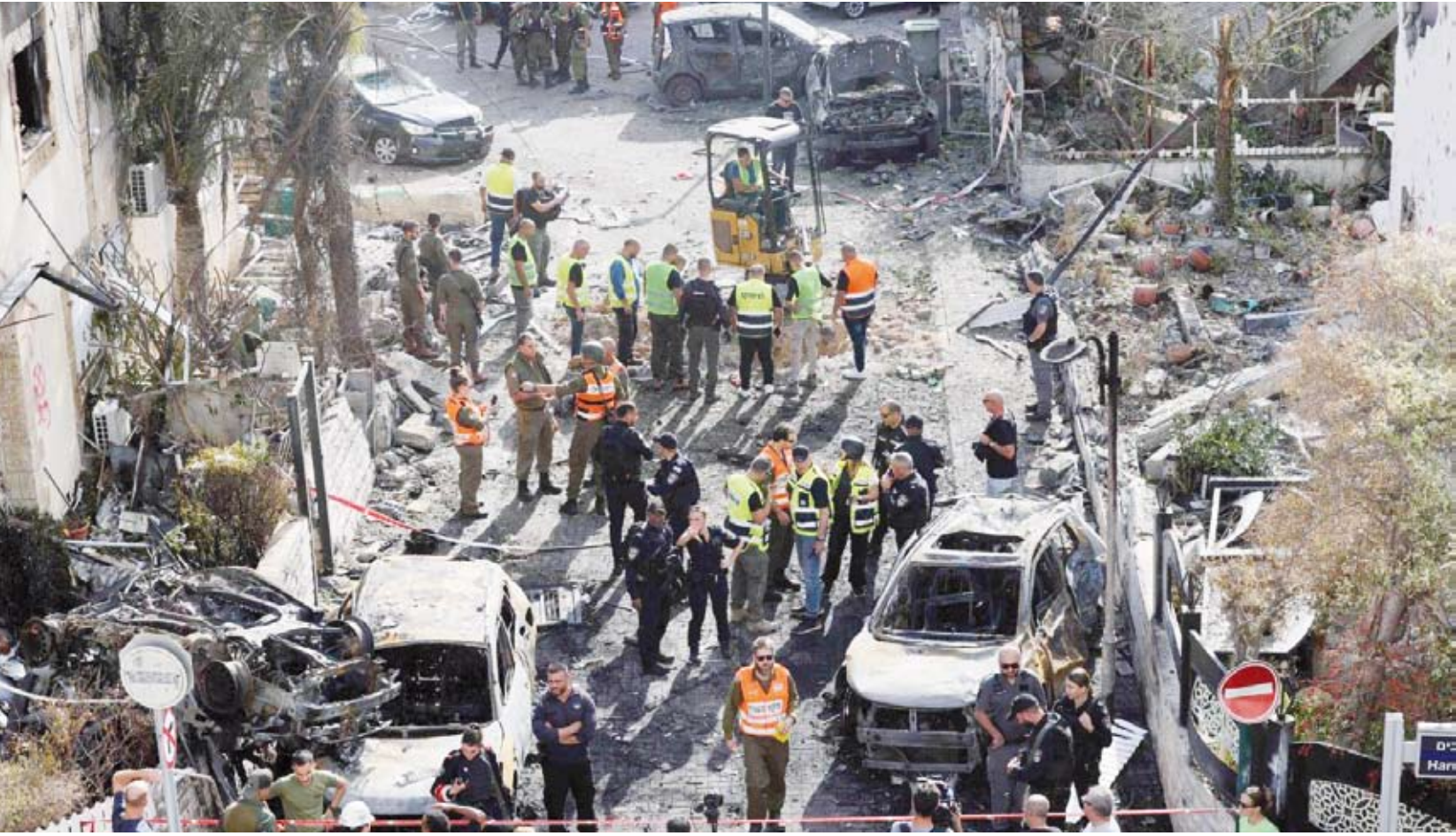
دمار في حيفا خلفه صاروخ حزب الله

ولم يرد شرفي على التهمة، وبدت على ملامحه علامات التأثر بالأحداث، عندما كان حاضراً، في مراسيم أداء اليمين الدستورية للرئيس المقبل على ولاية جديدة. وفي ذاته، استقبل تبون المرشحين الخاسرين، اللذين لم يطعنا أبداً في صديقة النتيجة التي حصل عليها.