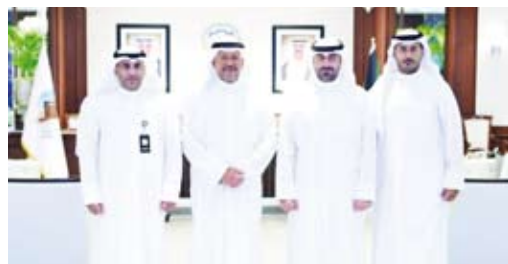
العنزي متوسطا مسؤولي البلدية

أشاد محافظ الفروانية الشيخ عنزي ناصر العنزي بجهود البلدية الحثيية الواضحة، داعياً إلى الارتقاء بمناطق المحافظة والعمل على رفع مستوى الخدمات التي تقدمها بلدية الكويت بوجه عام، وبلدية الفروانية خصوصاً لبناء المحافظة. واجتمع العنزي أمس الأول ، بعدد من مسؤولي البلدية وهم نائب المدير لقطاع بلدية محافظة الفروانية ومبارك الكبير محمد الجلاوي. وأكد المحافظ ضرورة بحث القضايا والمواضيع المتعلقة