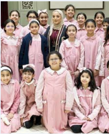
جانب من المشاركات الطلابية