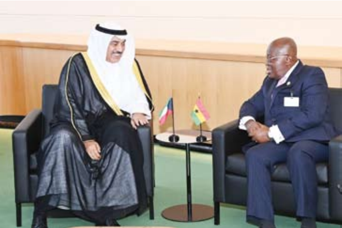
سمو ولي العهد الشيخ صباح الخالد يستقبل رئيسغانا نانا اكوفو آدو

السفير طارق البناي. واستقبل سمو ولي العهد الشيخ صباح الخالد، الرئيس كاي بي شاما اولى رئيس الوزراء بجمهورية نيبال الديموقراطية الاتحادية الصديقة في مقر الوفد الدائم لدولة الكويت لدى الأمم المتحدة بمدينة نيويورك في الولايات المتحدة الأمريكية. وتم خلال اللقاء بحث العلاقات المشتركة بين دولة الكويت وجمهورية نيبال الديمقراطية الاتحادية وسبل تطويرها بما يخدم مصالح البلدين والشعبين الصديقين بالإضافة إلى مناقشة أبرز المستجدات على الساحتين الإقليمية والدولية.