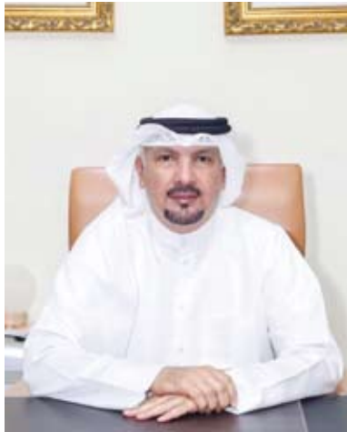
السفير جاسم الناجم

كبير من وزراء النقل والمسؤولين الدوليين ورواد الأعمال والعلماء من داخل وخارج الصين. وكانت الصين أعلنت أن المنتدى الذي يعقد يومي 25 و26 سبتمبر الجاري تحت عنوان (النقل المستدام: الخدمات اللوجستية تربط العالم) يهدف إلى تعزيز التعاون العالمي ودفع تنمية نظام نقل آمن ومرح وفعال وأخضر واقتصادي وشامل ومرن. ومن المتوقع أن يصدر المشاركون بشكل مشترك سلسلة من النتائج العملية خلال المنتدى بما في ذلك مبادرات تتعلق بتنفيذ أجندة الأمم المتحدة للتنمية المستدامة لعام 2030 وتعزيز تنمية النقل المستدام.