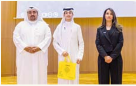
تكريم الفائز بجائزة زين للإبداع

طوال الموسم، وقامت الشركة بعدها بتقديم «جائزة زين للإبداع»، كما شهد الحفل تكريم جميع الطلبة والطالبات المشاركين في النسخة الرابعة. وترتكز العديد من مبادرات استراتيجية زين للاستدامة حول قطاعي الشباب والتعليم لمواكبة توجهات الاقتصاد والتعليم المتسارعة نحو المجالات الرقمية، ولهذا فقد وضعت الشركة تطوير المهارات البرمجية والرقمية لدى الشباب على رأس أولوياتها، وأتت دعمها لهذه المبادرة المميزة للعام الثالث على التوالي تحت مظلة هذه الاستراتيجية.