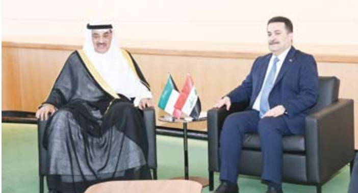
سمو ولي العهد يلتقي رئيس مجلس الوزراء العراقي محمد شياع السوداني

وقد تم خلال اللقاء مناقشة سبل التعاون المشترك وتعزيز الروابط الرياضية المشتركة بالإضافة إلى دعم وتطوير اللجنة الأولمبية الكويتية بكافة المجالات بما يعود بالنفع على الرياضيين في دولة الكويت. وحضر اللقاء وزير الخارجية عبدالله الحيحا ومدير عام هيئة تشجيع الاستثمار المباشر الشيخ الدكتور مشعل جابر الأحمد ووكيل الشؤون الخارجية بديوان سمو ولي العهد مازن العيسى ومساعد وزير الخارجية لشؤون مكتب الوزير السفير بدر التنيب والمندوب الدائم لدولة الكويت لدى الأمم المتحدة السفير طارق البناي.