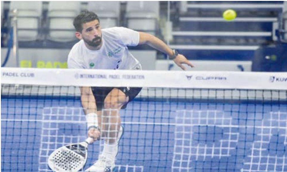
جانب من المنافسات

انطلقت التصفيات الآسيوية والإفريقية المؤهلة لكأس العالم للبادل للرجال والسيدات المقلبة (الدوحة 2024) المقررة أكتوبر المقبل والتي ينظمها النادي الكويتي للبادل بإشراف الاتحاد الدولي للعبة بمشاركة 14 منتخباً للرجال و13 للسيدات وتستمر 6 أيام. وأسفرت نتائج مباريات أمس في فئة الرجال عن فوز الإمارات على الفلبين وأستراليا على السعودية واليابان على الصين ومصر على لبنان وإيران على عمان والسنگال على تايلاند وجاءت جميعها بذات النتيجة بواقع (0/3). وفي منافسات السيدات تمكنت الإمارات من الفوز على لبنان (1/2) ومصر على البحرين (0/3) واليابان على السعودية (0/3) في حين حققت أستراليا فوزاً سهلاً على السنگال بذات النتيجة.