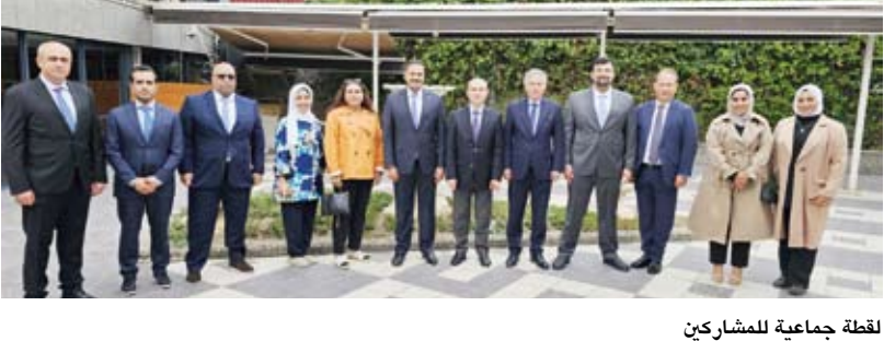
لفئة جماعية للمشاركةين

بدا معهد سعود الناصر الصباح الدبلوماسي الكويتي، أمس، دورة تدريبية لبعض منتسبي وزارة الخارجية الكويتية بالتعاون مع الأكاديمية الدبلوماسية التركية في أنقرة.