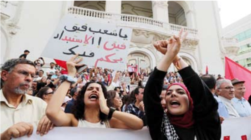
احتجاجات ضد الرئيس التونسي

وقال الدبيبة في افتتاحه منندى «أعمال تنفيذ الاستراتيجية العربية للعمل التطوعي وخطة دعم حقوق الأشخاص ذوي الإعاقة خلال الأوبئة والأزمات»، بالعاصمة طرابلس، إن ليبيا «كانت وستظل في طريقها السدول الداعمة للقضايا الإنسانية والاجتماعية، وفي مقدمتها العمل التطوعي، ودعم حقوق ذوي الإعاقة»، وشدد على أهمية المضي قدماً في تنفيذ خطة التنمية المستدامة 2030، وتعزيز برامج الحماية الاجتماعية لضمان الاستقرار والتنمية