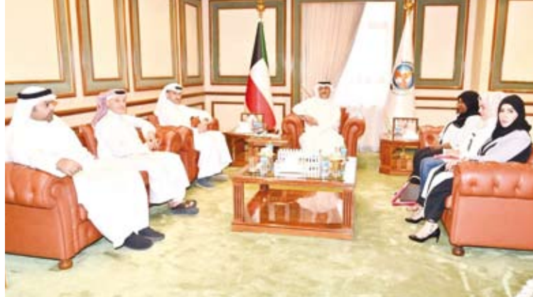
.. ويستقبل مدير عام هيئة الرياضة وبعض المسؤولين فيها