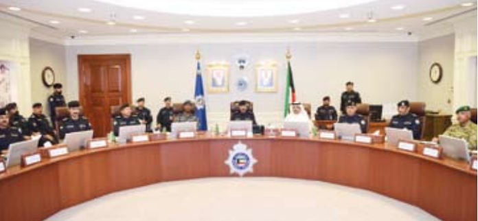
الفريق الشيخ سالم النواف يترأس الاجتماع

وذكر البيان أن الاجتماع ناقش التجهيزات والاستعدادات الأمنية والمرورية واللوجستية لاستقبال قادة دول مجلس التعاون الخليجي والخطط الرئيسية وآلية الانتشار الأمني في كافة المحافظات أثناء وبعد انعقاد القمة وآلية التنسيق بين القطاعات العسكرية المشاركة في عملية التأمين.