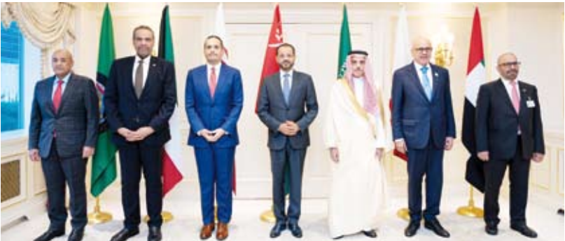
وزير الخارجية يشارك بالاجتماع التنسيقي الخليجي

شارك وزير الخارجية الكويتي عبدالله الحيحا في أعمال الاجتماع التنسيقي لوزراء خارجية دول مجلس التعاون لدول الخليج العربية، الذي عقد، أمس، على هامش أعمال الأسبوع الرفيع المستوى للجمعية العامة للأمم المتحدة في دورتها الـ 79 بمدينة نيويورك. وتم خلال الاجتماع مناقشة أطر تعزيز التعاون والتنسيق المشترك بين دول المجلس للتخضير للاجتماعات الوزارية التي ستعقد مع عدد من وزراء خارجية الدول والتكتلات الدولية على هامش اجتماعات الجمعية العامة للأمم المتحدة.