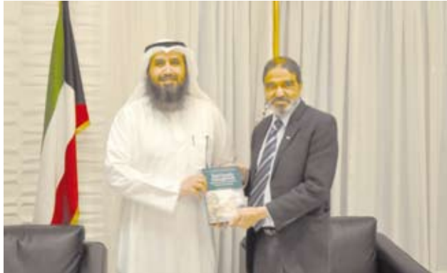
العتل يتلقى من روماني إصداره الجديد حول الجودة في المشاريع الإنشائية

المستمرة في نشر ثقافة إدارة المشاريع وجودتها، مشيراً إلى الإصدارات السابقة التي قدمها إلى الجمعية وتعاونته في مجال تأهيل وتصنيف المهندسين ونقل الخبرات والعمل معاً لتوطين تكنولوجيا العلوم الهندسية.