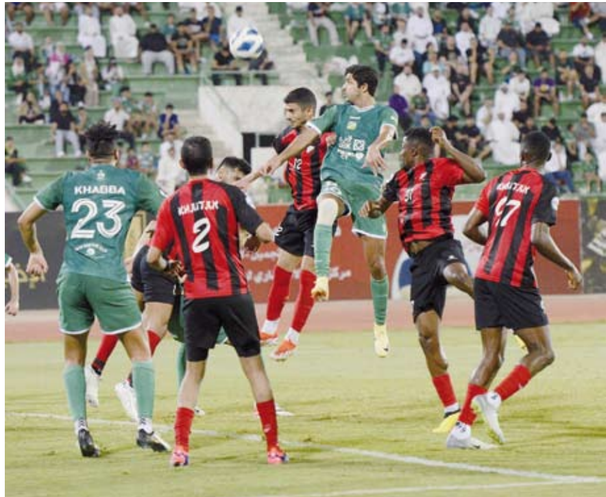
الإثارة حاضرة في لقاء العربي وخيطان