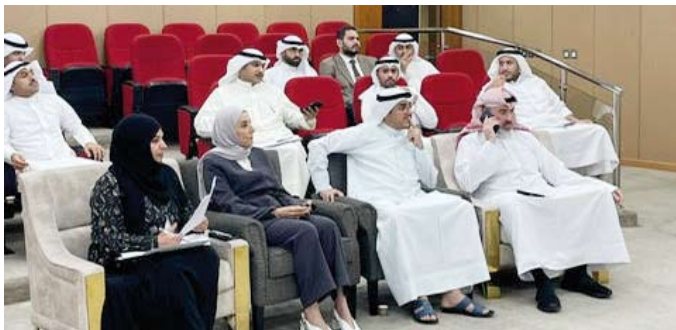
متابعة من الحضور