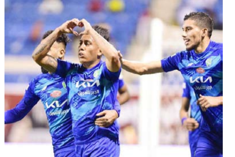
احتفال لاعبي الفتح