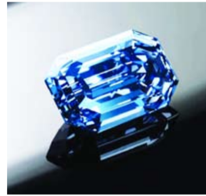
أكبر ماسة زرقاء

أعلنت دار سوذبيرز للمزادات، أمس، عن طرح ماسة The De Beers Cullinan Blue في شهر أبريل المقبل، والتي تعد واحدة من أكثر الماسات الزرقاء قيمة يتم عرضها في مزاد. وأعلن أحمد بن سليم، الرئيس التنفيذي الأول والمدير التنفيذي لمركز دبي للسلع المتعددة ورئيس مجلس إدارة بورصة دبي للماس، حسب صحيفة «البيان» عن عرض الماسة النادرة في بورصة دبي للماس. ويُقدر سعر الماسة الزرقاء بأكثر من 48 مليون دولار (176 مليون درهم)، وهي ماسة زرقاء مقصوصة بشكل مندرج عيار 15.10 قيراط وأكبر ماسة زرقاء زاهية تظهر على الإطلاق في مزاد. وتعتبر الماسات الزرقاء المهمة كهذه نادرة بشكل استثنائي، حيث تم طرح خمسة أمثلة فقط من الماسات التي يزيد عيارها على 10 قيراط في المزادات.