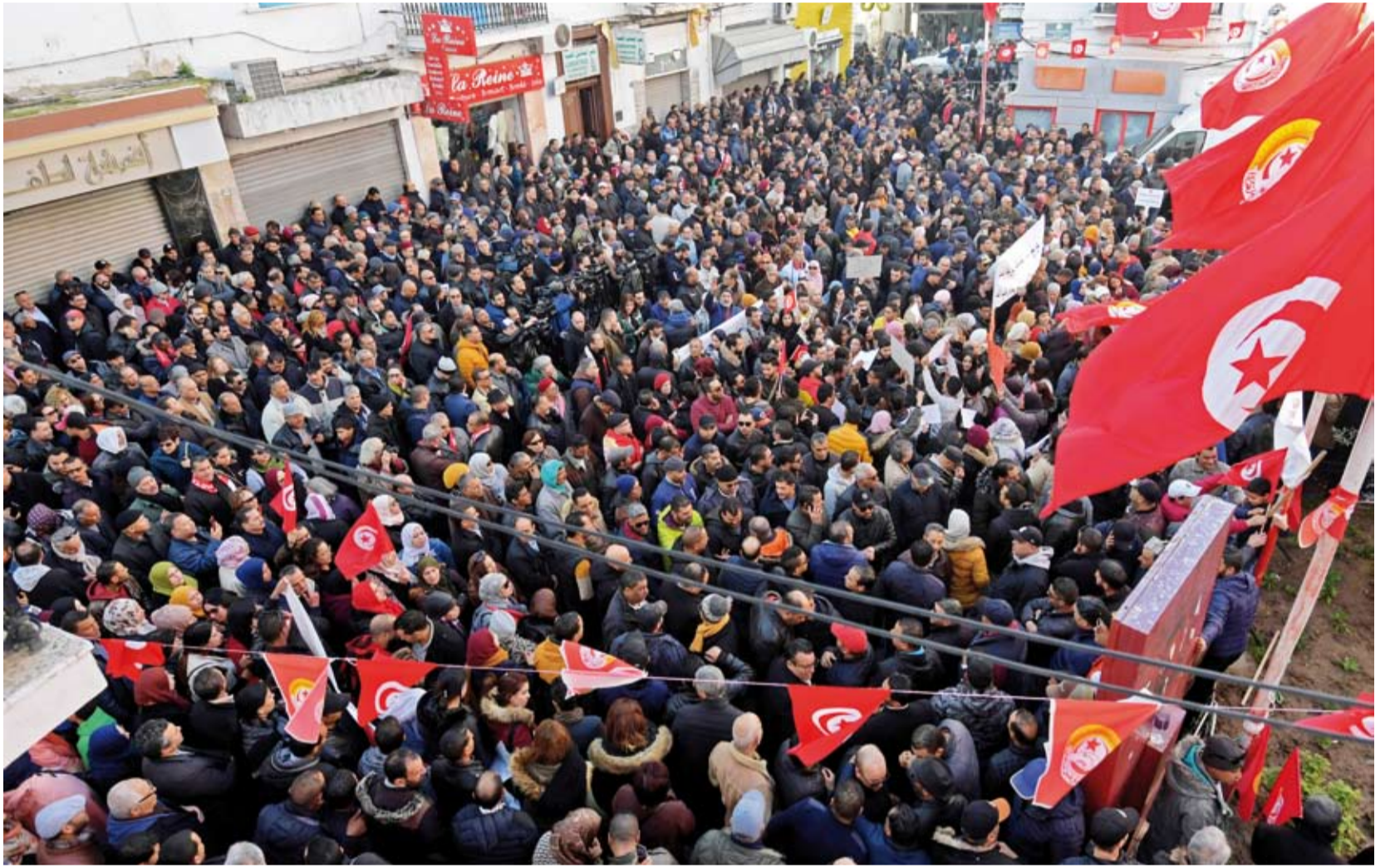
احتجاجات في تونس