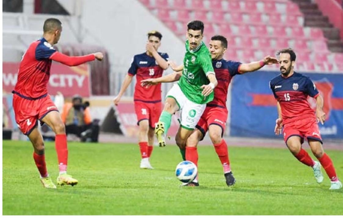
لقطة من مباراة العربي الصليبيخات

أكمل فريقا العربي والكويت الثلاثاء عقد نصف نهائي بطولة كأس سمو ولي العهد لكرة القدم في نسختها الـ 29 بفوزيهما على الصليبيخات والشباب تواليا.