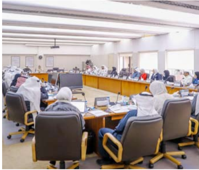
جانب من اجتماع اللجنة

أما فيما يتعلق بمصروفات جائحة كورونا التي خصصت لوزارة