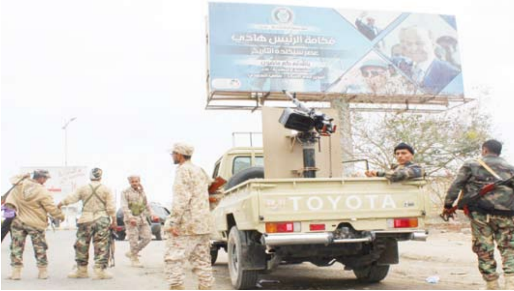
القتال في اليمن

عيس أو في مديرية حرض الحدودية. إلى ذلك، أفاد الإعلام العسكري الرسمي للجيش اليمني، باستمرار المعارك غربي مدينة تعز، وقال المركز الإعلامي للقوات المسلحة اليمنية: «إن قتلنا وجرحي من ميليشيا الحوثي الإيرانية سقطوا ببنيران الجيش في جبهة الأحطوب غرب تعز»، وكان الموقع الرسمي للجيش (سبتمبر، نت) قد ذكر أن الميليشيات الحوثية تكبدت خسائر كبيرة في العتاد والأرواح في معارك مع الجيش والمقاومة الشعبية جنوبي محافظة مارب.