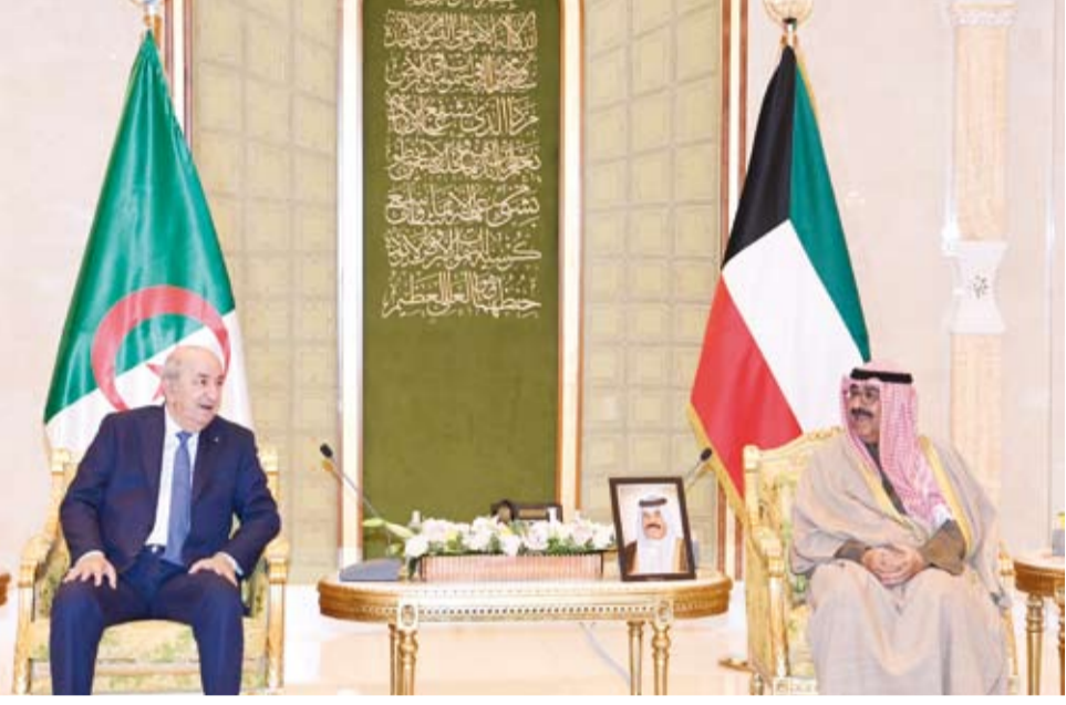
سمو ولي العهد والرئيس الجزائري خلال جلسة المباحثات الرسمية