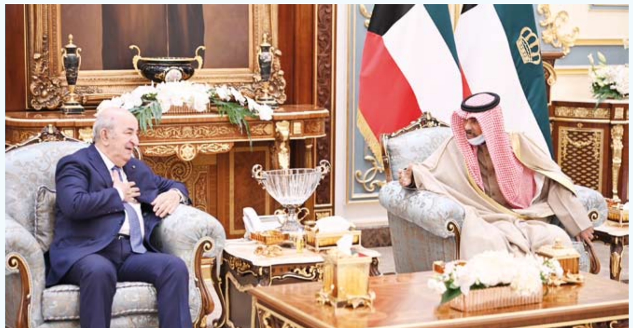
جانب من لقاء صاحب السمو الأمير ورئيس الجزائر أمس في دار يمامة

استقبل صاحب السمو أمير البلاد الشيخ نواف الأحمد بدار يمامة ظهر أمس، الرئيس عبدالمجيد تبون رئيس الجمهورية الجزائرية الديمقراطية الشعبية الشقيقة والوفد الرسمي المرافق له وبحضور سمو ولي العهد الشيخ مشعل الأحمد وذلك بمناسبة زيارته الرسمية للبلاد. وتم تبادل الأحاديث الودية الطيبة التي عكست عمق العلاقات الإخوية الراسخة التي تربط البلدين والشعبين الشقيقين وسبل دعمها وتعزيزها وأقام سمو ولي العهد الشيخ مشعل الأحمد بخصر بيان ظهر أمس مادية غداء على شرف تبون والوفد الرسمي المرافق له.