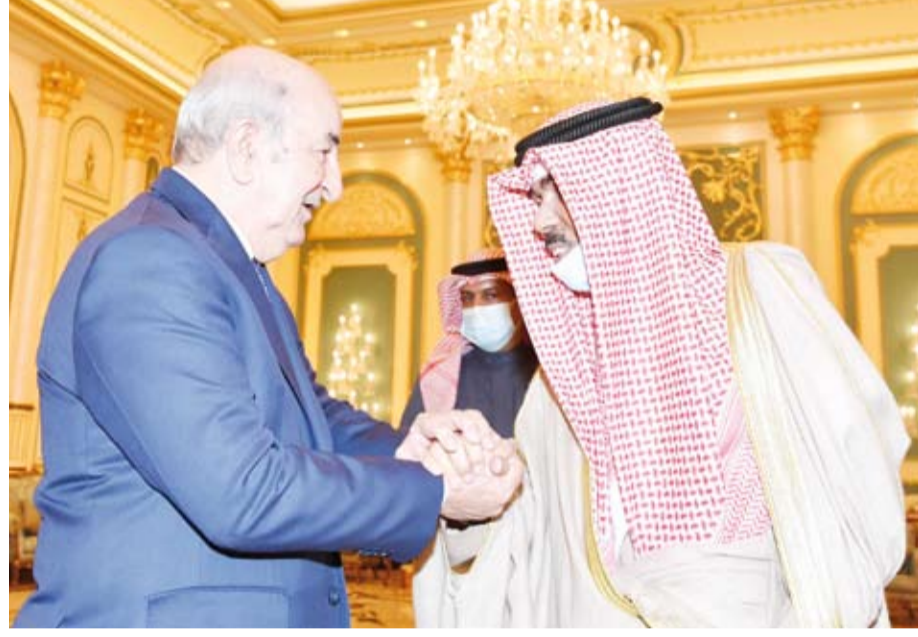
سمو الأمير يستقبل الرئيس الجزائري

استقبل صاحب السمو أمير البلاد الشيخ نواف الأحمد، بدار يمامة، ظهر أمس، الرئيس عبدالمجيد تبون رئيس الجمهورية الجزائرية الديمقراطية الشعبية الشقيقة والوفد الرسمي المرافق ل فخامته، وبحضور سمو ولي العهد الشيخ مشعل الأحمد، وذلك بمناسبة زيارته الرسمية للبلاد. وقد تم تبادل الأحاديث الودية الطيبة التي عكست عمق العلاقات الأخوية الراسخة التي تربط البلدين والشعبين الشقيقين وسبل دعمها وتعزيزها بين دولة الكويت والجمهورية الجزائرية الديمقراطية الشعبية الشقيقة على كافة الأصعدة وفي مختلف المجالات بما يخدم مصالحهما المشتركة في إطار ما يجمعهما من روابط وثيقة. وحضر المقابلة وزير شؤون الديوان الأميري الشيخ محمد العبدالله ورئيس الديوان الأميري الشيخ مبارك الفيصل. كما استقبل سمو ولي العهد الشيخ مشعل الأحمد، بقصر بيان، ظهر أمس، الرئيس عبدالمجيد تبون رئيس الجمهورية الجزائرية الديمقراطية الشعبية الشقيقة والوفد الرسمي المرافق ل فخامته، وذلك بمناسبة زيارته الرسمية للبلاد. وقد عقدت المباحثات الرسمية بين الجانبين، حيث ترأس الجانب الكويتي سمو ولي العهد الشيخ مشعل الأحمد وسمو الشيخ صباح الخالد رئيس مجلس الوزراء وكبار المسؤولين بالدولة. وعن الجانب الجزائري الرئيس عبدالمجيد تبون رئيس الجمهورية