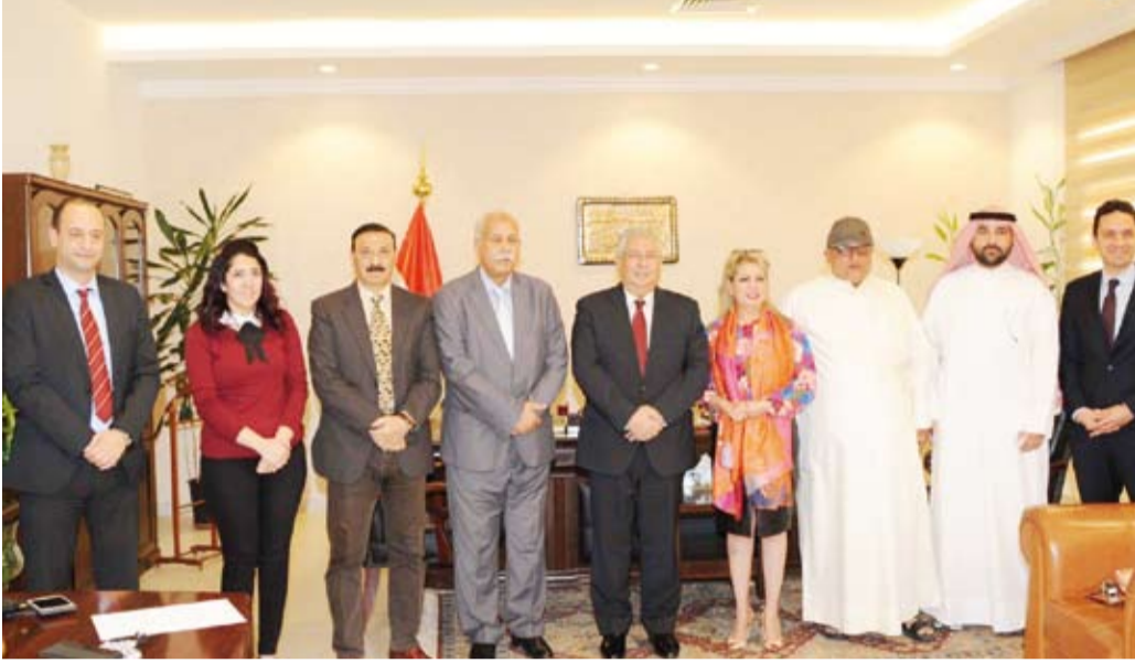
السفير المصري خلال لقائه الصحفيين في المؤتمر الصحفي

تضاهي نظيرتها في العالم الغربي، لافتاً إلى أن مصر أنشأت ألف جسر حتى الآن ورفع قدرة 40 ألف كيلو متر من الطرق إضافة إلى صرف 10 آلاف كيلو متر من الطرق الجديدة فضلاً عن إنشاء 64 مدينة جديدة من 14 مدينة ذكية .