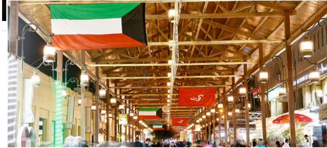
اعلام الكويت ترفرف في أزوقة سوق المباركية

واستعد سوق المباركية أحد أعرق مناطق الكويت التراثية وتزين وارتيدي حلة الأعياد الوطنية وإذ انت محلاته بالأزياء الشعبية التي تعبر عن عمق التراث الكويتي والمزينة بالوان علم الكويت لتعانق الأعلام التي تزينت بها أزوقة السوق فشكلت لوحة فنية بديعة ترمس البهجة والسرور على الوجوه.