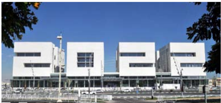
صورة لمبنى إيكونك 2022

الأكثر إبهارا في قطر. وأوضح «كانت فكرة المبنى رائعة وشكلت تحديا كبيرا وحرصت على أن تكون أبعاد التصميم مشابهة لعملية تصميم الاستادات والتي عادة ما يبدو شكلها المعماري المميز واضحا عند تصويرها من أعلى كما أردت التأكد من قراءة الأرقام بوضوح من كافة الزوايا ولهذا السبب يضم المبنى خمس واجهات تظهر جميعها الرقم 2022 ويمكن قراءته من كافة الجوانب».