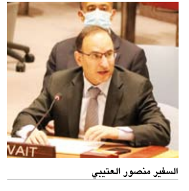
السفير منصور العتيبي

القرارات يعزز من مصداقية وفعالية المجلس المكلف وفقاً لميثاق الأمم المتحدة بصيانة السلم والأمن الدوليين. وقال: إن «اجتماع اليوم يمثل فرصة لتقديم الشكر والتعبير عن تقديرنا وامتناننا لأعضاء مجلس الأمن ولأعضاء مجلس إدارة لجنة التعويضات ومسؤولي الأمانة العامة للجنة وكافة العاملين فيها». وأعرب عن شكره للمملكة المتحدة حامل القلم لهند الحسنة بين العراق والكويت على تعاونهم مع الكويت وعلمهم الدؤوب وجهودهم الحثيثة والمستمرة للاضطلاع بالمهام والمسؤوليات المناطين بها طوال العقود الثلاثة الماضية وإنجازهم لولايتهم على أكمل وجه كما جاء في مقرر اللجنة رقم 277 الذي تم اعتماده في التاسع من فبراير الحالي.