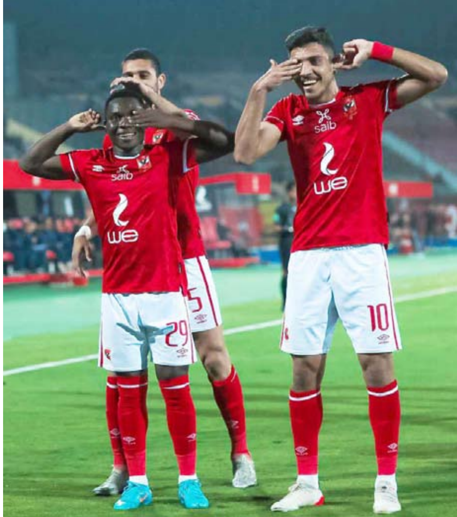
جانب من احتفال لاعبي الأهلي