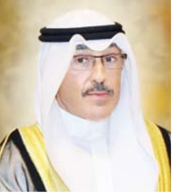
الشيخ فواز الخالد

هنا محافظ «الأحمدي»، الشيخ فواز الخالد، القيادة السياسية للبلاد بمناسبة حلول الذكرى الحادية والستين للاستقلال، وذكرى التحرير الحادية والثلاثين. وأعرب الشيخ فواز الخالد في تهنئته التي رفعها إلى صاحب السمو أمير البلاد الشيخ نواف الأحمد، وسمو ولي عهد الأمين الشيخ مشعل الأحمد، وسمو رئيس مجلس الوزراء الشيخ صباح الخالد، عن أخلص آيات التهاني والتبريكات، بهاتين المناسبتين العزيزتين على قلوب الجميع. كما عبر الخالد عن التطلع إلى الاستلهاج الدائم لروح الاستقلال والتحرير في الوقت