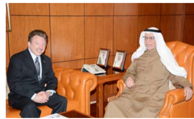
جانب من الاستقبال المصدرة، حيث أعرب عن استعداد الغرفة لتقديم كافة خدماتها للتوصل إلى نتائج إيجابية وتحقيق المصالح المشتركة بين القطاع الخاص في كلا

البلدين الصديقين. مؤكداً أن القطاع الخاص الكويتي له خبرات وتجارب استثمارية ناجحة ونموذجية في العديد من دول العالم. من جانبه، أعرب حمود عن لزيارة الغرفة ممناً جهودها الكبيرة في سبيل توطيد العلاقات مع أمريكا، مشيداً بالتعاون الإيجابي الذي تقدمه غرفة الكويت للغرفة العربية الأمريكية، مؤكداً حرصه على تعميق العلاقات الاقتصادية والتجارية، بهدف ترسيخ وتعزيز وتنمية التعاون الاقتصادي والتجاري لما فيه تحقيق المصالح المتبادلة لقطاع الأعمال في كلا البلدين، من خلال التشجيع لإقامة شركات استراتيجية لفتح آفاق اقتصادية جديدة.