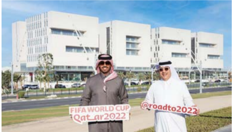
الشيخ ناصر بن حمد آل ثاني صاحب فكرة إيكونك 2022