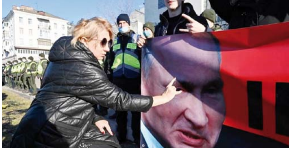
احتجاجات شعبية في أوكرانيا رداً على تصعيد موسكو

قالت روسيا أمس أنها سترد على العقوبات التي فرضها الغرب عليها بشكل محسوب النتائج ومؤلم للجانب الأمريكي مشيرة إلى أن هدف العقوبات الغربية يكمن في ارغام موسكو على تغيير نهجها. ووصفت وزارة الخارجية الروسية في بيان العقوبات ضد موسكو بأنها «غير فعالة وغير بناءة» مشددة على أن روسيا برهنت أنها قادرة على تقليص تداعيات هذه العقوبات «التي لن تؤثر على موقفها الحازم بالدفاع عن مصالحها». وأشارت إلى أن الولايات المتحدة «لم تعد تملك في مخزون السياسة الخارجية سوى التهديدات والتخويف والابتزاز من أجل فرض تصوراتها حول النظام العالمي على الآخرين».