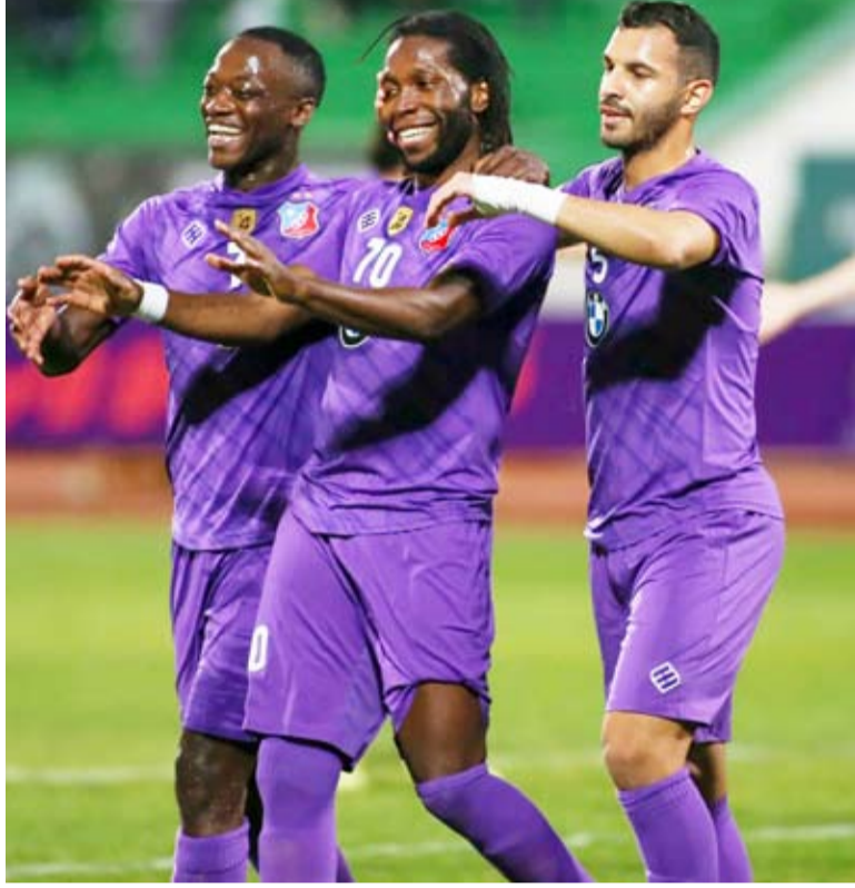
احتفال لاعبي الكويت