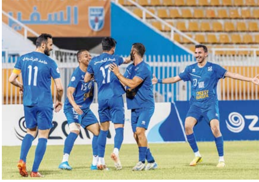
احتفال لاعبي التضامن بالهدف