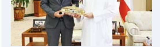
محافظ الجهراء خلال استقباله سفير قبرغيزستان

استقبل محافظ الجهراء حمد الحبيشي، في ديوان عام المحافظة، الدكتور نورلان توفو بابيف سفير جمهورية قبرغيزستان الصديقة لدى الكويت. وجرى خلال اللقاء تبادل الأحاديث الودية وبحث عدد من الموضوعات ذات الاهتمام المشترك، إلى جانب استعراض سبل تعزيز التعاون والتنسيق مع مختلف الجهات والبعثات الكويت وجمهورية قبرغيزستان. وأكد محافظ الجهراء حرص محافظة الجهراء على دعم أوجه التعاون والتنسيق مع مختلف الجهات والبعثات الدبلوماسية، بما يعكس عمق العلاقات التي تجمع دولة الكويت بالدول الصديقة، ويسهم في تعزيز مجالات التعاون المشترك. من جانبه، أعرب السفير عن شكره وتقديره للمحافظ على حسن الاستقبال، مشيداً بما تشهده محافظة الجهراء من اهتمام وتطور، ومنتظياً لدولة الكويت وشعبها دوام التقدم والازدهار.