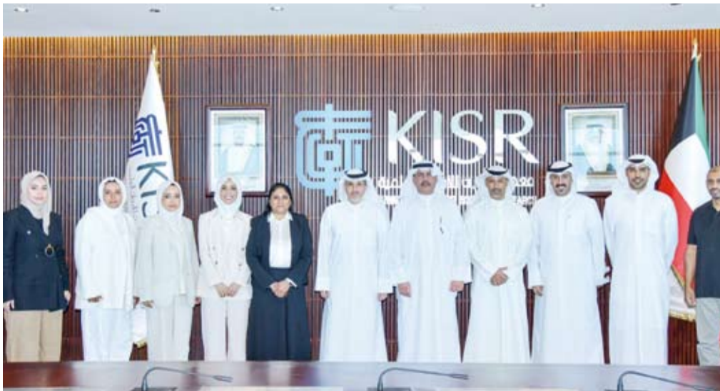
لفظة جماعية لمسؤولي وباحثي معهد الكويت للأبحاث وشركة الصناعات الوطنية

وقع معهد الكويت للأبحاث العلمية، أمس، مذكرة تفاهم مع شركة الصناعات الوطنية لتعزيز التعاون في مجالات البحث والتطوير والابتكار بقطاع البناء والبنية التحتية بما ينسجم مع مستهدفات (رؤية دولة الكويت 2035).