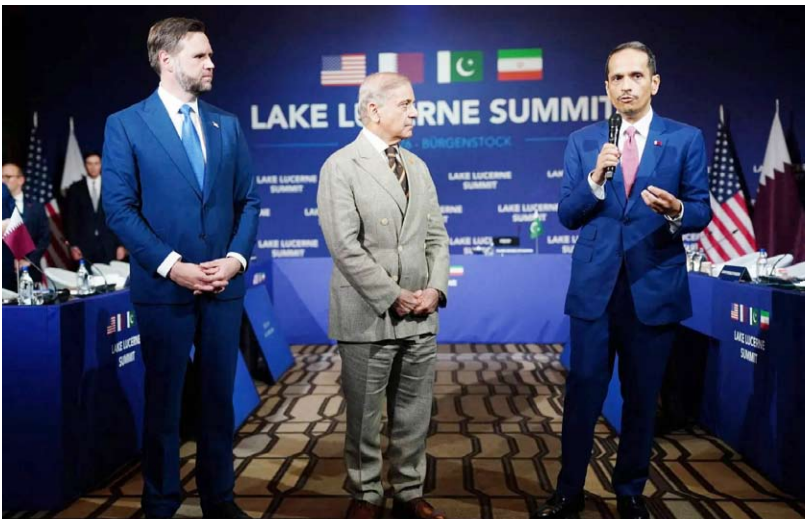
شهباز شريف يتوسط الشيخ محمد آل ثاني وجيه دي فانس

أعلنت قطر وباكستان اختتام الجولة الأولى من المحادثات رفيعة المستوى بين الولايات المتحدة وإيران، التي عُقدت في منتجع بورغنشتوك بسويسرا في إطار مذكّرة التفاهم الموقعة في إسلام آباد. وقال بيان قطري باكستاني مشترك إن أعمال اليوم الأول من قمة بحيرة لوسيرن جرت في أجواء إيجابية وبإسناد، وأسفرت عن إحراز تقدم مشجّع، مشيراً إلى إنشاء آلية لمواصلة المحادثات الفنية بين الأطراف. وأوضح البيان أن الأطراف اتفقت -استناداً إلى مذكّرة التفاهم- على إنشاء لجنة رفيعة المستوى تتولى الإشراف السياسي على جهود الوساطة، على أن يرفع كبار المفاوضين تقارير دورية إليها، إلى جانب قيادتهما مجموعات عمل متخصصة تُعنى بالملف النووي والعقوبات والمتابعة وتسوية النزاعات، بما يضمن التقديف الفعال لمذكّرة التفاهم، فضلاً عن بحث المسائل الأخرى ذات الصلة. وأضاف أن اللجنة رفيعة المستوى اتفقت على خريطة طريق تهدف إلى التوصل إلى اتفاق نهائي خلال 60 يوماً، تمهيداً للبدء الفوري في جولة جديدة من المحادثات الفنية. كما أشار البيان إلى إنشاء قناة اتصال بين الأطراف -خلال الفترة المنصوص عليها في الفقرة الخامسة من مذكّرة التفاهم- بهدف تفادي الحوادث وسوء الفهم، وضمان العبور الآمن للسفن التجارية عبر مضيق هرمز. وفيما يتعلق ببلقان، اتفق الطرفان على إنشاء مجموعة عمل لتفادي