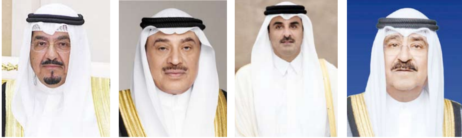
سمو أمير البلاد الشيخ مشعل الأحمد سمو ولي العهد الشيخ صباح الخالد سمو أمير دولة قطر سمو الشيخ تميم بن حمد آل ثاني أمير دولة قطر سمو الشيخ أحمد العبد الله

بعث صاحب السمو أمير البلاد الشيخ مشعل الأحمد ببرقية تعزية إلى صاحب السمو الشيخ تميم بن حمد آل ثاني أمير دولة قطر الشقيقة عبر فيها سموه عن خالص تعازيه وصادق مواساته بضحايا حادث الانفجار الذي وقع في أحد المصانع بمنطقة رأس لفان الصناعية وأسفر عن سقوط عدد من الضحايا والمصابين. سائلاً سموه المولى تعالى أن يتغمدهم بالصبر وحسن العزاء ويمن على المصابين بسعة الشفاء والعافية. وبعث سمو ولي العهد الشيخ صباح الخالد ببرقية تعزية إلى صاحب السمو الشيخ تميم بن حمد آل ثاني أمير دولة قطر الشقيقة ضمنها سموه خالص تعازيه وصادق مواساته بضحايا حادث الانفجار الذي وقع في أحد المصانع بمنطقة رأس لفان الصناعية.