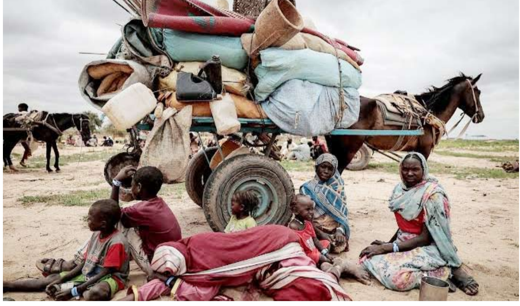
عائلة سودانية فرت من الصراع في مورني بالقبليم دارفور

وفي سياق متصل، دعا الاتحاد الأوروبي قوات الدعم السريع إلى الوقف الفوري لهجماتها على مدينة الأبيض بولاية شمال كردفان جنوبي البلاد، وشدد بيان مكتب العلاقات الخارجية في الاتحاد على ضرورة وضع حد لقتل المدنيين، وأعمال العنف الموجهة ضد المسيرات انقضاضية على مدينة الدنقج بولاية جنوب كردفان. وذكر الجيش أن الهجوم استهدف عدداً من المواقع، من بينها محلات تجارية في محيط سوق الدنقج، مشيراً إلى أن الهجوم سبقه قصف بالمدفعية الثقيلة للمدينة.