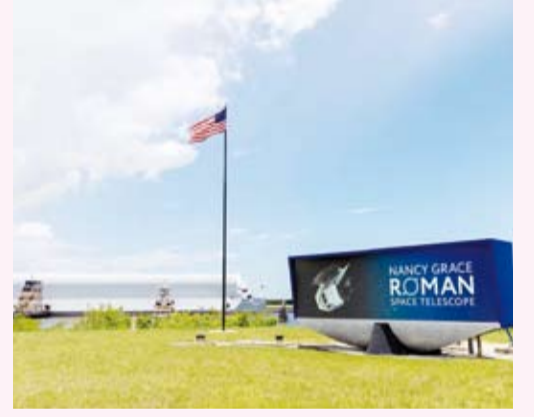
تلسكوب «نانسي غريس رومان»

بدأت وكالة الفضاء الأمريكية «ناسا» الاستعدادات النهائية لإطلاق تلسكوب «نانسي غريس رومان» الفضائي، أحد أبرز مشاريعها الفلكية خلال العقد الحالي، وذلك بعد وصوله إلى ولاية فلوريدا استعداداً للإطلاق المقرر في أغسطس المقبل. وأوضحت الوكالة أن التلسكوب وصل إلى مركز كينيدي للفضاء بعد استكمال عمليات الدمج والاختبارات، حيث سيخضع لسلسلة من الفحوصات والإجراءات النهائية للتأكد من جاهزيته للإطلاق. ومن المقرر أن يجري الفنيون اختبارات على الألواح الشمسية وأنظمة العزل والحماية الحرارية، إلى جانب تزويد المركبة بالوقود اللازم استعداداً للرحلة الفضائية. وبيّنت «ناسا» أن إطلاق التلسكوب سيتم في 30 أغسطس المقبل على متن صاروخ «فالكون هيفي» التابع لشركة «سبيس إكس» من منصة الإطلاق 39A بمركز كينيدي، مشيرة إلى أن المشروع يتقدم على الجدول الزمني المحدد بنحو ثمانية أشهر. وبعد إطلاقه، سيتجه التلسكوب إلى نقطة لاغرانج الثانية (L2)، حيث سيجري عمليات رصد واسعة النطاق تهدف إلى دراسة مليارات المجرات ومئات الآلاف من الكواكب خارج المجموعة الشمسية، إلى جانب المساهمة في فهم طبيعة الطاقة المظلمة التي يعتقد أنها تقف وراء التوسع المتسارع للكون. ويضم التلسكوب كاميرا رئيسية بدقة 300 ميجابكسل، إضافة إلى تقنيات متطورة تنتج دراسة الكواكب الخارجية والأجرام السماوية البعيدة في نطاق الأشعة تحت الحمراء، ما يجعله أحد أهم المراصد الفضائية التي تعمل عليها ناسا للإجابة عن أسئلة أساسية تتعلق بأصل الكون وتطوره.