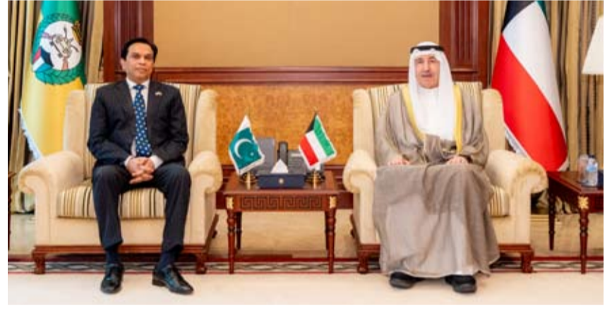
الشيخ مبارك الحمد مستقبلاً سفير باكستان د. ظفر اقبال

بحث رئيس الحرس الوطني الشيخ مبارك الحمد مع سفير جمهورية باكستان الإسلامية الصديقة لدى دولة الكويت الدكتور ظفر اقبال، موضوعات مشتركة. وقال «الحرس الوطني» في بيان صحفي أمس: إن الشيخ