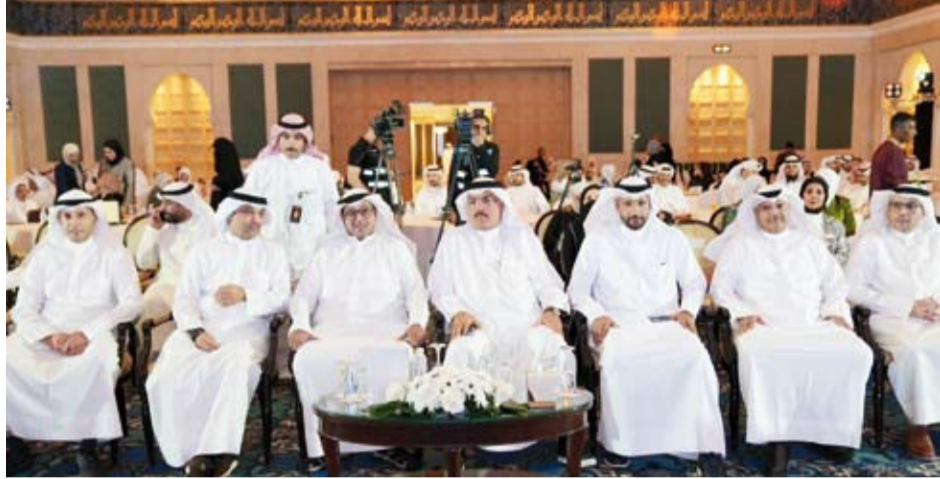
وزير التربية مع قيادات وزارة التربية وجمعية المعلمين