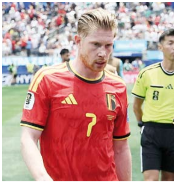
دي برون حزين بعد المباراة

وفيما غاب الجناح الماهر جبريمي دو كوستو عن تشكيلة بلجيكا بعد معاناته من مشكلات في التنفس، لعب المهاجم روميلو لوكاكو أساسياً أمام كينغ دي برون ولياندرو فروسار.