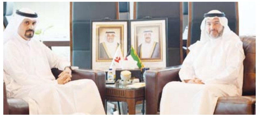
الشيخ المهندس حمود المبارك مع الشيخ الدكتور مشعل جابر الأحمد

قطاع الطيران المدني. وأضافت أن الجانبين، بحثاً سبل دعم الخطط التنموية للدولة وتعزيز المشاريع المرتبطة بقطاع النقل الجوي بما يساهم في تعزيز مكانة دولة الكويت مركزاً إقليمياً للنقل الجوي والخدمات اللوجستية.