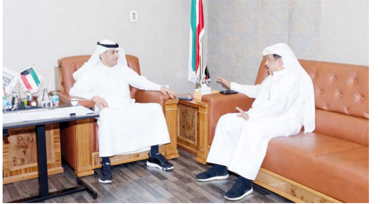
د.طارق الجلاهمة يبحث آفاق التعاون مع رئيس الاتحاد الآسيوي لكرة اليد بدر نياض

برامج إعداد وتأهيل الكوادر الفنية والإدارية والتكيفية بما يواكب أحدث التطورات في اللعبة ويسهم في رفع مستوى الأداء والاحترافية. وأضاف أن الكويت تمتلك المقومات والإمكانات اللازمة لاستضافة البطولات والفعاليات الرياضية القارية الكبرى مؤكداً أن المرحلة المقبلة ستشهد العمل على توسيع مجالات التعاون مع الاتحاد الآسيوي لكرة اليد بما يعكس إيجاباً على تطوير اللعبة وصقل الكوادر الوطنية وتعزيز حضور الكويت على خريطة الرياضة الآسيوية. من جانبه أشاد نياض بالدعم الذي توليه دولة الكويت للقطاع الرياضي مشمناً الجهود المبذولة لتطوير البنية الرياضية وتعزيز مشاركة الشباب في الأنشطة الرياضية. وأكد استمرار التعاون والتنسيق خلال المرحلة المقبلة بما يخدم أهداف تطوير كرة اليد الآسيوية ويعزز من مكانة كرة اليد في المنطقة.