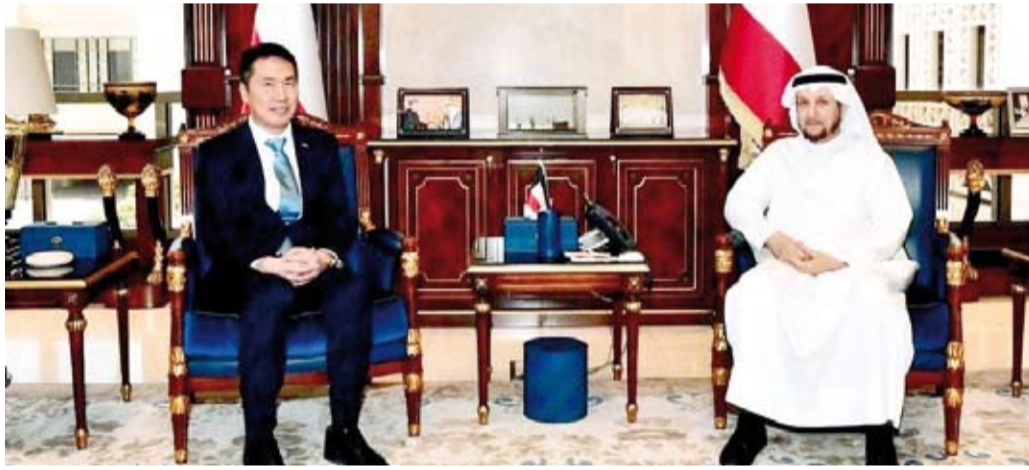
نائب رئيس مجلس الوزراء ووزير الدولة لشؤون مجلس الوزراء شريدة المعوشي خلال استقباله سفير الصين يانغ شين

يسهم في دعم أواصر الصداقة والتعاون بين البلدين. المجالات إضافة إلى مناقشة عدد من الموضوعات ذات الاهتمام المشترك بما