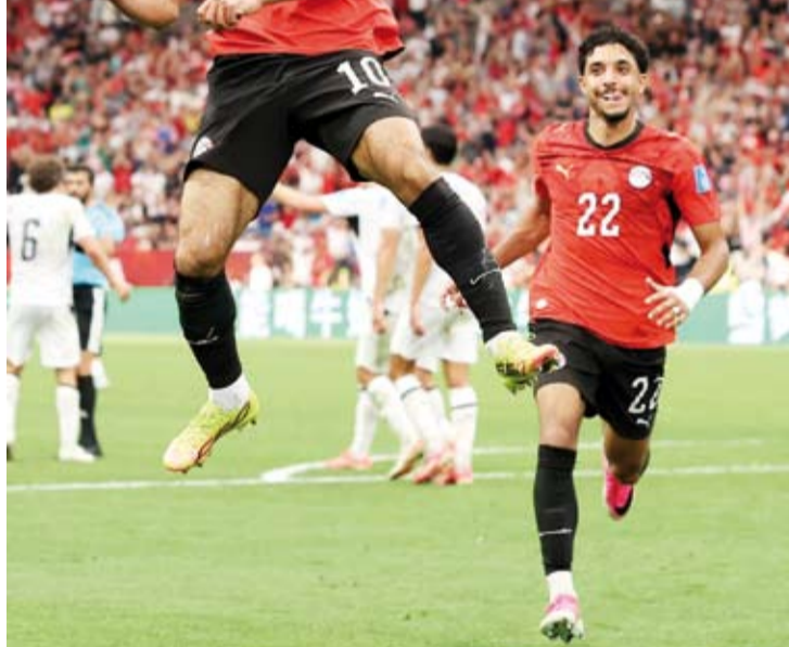
صلاح حصد رجل المباراة أمام نيوزيلندا

تماماً في الشوط الثاني ليدرك مصطفى عبد الرؤوف (زيكو) التعادل في الدقيقة 58 بضربة رأس رائعة من داخل المنطقة بعد تمريرة محمد هاني العرضية من الجهة اليمنى. وأضاف صلاح الهدف الثاني في الدقيقة 67 بعد هجمة منغلقة انتهت بتمريرة بالكعب من زيكو لصالح داخل المنطقة ليعضها الأخير بشكل رائع في الشباك. وأحرز البديل محمود حسن (تريزيغيه) الهدف الثالث في الدقيقة 82 بضربة رأس بعد ركلة ركنية من الجهة اليسرى فغذاها صلاح. وبذلك يتصدر منتخب مصر الذي أهدى العرب فوزهم الثاني في المونديال الحالي بعد المغرب، المجموعة السابعة برصيد أربع نقاط يليه إيران وبلجيكا بنقطتين لكل منهما وتأتي نيوزيلندا في المركز الأخير بنقطة واحدة.