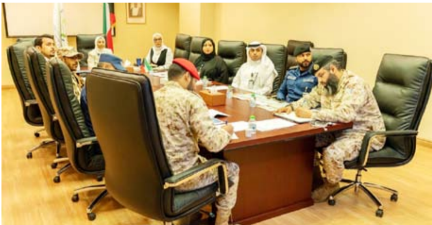
جانب من اجتماع هيئة الغذاء وامان

الهيئة العامة للغذاء والتغذية تستعرض منظومة إدارة الطوارئ والأزمات أمام فريق إنشاء المركز الوطني لإدارة الأزمات والكوارث