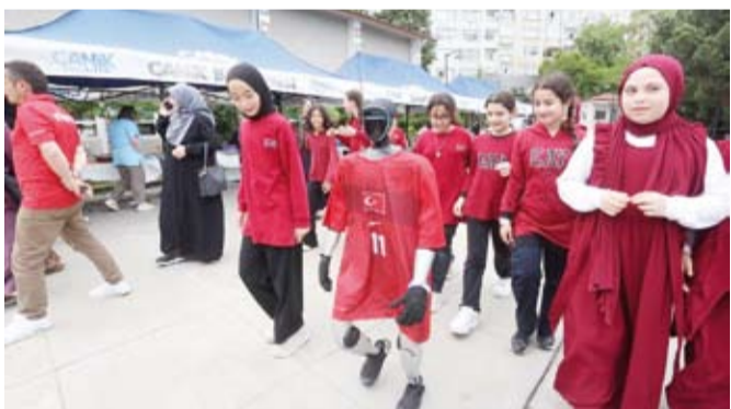
الروبوت «جانيكمان» وسط الطالبات

الروبوت "جانيكمان" في مجالات الحياة يوماً بعد آخر، لافتاً إلى أنه سيشارك قريباً في برامج التدريب الصيفية والأنشطة العلمية، بما يشمل ورش العمل والتجارب المخبرية.