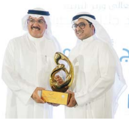
وزير التربية م. سيد جلال الطيباني خلال التكريم

وأعرب عن خالص الشكر والتقدير لجمعية المعلمين الكويتية وإدارتها وكوادرها التربوية والحاضرين وجميع القائمين على البرامج الأكاديمية التربوية تقديراً لشراكتهم الفاعلة مع وزارة التربية ودورهم المستمر في دعم التنمية المهنية للعاملين في الميدان التربوي وخدمة التعليم في دولة الكويت.