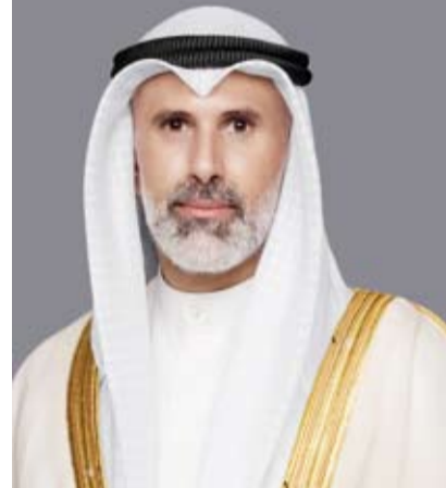
الشيخ جراح الجابر

أجرى وزير الخارجية الشيخ جراح الجابر، اتصالاً هاتفياً، أمس، مع وزير الخارجية والتعاون الدولي والمصريين بالخارج في جمهورية مصر العربية الشقيقة الدكتور بدر عبد العاطي.