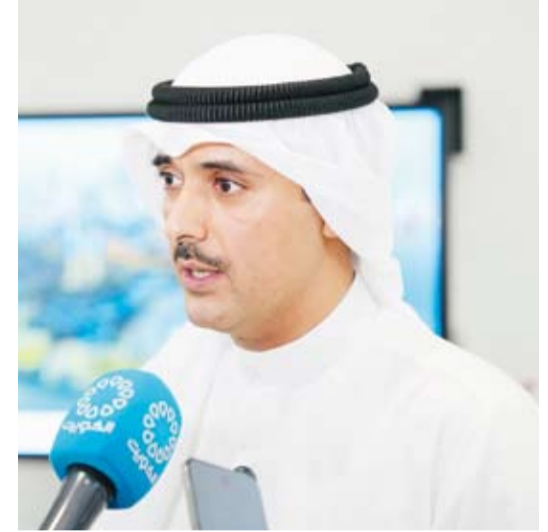
مहाفظ الاحمدي الشيخ حمود جابر الاحمد متحدثا

دعا محافظ الاحمدي ورئيس لجنة مبادرات التنمية الخضراء الشيخ حمود جابر الاحمد لمنتسبي كلية العمارة بجامعة الكويت من هيئة تدريسية وطلبة للمشاركة بتقديم تصاميم وافكار التي تخدم أعمال اللجنة والتي لها اثر ايجابي في المجتمع. جاء ذلك خلال تقديم الشيخ حمود الجابر محاضرة بعنوان (دعوة للمشاركة بمبادرات التنمية الخضراء) في كلية العمارة بجامعة الكويت في منطقة العدلية امس الاثنين بحضور ممثل مدير جامعة الكويت الدكتور دينا الميلم وامين عام جامعة الكويت بالانابة الدكتور ثقل العجمي وامين عام المجلس الوطني للثقافة والفنون والآداب ونائب رئيس لجنة مبادرات التنمية الخضراء الدكتور محمد الجسار.