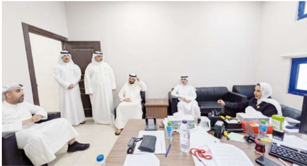
د. أمثال الحويلة خلال جولتها التفتيشية في المركز

قامت وزيرة الشؤون الاجتماعية وشؤون الأسرة والطولة الدكتورة أمثال الحويلة، أمس، بزيارة تفقدية إلى مركز تنمية المجتمع في منطقة اليرموك التابع لإدارة المرأة والطولة وتنمية المجتمع وذلك للاطلاع على سير العمل ومستوى الخدمات المقدمة للمواطنين.