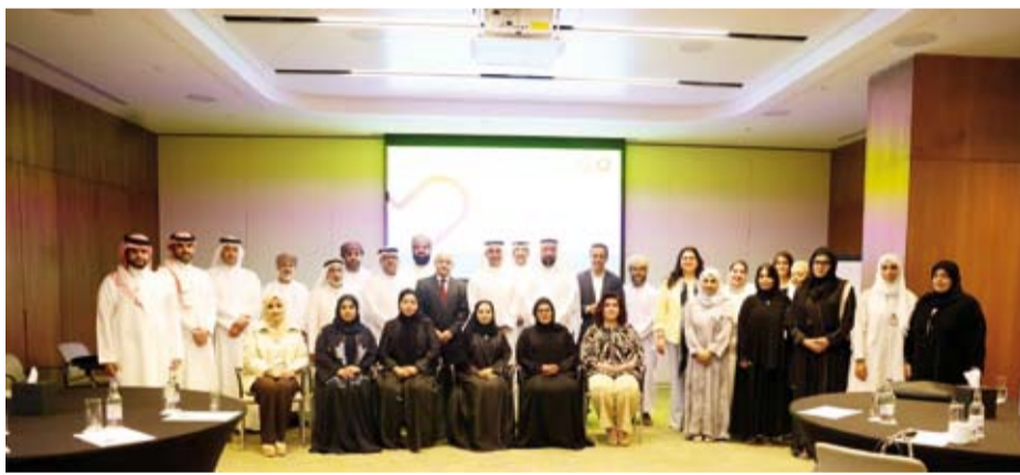
لقطة جماعية للمشاركين

استضافت الكويت ورشة عمل تدريبية لأعضاء اللجان الفنية بدول مجلس التعاون الخليجي لبرنامج (وافد) الخاص بفحص العمالة الوافدة بتنظيم مشترك بين إدارة الصحة العامة بوزارة الصحة ومجلس الصحة بدول (التعاون) تعزيراً للتعاون الخليجي المشترك وتوحيد الإجراءات الصحية.