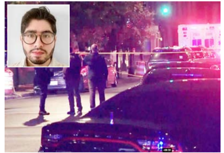
تشديد الإجراءات الأمنية عقب الحادث وفي الإطار منفذ الهجوم