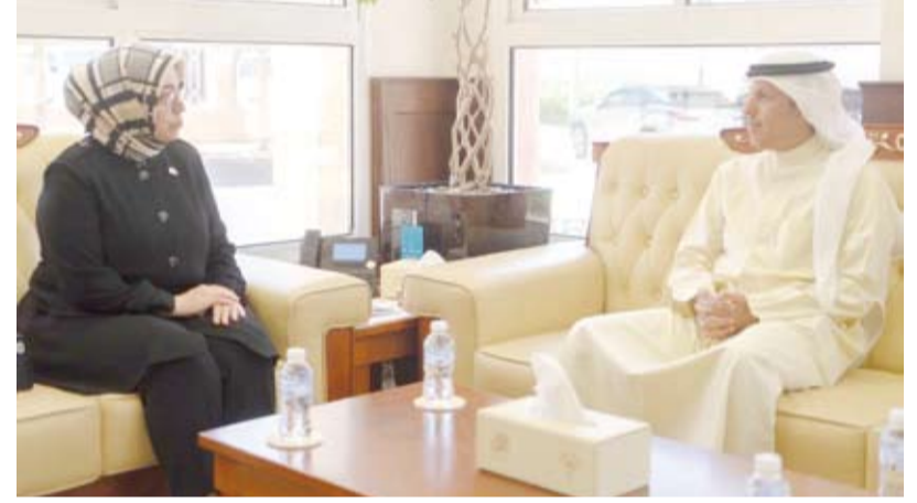
د. محمد الوسمي خلال جلسة المباحثات مع السفارة التركية توبا نور سونمز

بحث وزير الأوقاف والشؤون الإسلامية الدكتور محمد الوسمي مع سفيرة الجمهورية التركية لدى دولة الكويت توبا نور سونمز تعزيز التعاون المشترك بين البلدين. وذكرت وزارة الشؤون الإسلامية في بيان لـ (كونا) أمس، أنه تم خلال اللقاء بحث أوجه التعاون الثنائي بين الكويت وتركيا وسبل تعزيز التعاون في العلاقات وتبادل الخبرات في المجالات ذات الاهتمام المشترك الخاصة بتطوير العمل الوقفي بالشؤون