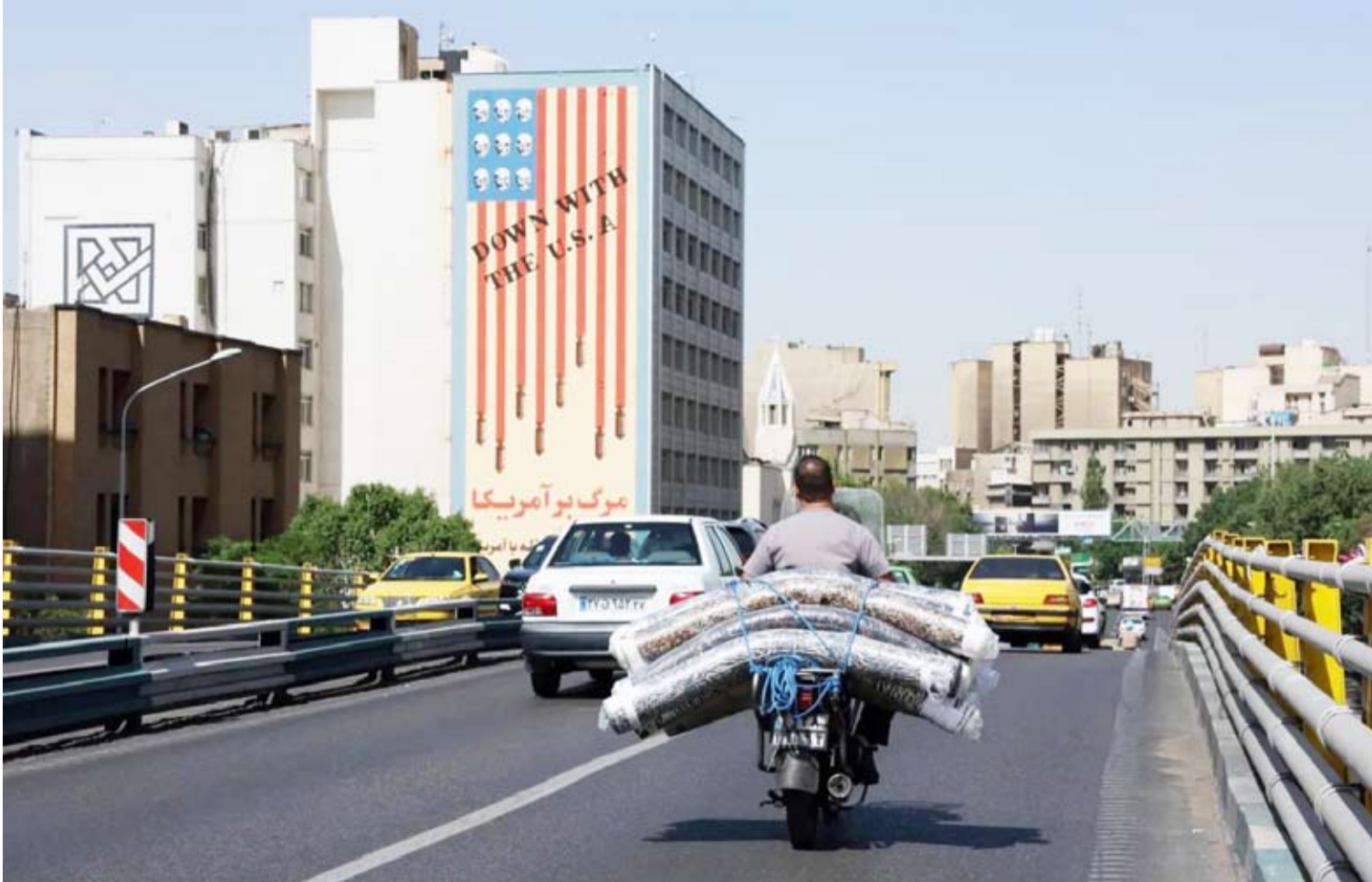
جارية مناهضة لأميركا في شارع كريم خان زند

أعلن وزير الخارجية العُماني، بدر البوسعيد، أن الجولة الخامسة من المحادثات الإيرانية - الأميركية ستُعقد، اليوم الجمعة، في روما، وذلك في ظل تصاعد التوترات بشأن ملف تخصيب اليورانيوم. وجاء ذلك بعد أن أبدى نظيره الإيراني، عباس عراقجي، تحفظات على المشاركة، مع تأكيد مسك طهران بخيار التفاوض وعدم انسحابها من المسار الدبلوماسي. وبعد أربع جولات من المحادثات التي تهدف إلى كبح البرنامج النووي الإيراني مقابل تخفيف العقوبات، لا تزال هناك العديد من العقبات التي تعترض طريق المحادثات. وعبر المرشد الإيراني علي خامنئي عن شكوكه فيما إذا كانت المحادثات النووية ستفضي إلى اتفاق. وقال إن على الطرف الأمريكي أن يتوقف عن «الهراء»، وأضاف: «حسبنا من تحدثوا عن وقف التخصيب». وكرر عراقجي، مسك بلاده بتخصيب اليورانيوم، وقال للصحافيين على هامش الاجتماع الحكومي: «سنواصل تخصيب اليورانيوم سواء تم التوصل إلى اتفاق أم لا»، مضيفاً: «أي مطالب إضافية تهدف إلى حرمان إيران من حقوقها المشروعة غير مقبولة إطلاقاً». وقال عراقجي: «لقد أجبنا سابقاً عن المطالب غير المنطقية، ونؤكد أن هذه التصريحات المتطرفة لا تساهم في دفع الحوار إلى الأمام... لكن إذا كانت الأطراف الأخرى تبحث عن شفافية فيما يتعلق ببرنامجهما النووي السلمي، فنحن مستعدون للتعاون». وفي المقابل، قال عراقجي: «العقوبات الجائرة والمفروضة على خلفية مزاعم بشأن