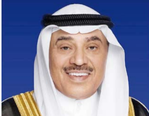
سمو ولي العهد الشيخ صباح الخالد

بعث سمو ولي العهد الشيخ صباح الخالد، ببرقية تهنئة إلى الدكتور رشاد محمد العليمي رئيس مجلس القيادة الرئاسي في الجمهورية اليمنية الشقيقة، ضمنها سموه خالص تهانيه بمناسبة ذكري العيد الوطني لبلاد وراجياً لفخامته دوام الصحة والعافية.