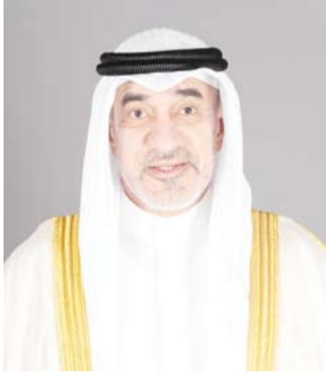
الشيخ فهد اليوسف

قد اكتسبها معهم بطريق التبعية" (أعمال جليلة). وأوضحت أن اللجنة قررت إسقاط الجنسية الكويتية وفقاً للمادة (14) فقرة (3) من قانون الجنسية الكويتية رقم (15) لسنة 1959م وتعديلاته من حالة واحدة للمناس بولائه للبلاد). وذكرت أن اللجنة قررت سحب الجنسية الكويتية وفقاً للمادة (13) فقرة (4) من قانون الجنسية الكويتية رقم (15) لسنة 1959م وتعديلاته (مصلحة عليا للبلاد) من 50 حالة (إحصاء 1965) ومن يكون قد اكتسبها معهم بطريق التبعية. وبينت أن اللجنة قررت سحب الجنسية الكويتية وفقاً للمادة (13) فقرة (4) من قانون الجنسية الكويتية رقم (15) لسنة 1959م وتعديلاته (مصلحة عليا للبلاد) من 967 حالة (أعمال جليلة) ومن يكون قد اكتسبها معهم بطريق التبعية. كما قررت اللجنة سحب الجنسية الكويتية وفقاً للمادة (13) فقرة (4) من قانون الجنسية الكويتية رقم (15) لسنة 1959م وتعديلاته (مصلحة عليا للبلاد) من 4 حالات (مادة ثامنة).