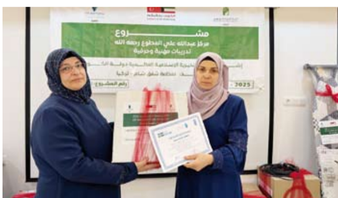
تكريم إحدى المشاركات