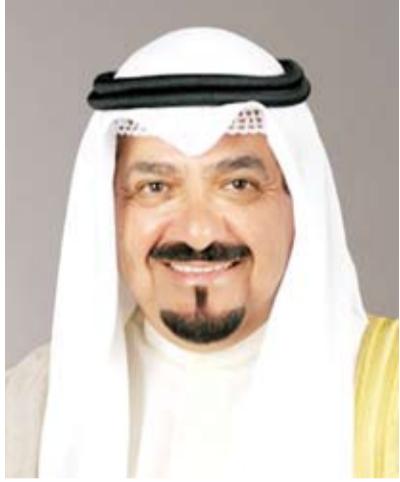
سمو الشيخ أحمد عبدالله

بعث سمو الشيخ أحمد العبدالله رئيس مجلس الوزراء، ببرقية تهنئة إلى فخامة الدكتور رشاد محمد العليمي رئيس مجلس القيادة الرئاسي في الجمهورية اليمنية الشقيقة بمناسبة ذكري العيد الوطني لبلاد.