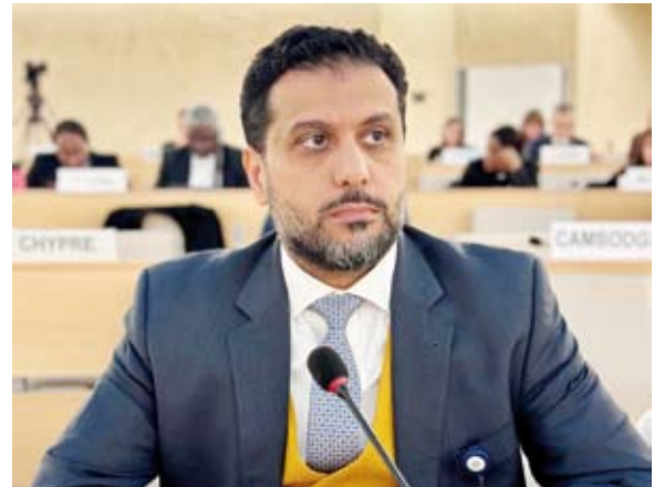
المستشار عبد الله الخبيزي

أعرب الوفد الدائم لدولة الكويت لدى الأمم المتحدة في جنيف، أول أمس، عن قلقه البالغ تجاه استمرار تدهور الأوضاع الصحية والإنسانية في الأراضي الفلسطينية المحتلة وفي الجولان السوري المحتل نتيجة استمرار الاحتلال والإجراءات القمعية والانتهاكات المنهجية التي تظال المدنيين بما في ذلك التهجير القسري وتدمير البنية التحتية الصحية في مخالفة صريحة للقانون الدولي الإنساني والاتفاقيات ذات الصلة. جاء ذلك في بيان القاه النائب المندوب الدائم المستشار عبد الله الخبيزي أمام لجنة الأوضاع الصحية في الأراضي الفلسطينية المحتلة وفي الجولان السوري المحتل في إطار البند 20 من أعمال الدورة 78 لجمعية الصحة العالمية (أعلى جهاز لاتخاذ القرار في منظمة الصحة العالمية). ولقت الخبيزي إلى التقارير الصادرة عن