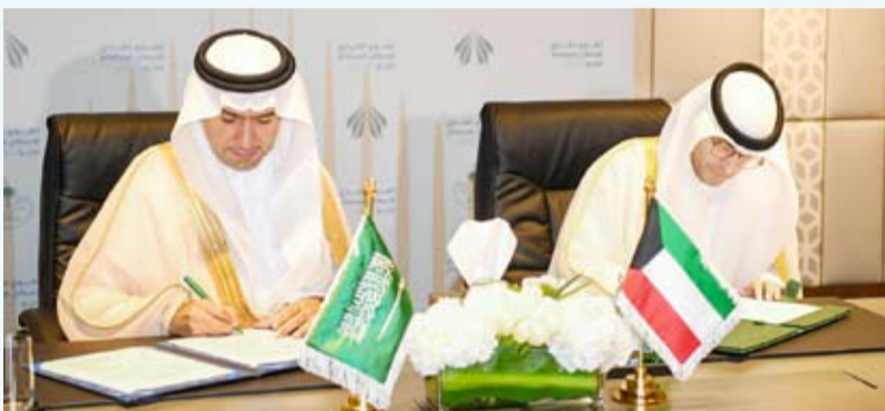
توقيع الاتفاقية بين الجانبين الكويتي والسعودي

الشركات المحلية فقط بل يطال الشركات العالمية "والكويت مفتحة للاستفادة من تجارب الأشقاء بدول مجلس التعاون الخليجي دون استثناء".