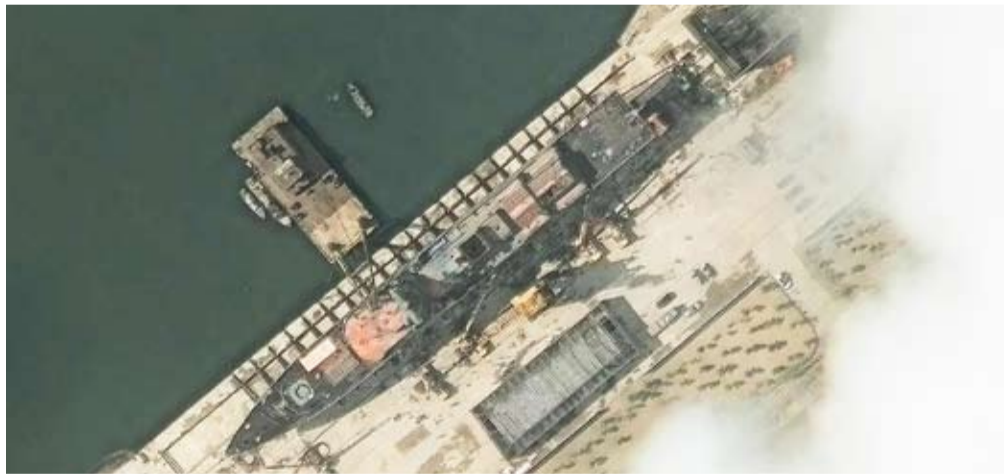
سفينة حربية كورية شمالية جديدة

أعلنت كوريا الجنوبية أن جارتها الشمالية أطلقت، باتجاه البحر «عدداً من الصواريخ المجهزة غير المحددة»، في تجربة تأتي بعيد ساعات من إعلان بيونغ يانغ وقوع «حادث خطير» خلال احتفال تدينين سفينة حربية. وقالت هيئة الأركان المشتركة الكورية الجنوبية إنها رصدت الصواريخ قرب مقاطعة هامغيونغ الجنوبية في كوريا الشمالية، إثر إطلاقها باتجاه البحر الشرقي، الذي يسمى أيضاً «بحر اليابان». وفي 8 مايو، أطلقت كوريا الشمالية دفعة من الصواريخ الباليستية القصيرة المدى باتجاه بحر اليابان، وفقاً للجيش الكوري الجنوبي، بينما أشار خبراء إلى احتمال إجراء تجربة أسلحة مخصصة للإرسال إلى روسيا. لكن عملية إطلاق الصواريخ لم يكن لها أي تأثير على اليابان المجاورة، بحسب وزارة الدفاع اليابانية. ووقعت بيونغ يانغ وموسكو معاهدة دفاع مشترك في يونيو 2024، تنص على «مساعدة عسكرية فورية» في حال تعرض أحد البلدين لهجوم مسلح من دولة أخرى. وتمنع العقوبات التي فرضتها الأمم المتحدة على بيونغ يانغ، على خلفية برنامجها النووي، كوريا الشمالية من امتلاك صواريخ باليستية.