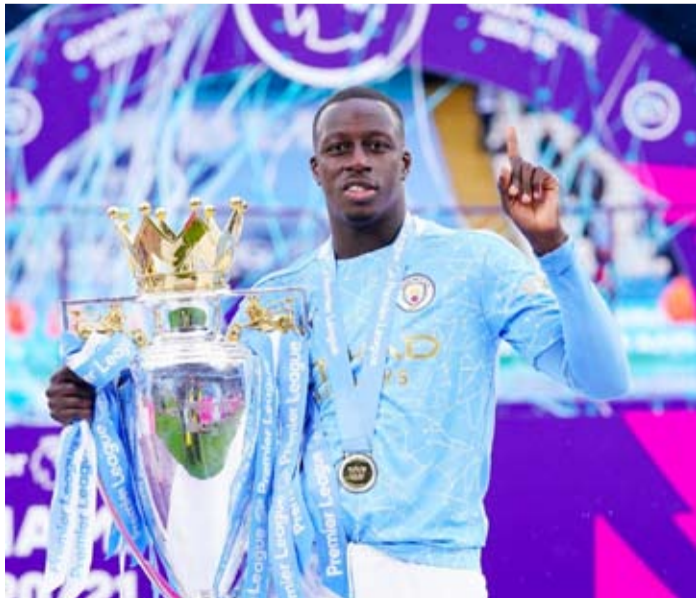
الفرنسي بنجامان ميندي

يحاول نادي الوداد البيضاوي المغربي حسم تعاقده مع الفرنسي بنجامان ميندي نجم مانشستر سيتي ومنتخب فرنسا السابق قبل مواجهة الفريقين في كأس العالم للأندية 2025. إلى جانب مانشستر سيتي الإنجليزي ويوفنتوس الإيطالي والعين الإماراتي، إذ ضمن مقعده بعد فوزه ببطولة دوري أبطال إفريقيا 2022. ويعمل الفريق المغربي على تعزيز صفوفه قبل مباراته الافتتاحية في 18 يونيو المقبل أمام مانشستر سيتي بمدينة فيلادلفيا. وفقا لـ«سبورت» الفرنسية فإن ميندي يدخل في دائرة اهتمامات الوداد تحديدا بعد فترة غير مريحة مع نادي زيورخ السويسري الذي أنهى الموسم في المركز السابع، إذ لعب فقط 8 مباريات في مسابقتين منذ انتقاله في فبراير الماضي. وعرف ميندي مسيرة متقلبة إذ وبعد سطوع اسمه بعد الانتقال من موناكو إلى مانشستر سيتي في 2017، توقف عن اللعب فترة طويلة بعدما فسخ سيتي تعاقده معه بسبب الخوض عليه ومحاكمته بتهمة الإغصاب إذ استمرت مدة التوقف من أغسطس 2021 حتى يوليو 2023 عندما فسخ التعاقد وانتقل إلى لوريان حيث لعب مباراته الأولى بعد التوقف في سبتمبر من ذلك العام. الطرفين، فخيرة اللاعب الدولي الفرنسي يمكن أن تساعد النادي البيضاوي على منافسة فرق مثل مانشستر سيتي الإنجليزي يوفنتوس أو العين، وهي الأندية التي سيواجهها الفريق في كأس العالم للأندية، وبالنسبة للاعب موناكو السابق ستكون أمامه فرصة أخرى لبعث مسيرته من جديد.. وأبانت «سبورت» أن اسم ميندي يتدرج على السلة الجمع في الوداد خاصة وأنه لم يتأقلم في سويسرا قبل أن تتسبب إصابات عضلية بإنهائه الموسم مبكرا. وأضافت الصحيفة «وفقا للمعلومات، تفيد التقارير بأن المفاوضات الأولية بدأت بين الوداد البيضاوي وبنجامان ميندي. هذه المغامرة قد تساعد كلا