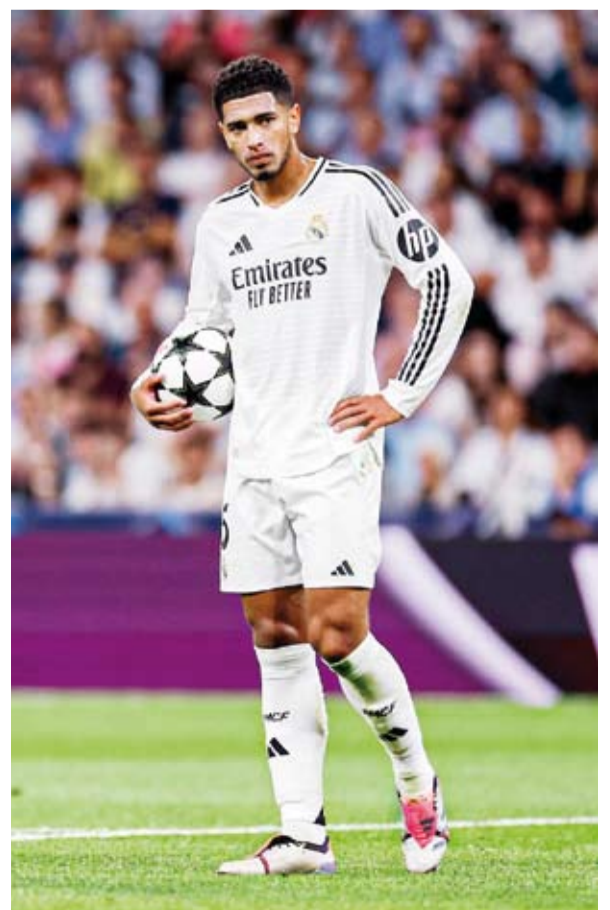
النجم الإنجليزي الدولي جود بيلنغهام

أعلن نادي ريال مدريد الإسباني لكرة القدم، إصابة مهاجمه البرازيلي إندريك فيليب في أوتار الركبة اليمنى. وقال النادي في بيان عبر حسابه الرسمي، إن الفحوصات الطبية التي خضع لها اللاعب البالغ من العمر (18 عاما) أثبتت، تعرضه للإصابة في أوتار ركبته اليمنى وسيتم تقييم تطور حالته في الأيام المقبلة. ولم يكشف ريال مدريد عن المدة المتوقعة لغياب اللاعب البرازيلي عن صفوف الفريق،