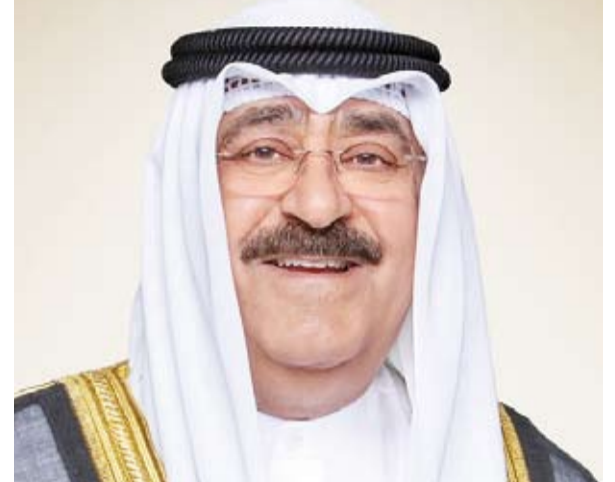
سمو أمير البلاد الشيخ مشعل الأحمد

بعث صاحب السمو أمير البلاد الشيخ مشعل الأحمد، ببرقية تهنئة إلى الدكتور رشاد محمد العليمي رئيس مجلس القيادة الرئاسي في الجمهورية اليمنية الشقيقة، عبر فيها سموه عن خالص تهانيه بمناسبة ذكري العيد الوطني لبلاد. متمنياً لفخامته موفور الصحة والعافية وأن يعم الأمن والسلام والاستقرار كافة ربوع البلد الشقيق.