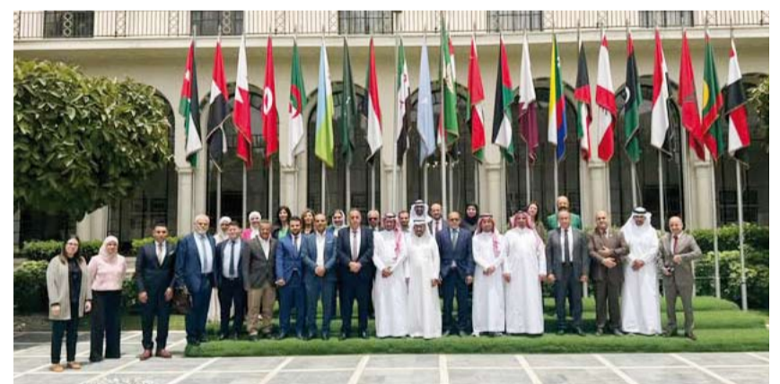
لقطة جماعية للمشاركين في الاجتماع

عقد القطاع الاقتصادي (إدارة شؤون البيئة والأرصاء الجوية الأمانة الفنية لمجلس الوزراء العرب المسؤولين عن شؤون البيئة) الاجتماع الـ 23 للفريق العربي المعني بمتابعة الاتفاقيات البيئية الدولية الخاصة بالتنوع البيولوجي ومكافحة التصحر بمشاركة دولة الكويت. وقالت الجامعة العربية في بيان: إنه شارك في أعمال الاجتماع المقام بقصر الأمانة العامة في القاهرة ممثلو الدول العربية من الوزارات المعنية بموضوعات التنوع البيولوجي ومكافحة التصحر بالإضافة إلى ممثلي