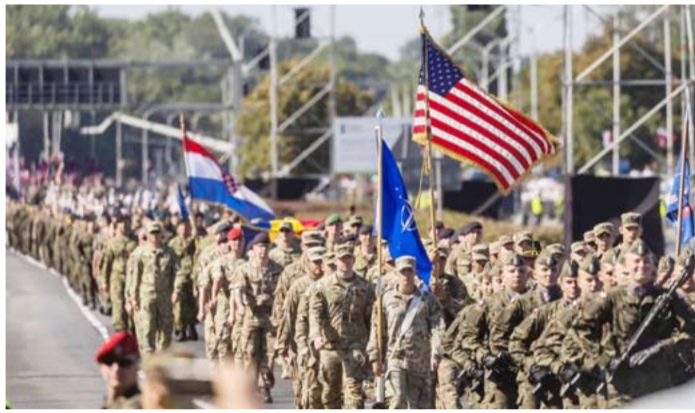
جنود الناتو من الولايات المتحدة ورومانيا وكروواتيا

أعلن الجيش الأمريكي أنه سيقام في واشنطن في 14 يونيو عرضاً عسكرياً ضخماً بمناسبة مرور 250 عاماً على تأسيسه، في حدث سيترافق أيضاً مع احتفال الرئيس دونالد ترامب بعيد ميلاده. وفي 14 يونيو المقبل، حين سيحتفل الرئيس الجمهوري بعيد ميلاده التاسع والسبعين، ستشارك عشرات الدبابات والمدفعات والمروحيات القتالية في هذا العرض العسكري النادر في العاصمة الأميركية. وقال المتحدث باسم الجيش ستيف وارن إن العرض ستشارك فيه خصوصاً 28 دبابة من طراز «أبرامز إم 1 إيه»، 28 مركبة قتالية مدرعة من طراز برادلي، بالإضافة إلى 50 مروحية قتالية. وتقدر التكلفة الإجمالية لهذا الاستعراض العسكري، بما في ذلك عرض ضخم بالألعاب النارية، بنحو 45 مليون دولار. وأوضح المتحدث أن الهدف من تنظيم هذا العرض هو «سرد قصة الجيش عبر التاريخ».