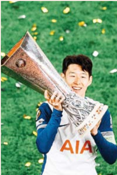
سون هيونغ مين

أكد سون هيونغ مين، قائد فريق توتنهام الإنجليزي لكرة القدم، أن من الممكن أن يطلق عليه الآن لقب «الأسطورة» بعدما حقق حلمه بالفوز بلقب مع النادي عقب التتويج بالدوري الأوروبي. وسجل بيرنان جونسون هدفا في الدقيقة 42 ليسانغ توتنهام في الفوز على مانشستر يونايتد 1-0 صفر والتتويج بلقب الدوري الأوروبي. وبهذا الفوز، حصد توتنهام أول