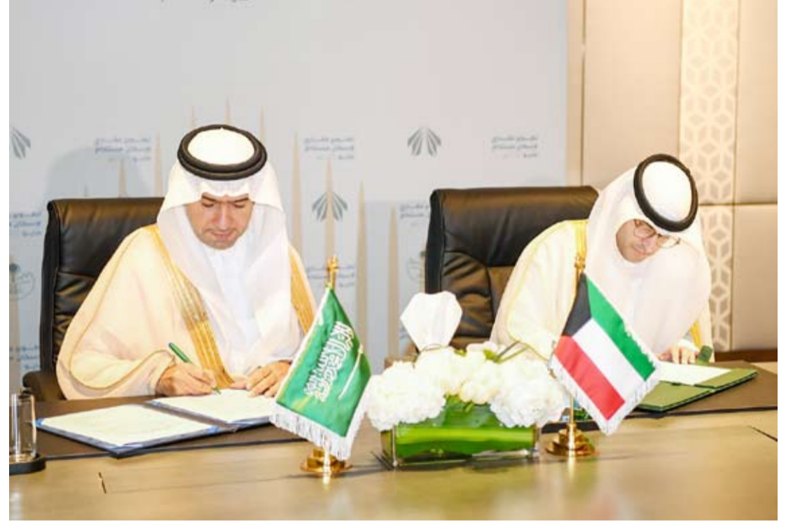
الوزير المشاري خلال توقيع الاتفاقية مع الجانب السعودي

نأمل أن يشهد السوق تغيرات واسعة تنعكس إيجاباً على الشركات المحلية والمواطنين بوجه عام.