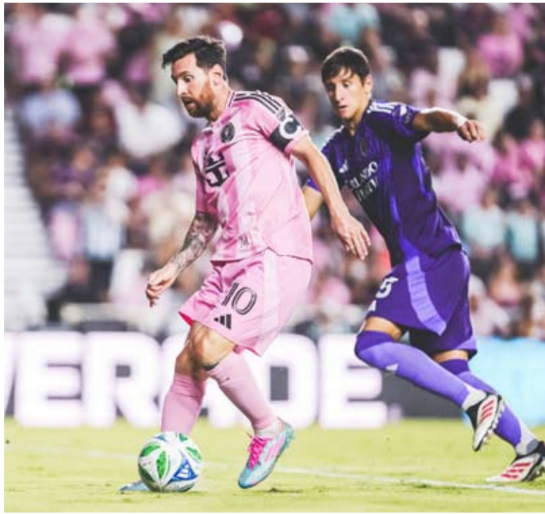
ميسي محبط قبل كأس العالم للأندية

بعد تراجع النتائج والافتقار بفوز وتعادل واحد مقابل خمس هزائم آخرها أمام أورلاندو سيتي. ويواجه المدرب خافيير ماسكيانو ضغطاً