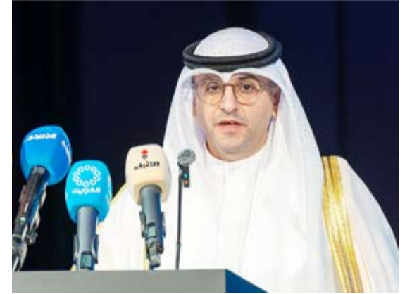
الوزير عبد اللطيف المشاري متحدثاً خلال حفل الافتتاح