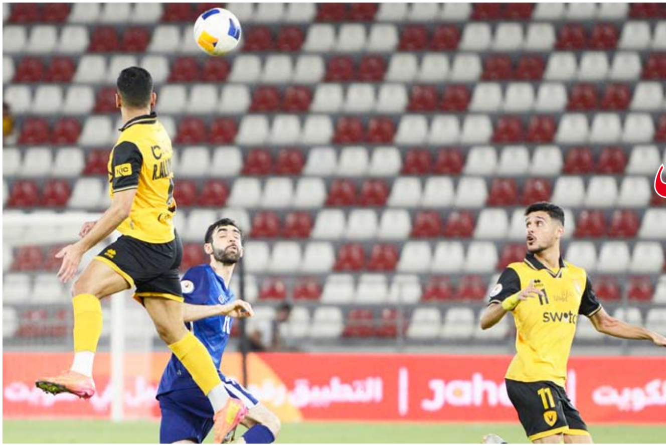
القادسية عبر بركان بصعوبة