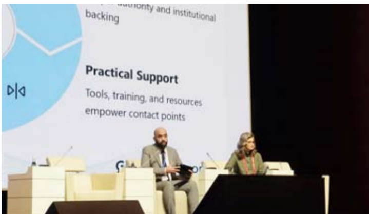
جانب من الجلسة

التي بدأت الأول من أول أمس الثلاثاء وتستمر إلى اليوم الجمعة بوفد يرأسه نائب رئيس الهيئة المستشار نواف المهمل إلى جانب ممثل عن وزارة الخارجية الوزير المفوض مهدي العجمي وعدد من خبراء إدارة التعاون الدولي في (نزاهة).