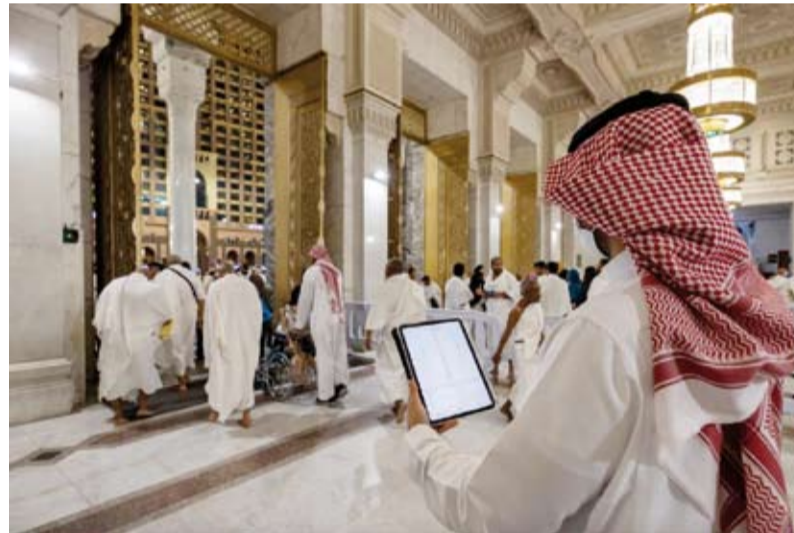
رصد أعداد مرطدي في الحرم المكي

بشكل استباقي إذ توفر المختبرات خدمات الفحص والتحليل الميداني مما يسهم في سرعة الاكتشاف ودقة التدخلات الصحية اللازمة في مواقع تجمع الحجاج. اما مختبرات الهيئة العامة للغذاء والدواء، فقد أكملت استعداداتها للمشاركة في جهود تعزيز سلامة الغذاء والدواء لضيوف الرحمن خلال موسم الحج من خلال العمل على أحدث الأجهزة والتقنيات المخبرية المتقدمة إلى جانب تنفيذها لبرامج الدراسات الميدانية لتطوير