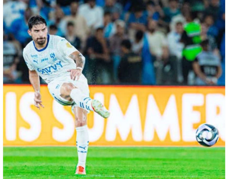
تعادل مخيب للهلال أمام الوحدة

استعاد النصر نعمة الانتصارات، التي غابت عنه في المرحلة الماضية ببطولة دوري المحترفين السعودي لكرة القدم (دوري روشن). وحقق النصر انتصاراً ثميناً 2-0 صفر على ضيفه الخليج، ضمن منافسات المرحلة الـ33 (قبل الأخيرة) في المسابقة. وعجز الفريق عن هز الشباك خلال الشوط الأول، الذي انتهى بالتعادل بدون أهداف، قبل أن يشهد الشوط الثاني هدي المباراة، الذي شهد الكثير من الإثارة. وافتتح الكولومبي جون دوران التسجيل لمصلحة النصر في الدقيقة الـ75، فيما تكفل النجم البرتغالي المخضرم كريستيانو رونالدو، بإحراز الهدف الثاني للفريق الملقب بـ(العالمي) من ركلة جزاء في الدقيقة السابعة من الوقت المحتسب بدلا من الضائع. وتمكن رونالدو بذلك من تعويض ركلة الجزاء التي أهدرها في الدقيقة الـ65، بتلك النتيجة، ارتفع رصيد النصر، الذي تعادل 1-1 مع ضيفه التعاون في المرحلة الماضية بالبطولة، إلى 67 نقطة، لكنه ظل في المركز الرابع، بفارق نقطة خلف القادسية، صاحب المركز الثالث، المؤهل لبطولة دوري أبطال آسيا 2. في المقابل، توقف رصيد الخليج، الذي تلقى خسارته الـ16 في البطولة خلال الموسم الحالي، عند 37 نقطة في المركز العاشر.