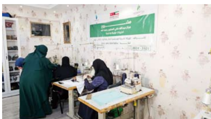
جانب من مشروع الخياطة

الاقتصادية والاجتماعية. وفي تفاصيل المشروع فقد تم تنفيذ برنامج تدريبي في الخياطة والتطريز على مرحلتين وامتد على مدى ثلاثة أشهر، وعلقت المشاركات خلاله دروساً نظرية وعملية تؤهلن لمزاولة المهنة بمهارة، مع منحهن شهادات خبرة معترف بها. وقد تمكن عدد منهن من الحصول على فرص عمل، فيما تسلّمت الخمس الأوائل مكائن خياطة وأدوات قص لتأسيس مشاريعهن الخاصة.