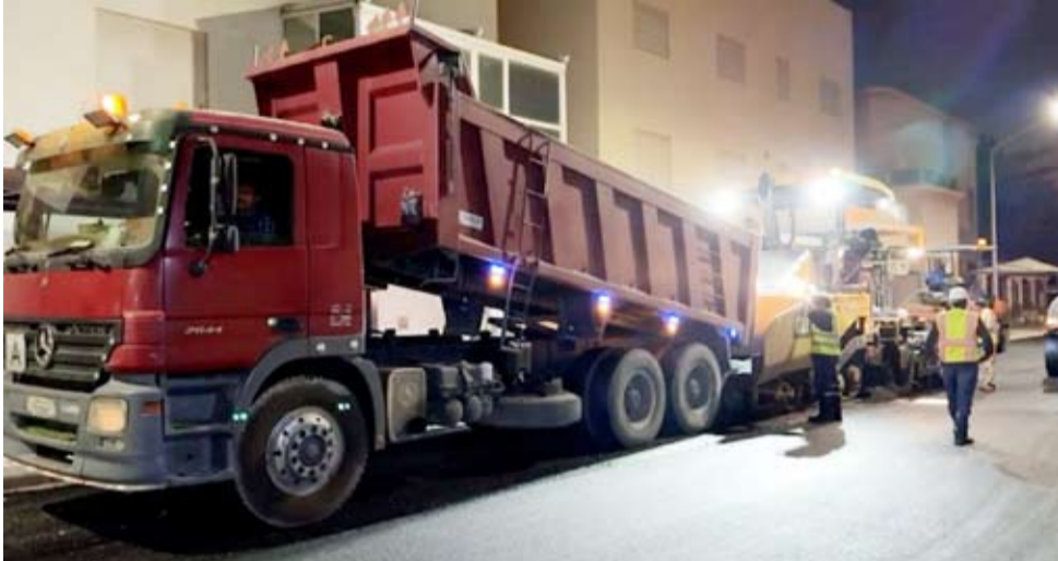
جانب من أعمال فرش الأسفلت