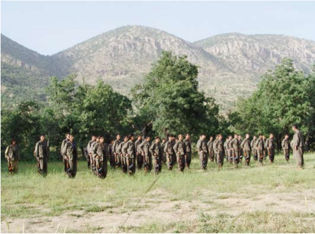
مسلحو حزب العمال الكردستاني

يثير اقتراح بشأن تشكيل لجنة برلمانية لبحث الخطوات التي سيتم اتخاذها، بناء على قرار حزب العمال الكردستاني حل نفسه والبقاء أسلحته، نقاشاً واسعاً وانقساماً على الساحة السياسية في تركيا.