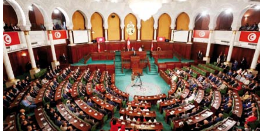
من جلسة البرلمان التونسي

أقر البرلمان التونسي، بالغالبية تعديلاً لقانون العمل، يمتع بموجبه توقيع عقود بالمناولة (الباطن)، والعقود المحددة بفترة زمنية، وهو أحد أبرز المشاريع السياسية للرئيس قيس سعيد، وسط انتقادات لدى جوداه في تنشيط اقتصاد البلاد المتعثر. نص القانون الجديد، الذي يباشر البرلمان التونسي مناقشته، على منع العقود المحددة الزمن، وتحويلها إلى عقود من دون سقف زمني، مع فترة تجريبية تدوم 6 أشهر، تمدد لمرّة واحدة، وأيد القانون 121 نائباً، بينما تحفظ عليه 4 نواب بحسب ما أورد تقرير لوكالة الصحافة الفرنسية.