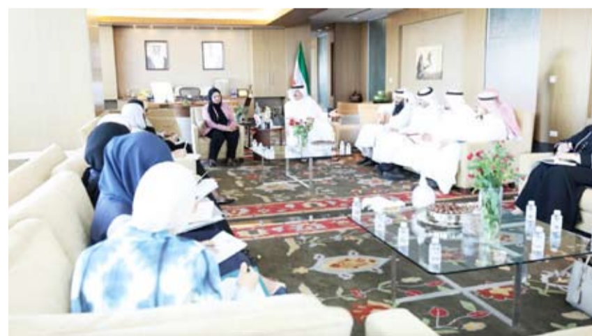
وزير التربية يترأس اجتماعاً مع موجهي عموم المواد الدراسية

مختصين من جهات خارجية لاعتمادها تمهيداً لتنفيذها على مراحل مدروسة استعداداً لتطبيقها في العام الدراسي القادم.