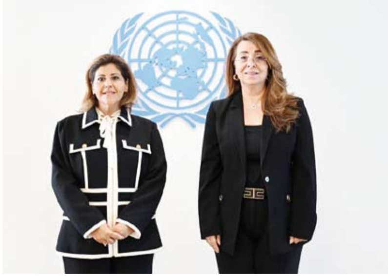
السفيرة الشيخة جواهر الصباح في صورة تذكارية مع غادة والي في مقر الأمم المتحدة في فيينا

أكدت مساعد وزير الخارجية السفيرة لشؤون حقوق الإنسان، السفيرة الشيخة جواهر الصباح، أول أمس، دعم دولة الكويت المستمر للجهود الأهمية الرامية إلى مكافحة الاتجار بالبشر والتزامها الراسخ بحقوق الإنسان وتعزيز الشراكات الدولية. جاء ذلك في تصريح خاص أدلت به السفيرة جواهر لـ (كونا) عقب لقائها وكيل الأمين العام للأمم المتحدة والمدير التنفيذي لمكتب الأمم المتحدة المعني بالمخدرات والجريمة غادة والي في مقر الأمم المتحدة في "فيينا" على هامش مشاركتها في اجتماعات لجنة الأمم المتحدة لمنع الجريمة والعدالة الجنائية. وأشارت مساعد وزير الخارجية إلى أنها استعرضت خلال لقائها مع والي أبرز ما قامت به دولة الكويت