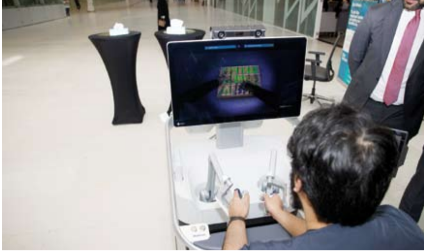
استخدام أحدث الأنظمة العالمية