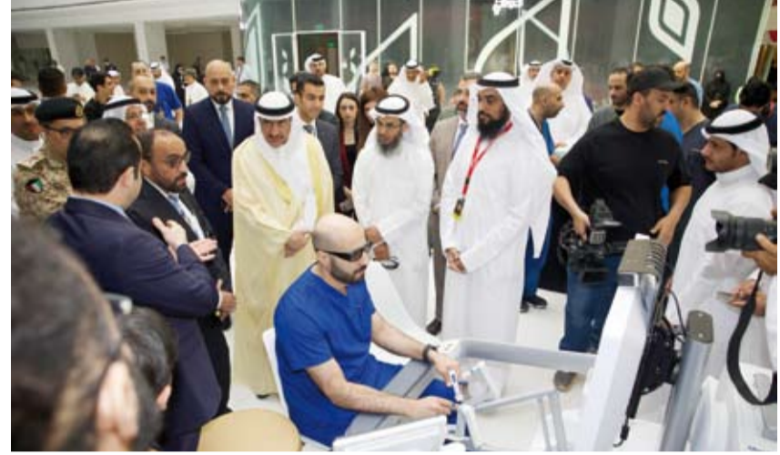
جانب من التدشين بحضور محافظ الجبراء

دشنت وزارة الصحة، أمس، تقنية الجراحات الروبوتية المتطورة ضمن قسم الجراحة في مستشفى الجبراء الجديد باستخدام أحدث الأنظمة العالمية بهذا المجال وذلك في إطار السعي لتعزيز جودة الرعاية الصحية والارتقاء بالخدمات الطبية في مختلف مناطق البلاد.