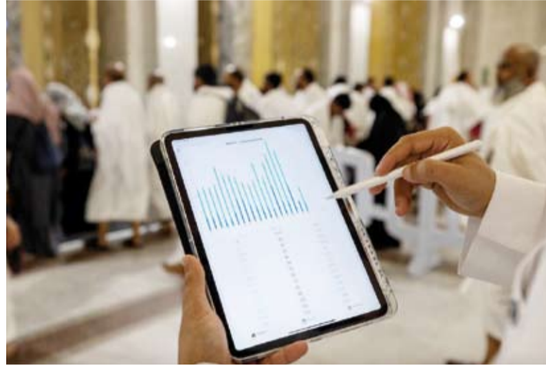
متابعة استعدادات الحج عبر أحدث التقنيات

ودشنت الرئاسة العامة للشؤون الدينية بالمسجد النبوي، النسخة الأولى من تطبيق (المساعد الذكي الإيثرائي) الذي يهدف إلى خدمة الزائرين وضيوف الرحمن خلال موسم الحج من خلال حزمة من الخدمات الرقمية الإيثرائية المدعومة بتقنيات الذكاء الاصطناعي وبما يسهم في تعزيز تجربة الزائر داخل المسج النبوي الشريف بعدة لغات عالمية.