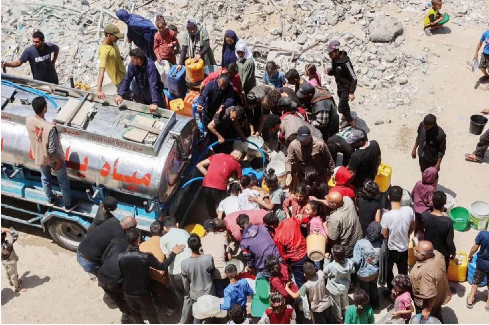
فلسطينيون يصفون للحصول على المياه

تتوالى المواقف الدولية والإقليمية ضد إسرائيل بشكل غير مسبق منذ انهيار اتفاق وقف إطلاق النار في قطاع غزة قبل نحو شهرين، تزامناً مع مفاوضات تراوح مكانها في الدوحة، وتبادل اتهامات بين حكومة بنيامين نتنياهو و«حماس» مع توسع عسكري إسرائيل. تلك المواقف الدولية يراها خبراء تحذرون لـ«الشرق الأوسط»، تعزز جهود الوسطاء وتضييق الخناق على نتنياهو، لكن استمرار كل طرف بأفكاره دون تنازل وغياب ضغوط أميركية جادة، يعينان أنه لن تسفر المحادثات بالدوحة عن تهدئة جديدة.