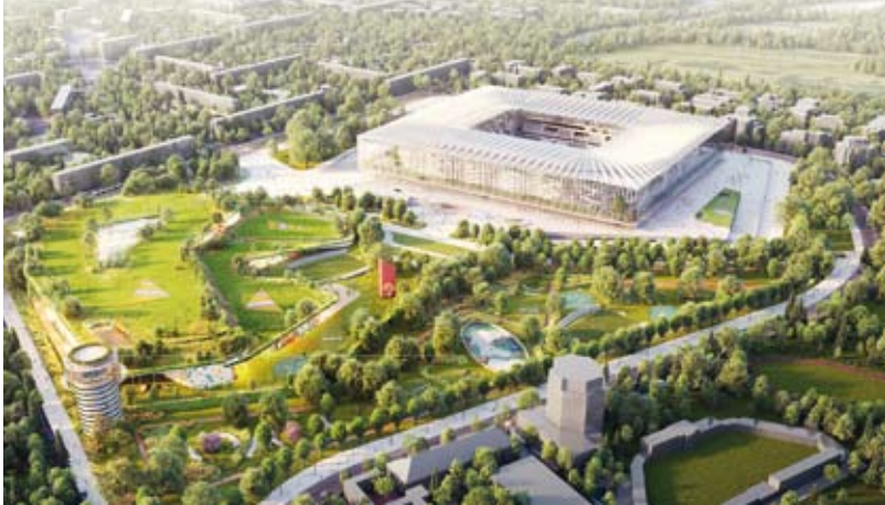
الملعب الجديد لميلانو

تصريحات موقع لوقع فابيه: «سيكون سان سيرو الجديد أجمل ملعب في العالم، بسبب هويته القوية وتميزه، وسيكون كساحة جذابة يسهل الوصول إليها».