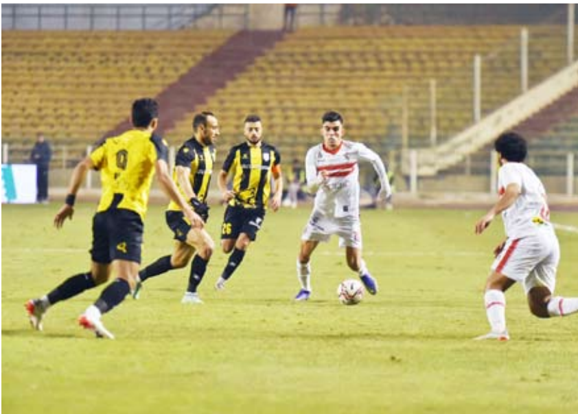
لقطة من مباراة الزمالك والمقاولون

تخطى الزمالك، مفاجآت مضيفة المقاولون العرب، بعدما اقتنص فوزاً مثيراً بنتيجة 2-1، الثلاثاء، على ملعب الجبل الأخضر، في الجولة السابعة للدوري المصري.