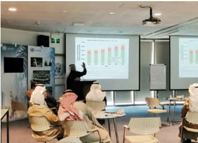
جانب من ورشة العمل

وأوضح: إن الدول المتقدمة تتعهد أيضاً بدعم جهود الدول النامية والأقل نمواً في مجالات مواجهة الآثار السلبية للتغير المناخي والتأقلم معها، علاوة على التعاون المشترك مع الدول النامية والأقل نمواً في آلية التنمية النظيفة. وأردف قائلاً: إن من أهم الاتفاقيات التي تمت في هذا المجال هي اتفاقية كيوتو التي تمثل خطوة تنفيذية لاتفاقية الأمم المتحدة المبدئية بشأن التغير المناخي، وهي معاهدة بيئية دولية خرجت للضوء في مؤتمر الأمم المتحدة المعنى بالبيئة والتنمية، ويعرف باسم «قمة الأرض الذي عقد في البرازيل من 14-5 يونيو 1992 هدفت المعاهدة إلى تحقيق "تثبيت تركيز الغازات الدفيئة في الغلاف الجوي عند مستوى يحول دون تدخل خطير من التدخل البشري في النظام المناخي. واختتم الورشة بقوله: إن هناك عدداً من الاتفاقيات العالمية التي عقدت تجاه إدارة المواد الكيميائية والنفايات الخطرة، وهي: اتفاقية بازل واتفاقية روتردام، اتفاقية روتردام، وكذلك اتفاقية مينام.