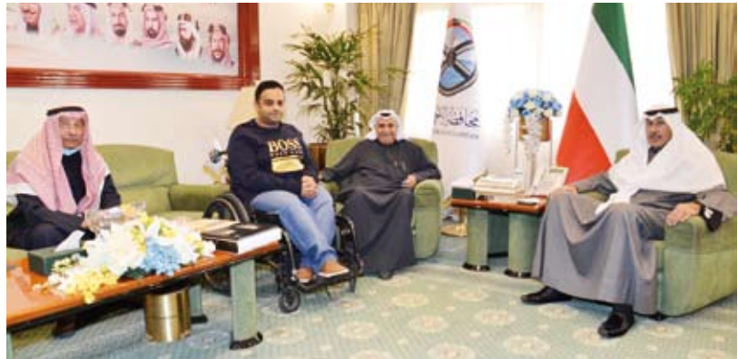
محافظ «الأحمدي» خلال لقائه مع المصور الشطي ووالده والمتروك

في إطار دعم وتشجيع شباب الكويت المبدع والمتميز في كافة المجالات، استقبل محافظ «الأحمدي»، الشيخ فواز الخالد، مدير عام بطولة الكويت للخيول العربية الأصيلة، مشعل المسباح، وذلك صباح أمس في ديوان عام محافظة الأحمدية، حيث اطلع على استعدادات تنظيم النسخة المقبلة من البطولة التي ستعقد في 12 يناير القادم في بيت العرب على مدى أربعة أيام، بمشاركة نحو 400 جواد من الكويت ودول خليجية وعربية شقيقة، متمنيا لهم التوفيق والنجاح في تنظيم هذه البطولة