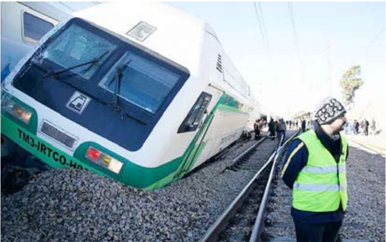
اصطدام بین قطاری مترو فی طهران

أصيب 22 شخصاً صباح أمس ثر اصطدام وقع بين قطاري مترو بين طهران وكرج غرب طهران. وذكرت وكالة «فارس» الإيرانية أن الحادث وقع صباح أمس حينما خرج قطار قادم من كرج عن مساره في منطقة جيتكر باصطدام بقطار كان أمامه.