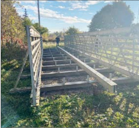
جزء من جسر المشاة الذي سرق من مدينة أكرون بولاية أوهايو

كجزء من مشروع استعادة الأراضي الرطبة، وتم تخزينه في ممتلكات المتزنه مع وجود خطط لإعادة استخدامه في مشروع ماوى للنساء المعنفات. واكتشفت الشرطة في 3