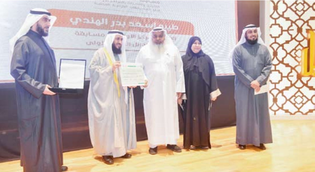
جانب من تكريم المتسابقة الفائزة في مسابقة «صفوة الأوائل»

8 آلاف دينار كويتي (نحو 26,4 ألف دولار).