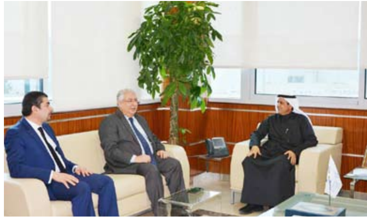
جانب من اللقاء

تنشيط العديد من البرامج للتبادل الطلابي وأعضاء الهيئة التدريسية، وتوفير عدد من المنح للطلاب لاستكمال دراستهم لمختلف الدرجات العلمية. وتعتبر هذه الزيارة ضمن سلسلة من الزيارات المقرر عقدها خلال الفترة القادمة مع العديد من المؤسسات البحثية والجامعات داخل دولة الكويت لتعزيز التعاون العلمي والبحثي في الفترة القادمة.