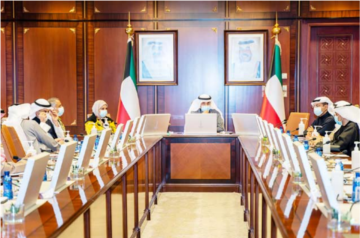
مراقبة تنفيذ اشتراطات مكافحة كورونا توصى بالتشدد في تطبيق الاشتراطات الصحية

لوقت الحالي واقتصره على حالات الضرورة ضمان أعلى مستوى من الحماية والوقاية متمنيا السلامة للجميع. من جانبها أكدت اللجنة الرئيسية لمراقبة تنفيذ الاشتراطات المتعلقة بمكافحة كورونا مس ضرورة التشديد في تطبيق الاشتراطات الصحية القدرية المقبلة نظر الوجود "بعض الترائح" في تطبيقها ما أدى خلال الأيام القليلة