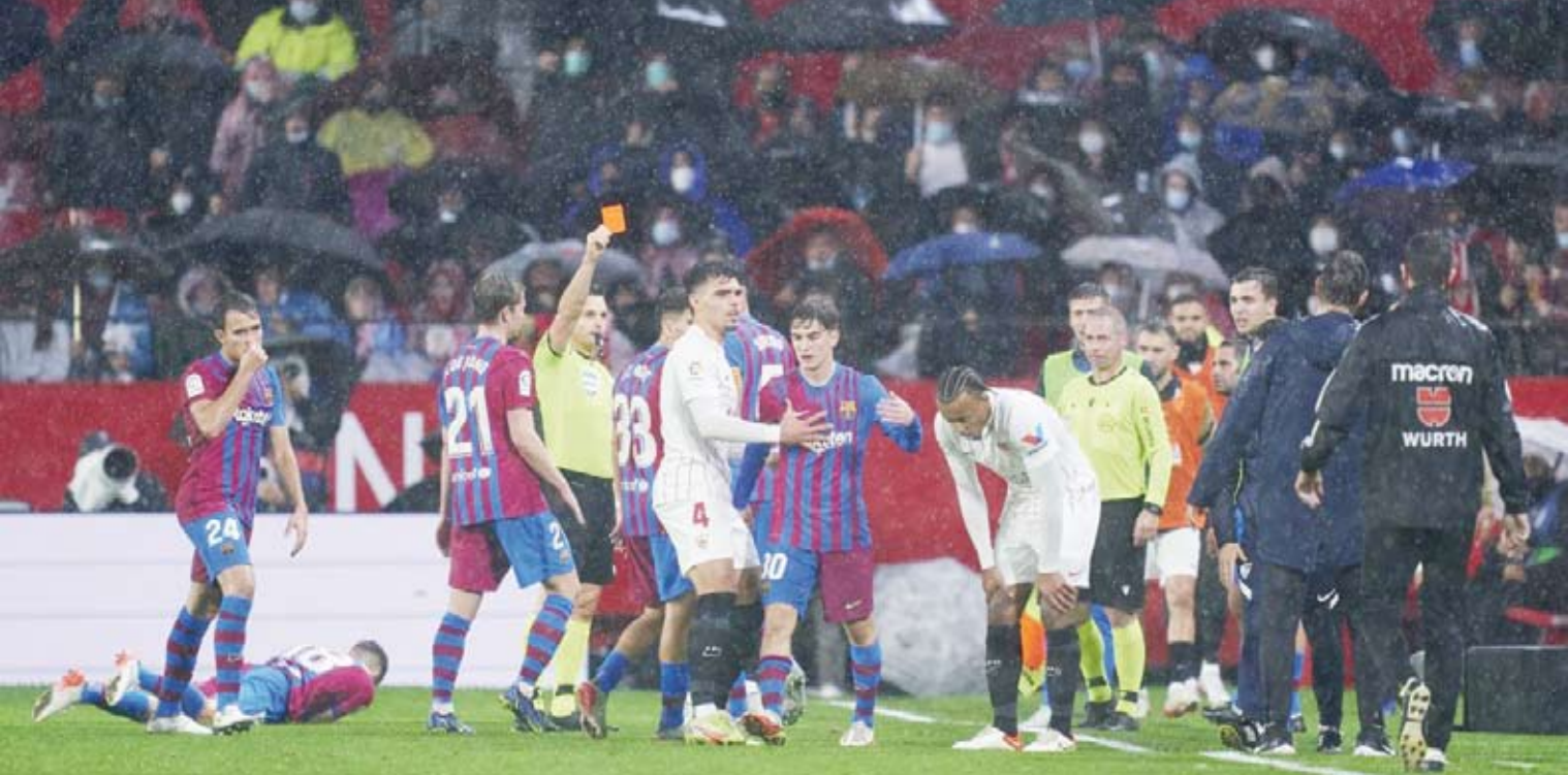
لحظة إظهار الحكم البطاقة الحمراء في وجه كوندوي

ويتمتع ديمبلي باهتمام متزايد من جانب أندية مانشستر يونايتد وتشيلسي وتوتنهام ونيوكاسل ويوفنتوس وبايرن ميونخ.