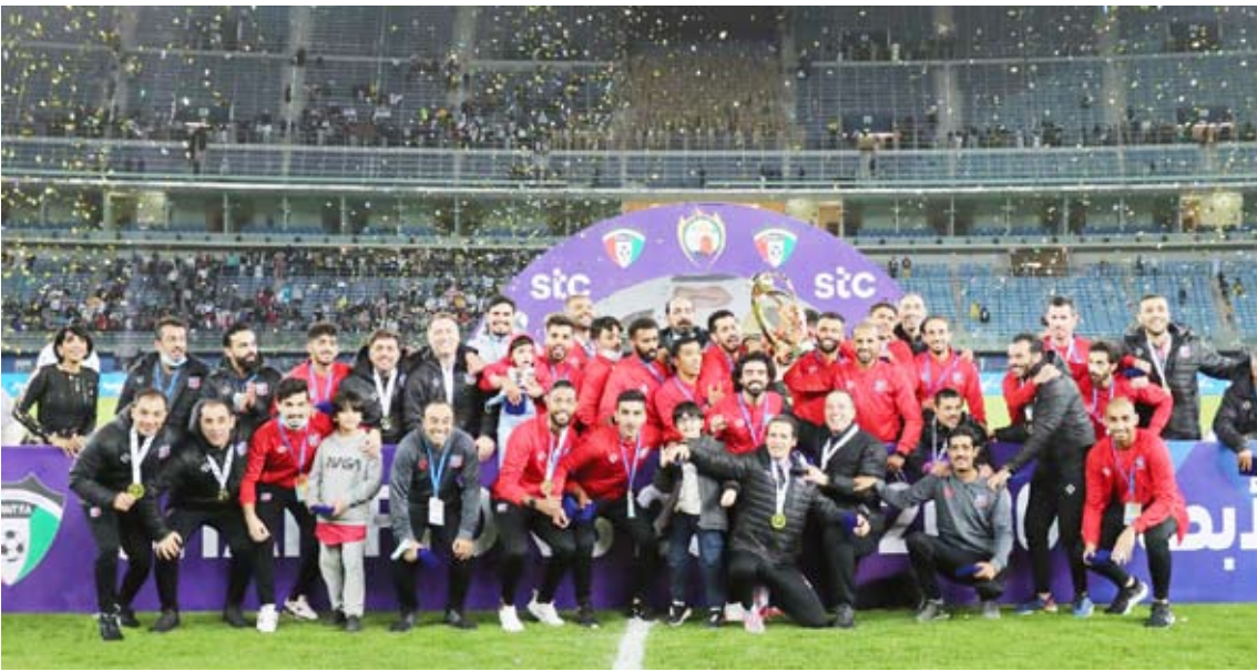
الكويت يحصد النجمة الـ15 في كأس الأمير

عبر المدير الفني لنادي الكويت الكويتي، التونسي نبيل معلول، عن سعادته بفوز فريقه بكأس أمير دولة الكويت بعد الفوز على نادي القادسية بهدف دون رد.