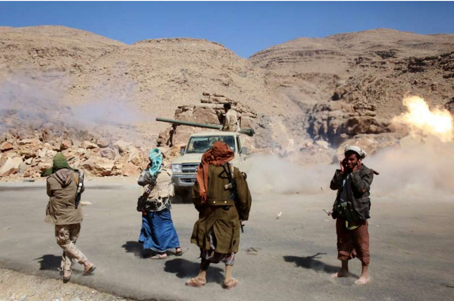
معارك في مارب

الحوثيين لبقوا مصرعهم بنيران القوات المشتركة المسنودة بطيران التحالف خلال الاشتباكات الضارية التي اندلعت صباح الثلاثاء في جبهة سقم شمال مديرية مقبنة بتعن وجبل رأس شرق الحديدة».