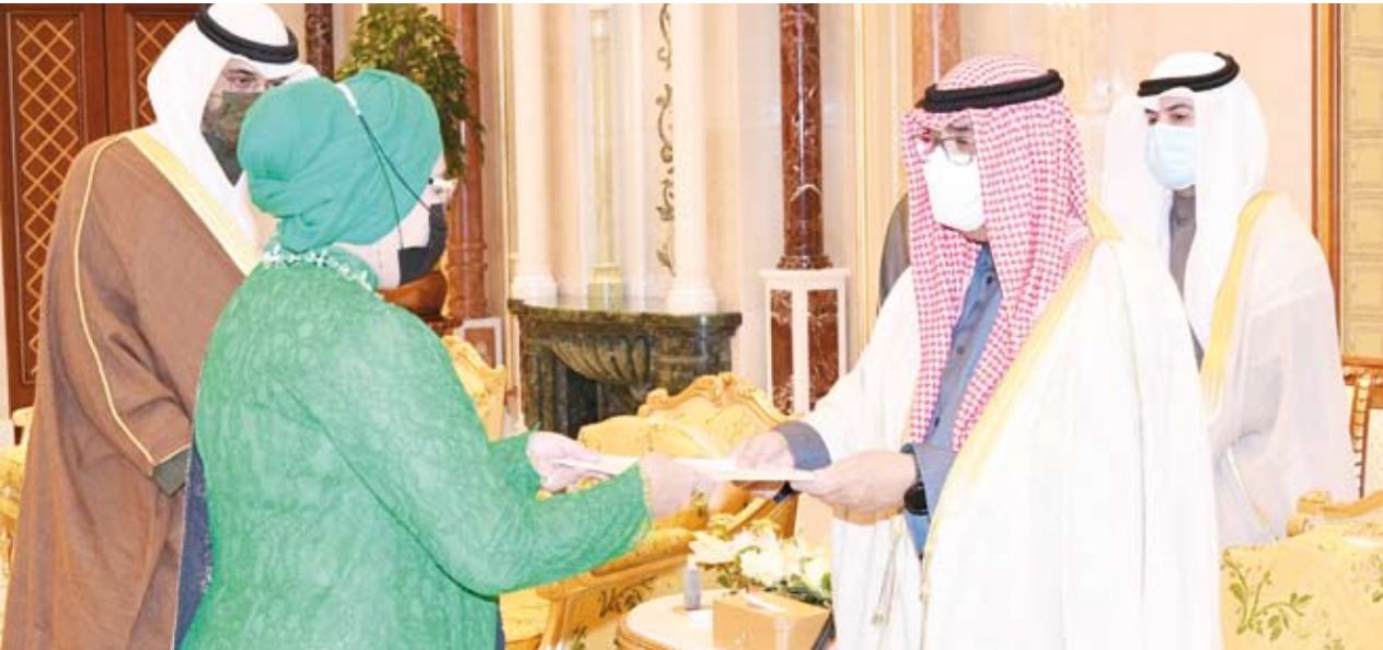
سمو ولي العهد يتسلم أوراق اعتماد سفيرة إندونيسيا