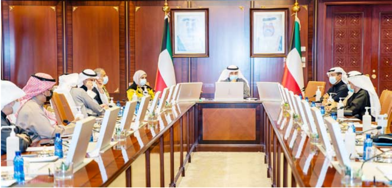
جانب من اجتماع اللجنة

مشيراً إلى أنه ”إذا كان هناك تراخ أو تهاون بهذا الخصوص سيتم إنذارهم أو لا ثم تحرير المخالفات في حال عدم الالتزام“. وأوضح أنه في حال عدم الانضباط والتقدير سيتم إحالة المخالفين إلى الجهات القانونية لضمان التزام الجميع بالاشتراطات الصحية. وبيّن أن الاشتراطات الصحية الواجب على الجميع اتباعها لمنع انتشار فيروس كورونا هي عدم دخول ”غير الملحقين“ إلى المجمعات التجارية وضرورة الالتزام بارتداء الكمام بالطريقة الصحيحة وهي تغطية الانف والفم في الأماكن المغلقة وتعقيم اليدين خصوصاً بعد لمس الأسطح والحرص على التباعد. وحول قرار مجلس الوزراء الأخير بشأن تطبيق الحجر المنزلي على القادمين إلى البلاد، قال المطوع: إن هذا القرار يهدف إلى حصر من يشتبه بإصابتهم بكورونا أثناء وجودهم