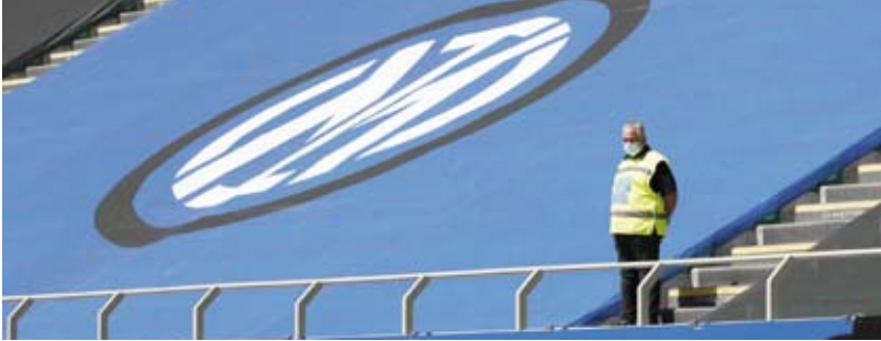
إنتر ميلان يخضع للتحقيق

أفاد حامل لقب الدوري الإيطالي، إنتر ميلان، أنه