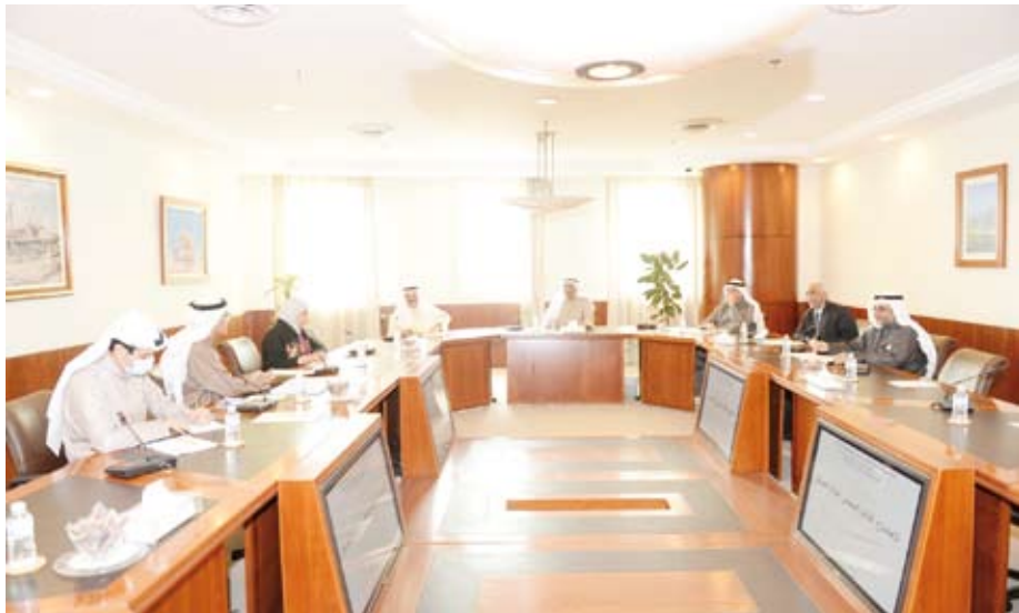
جانب من اجتماع مجلس الأمناء بغرفة التجارة

عبدالعزیز حمد الصقر للتنمية والتطوير مساهمة مباشرة في تعزيز المهارات الأكاديمية والمهنية للعاملين بالدولة سواء القطاع الخاص أو القطاع الحكومي من خلال اكتسابهم للمعرفة المتقدمة التي تقدم في برامج التدريب وبرامج الدراسات العليا وبما يسهم في تحسين بيئة الأعمال وتعزيز الاقتصاد الوطني .