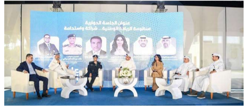
جانب من مشاركة البلدية