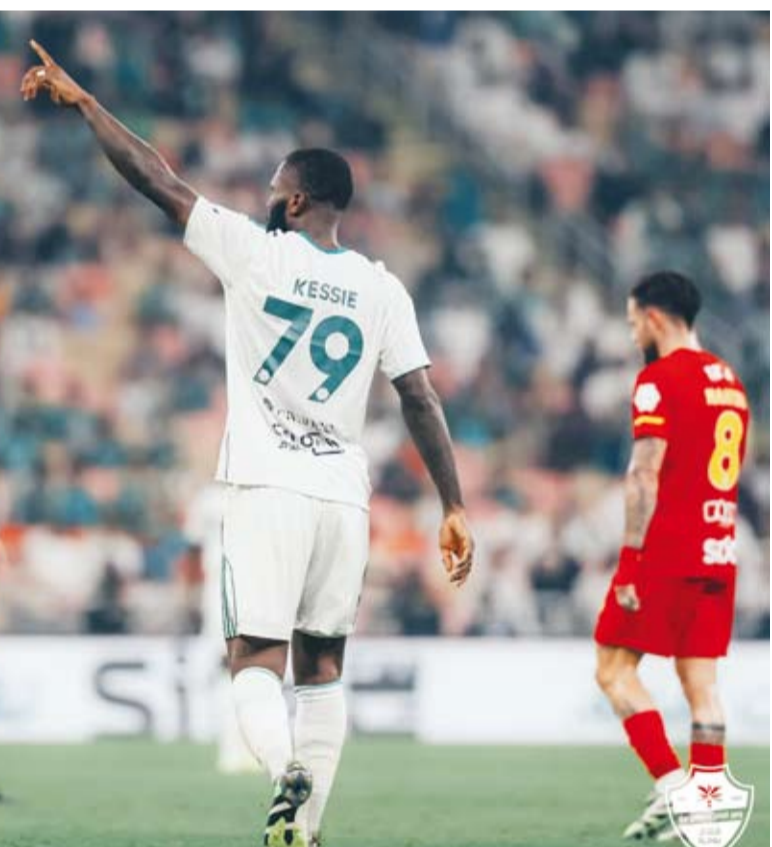
كيسيه يحتفل بالهدف

عاد الاتحاد إلى طريق الانتصارات ببطولة دوري روشن السعودي وذلك بعد فوزه على ضيفه الرياض 2-1 ضمن منافسات الجولة التاسعة من المسابقة. ورفع الاتحاد، حامل لقب الموسم الماضي، رصيده إلى 14 نقطة في المركز السابع، وهو يحاول العودة لمراكز القمة، حيث يتتعد بفارق عشر نقاط خلف النصر، متصدراً الترتيب، وسيعتقد خلف التعاون صاحب المركز الثاني، وست تقاط خلف الهلال الثالث. وجاء الفوز على الرياض ليكون الأول للفريق في آخر أربع مباريات بالمسابقة، بعدما خسر أمام الهلال والأهلي وتعادل مع الخليج، على الجانب الآخر. تجمد رصيد الرياض عند ثمانية نقاط في المركز الثالث عشر.