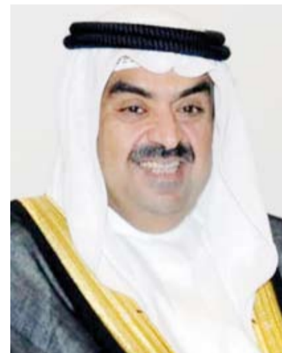
الشيخ خالد البدر الصباح

مشيداً بالجهود الكبيرة التي بذلت من قبل اللجنة المنظمة العليا وعلى رأسها صاحب السمو الأمير فهد بن جلوي لإنجاح هذا الحدث معرباً عن آمانياته القلبية بمزيداً من التقدم والرفق والازدهار للمملكة العربية السعودية الشقيقة في جميع المجالات لتبقى دائماً وأبداً بلد الأمن والأمان والإستقرار في ظل قيادتها الحكيمة.