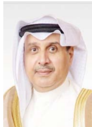
الشيخ حمد جابر العلي

صرح وزير شؤون الديوان الأميري الشيخ حمد جابر العلي أن صاحب السمو الشيخ مشعل الأحمد أمير البلاد، وأخاه سمو ولي العهد الشيخ صباح الخالد، وحكومة وشعب الكويت، يتقدمون بالشكر الجزيل وعظيم الامتنان إلى إخوانهم صاحب السمو الشيخ محمد بن زايد آل نهيان رئيس دولة الإمارات العربية المتحدة الشقيقة لإطلاق مبادرة (الاحتفاء بعقود الأخوة) بدءاً من 29 من شهر يناير المقبل ولمدة أسبوع وصاحب السمو الشيخ محمد بن راشد آل مكتوم نائب رئيس دولة الإمارات العربية المتحدة الشقيقة - رئيس مجلس الوزراء - حاكم دبي وولي عهده سموها وحكومة وشعب دولة الإمارات العربية المتحدة الشقيقة من المواقف النبيلة والعبارة السامية وطيب المشاعر، ممتدتين في الوقت ذاته هذه المبادرة التي تعكس عمق أواصر الروابط الأخوية التاريخية التي تجمع بين البلدين الشقيقين والتي تمثل لحمة بنيان