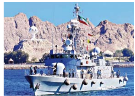
زورق البحرية الكويتية «استقلال»

باليوم الوطني إلى جانب عدد من القطع البحرية التابعة لأسطول البحرية السلطانية لدول الخليج العربية الشقيقة.