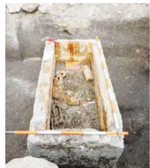
تابوت روماني فريد من نوعه

أعلن فريق من علماء الآثار في العاصمة الهنغارية بودابست العثور على تابوت روماني فريد من نوعه يعود إلى نحو 1700 عام.