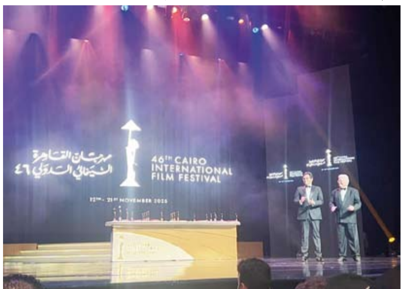
جانب من الحفل الختامي للمهرجان

اختتم مهرجان القاهرة السينمائي الدولي، أول أمس، فعاليات دورته الـ 46 بلحظة إنسانية مؤثرة عرض خلالها صورة للطفلة الفلسطينية هند رجب، مصحوبة بتسجيل صوتي لمكانتها الأخيرة مع طاقم الإسعاف قبل استهداف الاحتلال الإسرائيلي للسيارة التي كانت تستقلها واستشهادها.