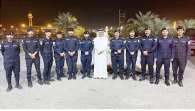
.. وخلال زيارته الميدانية إلى مخفر شرطة القشعانية