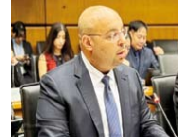
السفير طلال الفيصم

جميعها ملتزمة بمعاهدة عدم الانتشار النووي وتطبيق اتفاق الضمانات الشاملة باستثناء الاحلال الإسرائيلي الذي يرفض حتى الآن إخضاع منشآته النووية لرقابة الوكالة ويرفض أيضاً أي مبادرات أو خطوات جادة نحو إنشاء منطقة خالية من الأسلحة النووية وأسلحة الدمار الشامل في الشرق الأوسط وفقاً لقرارات مؤتمرات مراجعة المعاهدة منذ