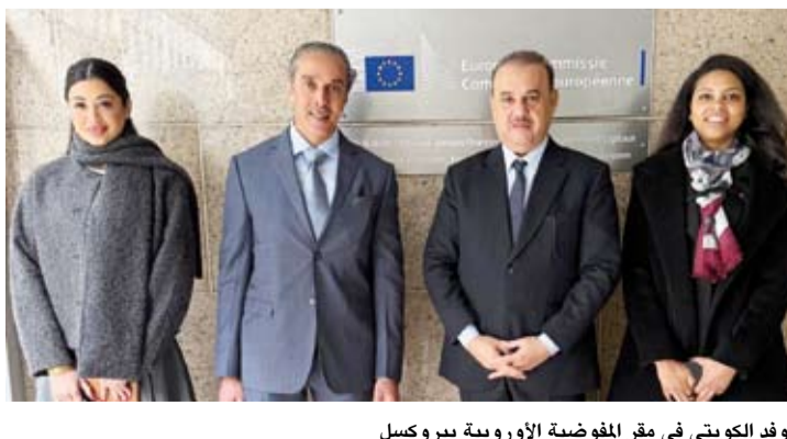
الوفد الكويتي في مقر المفوضية الأوروبية ببروكسل

ونقل البيان عن الجانبين تأكيدهما أهمية مواصلة التنسيق وتكثيف الجهود لضمان رفع كفاءة الأنظمة الرقابية وتعزيز حماية القطاع المالي في ضوء المتطلبات الدولية ذات الصلة التي تعتمدها (فاتف).