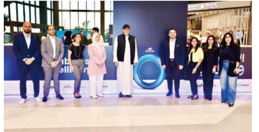
لقطة جماعية للمشاركة في الفعاليات

الإجراءات من دور كبير في تجنب المضاعفات والعيش مع المرض بسلاسة. وحذّر المضاحي قائلاً: لا تآمن السكري، فهو قد يأتي بلا أعراض، لكن تأثيراته تظهر على المدى البعيد. ودعا جميع المواطنين والمقيمين إلى الاستفادة من الخدمات الطبية والفحوصات التي توفرها مؤسسات وزارة الصحة في جميع المستشفيات والمراكز الصحية. وشدد المضاحي على أهمية المبادرة إلى الفحص الدوري، والالتزام بالضوابط الصحية عند تشخيص المرض، كالمحافظة على معدل الغلوكوزين السكري أقل من 7%، وضبط ضغط الدم ليكون أقل من 130/80، بالإضافة إلى إجراء الفحص السنوي للقدم وشبكة العين، لما لهذه