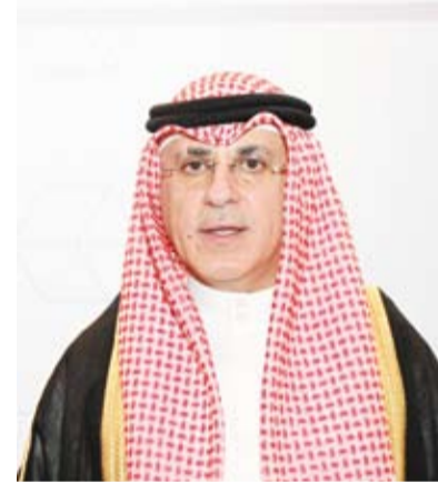
السفير جمال الغنيم

البلاد من العز والفاطم وهي مواقف راسخة في وجدان أهل الكويت وتاريخها. وأوضح السفير الغنيم أن هذا الأسبوع الاحتفالي سيشكل دافعاً جديداً لمسيرة العلاقات الثنائية التي تجمعنا مع دولة الكويت ولدى الشعب الكويتي لا ينسى مواقف الإمارات المشرفة من زمن الرئيس المؤسس الشيخ الراحل زايد بن سلطان آل نهيان (رحمه الله) والشيخ خليفة بن زايد آل نهيان (رحمه الله)، ثم الشيخ محمد بن زايد آل نهيان تجاه الكويت ومنها وقيادتها وشعبها ودعمهم الكبير إبان تحرير