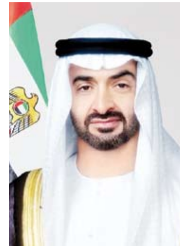
الشيخ محمد بن زايد آل نهيان

ومحبة لا تزيدنا الأيام إلا رسوخاً.. نوجه كافة الجهات الاحتفائية بتنفيذ توجيهات رئيس الدولة حفظه الله وإظهار حجم المحبة الحقيقية التي تجمع بين الشعبين الشقيقين. وأرفق الشيخ محمد بن راشد مشوره بصورة تجمع سمو أمير البلاد الشيخ مشعل الأحمد وأخاه رئيس دولة الإمارات الشيخ محمد بن زايد آل نهيان وتحته عبارة (الكويت والإمارات أخوة للأبد).