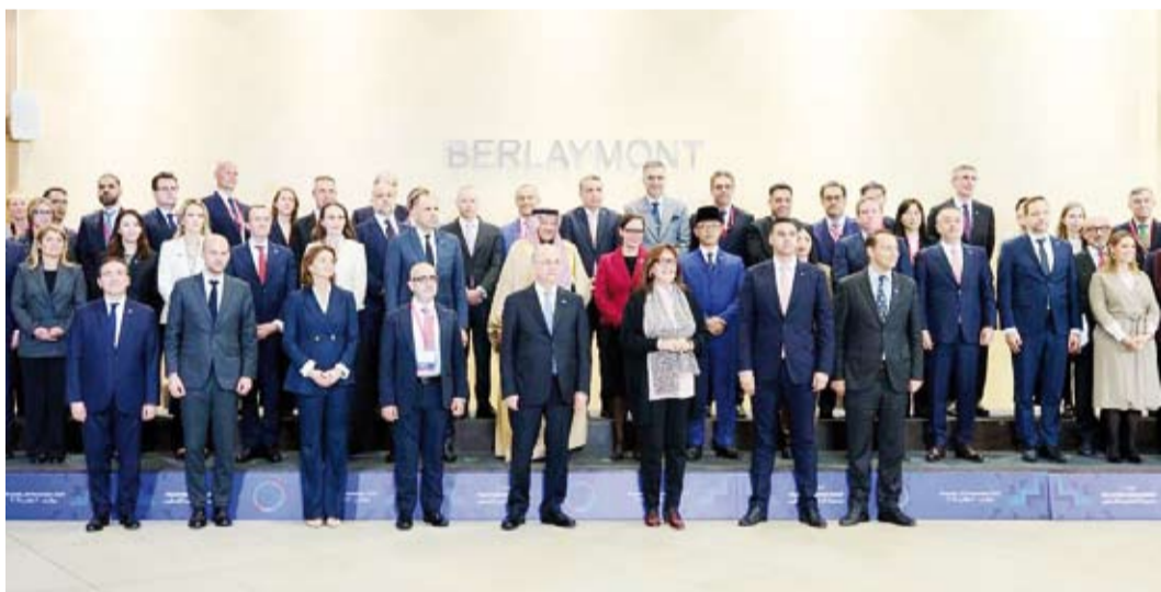
لقطة جماعية للمشاركين

الإعمار في دولة فلسطين الشقيقة. وفي الوقت ذاته، شدد السفير معرفي على ضرورة اضطلاع المجتمع الدولي بدوره لحل جذور الأوضاع الكارثية التي تشهدها سائر الأراضي الفلسطينية المحتلة والتي تتفاقم مع استمرار سلطات الاحتلال الإسرائيلي في ارتكاب جرائمها ضد الشعب الفلسطيني الشقيق في انتهاك للقانون الدولي والقانون الدولي الإنساني والمواثيق الدولية والقيم الإنسانية.