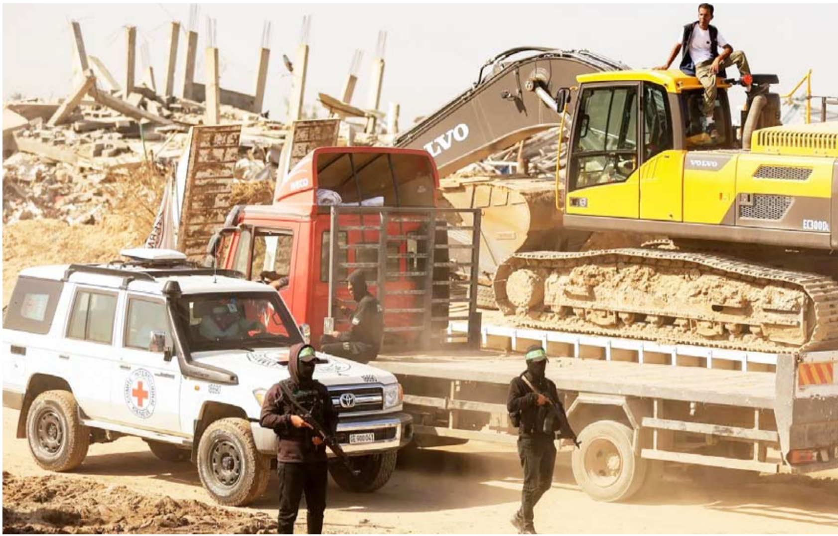
مسلحون من «حماس» مع أعضاء الصليب الأحمر

أقدم أفراد ميليشيات المستوطنين المسلحة، المعروفة باسم «شبيبة التلال»، على تصعيد جديد لاعتداءاتهم الإرهابية في الضفة الغربية، فأحرقوا عدداً من البيوت، ومزرعة قرب بيت لحم، وهدموا المنازل في مناطق القدس ورام الله ونابلس والخليل، فيما قتل جنود إسرائيليين شاہين بالرصاص في بلدة بشمال شرقي مدينة القدس المحتلة. ونقلت الإذاعة الرسمية «كان» عن مصدر سياسي في تل أبيب قوله إن الانطباع السائد أن تلك الميليشيات تعمل تحت غطاء داعم من عدد كبير من الوزراء، ومن قادة المستوطنين، وحتى من عدد من قادة الجيش. والتام المجلس الوزاري الأمني المصغر للحكومة الإسرائيلية، مساء للتداول في خطوة نشاط المستوطنين، فاقترح وزير الدفاع، يسرئيل كاتس، إدخالهم في دورات تثقيف حول «المواطنة الجيدة». تمضي الولايات المتحدة قدماً في خططها لبناء مجتمعات سكنية للمستوطنين على الجانب الإسرائيلي من الخط الفاصل بين غزة وإسرائيل، حيث تستقدم فرقاً من المهندسين وتبدأ في تظهير المواقع على أصل إبعاد المدنيين عن المناطق التي تسيطر عليها «حماس»، وفقاً لتقرير لصحيفة «وول ستريت جورنال». يُعد هذا الجهد اعترافاً ضمناً بأن نزع سلاح الجماعة المسلحة