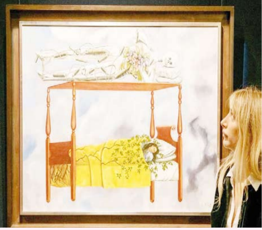
دار «سوزبير» لم تعلن هوية المشتري

بيعت لوحة بورتريه للفنانة المكسيكية فريدا كاهلو لقاء 54.66 مليون دولار، ضمن مزاد أقيم في دار «سوزبير» في نيويورك، لتصبح بذلك أعلى لوحة لفنانة على الإطلاق. تجاوز هذا العمل الذي يحمل عنوان «الحلم (الغرفة)»، الرقم القياسي السابق الذي حققته لوحة للفنانة الأميركية جورجيا أو كيف، حيث بيعت بـ 44.4 مليون دولار عام 2014. وأوصحت دار «سوزبير» عبر إكس أن اللوحة «أنجزت عام 1940، خلال عقد محوري في مسيرة (كاهلو) الفنية،