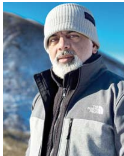
المصور محمد مراد

أحرز المصور الكويتي محمد مراد (إشادة تقديرية) في فئة (صور الحيوانات) ضمن مسابقة (Nature inFocus) للتصوير الفوتوغرافي لعام 2025 التي أقيمت في مدينة (بنغالور) الهندية. ونشر موقع المسابقة، أول أمس، الصور الفائزة بفرعها المختلفة والتي شارك فيها أكثر من 1250 مصورا من نحو 40 دولة قدموا خلالها نحو 16 ألف صورة للتنافس ضمن ثماني فئات تحمل فكرة التصوير الإبداعي للحفاظ على الطبيعة. وقال مراد لـ (كونا): إن فوزه إضافة جديدة لحضور دولة الكويت في مسابقات تصوير الطبيعة والحياة البرية على مستوى آسيا والعالم، معتبرا أن هذا التقدير الدولي يمثل دافعا لمواصلة تقديم أعمال تبرز جمال الحياة البرية وتسهم في رفع الوعي بأهمية حماية الطبيعة.