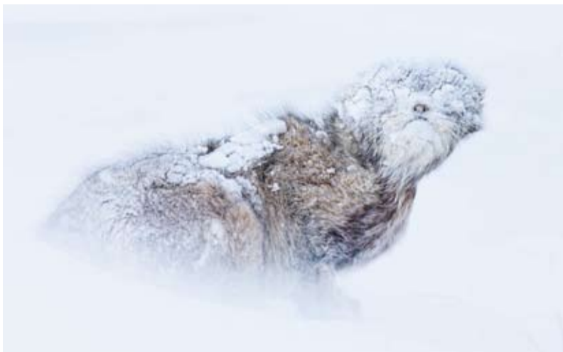
الصورة الفائزة بجائزة الإشادة التقديرية بالمسابقة