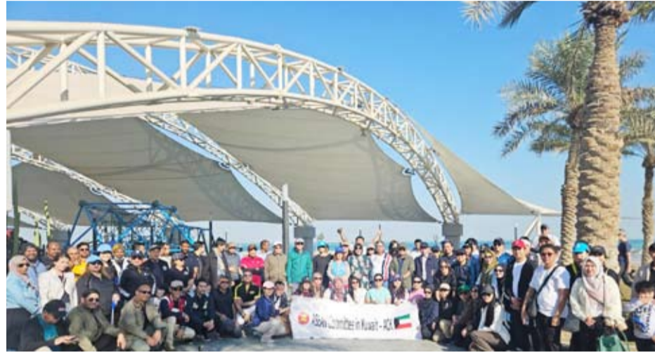
المشاركون في الحملة

العامية وتدعم الجهود الوطنية في حماية البيئة الساحلية ومكافحة التلوث.