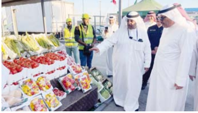
محافظ الجهراء حمد الحبشي خلال افتتاح سوق العبدلي الزراعي

الاستقرار، ولا سيما في منطقة العبدلي الزراعية، وأشاد المحافظ بما يقّمه رجال الأمن من عمل دؤوب وتفان في أداء مهامهم، مؤكداً أن المحافظة تضع الملف الأمني ضمن أولويات عملها بالتنسيق مع وزارة الداخلية وجميع الجهات المعنية لضمان أمن وسلامة المواطنين والمقيمين. وفي ختام الجولة، دعا محافظ «الجهراء» المولى عز وجل، أن يحفظ دولة الكويت وقيادتها الحكيمة وشعبها الكريم، وأن يديم عليها نعمة الأمن والرخاء والأزدهار.