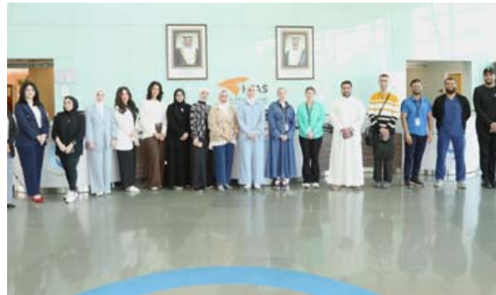
جانب من المشاركين في الورشة

اختتم معهد دسمان للسكري، والذي أنشأته مؤسسة الكويت للتقدم العلمي ورشة العمل المكثفة بعنوان «الوقاية من مضاعفات القدم السكرية وعلاجها»، والتي عقدت خلال الفترة من 16-18 نوفمبر 2025 في مقر المعهد، وذلك بالتعاون مع الإدارة المركزية للرعاية الصحية الأولية بوزارة الصحة ومنظمة الصحة العالمية. شهدت ورشة هذا العام مشاركة 15 طبيباً من مختلف قطاعات الرعاية الأولية والثانوية، حيث اكتسب المشاركون مهارات عملية مبنية على الأدلة العلمية في تقييم القدم السكرية وعلاجها. وتضمنت الورشة عدة محاور أساسية، منها: تقييم عوامل الخطورة، الفحص والتصنيف، الوقاية