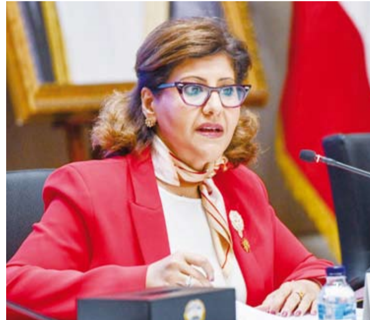
السفيرة الشيخة جواهر الصباح

أكدت مساعدة وزير الخارجية لشؤون حقوق الإنسان السفيرة الشيخة جواهر الصباح، اهتمام وزارة الخارجية بتطوير الرؤى التنموية الرامية إلى ترسيخ المكانة الدولية المتميزة لدولة الكويت التي تأتي ترجمة لاستحقاقاتها في إطار التعهدات الطوعية المقدمة على ضوء عضويتها في مجلس حقوق الإنسان عن الفترة 2024 - 2026 وعزمها الترشح عن فترة أخرى 2027 - 2029، جاء ذلك في كلمة الشيخة جواهر الصباح في الاجتماع التنسيقي الثالث للجنة الوطنية الدائمة لإعداد التقارير ومتابعة التوصيات ذات الصلة بحقوق الإنسان بمقر وزارة الخارجية، أمس، بشأن تنسيق عملية إعداد التقرير الوطني الدوري الرابع للعهد الدولي الخاص بالحقوق الاقتصادية والاجتماعية والثقافية المقرر تقديمه في شهر أكتوبر المقبل بنجنيف والتحضير لمناقشة التقرير الدوري الوطني الجامع للاتفاقية الدولية للقضاء على جميع أشكال التمييز العنصري.