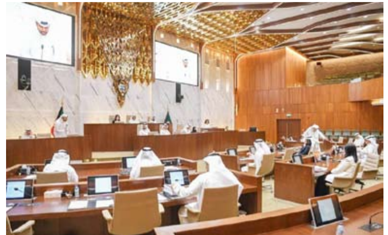
المحري مترشحا للجلسة

المحلات الإعلانية في الطرق والمباني في كل أرجاء الكويت، كما استمعت إلى إفادة ممثل الهيئة العامة للاستثمار، التي أكد فيها ضرورة وضع إطار عام يحدد ضوابط قبول الإعلانات من عدمها، يعقبه الدخول في مرحلة دراسة مقترح إنشاء شركة حكومية تتبرع الهيئة، مبيّن أن هذا النوع من الشركات لا يندرج ضمن اختصاصات الهيئة في الوقت الراهن، لكونه مجالاً جديداً عليها. وأشار الخطاب إلى أن المجلس اطلع على ورقة مقدمة من بلدية الكويت، متضمنة حلولاً في إطار مقترحين، الأول، طرح مزايدات الإعلانات عن طريق الهيئة العامة للاستثمار، وأعاد ممثل الهيئة بصعوبة إنشاء شركة حكومية تتبرع الهيئة، حيث إن هذا النوع من الشركات لا يندرج ضمن اختصاصاتها، والمقترح الآخر يقضي بطرح مزايدات الإعلانات عن طريق بلدية الكويت، عبر التعاقد المباشر مع مكتب استشاري عالمي لوضع حلول لمعالجة المحلات الإعلانية التي تشوه المرافق العامة، ووضع الشروط الخاصة والضوابط اللازمة في الطرق والمباني، وتحديد مواقع اللوحات الإعلانية للمزايدات في المحافظات والطرق السريعة، ووضع الشروط الخاصة والضوابط اللازمة لإقامة اللوحات الإعلانية على المباني بالتنسيق مع بلدية الكويت.