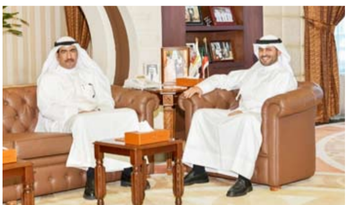
المحافظ مستقبلاً عبد الرشيد

استقبل محافظ مبارك الكبير ومحافظ حولي بالتكليف، الشيخ صباح بدر السالم الصباح، في مكتبه بديوان عام المحافظة، وكيل وزارة الأشغال العامة بالتكليف عيد الرشيد، لبحث سبل تطوير شبكة الطرق والارتقاء بالخدمات في المحافظة. وشهد اللقاء مناقشة موسعة للمشاريع التنموية وآليات تنفيذها، مع التركيز على مقترحات تطوير طرق محافظة مبارك الكبير، بما يحقق استجابة موروثة أفضل وعزز جودة الحياة للمواطنين. وتم استعراض خطط الصيانة الدورية، والتأكيد على أهمية الالتزام بالاولويات لضمان