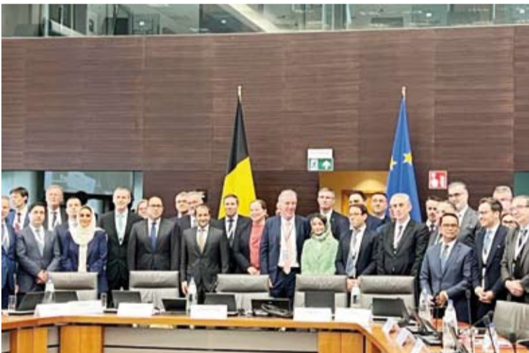
لغة جماعية للمشاركين في الاجتماع التاسع للحزب العالمي من أجل حل الدولتين