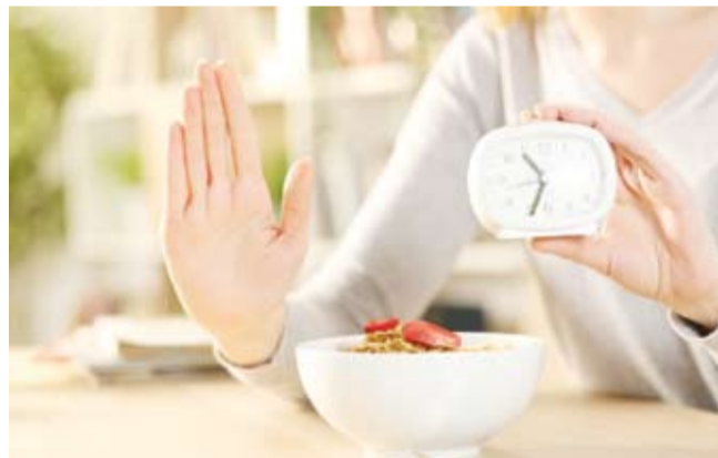
نظام غذائي يحاكي الصيام

في الجهاز الهضمي، خصوصاً الأمعاء الدقيقة والقولون، مع ظهور المرض على شكل نوبات غير منتظمة تخللها مناطق سلمية وأخرى ملتهبة.