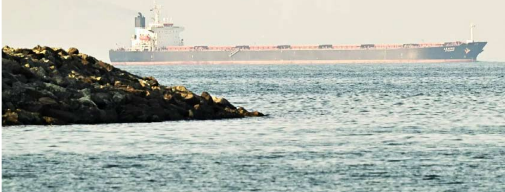
سفينة شحن تجر قرب مضيق هرمز

تزايدت المخاوف من انهيار وقف إطلاق النار بين واشنطن وطهران، بعد أن أعلنت الولايات المتحدة أنها احتجزت سفينة شحن إيرانية حاولت اختراق الحصار المفروض على موانئ إيران التي توعدت بالرد على ذلك. كما بدا أن الجهود الرامية إلى التوصل لسلام أكثر استمراراً في المنطقة تقف على أرضية هشة، إذ أعلنت إيران أنه لا خطط حتى الآن للمشاركة في جولة ثانية من المفاوضات كانت الولايات المتحدة تأمل في أن تبدأ قبل انتهاء وقف إطلاق النار، فيما تكثف باكستان اتصالاتها الدبلوماسية مع واشنطن وطهران لضمان استئناف المحادثات. وأقادت وسائل إعلام إيرانية رسمية أن طهران رفضت إجراء محادثات سلام جديدة، مشيرة إلى الحصار المستمر ولهجة التهديد ومواقف واشنطن المتقلبة ومطالبها المفرطة». قال إسماعيل بقائي المتحدث باسم وزارة الخارجية الإيرانية، إنه لا توجد خطة في الوقت الراهن لجولة ثانية من المفاوضات مع الولايات المتحدة. وأضاف في مؤتمر صحفي أن الولايات المتحدة أظهرت أنها «غير جادة» فيما يتعلق بالمضي في العملية الدبلوماسية وارتكبت أعمالاً عدوانية وانتهكت بنود وقف إطلاق النار. من جانبها، قال السفير الإيراني لدى روسيا، كاظم جلاي، إن طهران تضمن سلامة الملاححة عبر مضيق هرمز بموجب نظام قانوني جديد،