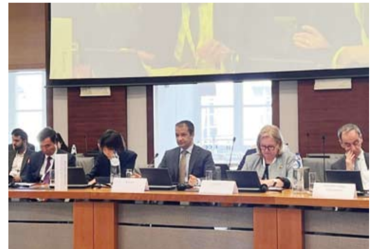
السفير العنزي خلال حضوره الاجتماع

وجدد السفير العنزي، إدانة دولة الكويت الشديدة للأعمال الوحشية التي ترتكبها قوات الاحتلال الإسرائيلي في قطاع غزة وأسفرت عن سقوط نحو 70 ألف قتيل وإصابة أكثر من 170 ألفاً معظمهم من النساء والأطفال.