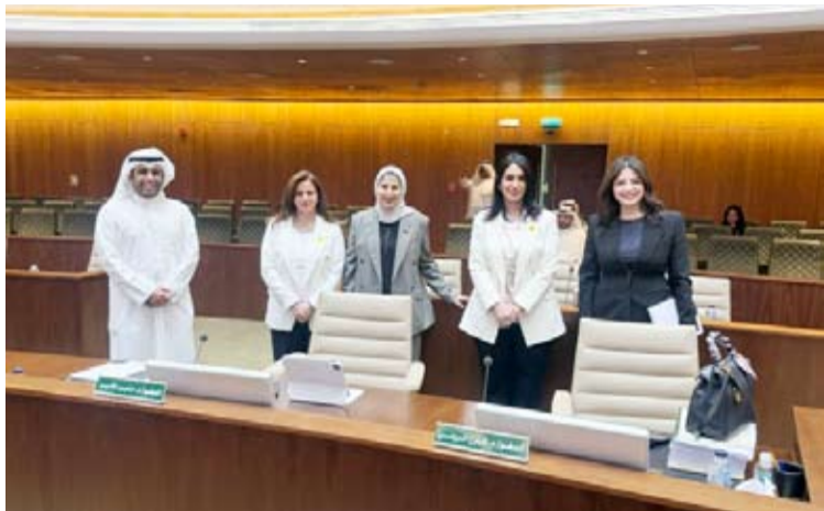
مدير عام البلدية وأعضاء المجلس البلدي