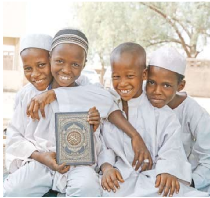
حلقات حفظ القرآن الكريم

ويبين المطوع أن قيمة كفالة اليتيم تبلغ 25 ديناراً داخل الكويت، و15 ديناراً خارج الكويت، مؤكداً أن هذه المبالغ تساهم بشكل كبير في تحسين حياة الأيتام وتوفير احتياجاتهم الأساسية. وأشار إلى أن كفالة اليتيم لا تقتصر على الدعم المادي فحسب، بل تمتد لتشمل الرعاية الشاملة التي تضمن تنشئتهم بشكل سليم وتمكينهم ليكونوا أفراداً فاعلين في مجتمعاتهم. ودعا المطوع أهل الخير والمحسنين إلى المبادرة بكفالة الأيتام والمساهمة في هذا المشروع الإنساني العظيم، لما له من أجر كبير عند الله، مستشهداً بقول النبي: «أنا وكافل اليتيم في الجنة كهاتين»، مشيراً إلى أن هذه الكفالة تمثل فرصة عظيمة لنيل الأجر ومضاعفة الحسنات، كما توجه بالشكر والتقدير إلى الداعمين، داعياً الله عز وجل أن يجعل ما يقدمونه في ميزان حسناتهم، وأن يحفظ الكويت وأهلها وسائر بلاد المسلمين من كل سوء.