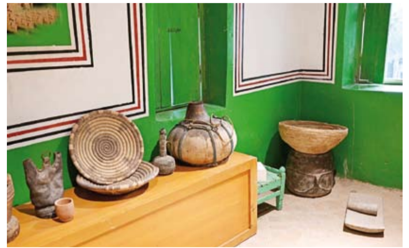
الأواني القديمة مكون أصيل من الموروث الثقافي في المملكة

ترسيخ قيمتها بوصفها شاهداً حياً على الهوية المحلية. وفي إطار المحافظة على هذا الإرث، تتواصل الجهود المؤسسية عبر مبادرات تقودها جهات ثقافية، من بينها وزارة الثقافة وهيئة التراث، وذلك من خلال توثيق الحرف التقليدية وتنظيم المعارض والفعاليات التي تُسهم في إبراز هذا الموروث وتعزيز حضوره لدى الأجيال الجديدة.