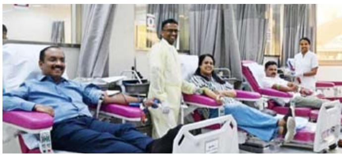
جانب من المتبرعين

نظمت رابطة «كولام جيلا براواسي ساماجام» (KJPS) في الكويت، بالتعاون مع «حملة التبرع بالدم - كيرلا الكويت» (BDK)، حملة للتبرع بالدم في بنك الدم المركزي بمنطقة الجابرية، وذلك في إطار التزامها بالعمل الإنساني وخدمة المجتمع. وشهدت الحملة إقبالاً لافتاً من أعضاء الجالية، حيث بادر عدد كبير منهم إلى التبرع بالدم طوعاً، في خطوة تعكس روح التضامن والمسؤولية الاجتماعية. وتعد KJPS رابطة تضم