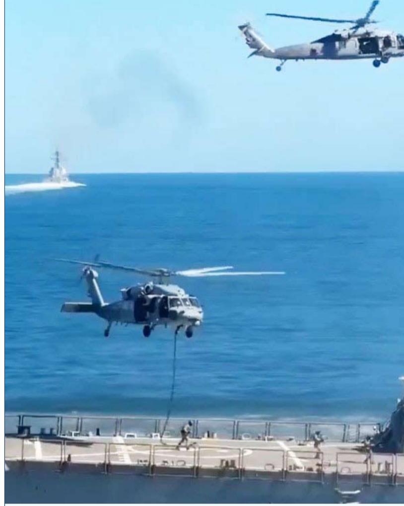
إنزال أميركي على السفينة الإيرانية توسكا

يبدو أن الوزير الروسي نسي أن الاحتلال الصهيوني هو من تسبب في الأزمات المتلاحقة التي شهدها الشرق الأوسط منذ أكثر من 40 عاماً، وأن احتلال فلسطين هو سبب رئيسي لما يحدث حالياً، ورغم أن روسيا غير مهتمة بفلسطين إلا أن وزيرها أراد تذكيرنا بقضيتنا الأساسية.. لن ننسى.