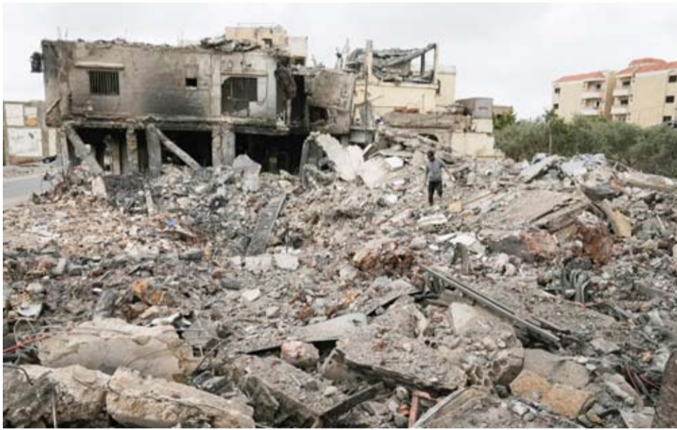
جانب من الدمار في لبنان

كشف مصدر وزاري لـ«الشرق الأوسط» أن لبنان طلب من واشنطن أن تتدخل لتمديد الهدنة بين إسرائيل و«حزب الله» لئلا تجرى المفاوضات المباشرة بين البلدين «تحت النار». وبحسب المصدر، فإن عودة السفير الأميركي لدى لبنان ميشال عيسى، إلى بيروت، تفتح الباب أمام اختبار مدى استعداد الإدارة الأميركية للتجاوب مع رغبة الرئيس اللبناني جوزيف عون بتمديد الهدنة، التي توصل إليها الرئيس دونالد ترمب، إفساحاً في المجال أمام تحصينها وتثبيتها، لئلا تبقى هشة في ضوء تبادل التهديدات بين إسرائيل و«حزب الله» الذي أعلن استعداده ميدانياً للرد على خروقتها لوقف النار. وأشار المصدر إلى أن تبادل التهديدات بين إسرائيل و«حزب الله» يقلق الجنوبيين وعون، خصوصاً أن إقحام الجنوب في دورة جديدة من المواجهة لا يخدم التحضيرات لإعداد الورقة اللبنانية التي على أساسها ستنتقل المفاوضات في أجواء هادئة. وحذّر الجيش الإسرائيلي، سكان عشرات القرى في جنوب لبنان من العودة إليها، قائلًا إن نشاطات «حزب الله» هناك مستمرة، رغم اتفاق وقف إطلاق النار، وفق ما أوردته «وكالة الصحافة الفرنسية».