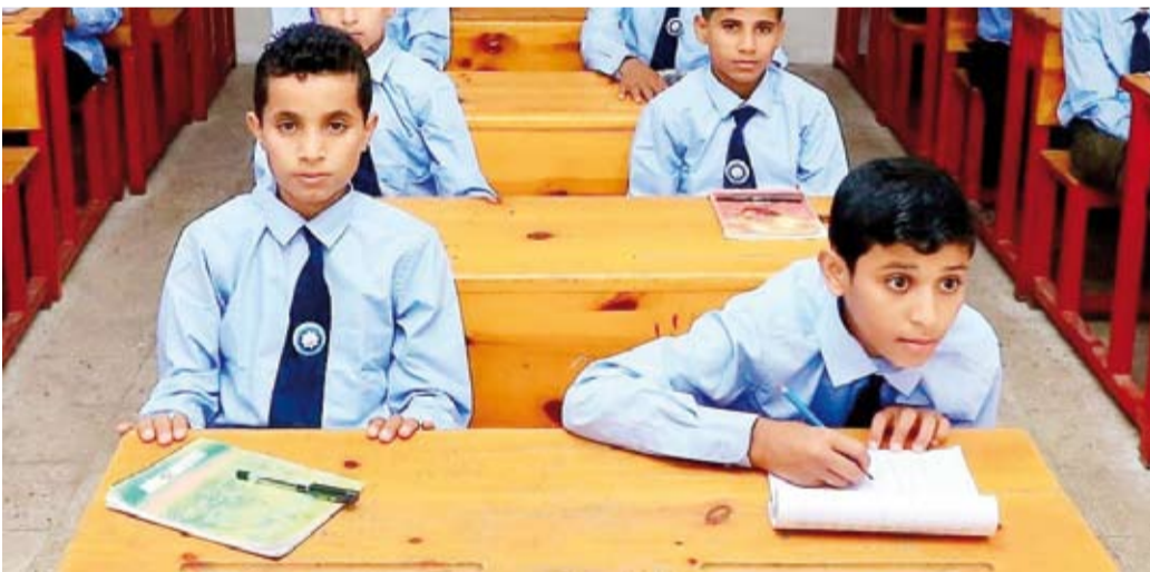
كفالة الطلبة الأيتام في اليمن