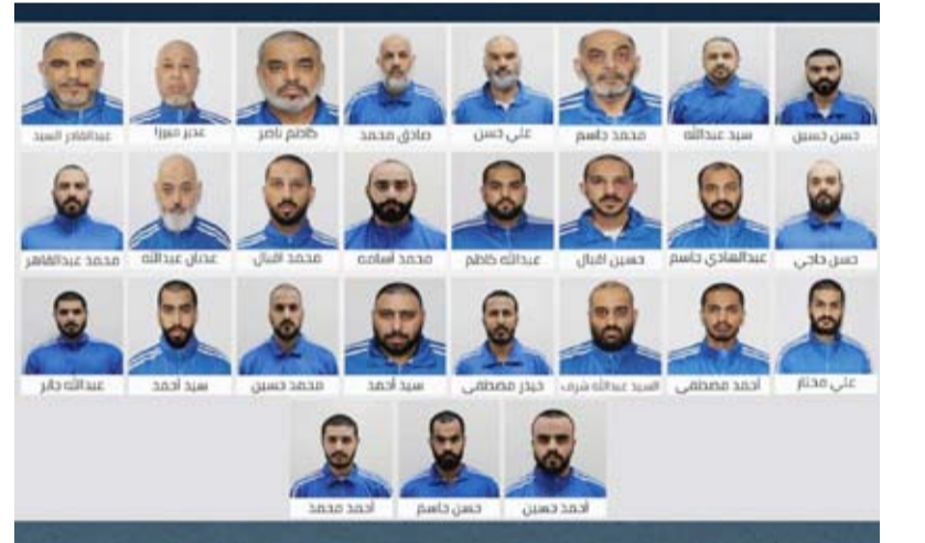
أعضاء التنظيم المتورطون في التخطيط لأعمال إرهابية

أعلن جهاز أمن الدولة الإماراتي أمس تفكيك تنظيم إرهابي والقبض على عناصره لتورطهم في نشاط سري استهدف المساس بالوحدة الوطنية وزعزعة الاستقرار من خلال التخطيط لتنفيذ أعمال إرهابية وتخريبية ممنهجة على أراضي الدولة حيث كشفت التحقيقات ارتباط التنظيم بإيران. وذكرت وكالة أنباء الإمارات (وام) أن التحقيقات أظهرت تبني أعضاء التنظيم أيديولوجيات وأفكاراً متطرفة تهدد الأمن الداخلي حيث قاموا بتنفيذ عمليات استقطاب وتجنيد عبر لقاءات سرية وفق مخطط منسق مع جهات خارجية بهدف الوصول إلى مواقع حساسة.