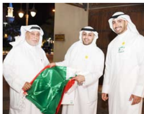
توزيع الاعلام على المارة في مواقع حيوية

أعلن البنك التجاري الكويتي دعمه ومشاركته في الحملة الوطنية «علم الكويت فوق كل بيت»، التي أطلقها مركز العمل التطوعي، برئاسة الشبيخة أمثال الأحمد، بهدف تعزيز قيم الانتماء الوطني، وترسيخ رمزية العلم الكويتي في نفوس المواطنين والمقيمين، في إطار التزامه الراسخ بالأسس ولبية الاجتماعية والوطنية.