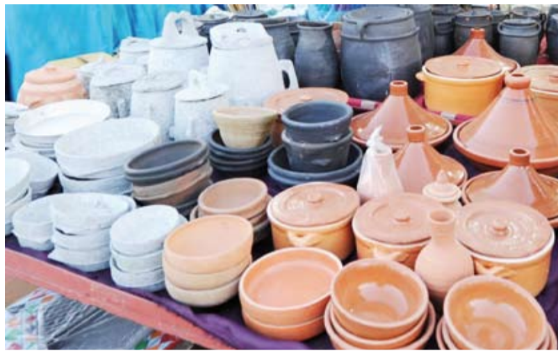
أواني للطواجن وإعداد الأطعمة