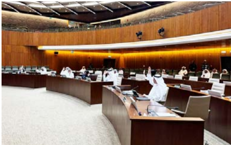
جانب من الجلسة