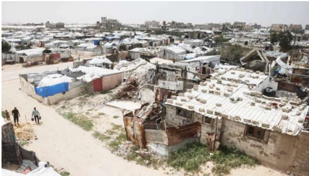
ناحون فلسطينيون في مخيم بخان يونس

الإسرائيلي على هذه الاتهامات. وأكدت الحركة ضرورة تنفيذ بنود المرحلة الأولى بشكل كامل، على أساس أن ذلك شرط للانتقال إلى مناقشة قضايا المرحلة الثانية. المستمرة التي تقودها أطراف إقليمية ودولية لتثبيت وقف إطلاق النار في قطاع غزة، وسط تحديات تتعلق بتنفيذ بنود الاتفاق، لا سيما ما يتعلق بإدخال المساعدات الإنسانية، وترتيبات الانسحاب العسكري. وكان اتفاق لوقف إطلاق النار قد دخل حيز التنفيذ في أكتوبر الماضي، ويتضمن مراحل متعددة تشمل تبادل محتجزين، وإدخال مساعدات إنسانية، وصولاً إلى ترتيبات أوسع تتعلق بترزح سلاح حركة «حماس»، والانسحاب الإسرائيلي من قطاع غزة، وإعادة الإعمار، ومستقبل إدارة القطاع.