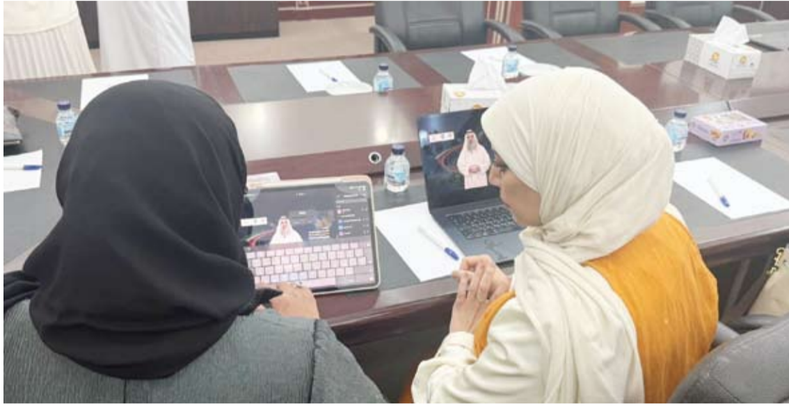
جانب من المؤتمر العلمي

إدارات التوجيه الفني المختصة حصلت على صلاحيات الوصول لقاعدة البيانات لإعداد تقارير تفصيلية