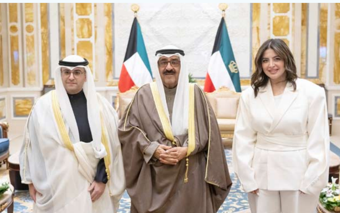
سمو الأمير استقبل وزير البلدية ومدير عام البلدية

استقبل سمو أمير البلاد الشيخ مشعل الأحمد بقصر بيان صباح أمس وزير الدولة لشؤون البلدية الدولة لشؤون الإسكان عبداللطيف المشاري حيث قدم لسموه مدير عام بلدية الكويت المهندسة منال العصفور وذلك بمناسبة تعيينها بمنصبها الجديد.