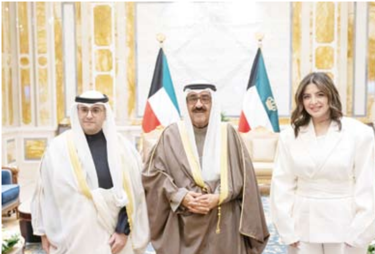
سمو الأمير مستقبلا وزير البلدية ومدير عام البلدية

وبدوره، استقبل سمو الشيخ أحمد العبدالله رئيس مجلس الوزراء في قصر بيان امس وزير الدولة لشؤون البلدية ووزير الدولة لشؤون الإسكان عبداللطيف حامد المشاري حيث قدم لسموه مدير عام بلدية الكويت المهندسة منال محمد العصفور وذلك بمناسبة تعيينها في منصبها الجديد.