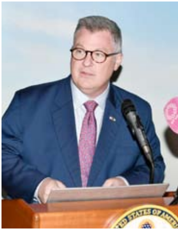
الخبير البريطاني من شركة غوغل ماثيو هيرلنج

ستيفن باتلر: الاحتفاء بالابتكار الأميركي يعكس الالتزام بتعزيز أمن الفضاء الرقمي وحماية البنى التحتية الحيوية