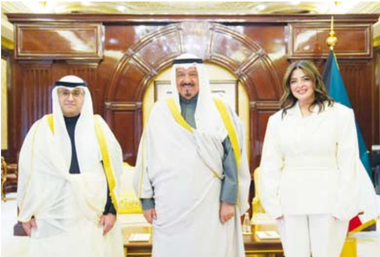
سمو رئيس مجلس الوزراء يستقبل المشاري والعصفور