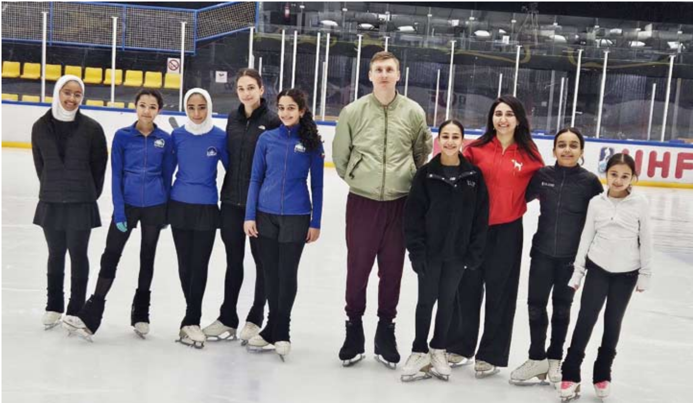
الخبير الفني يوجور ادميرال متوسط الالعاب الكويتيات

وأكد العجمي حرص النادي على استقدام هذا الخبير الذي جاء بترشيح من الاتحاد الدولي لدعم الالعاب الكويتيات وتشجيعهن على مواصلة التتاليق باللعبة موضّحاً أن هذه الخطوة تأتي تنفيذاً للخطّة الاستراتيجية التي وضعها مجلس الإدارة لتطوير الألعاب الشتوية الكويتية الخمس التي يشرف عليها ومنها (الفيغر).