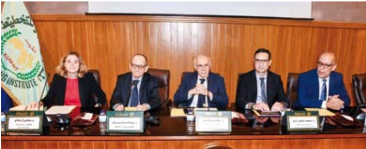
المندوبون في الندوة