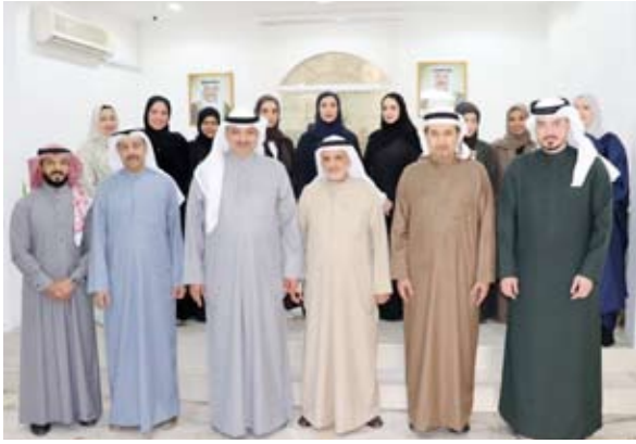
د.بدر البصري خلال زيارته لمقر المكتب الثقافي الكويتي في البحرين

التي تؤكد أهمية التواصل المباشر مع المكاتب الثقافية والوقوف على احتياجات الطلبة الدارسين في الخارج عن قرب مشدداً على الدور المحوري الذي تضطلع به هذه المكاتب في تقديم الإرشاد الأكاديمي والمتابعة المستمرة وتعزيز العلاقات مع المؤسسات التعليمية في دول الابتعاث. وأشاد الدكتور البصري بالجهود التي يبذلها المكتب الثقافي في البحرين لرعاية الطلبة ومتابعة شؤوهم والتنسيق المستمر مع الجامعات والمؤسسات التعليمية بما يخدم مصلحة الطلبة ويعزز من كفاءة منظومة الابتعاث.