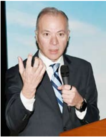
القائم بالأعمال في السفارة الأمريكية ستيفن باتلر

تحديد أولويات الحماية وإعادة توجيه الاستثمارات نحو الإجراءات الأكثر فاعلية مع تغير طبيعة المخاطر. وشدد على أن تطبيق الأساسيات مثل التحديثات الأمنية يمثل خط الدفاع الأول مبينا أن استمرار استغلال ثغرات قديمة يعكس ضعفا في الالتزام بالإجراءات الأساسية. ودعا إلى اعتماد برامج مرنة لحماية الأصول الحيوية.