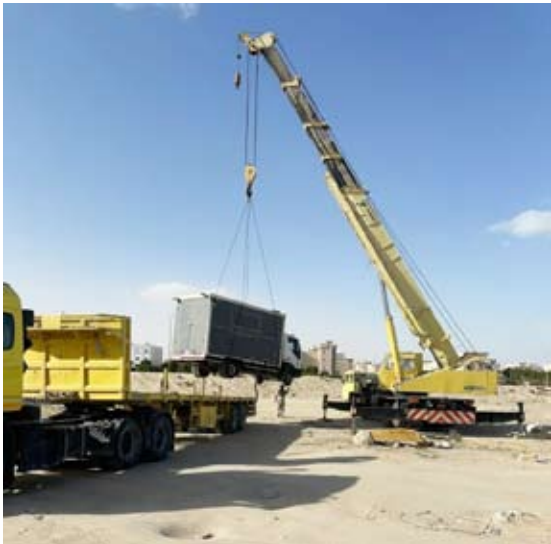
رفع بقالة منتقلة

في إدارة أسلاك الدولة لاستغلالها الاستغلال الأمثل وفقاً للإجراءات والنصوص القانونية المعمول بها وبما يتسجم مع السياسة الحكومية لتنظيم إسكان العمالة وتخفيف الضغط عن المناطق الحضرية. كما ناقشت اللجنة عدداً من الطلبات الأخرى حيث وافقت على إعادة تقسيم قسائم في منطقة المرقاب لصالح إحدى الجهات الخاصة كما قررت إبقاء طلب استقطاع جزء من موقع مدرسة في منطقة اليرموك لتخصيص محطة تحويل كهرباء بالتنسيق مع وزارة التربية علي جدول أعمال اللجنة مع دعوة وزارة الكهرباء والماء والطاقة المتجددة فيما قررت اللجنة إحالة طلب إعادة تنظيم قسائم في منطقة القبلة بمدينة الكويت إلى الجهاز التنفيذي لإبداء الرأي الفني بشأنه إلى جانب إحالة طلب إضافة دورين لمواقف سيارات متعددة الأذوار في منطقة حولي للجهاز التنفيذي لدراسته فنياً. وفي ختام الاجتماع أكدت المهندسة منيرة الأمير أن قرارات اللجنة الفنية تأتي في إطار