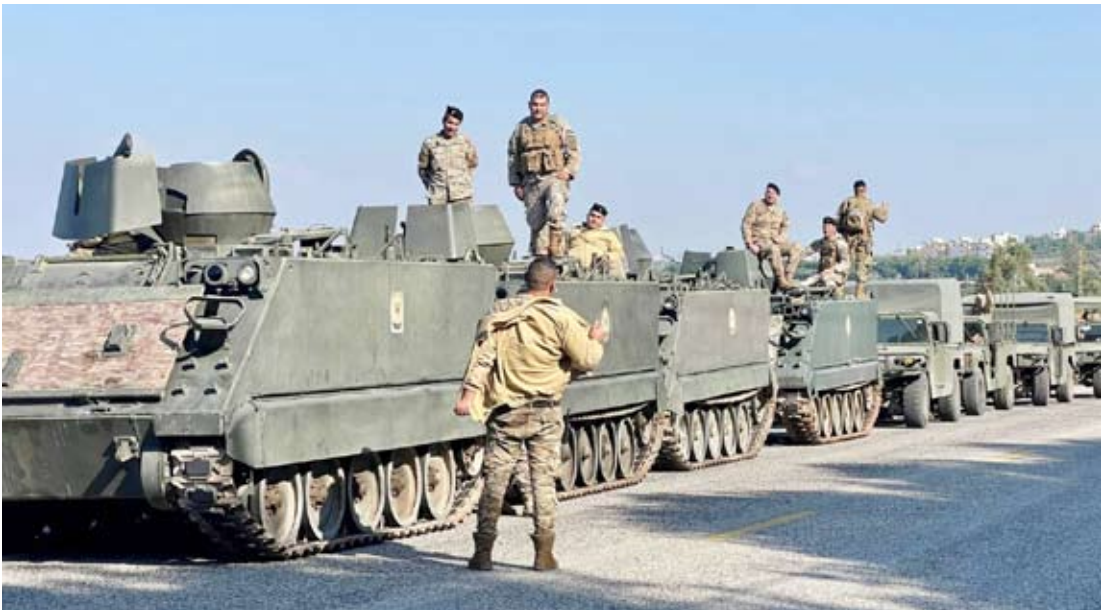
عناصر الجيش اللبناني عند الحدود الجنوبية

عنيفة استهدفت بلدات أنصار والزارية، ومجرى نهر الشّتي عند أطراف بلدة اللوزية في منطقة إقليم التفاح، إضافة إلى بلدة كفر ملكي، ما أدى إلى حالة من الخوف والقلق في صفوف الأهالي.