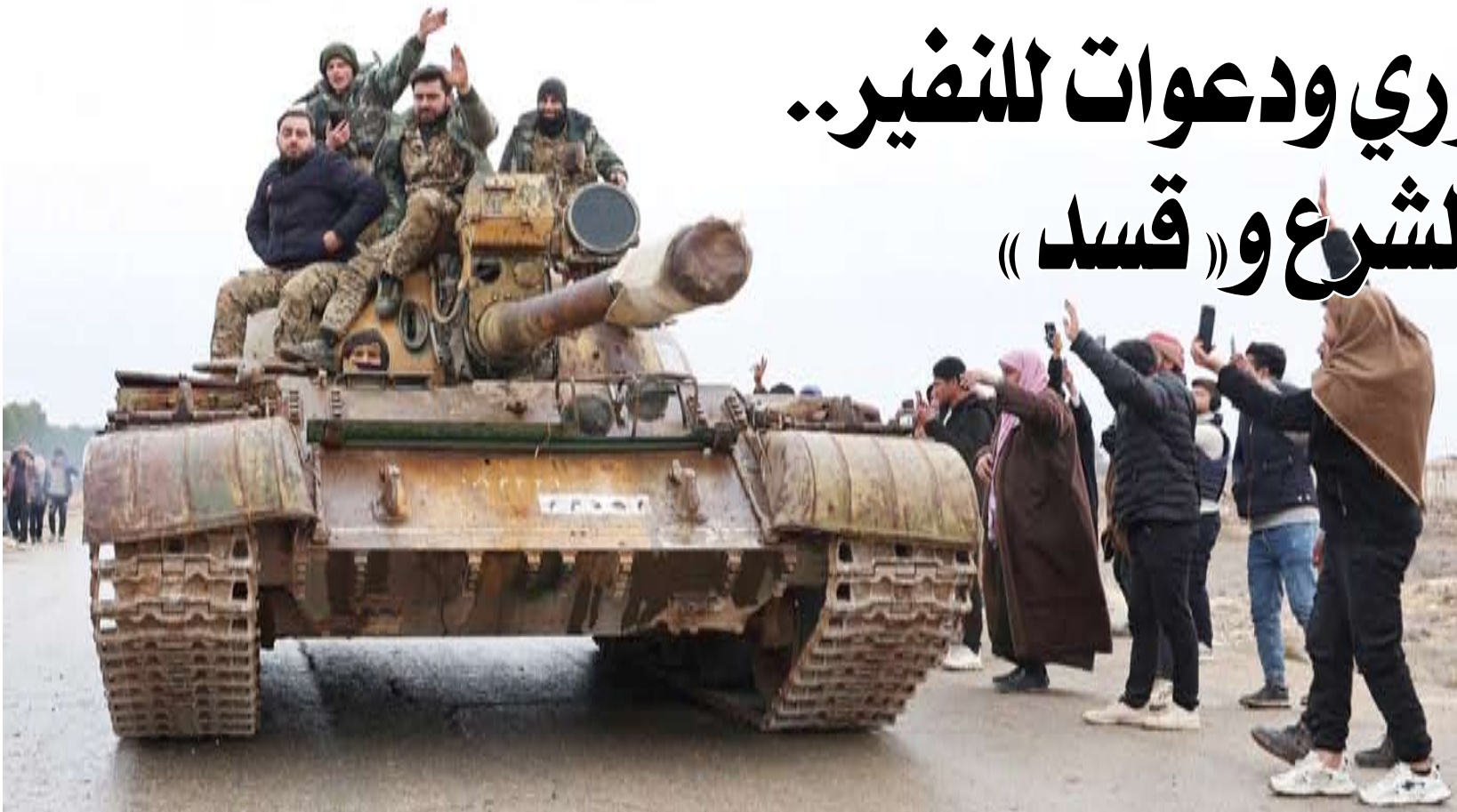
قوات الجيش السوري تقدم في الرقة

ومؤتمر الدوحة الدولي للدفاع البحري، وقالت الوكالة الرسمية إن الاتفاقية تهدف إلى «تعزيز مجالات التعاون المشترك، بما يخدم المصالح المتبادلة ويعزز الشراكات الدفاعية بين دولة قطر وجمهورية الصومال الفيدرالية».