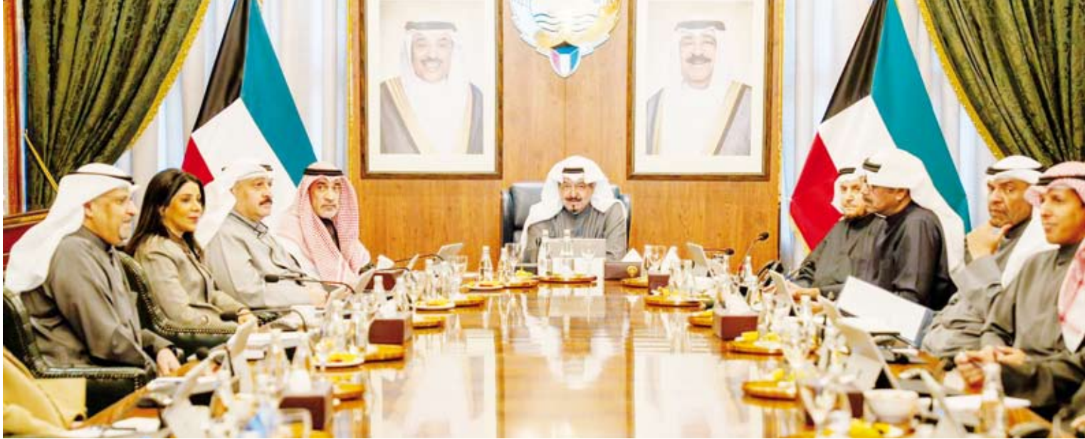
العبدالله يترأس اجتماع المجلس