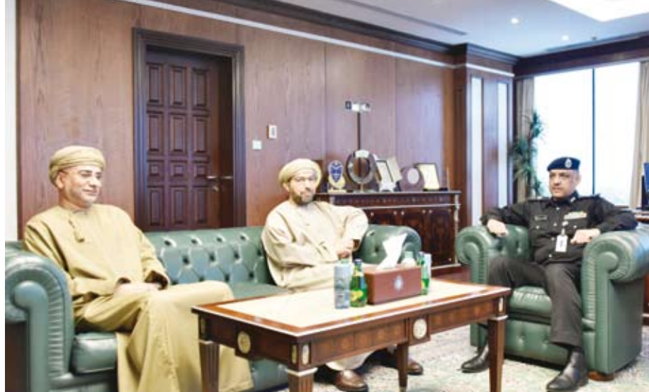
الوهيب مستقبل الخروصي والرواس

بحث وكيل وزارة الداخلية اللواء عبدالوهاب الوهيب مع سفير سلطنة عمان لدى دولة الكويت الدكتور صالح الخروصي والوزير المفوض شهاب بن سالم الرواس نائب رئيس البعثة بسفارة سلطنة عمان عدداً من الموضوعات ذات الاهتمام المشترك وسبل تعزيز التعاون والتنسيق بين الجانبين لاسيما في المجالات الأمنية بما يخدم المصالح المشتركة للبلدين الشقيقين. وقالت الداخلية في بيان صحفي إن اللواء الوهيب نقل لهم تحيات النائب الأول لرئيس مجلس الوزراء ووزير الداخلية الشيخ فهد اليوسف مؤكدا حرص الوزارة على تعزيز العلاقات الثنائية وتطوير آفاق التعاون المشترك مع عمان. وأشاد بمناخ العلاقات الأخوية التي تجمع البلدين وبدعم القيادتين الرشيدتين في الكويت وعمان لكل ما من شأنه تعزيز الأمن والاستقرار.