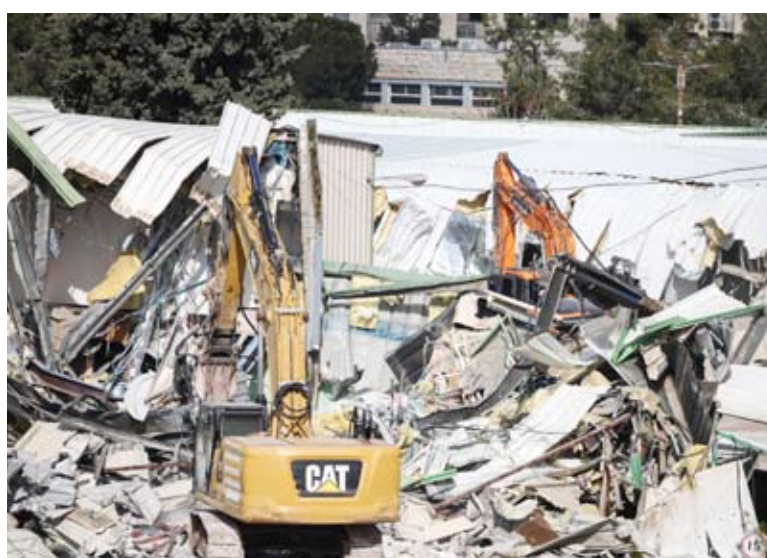
جرافات الاحتلال أزال مكاتب الوكالة في حي الشيخ جراح

قامت سلطات الاحتلال أمس بهدم مكاتب متنقلة داخل مقر وكالة غوث وتشغيل اللاجئين الفلسطينيين «أونروا» في حي الشيخ جراح بمدينة القدس المحتلة ورفع علمها فوق المقر الرئيسي. وذكرت محافظة القدس في بيان أن أليات الاحتلال برفقة دائرة أراض تابعة له هدمت مكاتب متنقلة داخل مجمع الوكالة الدولية وأقدمت على إزالة علم الأمم المتحدة ورفع علم دولة الاحتلال بذريعة عدم الترخيص. وأوضحت أن ما يسمى وزير الأمن القومي في حكومة الاحتلال المتطرف إيتمار بن غفير شارك في عملية الهدم التي اعتبرتها خطوة تصعيدية خطيرة تعكس سياسة منهجة تستهدف وكالة أممية تتمتع بالحصانة القانونية الدولية.