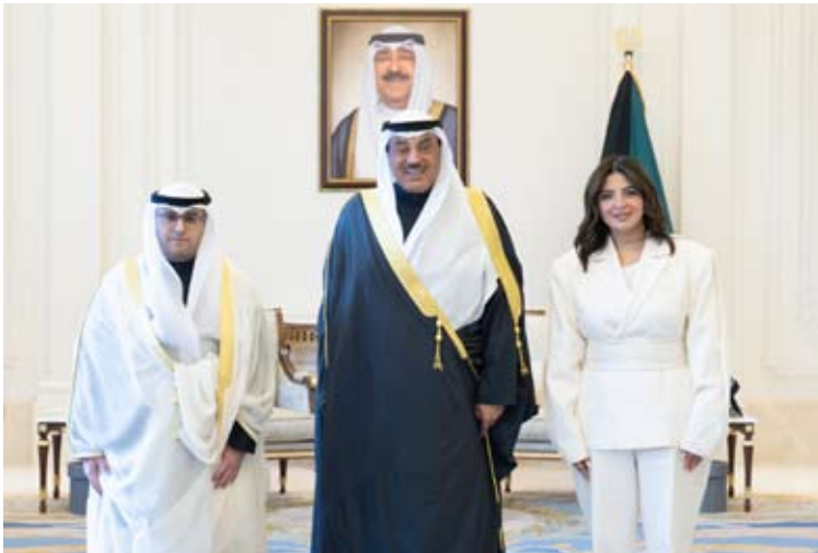
سمو ولي العهد يستقبل المشاري والعصفور