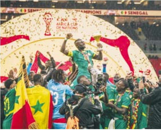
السنغال حققت لقب إفريقيا للمرة الثانية في تاريخها

حظي المنتخب السنغالي لكرة القدم باستقبال الأبطال، في أعقاب التتويج بلقب بطولة أمم أفريقيا، حيث كان في استقبالهم رئيس الدولة وبعض المسؤولين الكبار لدى وصولهم لداكار، قبل أن يقوموا بجولة قصيرة في شوارع المدينة على متن حافلة مكشوفة.