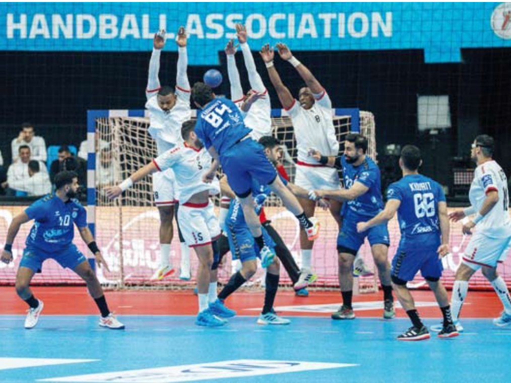
أزرق اليد يحقق الانتصار الثالث على التوالي

تغلب منتخب الكويت لكرة اليد على نظيره الإماراتي بنتيجة (27-22) ضمن مواجهات المجموعة الثالثة في إطار منافسات بطولة كأس آسيا الـ22 للرجال (الكويت 2026) المؤهلة إلى كأس العالم (مانيا 2027).