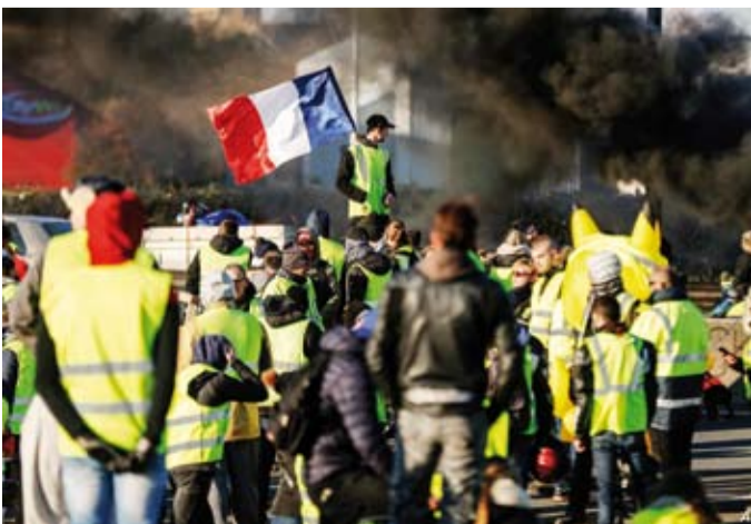
احتجاجات سابقة في فرنسا

وأعلن الناطق باسم الحكومة الوزير أولفييه فيران، أمس، أن الدولة ستواصل ما بدأت به بإلزام موظفين في المصافي والمستودعات بالعمل رغم الإضراب في الوقت الذي تصاعد فيه الاحتجاجات.