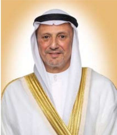
الشيخ سالم الصباح

أعربت وزارة الخارجية في بيان لها عن ترحيب دولة الكويت بإعلان أستراليا إلغاء اعتراف حكومتها السابقة بالقدس الغربية عاصمة مزعومة للاحتلال الإسرائيلي.