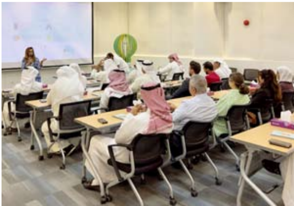
إقبال تُمييز من قبل المبادرين الجُدد على المعسكر التدريبي الأول

أعلنت زين عن انطلاق اللقاء التنويري والمعسكر التدريبي الأول للدورة السابعة من برنامج Zain Great Idea لتسريع الشركات التكنولوجية الناشئة، والذي شهد حضوراً وإقبالاً كبيرين من قبل أصحاب الأفكار والمبادرين الجدد لاكتساب أساسيات إدارة الشركات الناشئة بتواجد مجموعة من المرشدين العالميين أصحاب الخبرة في مجالات ريادة الأعمال. وانطلقت مؤخراً الدورة السابعة من برنامج زين المبتكر بحلّة جديدة كلياً بالتعاون مع مؤسسة Brilliant Lab بهدف تطوير منظومة الشركات التكنولوجية الناشئة والابتكارات الرقمية في مجتمع الأعمال الناشئة الكويتي