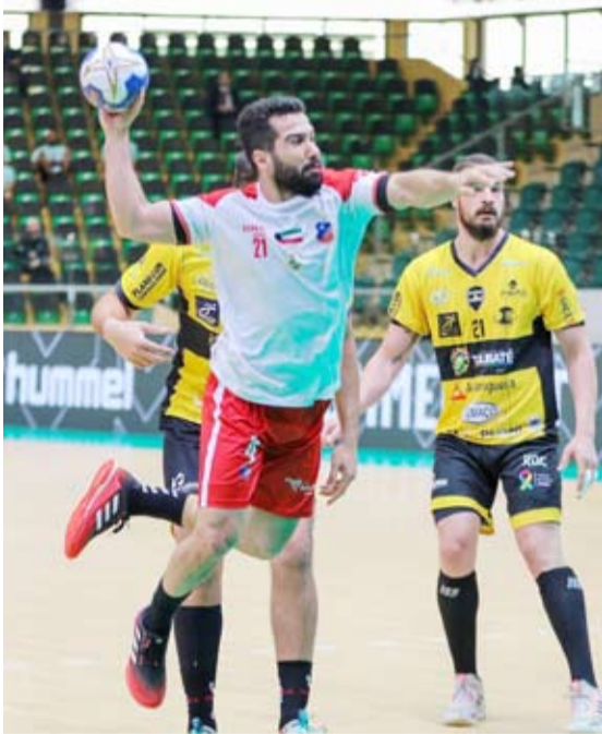
مستويات مميزة قدمها الأبيض الكويتي رغم الهزيمة

الأولى كلا من (ماغديبورغ) الألماني و(سيدني) الأسترالي وكذلك سيقام لقاء بجمع نادي (برشلونة) الإسباني مع نادي (مينيسستروس) المكسيكي ضمن المجموعة الرابعة فيما يلتقي نادي (مضر) السعودي بنظيره (الأهلي) المصري ضمن منافسات المجموعة الثامنة.