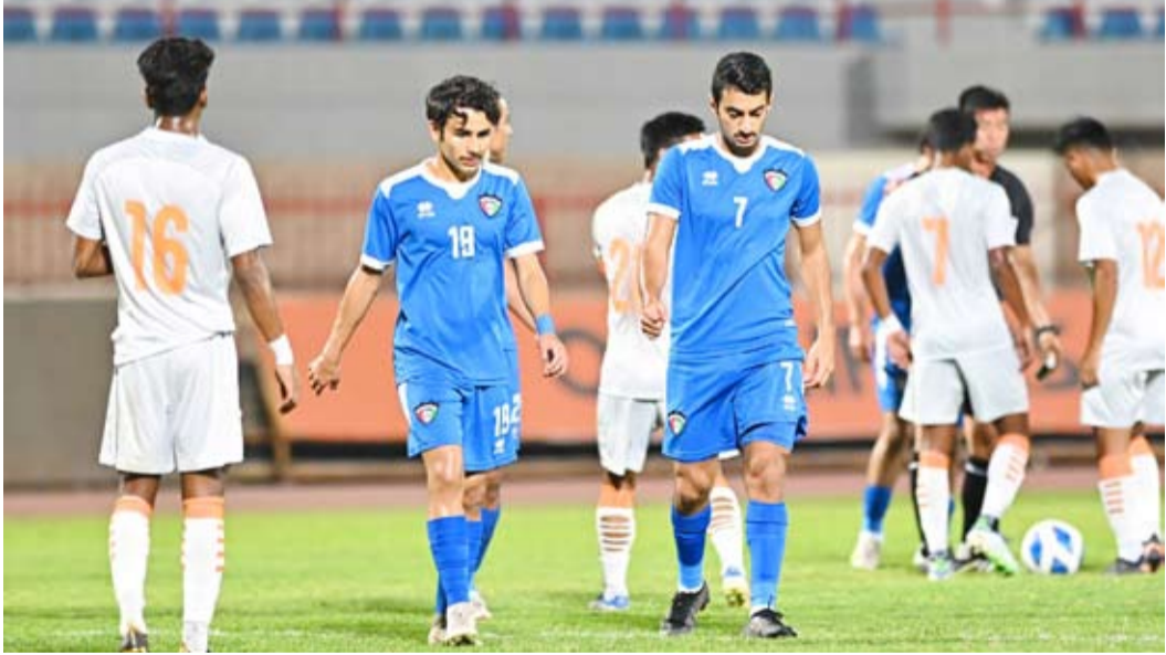
شباب الكويت فشل في حصد أي نقاط في المجموعة

ودع المنتخب الكويتي لكرة القدم للشباب تحت 20 عاماً، التصفيات المؤهلة لكأس آسيا، بهزيمة 2/1، في مواجهة المنتخب الهندي، في المباراة التي جمعت بينهما ضمن منافسات المجموعة الثامنة.