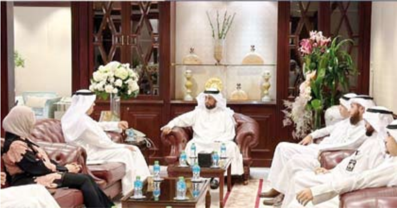
الوزير عمار العجمي خلال لقائه قيادات «السكنية»

دعا وزير الدولة لشؤون مجلس الأمة وزير الدولة لشؤون الإسكان والتطوير العمراني، عمار العجمي، قيادات المؤسسة العامة للتطوير العمراني إلى توفير سبل الراحة للمواطنين وإنجاز معاملاتهم بأقرب وقت ممكن وتذليل المعوقات والمشاكل التي تواجههم.