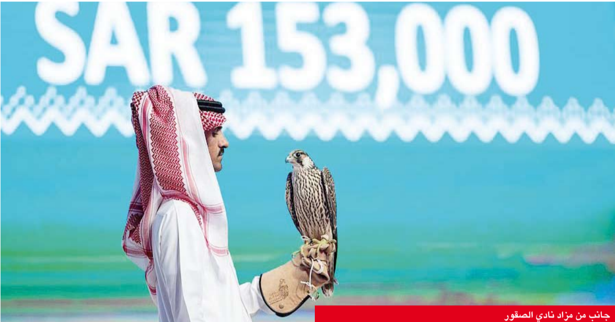
جانب من مزاد نادي الصقور