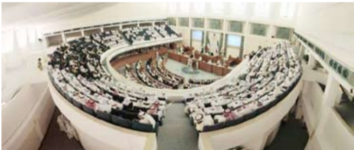
قاعة عبدالله السالم

انتهت لجان مجلس الأمة من اختيار رؤسائها ومقرريها عدا لجنتي المعاقين وغير محددتي الجنسية.