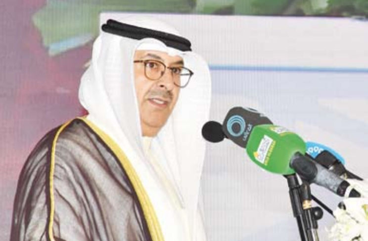
الوزير عبدالعزيز الماجد متحدثاً

ونسأل الله أن يحفظ الكويت وأهلها وأن يزيدنا رضاء ورفعة وإزدهار ونسأله تعالى أن يبارك في هذه الجائزة وأن يوفق القائمين عليها لمزيد من التقدم والتطور والريادة في خدمة كتابه الكريم. بعد ذلك تم عرض فيلم وثائقي عن الجائزة. وقد قام ممثل سموه حفظه الله ورعاه بتكريم الشخصيات القرآنية ولجان التحكيم وتقديم الجوائز على الفائزين والجهات الفائزة بمسابقة الكويت الدولية لحفظ القرآن الكريم وقراءته وتجويد تلاوته بدورتها الحادية عشر كما تم تقديم هدية تذكارية إلى صاحب السمو أمير البلاد الشيخ نواف الأحمد بهذه المناسبة.