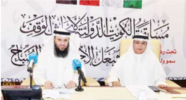
جانب من المؤتمر الصحفي

مرض هشاشة العظام بالغذاء المتوازن الغني بالكالسيوم والبروتين وفيتامين (د) والتمارين الرياضية التي تقوي العظام. وأوضحت أن الرابطة نظمت دورات يتم من خلالها تدريب وتأهيل عدد من أطباء الرعاية الأولية لإنشاء عيادات متخصصة بمرض هشاشة العظام بمراكز الرعاية الأولية مما يسهل على المرضى الحصول على الكشف المبكر للهشاشة. وذكرت أن هذه الخطوة مهمة لتعزيز الوقاية والكشف المبكر عن هذا المرض الصامت مما قد يسهم في تقليل معدلات الكسور المرتبطة بالهشاشة. وبيّنت أن اليوم العالمي لهشاشة العظام من ضمن الاعياد الصحية على مستوى العالم والذي يحتفل به في 20 أكتوبر من كل عام لإلقاء