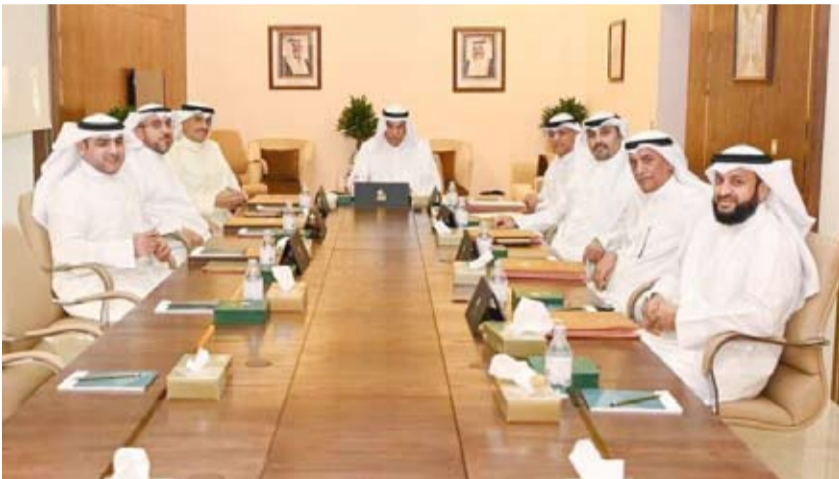
اجتماع مكتب مجلس الأمة

وأشار إلى مكتب المجلس قرر عدم القيام بأي ندب أو تكليف استشاري جديد لحين وضع آلية موحدة شفافة تلتزم بالعدالة وبالتكوين لأي