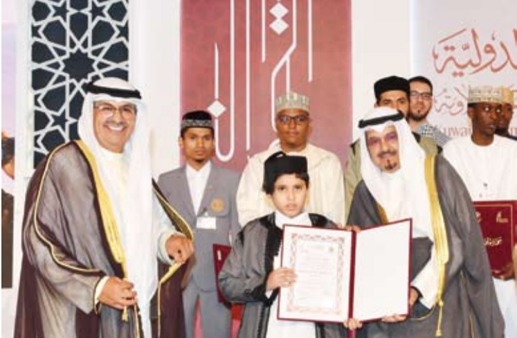
تقديم الجوائز على الفائزين بمسابقة الكويت الدولية لحفظ القرآن الكريم وقراءته وتجويد تلاوته