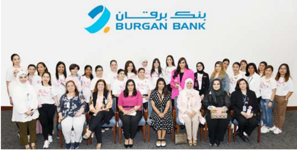
فريق البنك مع ممثلي مستشفى رويال حياة

اختتم بنك برقان مؤخراً ورشته التوعوية الصحية التي نظمها لموظفيه بالتعاون مع مستشفى رويال حياة في المبنى الرئيسي للبنك، وذلك في إطار فعالياته الخاصة بشهر التوعية بسرطان الثدي. وجاءت هذه المبادرة في سياق استراتيجية البنك الشاملة للمسؤولية المجتمعية، وبهدف نشر الوعي بين كادره وموظفيه، وخصوصاً الموظفين، حول هذا المرض والمساهمة في الوقاية منه.