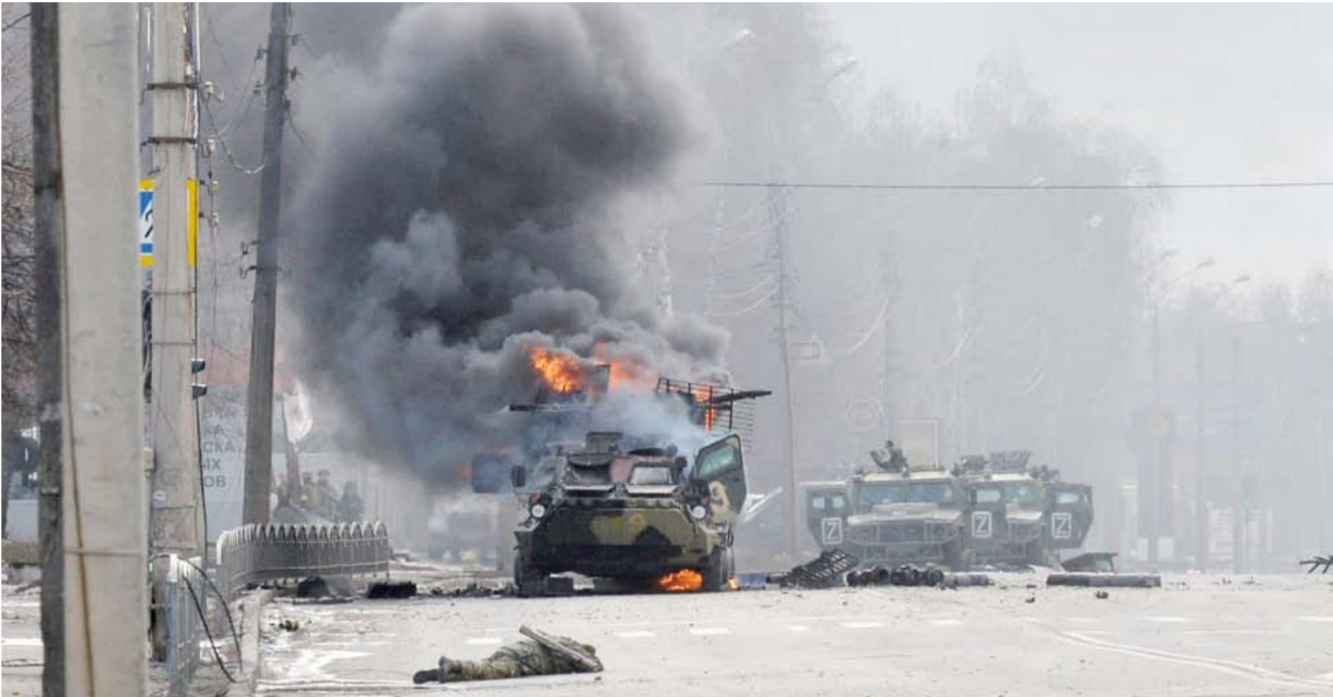
اشتباكات في خيرسون

أعلنت السلطات المالية الروسية في خيرسون أمس الأربعاء أن عمليات إجلاء المدنيين بدأت في المنطقة الواقعة في جنوب أوكرانيا، في مواجهة تقدم القوات الأوكرانية، فيما أكد قائد القوات الروسية في أوكرانيا أن «الوضع صعب» في المدينة..