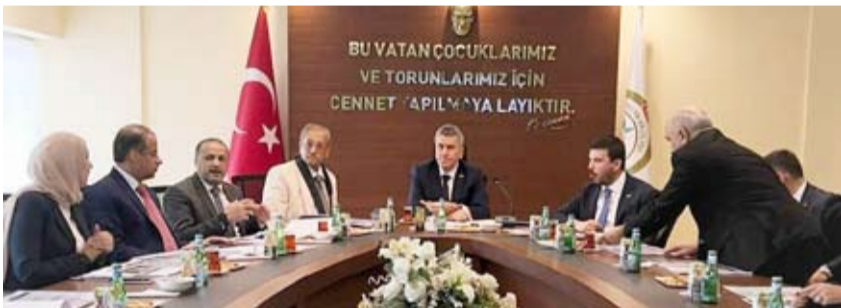
مباحثات تنفيذ المشاريع المجتمعية ضمن الاتفاقيات

بدعم من بيت التمويل الكويتي “بيتك”، وقعت جمعية الهلال الأحمر الكويتي اتفاقية مع جمعية الهلال الأحمر التركي لتنفيذ مشاريع إغاثية واجتماعية مختلفة لمساعدة المتضررين نتيجة الكوارث الطبيعية في تركيا.