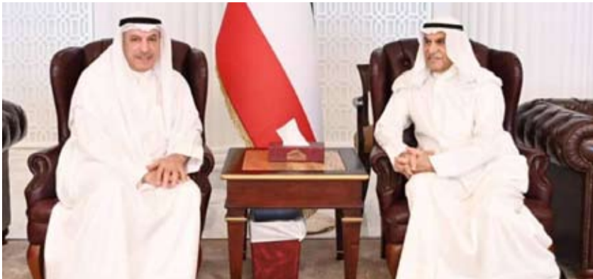
رئيس مجلس الأمة مستقبلاً رئيس ديوان الحاسبة

استقبل رئيس مجلس الأمة أحمد عبدالعزيز السعدون في مكتبه امس رئيس ديوان الحاسبة فيصل الشايخ، حيث قدم للسعدون تقرير الديوان عن نتائج الفحص والمراجعة على تنفيذ ميزانيات الوزارات والإدارات الحكومية وحساباتها الختامية والجهات الملحقه والمستقلة، وتقرير أهم المؤشرات المالية والظواهر الرقابية والمستجدات للسنة المالية 2021 / 2022.