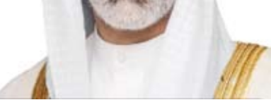
الشيخ جراح الصباح

تلقى نائب وزير الخارجية السفير الشيخ جراح جابر الأحمد الصباح، أمس، اتصالاً هاتفياً من نائب وزير خارجية روسيا الاتحادية والممثل الخاص للرئيس الروسي للشرق الأوسط ودول إفريقيا ميخائيل بوغدانوف، حيث تم بحث سبل توطيد العلاقات الثنائية بين البلدين والقضايا الراهنة محل الاهتمام المشترك.