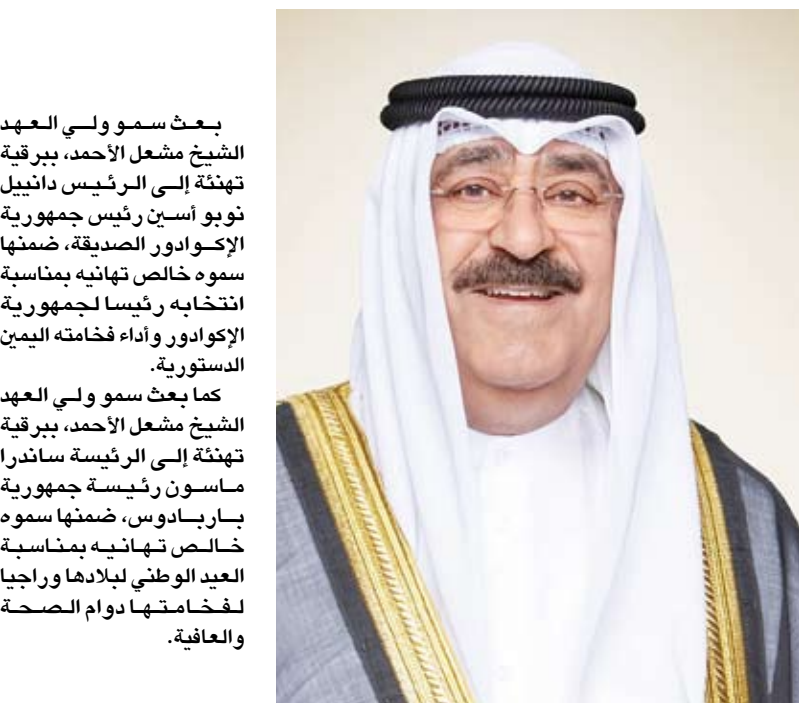
سمو ولي العهد الشيخ مشعل الأحمد

بعث سمو ولي العهد الشيخ مشعل الأحمد، ببرقية تهنئة إلى الرئيس دانييل نوبوا أسين رئيس جمهورية الإكوادور الصديقة، ضمنها سموه خالص تهانیه بمناسبة انتخابه رئيسا لجمهورية الإكوادور وأداء فخامته اليمين الدستورية. كما بعث سمو ولي العهد الشيخ مشعل الأحمد، ببرقية تهنئة إلى الرئيسة ساندرا ماسون رئيسة جمهورية باربادوس، ضمنها سموه خالص تهانیه بمناسبة العيد الوطني لبلادها وراجيا لفخامتها دوام الصحة والعافية.