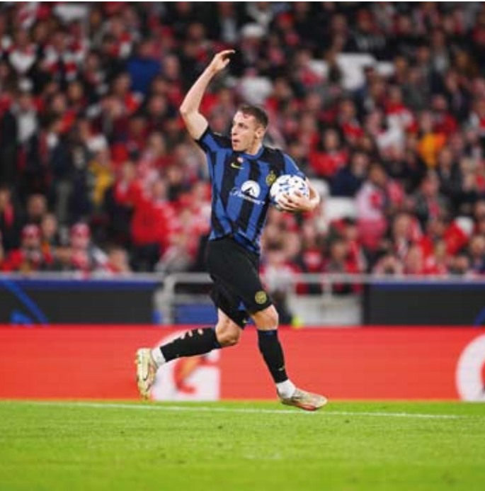
تعادل بطعم الفوز للإنتر مع بنفيكا