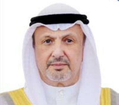
الشيخ سالم الصباح

فوراً والعمل على ضمان عدم اتساع رقعة الصراع وايصال المساعدات الإنسانية إلى غزة وعدم التعاطي مع هذه القضية بانزاجية المعايير وإيجاد أنجع السبل لإنهاء هذا التدهور الخطير الذي يهدد أمن المنطقة ككل.