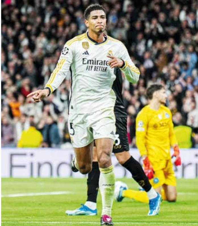
بيلينغهام يحتفل بالتسجيل

وأصبح يتعين على براغا الفوز على مضيفه نابولي بفارق هدفين في الجولة الأخيرة للمجموعة، من أجل الصعود لدور الـ16، حيث سيتساوى حينها في رصيد النقاط مع الفريق الإيطالي، ليجتتما بذلك إلى فارق المواجهات المباشرة بينهما. وكان نابولي استهل مشواره في المجموعة بالفوز 2 – 1 على براغا بملعبه.