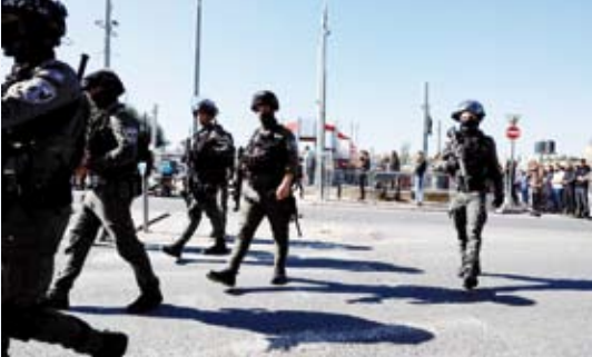
قوات صهيونية تقوم بدورية في غزة

قتل ثلاثة أشخاص وأصيب ستة آخرون بينهم ثلاثة إصاباتهم خطيرة، في هجوم بأسلحة نارية عند محطة لتوقف الباصات في غرب مدينة القدس على ما أظهرت حصيلة جديدة للشرطة الإسرائيلية، بحسب «وكالة الصحافة الفرنسية».