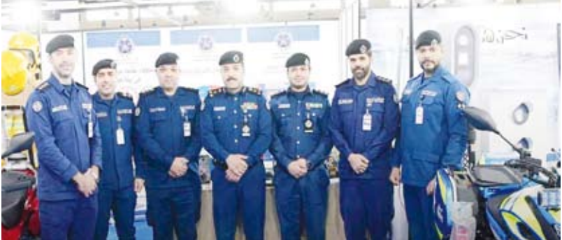
جناح قوة الإطفاء في أحد المعارض المحلية

شاركت قوة الإطفاء العام، متمثلة في بعض إداراتها بعدد من المؤتمرات والمعارض المحلية في الدولة منها مهرجان الطفولة النامن تحت شعار “أطفالنا استثمارنا”، الذي شاركة فيه إدارة العلاقات العامة والإعلام في القوة المقام في أرض المعارض والذي سوف يستمر لده ثلاث أيام بتنظيم من مركز ضوى البادية التطوعي بمشاركة 42 وزارة وجمعية نفع عام. كما شاركت إدارة الشؤون الصحية في القوة بمؤتمر ومعرض صحة الكويت الثاني عشر المقام في فندق الجمبرا والذي سوف يستمر لمدة يومين، ويهدف المؤتمر التعرف على كيفية تقديم الرعاية الطبية للمرضى وتواجد أكبر المستشفيات العالمية بهدف تقديم الخدمات