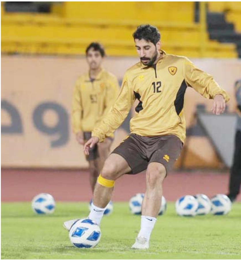
الأصفر يواصل الاستعداد لكأس سمو ولي العهد