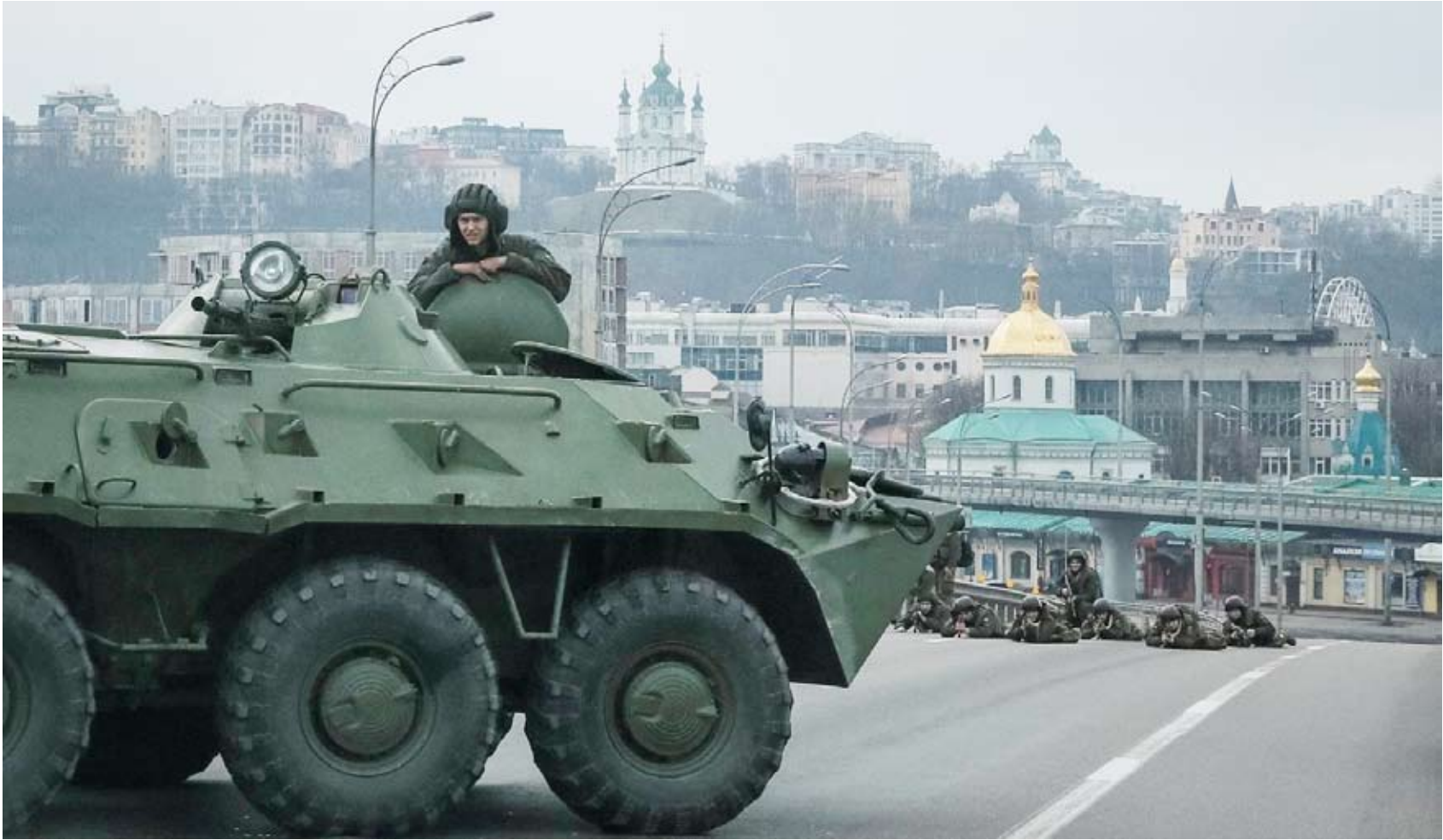
روسيا تسيطر على بلدة كروموف

أدرك الأوكرانيون منذ الساعة الأولى من المحادثات التي جرت في بداية الغزو الروسي لبلادهم أن الكرملين يدعي التفاوض من غير أن يفاوض فعلياً، وتعرّض لديهم هذه القناعة منذ ذلك الحين، بحسب «وكالة الصحافة الفرنسية». ولم ترسل روسيا سياسيين بارزين لتمثيلها في المفاوضات المتعلقة بأخطر نزاع في أوروبا منذ عام 1945، بل أرسلت سياسيين من الصف الثاني، وبينهم فلاديمير ميدينسكي، وهو وزير سابق للثقافة، منتهم بسرعة فكرية، وليونيد سلوتسكي البرلماني القومي المتهم بالتحرش الجنسي. وقال مستشار الرئاسة الأوكرانية ميخايلو بودولياك الذي شارك في المفاوضات، لـ«وكالة الصحافة الفرنسية» إن «هؤلاء الأشخاص لم يكونوا جاهزين للتفاوض. هم موظفون إداريون وليس لهم أي تأثير عملي في روسيا. جاؤوا وقروا بعض الإنذارات، وانتهى الأمر». وجرت هذه المحادثات في فبراير ومارس عام 2022، وبعد مرور عامين تقريباً على فشلها تكاد تكون إمكانية إجراء