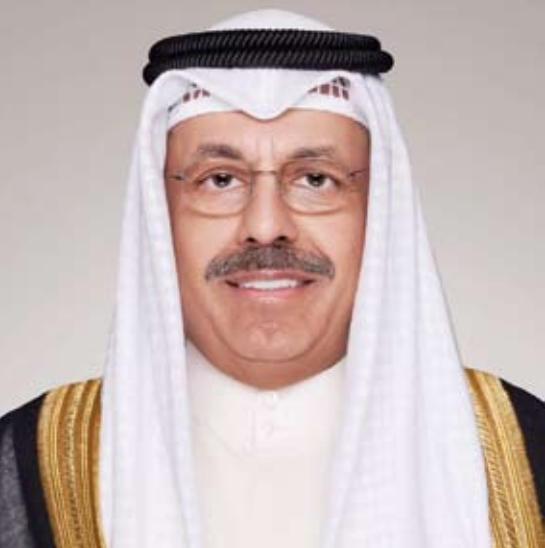
سمو الشيخ أحمد النواف

بعث سمو الشيخ أحمد النواف رئيس مجلس الوزراء، ببرقية تهنئة إلى الرئيس دانييل نوبوا أسين رئيس جمهورية الإكوادور الصديقة أعرب فيها سموه عن خالص تهانیه بمناسبة أداء فخامته اليمين الدستورية رئيساً لجمهورية الإكوادور الصديقة. كما بعث سمو الشيخ أحمد النواف رئيس مجلس وزراء، ببرقية تهنئة إلى الرئيسة ساندرا ماسون رئيسة جمهورية باربادوس الصديقة بمناسبة العيد الوطني لبلادها.