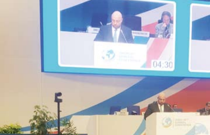
سفير الكويت لدى النمسا ومندوبها الدائم لدى المنظمات الدولية في “فيينا” طلال الفصام

وتطرق السفير الكويتي في كلمته إلى العدوان الاسرائيلي على غزة الذي استهدف البنية التحتية وتسبب في قطع الكهرباء والماء ومصادر الغذاء كافة عن الشعب الفلسطيني، مطالباً المجتمع الدولي بالتدخل لوقف إطلاق النار وادخال المساعدات الإنسانية ومحاسبة مرتكبي جرائم الحرب. كما أعرب عن دعم الكويت الكامل للعرض الذي تقدمته السعودية لاستضافة الدورة 21 للمؤتمر العام المقبل لليونيدو عام 2025.