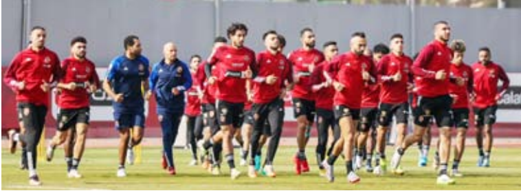
جانب من تدريبات الأهلي المصري

أعلن نادي يانج أفريكانز التنزاني طرح تذاكر مباراة الأهلي التي تجمع الفريقين ضمن منافسات الجولة الثانية من المجموعة الرابعة في دوري أبطال أفريقيا المحدد لها غدا السبت. وتضم المجموعة الرابعة في مرحلة مجموعات دوري الأبطال الأهلي بجانب أندية شباب بلوزداد الجزائري، يانج أفريكانز التنزاني، وميدياما الغاني.