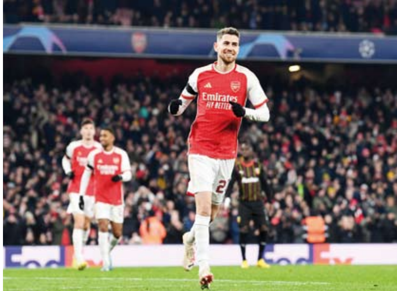
فوز عريض للجائز

إشبيلية الإسباني 3 – 2، في وقت سابق من يوم الأربعاء. وتقدم أرسنال في الدقيقة 13 عن طريق كاي هافيرتز. قبل أن يضيف غابرييل جيسوس الهدف الثاني في الدقيقة 21 وبعده بدقيقتين سجل بوكايو ساكا الهدف الثالث. وفي الدقيقة 27 سجل غابرييل مارتينيلي الهدف الرابع لأرسنال، فيما سجل زميله مارتين أوديجارد الهدف الخامس في الدقيقة الأولى من الوقت المحتسب بدلا من الضائع للشوط الأول. وفي الدقيقة 86 اختتم جورجينو سداسية أرسنال من ضربة جزاء. ويلتقي أرسنال في الجولة المقبلة والأخيرة من دور المجموعات، مع ضيفه آيندهوفن، فيما يستضيف لانس الفرنسي فريق إشبيلية.