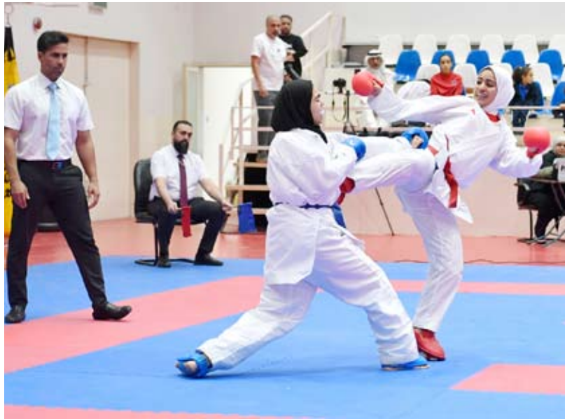
جانب من منافسات اليوم الختامي للبطولة