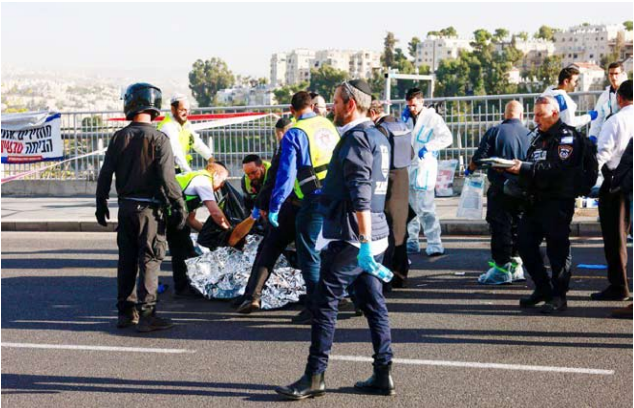
مقتل 3 إسرائيليين وإصابة 6 بهجوم في مدخل القدس

صباح امس في مدينة القدس المحتلة. وأعلنت كتائب القسام تبني العملية، موضحة أنها ردت على قيام ضابطاتها وتجاوزات وزير الأمن الوقفي إيتمار بن غفير وصاحبته. وأضافت أن العملية تأتي ردا على جرائم الاحتلال في قطاع غزة والضفة المحتلة وتدنيس الأراضي المقدسة. وحول التهدة، قال رئيس الهيئة العامة للاستعلامات التابعة للرئاسة المصرية شبیه رشوان إن أنه تم تمديد الإحسانية في قطاع غزة بجهود مصرية - فطرية مكثفة لمدة يوم واحد، مؤكداً أن هناك اتصالات مستمرة لتمديدتها إلى يومين إضافيين. (طالع صفحة 8)