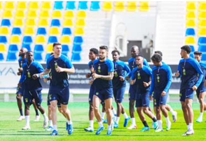
جانب من تدريبات النصر

في المقابل، يتقدم البرتغالي كريستيانو رونالدو متصدرا لائحة الهدافين برصيد 15 هدفاً، وكوكبة نجوم النصر الى جانب مواطنه أوتافيو والبرازيليين تاليسكا وأليكس تيليس والسنگالي ساديو ماني والكرواتي مارسيلو برونوفيتش، والإيفواري سيكو فوفانا.