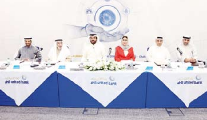
جانب من العمومية

وبهذه المناسبة استعرض الدكتور المضيف المحطات التاريخية ونقاط التحول الفارقة التي شهدها البنك الأهلي المتحد منذ تاسيسه عام 1941 كأول بنك عمل في الكويت والبيئة الأولى في صرح العمل المصرفي الكويتي، ليتحول بعدها في العام 1971 إلى «بنك الكويت والشرق الأوسط» عندما أصبح مملوكاً بالكامل للحكومة الكويتية. ثم العام 2002 والذي شكل بداية لمرحلة جديدة من مراحل نجاح البنك وذلك بعد عمله في ظل مساهم رئيسي، وهو مجموعة البنك الأهلي المتحد بما لها من سمعة مشهودة في مجال العمل المصرفي.