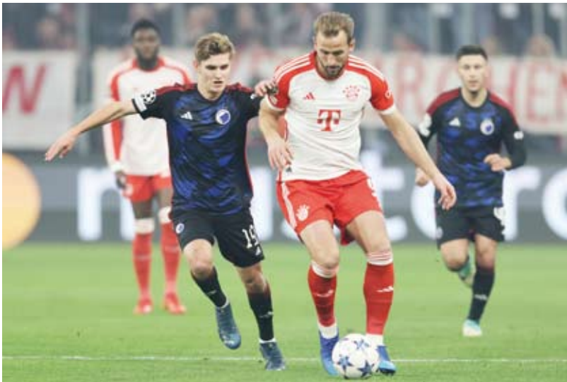
كين توقف عن التهديف أمام كوبنهاغن

إلى 13 نقطة، وهو الذي ضمن تأهله لدور الستة عشر من المسابقة في وقت سابق من دور المجموعات. وكانت مباريات الجولة قد انطلقت في وقت سابق من يوم الأربعاء، حيث خطف غلطة سراي تعادلاً مثمراً 3 – 3 مع مانشستر يونايتد. ويلتقي بايرن ميونخ في الجولة الأخيرة بمضيفه مانشستر يونايتد، فيما يستضيف كوبنهاغن فريق غلطة سراي التركي بذات الجولة.