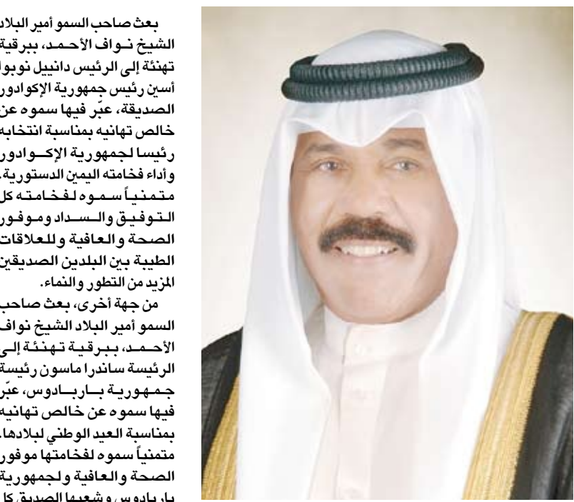
سمو أمير البلاد الشيخ نواف الأحمد

بعث صاحب السمو أمير البلاد الشيخ نواف الأحمد، ببرقية تهنئة إلى الرئيس دانييل نوبوا أسين رئيس جمهورية الإكوادور الصديقة، عبر فيها سموه عن خالص تهانیه بمناسبة انتخابه رئيسا لجمهورية الإكوادور وأداء فخامته اليمين الدستورية. متمنياً سموه لفخامته كل التوفيق والسداد وموفور الصحة والعافية وللعلاقات الطيبة بين البلدين الصديقين المزيد من التطور والنماء. من جهة أخرى، بعث صاحب السمو أمير البلاد الشيخ نواف الأحمد، ببرقية تهنئة إلى الرئيسة ساندرا ماسون رئيسة جمهورية باربادوس، عبر فيها سموه عن خالص تهانیه بمناسبة العيد الوطني لبلادها. متمنياً سموه لفخامتها موفور الصحة والعافية ولجمهورية باربادوس وشعبها الصديق كل التقدم والأزدهار.