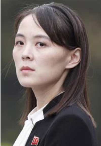
كيم يو جونج شقيقة الزعيم الكوري

يواصل حلف شمال الأطلسي (الناتو) ضغوطه على تركيا للانضمام للمصادقة على بروتوكول انضمام السويد إلى الحلف. بينما تؤكد تركيا من جانبها أن على الدولة الإسكندنافية أن تبدي التزاماً بإزالة مخاوفها من التنظيمات الإرهابية، بينما يسعى الحلف إلى تأكيد التزامه الثابت في أوكرانيا في ظروف صعبة لم ينجح فيها أي من طرفي النزاع في التقدم في ساحة المعركة، إلى جانب ماطلة واشنطن. وقال الأمين العام للحلف ينس ستولتنبرغ في مستهل اجتماع وزاري في بروكسل: «إنني واثق» باستمرار الدعم العسكري الأميركي لأوكرانيا.