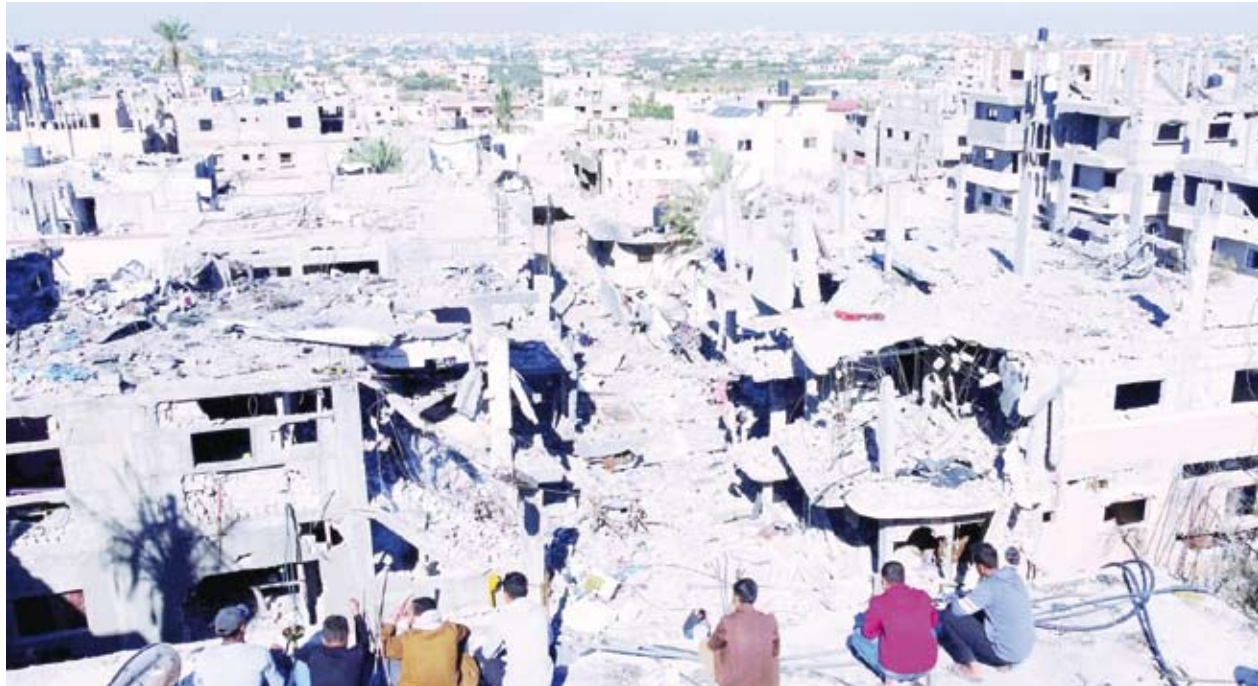
فلسطينيون ينظرون إلى الدمار

في قطاع غزة بمجرد «استنفاد مرحلة إعادة الرهائن».