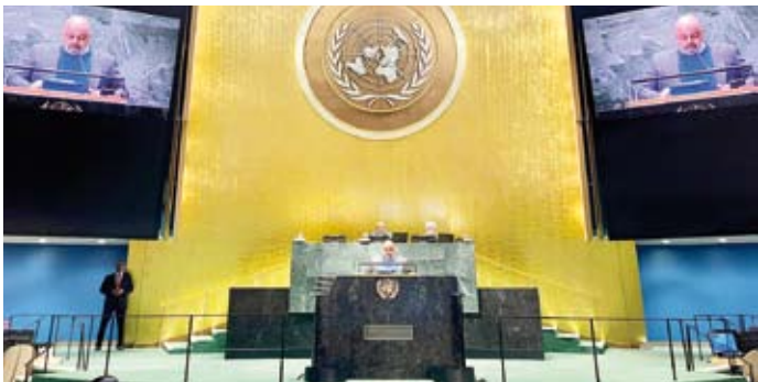
مندوب الكويت الدائم لدى الأمم المتحدة السفير طارق البناي

وأوضح الفصام أن من بين أهداف الخطة بزيادة نسبة المنشآت الصناعية التي تتبنى ممارسات الاقتصاد الدائري وتقليل تكاليف سلاسل التوريد على المدى الطويل وتحسين إمكانات التصدير لمنتجات الصناعة