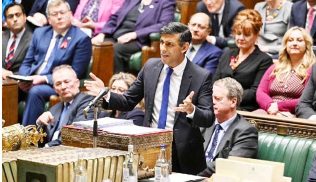
ريشي سوناك في مجلس العموم

قُتل 40 مدنياً على الأقل في الهجوم الإرهابي الكبير، في مدينة دجيبيو بشمال بوركينافاسو، وفق ما أفادت المفوضية العليا لحقوق الإنسان في الأمم المتحدة. وقالت الوكالة الأممية في بيان، إن عدداً كبيراً من مقاتلي «جماعة نصرة الإسلام والمسلمين» المرتبطة بـ«القاعدة»: «هاجموا قاعدة عسكرية ومنازل ومخيمات للنازحين في مدينة دجيبيو بمنطقة الساحل، وقتلوا ما لا يقل عن 40 مدنياً وأصابوا أكثر من 42».