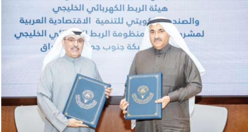
الجانبان خلال توقيع الاتفاقية

ويعد هذا القرض الإضافي القرض الثالث الذي يقدمه الصندوق الكويتي للتنمية لهذا المشروع بمبلغ إجمالي قدره 78 مليون دينار كويتي بما يشكل نحو 29 بالمئة وتساهم حكومة دولة الكويت بحوالي 37,5 مليون دينار كويتي في تأكيد على الدور المحوري الذي يضطلع به الصندوق في دعم مشروعات البنية التحتية الإقليمية وتعزيز أمن الطاقة وخدمة المصالح الاستراتيجية لدولة الكويت ودعم التعاون الخليجي المشترك.