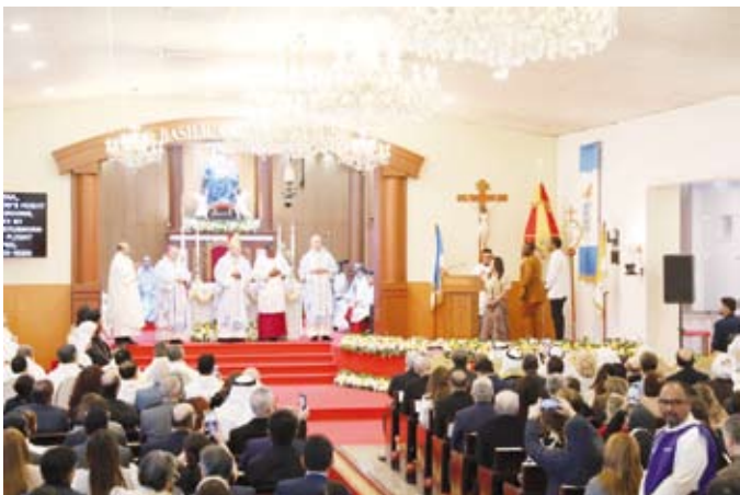
نيافة الكاردينال بيترو بارولن خلال القداس

والروحية والمعمارية وهو ما تميزت به كنيسة الجزيرة العربية التي أنشأتها شركة نفط الكويت في عام 1948. وتعد كنيسة سيدة الجزيرة العربية الكنيسة الأم في الكويت ومركزاً ذا أهمية روحية وتاريخية بارزة في منطقة الخليج.