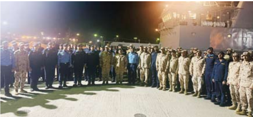
المشاركون في التمرين قبيل مغادرتهم

غادر زورق القوة البحرية «فيلكا» وسفينة الإنزال «السفار» والوحدات البحرية الخاصة إلى المملكة العربية السعودية، وذلك للمشاركة في التمرين الثنائي المختلط (سلام الخليج 1) مع البحرية الملكية السعودية (الأسطول الشرقي) خلال الفترة من 16 ولغاية 25 يناير 2026.