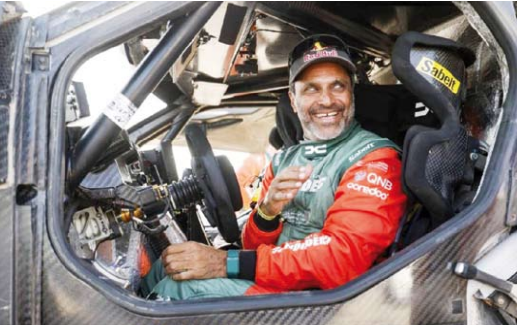
السائق القطري ناصر العطية

تُوِّج السائق القطري ناصر العطية، بلقب رالي داکار السعودية 2026 لفئة السيارات ”التيميت“، محققاً إنجازاً ه السادس في تاريخه والثالث له على أرض المملكة، في النسخة السابعة التي استضافتها المملكة العربية السعودية، وينظمها الاتحاد السعودي للسيارات والدراجات النارية، تحت إشراف وزارة الرياضة.