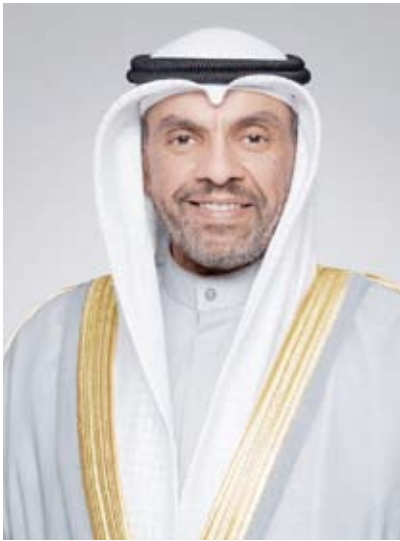
وزير الخارجية عبدالله الحيا

وأجرى وزير الخارجية عبدالله الحيا أمس اتصالا هاتفيا مع نائب رئيس الوزراء ووزير الخارجية وشؤون المغتربين في المملكة الأردنية الهاشمية الشقيقة أيمن الصفدي.