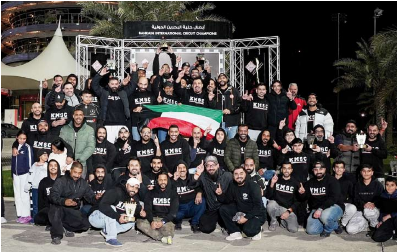
متسابقو النادي الكويتي للسيارات والدراجات الالية

نجح متسابقو النادي الكويتي للسيارات والدراجات الالية في تصدر ثلاث فئات من بين ثمانية مراكز متقدمة حققوها في بطولة البحرين لسباقات السرعة الدراج. ونوه مدير فريق النادي الكويتي للسيارات والدراجات الالية الشيخ صباح داود الصباح بما حققه الفريق من نتائج مشرفة في البطولة التي اقيمت على مضمار حلبة البحرين الدولية ضمن موسم 2025 – 2026.