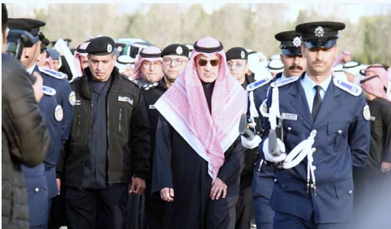
النائب الأول تقدم مشيعي العقيد الخمسان

بحضور النائب الأول لرئيس مجلس الوزراء وزير الداخلية الشيخ فهد اليوسف، ووكيل الوزارة اللواء عبدالوهاب الوهيبي، إلى جانب كبار قادة وزارة الداخلية وعدد من القيادات الأمنية، ووسط مراسم عسكرية، توافدت حشود غفيرة أمس على مقبرة الصليبيخات للمشاركة في تشييع المغفور له طال مبنى الإدارة العامة للمؤسسات الإصلاحية.