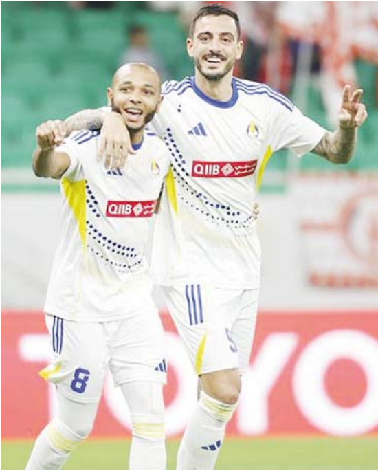
الغرافة يتجاوز العربي

واصل الغرافة انفرادة بصدارة الدوري القطري لكرة القدم ”دوري نجوم بنك الدوحة“ بختام الجولة الثالثة عشرة، وشهدت استمرار السد حامل اللقب بالبطرة.