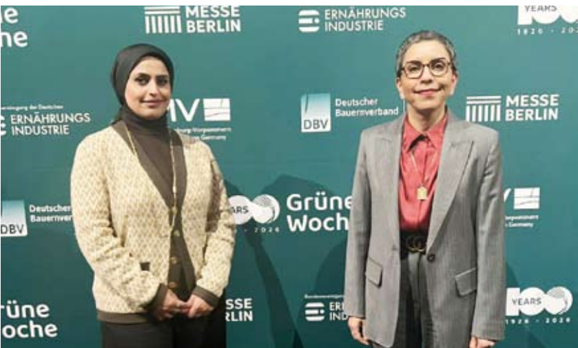
سفيرة الكويت في ألمانيا ونائب مدير عام «الزراعة»

أكدت سفيرة دولة الكويت لدى ألمانيا ريم الخالد أهمية المشاركة في المعرض الزراعي «الأسبوع الأخضر» الذي انطلقت فعالياته في برلين أمس الأول ويستمر حتى 25 يناير الجاري. وقالت الخالد إن مشاركة الكويت للعام الثاني على التوالي في المعرض تأتي تأكيداً لاهتمام دولة الكويت بقضايا الأمن الغذائي. ووفق الخالد فإن المشاركة