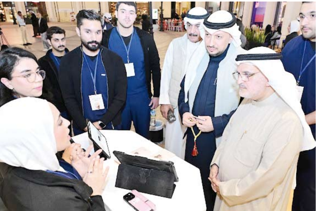
الديم خلال تدشين الحملة التوعوية

مدى يومين بمجمع الأنفيوز بهدف تعزيز الوعي المجتمعي بالأمراض الجلدية المختلفة.