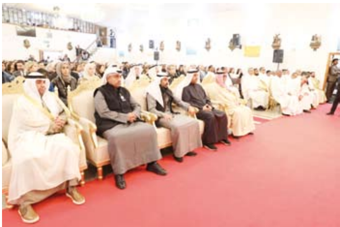
السفير صادق معرفي وسفير الفاتيكان وكبار الشخصيات والحضور