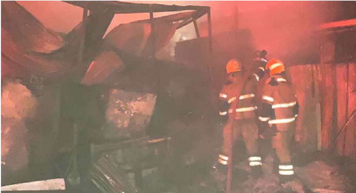
مقاومة رجال الإطفاء