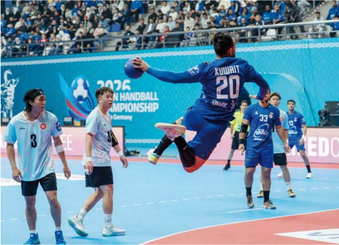
لاعب الكويت لحظة التسجيل بشباك هونغ كونغ

للاتحاد الكويتي لكرة القدم، انهم فخورون باستضافة اتحاد اليد الكويتي لأكبر حدث رياضي في القارة الصفراء، وهي بطولة آسيا المؤهلة لكأس العالم 2027.