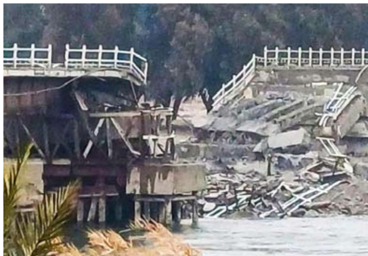
أحد الجسور المدمرة فوق نهر الفرات