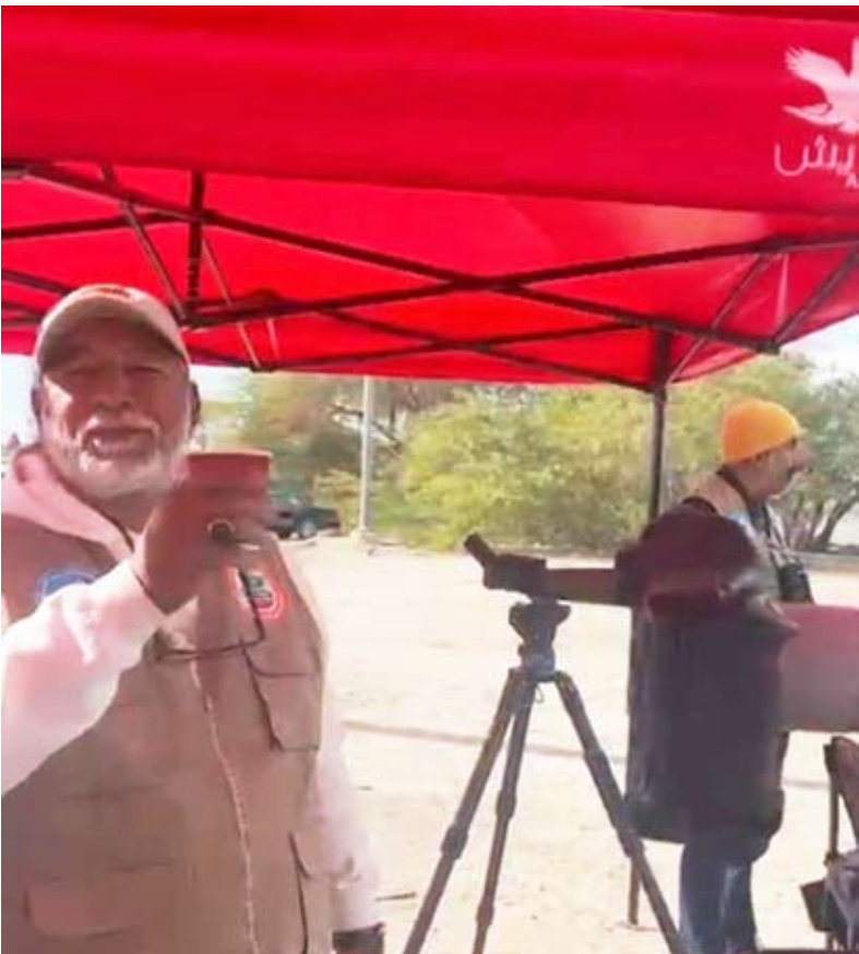
فريق الجمعية خلال مراقبة الطيور

وذكر أن «الجمعية عرّضت على تنظيم فعالية اليوم العالمي الشتوي لعد الطيور والتي ينظمها الفريق سنوياً يوم السبت الثالث من الشهر يناير الجاري، وذلك بسبب المد العالي فينتج ذلك اقتراب الطيور الخواضة والطيور البحرية على الشاطئ إلى أقرب نقطة ممكنة ليتم رصدها وعلما بالشكل الصحيح والسهل، حيث أن المد يتجاوز 3 أمتار».