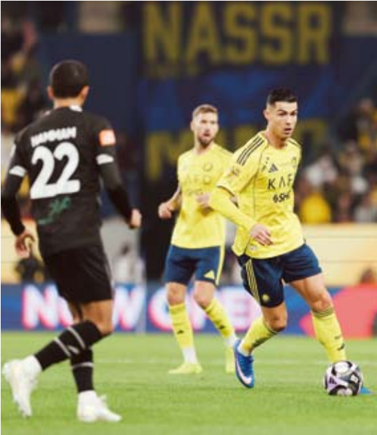
رونالدو يقود النصر إلى عبور الشباب

استعاد النصر ابتسامته من جديد في الدوري السعودي للمحترفين، بتحقيقه فوزاً ثميناً على الشباب 2/3 في القمة الكروية المثيرة، لينجح في تجنب انتفاضة الليث، ويعود لسكة المنافسة على اللقب.