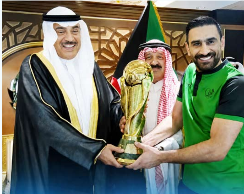
سمو ولي العهد يتوج النادي العربي بكأس البطولة

توج سمو ولي العهد الشيخ صباح خالد الحمد الصباح نادي العربي بكأس سموه بعد فوزه أمس على نظيره نادي الكويت بثلاثة نظيفة. الأهداف سجلها محمد خالد في الدقيقة الرابعة والخمسين فيما سجل علي خلف الهدف الثاني في الدقيقة الثمانين وفي الدقيقة التسعين سجل زيد قنبر الهدف الثالث. حاول نادي الكويت العودة إلى اللقاء من خلال هجوم مكثف لكن صلابه دفاع الأخضر حالت دون التسجيل رغم الضغط الأبيض لينتهي اللقاء بثلاثة نظيفة. تأثر الكويت بحالة الطرد في نهاية الشوط الأول للمحترف المغربي مهدي بن رحمة.