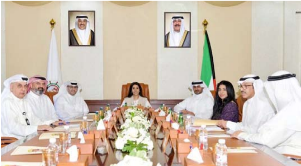
جانب من اجتماع المشعان ومحافظ مبارك الكبير