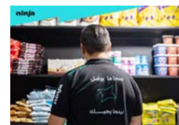
أسرع توصيل خلال 30 دقيقة

حملته للعروض الأسبوعية المستمرة، والتي تشمل ما يصل إلى 1.200 منتج أسبوعياً عبر فئات متعددة، مع خصومات تصل إلى 50%، بما يعزز من تجربة التسوق اليومية ويمنح المستهلك فرصة الاستفادة من أسعار تنافسية على المنتجات الموسمية والاحتياجات الأساسية. ومع تغير سلوك المستهلك خلال الموسم، باتت الراحة وسرعة الحصول على الاحتياجات المنزلية من أهم الأولويات، وهو ما يستجيب له «نينجا» من خلال منصة توفر كل ما يحتاجه العميل في مكان واحد: من منتجات العناية الشخصية، إلى المرطبات، والمنظفات.