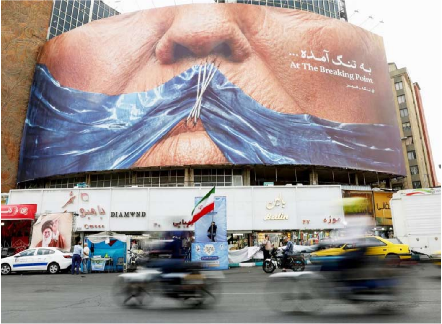
لوحة دعائية مناهضة للولايات المتحدة

من جانبها، أدانت قطر بشدة محاولة استهداف السعودية بطائرات مسيرة، وعدتها «اعتداءً مرفوضاً وانتهاكاً لسيادة المملكة وتهديداً لأمنها وأمن المنطقة». وأكدت وزارة الخارجية القطرية، في بيان، تضامن الدوحة الكامل مع السعودية، ودعمها كل ما تتخذه من إجراءات للحفاظ على أمنها وسيادتها وسلامة مواطنيها والمقيمين على أراضيها. من جانبها، أعربت وزارة الخارجية البحرينية عن إدانة مملكة البحرين واستنكارها الشديدين للهجوم الإرهابي الأثم الذي استهدف أمن واستقرار السعودية باستخدام ثلاث طائرات مسيرة قادمة من الأجواء العراقية، وعدت ذلك تصعيداً خطيراً يهدد الأمن والاستقرار الإقليمي، وانتهاكاً صارخاً لمبادئ حسن الجوار وقواعد القانون الدولي، وخرقاً لقرار مجلس الأمن الدولي رقم 2817.