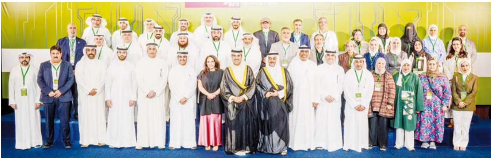
أعضاء هيئة محكمي مسابقة الكويت للعلوم والهندسة الـ12