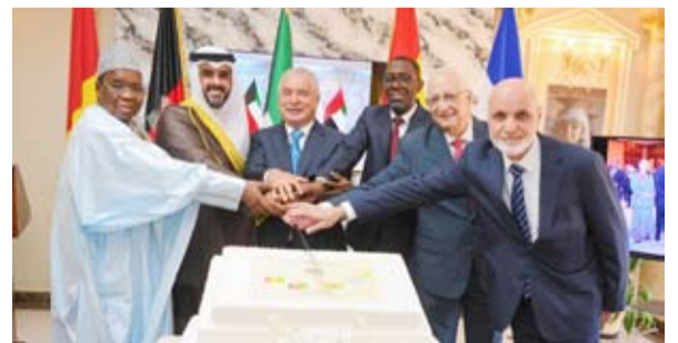
السفراء المحتفى بهم

التحتية والتنقل الحضري في غينيا. كما عمل السفير الغيني على إطلاق مفاوضات مهمة بشأن مشروع تقاطع "ENCO 5"، إلى جانب مساهماته البارزة في دعم التضامن والتنسيق بين البعثات الدبلوماسية الإفريقية بالكويت، حيث تم تعيينه نائبا لعميد السلك الدبلوماسي الإفريقي في الكويت عام 2025.