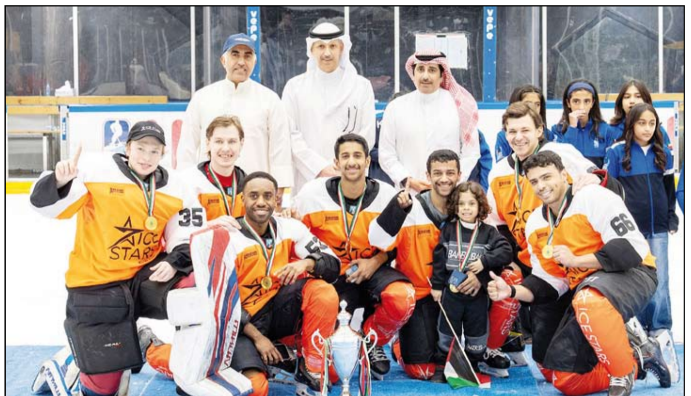
جانب من التتويج

في بطولات خارجية شملت أيضاً لعبتي الكيرلنج والتزلج على الجليد. وذكر أن النادي حرص على استكمال مباريات الدوري الكويتي بعد فترة التوقف الأخيرة بهدف استعادة اللاعبين لأجواء المباريات التنافسية في ظل استعدادات منتخب الكويت الأول لخوض منافسات البطولة الدولية الرابعة لمتدري الدول الإسلامية لهوكي الجليد والمزمع إقامتها في مدينة (كازان) في روسيا يونيو المقبل.