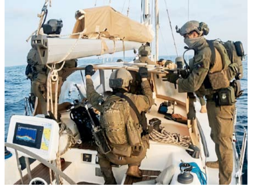
قوات الاحتلال خلال توقيف إحدى سفن الأسطول البحري

دانت وزارة الخارجية التركية أمس بشدة هجوم قوات الاحتلال على مبادرة أسطول الصمود العالمي الثالثة في المياه الدولية واصفة الهجوم بـ«القرصنة الجديدة». وشددت على ضرورة إيقاف الاحتلال لهجماته بشكل فوري والإفراج عن جميع النشطاء المعتقلين دون شروط مشيرة إلى اتخاذ السلطات التركية الخطوات اللازمة لضمان عودة مواطنيها المشاركين في الأسطول إلى جانب التنسيق مع الدول المعنية. وأضافت أن مبادرة أسطول الصمود الثالثة تتكون من 54 قارباً وتضم ناشطين من أكثر من 40 دولة.