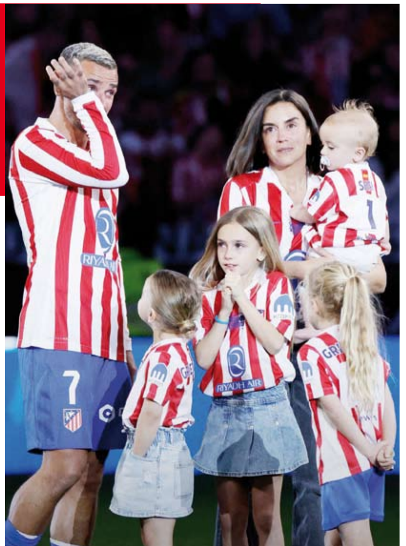
أنطوان غريزمان وعائلته في وداع الليغا

يحمل شارة القيادة، ويصنّعه الهدف الوحيد في اللقاء بتمريرة حاسمة هي الـ44 في مسيرته، سجله النيجيري أديمولا لوكمان، نال «غريزي» تصفيقا حاراً وبتكرراً من جماهيره خلال المباراة التي شكرت «هدافها الأسطوري» على عشرة أعوام من العطاء والإخلاص، تخللتها تجربتان مع برشلونة (2019-2021). وقال مدرب الأرنجنيني دييغو سيميوني قبل المباراة مادحاً: «عندما عاد، كانت لحظة فرح وسعادة، كنا نعلم أن عبقرية يعود. كان لدينا هنا عبقرية حقيقية في كرة القدم، وستفتقده كثيراً».