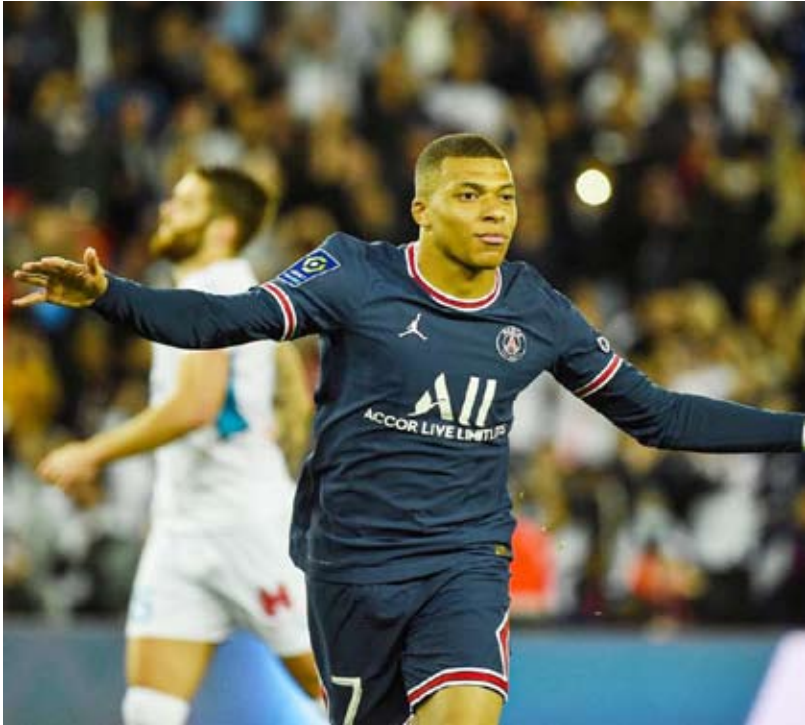
مبابي يواصل التالق

وقبل نهاية الشوط الأول، تمكن كيليان مبابي من تسجيل الهدف الثاني من ركلة جزاء في الدقيقة 45+5.