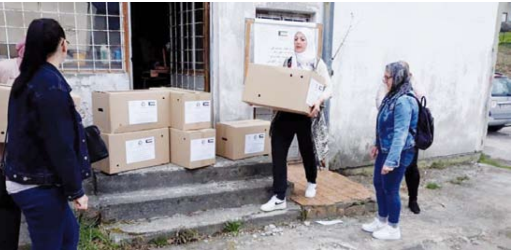
جانب من توزيع السلة الغذائية على الأسر المحتاجة داخل الكويت وخارجها

للأسر المحتاجة عن طريق الجمعية، مؤكدة أهمية مواصلة عملاتهم لإنجاح برنامج المساعدات المحلية على أكمل وجه.