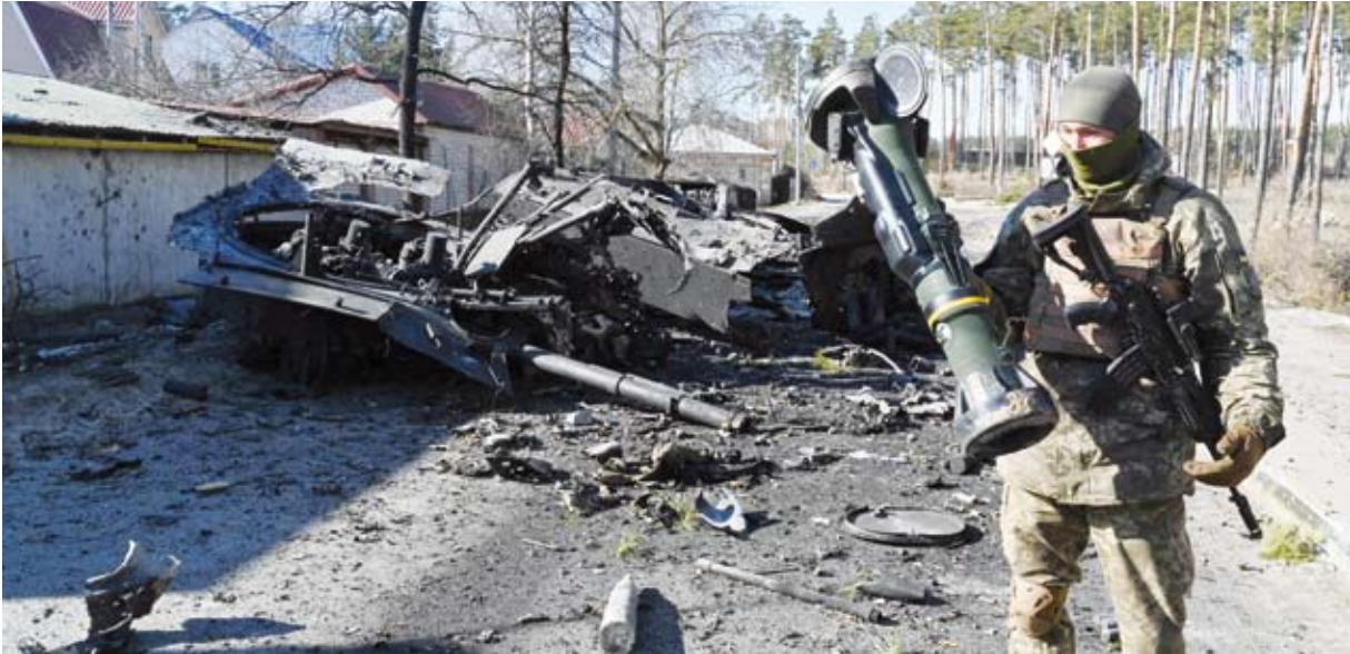
القتال في أوكرانيا