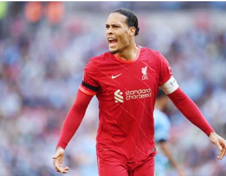
فيرجيل فان دايك

مفاجأة في بلوغ ربع نهائي النسخة الأخيرة، على وشك الغياب قبل أن تتقدها ركلة جزاء متأخرة أمام تشاد.