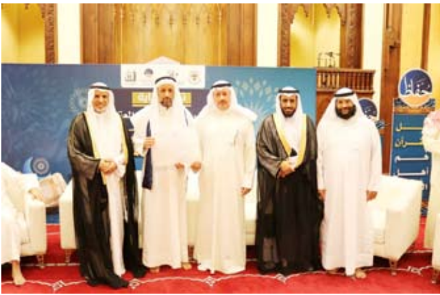
تكريم أحد المشاركين

وزارة الأوقاف على تعاونها الصادق ودعمها المستمر مضيفاً أن الجمعية ما كانت تستطيع أن تعمل أو تحقق مثل هذا الإنجاز بدون دعم وزارة الأوقاف بمختلف قطاعاتها وإداراتها.