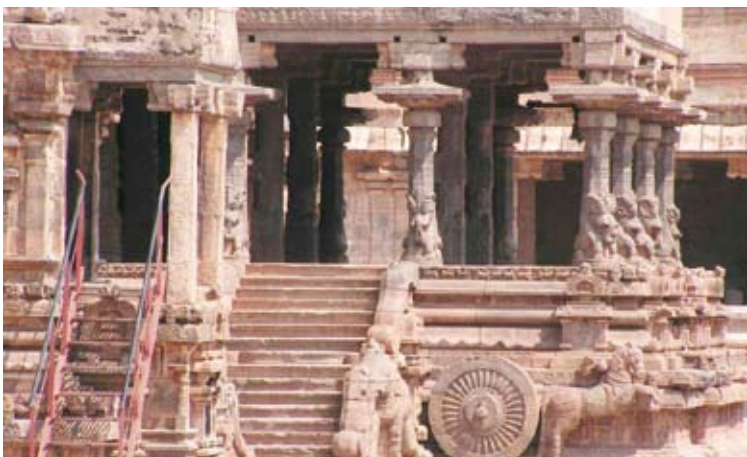
أرم ذات العماد