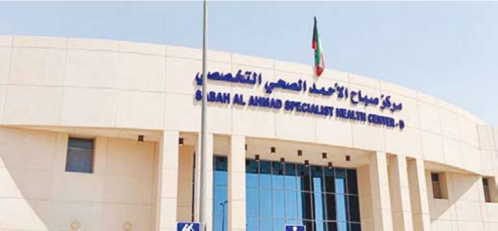
مستوصف مدينة صباح الأحمد

كحل سريع تتوفر فيه كافة العمليات والجراحة والولادة... إلخ. لحين إنشاء المدينة الطبية في صباح الأحمد المدينة الثانية التي تحتوي على (5) مناطق سكنية بواقع (11600) وحدة سكنية. 2 – إعادة جميع مراكز الرعاية الأولية لطبيعية تخصصها و عملها الأصلي لتكون خمسة مراكز صحية كما خصصت من أجله لتفادي الإزدحام الهيكلي لوزارة الصحة، ولتصحيح هذه الخدمات الصحية السيئة وتعديل المسار.