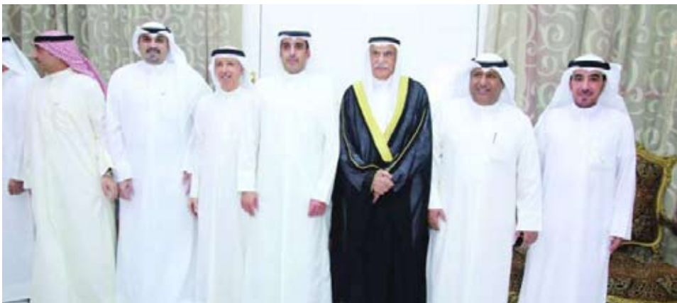
سعدون حماد متوسطا المهنيين بشهر رمضان

أقام النائب سعدون حماد حفل استقبال بمناسبة حلول شهر رمضان المبارك، حيث تبادل الحضور التهاني والتبريكات بمناسبة الشهر الفضيل. ووجه حماد الشكر الجزيل للحضور على تلبية الدعوة، مؤكداً أن أهل الكويت جبّلوا على التوادد والتراحم والتواصل والحرص على الوحدة الوطنية، متضرعاً إلى الله سبحانه وتعالى أن يعيد شهر رمضان على الكويت وأهلها وبخير وبركات، وأن يحفظها وشعبها وقيادتها من كل سوء.