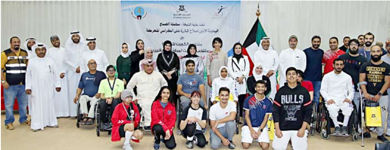
صورة جماعية للمشاركين في البطولة الاولى لسلح المبارزة على الكراسي المتحركة