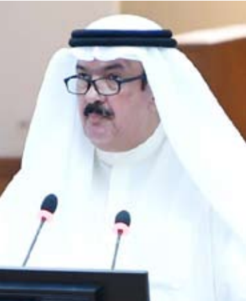
وزير التربية د. علي المصنف