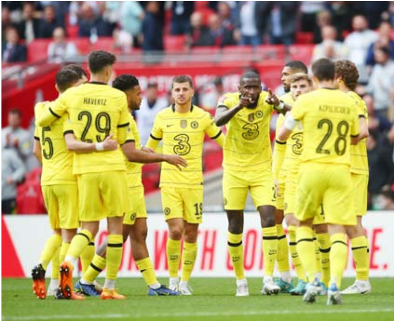
فوز مستحق للبلوز على كريستال بالاس

حساب تشلسي بركلات الترجيح بعد تعادلهما السلبي في الوقتين الأصلي والإضافي.