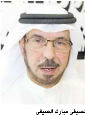
الصيفي مبارك الصيفي

تختتم غدا الأربعاء فعاليات بطولة "شهداء أبو حليفة لكرة القدم" الرضائية تحت رعاية النائب الصيفي مبارك الصيفي. وحققت البطولة نجاحاً كبيراً على جميع المستويات، إذ شهدت مشاركة شبابية واسعة، إضافة إلى إشارات عديدة لما حققته من صدى واسع ومتابعة جماهيرية وتغطية إعلامية شاملة