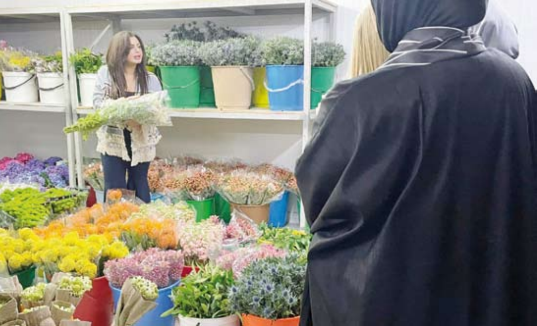
جانب من دورة مبادئ تنسيق الهدايا

للمشروع والتسويق الإلكتروني ومبادئ التنسيق ومبادئ تنسيق الهدايا ومبادئ الطبخ وتدريب عملي للطبخ والعلامة التجارية والخطوات الأخيرة للمشروع. وذكرت أن مشروع (المبادر المحترف) يهدف إلى تنمية الوعي الاستثماري لدى الشباب بأهمية المشروعات الصغيرة والمتوسطة في تنمية المجتمع والتعريف بالفرص الاستثمارية.