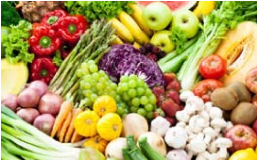
الإكثار من الخضروات والفواكه

من الأشياء التي تشغلنا كثيراً هذه الأيام هي الطريقة المثلى للحفاظ على الوزن دون زيادة أثناء شهر رمضان، حيث تكثر الولايم والعزائم، لا تخلو أي مأدعة رمضان من كميات كبيرة من الأطعمة والمشروبات السكرية والحلويات، فهي عادات رمضان يصعب التخلي عنها، إلا إذا كان الصائم حريصاً بالفعل على الحفاظ على وزنه، بل ومحاولة إنقاص وزنه خلال الشهر الكريم.