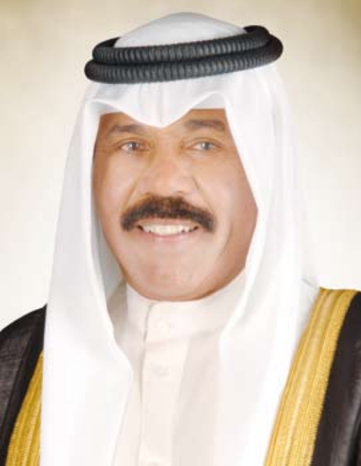
سمو أمير البلاد الشيخ نواف الأحمد

بعث صاحب السمو أمير البلاد الشيخ نواف الأحمد، ببرقية تهنئة إلى الرئيس إيمرسون منانغاغا رئيس جمهورية زيمبابوي الصديقة، عبر فيها سموه عن خالص تهانيه بمناسبة العيد الوطني لبلاده، متمنياً لفخامته موفور الصحة والسعادة ولجمهورية زيمبابوي وشعبها الصديق كل التقدم والازدهار.