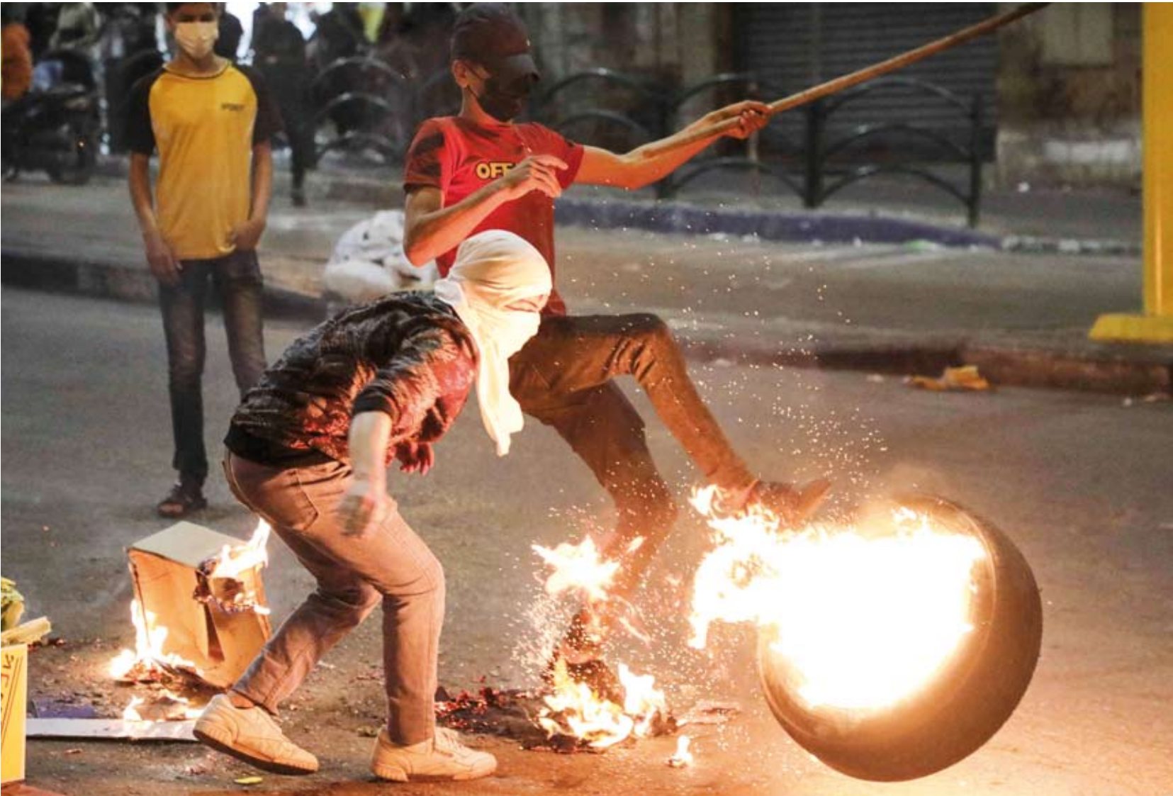
الاشتباكات في فلسطين

أغلقت القوات الإسرائيلية أمس (الاثنين)، الحرم الإبراهيمي أمام المصلين الفلسطينيين، تمهيداً لافتتاحه من قبل المستوطنين للاحتفال بعيد الفصح اليهودي. ونقلت وكالة الأنباء والمعلومات الفلسطينية (وفا) عن مديرية أوقاف الخليل قولها إن «قوات الاحتلال أغلقت الحرم ، ويمتد الإغلاق لمدة يومين».