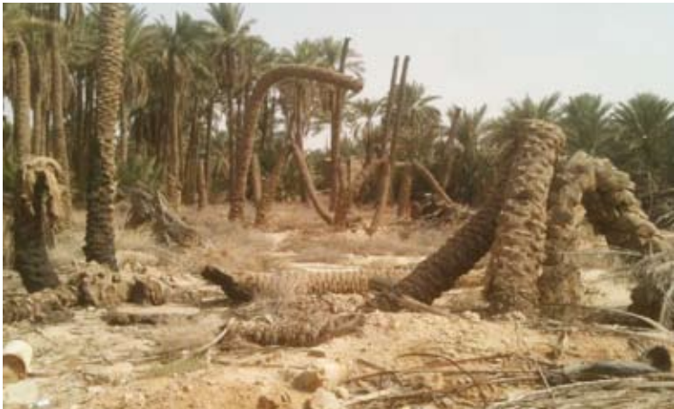
سخر الله عليهم ريحا عاتيه

♦ سلط الله على قوم هود ريحا قويه قلعت الاشجار وهدمت المنازل