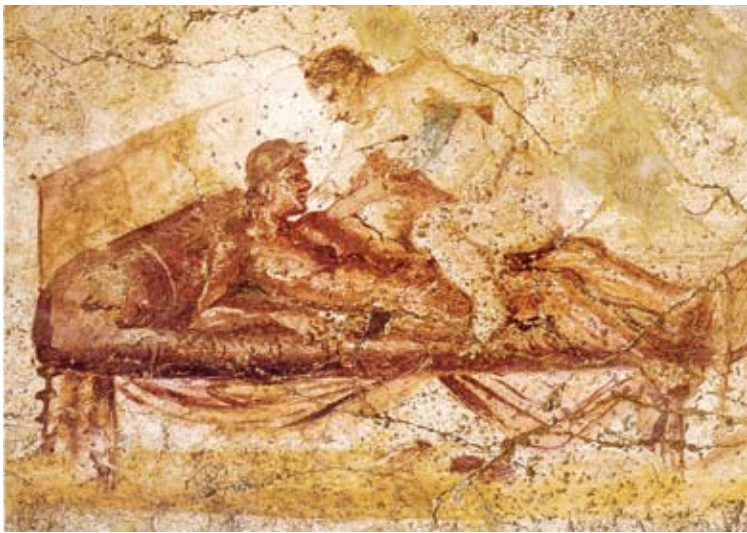
أهلكهم الله بكفرهم

على ذلك، ففازوا بالنجاة من العذاب في الدنيا وبأذن الله سيكونون في جنات النعيم في الآخرة نسال الله صلاح الحال وحسن الختام.