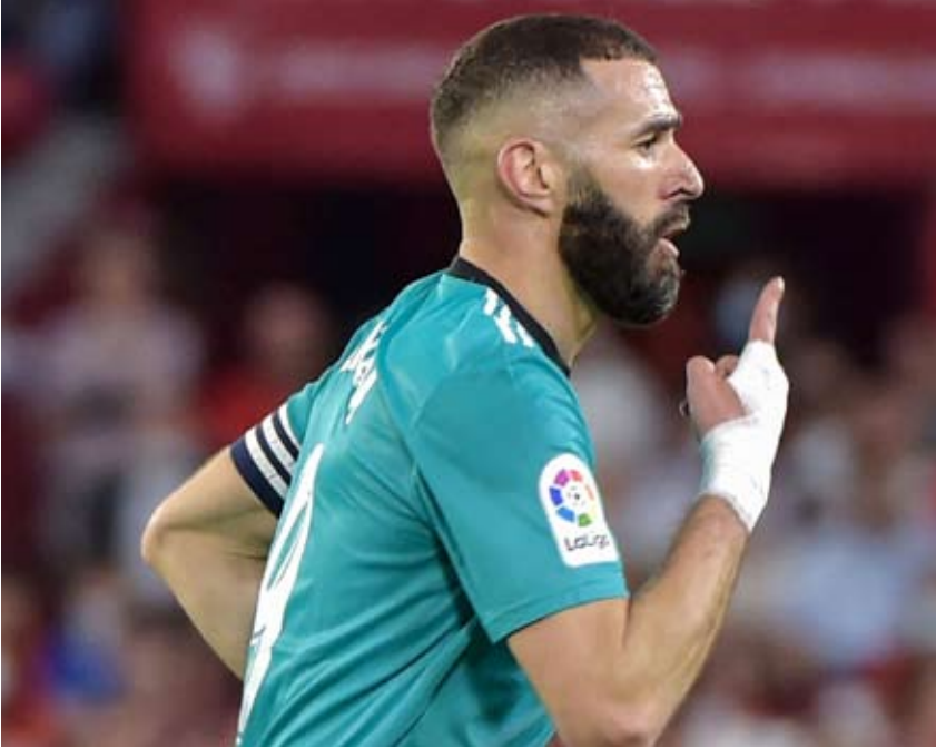
ريال مدريد يقترب من الفوز بالدوري الإسباني