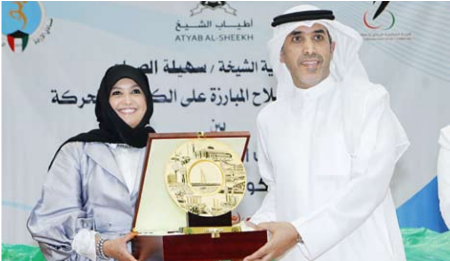
جانب من توقيع البروتوكول

سجل حافل بالإنجازات الكبيرة على المستويين القاري والدولي، وإقامة أول بطولة للمبارزة تجمع أفضل لاعبي الكويت في الفئتين، وتعد خطوة في الاتجاه الصحيح، ونأمل أن تتبناها المزيد من الخطوات التي تصب في مصلحة اللاعبين، وبما يفعل بروتوكول التعاون بين اتحاد المبارزة واللجنة البارالمبية الكويتية، مشيدا بجهود الجميع التي أدت لنجاح أول بطولة لسلح المبارزة على الكراسي المتحركة.