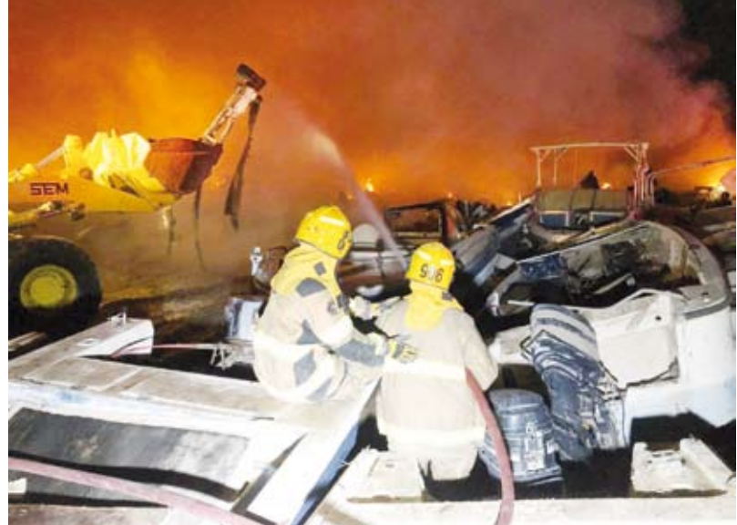
قوة الإطفاء أثناء السيطرة على الحريق

أعلنت قوة الإطفاء العام الكويتية، أن أربعة فرق تابعة لها تمكنت من السيطرة على حريق اندلع في حجز البلدية بمنطقة ميناء عبدالله. وقالت الإدارة العلاقات العامة والإعلام بقوة الإطفاء في بيان في وقت متأخر مساء الأحد: إن إدارة العمليات المركزية وجهت فرق الإطفاء من مراكز ميناء عبدالله وآم الهيامن والأحمدي