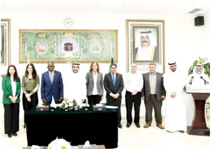
لقطة جماعية للحضور خلال توقيع مذكرة التعاون

أعلنت الهيئة الخيرية الإسلامية العالمية، أمس، توقيعها مذكرة تعاون عامة مع منظمة الأمم المتحدة للطفولة (يونيسيف).