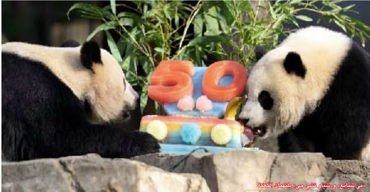
«مي شيانغ» و«شياو تشي جي» والتمايل الكعكة

أطلقتها زيارة الرئيس ريتشارد نيكسون التاريخية إلى الصين، سلط الاحتفال الذي أقيم يوم السبت الضوء أيضاً على نجاح برنامج تربية الباندا العملاقة العالمي، والذي ساعد في إعادة الباندا من حافة الانقراض.