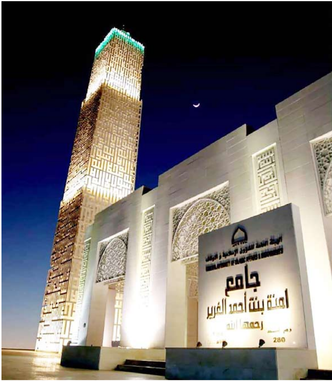
مسجد أمّنة الغريب