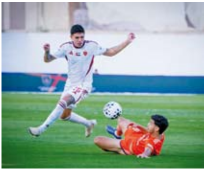
صراع على الكرة بين لاعبي الوحدة وعجمان

حقق الوحدة الذي نشط بشكل لافت في سوق الانتقالات، بداية قوية بفوز على مضيفه عجمان 2-0 في ختام المرحلة الثانية من الدوري الإماراتي لكرة القدم. ويدين ثالث الموسم الماضي والطامح لنيل اللقب الغائب عن خزائنه منذ 2010 بفوزه إلى مهاجمه السوري عمر خربين الذي سجل الهدفين، الأول عبر ركلة جزاء (35) والثاني بعد تمريرة رائعة من الوافد الجديد المصري دوشان تاديتش (65). وفاجأ خورفكان بعشرة لاعبين ضيفه الجزيرة بالفوز عليه 3-2 في مباراة شهدت ركلتي جزاء وبطاقة حمراء وتقلبات في النتيجة.