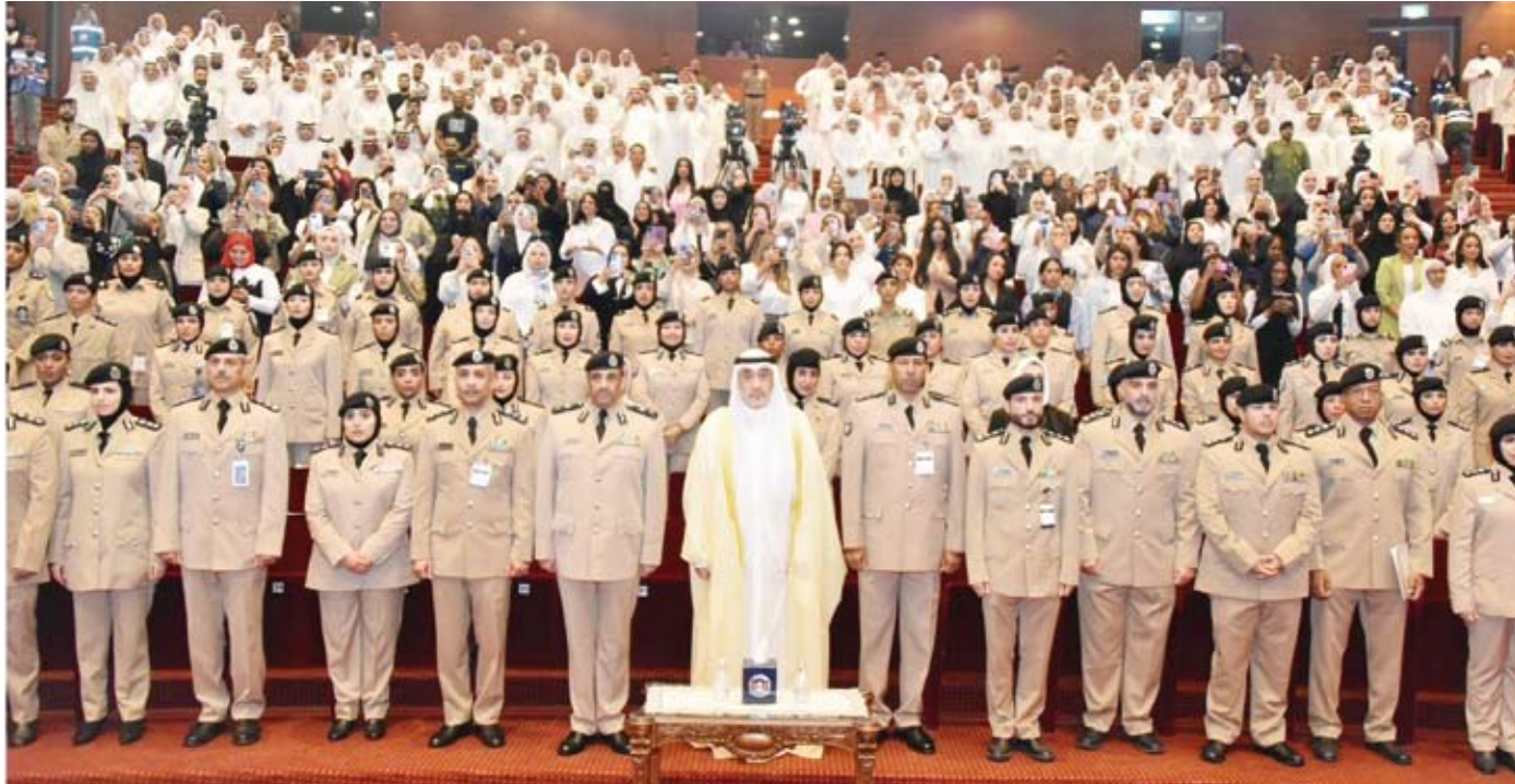
الشيخ فهد اليوسف يتقدم الحضور