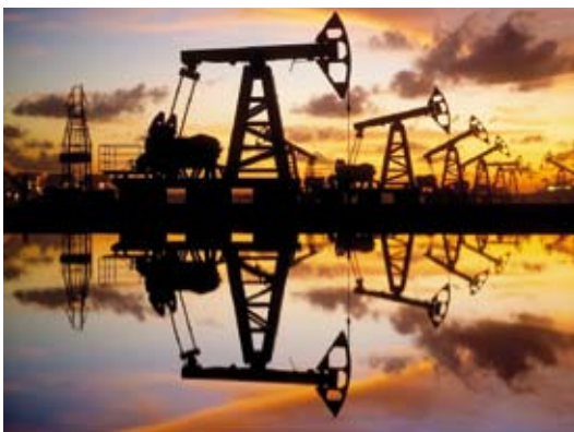
ارتفاع أسعار النفط في تداولات أمس

ارتفعت أسعار النفط خلال تعاملات أمس، مع تقييم الأسواق للقاء الرئيس الأمريكي دونالد ترامب مع نظيره الروسي فلاديمير بوتين في الأسكاجيعة الماضية، ضمن مساعي إنهاء أعنف حرب في أوروبا منذ 80 عاماً. وصعدت أسعار العقود الآجلة لخام "برنت" تسليم أكتوبر بنسبة 0.35% أو 23 سنتاً إلى 66.08 دولار للبرميل. بينما ارتفعت أسعار العقود