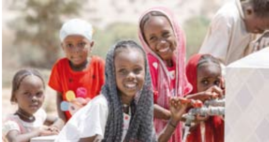
توفير المياه العذبة