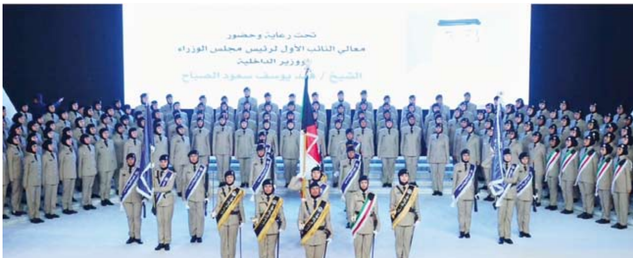
جانب من حفل التخرج