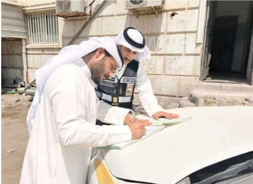
موظفي البلدية يسجلون مخالفة

◆ الخرينج: رصد المظاهر السلبية واتخاذ كافة الإجراءات القانونية تجاه المخالفين