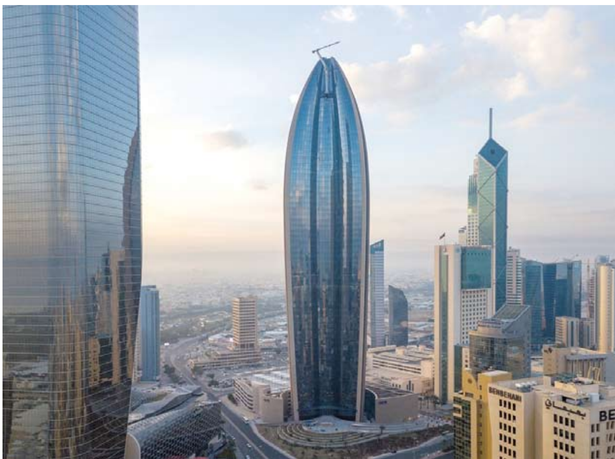
البنوك الكويتية تواصل دعم المبادرات الخيرية والاجتماعية

نحو 354 مليون دينار وفي المرتبة الثالثة تأتي مساهمات البنوك الكويتية لمؤسسة الكويت للتقدم العلمي لدعم وتطوير مجالات البحث العلمي حيث بلغت نحو 209 مليون دينار. وأضاف أن مساهمات البنوك لمعهد الدراسات المصرفية لتوفير البرامج التدريبية اللازمة لرفع كفاءة العاملين بالقطاع المصرفي تأتي في المرتبة الرابعة حيث بلغت نحو 56 مليون دينار وفي المرتبة الأخيرة جاءت التبرعات للجمعيات التعاونية والتي بلغت نحو 13 مليون دينار.