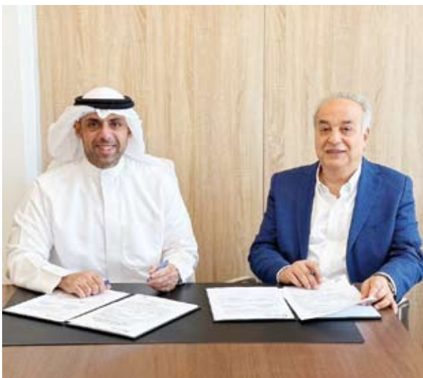
جانب من مراسم توقيع العقد

المخالفة. وأشارت الهيئة إلى أن من أهداف المشروع أيضاً رفع كفاءة التنظيم والالتزام بشروط الترخيص للحفاظ على استدامة مورد الطيف الترددي واستغلاله بالشكل الأمثل إضافة إلى إنشاء مركز تحكم متكامل ومحطات رصد ثابتة ومتنقلة وأجهزة محمولة وأدوات قياس جودة الخدمة لشبكات الاتصالات وتغطية جميع المناطق السكنية والحدودية في الدولة لضمان رصد شامل ومتكامل. وأوضحت أن هذا المشروع يساهم في تعزيز قدرات الهيئة لمراقبة جودة شبكات الاتصالات والحد من الانقطاعات الناتجة عن التداخلات والاستخدامات غير المرخصة مما يعود بالفائدة على مزودي الخدمة والمستخدمين النهائيين على حد سواء. وأكدت الهيئة التزامها المستمر بتطوير البنية التحتية الرقمية وتعزيز بيئة الاتصالات في دولة الكويت بما يتماشى مع الاستراتيجيات الوطنية وأفضل المعايير الدولية.