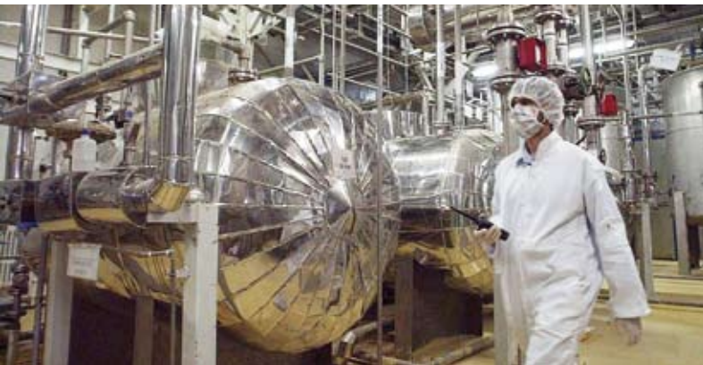
العقوبات الدولية تتواصل على إيران

دعت «جبهة الإصلاحات» في إيران، إلى وقف تخصيب اليورانيوم طوعاً وقبول رقابة الوكالة الدولية للطاقة الذرية مقابل رفع العقوبات. وحذرت الجبهة، في بيان، من خطورة التهديد الأوروبي بتفعيل آلية «سناپ باك» بما يعني عودة العقوبات الأممية، فضلاً عن توفير «غطاء شرعي» لأي حرب مستقبلية ضد طهران. وأكدت أن تجنب هذا السيناريو بشكل «أولوية وطنية عاجلة». وأضافت أن «حرب الـ12 يوماً مع إسرائيل في يونيو (حزيران)، قد غيرت ملامح أمننا القومي في المنطقة والعالم رغم الرد