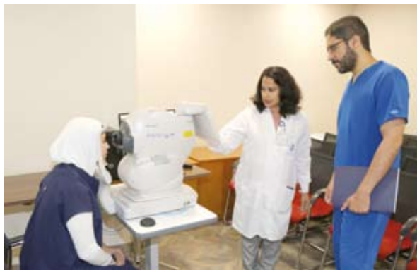
جانب من الورشة

الممارسات العالمية في هذا المجال. كما تم التركيز على الجوانب التطبيقية التي يمكن تبنيها في المراكز الصحية لضمان التدخل المبكر والحد من تطور المرض ومضاعفاته. ويحرص المعهد، على أهمية تنظيم مثل هذه الورش التدريبية لتمكين الأطباء في خط الدفاع الأول حيث يعد ذلك خطوة جوهرية في تحسين جودة الرعاية الصحية وخفض معدلات الإصابة بمضاعفات الزمنة للسكري.