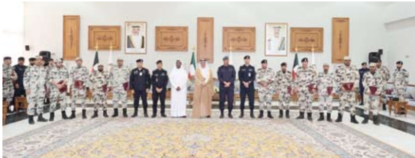
محافظ الجھراء يتوسط المكرمين