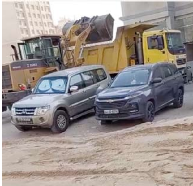
الساحة بعد رفع المخلفات