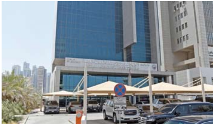
الجهاز المركزي للمناقصات

السكراب الجديد من المنتظر أن يحتوي السكراب الجديد على: 1 - منطقة للمحال والمعارض لبيع قطع غيار السيارات المستعملة والتالفة. 2 - مستودعات لتخزين القطع بعد فرزها. 3 - منطقة للورش وإصلاح وتطبيع السيارات. 4 - مراكز صيانة سريعة للفوز وإعادة التدوير. 5 - إضافة وحدات لمعالجة الزيوت، والبطاريات، والإطارات، بطرق صديقة للبيئة. 6 - ساحات لتجميع المعادن وفرزها (حديد - المنيوم - نحاس). 7 -وحدات للتعامل مع النفايات الخطرة (المواد الكيميائية، وسوائل التبريد)