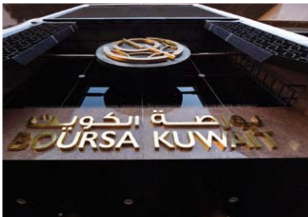
السوق العام يواصل التراجع للجلسة الثانية على التوالي

سيطر التباين على المؤشرات الرئيسية لبورصة الكويت عند إغلاق تعاملات، وسط ارتفاع 5 قطعاً. تراجع مؤشر السوق الأول والعام بنسبة 0.37% و0.24%، على التوالي، بينما ارتفع "الرئيسي" 50 بنحو 0.25%، و"الرئيسي" بـ 0.37% عن مستوى. سجلت بورصة الكويت تداولات بقيمة 93.57 مليون دينار، وزعت على 579.42 مليون سهم، بتفنيذ 27.61 ألف صفقة.