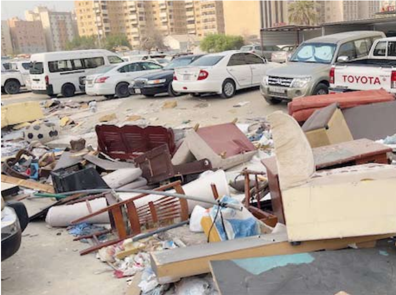
المخلفات في الساحات العامة