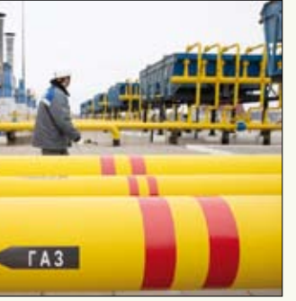
دور مهم للغاز الروسي في المفاوضات مع الاتحاد الأوروبي

وبالنسبة لعام 2024 بالكامل، شكلت واردات التكتل من الغاز الطبيعي المسال من الولايات المتحدة نحو 45 في المائة، مما يجعلها أكبر مورد للغاز الطبيعي المسال للاتحاد الأوروبي، بحسب المفوضية الأوروبية. وعلى عكس الفحم والنفط والروسيين، لم يفرض الاتحاد الأوروبي حتى الآن عقوبات على الغاز بسبب استمرار الاعتماد عليه من جانب بعض الدول الأعضاء. وما زالت إمدادات الغاز الطبيعي المسال وخطوط الأنابيب، بما في ذلك عبر ترك ستريم، تتدفق إلى التكتل.