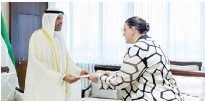
وزير الخارجية يتسلم نسخة من أوراق اعتماد سفيرة كندا

السفير من جهود متميزة وإسهامات بارزة في تعزيز أواصر العلاقات الثنائية المتميزة بين دولة الكويت وجمهورية العراق، معرباً عن شكره وتقديره لما قدمه من دعم لتطوير هذه العلاقات ومتمنياً له التوفيق والنجاح في مهامه المستقبلية.