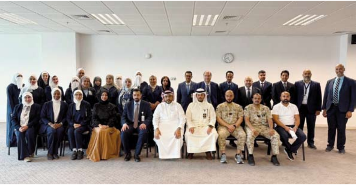
لقطة جماعية للمشاركين في الورشة التدريبية

بمشاركة 30 مساعد رئيس هيئة ترفيهية من مختلف القطاعات الصحية. وأضافت أن البرنامج التدريبي الذي استمر ثلاثة أيام ركّز على تطوير مهارات