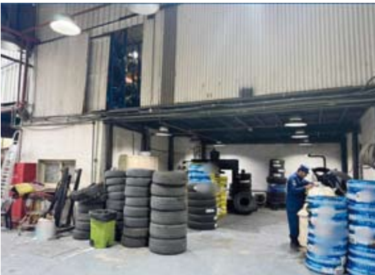
قوة الإطفاء تفحص مخزن للتوابير

مع عدة جهات حكومية وهم وزارة التجارة والهيئة العامة للصناعة وبلدية الكويت، وتهدف الحملة إلى رصد المباني والمنشآت المخالفة لاشتراطات السلامة والوقاية من الحريق. وقد أسفرت الحملة عن غلق