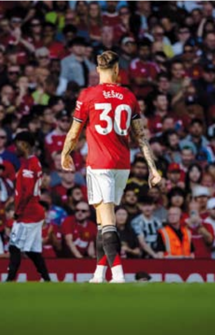
يونايتد يفشل في تحقيق الفوز على الأرسنال في 6 مواجهات

للمان يونايتد، حيث لم يتذوق أمامه أي خسارة للمباراة السادسة على التوالي في الدوري (5 انتصارات وتعادل). وكان آخر انتصار لـ«الشياطين الحمر» على اللندنيين في سبتمبر 2022 بنتيجة (3-1) على ملعب (أولد ترافورد). وحصد فريق الإسباني ميكيل أرتيتا أول 3 نقاط في الموسم، ليحتل المركز السادس مؤقتا بفارق الأهداف خلف مانشستر سيتي وسندرلاند وتوتنهام هوتسبر وليفربول، ونو تنجحهم فورست على الترتيب. بينما سقط المان يونايتد في فخ الخسارة الأولى في الموسم وفي عقد داره، ليأتي في المرتبة 15أ بشكل مؤقت بدون نقاط.