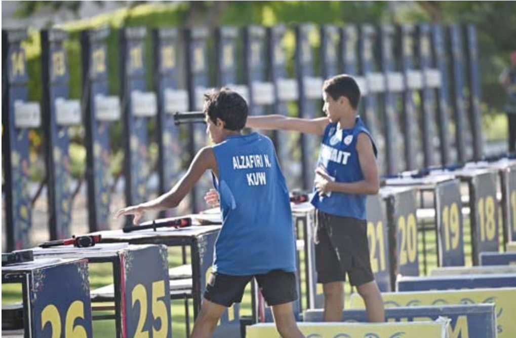
أداء قوي لناشئي الكويت تحت 15

بلغت البولندية إيغا شفيونتيك، المصنفة ثالثة عالميا، نهائي دورة سينسيناتي الألف نقطة لكرة المضرب لأول مرة في مسيرتها، وذلك بعدما جددت تفوقها على الكازخستانية إيلينا ريباкина العاشرة عالميا بالفوز عليها 6-3 و6-3. وبعدما بلغت نصف النهائي في الموسمين