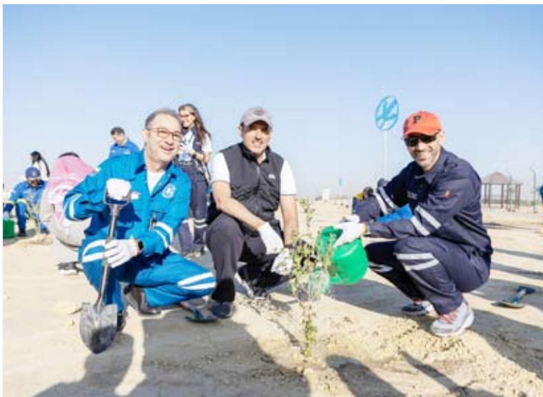
المحافظ ورئيس المؤسسة ورئيس شركة نفط الكويت خلال أعمال الزراعة

أطلقت مؤسسة البترول الكويتية أمس النسخة الثانية من مبادرة زراعة أشجار السدر في واحة الأحمد التابعة لشركة نفط الكويت في إطار التزام القطاع النفطي الكويتي بدعم الاستدامة البيئية وتوسيع الرقعة الخضراء. وقالت المؤسسة في بيان صحفي إن الفعالية شهدت حضوراً رفيع المستوى تمثل بمشاركة نائب رئيس مجلس الإدارة والرئيس التنفيذي للمؤسسة الشيخ نواف سعود الناصر الصباح ومحافظ الأحمد الشيخ حمود جابر الأحمد الصباح إلى جانب الرؤساء التنفيذيين والأعضاء المنتمين في الشركات التابعة للمؤسسة.