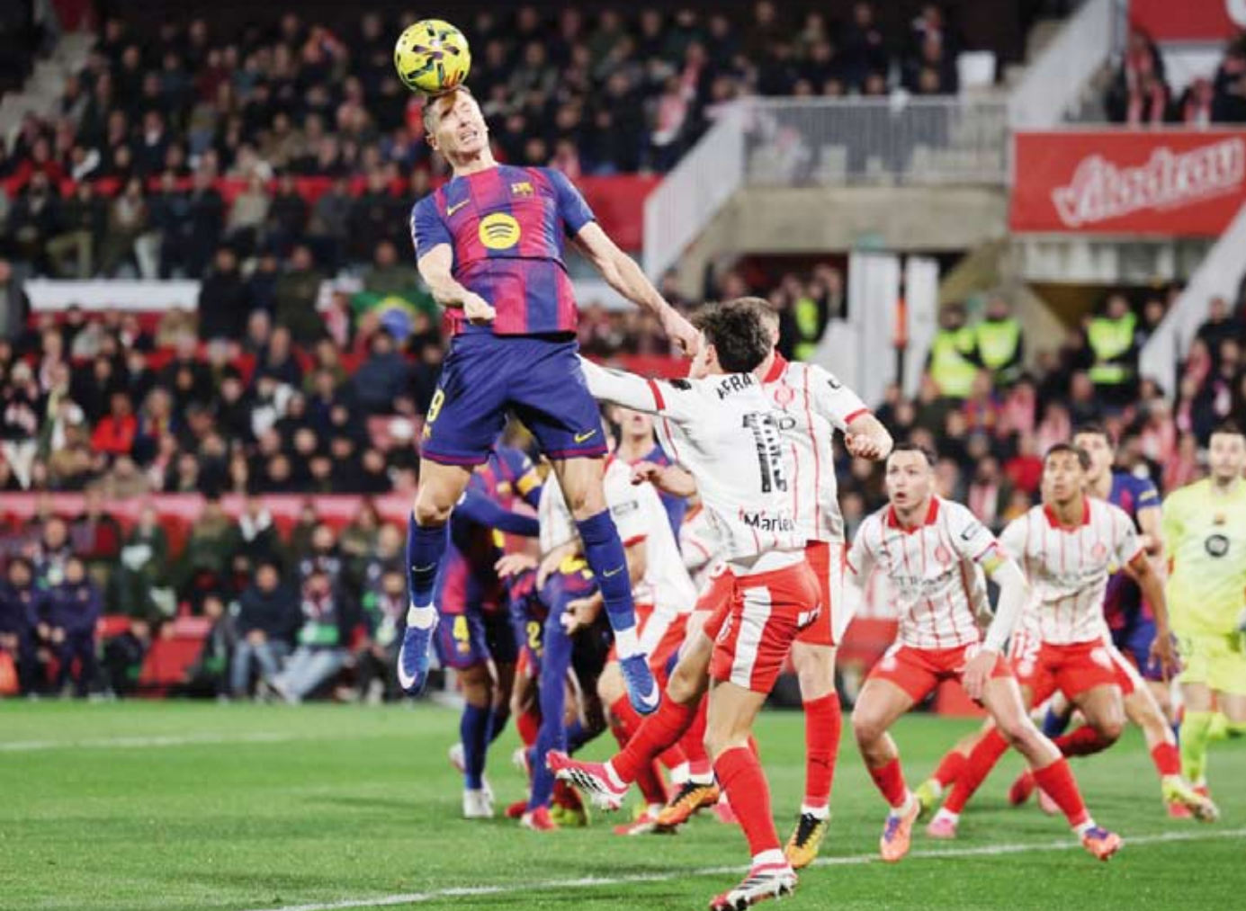
برشلونة يتنازل عن قمة الليغا لصالح ريال مدريد

أعلن النادي الأهلي المصري، الاثنين، رفضه التقدم بشكوى ضد نادي الجيش الملكي المغربي، على خلفية الأحداث التي شهدتها مباراة الفريقين في دوري أبطال أفريقيا، مؤكداً أنه وضع كل الحقائق أمام الاتحاد الأفريقي لكرة القدم «كاف». وأوضح الأهلي، في بيان رسمي، أن لكل الأندية الشقيقة الحق في اتخاذ ما تراه مناسباً من إجراءات أمام الجهات المختصة، مشيراً إلى أن أحداث المباراة الأولى بين الفريقين، التي أقيمت على ملعب الأموم مولاي الحسن يوم 28 نوفمبر 2025، شهدت تعرض لاعبي الأهلي للإذى والتهديد عقب ذقب آلات حادة داخل أرض الملعب، وهو ما تم توثيقه عبر البث التلفزيوني والفيديوهات المتداولة.