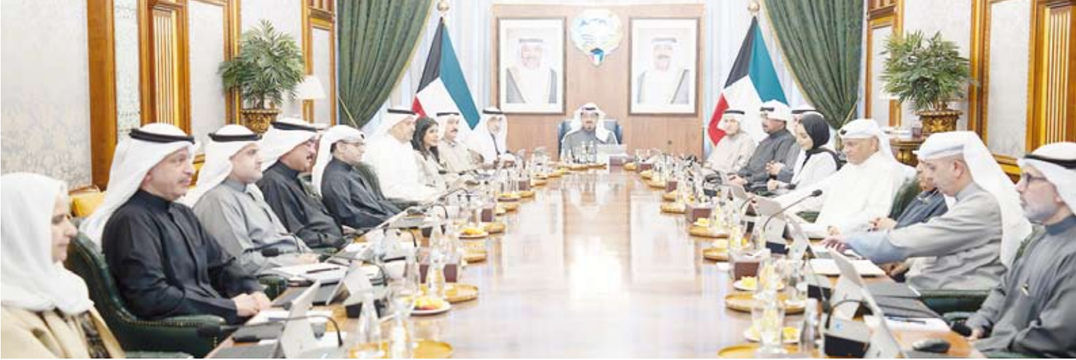
العبدالله يترأس اجتماع المجلس أمس

من جهةتتجدد مجلس الوزراء تأكيده على دعمه الكامل للجهود الوطنية المبذولة لتعزيز فعالية المنظومة الوطنية لمكافحة غسل الأموال وتمويل الإرهاب وانتشار التسلح واستكمال تنفيذ خطة العمل ضمن الإطار الزمني المحدد بما يعكس التزام دولة الكويت بالمعايير الدولية وترسيخ مكانتها المالية والاقتصادية. واستعرض مجلس الوزراء عددا من المواضيع المدرجة على جدول الأعمال وقرر الموافقة عليها كما قرر إحالة عدد منها إلى اللجان الوزارية المختصة لدراستها وإعداد تقارير بشأنها لاستكمال الإجراءات الخاصة لإنجازها.