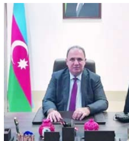
السفير إميل كريموف

تقدم سفير جمهورية أذربيجان لدى دولة الكويت السفير إميل كريموف ، إلى حضرة صاحب السمو أمير البلاد الشيخ مشعل الأحمد الجابر الصباح و إلى ولي عهد دولة الكويت سمو الشيخ صباح خالد الحمد الصباح وإلى حكومة دولة الكويت وشعبها الشقيق والصديق بأسمى آيات التهاني والتبريكات بمناسبة شهر رمضان المبارك « داعيا الله تعالى أن يعيد هذه الأيام الفضيلة سنوات عديده عليكم وعلى الأمة الإسلامية بالخير والبركات، وأن ينقل بنا ومنكم صالح الأعمال وأن يوفقنا وإياكم لصيامها ولقيامه .