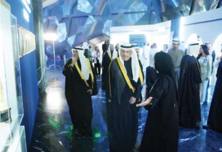
جولة في المعرض

وتتطلق بنقطة نحو المستقبل شريكاً فاعلاً في بناء وعي خليجي جامع وإعلام يعكس صورتنا الحضارية المشتركة». وثقن جهود جميع من أسهموا في مسيرة هذه المؤسسة منذ تأسيسها من المؤسسين الأوائل إلى الكوادر التي واصلت العطاء بإخلاص و ثقتان فصنعوا من هذا الصرح إرثاً إعلامياً راسخاً في وجدان الأسرة الخليجية فأثلاً: لقد كان عطاؤهم رسالة صادقة تجاوزت حدود الزمن وستبقى بصماتهم محفورة في ذاكرة العمل الخليجي المشترك. وغير الوزير العمر عن أمله في أن تبقى مؤسسة الإنتاج البرامجي المشترك منارة إعلامية خليجية وجسراً ثقافياً يجمع شعوبنا ويجسد روح التعاون التي قامت عليها مسيرتنا الخليجية المشتركة.