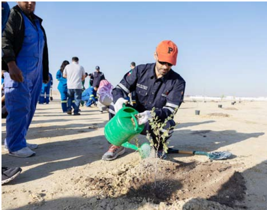
الشيخ نواف خلال زراعته لشجرة السدر

أطلقت مؤسسة البترول الكويتية أمس الثلاثاء النسخة الثانية من مبادرة زراعة أشجار السدر في واحة الأحمدى التابعة لشركة نفط الكويت في إطار التزام القطاع النفطي الكويتي بدعم الاستدامة البيئية وتوسيع الرقعة الخضراء.