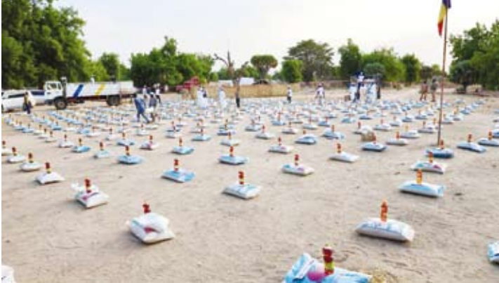
تجهيز السلال الغذائية