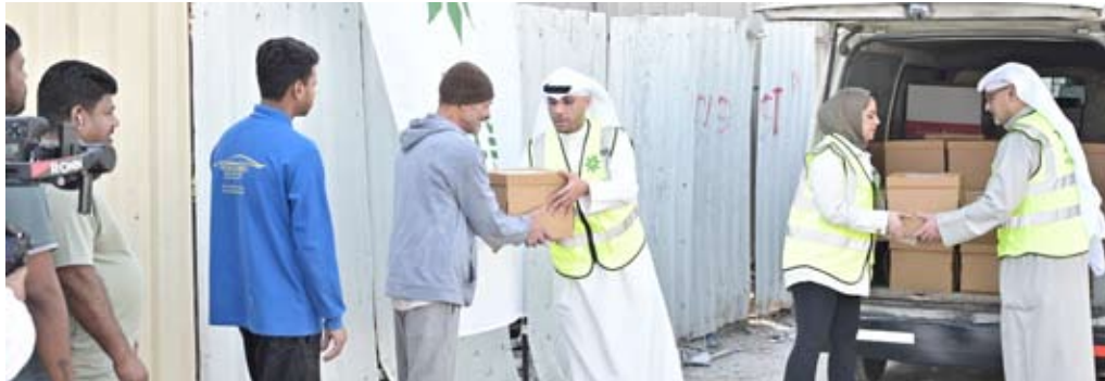
فريق التجاري يوزع سلة الخير