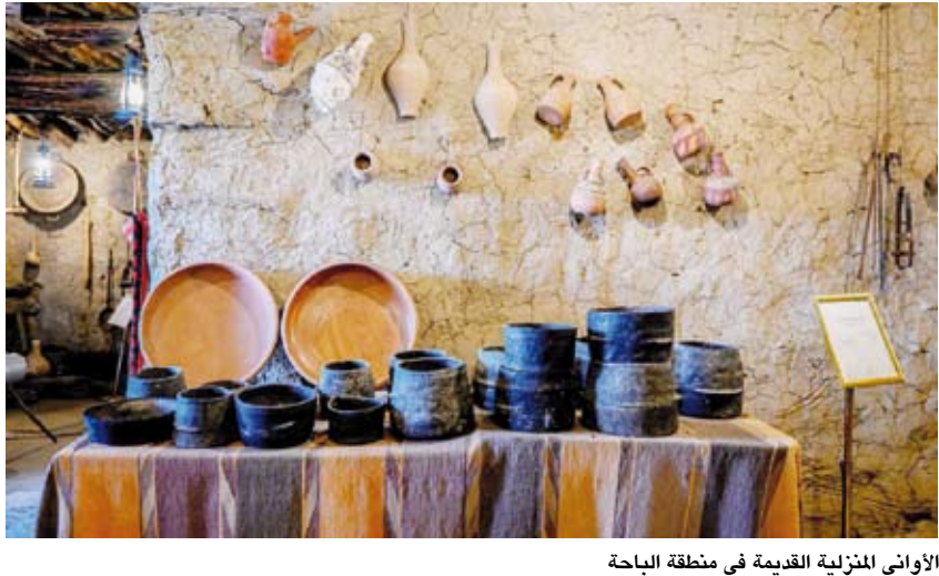
الأواني المنزلية القديمة في منطقة الباحة