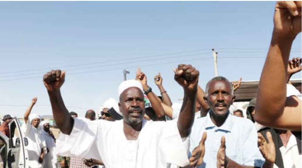
سودانيون ينددون بانتهاكات «الدعم السريع»

ويرى عبد الكافي، في حديثه إلى «الشرق الأوسط»، أن «فك الارتباط هذا سوف يحدث إذا ما استمر الضغط المصري – التركي المشترك على حفتر لقطع إمداد (الدعم السريع)».