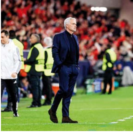
مدرب بنفيكا البرتغالي جوزيه مورينيو

وقال مورينيو للصحافيين رداً على سؤال عما إذا كان قادراً أوضح أن بند فك الارتباط أدرج بسبب انتخابات رئاسة بنفيكا التي كانت مقررة في نوفمبر 2025، أي بعد أسابيع قليلة من توقيعه العقد.