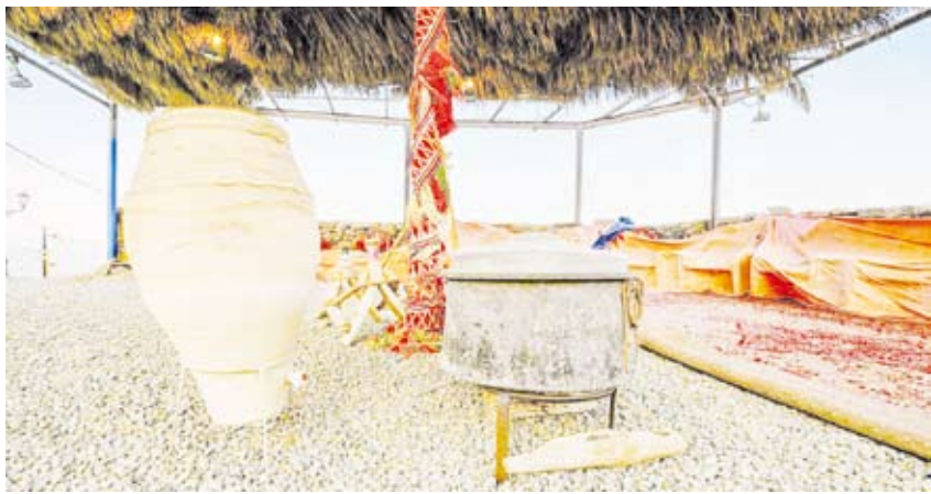
تراث عميق يجمع بين التاريخ العريق والطبيعة الساحرة والإبداع

الكثير من النساء عادة موسمية تسبق شهر رمضان، إذ يقفن تجار الأواني في توفير مختلف الأواني بأشكالها المختلفة ذات الزخارف والرسومات التراثية والإسلامية المرتبطة بالشهر الكريم، وتجذب الزبائن وخاصة كبار السن والنساء، حيث تزين محلات بيع الأواني الفخارية الشعبية التي جنبات الطرق العامة بالمنطقة الكثافة التراثية التي تجدها تلك الأواني من قبل أهالي وزوار المنطقة. ووُثقت عدد من الأواني المنزلية القديمة التي تعرض في متحف الأخوين بالباحة، وتجد إشادة وإعجاب من زوارها بما يشهدهونها من أوان منزلية بمختلف أنواعها وأحجامها وطريقة صناعتها واستخدامها التي تعكس العمق الثقافي والتاريخي والتراثي للمنطقة. يُذكر أن منطقة الباحة تزخر بثراث عميق يجمع بين التاريخ العريق والطبيعة الساحرة والإنسان المبدع، لتظل شاهدة على هوية الباحة الأصيلة، المتوارثة جيلاً بعد جيل، وعلامة بارزة من علامات المنطقة الثقافية.