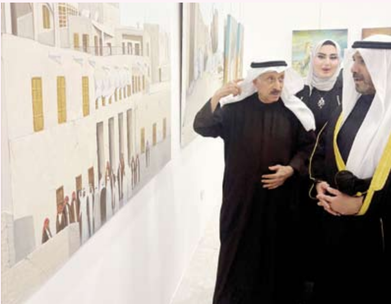
الشيخ صباح ناصر الصباح يطلع على لوحات المشاركين

أقامت الجمعية الكويتية للفنون التشكيلية، أول أمس، النسخة الـ18 من مهرجان الكويت للإبداع التشكيلي التي شهدت مشاركة واسعة وتقديم أعمال فنية متميزة عكست الثراء المعرفي والثقافي للمشاركين. وقال سفير دولة الكويت لدى المملكة العربية السعودية الرئيس الفخري للجمعية الكويتية للفنون التشكيلية الشيخ صباح ناصر صباح الأحمد في كلمة خلال افتتاح المهرجان، الذي أقيم في مقر (الجمعية)، تزامناً مع احتفالات دولة الكويت بالذكرى الـ65 للعيد الوطني والذكرى الـ35 ليوم التحرير: إن مهرجان الكويت للإبداع التشكيلي يشكل فرصة حقيقية للاطلاع على ملامح غنية من المدارس والاتجاهات الفنية المتنوعة. وأضاف أن الفنانين أبسروا في هذا