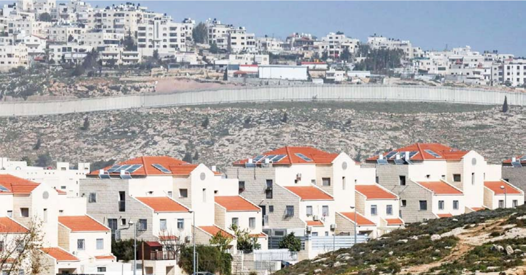
مستوطنة «نقيع يعقوب» شمال القدس الشرقية

أظهرت مخططات إسرائيلية كُشِف عنها، رغبة رسمية في تسريع الاستيلاء على مزيد من أراضي مدينة القدس عبر تمديد حدود مناطقها الخاضعة للاحتلال، إلى خطوط ما قبل حرب عام 1967.