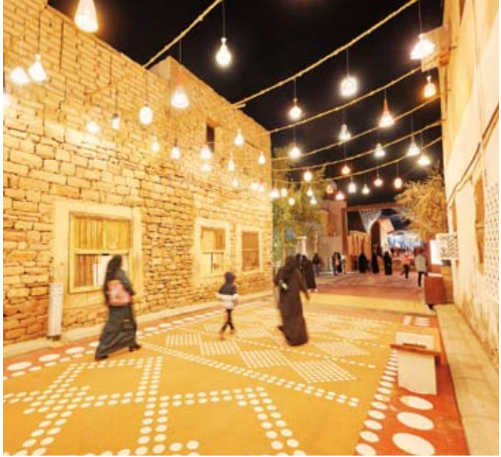
أجواء رمضانية في «الاعلا»

رحلات مباشرة من دبي تصل إلى نحو 20 رحلة أسبوعياً. كما يستمتع الزوّار بأجواء شتوية مشمسة ومعتدلة، حيث يبلغ متوسط درجات الحرارة العظمى خلال شهر رمضان نحو 24 درجة مئوية، والصغرى 7 درجات مئوية، ما يجعلها مثالية للأنشطة الخارجية نهاراً وليلاً. كما تقدّم فنادق الاعلا خلال شهر