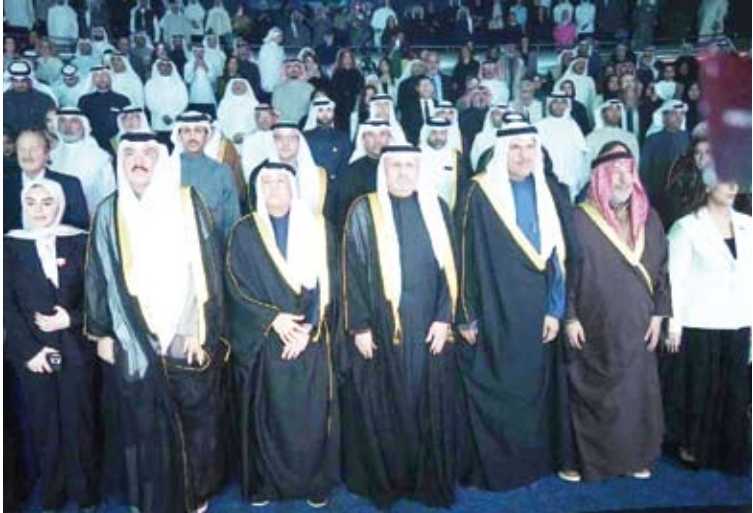
الوزير عمر العمر يتقدم الحضور

بدوره رفع الأمين العام لمجلس التعاون لدول الخليج العربية جاسم البديوي في كلمته أسمى آيات الشكر والتقدير إلى صاحب السمو أمير البلاد الشيخ مشعل الأحمد على ما توليه دولة الكويت من رعاية كريمة واهتمام متواصل باستضافة ودعم مقرات مجلس التعاون ومؤسساته في تجسيد صادق لنهج راسخ يعكس عمق الإيمان بالحرص على تعزيز العمل الخليجي المشترك. وغير البديوي عن سعاداته بالاحتفاء بمرور خمسين عاماً على تأسيس مؤسسة خليجية رائدة شكلت منذ انطلاقتها منصة إعلامية متميزة وأسهمت عبر مسيرتها الحافلة في ترسيخ الهوية الخليجية