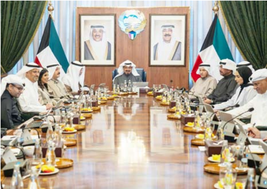
العبدالله يترأس اجتماع مجلس الوزراء أمس

نتقدم بأصدق آيات التهاني والتبريكات إلى حضرة صاحب السمو أمير البلاد الشيخ مشعل الأحمد الصباح حفظه الله ورعاه وإلى سمو ولي العهد الشيخ صباح خالد الحمد الصباح حفظه الله ، وإلى رئيس مجلس الوزراء سمو الشيخ أحمد عبدالله الأحمد الصباح حفظه الله وإلى جموع المواطنين والمقيمين على أرض بلدنا الحبيب الكويت بمناسبة قدوم شهر رمضان المبارك أعاده الله على الأمتين العربية والإسلامية بالخير واليمن والبركات.