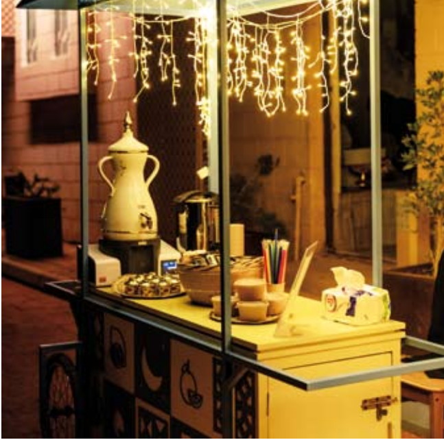
أصالة الضيافة العربية وروح الشهر الفضيل