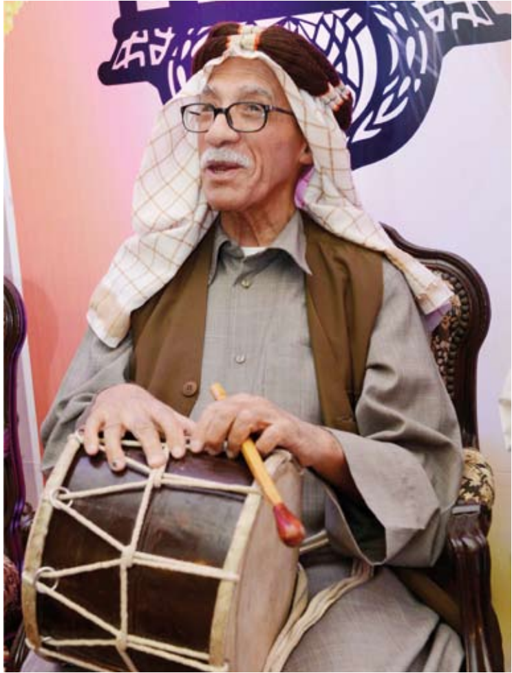
شخصية بوطيلة الرمضانية

وكان بو طيلة «المسحراتي»، وهي شخصية قديمة من التراث العربي افتقدناها في عصرنا الحالي وهو شخص يطوف الشوارع والأزقة منبها الناس لوقت السحور ويعرف في بعض الدول العربية، يطوف بين البيوت قبيل الفجر لينبهم لموعد السحور، ويكون أحياناً معه حمار عليه خرج يضع فيه ما يتصدق عليه به أهالي الحي من طعام أو عطايا، فيقرع بو طيلة على طبله وهو يطوف بالبيوت ويردد: قوم يا نايب، وخذ الدايب اتسحر بالسحور. وعادة ما يكون بو طيلة من أهل الحي نفسه، حيث ينادي أحياناً أسماء أبناء الحي واحداً تلو الآخر ليوظهم من نومهم قبيل وقت الاساك لتناول طعام السحور ومن ثم تأدية صلاة الفجر. وكان لكل حي «بو طيلة» خاص به، ولكل منهم نداءه وأدعيته الخاصة حسب اجتهاده وإبداعه.