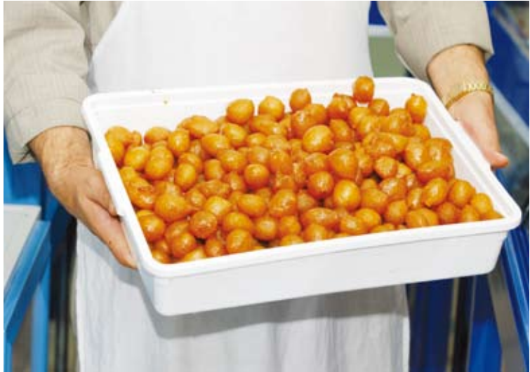
الحلويات طبق رئيسي في شهر الخير