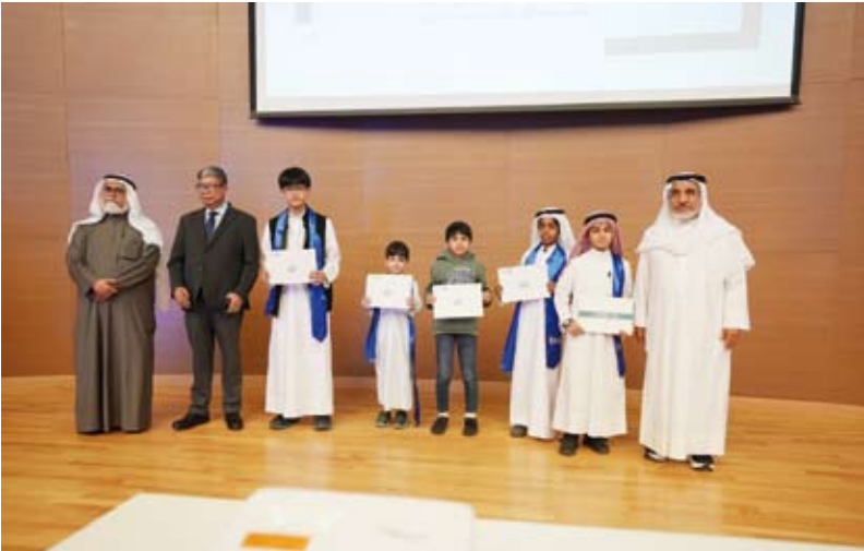
جانب من تكريم الفائزين