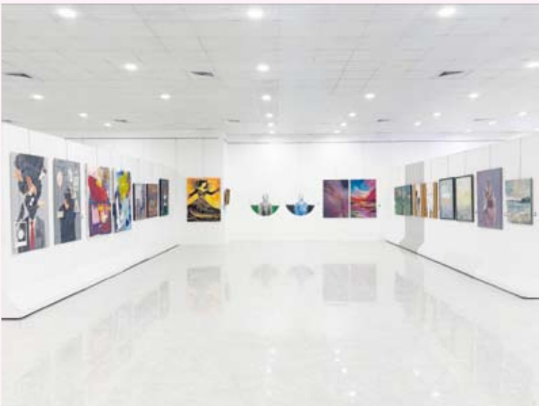
جانب من الأعمال الفنية