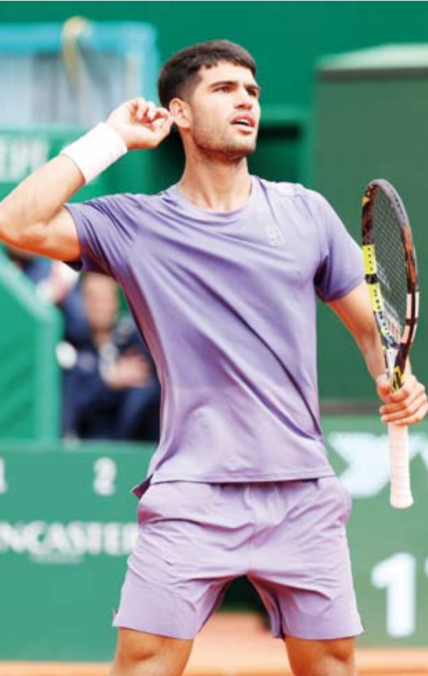
الإسباني كارلوس الكاراز

الذي حافظ بدوره على المركز التاسع برصيد 4050 نقطة رغم تتويجه باللقب في تكساس بينما جاء الكازخي ألكسندر بوليك في المركز العاشر برصيد 3405 نقاط.