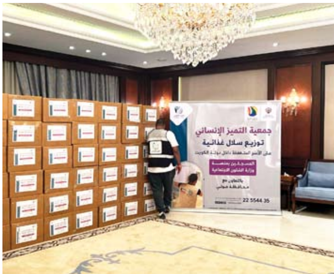
التعاون المثر مع محافظة حولي يعكس روح الشراكة المجتمعية