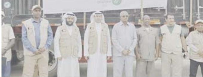
جانب من مراسم توزيع السلال الغذائية لتناحي الحرب في السودان

من جهة أخرى أحاط سمو الشيخ أحمد العبدالله رئيس مجلس الوزراء ورئيس وفد دولة الكويت في أعمال الدورة الـ62 لمؤتمر ميونخ للأمن مجلس الوزراء علما بنتائج مشاركة وفد دولة الكويت في الدورة التي حضرها عدد من رؤساء الدول والحكومات ووزراء الخارجية والدفاع وممثلي منظمات المجتمع المدني مؤكدا سموه لحفظه الله أهمية مؤتمر ميونخ للأمن الذي ناقش أبرز التحديات الأمنية العالمية الراهنة واتاح المجال لحوارات بناءة تسهم في تشكيل أرضية مشتركة تعزز التعاون الدولي وتدعم الجهود الرامية إلى تسوية الخلافات والأزمات على المستويين الإقليمي والدولي مشيرا سموه إلى أن التحديات المتسارعة التي يواجهها العالم تستوجب وضع خريطة طريق توافقية لتعزيز الأمن العالمي وتوحيد الجهود لترسيخ الاستقرار وتعزيز التعاون الدولي بما يسهم في بناء مستقبل آمن ومزدهر مجددا سموه حفظه الله التأكيد على التزام دولة