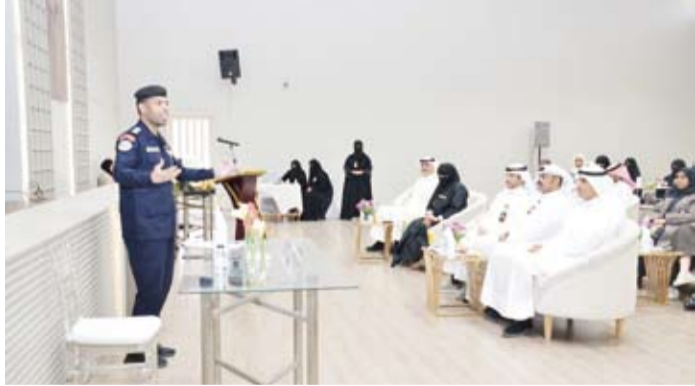
جانب من المحاضرة