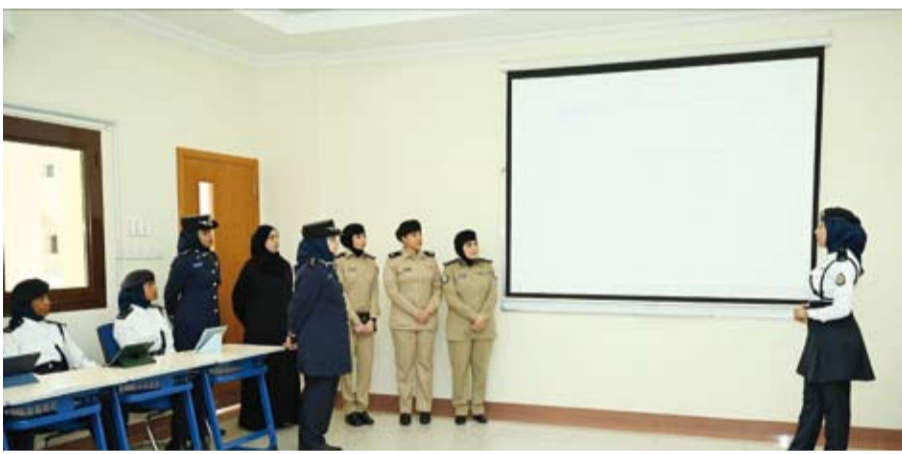
جانب من زيارة وفد معهد الشرطة النسائية الكويتي

أجرى وفد من معهد الشرطة النسائية بوزارة الداخلية الكويتية، أول أمس، زيارة لأكاديمية السلطان قابوس لعلوم الشرطة بسلطنة عمان الشقيقة لتعزيز التعاون في مجالات التعليم والتدريب للمرأة الشرطة وتطوير النظم التعليمية والبرامج التدريبية والمعرفية بين البلدين. وذكرت وزارة الداخلية الكويتية في بيان صحفي، أن الزيارة تأتي في إطار التعاون الأمني المشترك وتبادل الخبرات بين دول مجلس التعاون لدول الخليج العربية الشقيقة.