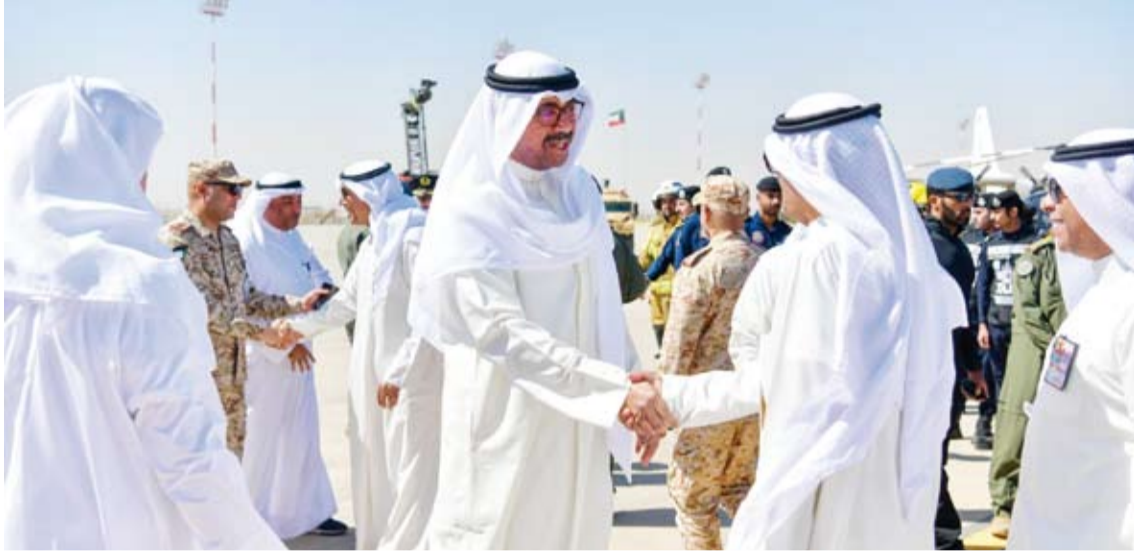
الشيخ عبدالله العلي يصافح المشاركين

◆ نائب رئيس الأركان: الهدف الأسمى من التمرين العمل تحت راية واحدة وتعزيز العمل المشترك وتوحيد الجهود