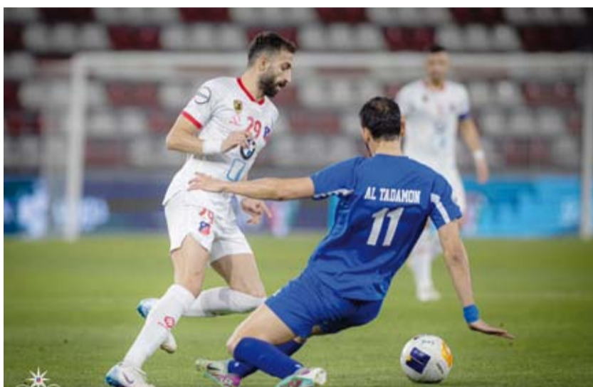
الكويت في طريقه للاحتفاظ بلقب الدوري