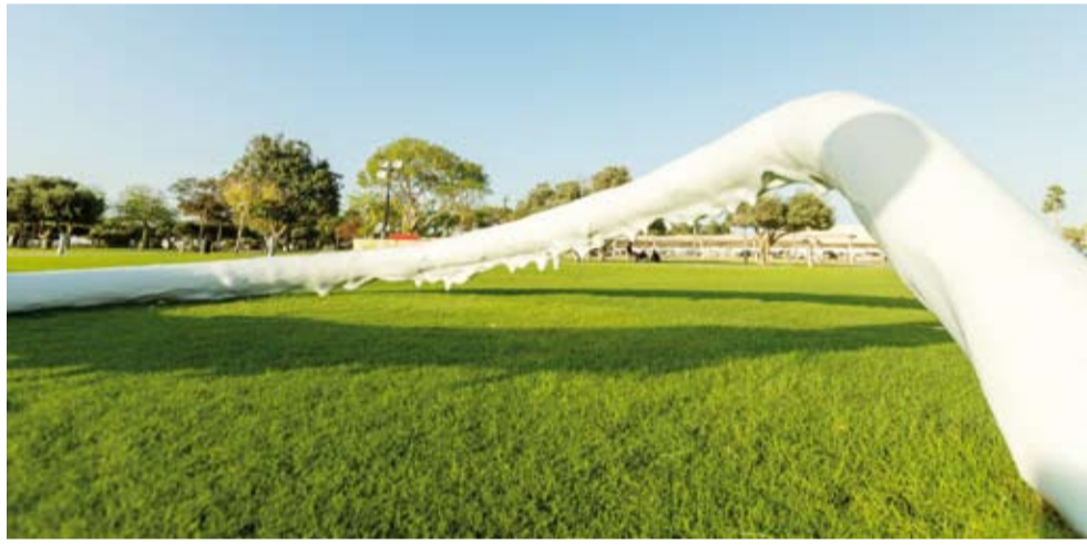
العمل الفني «نقاط الارتكاز»