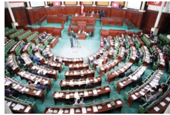
من جلسة سابقة لنواب البرلمان التونسي

الصورة النمطية، ويؤكدوا أنهم نواب فاعلون». وتابع حامدي، في تعليقه لوكالة الأنباء الألمانية، أن «المحكمة الدستورية لا تبدو من أولويات الرئيس سعيد، لكن بعد استكمالته مشروعه السياسي، وإرساء القوانين، ربما يعمل على وضع المحكمة، التي لا يعتقد أن تكون بصلاحيات قوية في نظام سياسي يهيم عليه بالكامل الرئيس، بما في ذلك السياسات التشريعية». ويقول خبراء وقادة المعارضة إن تعطيل وضع