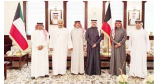
السفير حمد المرعي مستضيفاً لنظرائه الخليجيين

تحقيق الأهداف الاستراتيجية والمصالح المشتركة بين دول المجلس التعاون الخليجي. وأضاف المرعي أن هذه اللقاءات فرصة للتباحث والتشاور في جميع القضايا المشتركة بين دول المجلس التعاون الخليجي وتحسين فرص الشراكات المستقبلية. وناقش الاجتماع العلاقات المتميزة بين دول مجلس التعاون لدول الخليج العربية مع الأردن وسبل تنميتها في مختلف المجالات. وبحث السفراء عدداً من القضايا الإقليمية والتعاون المشترك بين دول مجلس التعاون والأردن.