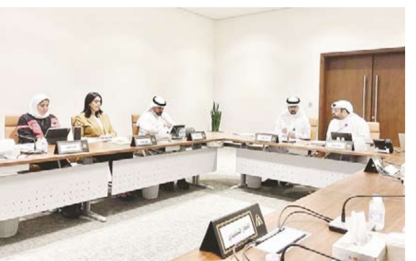
اجتماع سابق للجنة القانونية

البلدية؛ الأولى في طور تنفيذها إلكترونياً على « البناء » والثانية لا حاجة لتعديل قيمتها حالياً اقتراح العبد الجادر بشأن تعديل قيمة الرسوم الواردة في لائحة المعارض المؤقتة رقم 930 لسنة 2019 مقترح تعديل قيمة بعض الرسوم الواردة في لائحة الإعلانات رقم 599