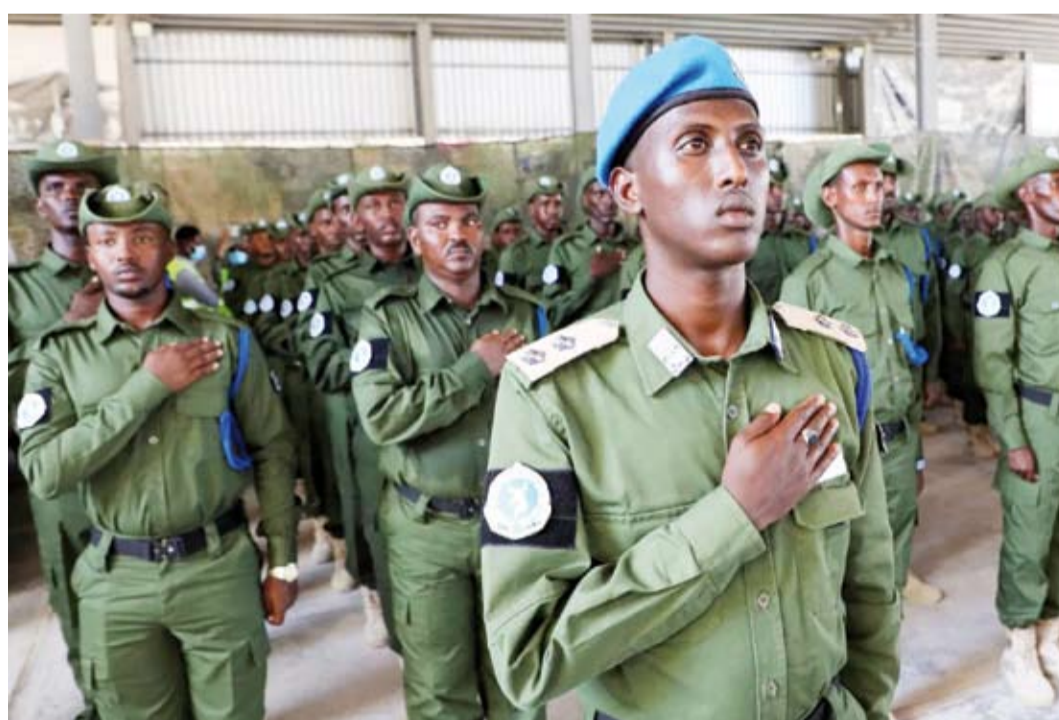
أفراد من قوات الشرطة الخاصة الصومالية

سيطر «حركة الشباب» الصومالية المتطرفة على عدد من يابال، البلدة الواقعة في وسط البلاد، التي تعد استراتيجياً للجيش؛ بسبب وجود قاعدة عسكرية أساسية فيها، وفق ما أفاد مسؤولون عسكريون وسكان.