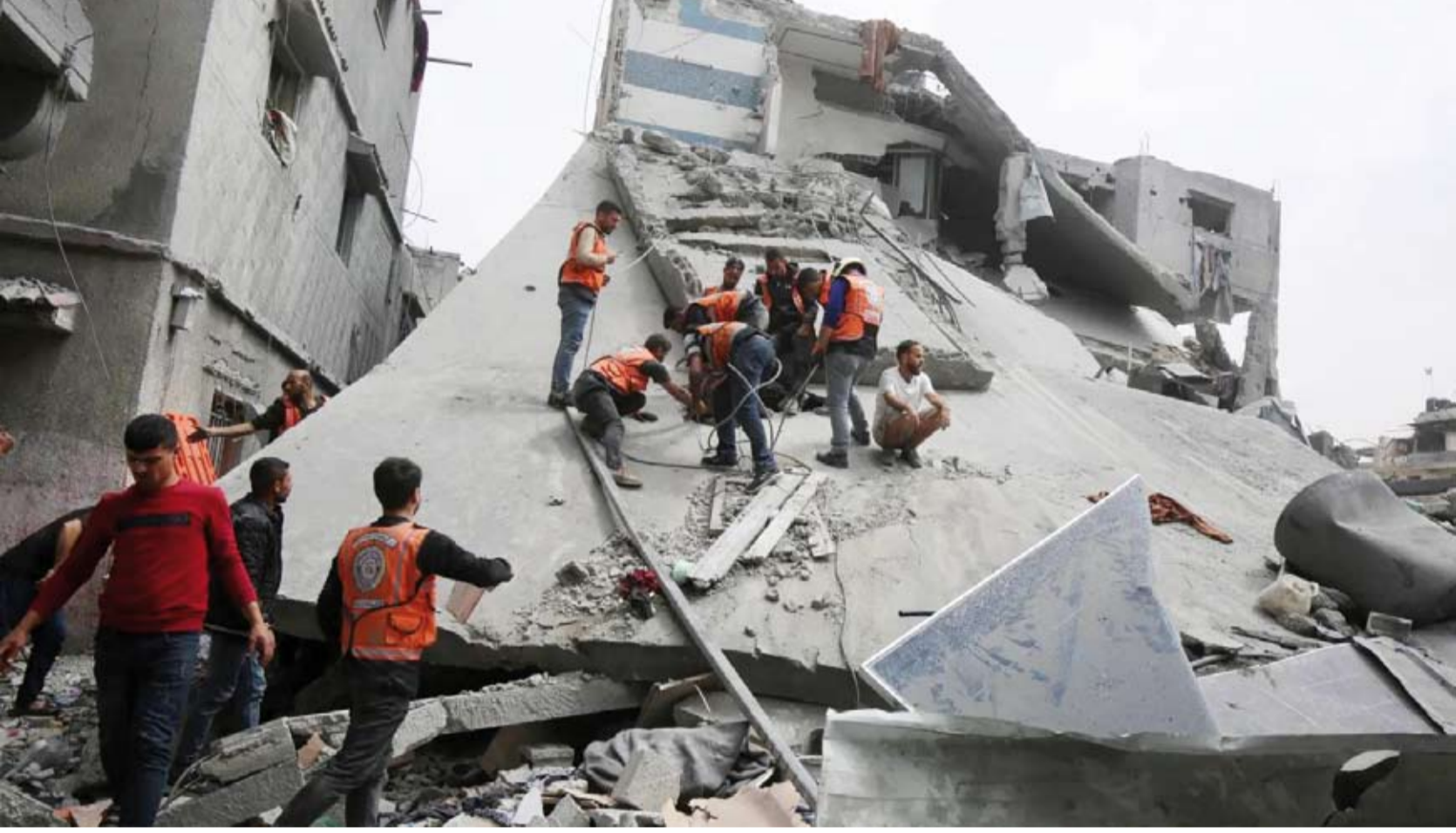
فلسطينيون يتفقدون انقاض مبنى إثر غارة صهيونية