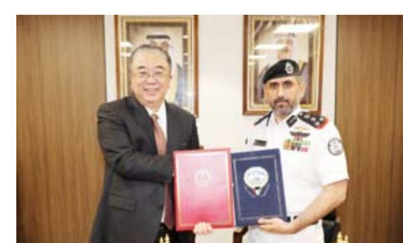
المعيد الركن بحري الشيخ مبارك العلي ونائب وزير النقل الصيني فو

المرافق له في قاعدة صباح الأحمد البحرية التابعة لخبز السواحل. وأشارت إلى أن الاتفاقية ومذكرة التفاهم تأتان في إطار