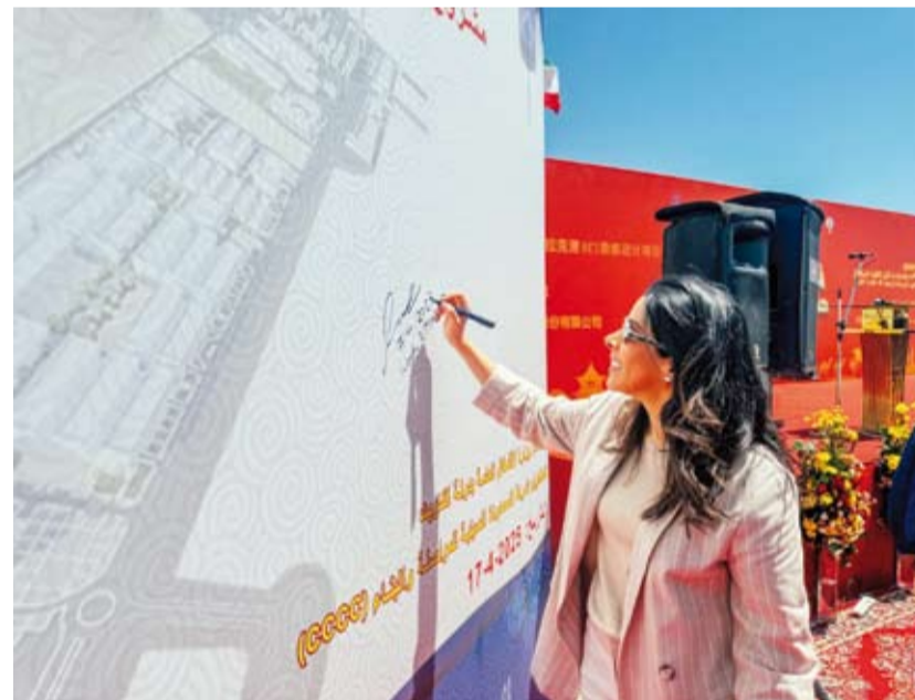
المشعان خلال الزيارة التقديرية لمتابعة مستجدات الأعمال بموقع المشروع

قامت وزير الأشغال العامة د. نورة المشعان أمس بزيارة ميدانية لموقع مشروع ميناء مبارك الكبير بجزيرة بوبيان شمال البلاد برفقة نائب وزير النقل الصيني فو شيوي بين وحضور مساعد وزير الخارجية لشؤون آسيا السفير سميح حيات والسفير الصيني لدى البلاد تشانغ جيناوي. وذكرت الوزارة في بيان صحفي أن الزيارة جاءت لمتابعة أعمال عقد دراسة وتصميم وتقديم خدمات ما قبل التنفيذ لاستكمال مشروع ميناء مبارك الكبير للوقوف على آخر المستجدات لتنفيذ العقد الذي تمت مباشرة أعماله في 16 مارس 2025.