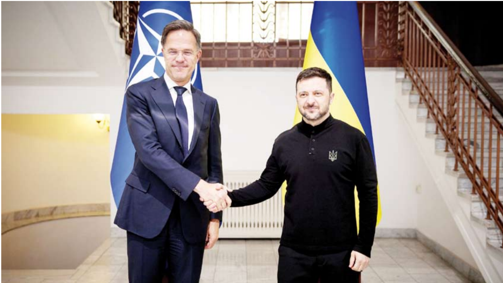
روته وزيلينسكي خلال لقائهما في أوديسا

وقال روته: «هذه المناقشات ليست سهلة، ولا سيما في أعقاب هذا العنف المروع»، في إشارة إلى الضربات الأخيرة. وأضاف: «لكننا جميعاً ندعم جهود الرئيس ترامب من أجل إحلال السلام». وخلال محادثاتهما المشتركة، توجت على وجه الخصوص مسألة تعزيز الدفاعات الجوية الأوكرانية. وكتب زيلينسكي: «يرى الجميع على الإطلاق مدى حاجة أوكرانيا الملحة لأنظمة الدفاع الجوي والصواريخ الخاصة بها». وكرر استعداد كييف لشراء أنظمة الدفاع الجوي باتريوت.