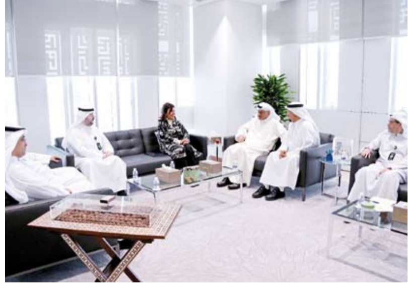
وزير التعليم العالي ومديرة الجامعة خلال جلسة نقاشية

من جانبه أكدت الدكتورة الميلم التزام جامعة الكويت بتطبيق سياسات ترشيد استهلاك الطاقة ووجهت بتشكيل لجنة لوضع آليات