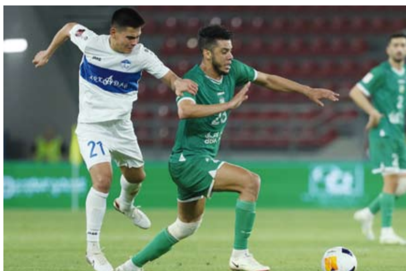
أداء باهت للاخضر العرباوي

الثالث في الدقيقة 86 من هجمة مرتدة منظمه، لتكتمل الكارثة، ويُقصى العربي رسمياً عن آمال التأهل التي كانت مرتفعة بعد لقاء الذهاب. أداء العربي في هذه المواجهة لم يكن على قدر الطموحات، لافئياً ولا ذهنياً. الحارس الشطي قدم مجهوداً لافتاً، لكنه لم يجد أمامه منظومة دفاعية تحميه. أما الوسط والهجوم، فغاب عنهما الحضور الذهني، ولم يشكل أي خطورة تُذكر على مرمى الفريق التركماني. الخسارة لم تكن مجرد خروج من بطولة، بل تجديد للألم المتواصل الذي تعانیه الكرة الكويتية على مستوى الأندية، بعد إخفاقات المنتخب الأخيرة في تصفيات كأس آسيا وكأس العالم. ردود الفعل الجماهيرية على مواقع التواصل جاءت غاضبة، وسط مطالبات بإعادة تقييم شاملة للمنظومة الفنية والإدارية داخل النادي، إلى جانب ضرورة وقف جادة من الاتحاد الكويتي لمعالجة هذا الإخفاق المتكرر. فهل تكون هذه الهزيمة بداية تصحيح حقيقي، أم مجرد حلقة أخرى في مسلسل التراجع؟