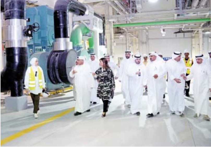
جولة وزير التعليم العالي في مدينة صباح السالم الجامعية

وأكدت الجامعة اتخاذها كل الإجراءات اللازمة لترشيد استهلاك الكهرباء إيماناً منها بدورها القيادي في وضع القواعد والحلول للتعامل مع أية تحديات ونشر الوعي وتنقيف المجتمع وحرصها على أن تكون من أوائل الجهات في تطبيق التوجهات والسياسات العامة للدولة تزامناً مع الوضع الراهن من ارتفاع درجات الحرارة في البلاد مما أدى إلى وصول الأحمال الكهربائية لمستويات عالية.