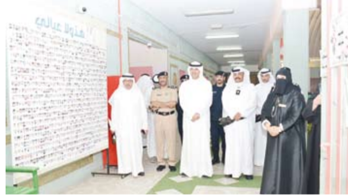
جولة محافظ الأحمدى في المدرسة

يهدف من تكبوها إلى الربح المادي في المقام الأول. وعقب المحاضرة قام المحافظ بجولة تفقدية للمعرض المصاحب والذي تم تنظيمه بمشاركة طالبات المدرسة، إضافة إلى فقرات فنية قدمها طلاب مدرسة ضرابن الأزور، موجهاً الشكر إلى القائمين على تنظيم المحاضرة والمشاركين فيها من معلمات وطالبات.