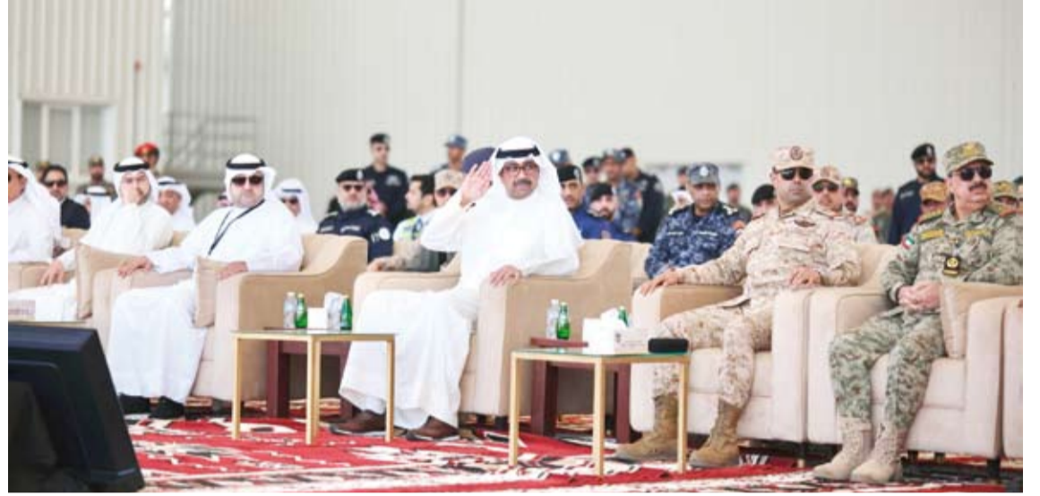
وزير الدفاع خلال متابعته للتمرين