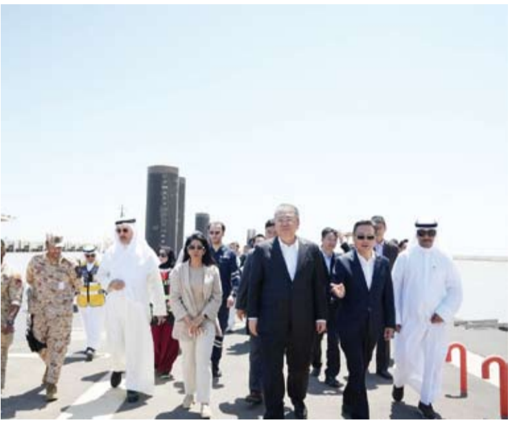
المشعان والوزير الصيني

هذا ويشمل العقد الجاري مجموعة من الأعمال أهمها مراجعة واستكمال التصميم الخاصة لمشروع ميناء مبارك الكبير وتقديم الرؤية والخطة الشاملة لتنفيذ وتشغيل ميناء مبارك الكبير.