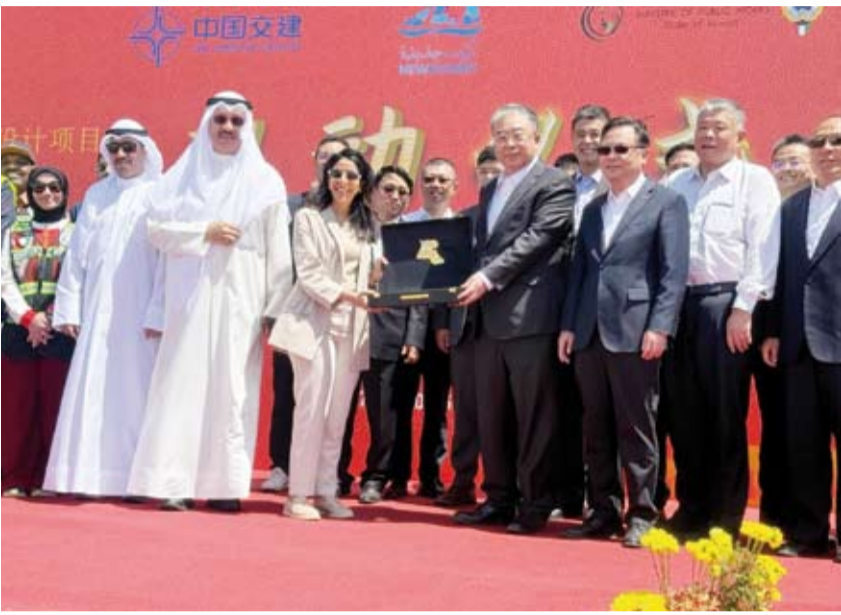
المشعان والوزير الصيني تكرم الوزير الصيني