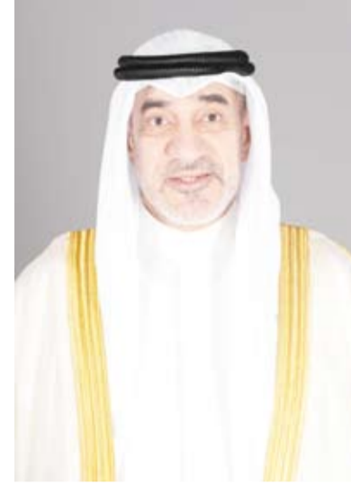
الشيخ فهد اليوسف

عقدت اللجنة العليا لتحقيق الجنسية الكويتية اجتماعاً، أمس، برئاسة رئيس مجلس الوزراء بالإنابة الشيخ فهد اليوسف، وقررت سحب وفقد الجنسية الكويتية من 962 حالة تمهيداً لعرضها على مجلس الوزراء.