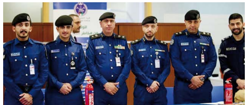
جانب من مشاركة الإطفاء

شاركت قوة الإطفاء العام ممثلة بإدارة العلاقات العامة والإعلام في فعاليات معرض الصحة والأمن والسلامة في الجامعة العربية المفتوحة خلال الفترة من 16 إلى 17 أبريل. وتهدف هذه المشاركة نحو مستقبل تعليمي أفضل لحلق بيئة آمنة والحفاظ على الأمن المجتمعي