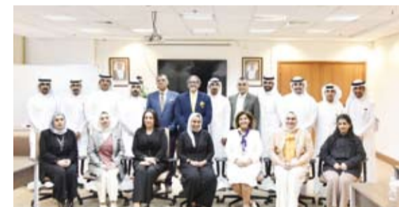
جانب من الحضور خلال الورشة

المعني بالمخدرات والجريمة لدول مجلس التعاون الخليجي وذلك يومي 14 و 15 ابريل الجاري في معهد الدراسات القضائية والقانونية. وذكرت ان الورشة شهدت حضور مساعد وزير الخارجية لشؤون حقوق الإنسان السفير الشيخة جواهر الصباح ورئيس البعثة والممثل الإقليمي لمكتب الأمم المتحدة المعني بالمخدرات والجريمة لدول مجلس التعاون الخليجي حاتم علي. وشارك من وزارة الداخلية مساعد مدير إدارة حماية الأداب العامة ومكافحة الاتجار بالأشخاص محمد مصطفى وعدد من ضباط مباحث شؤون الإقامة إلى جانب ممثلين عن وزارات ومؤسسات الدولة ذات العلاقة وأعضاء اللجنة الوطنية الدائمة لمكافحة الاتجار بالأشخاص وعدد من الخبراء القانونيين والأمنيين