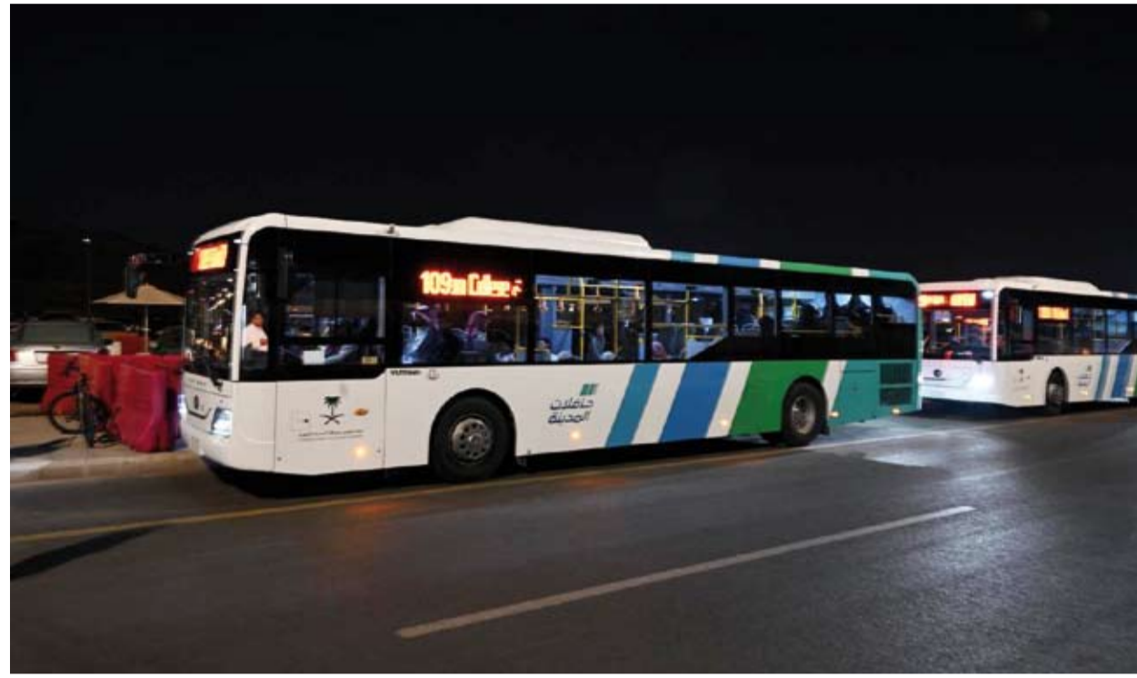
حافلات المدينة المنورة

أعلن مشروع «حافلات المدينة المنورة» عن تسيير أكثر من 70 ألف رحلة خلال شهر رمضان الماضي عبر كافة محطات التوقف التي يشملها المشروع في أرجاء المدينة المنورة، استفاد منها أكثر من 1.7 مليون راكب من سكان المنطقة وزائريها. وأسهم مشروع «حافلات المدينة المنورة» في تعزيز انسيابية الحركة المرورية في المنطقة المركزية من خلال نقل المستفيدين بواسطة أسطول من الحافلات التابعة للمشروع، وأسهم بشكل مباشر في تقليص أعداد المركبات المتجهة إلى المسجد النبوي خلال أوقات الذروة، وتعزيز الإصحاح البيئي عبر خفض مستوى انبعاثات الكربون في مناطق الزحام. ويتألف المشروع من 6 مسارات، تتصل بها 106 محطات توقف، تحمل شاشات عرض تعريفية تعمل بالطاقة الشمسية، تتضمن اسم المحطة، وخريطة لتوضيح مسار النقل، والبرنامج الزمني للخدمة، كما تشمل مسارات مخصصة لمساعدة الأشخاص ذوي الإعاقة، لتسهيل تنقلهم في المحطات ووصولهم إلى مقاعد داخل الحافلات، فضلاً عن أنظمة لتعزيز مستوى الأمان.