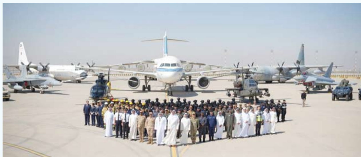
وزير الدفاع وقيادي الجهات المشاركة في ختام التمرين بقاعدة عبدالله المبارك الجوية

أكد وزير الدفاع ووزير الداخلية بالإنيابة الشيخ عبدالله العلي الصباح أن تمرين «الجابرية 1» يشكل نموذجاً ناجحاً للتعاون بين الجهات الأمنية والعسكرية والمدنية بما يعزز جاهزية الجهات واستعدادها لمواجهة التحديات بكفاءة عالية. جاء ذلك خلال ختام تمرين «الجابرية 1» في قاعدة عبدالله المبارك الجوية الذي تم تنفيذه بقيادة القوة الجوية الكويتية ومشاركة كل من وزارة الداخلية والحرس الوطني بصفة مراقب ولواء المغاوير / 25 إلى جانب كل