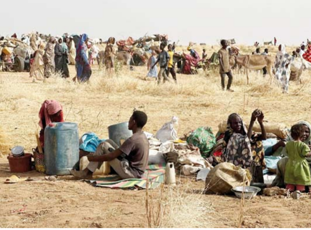
أشخاص فروا من مخيم زمزم للنازحين

أعرب المتحدث باسم الأمين العام للأمم المتحدة في تصريح لوكالة الصحافة الفرنسية، عن قلق المنظمة العميق إزاء خطر «تفكك» السودان، وذلك غداة إعلان «قوات الدعم السريع»، تشكيل حكومة منافسة.