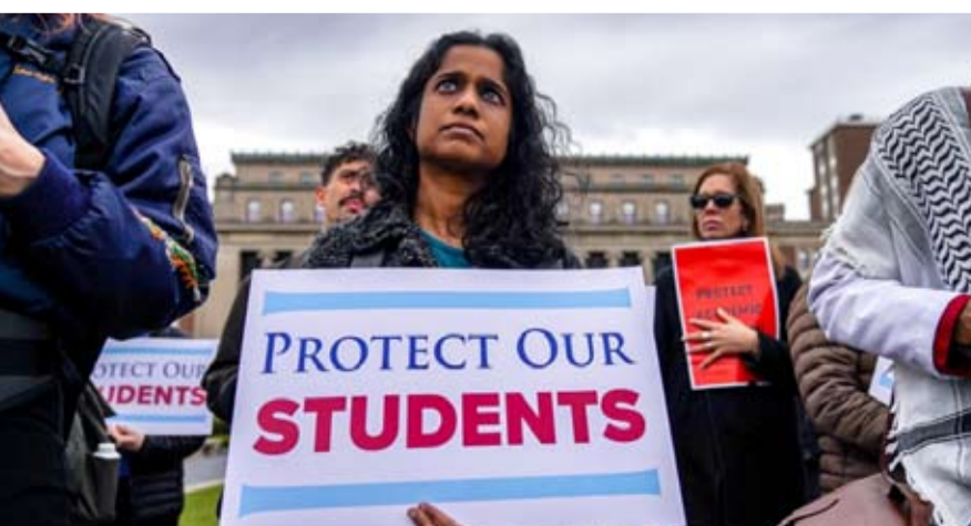
الدعوى القضائية رفعها الطلاب في المحكمة الفدرالية في جورجيا

وغير قانوني» وضع الطلاب المدعين من خلال قاعدة بيانات تسجيل خاصة، رغم أن تأشيراتهم كانت «سارية تماماً»، كما جاء في الشكوى. وأدرج عدد منهم في قاعدة البيانات على أن لهم سجلاً إجرامياً، في حين أن ذلك غير صحيح، وفق الوثيقة القضائية. ويرد في الشكوى أن إنهاء وضعهم كطلاب «يمنعهم من مواصلة دراستهم والحفاظ على عملهم في الولايات المتحدة» ويعرضهم «لخطر التوقيف والاحتجاز والترحيل»، مطالبة بإعادة وضعهم القانوني. ومن بين هؤلاء الطلاب الذين تم الحفاظ على سرية هوياتهم في وثائق المحكمة «خوفاً من الانتقام»، عدد من مواطني الهند والصين وكولومبيا.